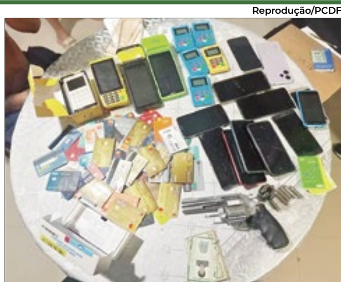
Criminosos deram prejuízo de R$ 360 mil em público