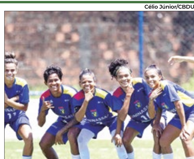
Evento esportivo em Recife reúne 353 mulheres atletas