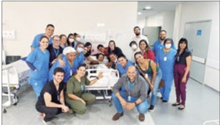
Adolescente, que fez 15 anos, está internada com dengue