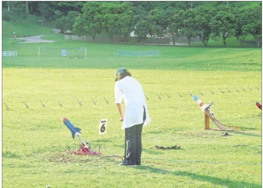
Mostra Brasileira de Foguetes ensina astronáutica e astronomia e reúne várias escolas

Ensinar a ciência de modo lúdico e divertido. Esse é o objetivo da Mostra Brasileira de Foguetes (MOBFOG), que está com as inscrições abertas para a edição de 2024. Voltadas para estudantes dos ensinos fundamental, médio e superior, as atividades envolvem elaborar e lançar foguetes feitos de papel, canudinho, garrafa pet ou de tubo de pvc. Até o dia 1º de maio, as escolas participantes, não inscritas ou com cadastro inativo, podem inscrever seus alunos pelo link app.oba.org.br .