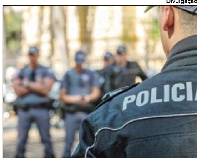
Policiais militares vão passar por aprimoramento