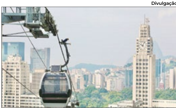
Teleférico voltará a funcionar gradualmente

“As comunidades que vamos visitar têm sobrevivido à base de caminhões-pipa e outras soluções precárias e caras para a população”