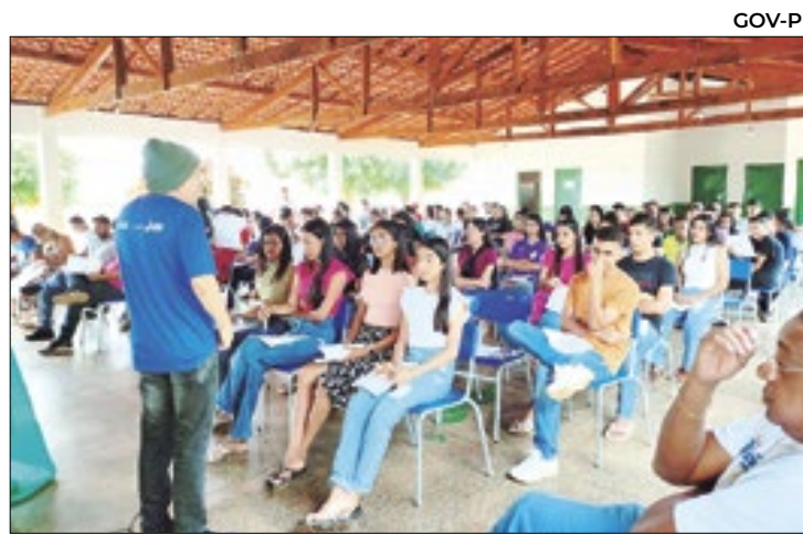
Programa visa capacitar alunos do Piauí para o Enem

De acordo com Paolillo, assim que a unidade demonstrativa da Emdagro for implementada, será feito dia de campo para transferência de tecnologia com mudas saudáveis.