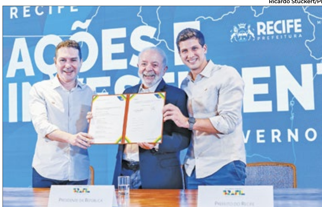
As obras visam segurança de 717 famílias em áreas de risco durante chuvas

Execução será feita em cinco lotes e beneficiará 13 bairros