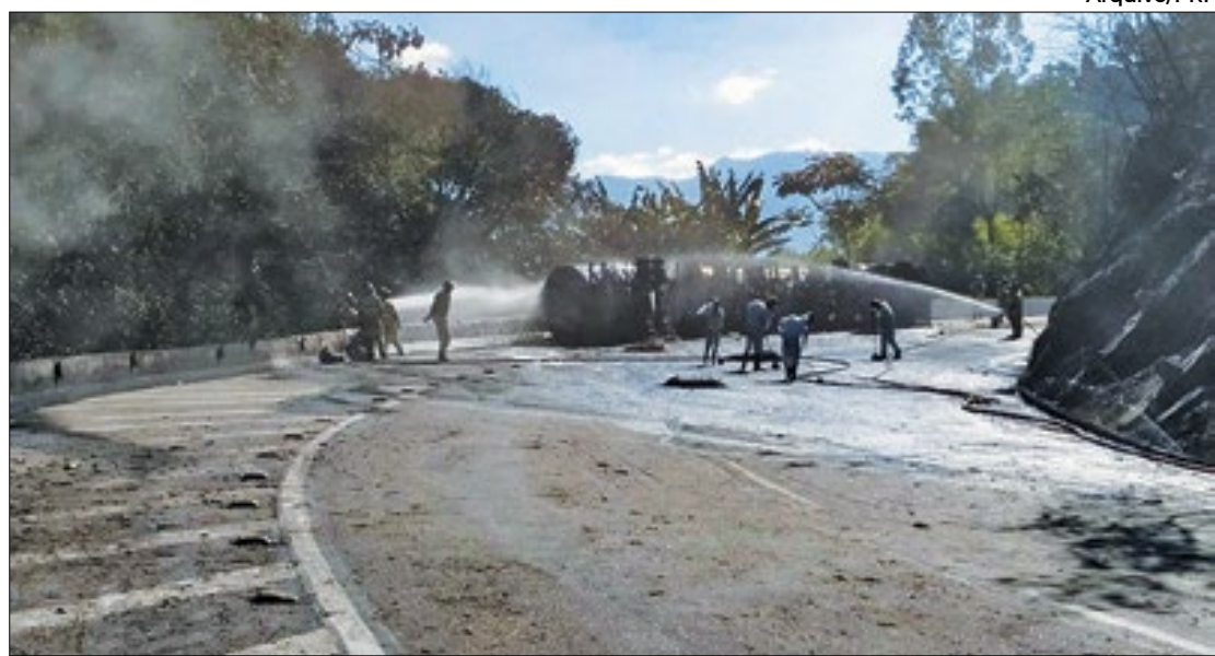
Pista estreita e sinuosa da subida da serra é uma das causas de inúmeros acidentes

Como informado pela própria Concer, em novembro de 2020, o atual trecho que liga a Baixada Fluminense e a cidade de Petrópolis é antigo e sinuoso. “Em 2019, a subida da Serra de Petrópolis ficou completamente interditada por 35 horas no total. Foram 18 ocorrências de maior complexidade no período que interromperam o fluxo de tráfego pelo equivalente a quase um dia e meio. Panes mecânicas, secas e elétricas, desatrelamentos e derramamentos de carga, acidentes e quedas de árvores estão entre as causas dos frequentes transtornos, agravados pela pista estreita e sinuosa”.