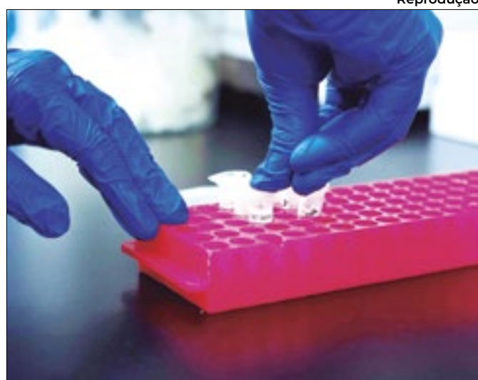
Número de medicamentos deve dobrar em seis anos