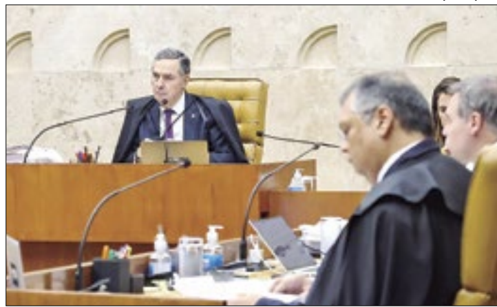
Corte irá julgar foro privilegiado