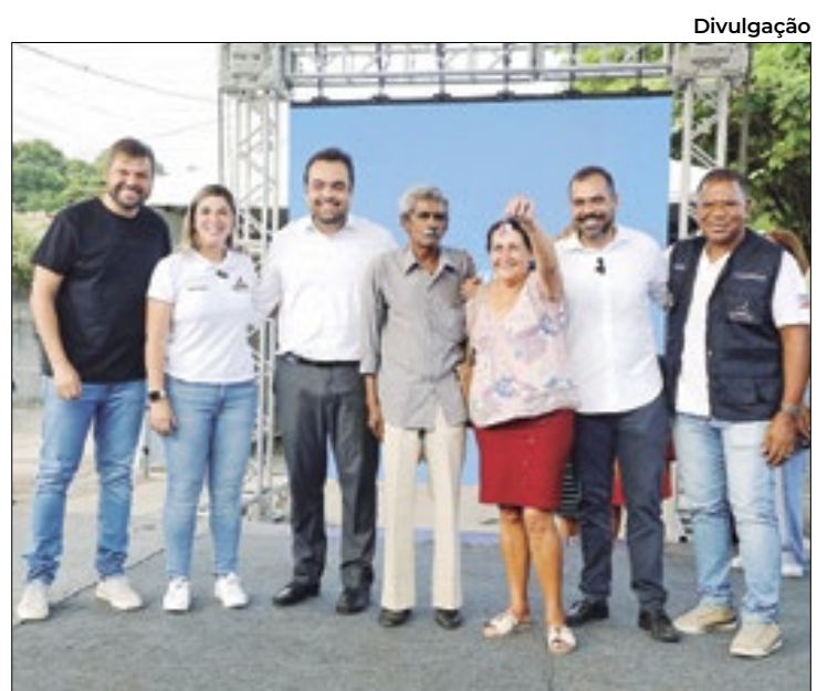
Cerimônia marcou a entrega das chaves para os moradores