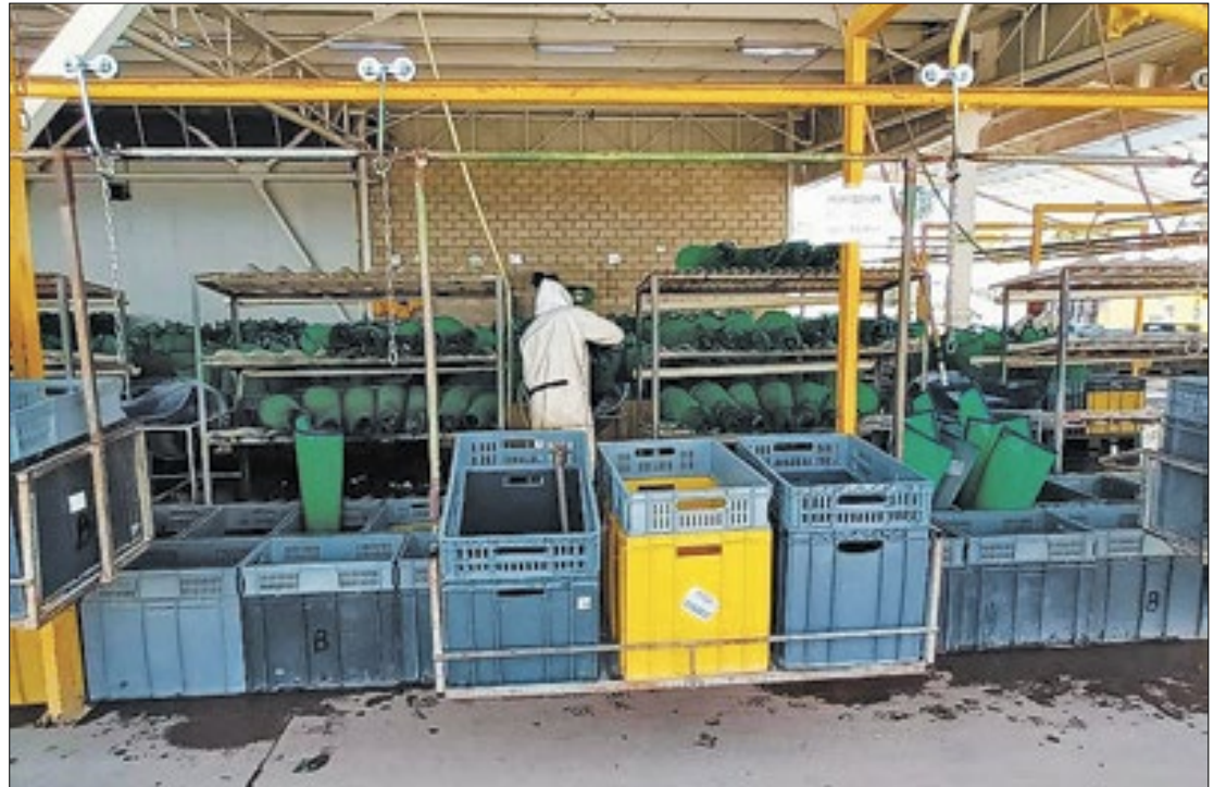
Na Colômbia, o transporte de flores e cachos de dendê é realizado por cabos

Além disso, os brasileiros participaram de uma reunião em Bogotá com representantes de um grupo exportador de açaí na Colômbia, a fim de evidenciar a disposição do estado brasileiro para colaborações comerciais.