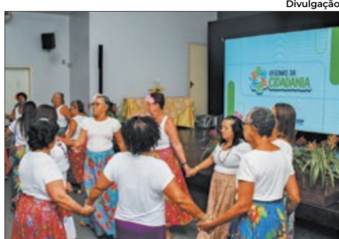
Ação acontecerá em todos os CRAS da cidade