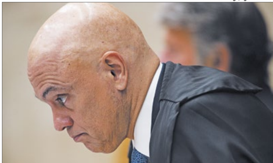
Embate entre Alexandre de Moraes e Elon Musk agrava questão das redes

No início da noite de domingo (7), interlocutores de