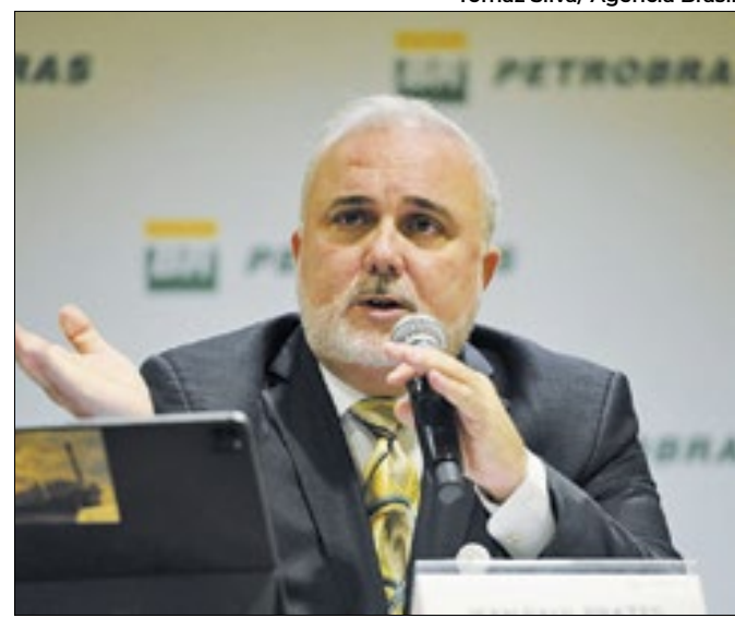
Presidente é alvo de fritura no governo