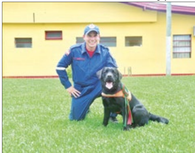
Certificação Nacional de Cães do Corpo de Bombeiros