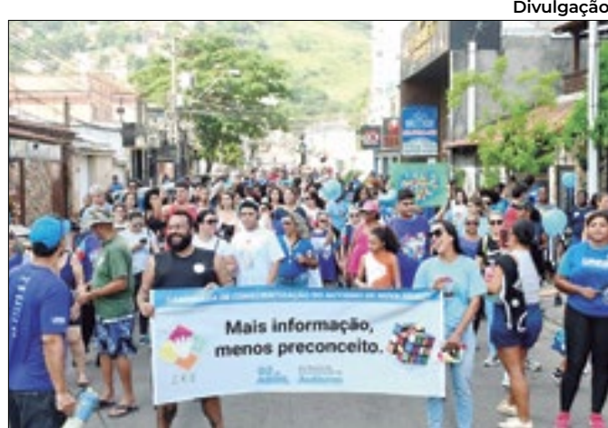
Caminhada de conscientização pelo Autismo