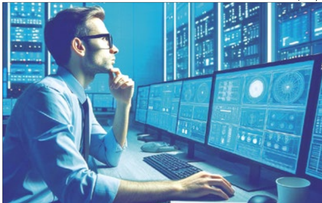
Tecnologia pretende dar informações em tempo real

Essa tecnologia já foi testada em casos pontuais com algumas polícias militares do Brasil. A ideia é que comandantes possam tomar decisões com agilidade à medida que são informados sobre o andamento de uma operação: a tela mostra a posição das tropas e veículos, e as câmeras o que acontece em tempo real, então é possível orientá-los com uma precisão