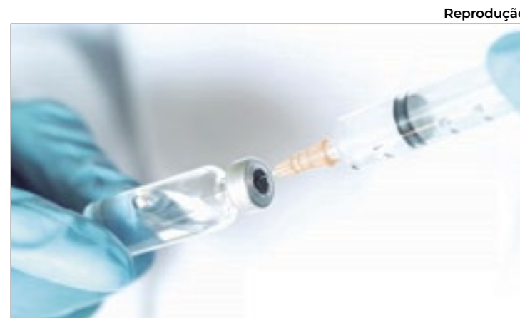
Estes imunizantes foram usados nas vacinas de covid