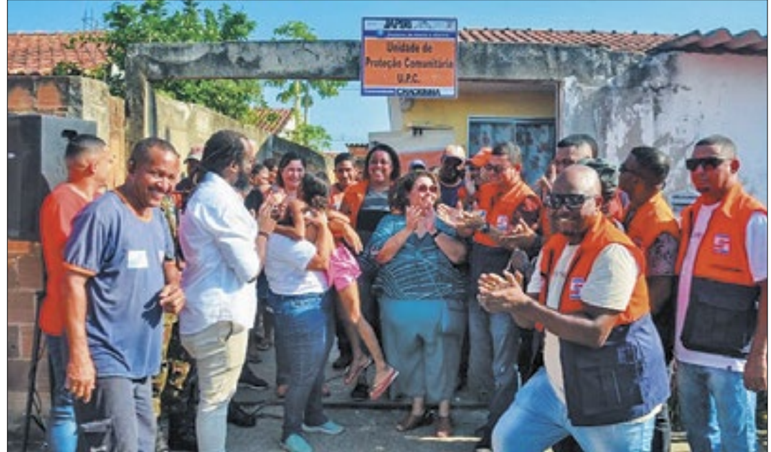
Núcleos de Proteção e Defesa Civil foram inaugurados pela Prefeitura de Japeri

Para este trabalho, o secretário pontuou que as parcerias têm sido fundamentais para o apoio à população. Ele citou as secretarias Municipais do Meio