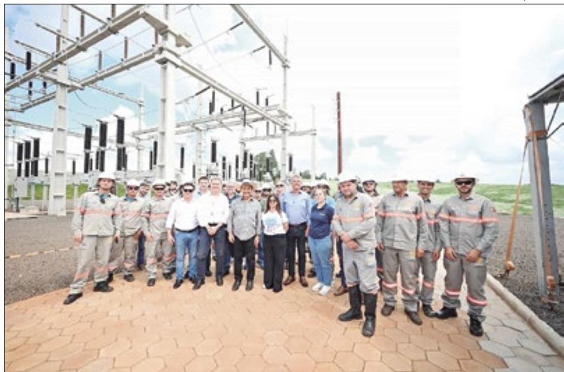
Nova subestação no Oeste melhora o fornecimento para 10,5 mil unidades consumidoras

“Com essa nova subestação estamos garantindo a distribuição de energia elétrica de qualidade para as cidades do interior, além de atrair novos investimentos e gerar empregos para a população local. Também estamos avançando no fornecimento de energia trifásica e garantindo infraestrutura energética para o nosso agronegócio continuar crescendo”, comemorou o governador.