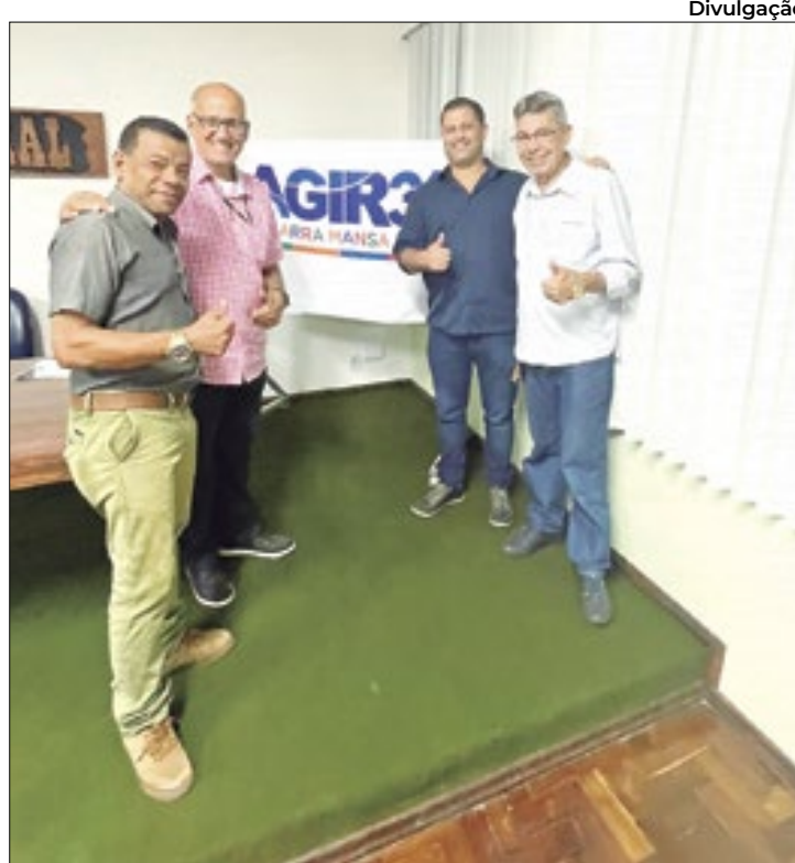
Agir fecha a nominata em Barra Mansa