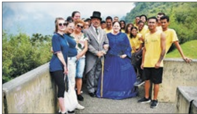
Aula-passeio do Projeto 'Olhar a cidade'