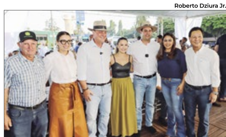
Governador participa da abertura da ExpoLondrina