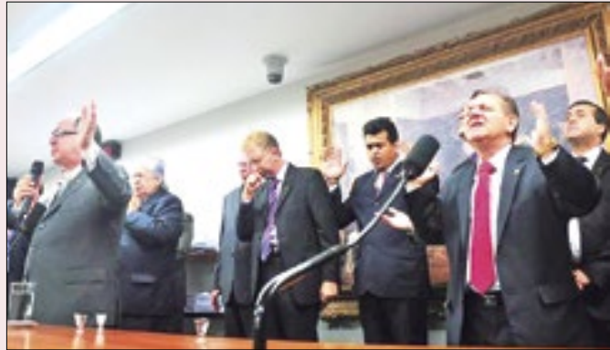
Governo terá que se aproximar dos líderes religiosos