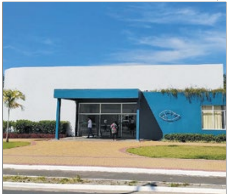
Abertura do plano acontecerá no Centro de Estudos Ambientais

A Secretaria de Proteção e Defesa Civil de Angra dos Reis realiza a abertura oficial do Plano Municipal de Redução de Riscos (PMRR) nesta segunda-feira (8). O evento será feito no auditório do Centro de Estudos Ambientais (CEA), na Praia da Chácara, às 16h. Angra foi um dos 20 municípios em todo o Brasil selecionados pelo Ministério das Cidades para o desenvolvimento do plano.