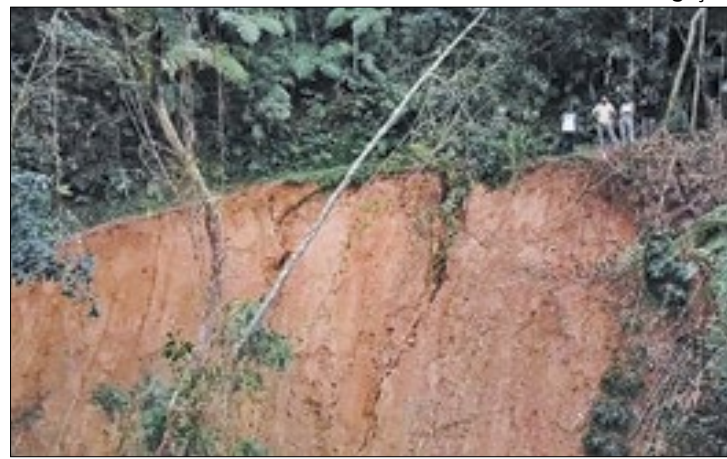
Trecho para o acesso à Barragem Beija-Flor e o Abrigo

O Parque Nacional da Serra dos Órgãos (PARNASO) em Teresópolis divulgou um alerta em suas redes sociais sobre um deslizamento ocorrido na trilha do Sino, provocado pelas chuvas recentes. O deslizamento afetou o trecho entre a barragem Beija-Flor e o Abrigo 1. Apesar do ocorrido, a trilha permanece aberta, contando com um desvio emergencial. A equipe do PARNASO está trabalhando na avaliação das melhores alternativas para um novo trajeto, enquanto isso, recomenda-se cautela aos visitantes nesse trecho da trilha.