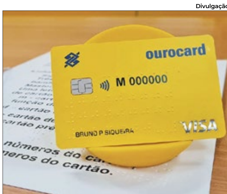
BB dá mais um passo crucial na direção da inclusão social

Ao solicitarem uma nova via de seu cartão, ou um cartão novo, eles receberão em seu endereço um kit contendo um cartão com as informações de número, CVV, data de validade e bandeira em braile, além de um manual com instruções sobre o cartão e sua forma de desbloqueio e de um porta-cartão com os seus dados comple-