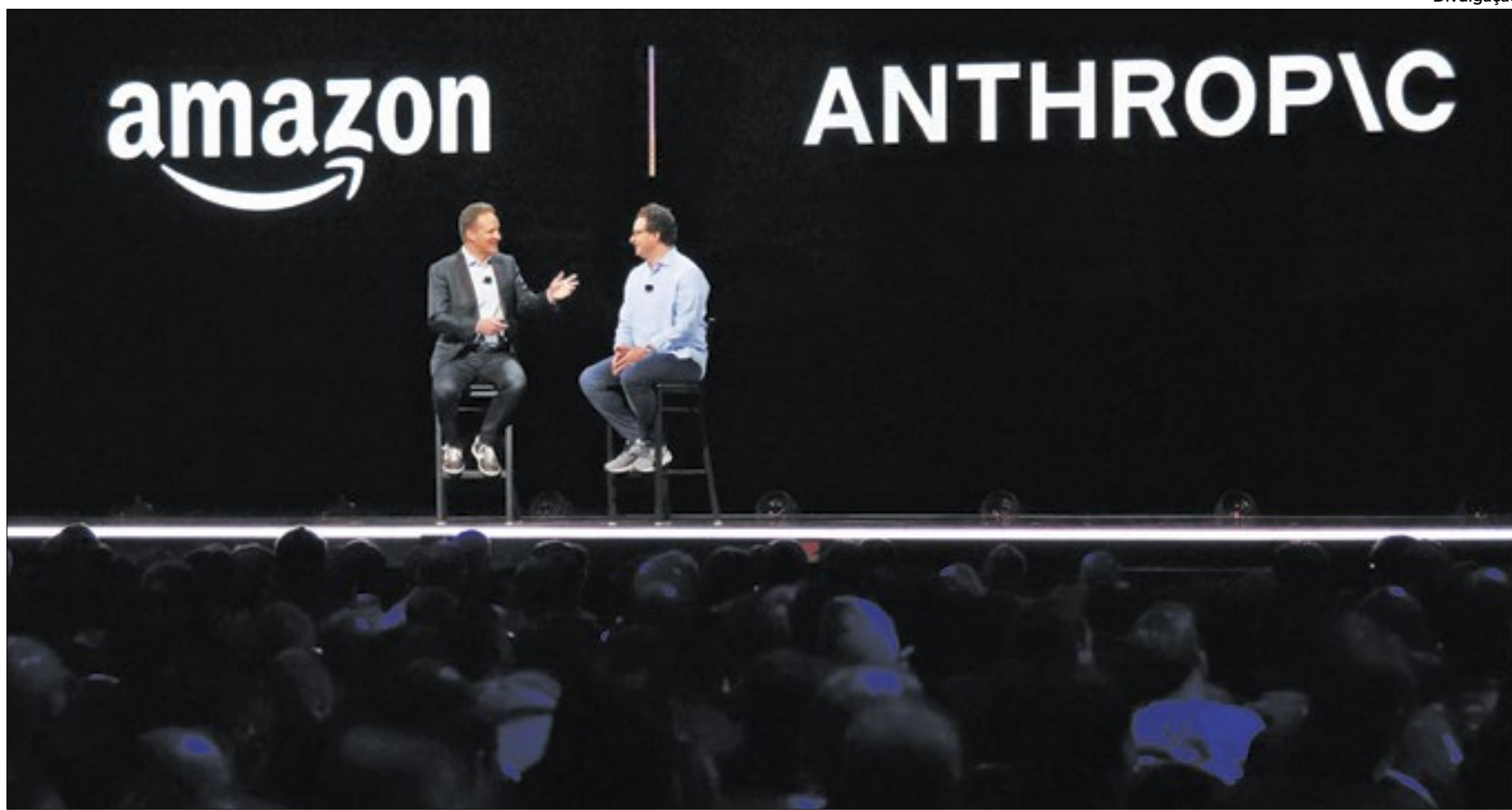
Amazon aposta pesado no futuro da Inteligência Artificial com a startup Anthropic

A AI Anthropic foi criada em 2021 por dois ex-diretores da OpenAI, que pediram demissão da empresa, justamente para criar uma concorrente que trouxe ao mundo seu próprio estilo de ChatGPT, o Claude, que atualmente já está em sua maior versão sendo o Claude 3, que além de trazer dados consegue também produzir e criar novas imagens. Porém, desde sua criação, a Anthropic vem ganhando força no mercado, embora ainda não seja tão comentada como o ChatGPT, ela vem crescendo e ganhando espaço, principalmente por sua possibilidade de sobressair-se em relação a sua concorrente. Aliás, ao que tudo indica, o nome da empresa poderá começar a ficar ainda mais conhecida após o anúncio de um aporte de US$ 4 bilhões da gigante americana Amazon que possui uma participação minoritária na startup.