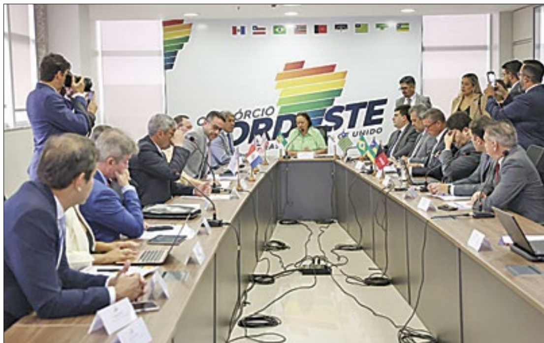
Os líderes nordestinos foram recebidos pelos ministros do Planalto e da Fazenda

Na semana anterior, o Ministério da Fazenda apresentou