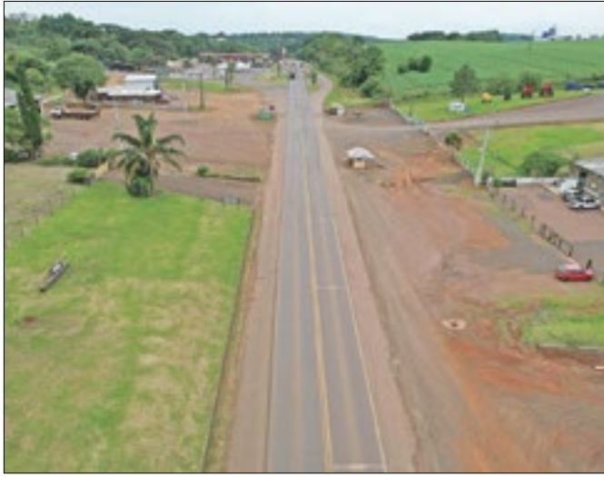
Restauração em concreto da PRC-280 tem vencedor