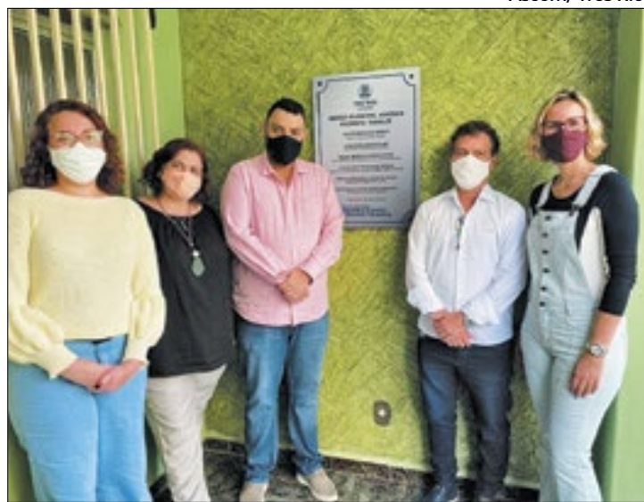
Abrigo de TR na data da inauguração em 2021

Dentre as adequações recomendadas pelo MPRJ estão: aquisição de material de limpeza e higiene pessoal, organização