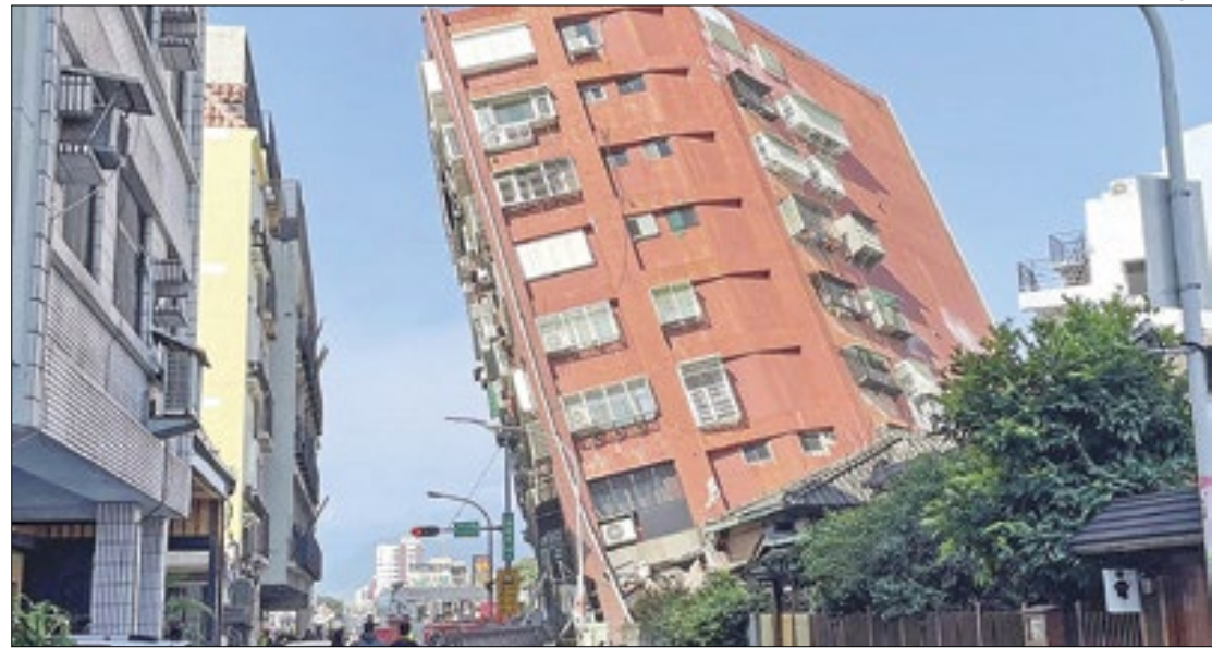
Tremores fizeram prédios desabarem e causaram deslizamentos

O local mais afetado pelo sismo desta quarta foi a cidade