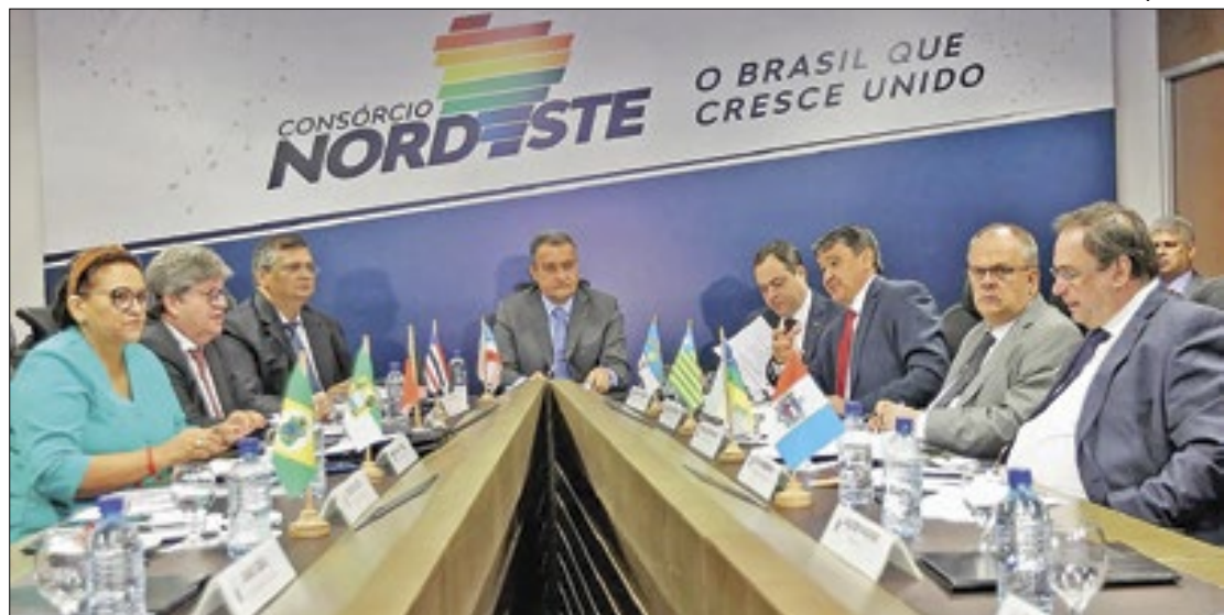
Ministro Rui Costa quando era o presidente do Consórcio Nordeste

Na delação, a empresária também disse aos agentes da PF que o processo de contratação da Hemptcare foi intermediado por um empresário baiano que se apresentou como amigo do ex-governador. Esse suposto amigo teria cobrado o pagamento de comissões pelo negócio, um total R$ 11 milhões. O Ministério Público Federal (MPF) e a Polícia Federal apuram se essas "comissões" seriam propinas des-