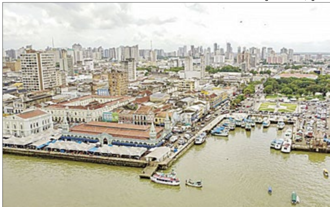
Belém terá aumento do fluxo de turistas em novembro de 2025, devido à COP 30

"Estamos honrados em ser o primeiro estado da região Norte a se filiar como parceiro institucional dessa associação. Essa colaboração trará benefícios não apenas para o nosso