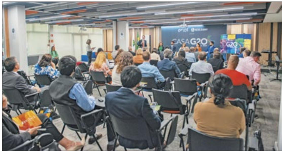
Espaço servirá para intercâmbio e troca de experiências culturais