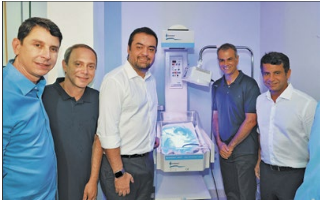
Governador Cláudio Castro reinaugurou hospital maternidade, em Nova Iguaçu

Do total de 112 leitos, 68 são de enfermagem, 20 são da Unidade de Tratamento Intensivo (UTI) neonatal, 10 para Unidade de Cuidados Intermediários Neonatais (UCIN) e 5 são da UTI materna; além de leitos em quartos pré e pós-parto. A maternidade conta ainda com dois consultórios para atendimentos de emergência e duas salas de cirurgia com equipamentos de ponta.