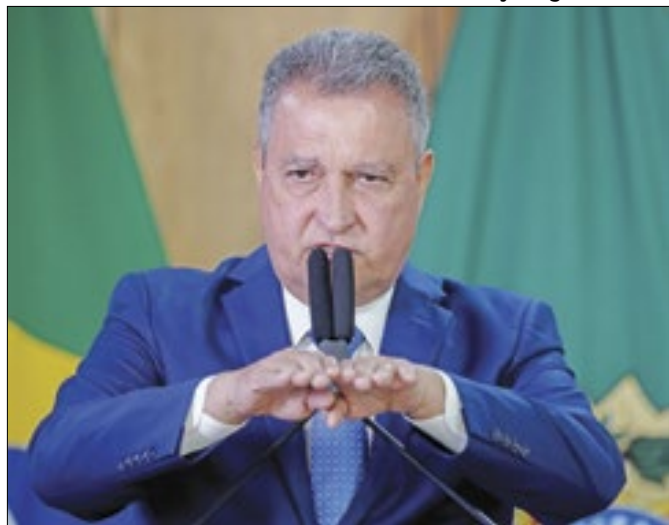
Destino de Costa no governo fica incerto com denúncia