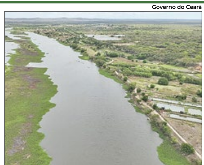
Projeto visa recuperar áreas degradadas na bacia do rio