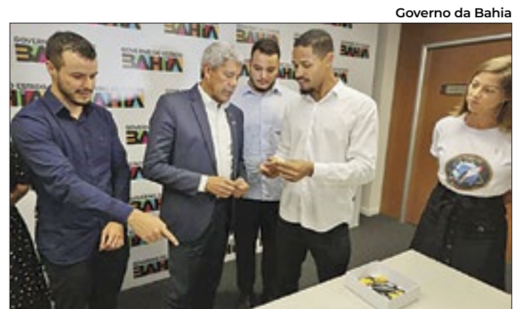
Governo da Bahia

O presidente Luiz Inácio Lula da Silva levantou a questão de possível ajuda interna na fuga, enquanto a Federação Nacional dos Policiais Penais Federais (Fenappf) negou qualquer envolvimento, assegurando que os foragidos não receberam apoio externo. Segundo a entidade, a ausência de logística externa sugere que a fuga pode ter sido uma oportunidade aproveitada, e não resultado de um planejamento prévio.