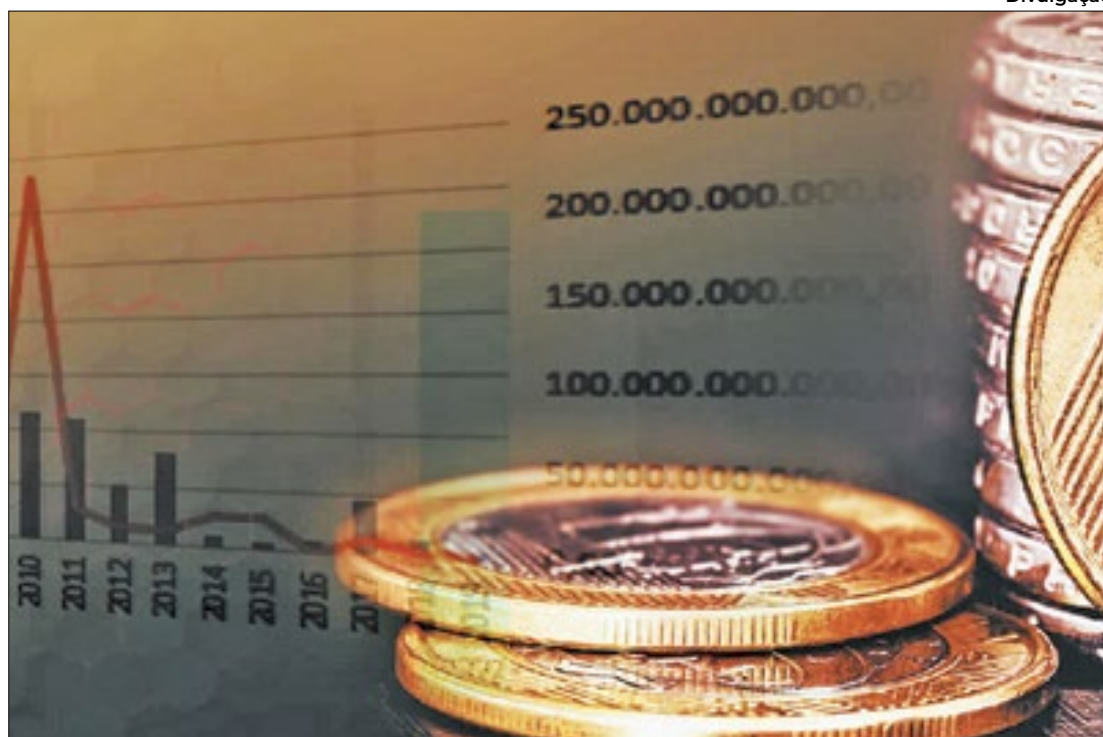
Cortes da Selic e inflação resiliente ‘conspiram’ contra a estabilidade da economia