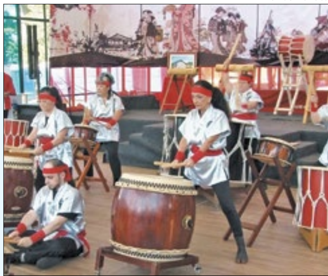
Bunka-Sai celebra a cultura japonesa em Petrópolis