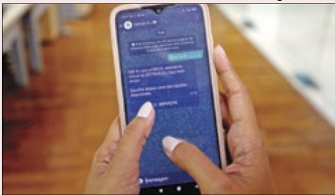
Detran.RJ passa a oferecer atendimento por WhatsApp