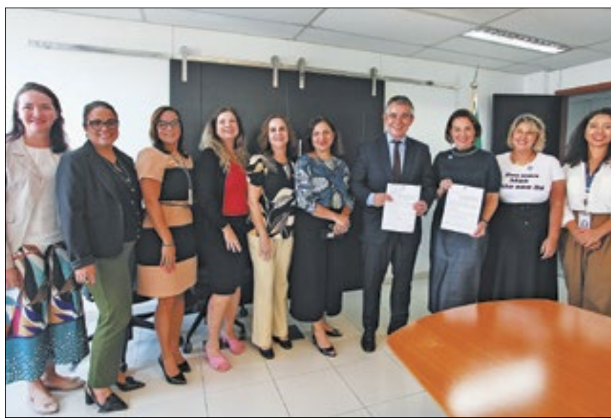
Acordo é para gerar oportunidade de trabalho a vítimas de violência nos prédios da Justiça Federal do Estado do Rio