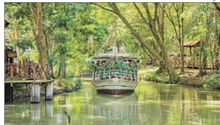
Programação inclui passeio no barco "Regatão"