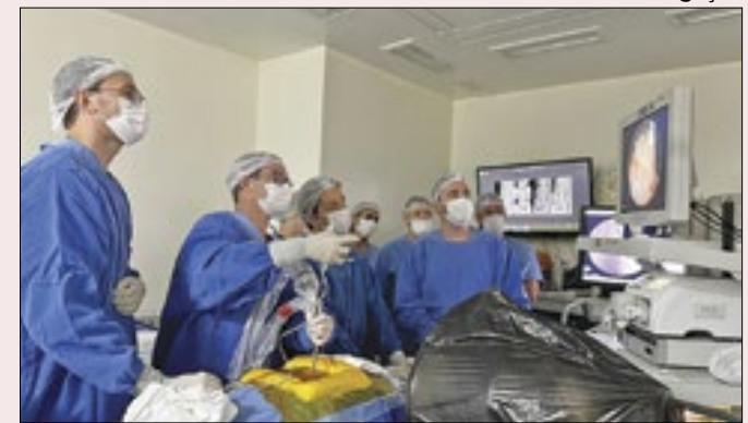
Planos de saúde atendem 26% da população