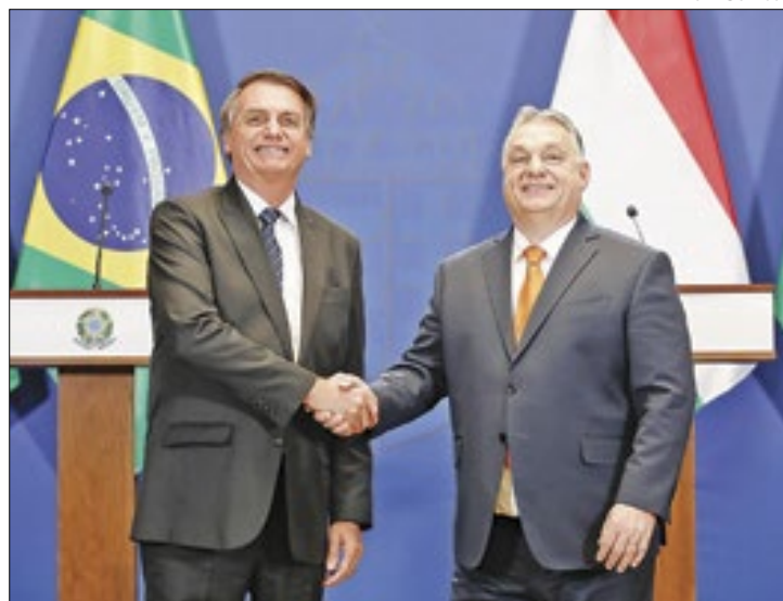
Bolsonaro é próximo de Viktor Orbán, da Hungria

Pouco antes da estadia de Bolsonaro na embaixada, a Polícia Federal deflagrou a Operação Tempus Veritatis, em 8 de fevereiro, que investigava envolvidos em uma tentativa de Golpe de Estado e abolição do Estado Democrático de Direito para