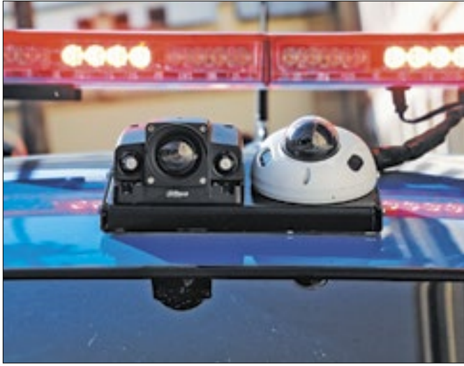
Programa vai equipar 5.849 viaturas