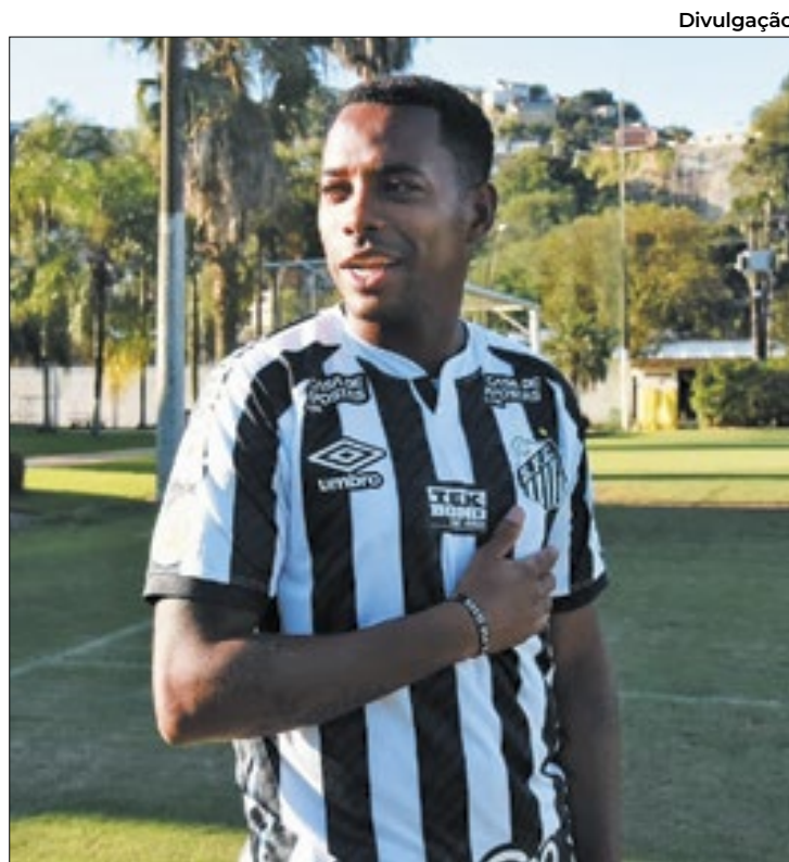
Defesa de Robinho protocolou novo pedido de liberdade

O advogado de Robinho acredita que Fux deverá colocar o habeas corpus para ser julgado já na próxima semana.