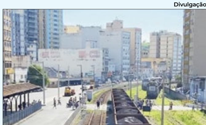
Pré-candidato faz propostas para mobilidade urbana