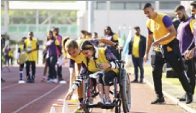
Evento acontecerá no segundo semestre