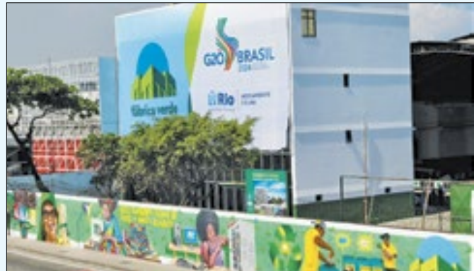
Equipamento vai ficar instalado na Avenida Brasil