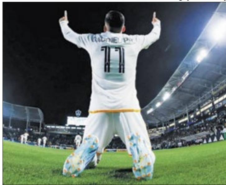
Vitória garantiu a liderança da Conferência Oeste