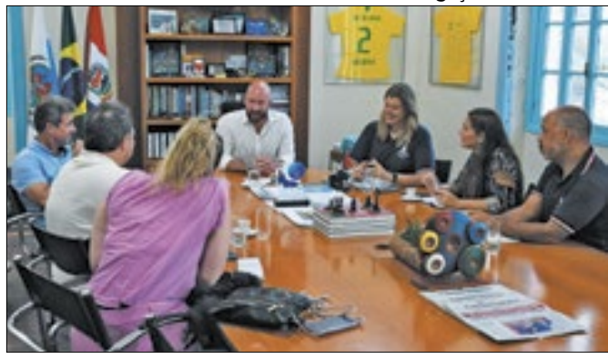
Prefeitura discute sobre o 2º Seminário Turismo Rural