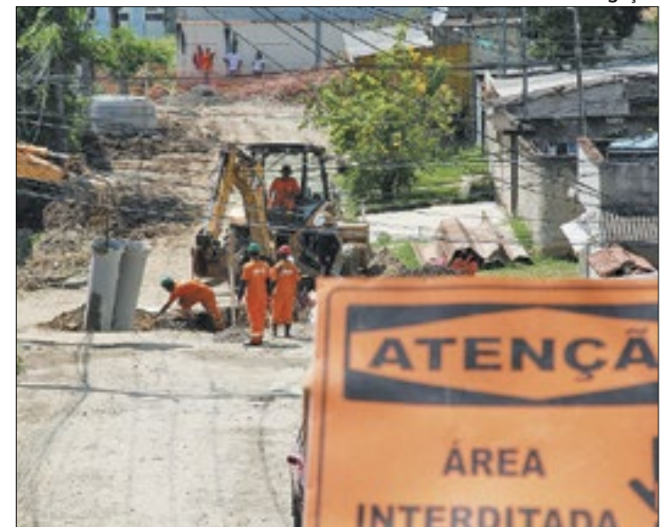
Pacote de intervenções inclui Mutuá e Porto do Rosa

Em relação às pontes, ele disse que os trabalhos estão concentrados na retirada da vegetação dos pilares, que impede a drenagem da água pelos canais. "O mato acaba retendo a água e os canais transbordam", acrescentou.