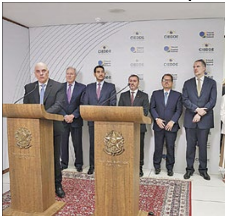
Entidades passam a integrar centro de enfrentamento

Para lidar com esse problema, o Ciedde contará, em tempo real, com uma rede de comunicação envolvendo os 27 tribunais regionais eleitorais (TREs). Também caberá ao centro integrado desenvolver campanhas publicitárias de educação contra desinformação, discursos de ódio e antidemocráticos e em defesa da democracia e da Justiça Eleitoral.