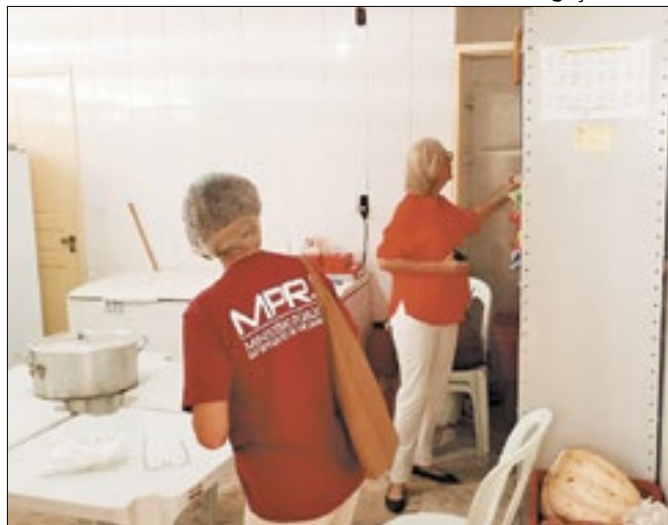
MPRJ vistoria abrigos provisórios em Petrópolis