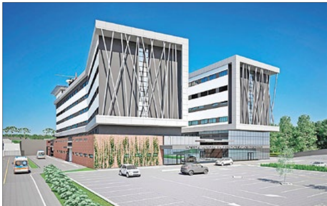
Projeto do novo hospital municipal de São José dos Pinhais.

Os investimentos na construção das unidades são parte de uma estratégia de distribuição do atendimento em saúde pelas regionais, fazendo com que os pacientes não precisem viajar grandes distâncias para realizar consultas ou cirurgias. Desde 2019, já foram inaugurados, entre unidades próprias e convênios com prefeituras, hospitais em Ivaiporã, Telêmaco Borba, Guarapuava, Cornélio Procopio e Boa Vista da Aparecida. Também começaram a funcionar hospitais em Cafelândia e Toledo, que contaram com o apoio do Es-