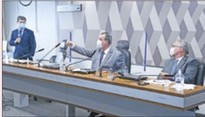
Oposição não conseguiu investigar na CPI da Covid