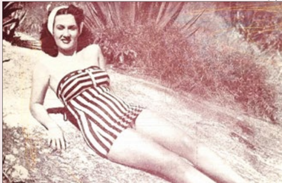
Vedete consagrada, Zaquia Jorge abriu teatro de revista em Madureira