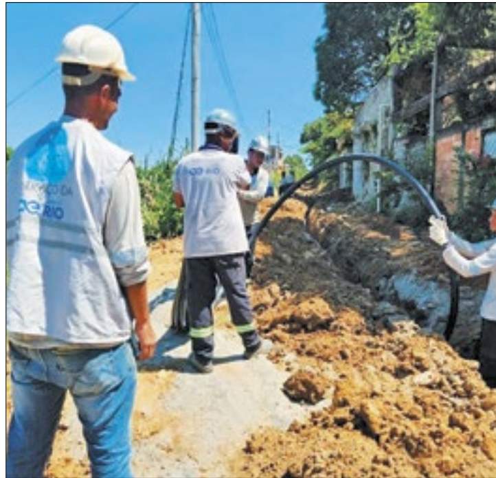
Águas do Rio promove melhorias em Engenheiro Pedreira

o que estou sentindo, parece um sonho. Nós, moradores, lutamos há muito tempo por isso. Sem água não somos ninguém, não conseguimos fazer nada em casa. Agora, toda essa dificuldade ficou para trás, e vamos viver melhor", afirmou.