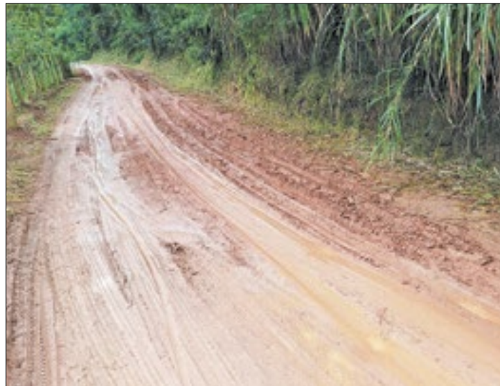
Rua Presbítero Antônio Castor virou lamaçal após chuva