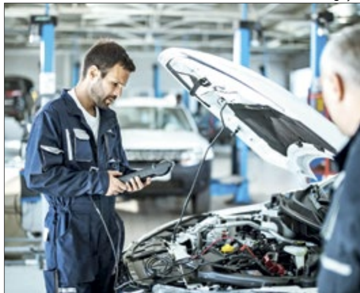
Avanço do setor é o maior, nos últimos 20 meses

Patamar mais elevado em 20 meses, o PMI (Índice de gerentes de compras, na sigla em inglês) do setor de serviços avançou de 54,6, em fevereiro, para 54,8 em março último, de acordo com dados fornecidos pela consultoria S&P Global, segundo a qual o desempenho do primeiro trimestre deste ano (1T24) é o melhor já registrado, desde junho de 2022. De igual forma, o PMI Composto da indústria também cresceu para 55,1, o mais alto em 20 meses.