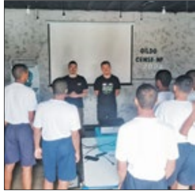
Ações serão feitas de mês e mês

A prefeitura de Nova Friburgo através da Subsecretaria de Atenção Básica, sob a responsabilidade da área técnica de saúde da criança, adolescente e aleitamento materno, a equipe da Política Nacional de Atenção Integral à Saúde de