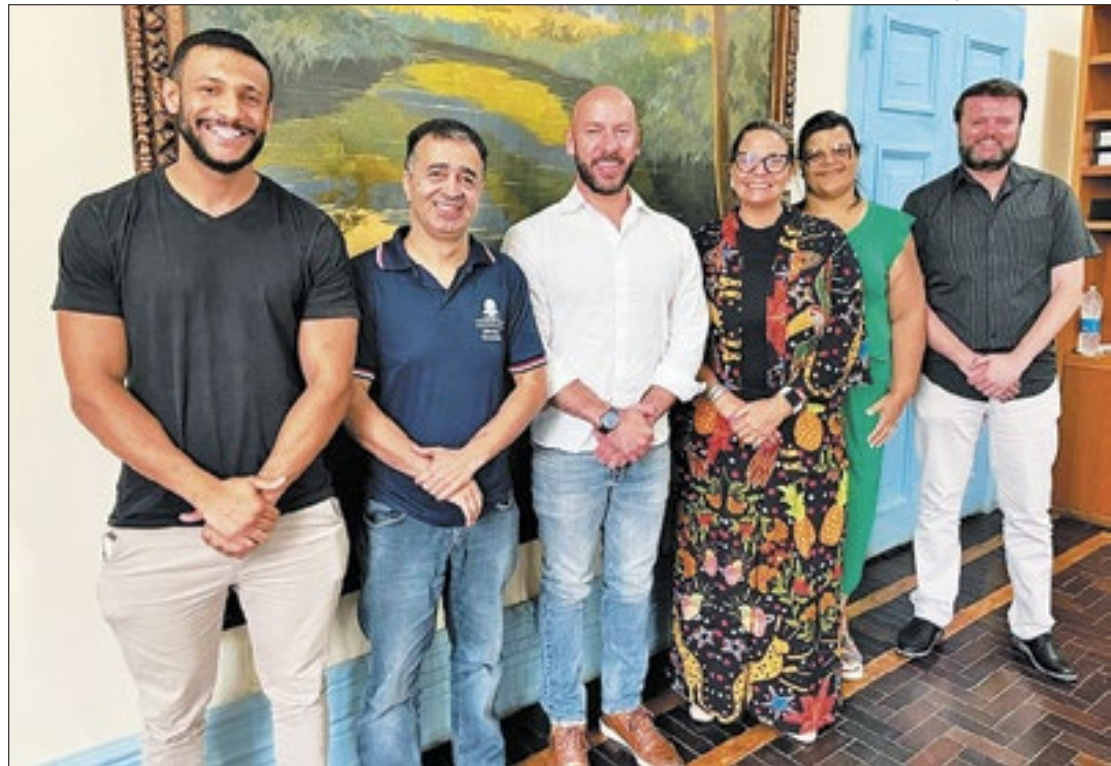
Prefeito Vinicius Claussen e a comissão do IFRJ

Na terça-feira (02), um importante passo foi dado para o fortalecimento do ensino público em Teresópolis, com a realização de uma reunião entre representantes da Prefeitura e do Instituto Federal de Educação, Ciência e Tecnologia do Rio de Janeiro (IFRJ). O encontro teve como objetivo discutir os detalhes da implementação de um novo campus do IFRJ na cidade, uma iniciativa que promete impactar positivamente a educação e o desenvolvimento local.