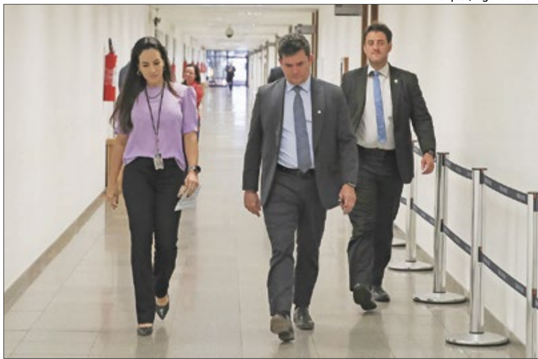
Julgamento de Moro prossegue na semana que vem

“O argumento de que ato de pré-campanha realizado em São Paulo não tem relevância e impacto no Paraná ignora todo esforço que os TREs e o Tribu-