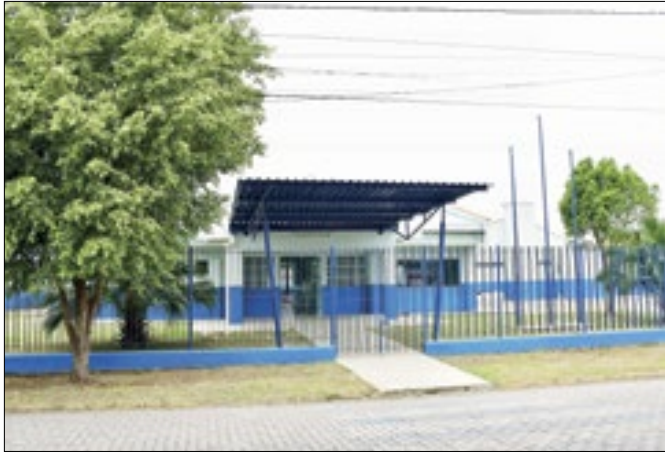
Creche Menino Jesus enfrentava problemas desde 2014