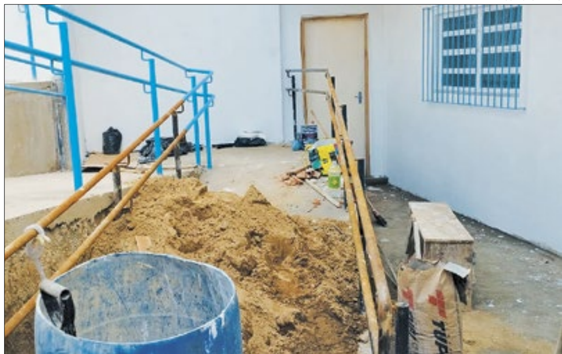
Perto da entrega, entrada do posto de Saúde Sargento Boening com canteiro de obras

Antes dos serviços serem transferidos para a igreja, desde fevereiro de 2022 os moradores se deslocavam até o PSF do Alto da Serra para conseguirem assistência. Frente a situação os mesmos expressaram insatisfação e preocupação: “já estamos há quase dois anos nos deslocando e nada do posto sair, não é fácil ficar para lá e para cá. Acho que os serviços voltaram aqui para cima porque lá no Alto da Serra haviam muitas pessoas e a fila de espera dobra-