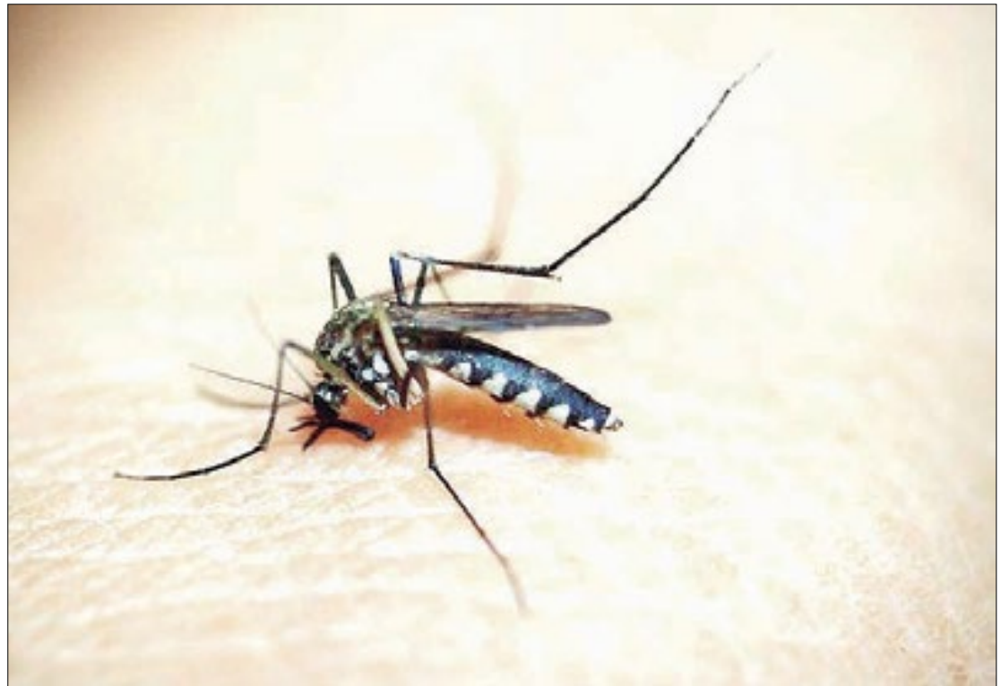
Duas pessoas morreram por dengue em Nova Friburgo.

O Estado divulgou que as cidades de Nova Friburgo, Teresópolis, Sumidouro e Bom Jardim confirmaram mortes. Duas pessoas morreram por dengue em Nova Friburgo, segundo a Subsecretaria de Vigilância em Saúde, ambos são pessoas do sexo masculi-