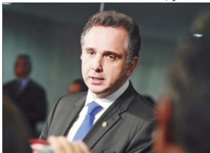
Pacheco diz ter agido para dar "segurança jurídica"

"A partir do uso indevido de medida provisória para esta finalidade, nós teríamos uma realidade de três meses do ano com alíquota de 8%, 60 dias de vigência da medida provisória com alíquota