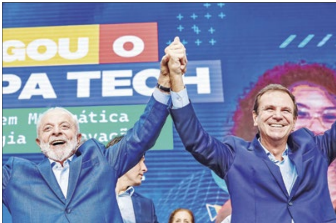
Lula tenta emplacar vice do PT na chapa de Paes

Nesta terça, Lula participou da inauguração do Instituto de Matemática Pura e Aplicada e de Tecnologia, o Impa Tech. Os ministros Camilo Santana,