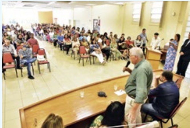
Ao todo, 1,7 mil concursados foram convocados