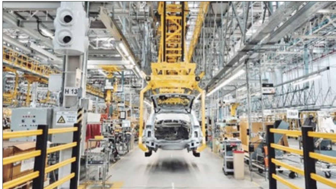
Fábrica da Jaguar em Itatiaia é uma das mais modernas do grupo em todo o mundo

Esses são os únicos SUVs premium que podem ser abastecidos com etanol no Brasil. A Mercedes-Benz chegou a ter o GLA flex, mas essa opção saiu de linha quando a produção em Iracemápolis (interior de São Paulo) foi encerrada.