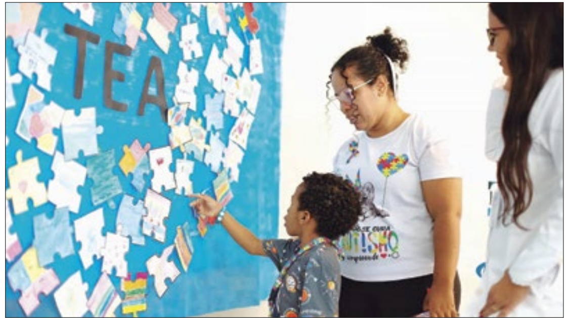
Projeto 'Laço Azul' oferece atendimentos com uma equipe multidisciplinar em V.Redonda

O projeto "Laço Azul" oferece aos pacientes atendimentos com uma equipe multidisciplinar, formada por especialistas em fonoaudiologia, educador físico, psicologia, terapia ocupacional e psicopedagogia. O "Laço Azul" atende quase 600 crianças e auxilia no desenvolvimento da comunicação e na autonomia delas.