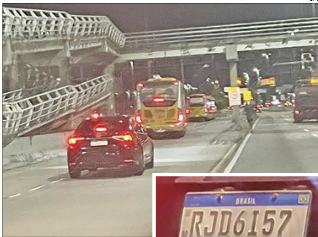
Veículo com placa reservada transitando em faixa exclusiva do BRT