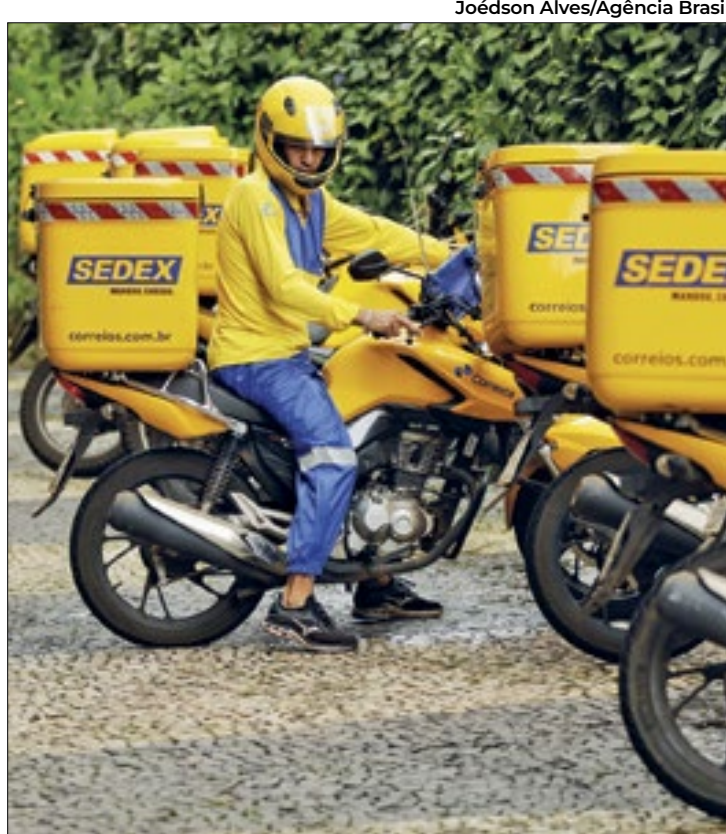
Correios são próxima categoria a parar

Está prevista uma série de atos nos próprios locais de trabalho dos servidores, além de uma manifestação programada para acontecer em frente ao Ministério da Gestão e Inovação em Serviços Públicos