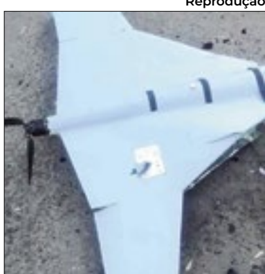
Avião ucraniano sem piloto

A Ucrânia realizou um ataque kamikaze com um avião sem piloto em uma região industrial no Tartaristão, território da República da Rússia, na terça. Ataque visava explodir uma planta de montagem de drones russos. "Foi uma operação do serviço de inteligência ucraniano contra uma empresa de drones Shahed. Foram infligidos danos significativos ao local", disse uma fonte do ministério da Defesa da Ucrânia à agência de notícias AFP.