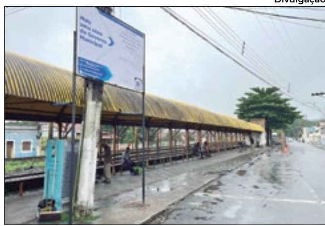
Obras não causarão alterações no trânsito local