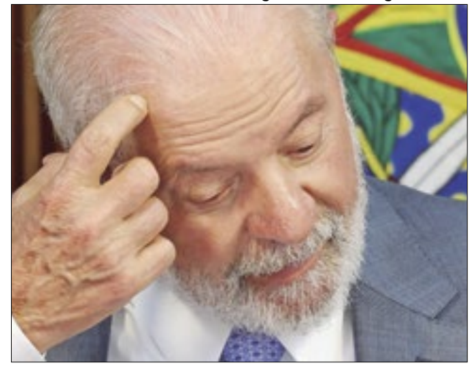
Lula investe no aumento de popularidade