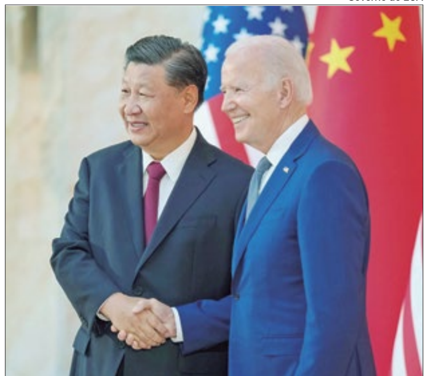
Governo do EUA

"Temos sido consistentemente claros sobre nossas preocupações com a segurança da nossa eleição e os esforços de alguns atores, incluindo alguns da China, de afetar isso", disse o porta-voz do Conselho de Segurança Nacional, John Kirby, a jornalistas nesta terça.