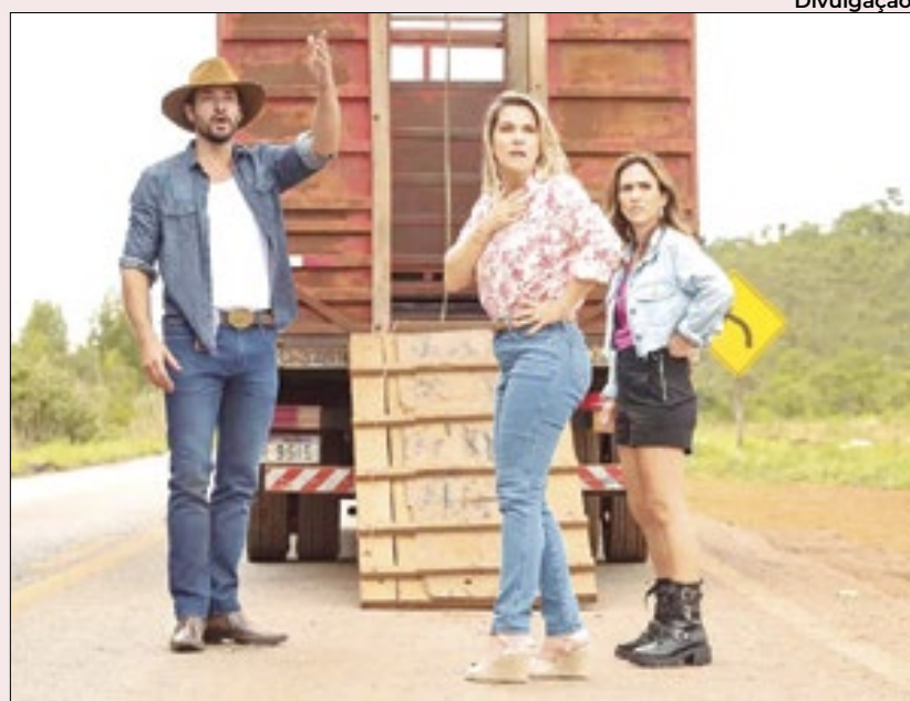
'Minha Irmã e Eu' segue liderando o ranking nacional de bilheteria