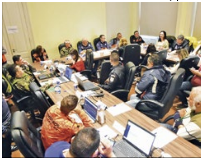
Centro Integrado de Comando e Controle Petrópolis