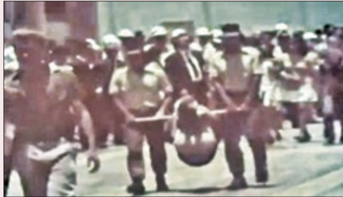
Índigena chegou a desfilar em um pau-de-arara