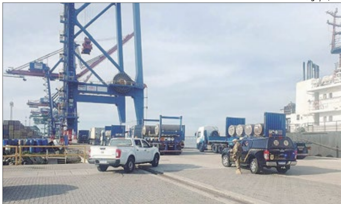
Urânio enriquecido sai do Porto do Rio em direção a Resende pela Dutra

O projeto prevê ainda outras obras de complementação, como construção de novos viadutos e duas áreas de escape. Segundo a concessionária, as melhorias têm a finalidade de melhorar a fluidez no tráfego da Serra das Araras, por onde circulam mais de 390 mil veículos por mês. No período de execução dos serviços, será criado um planejamento para cada fase, a fim de minimizar os impactos no tráfego.