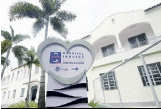
Hospital Iguassu esteve desativado por 15 anos