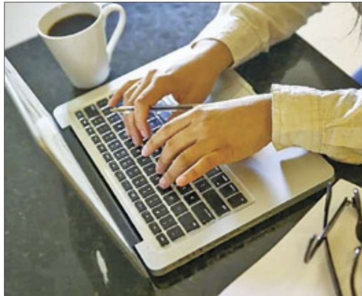
As aulas serão ministradas em 16 pólos Faetec

A Fundação de Apoio à Escola Técnica (Faetec) anunciou a abertura de 315 vagas em cursos de Qualificação Profissional destinados a mulheres em situação de vulnerabilidade social ou vítimas de violência, com vagas para as cidades de Teresópolis e Três Rios. Essa iniciativa integra o Programa Pronatec Mulheres Mil, em colaboração com a Secretaria de Estado da Mulher. O período de inscrições teve início nesta segunda-feira (01) e seguirá até o dia 23 de abril, com previsão de início das aulas ainda neste mês.