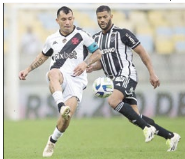
As SAF's começaram a crescer no futebol brasileiro