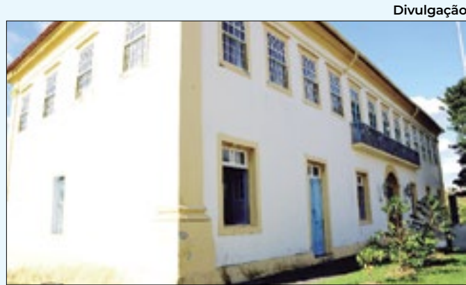
Exposição poderá ser visitada durante abril

devolvida à Igreja Matriz de Sant'Ana Piraí, com o apoio da 94ª Delegacia de Polícia Civil de Piraí. A reunião será realizada no auditório da Curia Diocesana, em Volta Redonda.