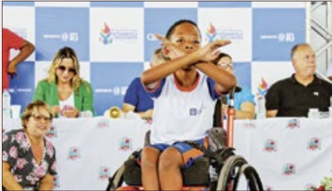
Atividades terão foco inclusivo com a paralimpíada