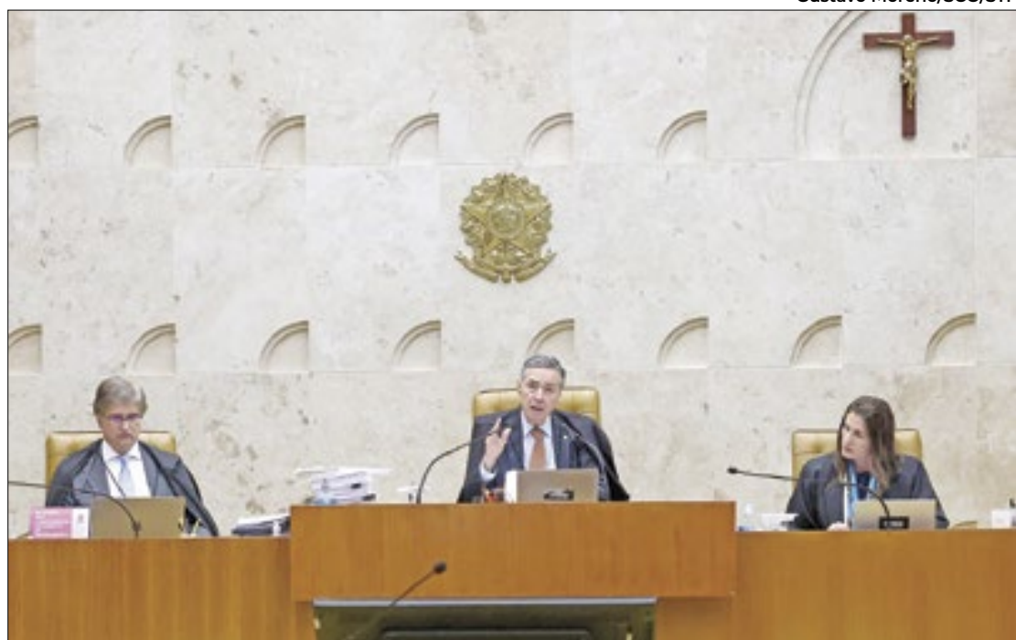
Maioria do STF define papel constitucional das Forças Armadas

Esse trecho da Constituição foi amplamente disseminado, principalmente nos últimos anos durante o mandato do ex-presidente Jair Bolsonaro (PL), como justificativa para uma eventual interferência dos militares sobre as instituições democráticas. Até agora, além de Zanin, votaram os ministros Gilmar Mendes, André Mendonça, Edson Fachin, Flávio Dino e o presidente da Corte, Luís Roberto Barroso, que acompanharam o relator Luiz Fux, e entenderam que a Constituição não permite a suposta "moderação" dos militares.