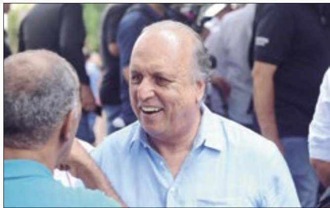
Pezão tem apoio da maioria da Câmara de Pirai