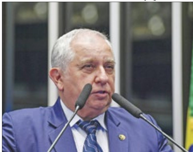
Izalci: seus eleitores tornaram-se conservadores