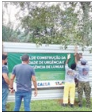
Unidade de pronto socorro

A Prefeitura de Nova Friburgo no dia 1º de abril, deu a ordem de início das obras para a construção da Unidade de Urgência e Emergência de Lumiar. Esta já era uma demanda antiga dos moradores do distrito e arredores. O projeto foi elaborado pela gestão municipal e os recursos são provenientes de emenda parlamentar do deputado Glauber Braga, cujo repasse foi recebido pelo município no último mês. O valor da obra é de R$ 894.165,42. Inicialmente, a previsão é que a unidade funcione como pronto socorro 24h.