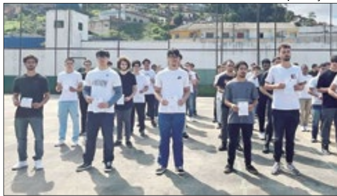
Formatura de dispensa do serviço militar obrigatório