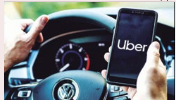
Parte de motoristas não quer contribuir para INSS