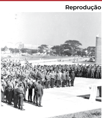
Documentário nas Escolas

municação e Empostação de Voz, bem como o de Pintura em Têcido, que foi ministrado na sede do Sindicato dos Trabalhadores. Para o público infantil, a Cultura ofereceu sessões gratuitas, ao longo de todo o mês e com datas variadas, a peça teatral: “O Castelo Encantado”, inspirado no trabalho de Lucia Benedetti.