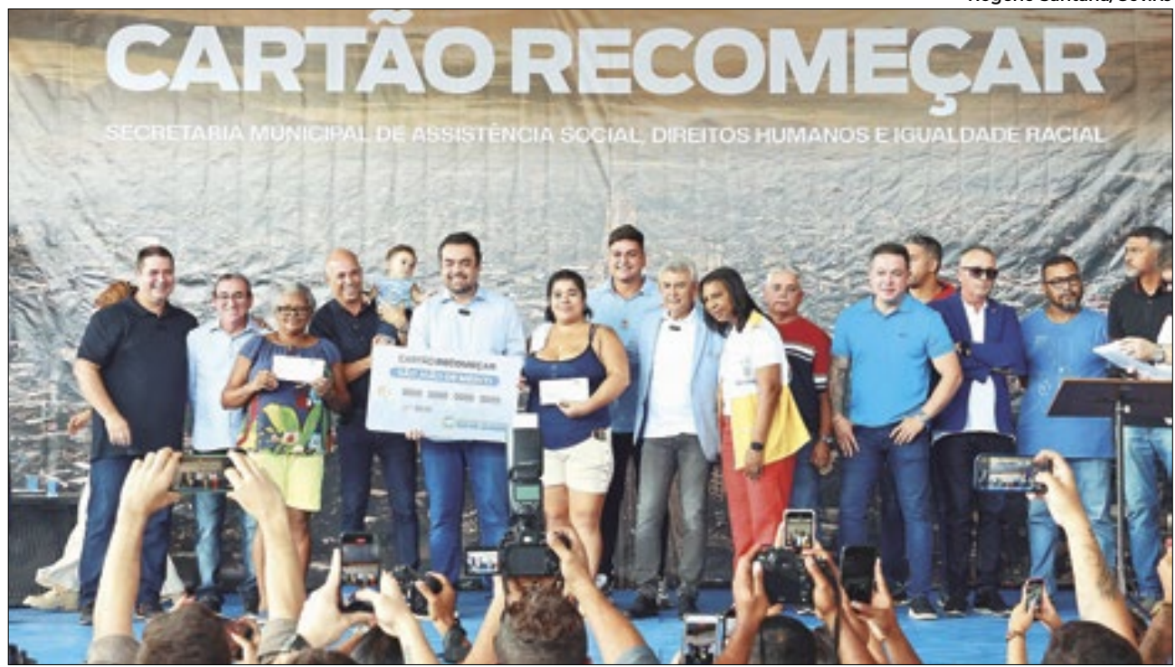
Governador fez entregas do Cartão Recomeçar em cidades da Baixada Fluminense

anos, diagnosticado com transtorno do espectro autista. A docente falou sobre esse momento que marcou sua vida e a importância dos jogos na cidade: "O esporte e a educação são aliados. A prática esportiva ajuda no desenvolvimento, disciplina e na construção de valores". reforçou.