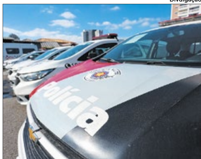
Operação Verão termina com sucesso de ações