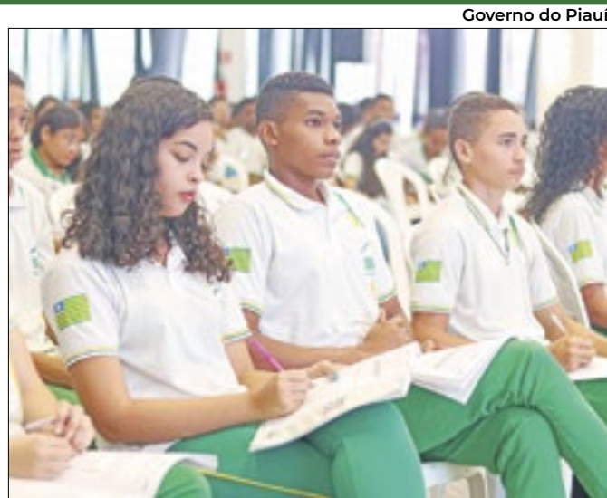
50 alunos da rede estadual serão premiados

Aço, calçados e pescados estão entre os produtos comercializados