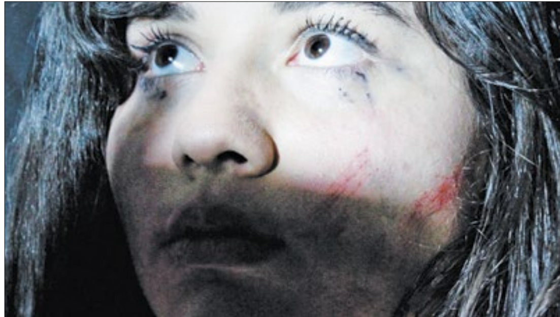
Gabriela Gallo/Correio da Manhã

Por isso, além do relatório, a ferramenta “The Purple Check” permite verificação de texto para averiguar se as palavras estão corretas ou se incluem um viés. É só entrar no site, anexar o texto na caixa e a ferramenta irá verificar e