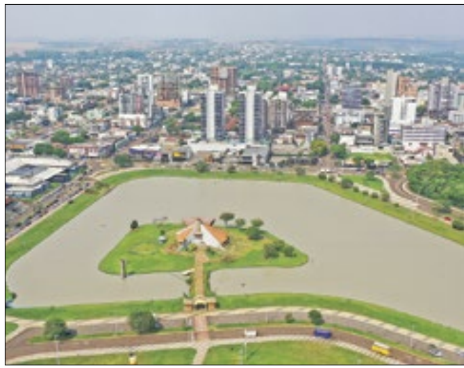
Repases do Estado aos municípios cresceu 10,8%