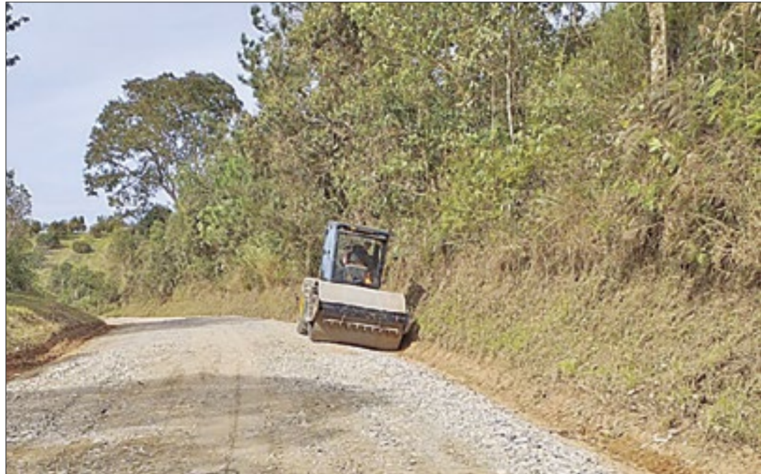
DER/PR assina contrato de R$ 56,9 milhões para pavimentação da Doutor Ulysses

Além de sinalização horizontal e vertical ao longo do trecho pavimentado, também serão instaladas defensas metálicas em todos os pontos mais sinuosos para garantir maior segurança aos usuários. Também estão previstos dispositivos de drenagem como sarjetas de concreto, descidas d'água, drenos, bueiros e também