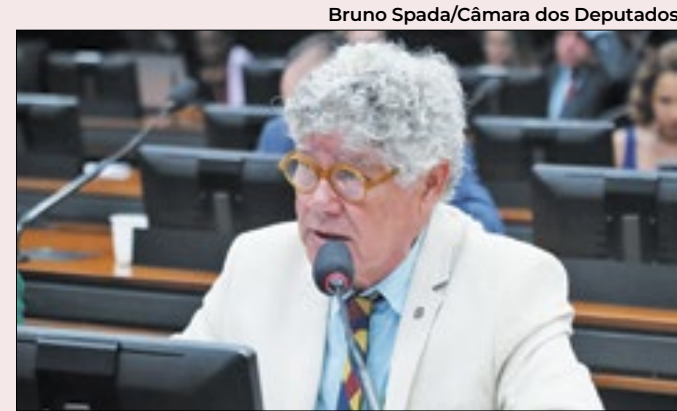
Alencar cobra motivos para assassinato

Após a negociação entre os dois poderes, em fevereiro o governo federal editou uma MP 1.208/2024, uma nova MP substituta que revogou os trechos da primeira em relação à desoneração para as empresas. Na época a nova MP não englobava a desoneração dos municípios, o que também foi alvo de crítica dos parlamentares. Agora, o trecho dos municípios caducou e não vale mais.