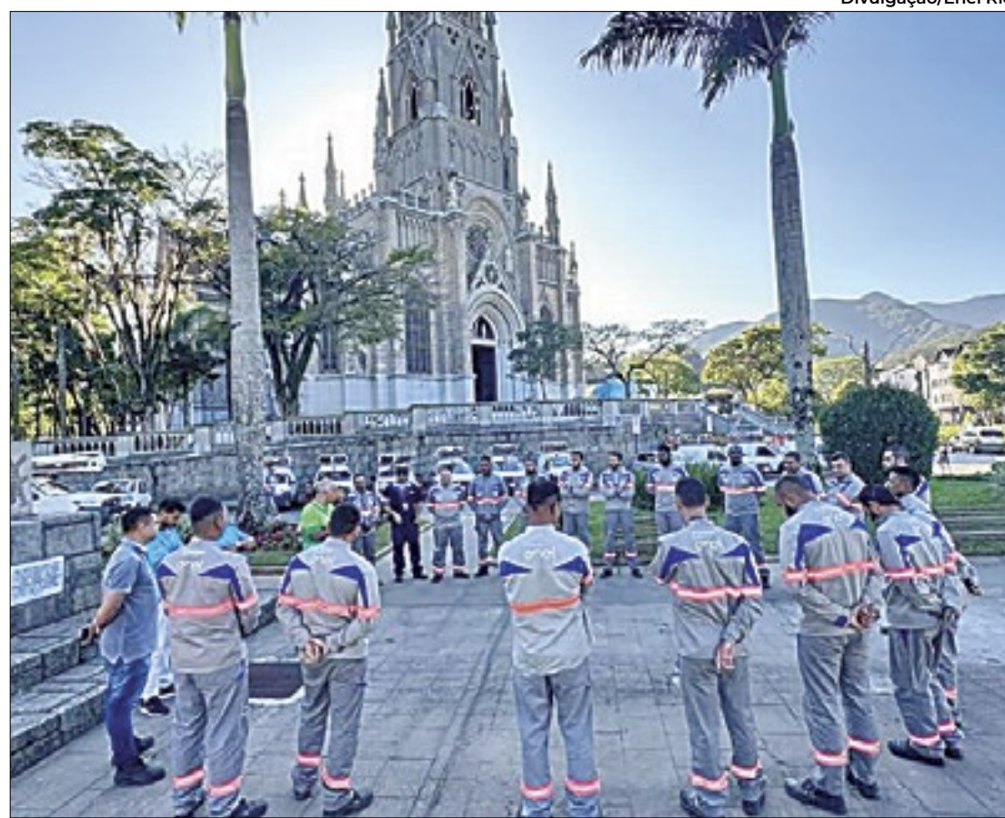
Enel Distribuição atende 66 municípios em todo o estado do Rio de Janeiro

Ministro Alexandre Silveira entrará com processo contra a companhia