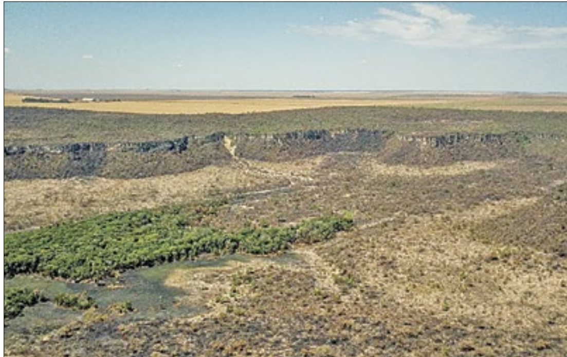
O estado faz parte da região onde ocorre o maior índice de devastação do bioma

Thomas Bauer/Instituto Sociedade População e Natureza Geral