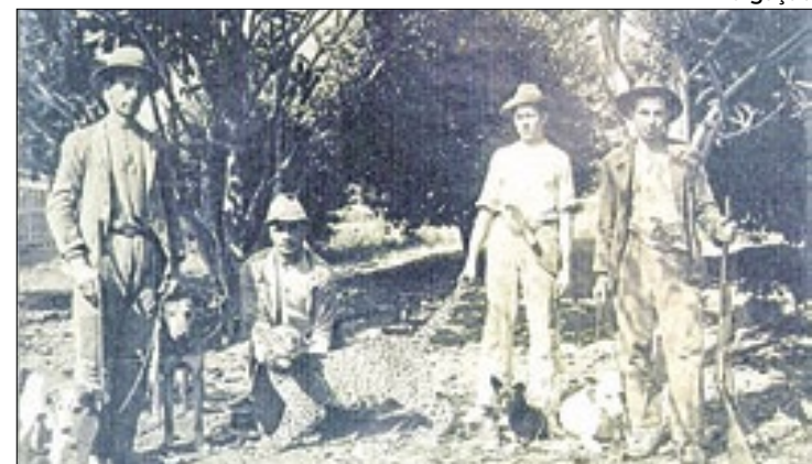
Mostra fotográfica sobre colonização italiana