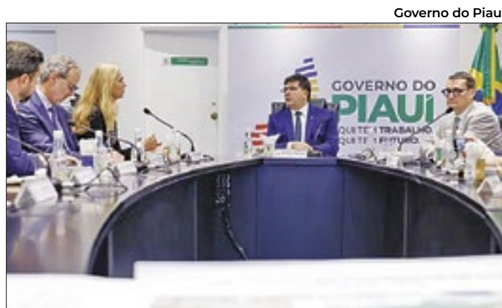
Parceria busca o desenvolvimento de hidrogênio verde

Os Estados Unidos lideram como o principal mercado internacional para os produtos cearenses, representando 47,2% do total das exportações, seguidos pelo México (11,7%), Argentina (4,5%), Alemanha (4%), Bélgica (3,3%), Holanda (3,3%), França (2,5%), China (2,4%), Itália (2,1%) e Reino Unido (2,1%). Todos esses países fazem parte