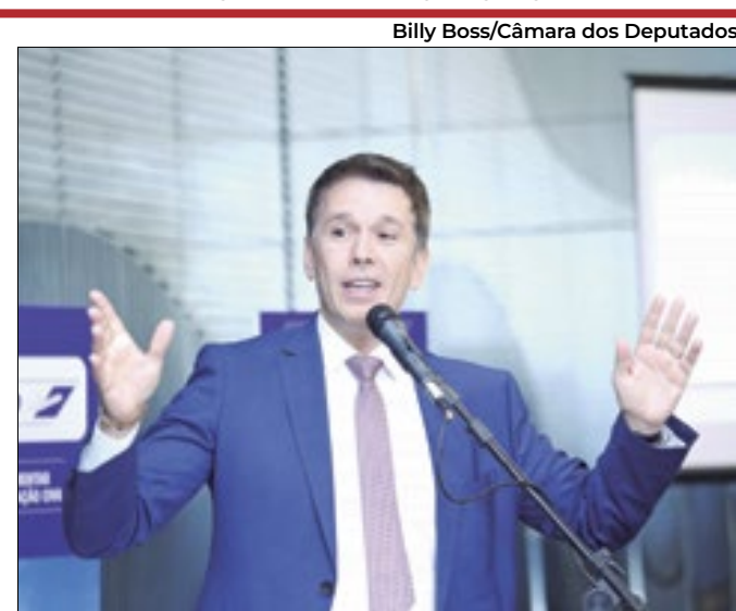
Carreras: falta humildade ao Ministério da Fazenda