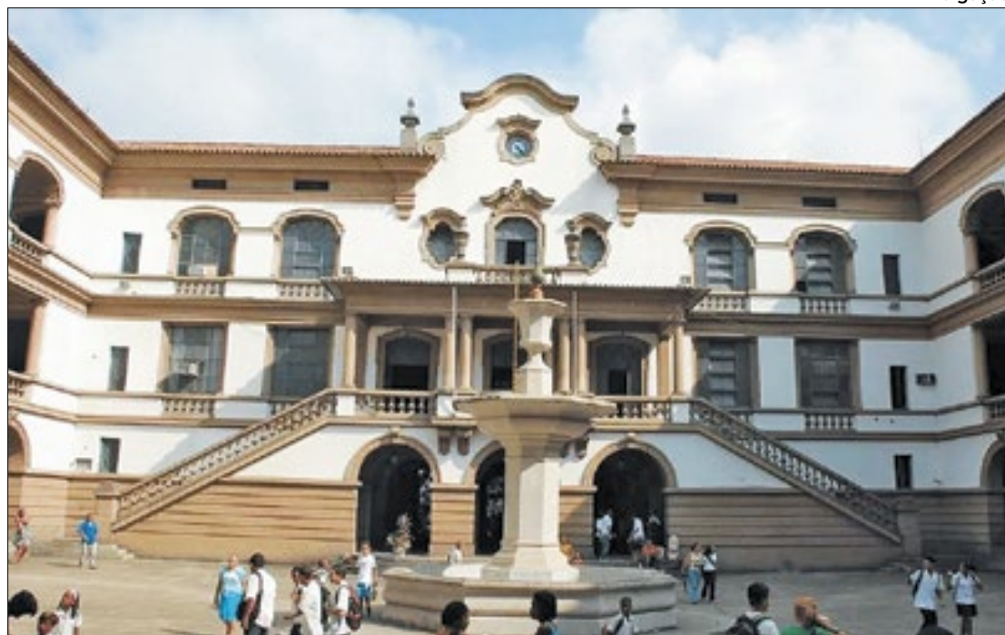
Colégio Pedro II é uma das unidades de ensino que entrarão em greve

“Não queremos a resposta em maio, porque o dinheiro que nós estamos disputando, aquilo que sobrou, e é excesso da arrecadação, já estará gasto em maio. Nós precisamos fazer a pressão e a luta agora. Nós queremos