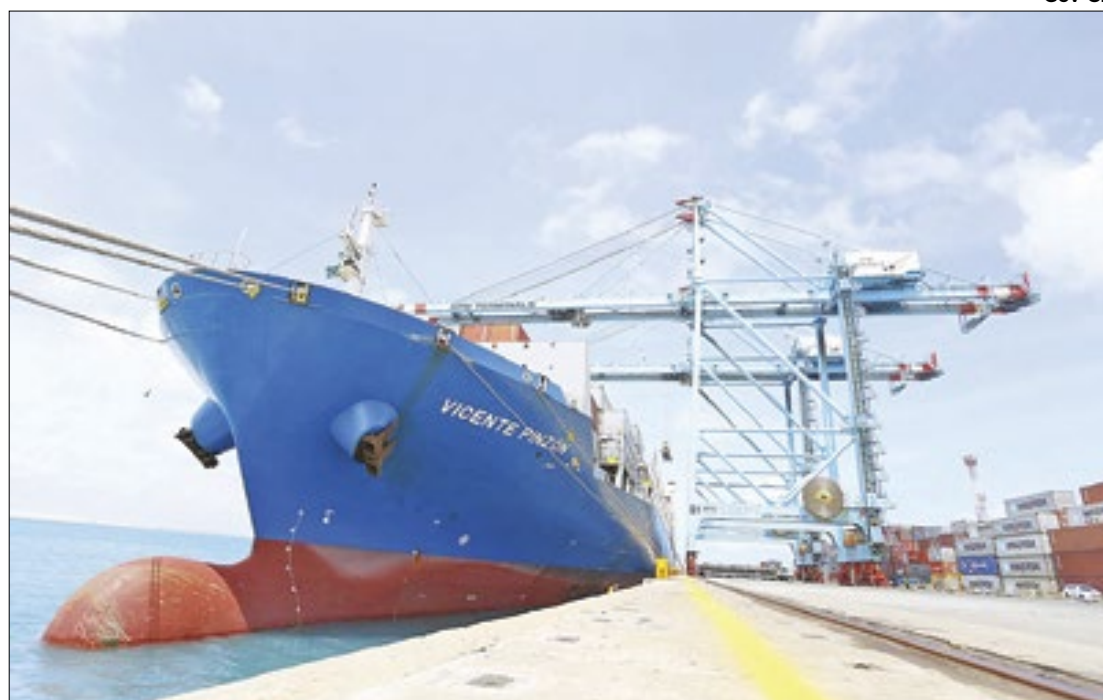
Em 2023, as exportações cearenses alcançaram mais de 2 bilhões de dólares

A Secretaria Municipal de Infraestrutura de Maceió concluiu obras em mais de 20 encostas, empregando tecnologias como solo grampeado e gabioes. Os investimentos visam proteger áreas vulneráveis e proporcionar segurança aos moradores, evitando deslizamentos e desabamentos.