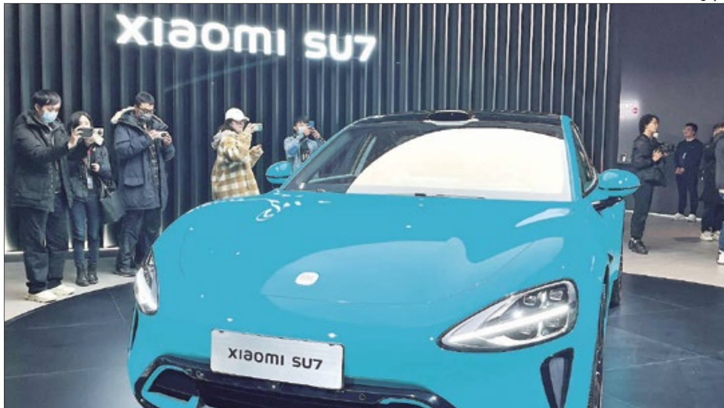
No lançamento do SU7 CEO da Xiaomi “alfineta” Apple e Elon Musk e mostra cumplicidade com montadoras chinesas

neira alguma a equipe da BYD e ainda no início de seu discurso, aproveitou para agradecer a presença de CEOs de outras fabricantes chinesas de carros elétricos, como Nio, Xpeng e Li Auto, que estavam presentes ao evento. “Eles nos deram muitas sugestões ao longo dos anos para evitar armadilhas no desenvolvimento de EVs”, agradeceu Lei. O ato demonstrou que realmente a indústria chinesa, segunda maior economia do mundo, pode estar trabalhando em conjunto para dominar de vez