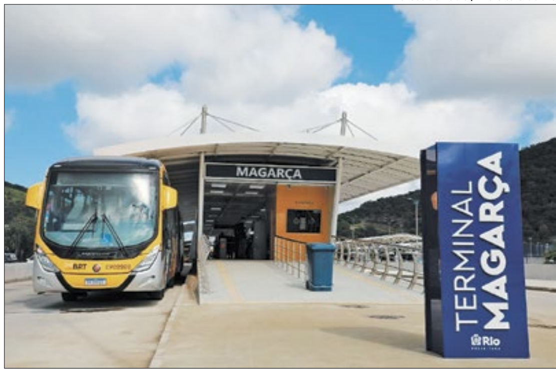
Estação é a primeira das quatro do corredor Transoeste a virar terminal de integração

"O sistema de BRT estava completamente destruído. Na perspectiva da população era praticamente impossível retomar o serviço. Hoje, são mais de 700 ônibus novos comprados e rodando pela cidade, os amarelinhos. A Transoeste está toda reconstruída, tem os novos terminais. Hoje a gente inaugura o terminal Magarça, mas vem mais por aí, os terminais Mato Alto, Pingo d'Água e Curral Falso. Ontem tivemos a primeira viagem na Transbrasil, um dia histórico, que inaugura um novo capítulo da história dos transportes do Rio de Janeiro", disse Cavaliere.