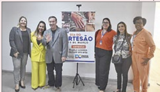
Evento fez parte de uma série de atividades em março