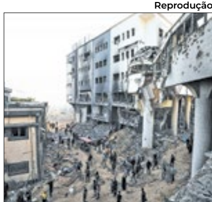
Israel deixou hospital de Gaza

A retirada das tropas de Israel do Al-Shifa na segunda (1º) após duas semanas de invasão revelou um hospital em ruínas e, segundo o Ministério da Saúde do território palestino, controlado pelo Hamas, dezenas de corpos espalhados pelo chão --incluindo alguns em estado de decomposição. A operação havia sido elogiada pelo primeiro-ministro israelense, Binyamin Netanyahu, no domingo (31).