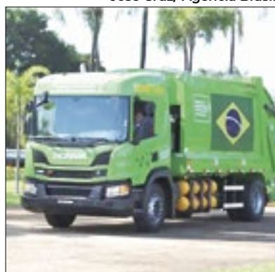
Proprietários serão responsáveis

A Prefeitura de Paraíba do Sul anunciou novas regras sobre a coleta de lixo verde. Segundo o órgão, nenhum funcionário público está autorizado a realizar poda ou supressão de vegetação em terrenos particulares. Cabe ao proprietário do terreno