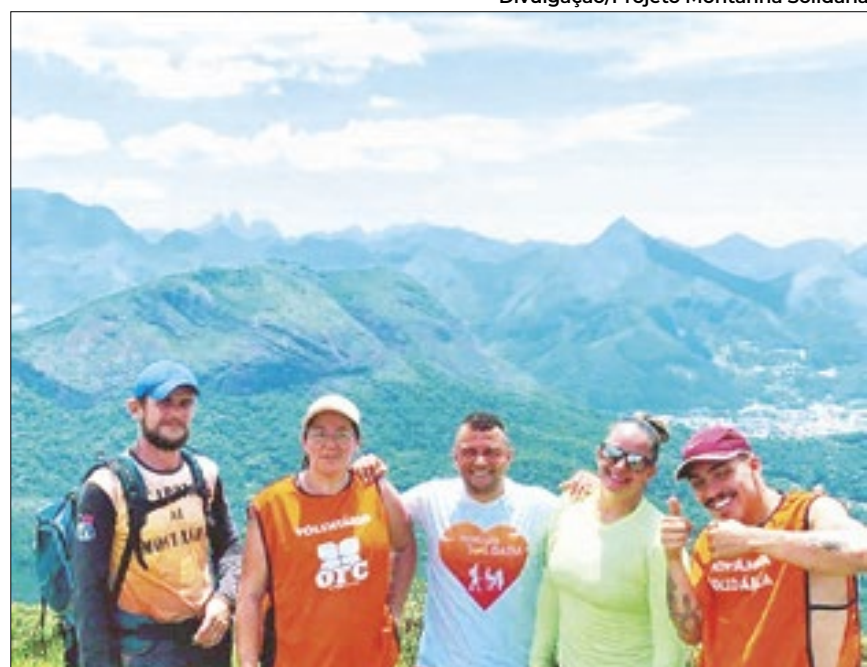
Voluntários do Projeto Montanha Solidária em Nova Friburgo

"No momento, somos seis voluntários que compõem o