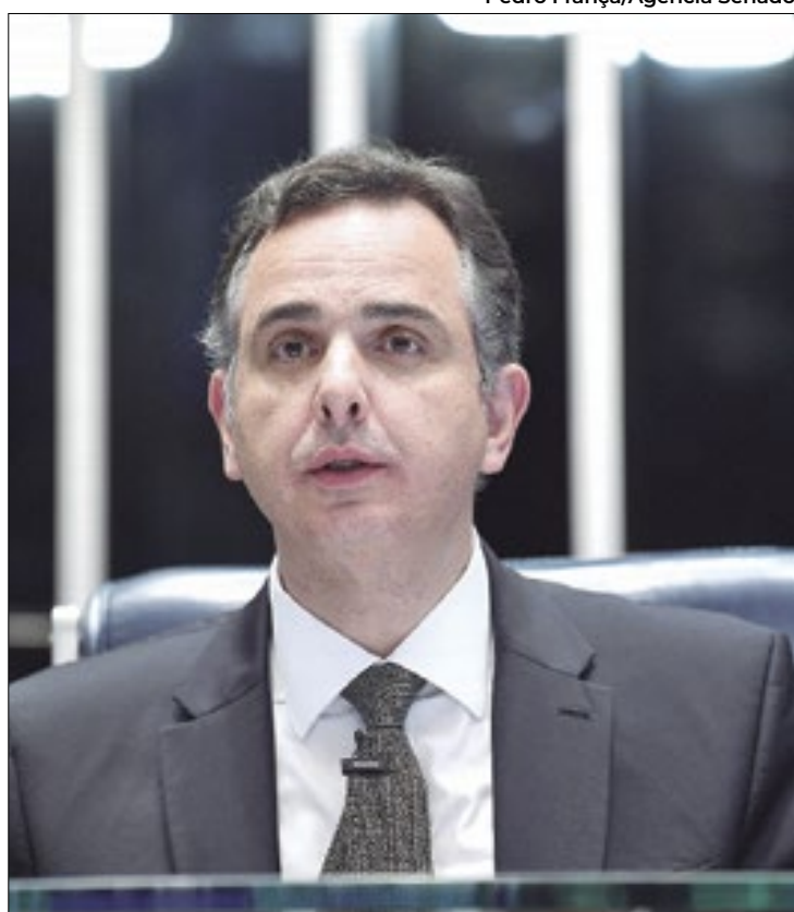
Pacheco deixou caducar reoneração dos municípios

Na prática, a decisão do presidente do Senado determina que somente perderam a validade os dispositivos que cancelavam a desoneração da folha das empresas, que já foram revogados em fevereiro