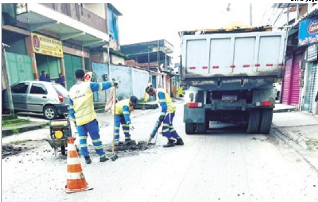
Avenida São Paulo, em Campos Elíseos, recebeu melhorias