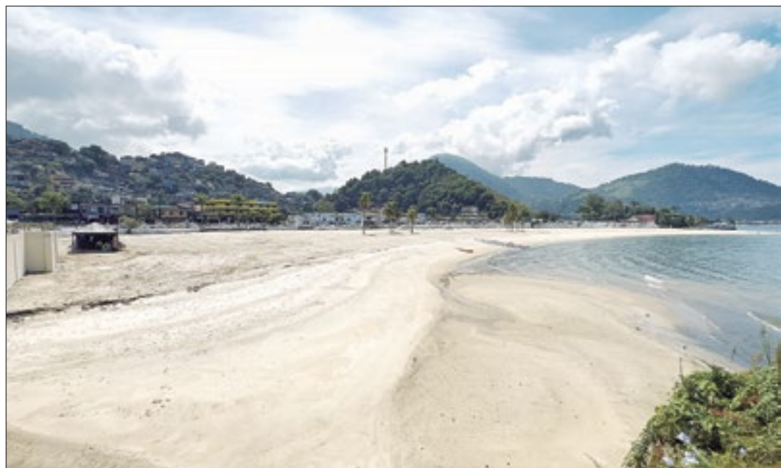
Praia do Anil fica no Centro de Angra dos Reis e despeja esgoto no mar

de uma elevatória no bairro, o material será coletado por três bombas e seguirá por uma tubulação até a estação de tratamento na vizinha Praia da Chácara, para só então ser descartado - afirmou o release da prefeitura.