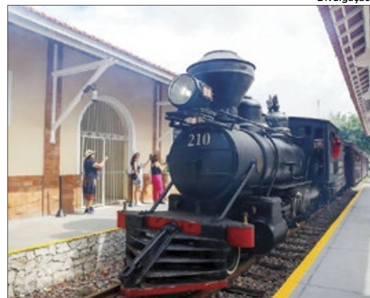
Maria Fumaça: Passeio de história e cultura