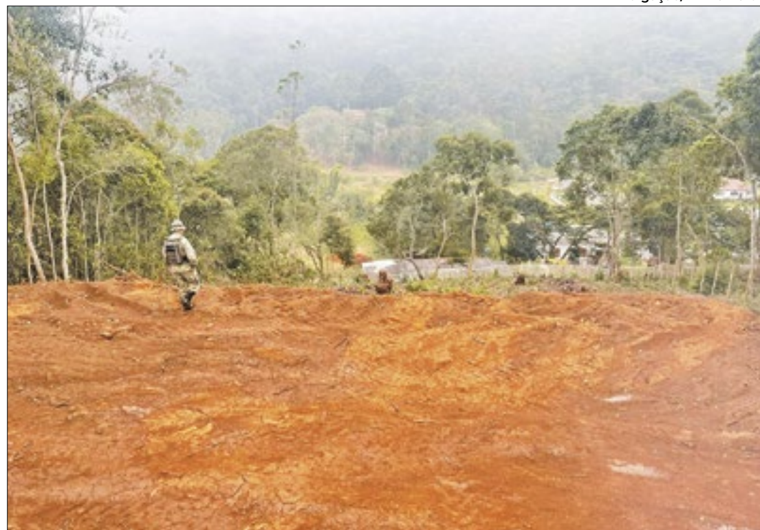
Nos primeiros meses do ano, Petrópolis lidera o ranking de denúncias.

Nova Friburgo fica em segundo lugar, registrando 60 denúncias gerais. Em 2023, o município registrou 41 queixas. Tendo como destaque, desmatamento florestal, com 22 denúncias, guarda/comércio de animais silvestres, com 16, maus tratos contra animais e extração irregular de árvores, ambos com 14. Os