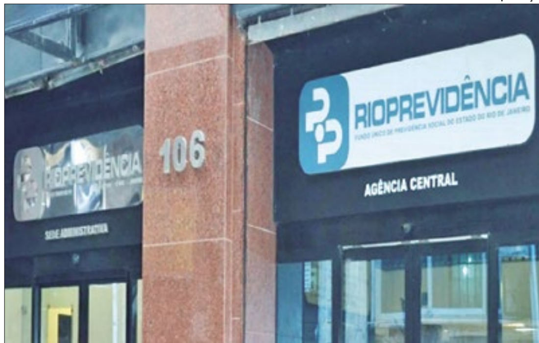
Grupo de beneficiários deve fazer atualização cadastral

O objetivo é fornecer às mulheres e aos adolescentes de ambos os sexos informações que garantam o exercício seguro dos seus direitos reprodutivos. A medida determina que as unidades de saúde públicas devem divulgar a contraindicação de todos os métodos contraceptivos.