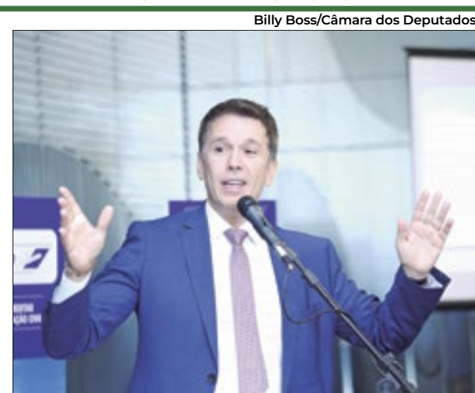
Carreras: falta humildade ao Ministério da Fazenda