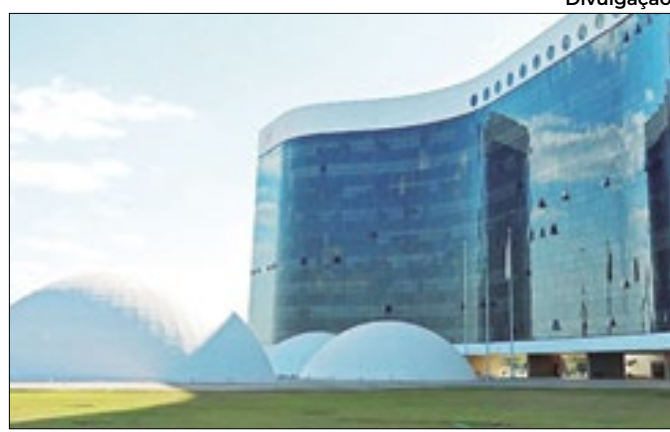
TSE estabelece calendário para eleição de outubro