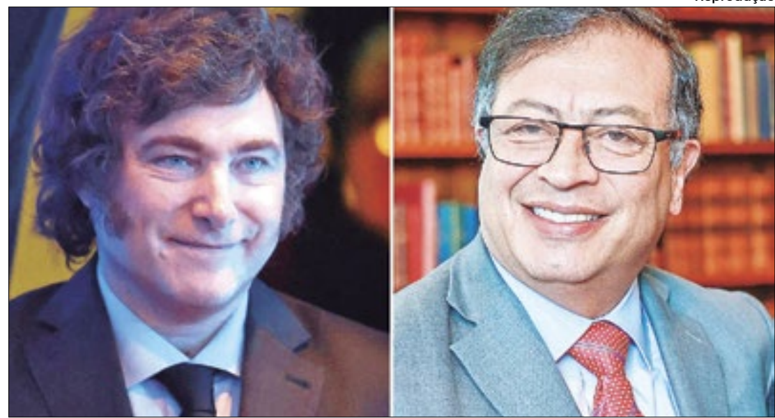
Os dois países também reafirmam a importância de manter boas relações

"O general Mohamad Reza Zahedi, um dos altos comandantes da Força Quds, foi martirizado em um ataque de combatentes do regime sionista contra o prédio da embaixada