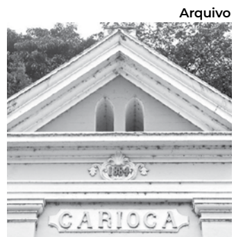
Construído pelo Barão do Rio Bonito

d'água, situados no beco do mesmo nome, em 1884, pelo Terceiro Barão do Rio Bonito que, dessa forma, inaugurou o abastecimento de água, beneficiando, às suas expensas, a serventia pública do povoado, então, pertencente ao município de Valença. O Barão, além de providenciar o abastecimento de água, ofertou, também, sete postes com lâmpades.