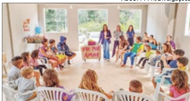
Crianças foram presenteadas com chocolates