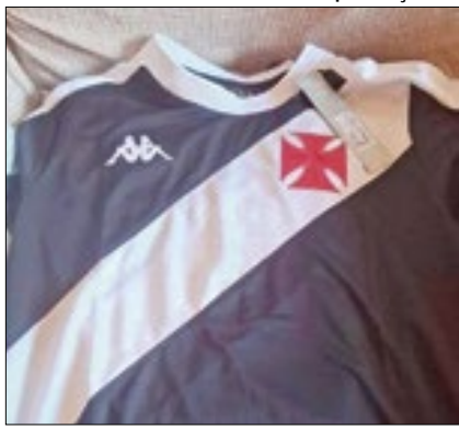
Nova camisa vazou na internet

Quando entrar em campo contra o Grêmio, na partida válida pela primeira rodada do Campeonato Brasileiro 2024, em 14 de abril, o Vasco estreará sua camisa 1 da temporada.