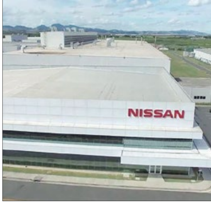
Evento é realizado pela Nissan Brasil, em Resende

O lançamento da edição 2024 do Inova-san aconteceu em um evento virtual transmitido pelo canal da Nissan Brasil no Youtube, com a participação do presidente Gonzalo Ibazabal. O programa impactou a vida de mais de dois mil estudantes no Sul Fluminense, atingindo o marco de 22 mil horas certi-