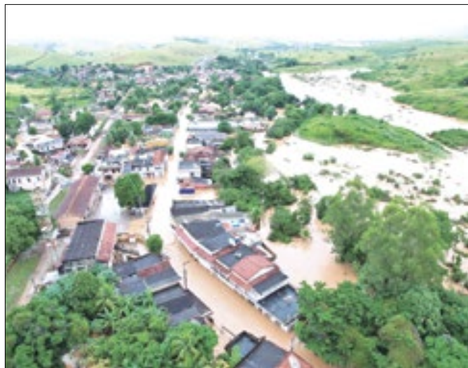
Cidade foi castigada pelas recentes chuvas no Rio