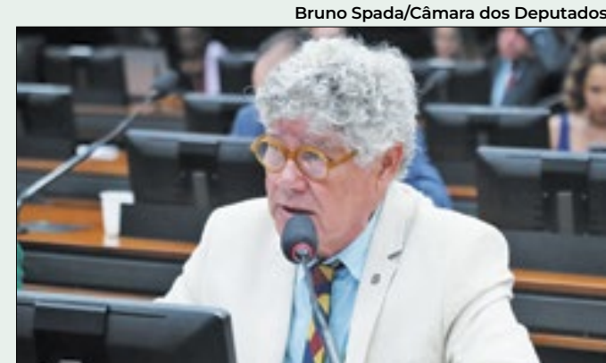
Alencar cobra motivos para assassinato

Após a negociação entre os dois poderes, em fevereiro o governo federal editou uma MP 1.208/2024, uma nova MP substituta que revogou os trechos da primeira em relação à desoneração para as empresas. Na época a nova MP não englobava a desoneração dos municípios, o que também foi alvo de crítica dos parlamentares. Agora, o trecho dos municípios caducou e não vale mais.