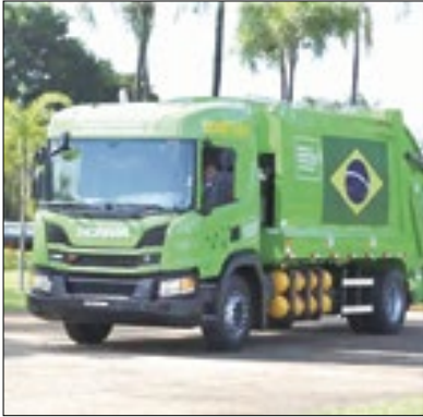
Proprietários serão responsáveis

A Prefeitura de Paraíba do Sul anunciou novas regras sobre a coleta de lixo verde. Segundo o órgão, nenhum funcionário público está autorizado a realizar poda ou supressão de vegetação em terrenos particulares. Cabe ao proprietário do terreno