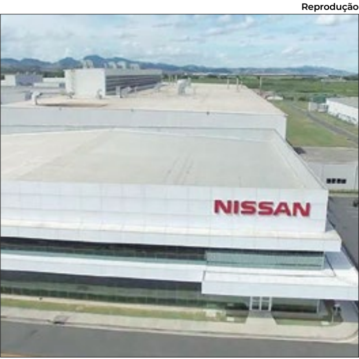
Evento é realizado pela Nissan Brasil, em Resende

O lançamento da edição 2024 do Inova-san aconteceu em um evento virtual transmitido pelo canal da Nissan Brasil no Youtube, com a participação do presidente Gonzalo Ibazábal. O programa impactou a vida de mais de dois mil estudantes no Sul Fluminense, atingindo o marco de 22 mil horas certi-