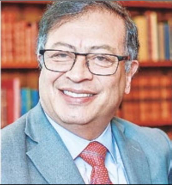
Os dois países também reafirmam a importância de manter boas relações

xador na capital colombiana. Milei, por sua vez, anunciou a visita de sua chanceler, Diana Mondino, à Colômbia.