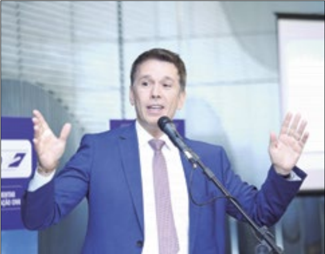
Carreras: falta humildade ao Ministério da Fazenda