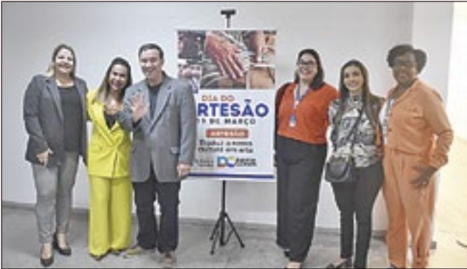
Evento fez parte de uma série de atividades em março