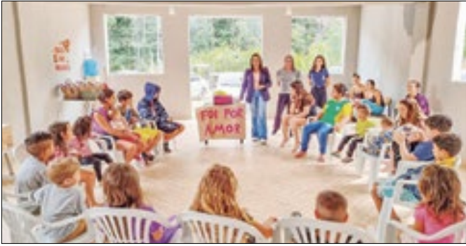
Crianças foram presenteadas com chocolates

Na última quarta-feira, dia 27, o CRAS Bonsucesso promoveu uma ação de Páscoa para 31 crianças da Vila do Alegria, em Teresópolis. O evento, focado em ensinar o valor da comunhão, incluiu dinâmicas, brincadeiras, uma oficina de dobraduras em papel e ativi-