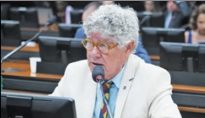
Alencar cobra motivos para assassinato