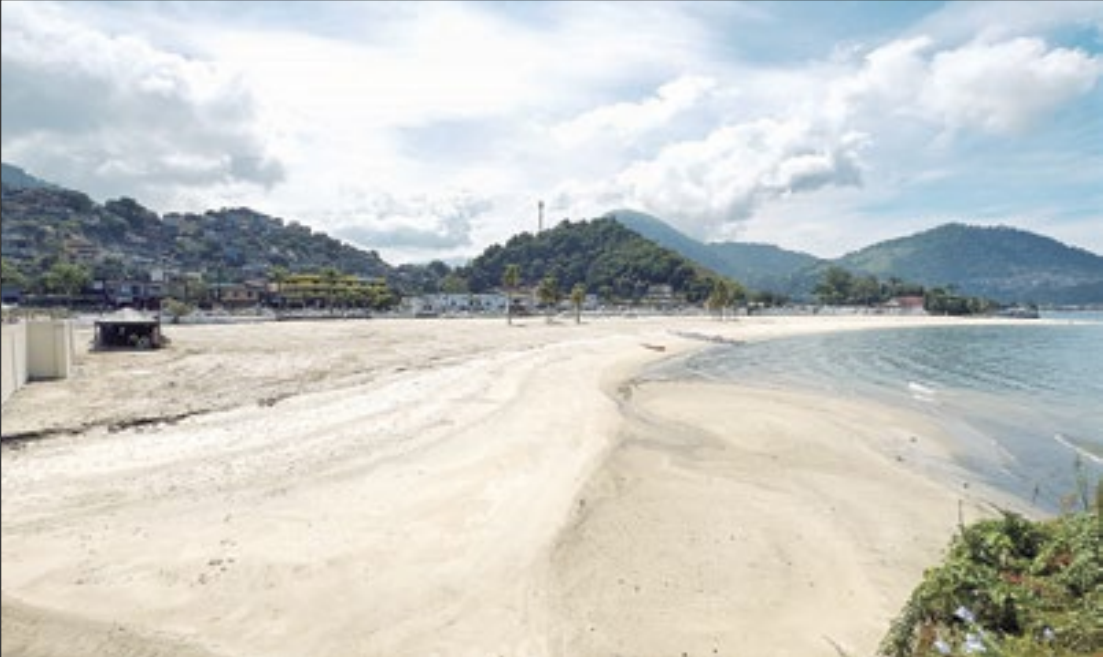
Praia do Anil fica no Centro de Angra dos Reis e despeja esgoto no mar

de uma elevatória no bairro, o material será coletado por três bombas e seguirá por uma tubulação até a estação de tratamento na vizinha Praia da Chácara, para só então ser descartado - afirmou o release da prefeitura.