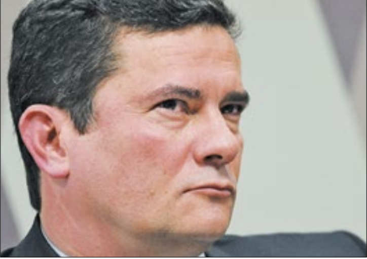
TRE julga ação que pode cassar mandato de Moro