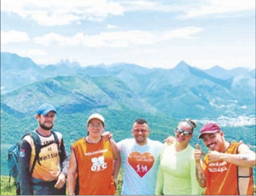
Voluntários do Projeto Montanha Solidária em Nova Friburgo