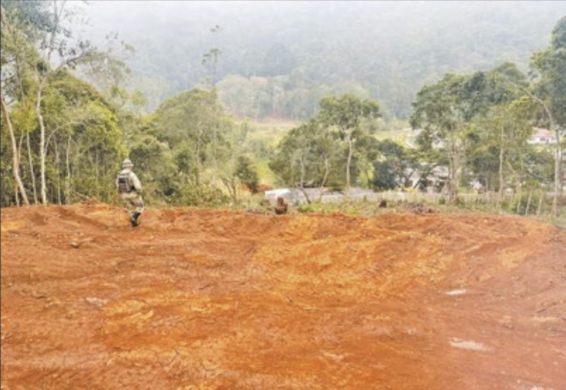
Nos primeiros meses do ano, Petrópolis lidera o ranking de denúncias.