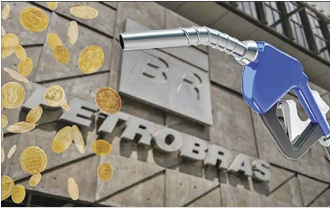
Relatório do Tribunal de Contas da União aponta ‘desvios de governança’ no negócio

Tal parecer, porém, colide frontalmente com aquele proferido pela Petrobras, duas semanas antes, no sentido de que sua apuração interna não havia encontrado qualquer irregularidade no acerto com a Unigel e que o sistema de governança da estatal havia sido “integralmente respeitado”.