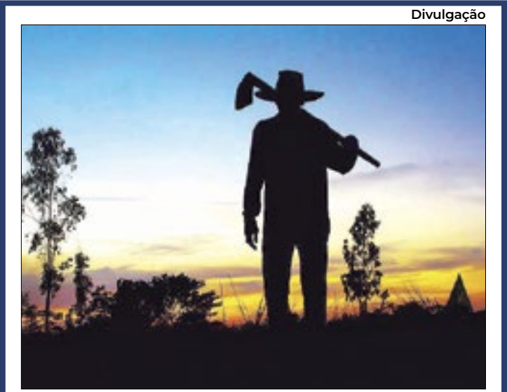
Montante parcelado em dívidas rurais soma R$ 20,8 bi

Os efeitos climáticos negativos sobre os preços agrícolas levaram o Conselho Monetário Nacional (CMN) a autorizar, na última quinta-feira (28), a renegociação de dívidas de crédito rural por parte de produtores rurais de 16 estados, cujas respectivas solicitações poderão ser feitas até 31 de maio próximo. Como justificativa, o Ministério da Fazenda, em nota, explicou que