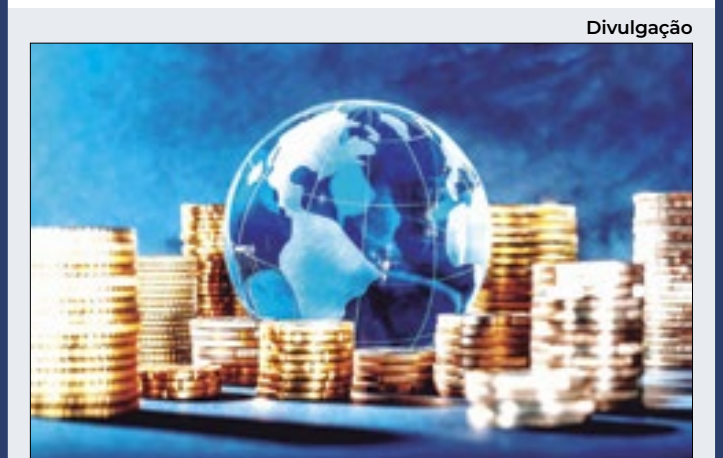
Projeção da entidade é próxima da feita pelo governo

Linhas de crédito Pelo formato da negociação, as dívidas poderão ser integralmente negociadas, mediante parcelas que vencem, entre 2 de janeiro e 30 de dezembro deste ano, para linhas de crédito contratadas até 30 de dezembro de 2023. O tomador precisa estar com as parcelas em dia.