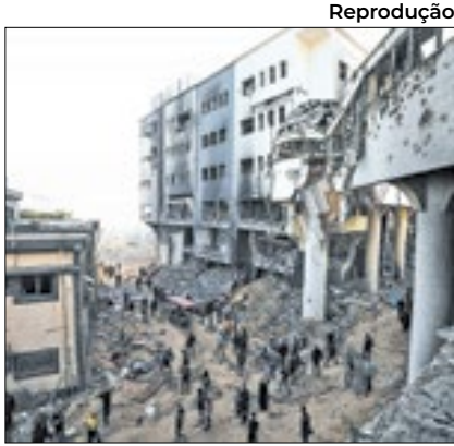
Israel deixou hospital de Gaza

A retirada das tropas de Israel do Al-Shifa na segunda (1º) após duas semanas de invasão revelou um hospital em ruínas e, segundo o Ministério da Saúde do território palestino, controlado pelo Hamas, dezenas de corpos espalhados pelo chão --incluindo alguns em estado de decomposição. A operação havia sido elogiada pelo primeiro-ministro israelense, Binyamin Netanyahu, no domingo (31).