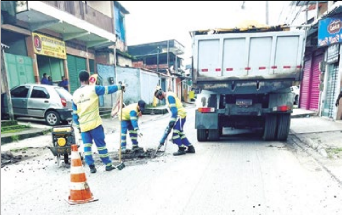
Avenida São Paulo, em Campos Elíseos, recebeu melhorias