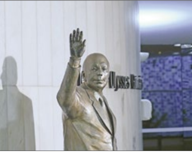
Estátua de Ulysses Guimarães, do MDB