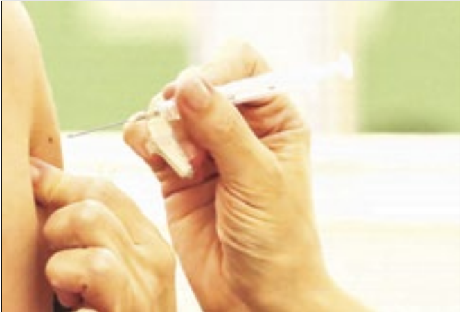
Vacinas estão sendo aplicadas nas 44 unidades de saúde