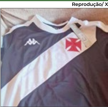
Nova camisa vazou na internet

Quando entrar em campo contra o Grêmio, na partida válida pela primeira rodada do Campeonato Brasileiro 2024, em 14 de abril, o Vasco estreará sua camisa l da temporada. Ela homenageia o ídolo máximo do clube, Roberto Dinamite, que faria aniversário no dia 13 de abril. A camisa traz uma gola que simula o algodão da camisa eternizada por Roberto e traz o nome ‘Dinamite’ estampado na faixa diagonal.