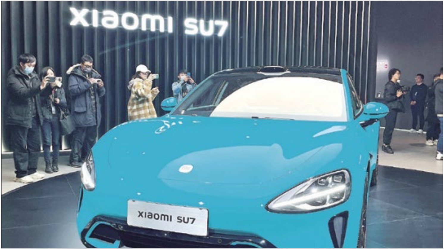
No lançamento do SU7 CEO da Xiaomi “alfineta” Apple e Elon Musk e mostra cumplicidade com montadoras chinesas

A Xiaomi passou à frente da Apple e lançou seu primeiro carro elétrico. As duas gigantes do mercado mobile já haviam mostrado interesse em fazer parte da luta pelos carros elétricos. Hoje o mercado é liderado pela chinesa BYD que passou à frente da Tesla, de Elon Musk, ainda no começo desse ano. Porém, agora os chineses parecem estarem querendo tomar o comando de vez do setor. Vale ressaltar que a Apple mostrou interesse em entrar no setor lançando o seu modelo de carro elétrico. Porém desistiu no meio do caminho, depois de um investimento de cerca de US$ 1 bilhão. Esse foi o mesmo valor gasto pela Xiaomi para trazer o SU7. O novo modelo foi apresentado pelo CEO da Xiaomi, Lei Jun durante um evento de luxo na última quinta-feira (28/03). “Thor”, como ficou conhecido nas redes sociais, uma referência ao seu sobrenome que significa trovão em chinês, explicou que demorou longos três anos para ser concluído o projeto e aproveitou o dia para provocar seus concorrentes. Primeiramente “alfinetou” a equipe da Apple pela desistência do setor e finalizou alertando que o SU7 é um modelo superior ao Model 3, um dos principais modelos da Tesla. Porém, Lei não atacou de ma-