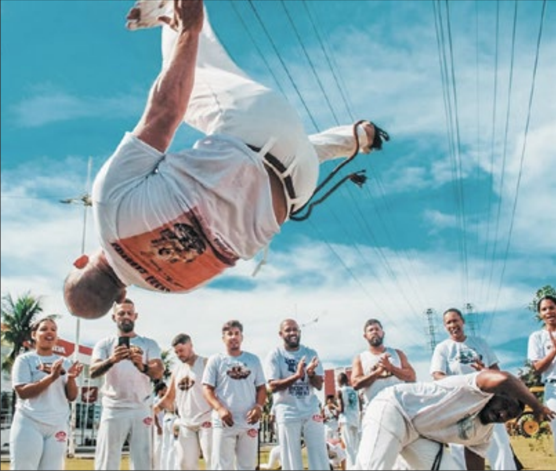
Município de Nova Iguaçu terá diversas apresentações durante seu Festival de Artes

Vai começar o II Festival de Artes de Nova Iguaçu. Depois do grande sucesso da primeira edição, realizada em 2023, o evento deste ano contará com 65 apresentações artísticas gratuitas espalhadas pela cidade pelos próximos dois meses. O primeiro deles acontece nesta quarta-feira (3), no Complexo Cultural Mário Marques, às 18h. O Festival de Artes é promovido pela Prefeitura, por meio da Fundação Educacional e Cultural de Nova Iguaçu (FENIG), com apoio da Secretaria Municipal de Cultura (SEMCULT).