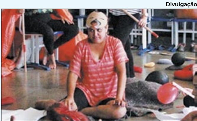
Mostra estará no Centro Cultural Sérgio Porto