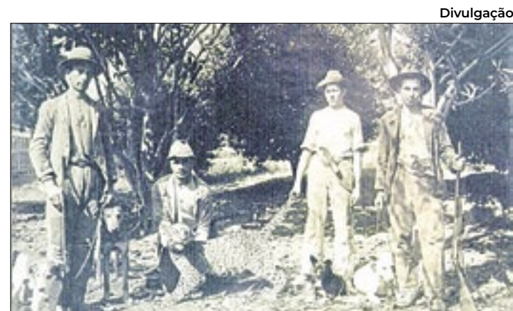
Mostra fotográfica sobre colonização italiana

O Carnaval foi um caso à parte: entre 9 e 14 de fevereiro, mais de 38 mil pessoas desembarcaram na Capital catarinense. Muita gente também aproveitou o Verão circulando pelas rodovias.