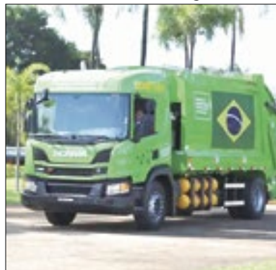
Proprietários serão responsáveis

A Prefeitura de Paraíba do Sul anunciou novas regras sobre a coleta de lixo verde. Segundo o órgão, nenhum funcionário público está autorizado a realizar poda ou supressão de vegetação em terrenos particulares. Cabe ao proprietário do terreno