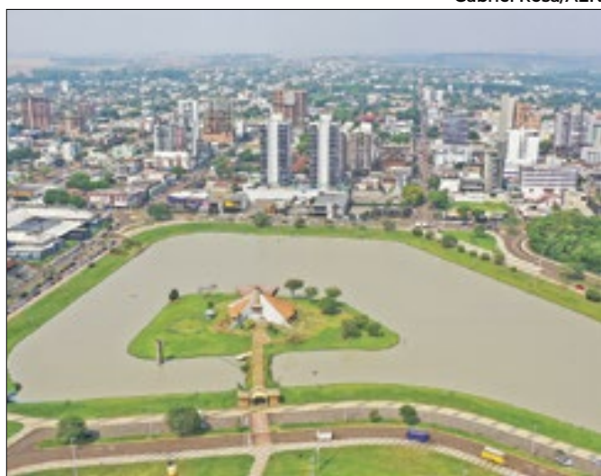
Repases do Estado aos municípios cresceu 10,8%