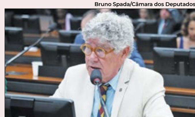
Alencar cobra motivos para assassinato

Após a negociação entre os dois poderes, em fevereiro o governo federal editou uma MP 1.208/2024, uma nova MP substituta que revogou os trechos da primeira em relação à desoneração para as empresas. Na época a nova MP não englobava a desoneração dos municípios, o que também foi alvo de crítica dos parlamentares. Agora, o trecho dos municípios caducou e não vale mais.