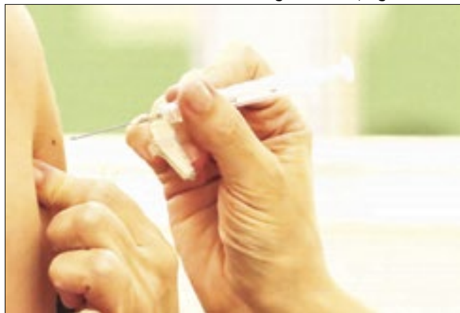
Vacinas estão sendo aplicadas nas 44 unidades de saúde