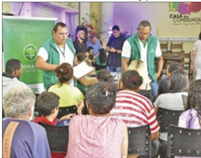
Mutirão leva serviços às vítimas das chuvas