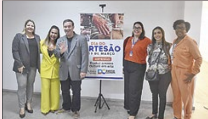
Evento fez parte de uma série de atividades em março