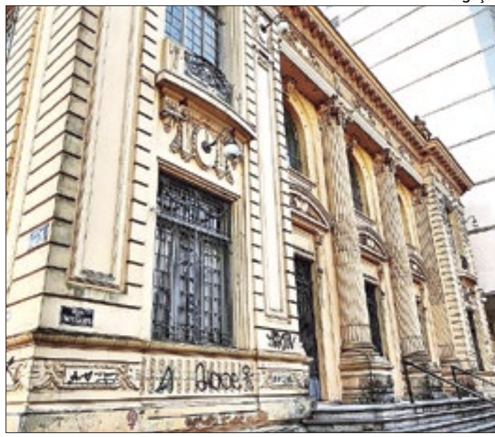
Prédio central dos Correios em Petrópolis está fechado