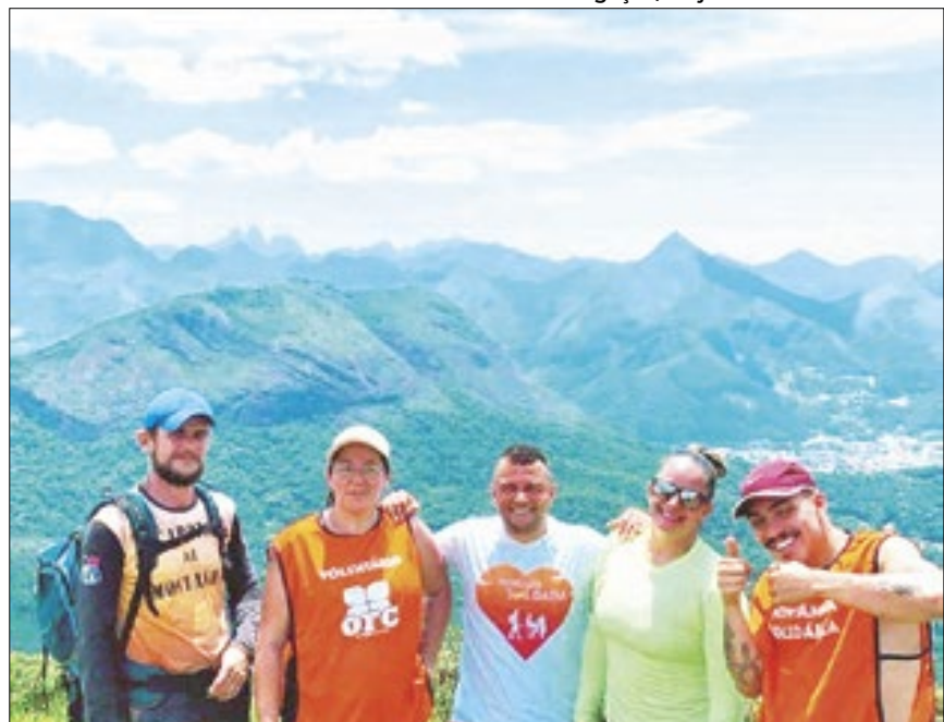
Voluntários do Projeto Montanha Solidária em Nova Friburgo

"No momento, somos seis voluntários que compõem o