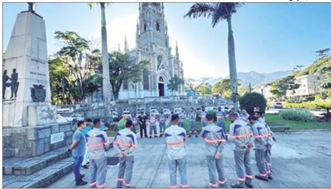
Enel Distribuição atende 66 municípios em todo o estado do Rio de Janeiro

Segundo o ministro, a abertura do processo disciplinar pode levar inclusive a um processo de caducidade. A caducidade de uma concessão é recomendada pela Agência Nacional de Energia Elétrica (Aneel). Contudo, a decisão sobre cancelar ou não o contrato é do Ministério de Minas e Energia.