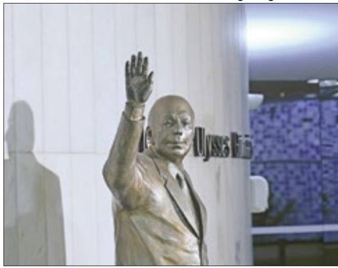
Estátua de Ulysses Guimarães, do MDB