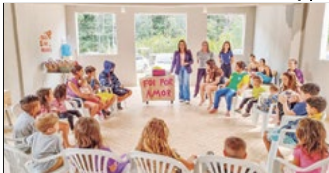
Crianças foram apresentadas com chocolates