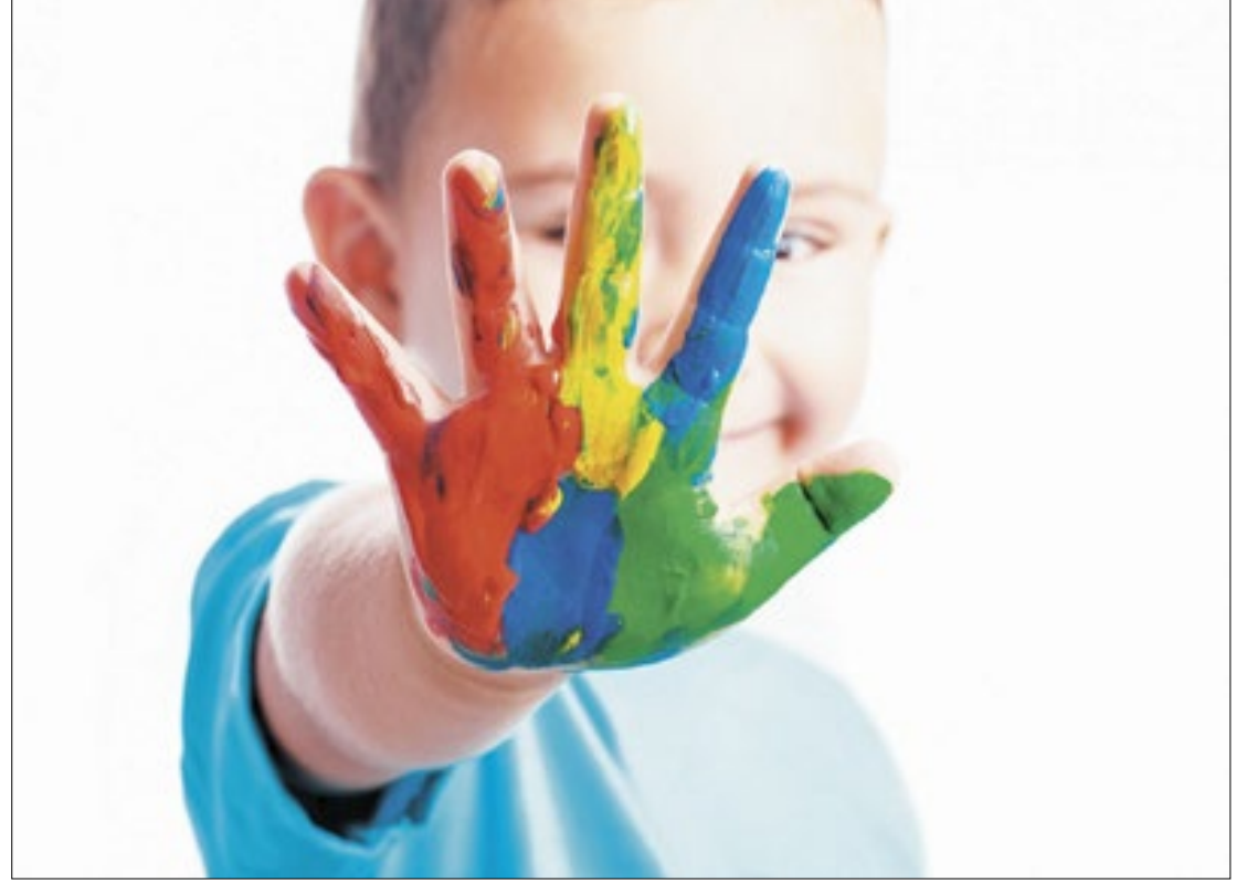
Data visa ressaltar a importância da inclusão na sociedade

"Então passei por uma avaliação neuropsicológica e veio a confirmação. Nesse processo, eu passei a estudar o tema e, quando eu comecei a ler sobre o que era o autismo, os sintomas,