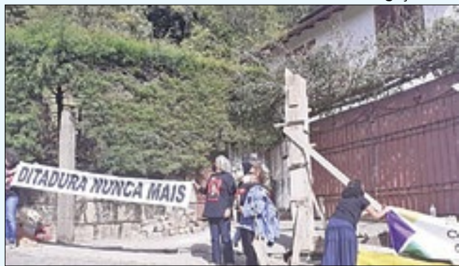
'Casa da Morte' foi usada como centro de tortura