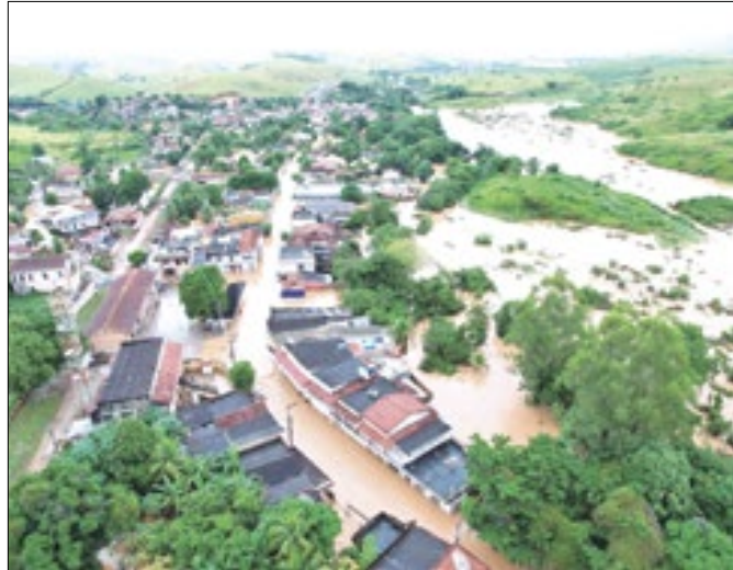
Cidade foi castigada pelas recentes chuvas no Rio