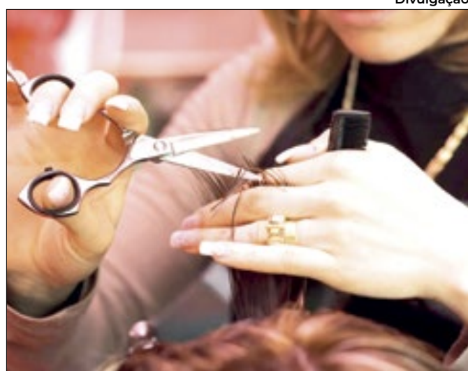
Serviços têm melhor resultado, desde outubro de 2022

Pelo resultado, déficit primário supera em 37,7% igual mês de 2023