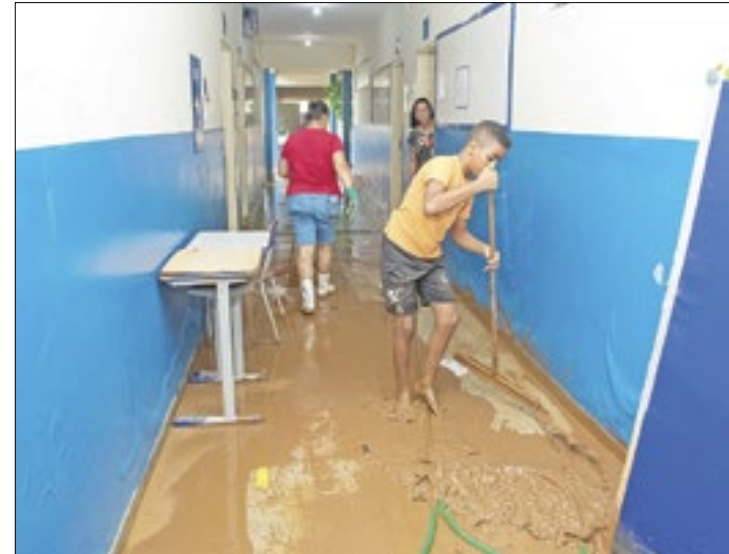
União de voluntários mostra o poder da educação