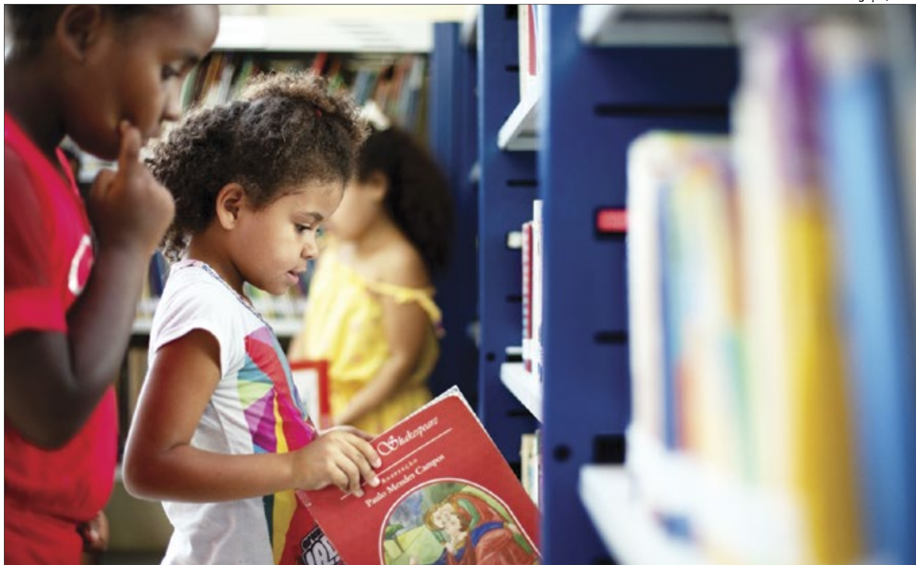
Evento tem entrada franca e será realizado pelo Instituto Dagaz em parceria com a prefeitura

“É importante que as escolas façam o agendamento o quanto antes para garantir a vaga da sua escola. O evento será totalmente organizado e conta com a produção de mais de 200 profissionais.