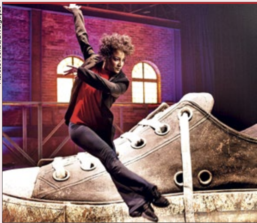
O tênis enlameado, imagem icônica de 1985, integra o cenário