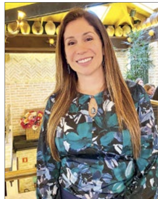
Desembargadora Eleonora Lacerda da EJUD do TRT - 9