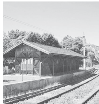
A bucólica Mendes