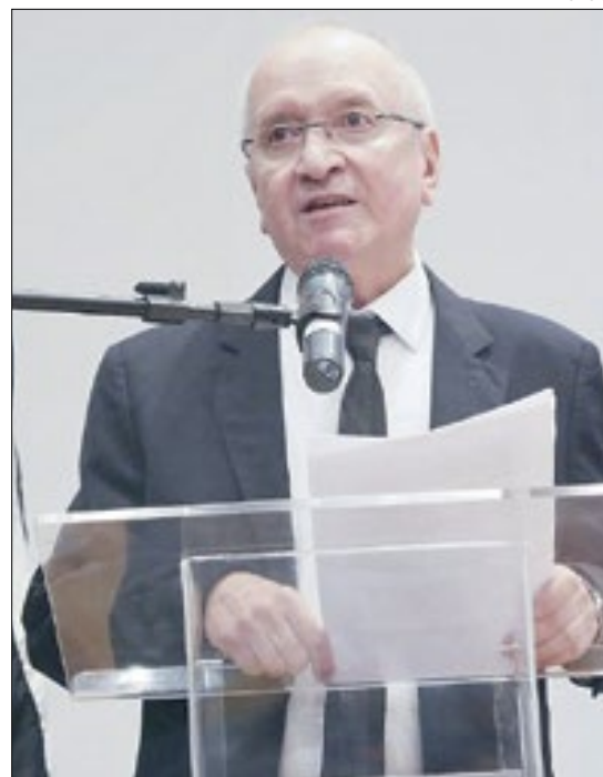
Desembargador Álvaro Alves Noga da EJUD do TRT - 2