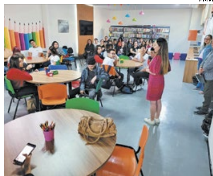
Interessados devem fazer a inscrição até dia 3 de abril

A remuneração prevista para os cargos será acrescida de auxílio-alimentação no valor de R$ 250; gratificação social no valor