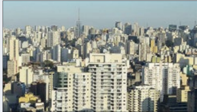
'Inflação de aluguel' exhibe queda menor este mês