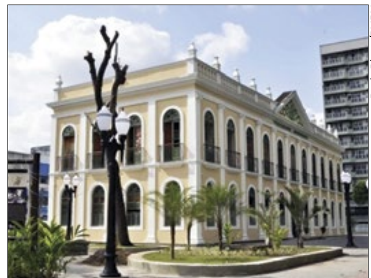
Palácio Barão de Guapi é um dos patrimônios de BM

possam colaborar com demandas, sugestões, entre outras informações relevantes para garantir um Plano de Aplicação democrático e justo. Barra Mansa se tornou grande referência nesse assunto nos últimos anos, possibilitando grande desenvolvimento nesses mecanismos. Tudo isso é fruto de um Conselho de Cultura atuante e liderado pela sociedade civil organizada – ressaltou Bravo.