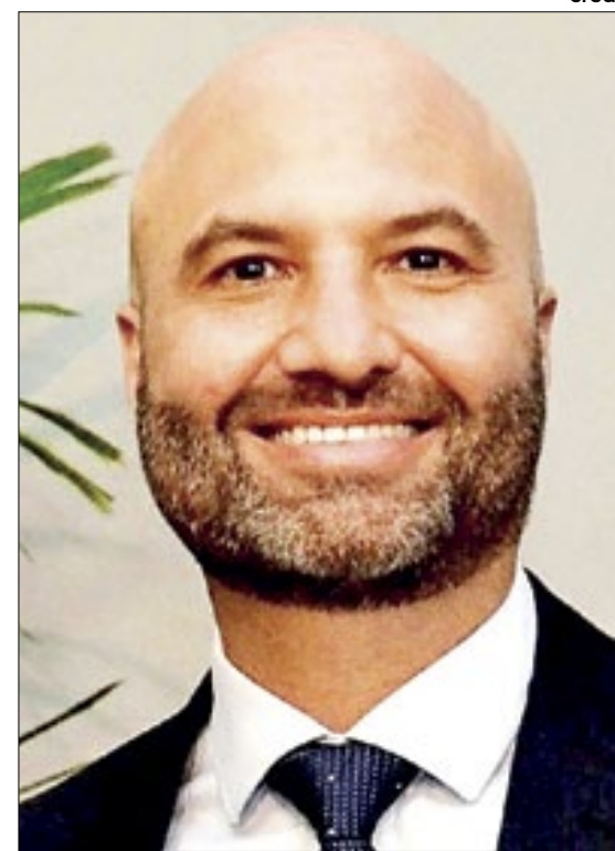
Desembargador Fabiano Holz Beserra - Diretor da EJUD - 4