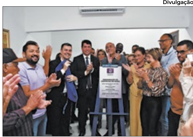
Centro apresentará atividades durante todo o dia