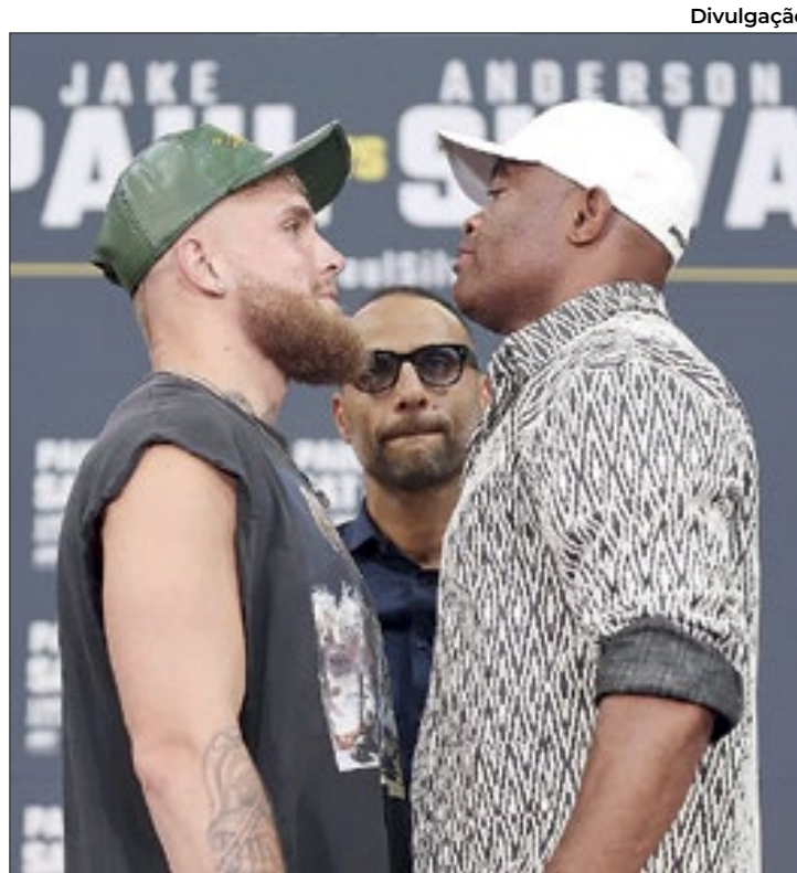
‘Spider’ foi derrotado por Jake Paul em luta em 2022

“Temos duas coisas completamente diferentes uma da outra. Uma é o boxe profissional de alto nível, os lutadores ranqueados que lutam pelas associações reconhecidas no mundo do boxe. Outra é o mundo do entretenimento, que é essa coisa de youtuber lutando com ex-lutadores”, disse.