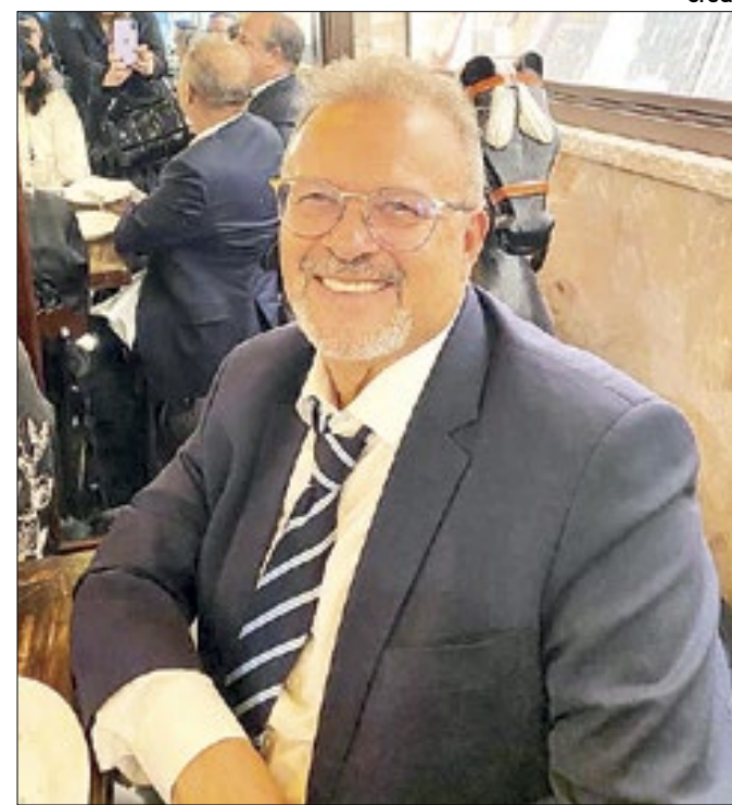
Desembargador e Diretor da EJUD-3, Emerson Lage

Foto de todos os desembargadores juntos, depois de dois dias de trocas de experiências e aprendizados, com propostas para melhorar as escolas judiciais de todos os 24 Tribunais Regionais do Trabalho