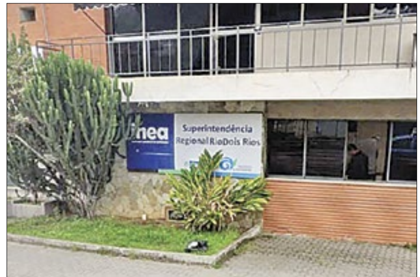
Reprodução Google Maps

O MPRJ chama atenção para o fato de que a empresa sequer era sediada em Nova Friburgo e obteve licenças no prazo de 24 horas. No caso de