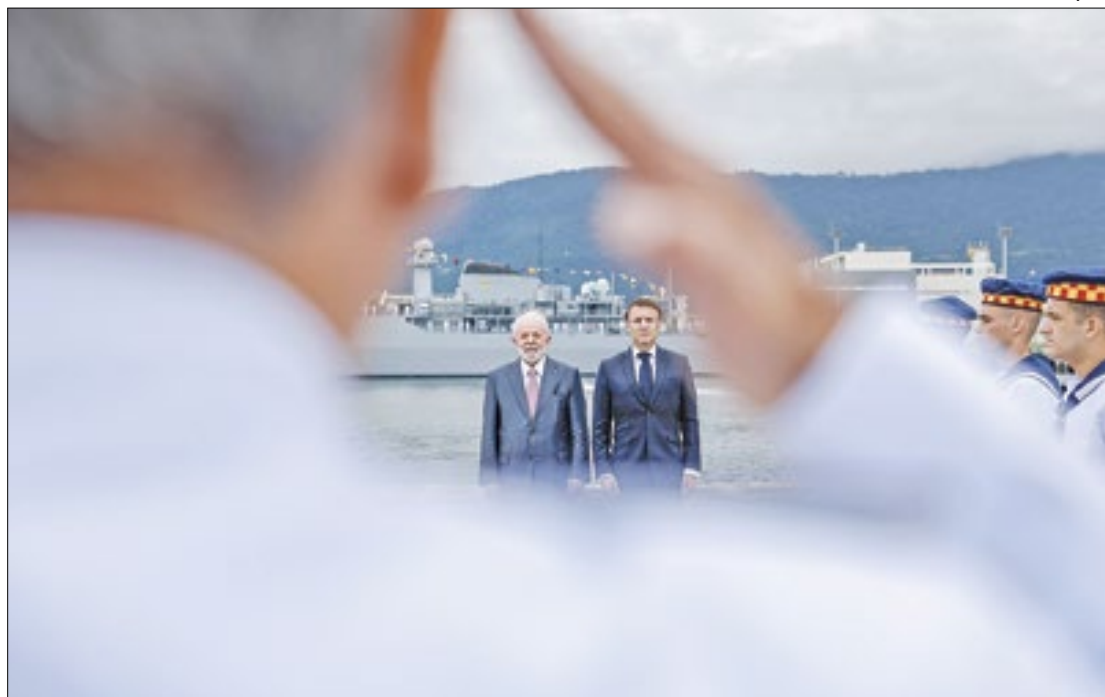
Lula e Macron no lançamento do submarino Tonelero, em Itaguaí

O presidente francês defendeu a parceria, ao citar que tanto o Brasil quanto a França são potências independentes.