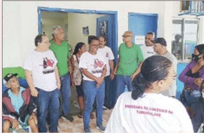
Os curados receberam certificados dos técnicos