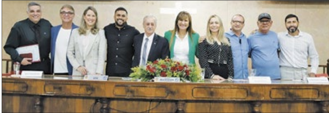
Evento homenageou personalidades e integrantes da Acadêmicos do Grande Rio