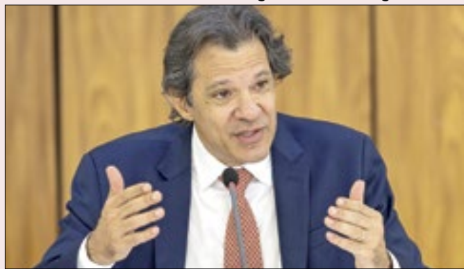
Equipe de Haddad formula os projetos da reforma