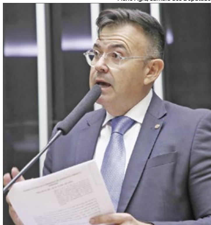
Ranieri aceitou emenda para garantir água nas escolas

Inicialmente, o projeto englobava apenas o programa Carro-Pipa, mas o relator destacou que há outros projetos nacionais para garantir não apenas o acesso à água para a população como também a segurança hídrica. Além disso, o parlamentar também aceitou a sugestão de garantir o garantir o fornecimento de água potável em escolas públicas no semiárido. O texto ainda prevê linhas de crédito para recompor pequenas produções rurais afetadas por processos de desertificação e seca.