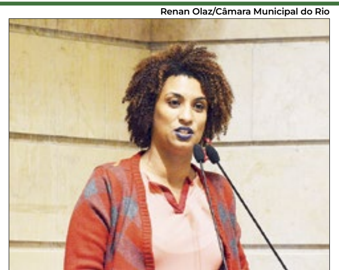
Vereadora teria sido alvo do espião