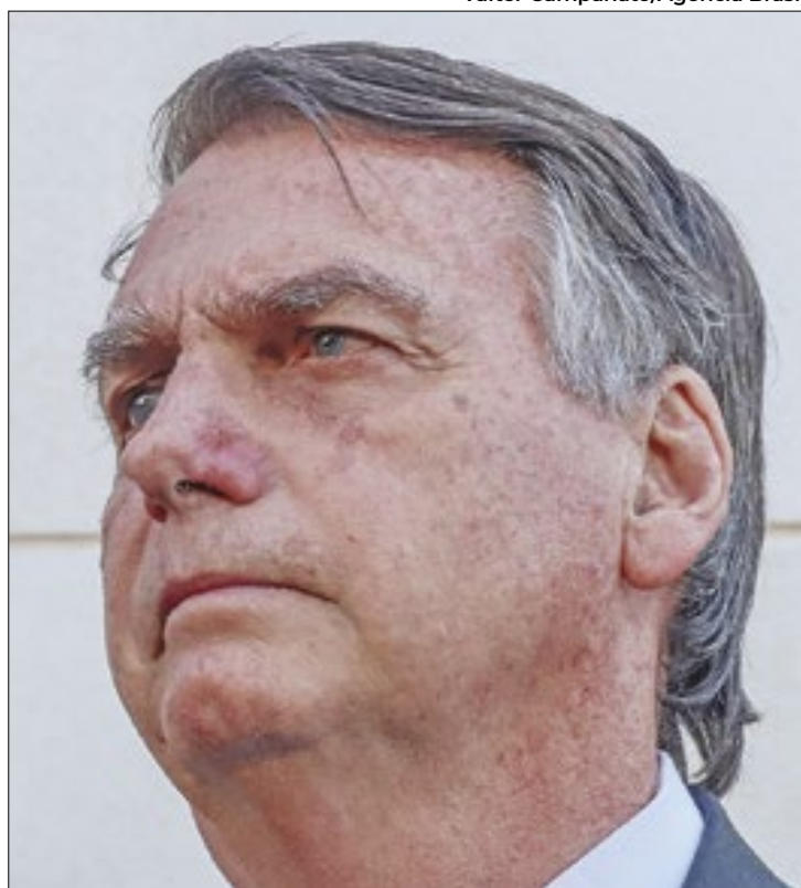
Segundo defesa, ideia da fuga não faria sentido

No ofício, os advogados dizem que Bolsonaro tem amizade com autoridades húngaras e foi para a embaixada tratar de temas políticos. “O ex-presidente mantém uma agenda de compromissos políticos, nacional e internacional que, a despeito de não mais ser detentor de mandato, continua extremamente ativa, inclusive em relação a lideranças estrangeiras alinhadas com o perfil conservador”.