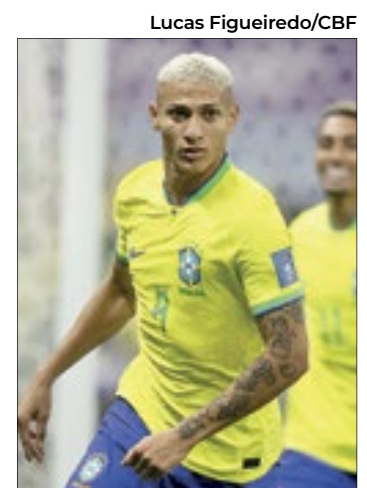
Richarlison pensou em desistir

“Acho que a psicóloga, querendo ou não, salvou, me salvou, salvou minha vida. Eu só pensava besteira. No Google mesmo eu só pesquisava besteira, só queria ver besteira de morte”, finalizou o atacante do Tottenham