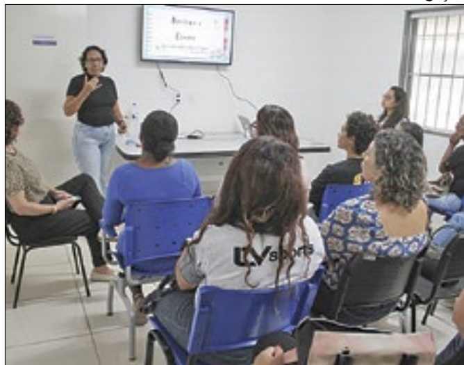
Palestra foi realizada no Centro de Orientação à Mulher