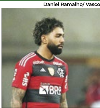
Torcida fala em ‘perseguição’

Questionado pelo ‘Ge’ sobre os casos Robinho e Dani Alves, Felipe Melo disse que ninguém é obrigado a ter uma opinião sobre. Porém, disse que os condenados devem pagar pelo que fizeram.