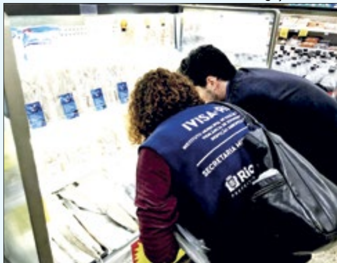
Agentes fiscalizam estabelecimento para a Páscoa