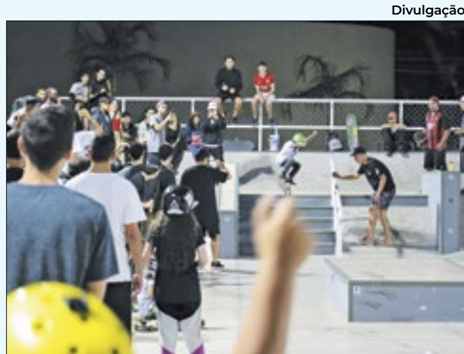
campeonato skate angra dos reis

meia noite, terá atração musical da banda Cabeça Quente e oferecerá barracas típicas para alimentação. O evento é realizado em alusão às comemorações de Páscoa.