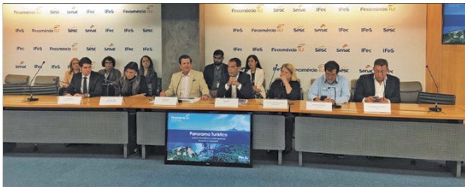
Impacto na economia do estado foi de R$ 2,35 bilhões, segundo o Instituto Fecomércio de Pesquisas e Análises

Os produtos pré-embalados, como ovos de chocolate, bombons e chocolates em geral, devem ser armazenados e expostos segundo orientação do fabricante. O ideal é que estejam em local fresco e arejado, sem umidade, longe de produtos de limpeza ou com intenso odor, e sem contato direto com a luz solar.