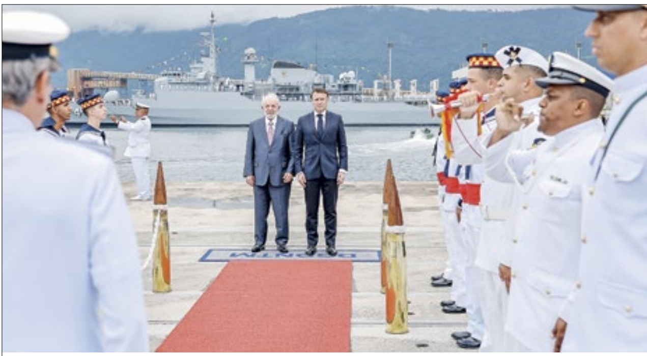
Lula (esquerda) e Emmanuel Macron, presidente da França (esquerda), na cerimônia de lançamento ao mar do submarino Tonelero, na Base de Submarinos da Ilha da Madeira, em Itaguaí, no Rio de Janeiro. O submarível é o terceiro dos cinco previstos no Programa de Desenvolvimento de Submarinos da Marinha. O presidente Lula destacou que "um país que quer proteger a soberania do seu povo, tem que se preocupar com seus espaço aéreo, marítimo e terrestre, além das riquezas naturais".