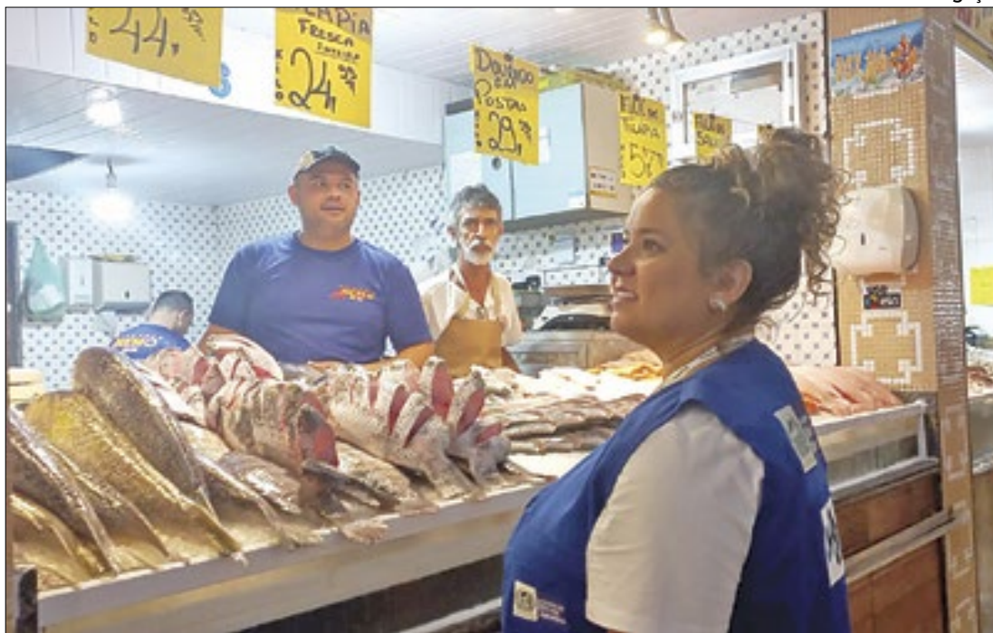
Estado do Rio é um dos maiores produtores de pescado marinho e estuarino do país

O Hospital Municipal Oceânico Dr. Gilson Cantarino, em Niterói, promoveu ação de conscientização no mês da mulher a respeito do diagnóstico precoce de endometriose. A musicoterapia também levou alegria a pacientes internados com músicos do Coral Cênico.