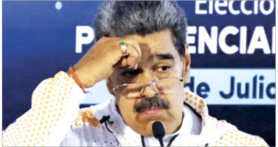
Opositores de Nicolás Maduro não puderam se candidatar

Também naquela segunda, Maduro, ao oficializar a candidatura que pode levá-lo a ficar 18 anos no poder, subiu num palco montado em frente ao CNE (Conselho Nacional Eleitoral) e afirmou que dois homens armados do partido opositor Vente Venezuela foram presos numa tentativa de assassiná-lo no comício.