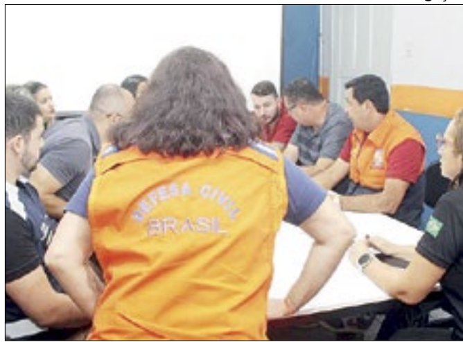
Equipe da SEDEC visitou o município de Magé