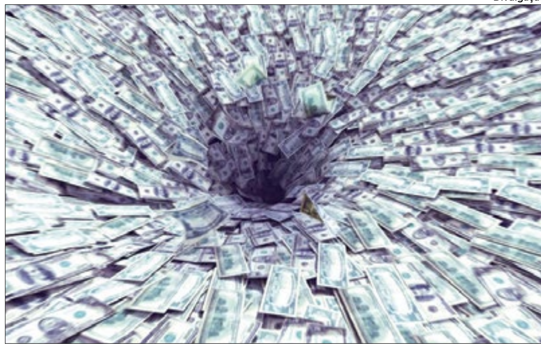
Segundo o Tesouro Nacional, resultado das contas públicas é o pior em 28 anos

Como resultante desse desempenho, o resultado primário