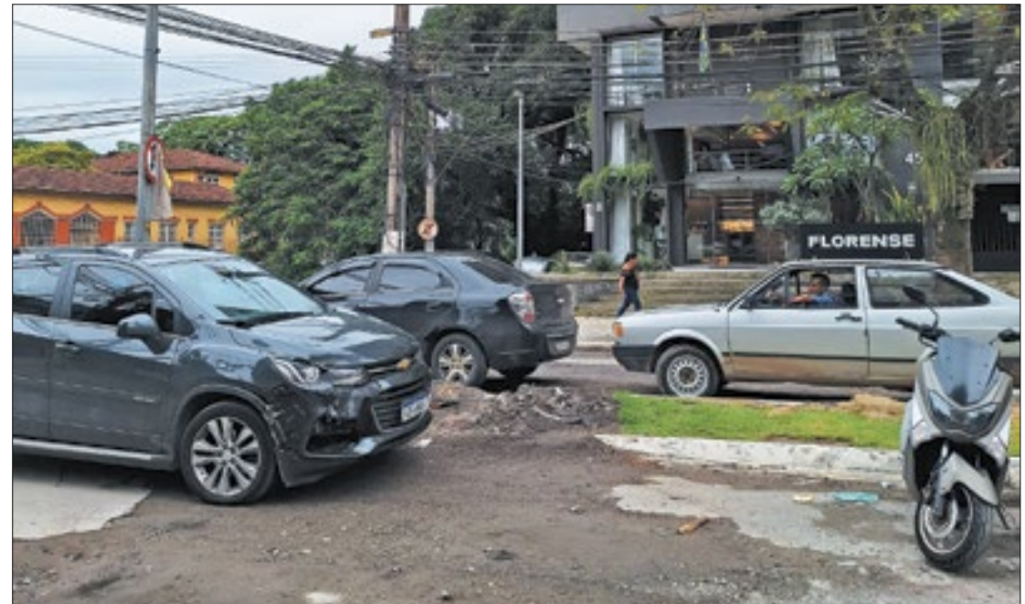
Trechos na via ainda apresentam asfalto deteriorado

A execução das reformas exigiu diversas paralisações e