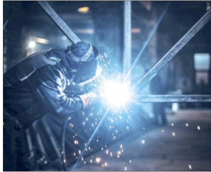
Gastos com salários e tributos contribuíram no avanço

Somente na passagem do terceiro para o quarto trimestre do ano passado (4T23/3T23), os custos tributários cresceram 10,3%, enquanto o custo de