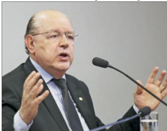
Hauly e sua eterna crença na reforma tributária