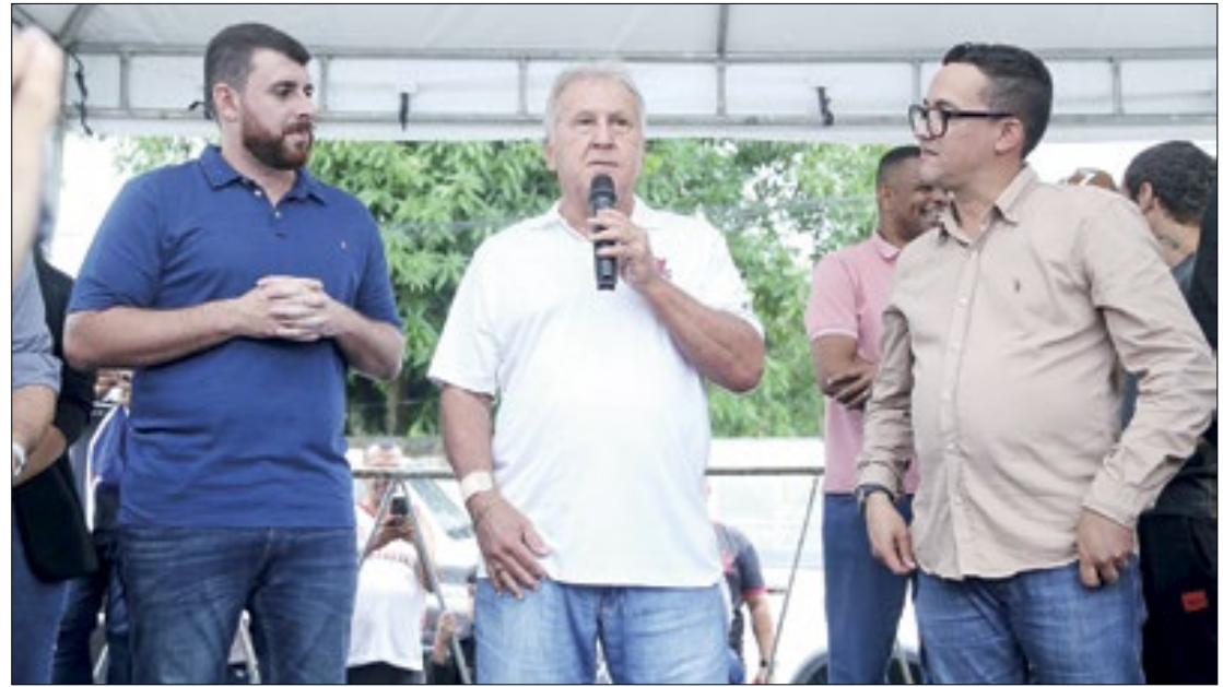
O prefeito de Magé, Renato Cozzolino, ladeado por Zico e pelo vereador Valdeck

O município de Magé recebeu uma visita ilustre na última terça-feira (26): Zico. O ex-jogador da Seleção Brasileira e maior ídolo do Flamengo esteve na cidade para inaugurar mais dois polos da Escola de Futebol Zico10 em parceria com a Prefeitura. O Pacobaíba Esporte Clube, no 5º distrito, e o Suruiense, no 4º distrito. Agora Magé conta com 4 polos que atendem mais de 1800 crianças com o projeto.