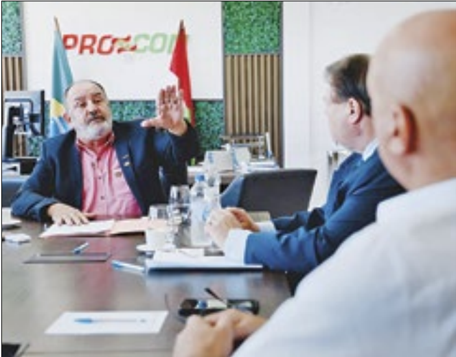
Água nos jogos da final do Catarinense