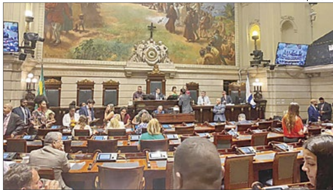
Câmara Municipal do Rio

Desde que foi implementada pela Lei nº 5.695, de 27 de março de 2014, a medida proporcionou um aumento do percentual de negros e índios no funcionalismo público municipal, nas faixas etárias compreendidas entre 18 a 38 anos, contribuindo para o combate às discriminações étnicas, raciais, religiosas e de gênero na cidade. A proposta ainda prevê que o Poder Executivo deverá promover o acompanhamento permanente dos resultados alcançados.