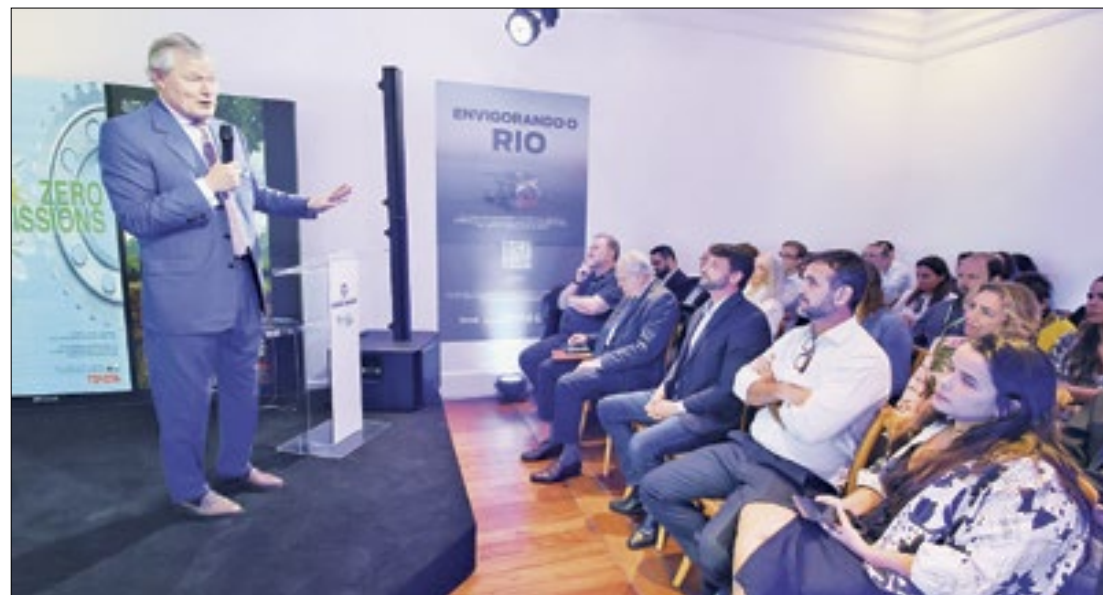
Gunter traça Rio de Janeiro como exemplo para economia competitiva