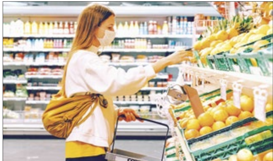
Alimentos tiveram alta de 0,91% na passagem mensal

Tendo o grupo Alimentação e Bebidas, mais uma vez, como o grande 'vilão' da carestia (alta de 0,91% e impacto de 0,19 ponto percentual sobre o índice geral), a chamada prévia da inflação (IPCA-15) avançou 0,36% em março, segundo os dados foram divulgados pelo IBGE nesta terça-feira (26). Em fevereiro, o indicador fechou em 0,78%. Em 12 meses, o índice tem alta de 4,14% e no ano, de 1,46%.