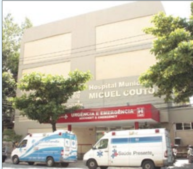
Hospitais, UPAs e emergências vão funcionar 24 horas