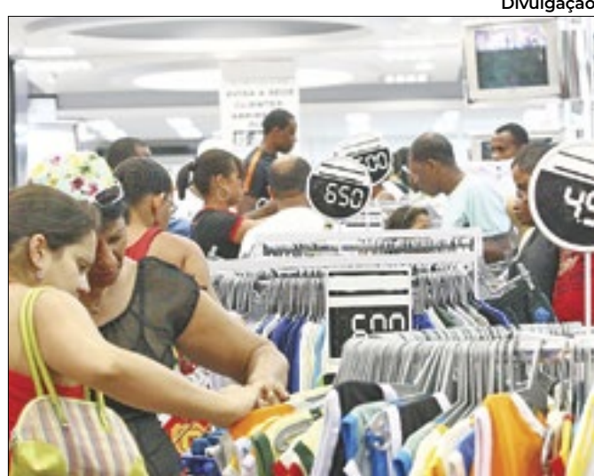
Icec atesta otimismo de comerciantes na economia