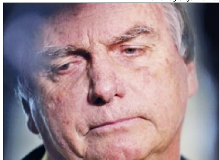
Ex-presidente da República nega que intenção era asilo

Por isso, o entendimento é que as autoridades não se apressem e aguardem até que haja elementos concretos para comprovar as acusações contra o ex-presidente, no inquérito que