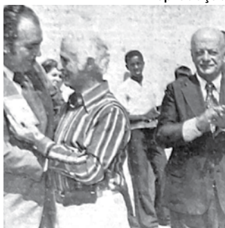
Solenidade reuniu autoridades