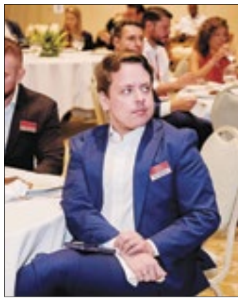
Prestigiando o evento, o subsecretário estadual de Comunicação do Rio, Igor Marques