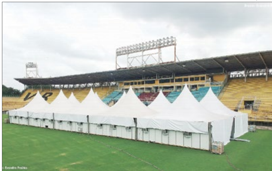
PF investiga contratações em Hospital de Campanha de Volta Redonda na pandemia

As investigações foram iniciadas em 2020, a partir de uma denúncia anônima que relatou irregularidades no processo de dispensa de licitações relativo à contratação de serviços para instalação de equipamentos no hospital de campanha monta-