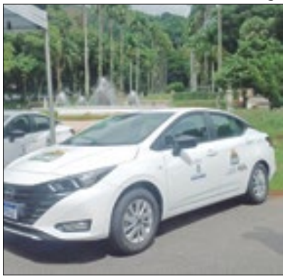
Agora são 17 carros à serviço

A Secretaria Municipal de Assistência Social de Nova Friburgo, recebeu do Governo do Estado um carro novo para reforçar o atendimento nos equipamentos da pasta. O veículo foi entregue pela Secretaria de Estado de Desenvolvimento Social e Direitos Humanos e foi adquirido através de recursos provenientes de uma emenda parlamentar do deputado federal Hugo Leal, no valor de R$ 9.658.500,00. Foram adquiridos 94 veículos distribuídos entre os municípios.