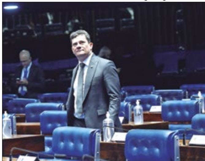
Moro: os Brazão já eram conhecidos em 2019