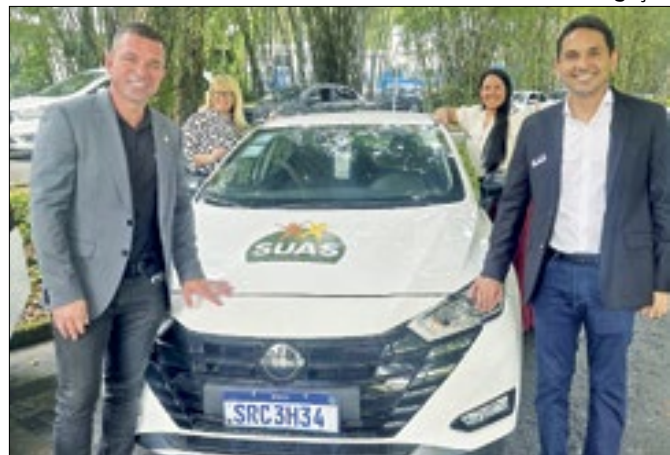
Autoridades nilopolitanas receberam o novo veículo