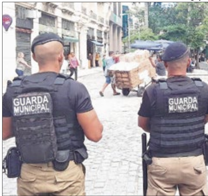
Guarda fará o patrulhamento para ordenar o local