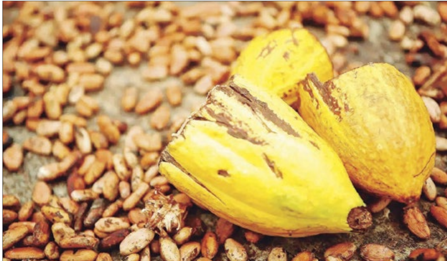
Regiões Norte e Nordeste do país são as que mais se destacam na produção da matéria prima

Diante desse histórico de excelência, o MTur não poderia deixar de dar destaque a roteiros para os viajantes que desejem unir gastronomia e história no país. Confira as dicas.