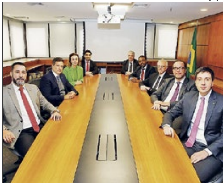
Cautela passou a ser a 'palavra de ordem' do colegiado