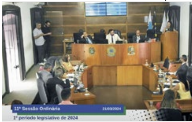
Secretária participa de sessão da Câmara de Angra