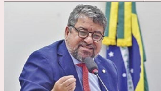
Deputado diz que não há organização da base