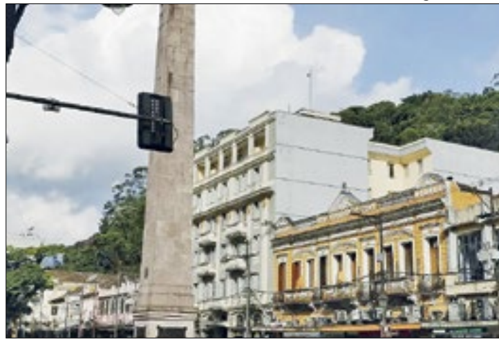
Defesa Civil evacuou Rua do Imperador no início da chuva

O transbordamento do rio Quitandinha fez com que entrasse água em algumas lojas, mas comerciantes relataram que os alertas feitos dias antes das chuvas, ajudaram a prevenir a perda