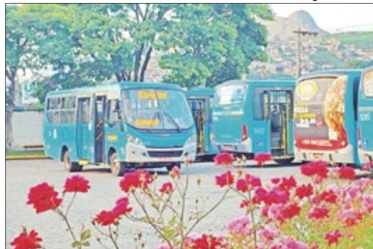
Mudança foi adiada para a próxima segunda-feira (1)

o tempo necessário para a conclusão das obras e a reabertura da via estão diretamente relacionados ao progresso dos serviços realizados pela empresa responsável pela execução. Assim, os passageiros devem estar cientes de que as datas mencionadas estão sujeitas a alterações conforme o avanço dos trabalhos. E em caso de qualquer mudança no cronograma das obras e itinerários, é válido consultar os canais