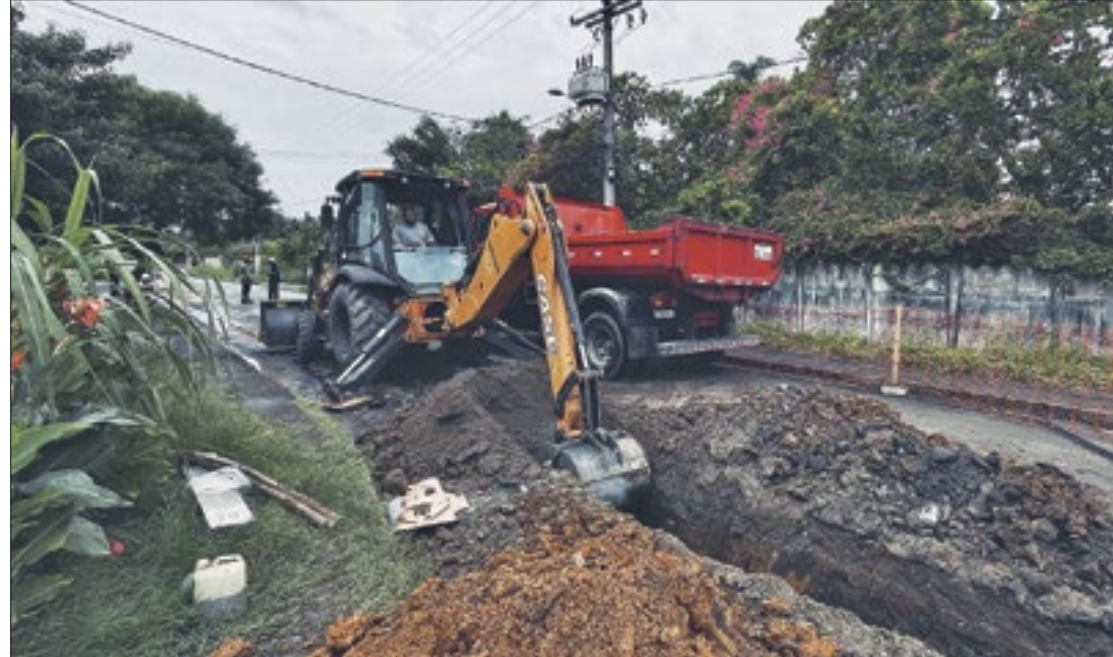
Trabalho foi iniciado na Rua Maria Isabel, no bairro Cosme e Damião