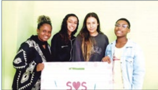
COMAC realiza atividades pela mobilização