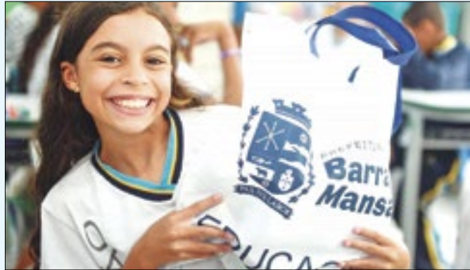
Ações aconteceram em duas escolas municipais