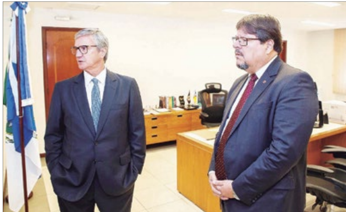
Reunião entre o procurador-geral de Justiça, Luciano Mattos (d) e o presidente do TRE-RJ, desembargador Henrique Figueira (e), foi realizada nesta terça-feira

Luciano Mattos ressaltou que o intuito da reunião foi ali-