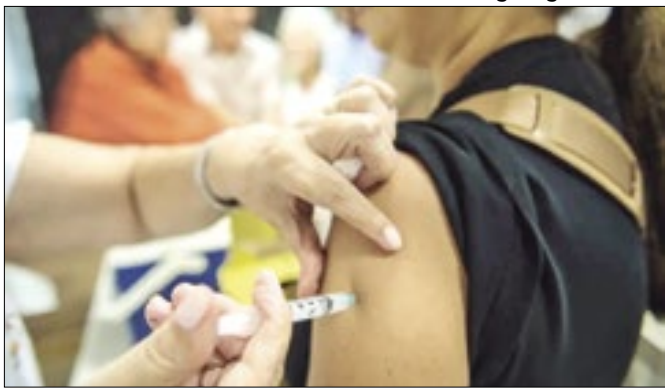
Vacina utilizada é trivalente, eficaz para a proteção