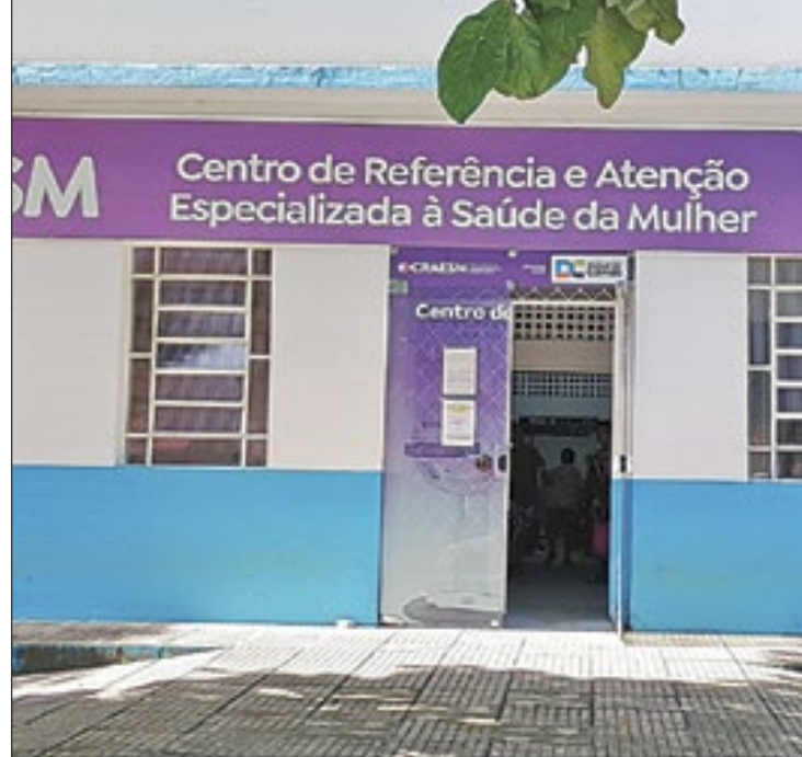
Unidade é referência no atendimento à mulher no município

O CRAESM foi a primeira unidade da rede municipal de saúde a receber um aparelho de mamografia digital. O equipamento, instalado em março de