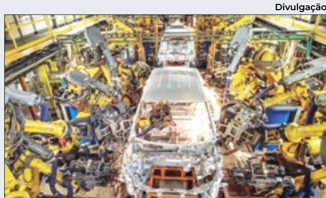
Executivo divulga regulamentação de novo programa

Outra informação relevante do indicador é a alta, em março, dos três grupos de varejistas, como comerciantes de bens essenciais (3,4%) – que incluem supermercados e farmácias – semiduráveis (1,3%) – que engloba vestuário, tecidos e calçados – e bens duráveis (1,1%).