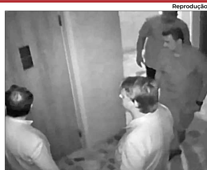
Ex-presidente na Embaixada da Hungria