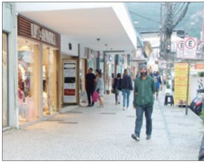
Rua Teresa pode funcionar na sexta-feira da Paixão