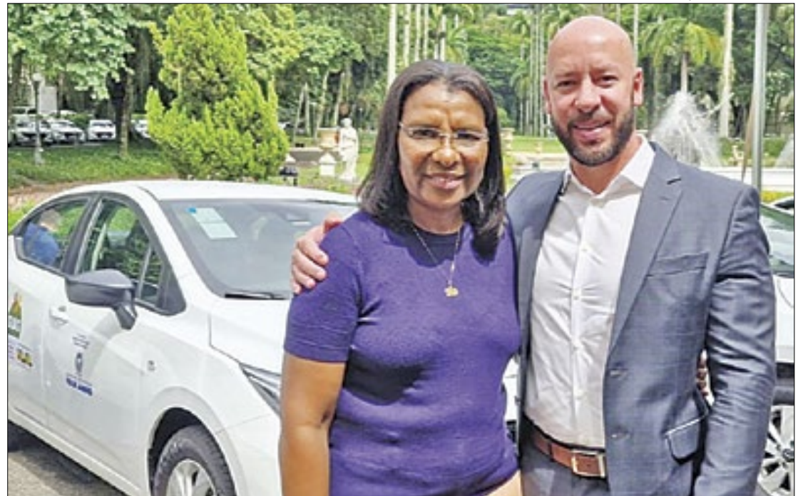
Cerimônia de entrega das novas viaturas para Assistência Social dos municípios

Assim como os outros municípios, Teresópolis recebeu um Nissan Versa 2024. Os veículos serão usados pelas secretarias municipais para serviços administrativos e para atuação na Proteção social Básica e Especial, e têm como objetivo melhorar a lo-