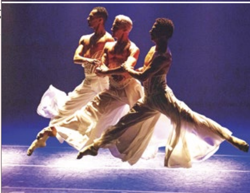
'Sem Você' tem a coreografia assinada por Éric Frédéric