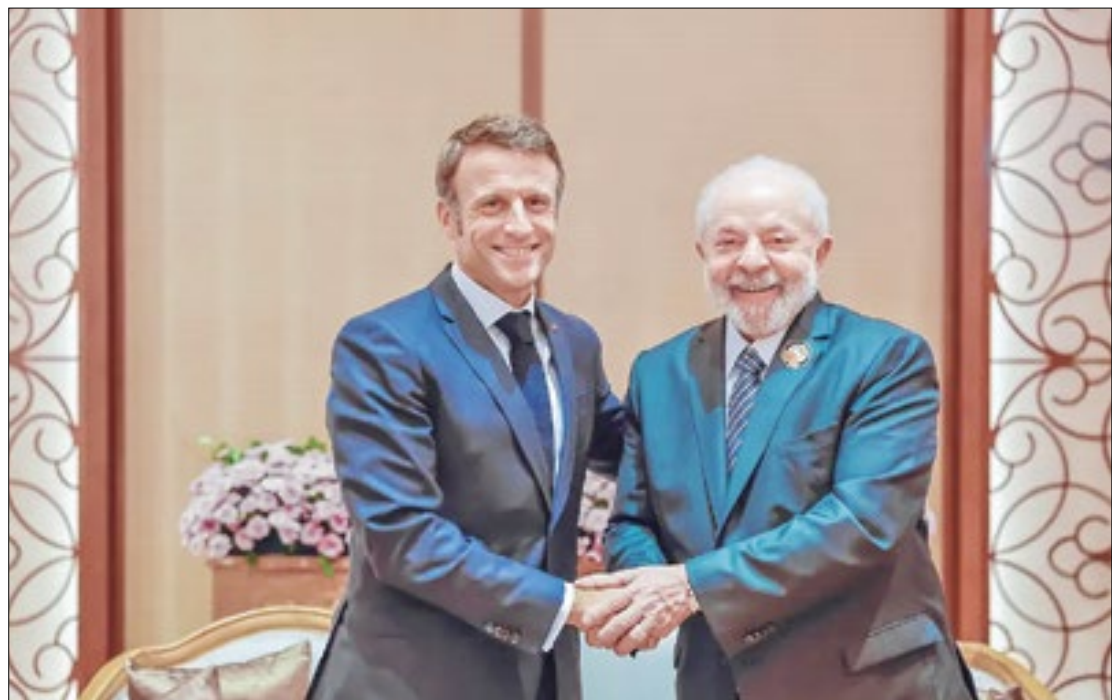
Presidente Lula recebeu Macron para uma reunião bilateral em Belém

Na terça-feira (26), Macron encontrou o presidente Luiz Inácio Lula da Silva durante a tarde para uma reunião bilateral. Posteriormente, os líderes visitaram uma fábrica de chocolate na comunidade ribeirinha da Ilha do Combu (PA). O intuito da programação é acompanhar a produção artesanal e sustentável do cacau em região de floresta. Na mesma ilha, eles também encontraram representantes dos povos indígenas e participaram de uma cerimônia para condecorar o líder indígena Raoni. A visita ao Pará contempla as pautas relacionadas à 30ª Conferência das Nações Unidas sobre as Mudanças Cli-