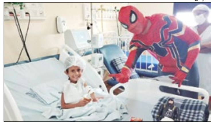
Ação buscou entreter e acolher crianças internadas