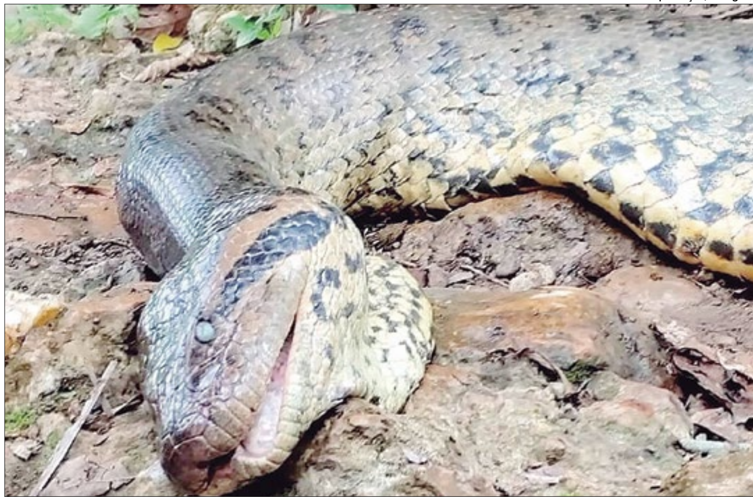
A cobra de grande porte era considerada por biólogos um símbolo da espécie na região

“As sucurelis verdes, mais especificamente, as fêmeas são predadoras de topo de cadeia alimentar. Ou seja, podem controlar as populações de suas presas e ter uma grande influência ao longo de toda a teia alimentar onde elas estão