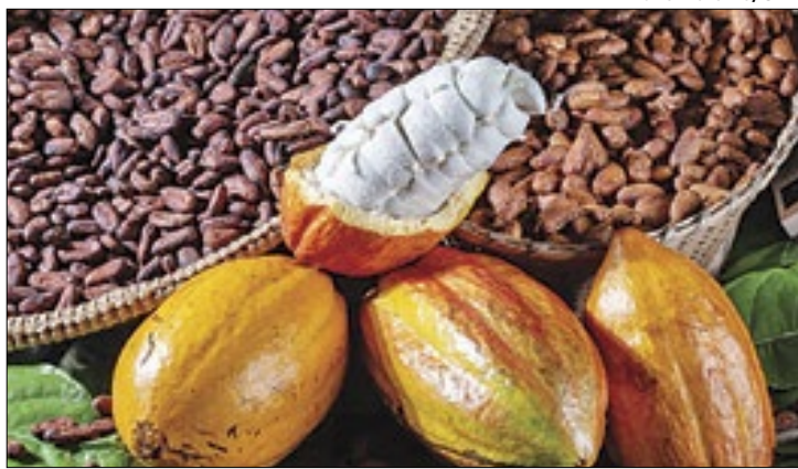
Estado investe no desenvolvimento sustentável do cacau