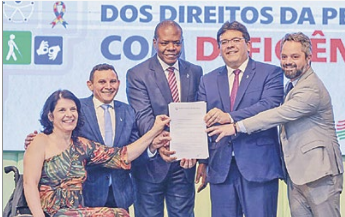
Piauí tem previsão de receber R$ 64 milhões para implementar o programa federal

O ministro Silvío Almeida destacou a importância do Piauí como um estado propício para o desenvolvimento e execução de políticas públicas, justificando a escolha da capital