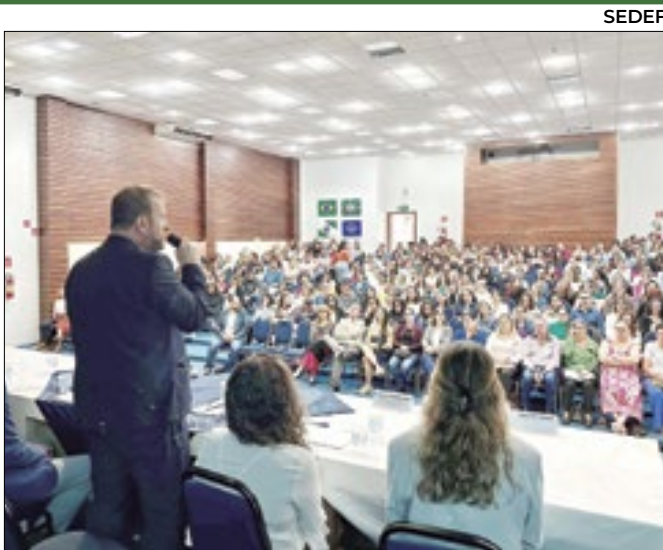
Técnicos recebem formação sobre recursos da área