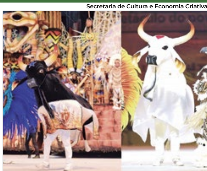
Bumbás revezam ensaios no Sambódromo de Manaus