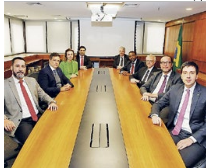
Cautela passou a ser a ‘palavra de ordem’ do colegiado