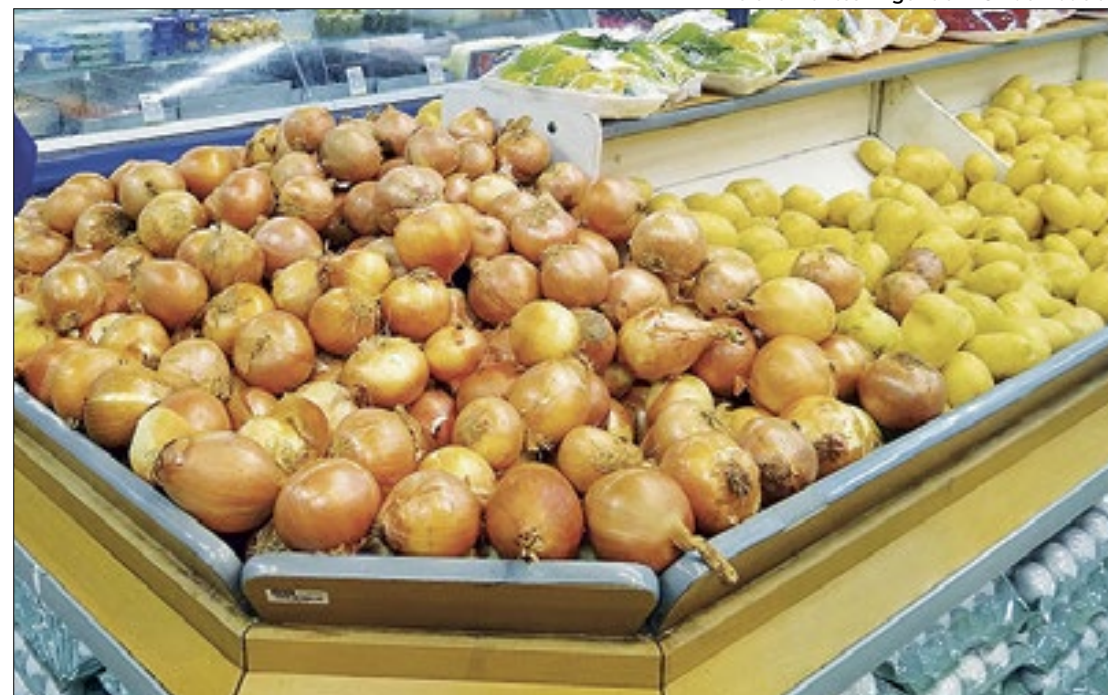
Campeoníssima da carestia do grupo Alimentação, cebola subiu exatos 16,64%

Entre os cinco dos nove grupos de produtos e serviços pesquisados com avanço neste mês, também subiram: Transportes