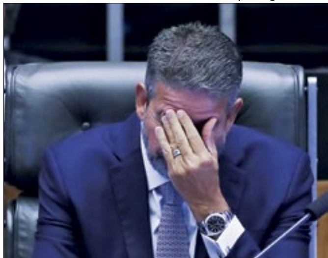
Lira resolveu que nada decidira sozinho sobre Brazão