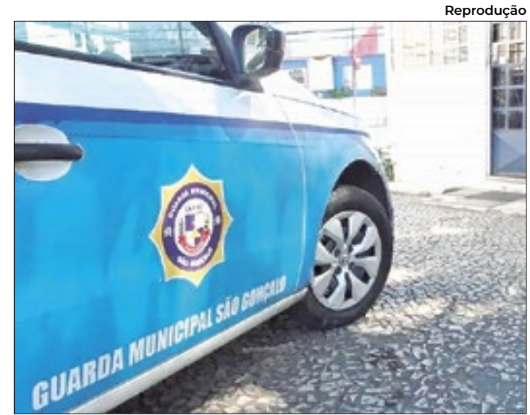
Corporação fecha primeiro bimestre com aumento de prisões

A medida tem por base o Decreto Municipal nº 66/2024, que criou o gabinete Municipal de Gerenciamento de Crises, para a adoção de medidas, visando a avaliação e o enfrentamento de possíveis desastres causados pelas chuvas.