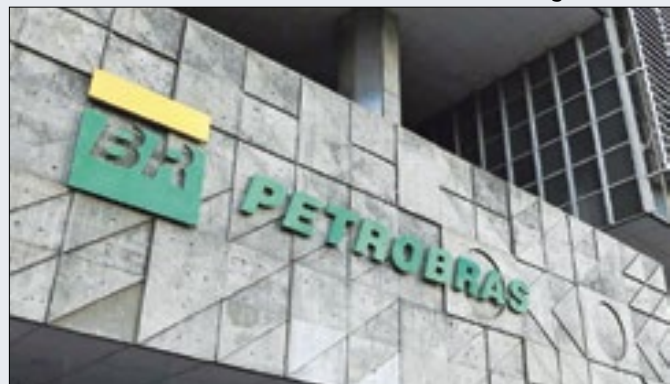
Empresa quer explorar perto da foz do rio Amazonas