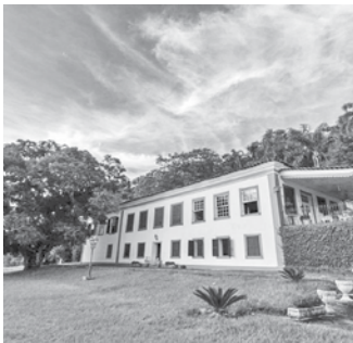
Fazenda já recebeu visitantes ilustres