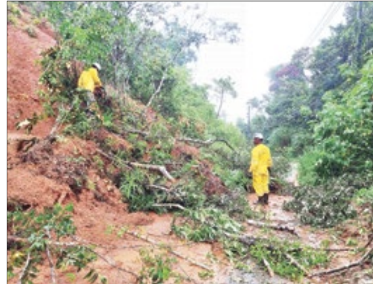
128 guarda-parques atuam na diminuição dos danos

Com especial atenção à Região Serrana, as equipes das unidades de conservação estiveram à disposição para colaborar com os trabalhos da Defesa Civil e do Corpo de Bombeiros. Em Teresópolis, guarda-parques do Parque