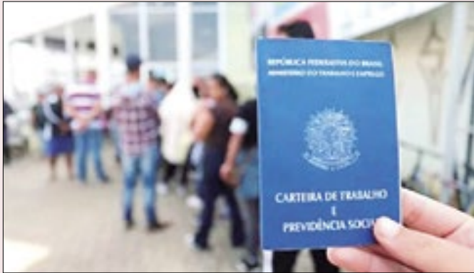
Há diferentes oportunidades em várias regiões do estado