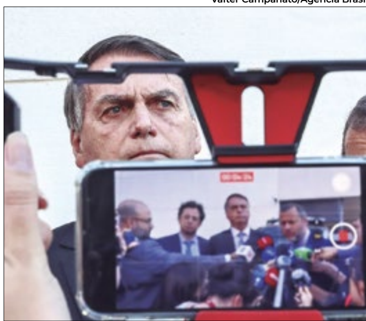
Bolsonaro passou dois dias na embaixada da Hungria

As imagens mostram Bolsonaro acompanhado de dois seguranças, do embaixador da Hungria no Brasil, Miklós Halmay, e de outros membros da equipe diplomática. Logo no primeiro dia de estadia do ex-presidente, funcionários da representação diplomática aparecem carregando roupas de cama, água e outros itens para a área residencial da embaixada. No dia seguinte, Bolsonaro aparece nas imagens passeando pelo estacionamento do local com um de seus seguranças.