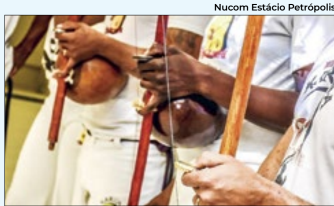
Nucum Estácio Petrópolis

trazendo à tona as lembranças. Por tudo isso, decidiram adiar a entrega dos prêmios aos artistas e colaboradores do cenário acadêmico da cidade. Representantes da academia ressaltaram que se mantivessem o evento seriam criticados por festejar em meio ao cenário atual que se encontra a cidade.