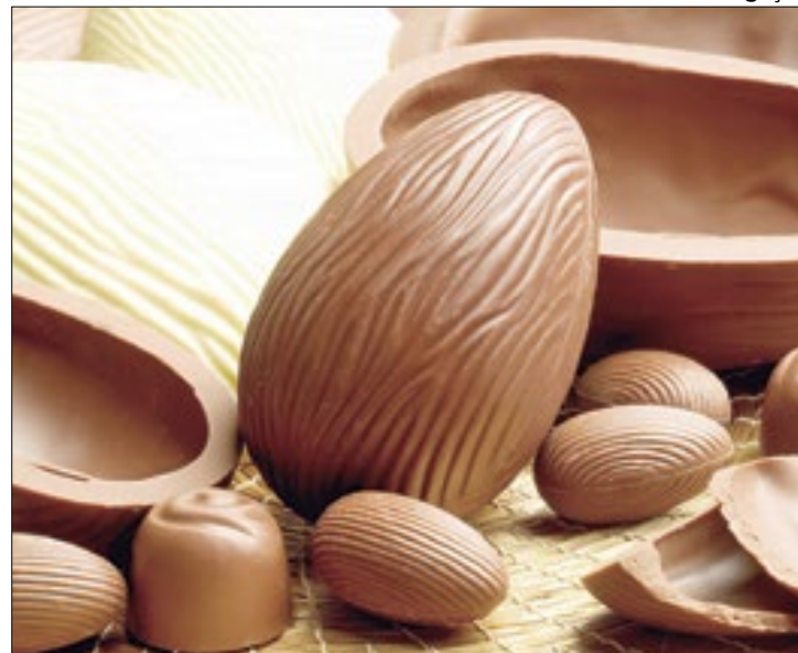
Cotação do cacau impacta o preço de itens de chocolate

Para deleite de associações de classe e fabricantes do setor, a Associação Brasileira de Supermercados (Abrás) estima que, em 2024, o consumo das famílias deve crescer de 13% a 15% neste período pascal. Para a Associação Brasileira da Indústria de Chocolates, Amendoim e Balas (Abicab), a projeção é de um crescimento de 17% na produção de ovos de Páscoa, no comparativo anual, montante de 58 milhões de unidades que estarão disponíveis nas prateleiras de estabelecimentos e lojas virtuais do país.