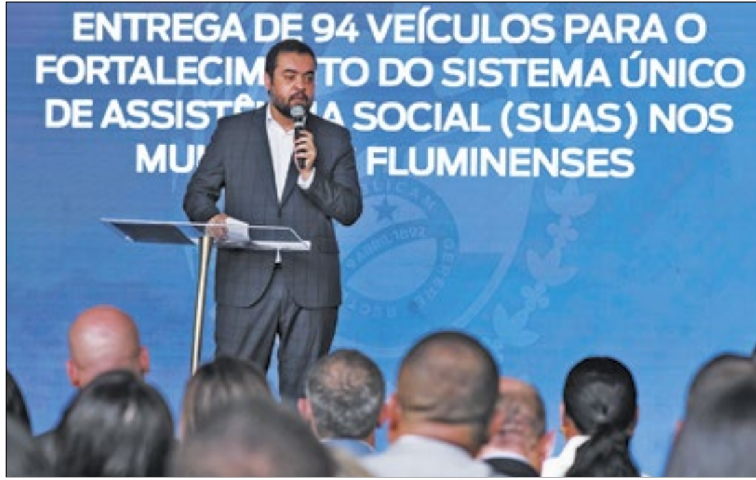
Governador Cláudio Castro durante entrega da frota para as secretarias municipais

O Centro Estadual de Monitoramento e Alerta de Desastres Naturais (CEMADEN-RJ) está acompanhando as condições meteorológicas e os níveis pluviométricos em todo o território fluminense, enviando alertas para os municípios quando necessário.