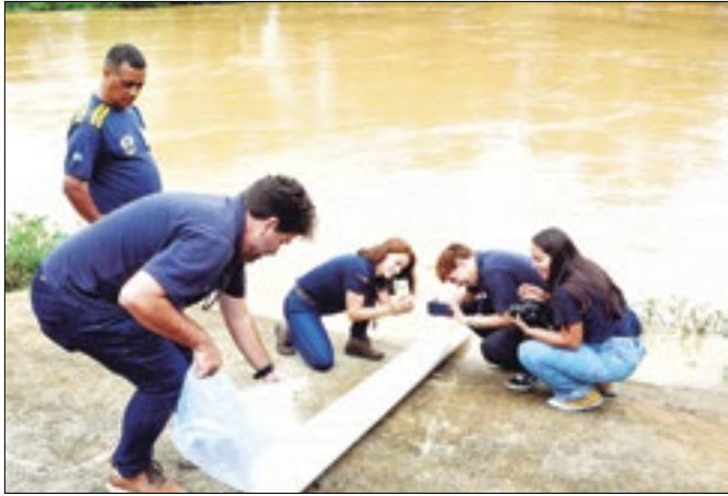
Atividade é uma das ações educativas