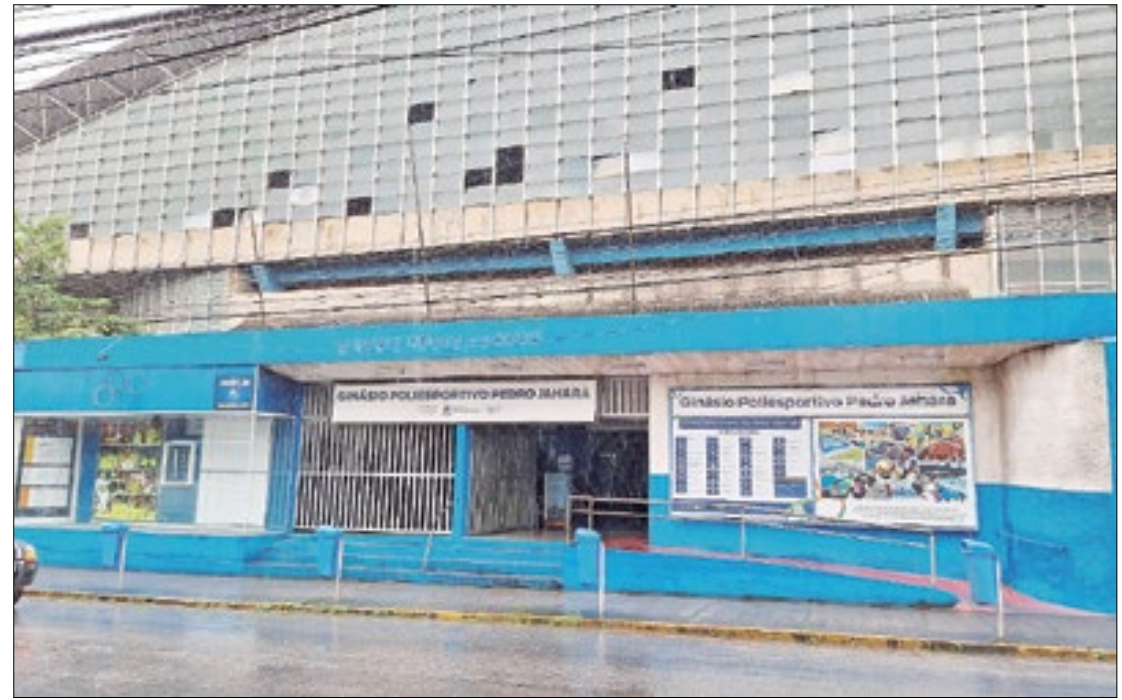
Ginásio Poliesportivo Pedro Rage Jahara em Teresópolis foi disponibilizado

A importância dessas doações vai além do simples fornecimento de alimentos e produtos básicos. Em momentos de crise, gestos como esses repre-