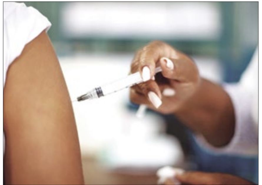
Campanha segue até dia 31 de maio