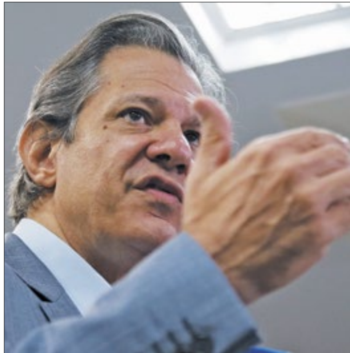
Haddad tentará agilizar regulamentação da tributária

Parlamentares acreditam que como os projetos estão demorando a chegar nas casas Legislativas, pautas da agenda poderiam impedir a análise do texto nesse primeiro semestre. Já no segundo semestre, os congressistas devem se voltar para as eleições