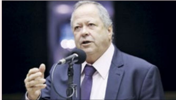
União expulsou Brazão ainda no domingo