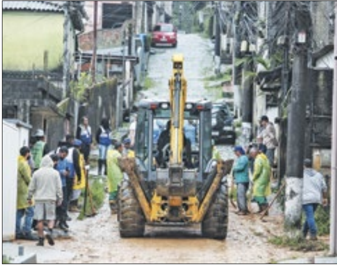
Maquinário e funcionários do INEA em Petrópolis