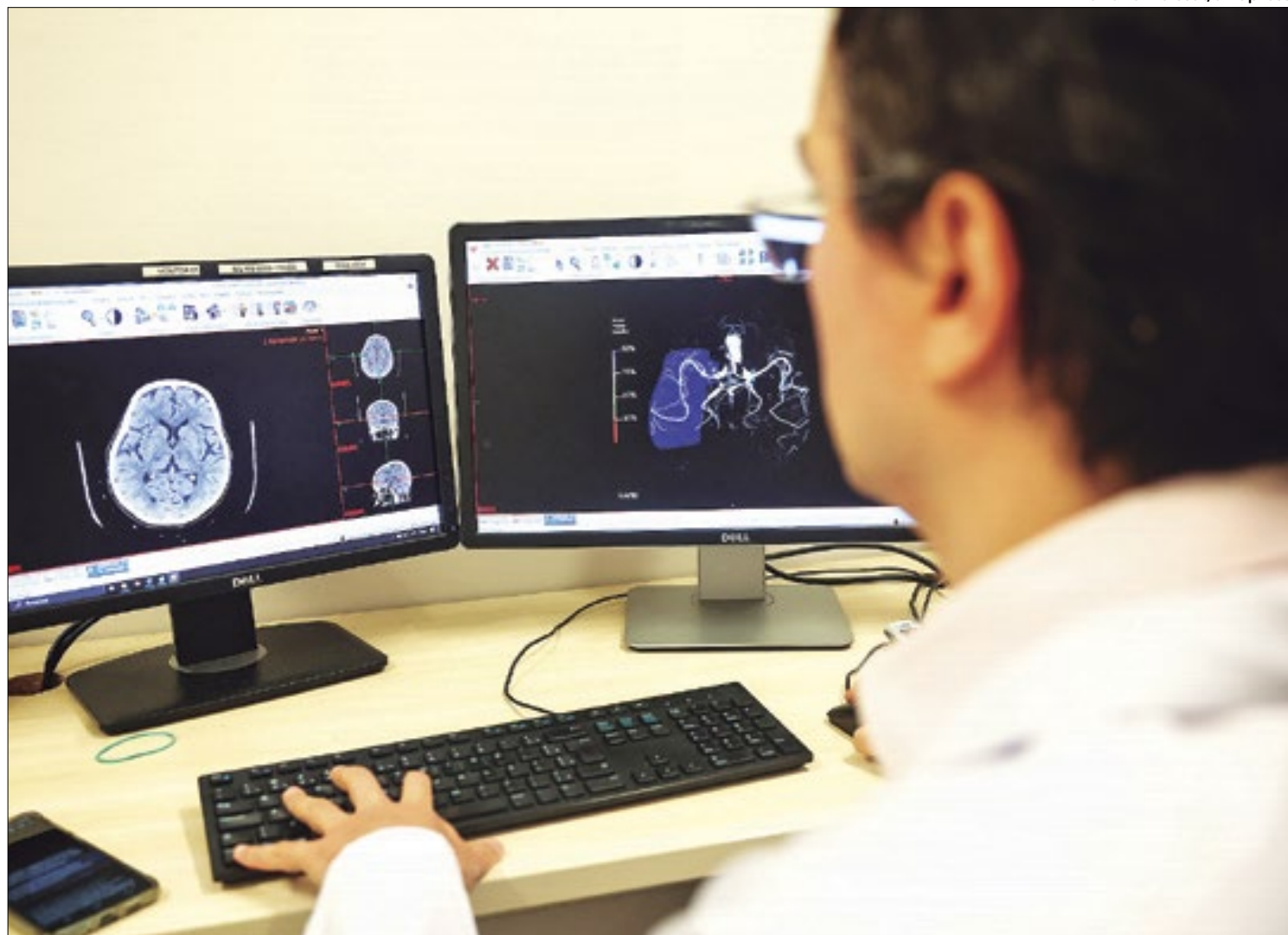
IA é utilizada na identificação da área afetada por um AVC (Acidente Vascular Cerebral)

Queiroz entende que, apesar dos avanços, a IA nunca vai substituir o médico. “Os algoritmos vão ficar tão especializados que determinadas funções eles poderão fazer sozinhos, mas isso não vai substituir o médico. Ele será deslocado para outras funções, como, por exemplo, estar escutando mais o paciente, ganhando tempo para estar mais junto ao