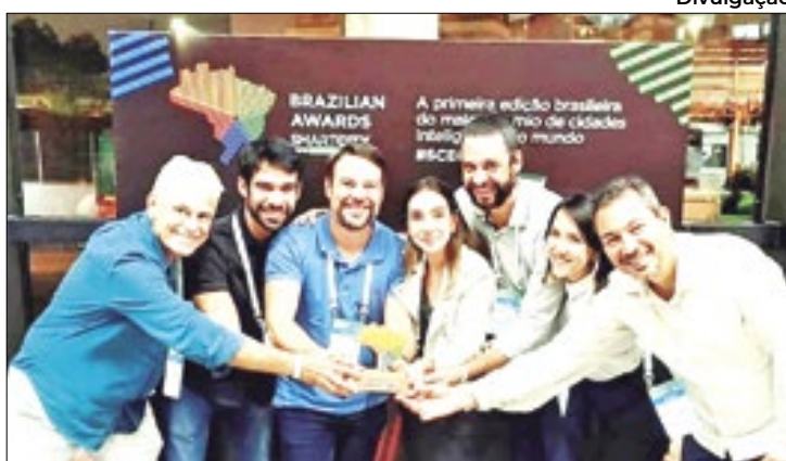
Projeto "Eita!Recife" é destaque em inovação tecnológica