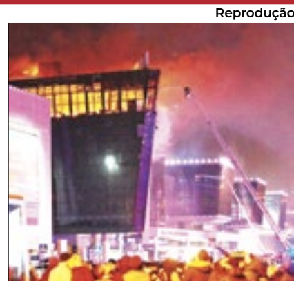
Atentado na Rússia matou 137

Após o presidente Vladimir Putin ter sugerido que a Ucrânia estava envolvida no ataque terrorista que matou 137 pessoas em Moscou na última sexta-feira (22), o Kremlin mudou o discurso nesta