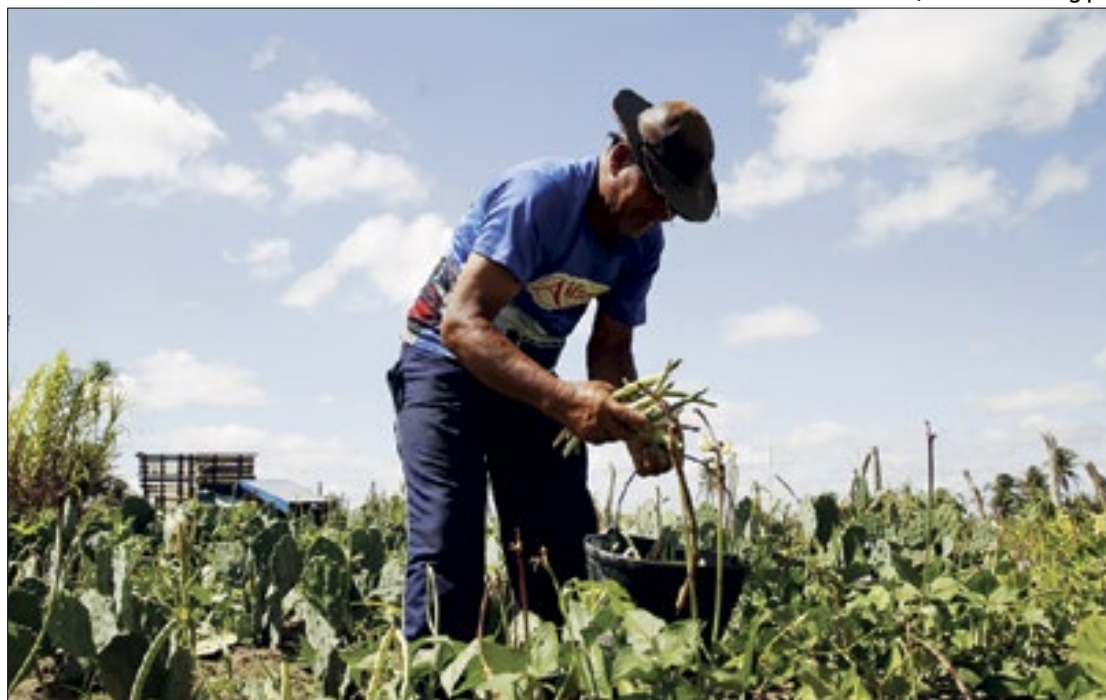
Plantio de palma consorciado com feijão se tornou uma nova alternativa no sul do estado