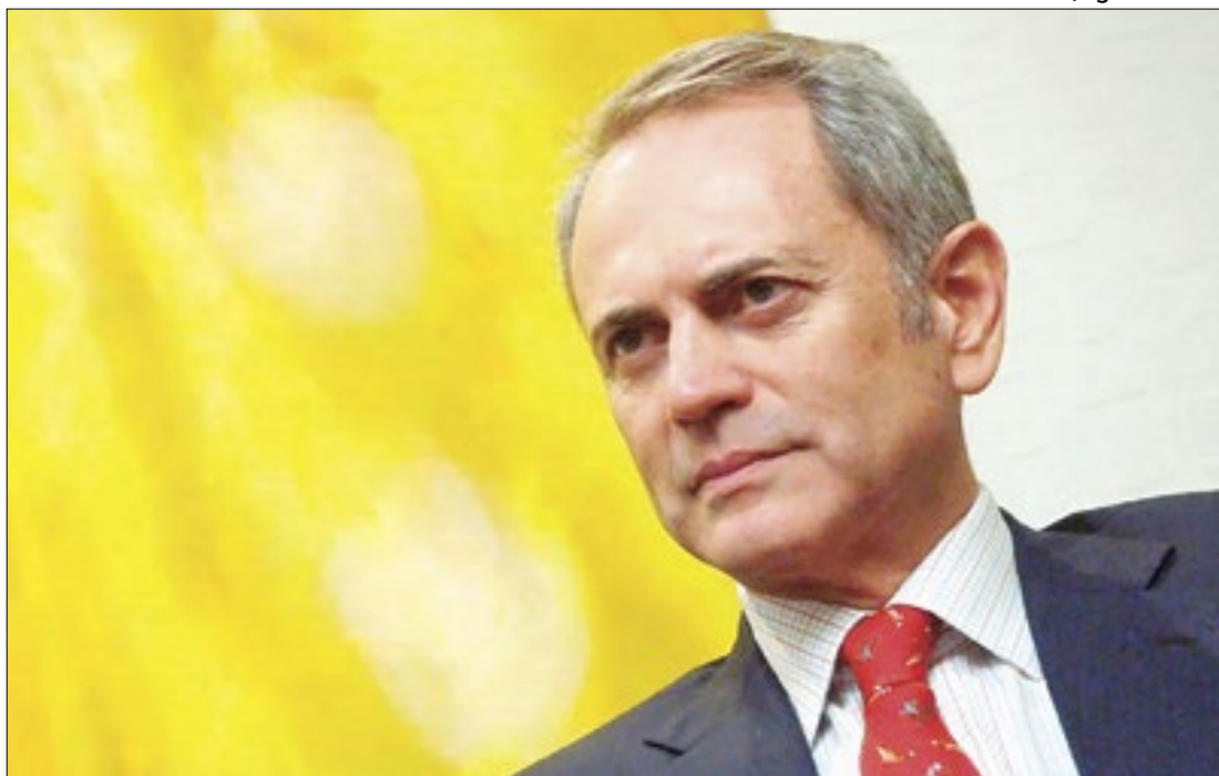
Foram cumpridos mandados de busca e apreensão em endereços do empresário

O Ministério Público do Distrito Federal e Territórios (MPDFT) realizou uma operação, na segunda-feira (25), para investigar um suposto crime de dispensa indevida de licitação que teria beneficiado a empresa Paulo Octávio. O contrato objeto das investigações foi firmado entre a entidade e a Secretaria de Saúde (SES-DF). Conforme o documento, ficou determinado o aluguel de R$ 750 mil para ocupar um prédio do grupo empresarial. O edifício fica localizado no Setor de Rádio Norte (701 Norte).