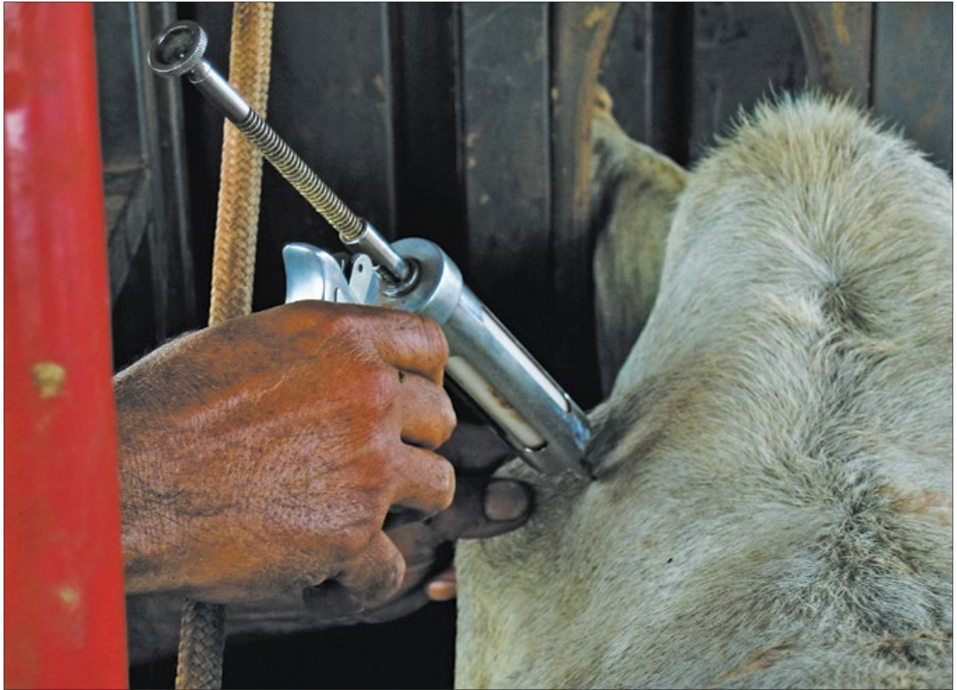
A normativa ainda proíbe o armazenamento, a comercialização e o uso de vacina

Para realizar a transição de status sanitário, os Estados e o Distrito Federal atenderam aos critérios definidos no Plano Estratégico, que está alinhado