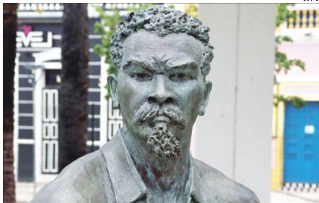
Chico da Matilde, conhecido como Dragão do Mar, se opôs à escravidão no Ceará

A Prefeitura de Natal investirá R$7,5 milhões no Programa Djalma Maranhão, utilizando os recursos da renúncia fiscal da arrecadação do Imposto Predial e Territorial Urbano (IPTU) e do Imposto Sobre Serviços (ISS) para apoiar projetos culturais. O programa viabiliza áreas artísticas.