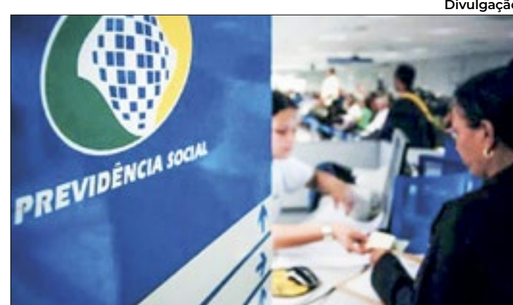
O STF marcou para 3 de abril o julgamento