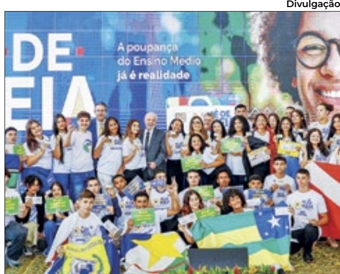
O programa federal vai pagar bolsas