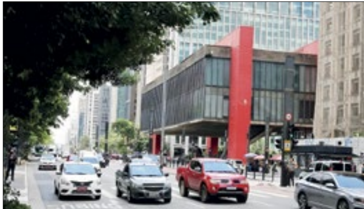
Porém, estado teve aumento de latrocínios e furtos no mês