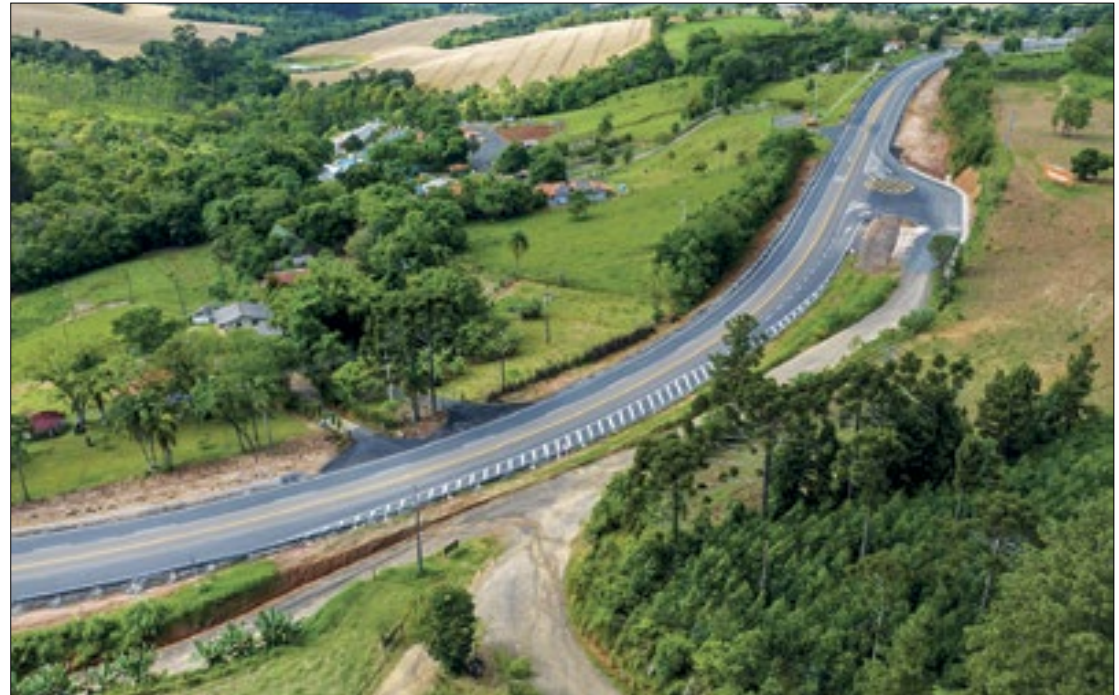
Campos Gerais, Centro e Centro-Sul tem investimento bilionário em rodovias

A SRCGerais tem sede em Ponta Grossa, e conta com três escritórios regionais: Cerne em Piraí do Sul, Centro-Oeste em Guarapuava, e Centro-Sul em Irati. Ao todo, a superintendência é responsável por administrar diretamente um orçamento de mais de R$ 780 milhões, além de obras em um montante de R$ 450 milhões por meio de parceria com a Klabin S.A. As obras em andamento incluem a pavimentação da PR-160 entre