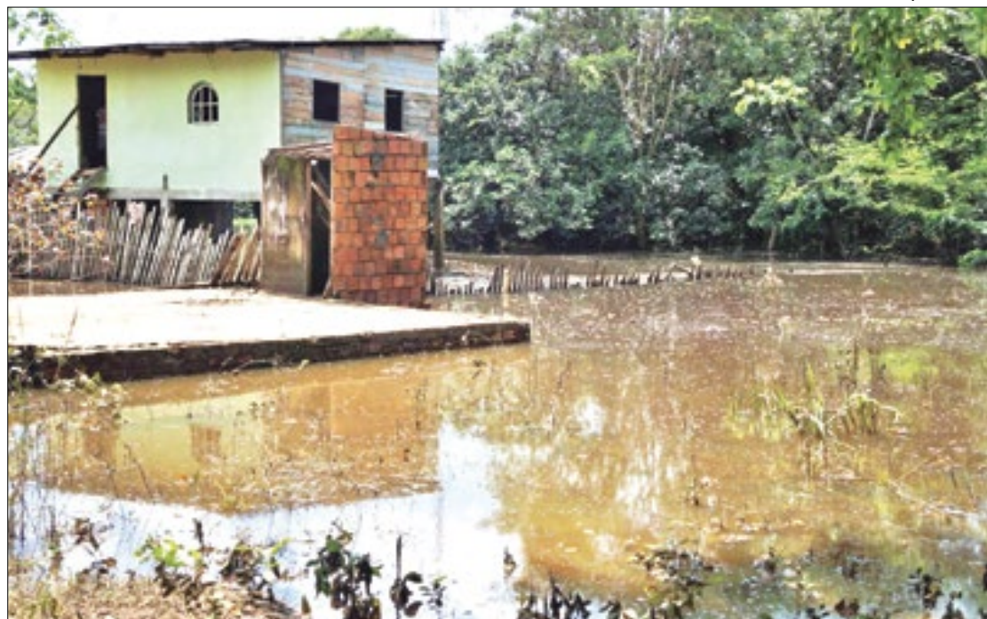
Doença pode levar à morte e ocorre tanto em áreas urbanas como rurais do estado

“De janeiro até esta semana, nós confirmamos ao todo 14 casos de leptospirose no Acre, sendo três em Rio Branco, três em Senador Guiomard, seis em Cruzeiro do Sul e um em Brasi-