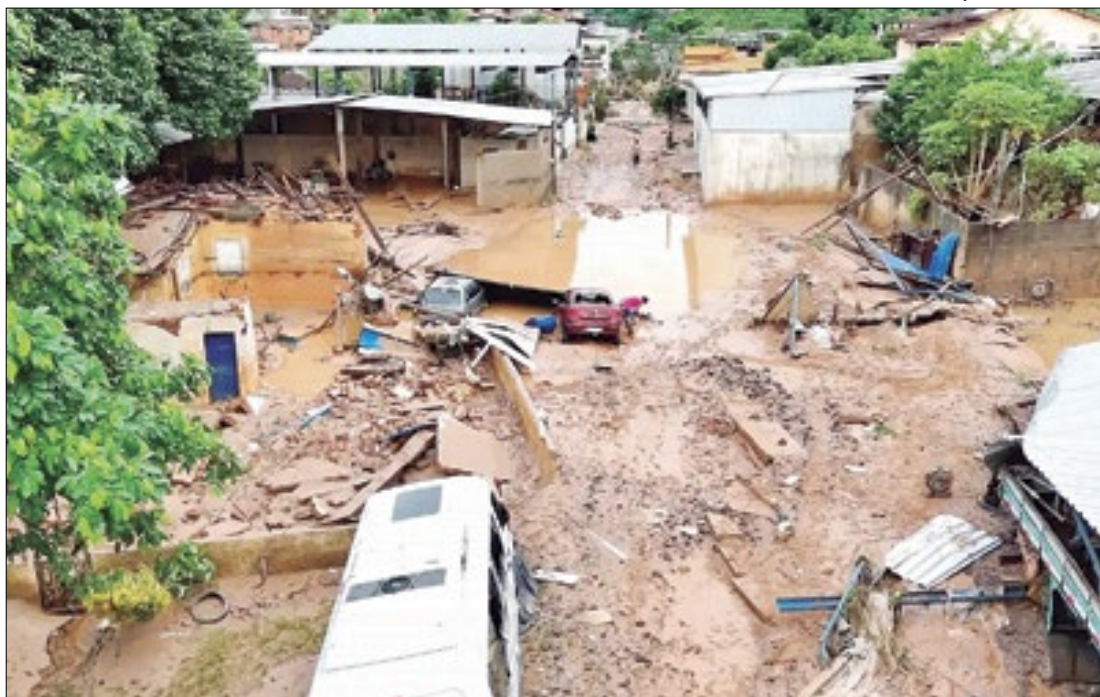
Desde o fim de semana, Espírito Santo já registrou 19 mortes pelo temporal

Em um cenário de destruição, o Corpo de Bombeiros do estado do Espírito Santo fazia buscas, até o fechamento desta edição do Correio, por seis pessoas desaparecidas após temporais na cidade de Mimoso do Sul, na região sul do estado, a 177 km de Vitória. Os nomes dos desaparecidos não foram divulgados.