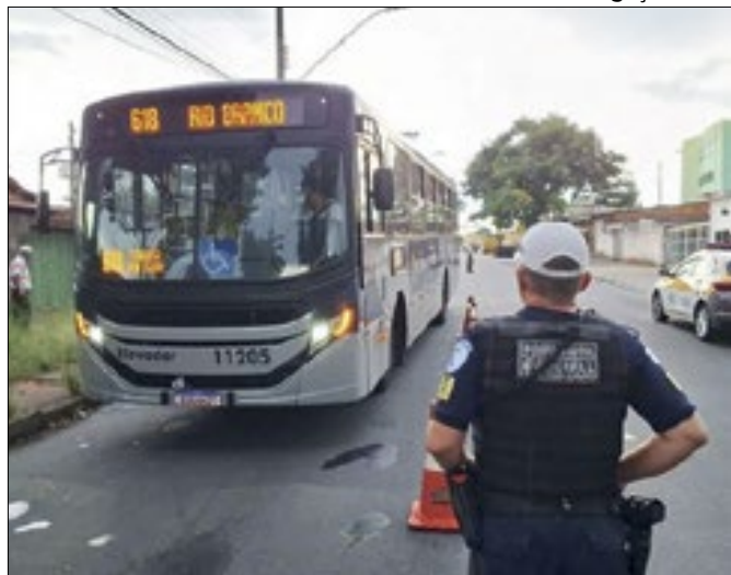
Fiscalizações ocorrem em portas de garagens e estações