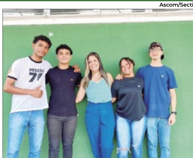
Estudantes baianos criam sacola biodegradável

Em 25 de março, o estado celebrou 140 anos do seu pioneirismo