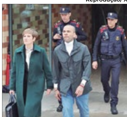
Daniel Alves pagou sua fiança

Condenado por estupro na Espanha, o ex-lateral do Barcelona e da Seleção Brasileira, Daniel Alves, pagou a fiança de 1 milhão de euros e deixou a prisão na segunda (25). Ele está em liberdade provisória até a divulgação da sentença final, quando não houver mais possibilidade de recursos. Alves teve os dois passaportes apreendidos e se apresentará toda sexta ao Tribunal Superior de Justiça de Catalunha.