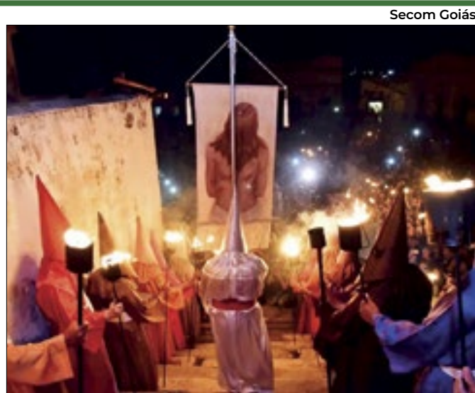
Procissão do Fogaréu ocorre na quarta-feira santa

O grupo empresarial frisou ainda que o espaço alugado tem uma área total de 14.109,74 metros quadrados. Com isso, o contrato estabelece a cobrança de R$ 53,15 por metro quadrado, o que a entidade investigada alega ser o “menor valor pago entre todos os locatários do prédio”. Além disso, a empresa lembrou dos investimentos feitos para atender à SES-DF, avaliados em R$ 9 milhões.