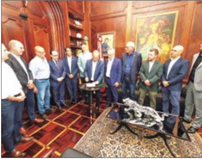
Governador do Estado autoriza edital para Porto