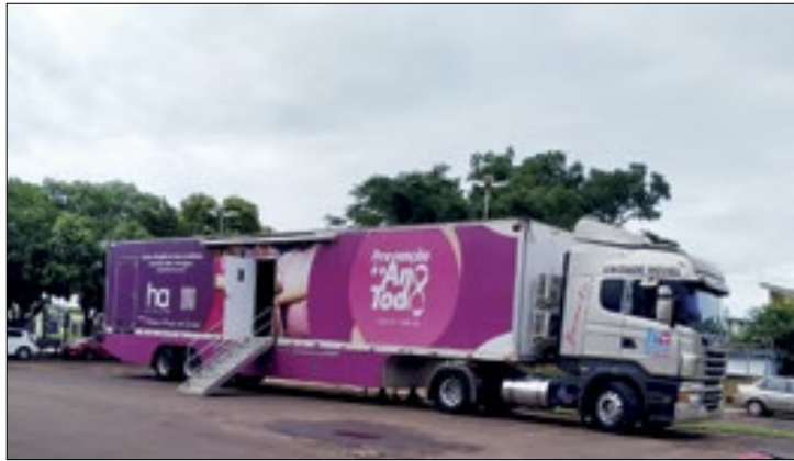
Iniciativa é do Hospital de Amor de Campo Grande