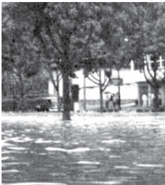
Enchente de 1977