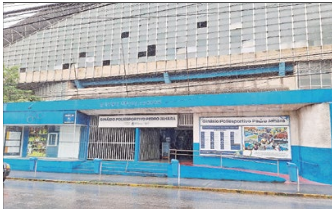
Ginásio Poliesportivo Pedro Rage Jahara em Teresópolis foi disponibilizado

A importância dessas doações vai além do simples fornecimento de alimentos e produtos básicos. Em momentos de crise, gestos como esses repre-