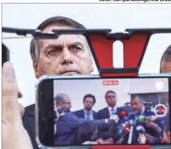
Bolsonaro passou dois dias na embaixada da Hungria

As imagens mostram Bolsonaro acompanhado de dois seguranças, do embaixador da Hungria no Brasil, Miklós Halmay, e de outros membros da equipe diplomática. Logo no primeiro dia de estadia do ex-presidente, funcionários da representação diplomática aparecem carregando roupas de cama, água e outros itens para a área residencial da embaixada. No dia seguinte, Bolsonaro aparece nas imagens passeando pelo estacionamento do local com um de seus seguranças.