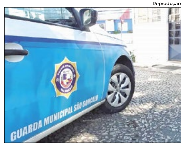
Corporação fecha primeiro bimestre com aumento de prisões

A medida tem por base o Decreto Municipal nº 66/2024, que criou o gabinete Municipal de Gerenciamento de Crises, para a adoção de medidas, visando a avaliação e o enfrentamento de possíveis desastres causados pelas chuvas.