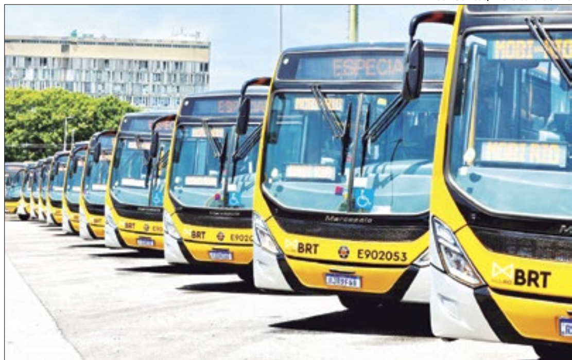
Novos veículos deram agilidade e mais conforto à população carioca

Quando a Prefeitura assumiu a gestão municipal do BRT, a média diária de passageiros era de 150 mil pessoas. Hoje já são cerca de 375 mil, ou seja, um aumento de 150%. Antes da intervenção, o sistema dispunha de 120 ônibus em operação nos três corredores. Atualmente, a nova frota é mais de quatro vezes maior: 515 amarelinhos novinhos rodando. Na Transoeste, último corredor a receber os novos Euro 6, com tecnologia