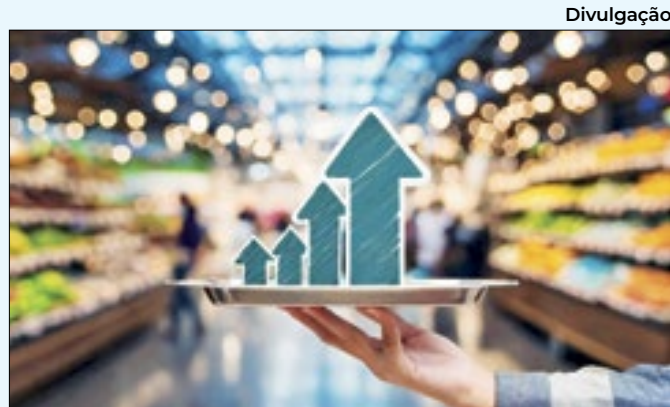
Aumento foi de 6,5% em relação a 2020, ano da covid

do Carmo, no Santo Cristo; e nas clínicas da família São Sebastião, no Caju; Sérgio Vieira de Melo, no Catumbi; Medalhista Olímpico Maurício Silva, em Benfica; e Medalhista Olímpico Ricardo Lucarelli, na Cidade Nova. As salas praticam o mesmo horário de funcionamento das unidades.