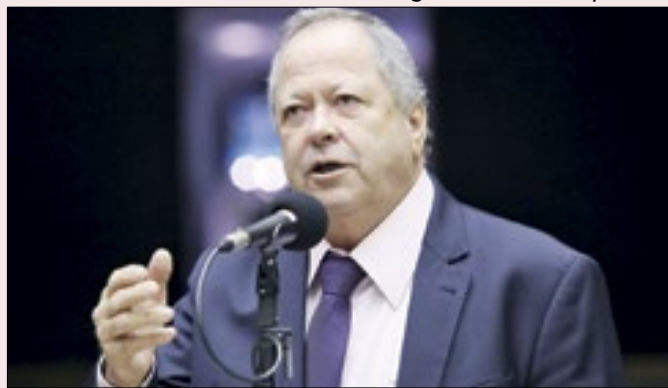
União expulsou Brazão ainda no domingo