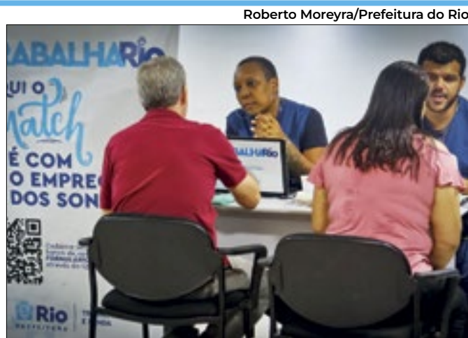
São 620 para trabalhadores comuns e 365 para PcD