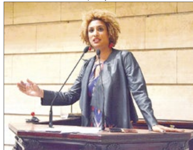
Vereadora considerava que tema era “vespeiro”

Marielle Franco