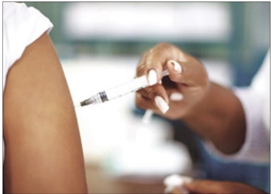
Campanha segue até dia 31 de maio