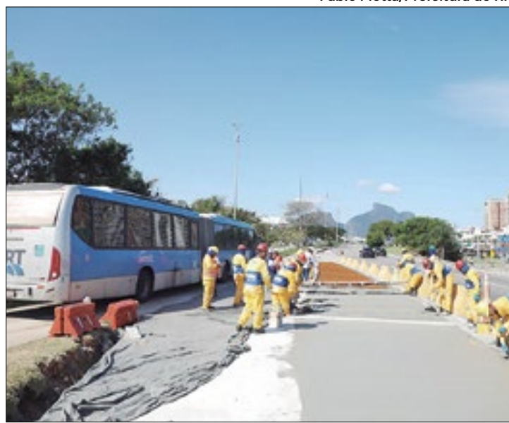
Corredor teve o asfalto trocado

No Malto Alto, já é possível vislumbrar a estrutura dos novos viadutos. A passarela, que vai receber usuários tanto de Sepetiba como de Campo Grande, já está pronta para uso. Parte da estação antiga foi desmontada para a construção do