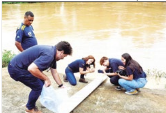
Atividade é uma da série de ações educativas