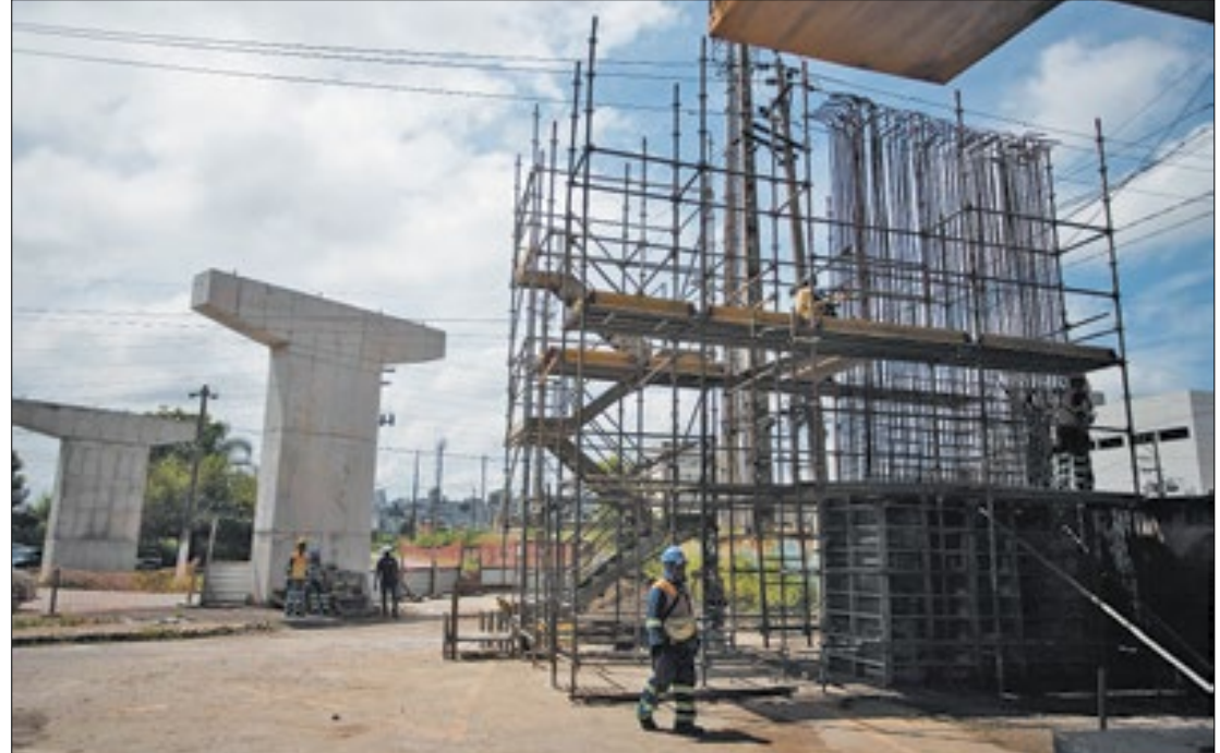
Construções fazem parte das obras que estão dentro do Plano de Mobilidade Urbana

De acordo com a Secretaria Municipal de Transporte e Mobilidade Urbana (STMU), o novo viaduto vai facilitar para os motoristas o acesso ao bairro Niterói, melhorando também