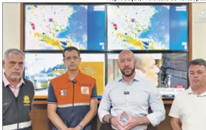
Prefeito de Teresópolis anuncia plano de contingência

A cidade de Teresópolis criou um Gabinete de Crise Preventivo, que decretou a suspen-