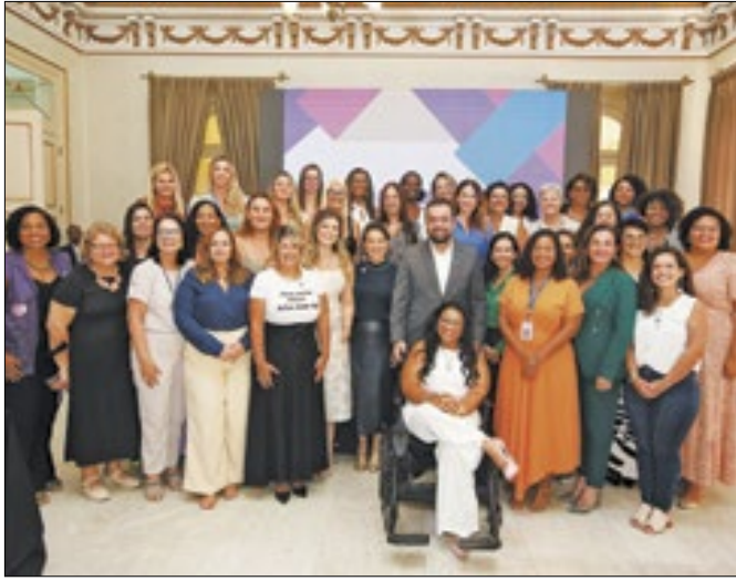
Governador Cláudio Castro participou do lançamento