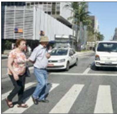
Novos sinais no município

A Prefeitura de Nova Friburgo, através da Secretaria Municipal de Ordem e Mobilidade Urbana (Smomu), está remodelando o parque semafórico da cidade. Vários sinais estão sendo implantados ou substituídos, com novos controladores, que têm mais recursos de programação e permitem a implantação da chamada “onda verde”. A novidade chegou ao bairro Olaria, o mais populoso e um dos mais movimentados do município. O feito será para a melhoria do trânsito.