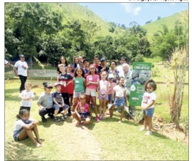
Jardim das Cerejeiras será aberto à visitação

A ONG Projeto Água fundada em 2004 pela Carbografite Equipamentos Industriais LTDA com a missão de “conscientizar e instruir a população em geral sobre a importância de preservar, economizar e recuperar a água, através do exercício da educação ambiental, de modo a assegurar para atual e futuras gerações a disponibilidade de água doce e limpa no planeta” já tem em sua sede, desde a fundação, 16 Programas Ambientais implantados, uma floresta nativa reconstruída e milhares de pessoas envolvidas na causa ambiental.