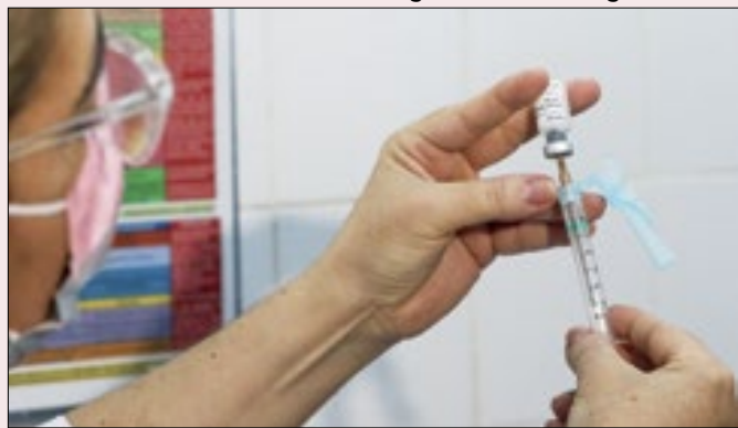
Falsa expectativa: não haverá vacina suficiente