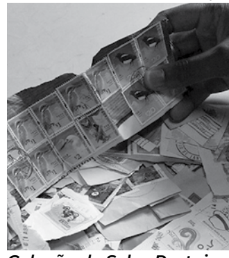
Coleção de Selos Postais