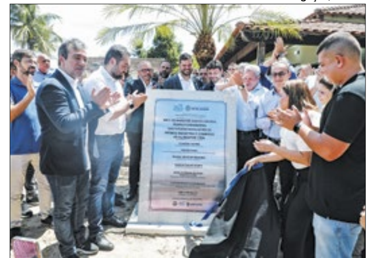
Investimento da empresa chegará a R$ 300 milhões,

Em 2023, a Secretaria de Educação também inaugurou da UMEI Professora Silviane Moraes de Oliveira Martins, em Marambaia. Duas novas creches, nos bairros Jardim Bom Retiro e Almerinda já estão em fase de finalização.