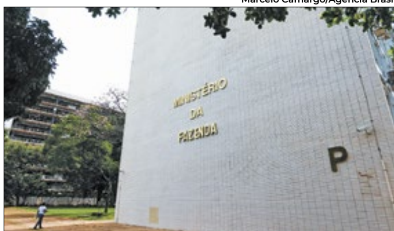
Ministro Haddad quer tentar zerar o deficit fiscal em 2024

Melhor fevereiro da série histórica da Receita Federal (iniciada em 1995) e o melhor desempenho arrecadatório bimestral (desde 2000), a arrecadação federal apresentou crescimento de 12,27% no mês passado (no comparativo anual), chegando ao montante de R$ 186,5 bilhões.