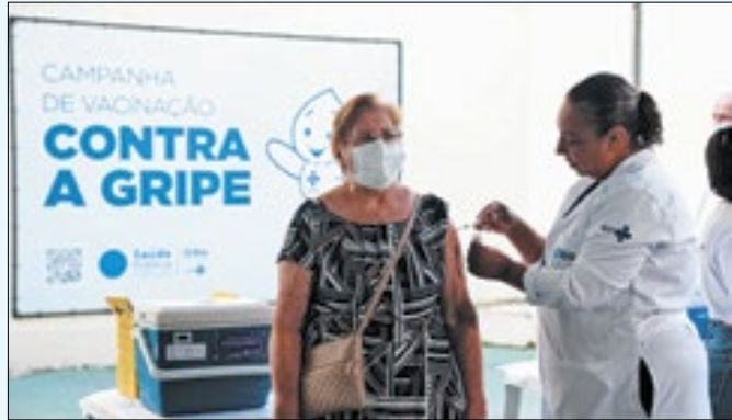
Idosos já podem se imunizar contra a doença