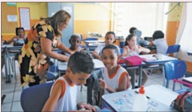
Niterói adquiriu cerca de mil aparelhos de ar condicionado