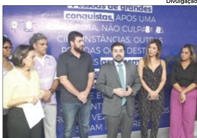
Espaço foi inaugurado na quarta-feira (20)