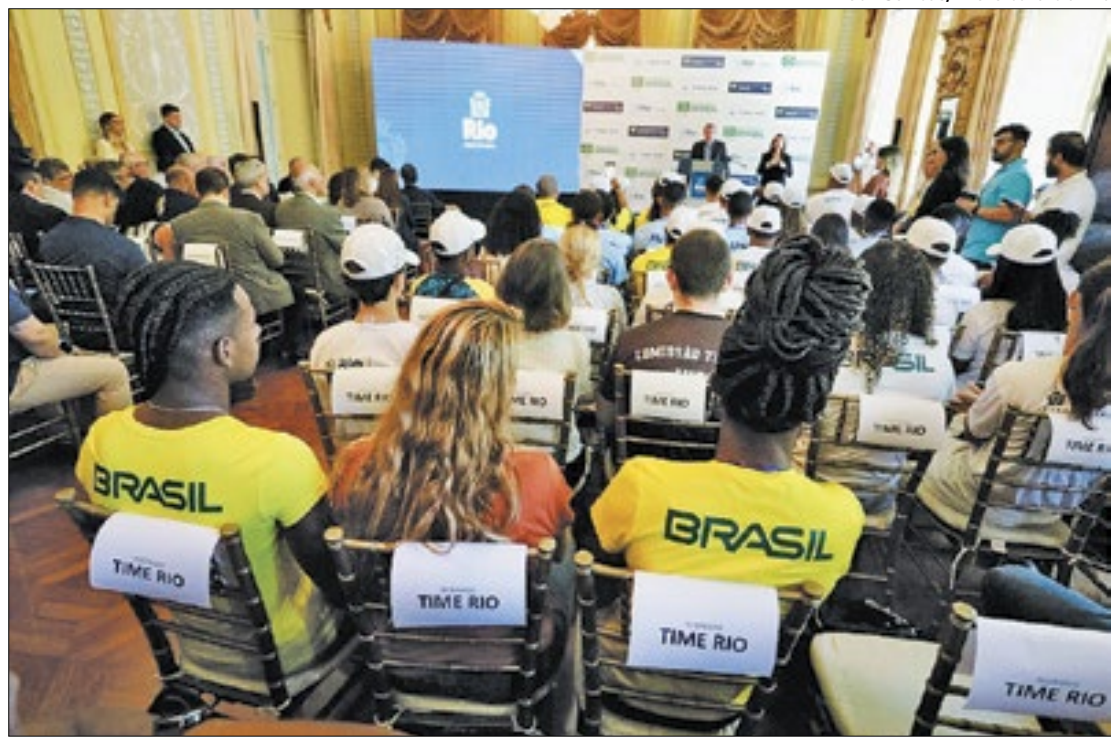
Trinta e um atletas olímpicos e paralímpicos receberam a premiação