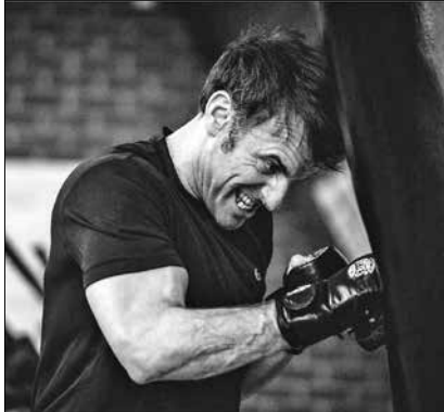
Presidente publicou a foto