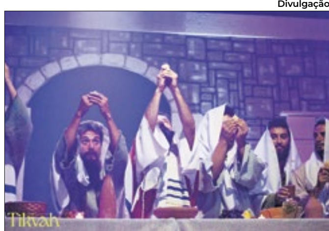
Show apresenta os milagres feitos por Jesus