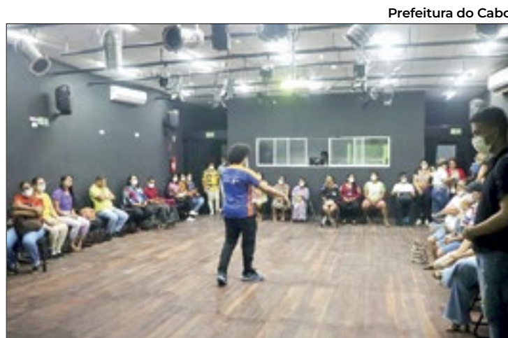
Oficinas visam integrar o grupo ao mercado de trabalho

A seção especial não é aberta a toda a população, mas sim para internos que tenham inscrição eleitoral, servidores que estejam de plantão no dia do pleito, servidores da segurança pública em serviço no dia da eleição.