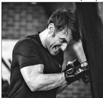
Presidente publicou a foto