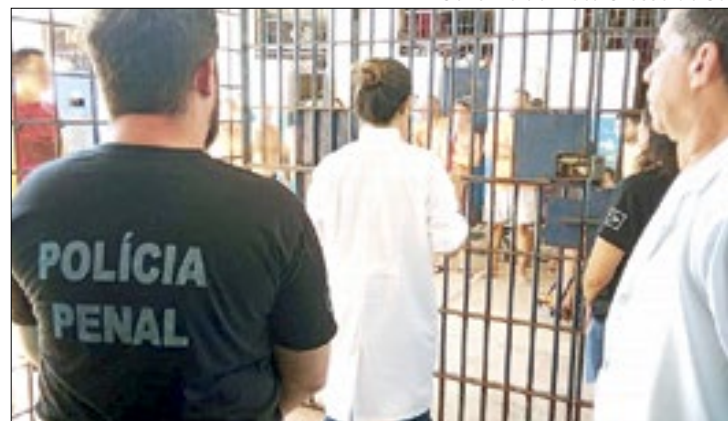
Foram entregues kits de higiene bucal aos internos