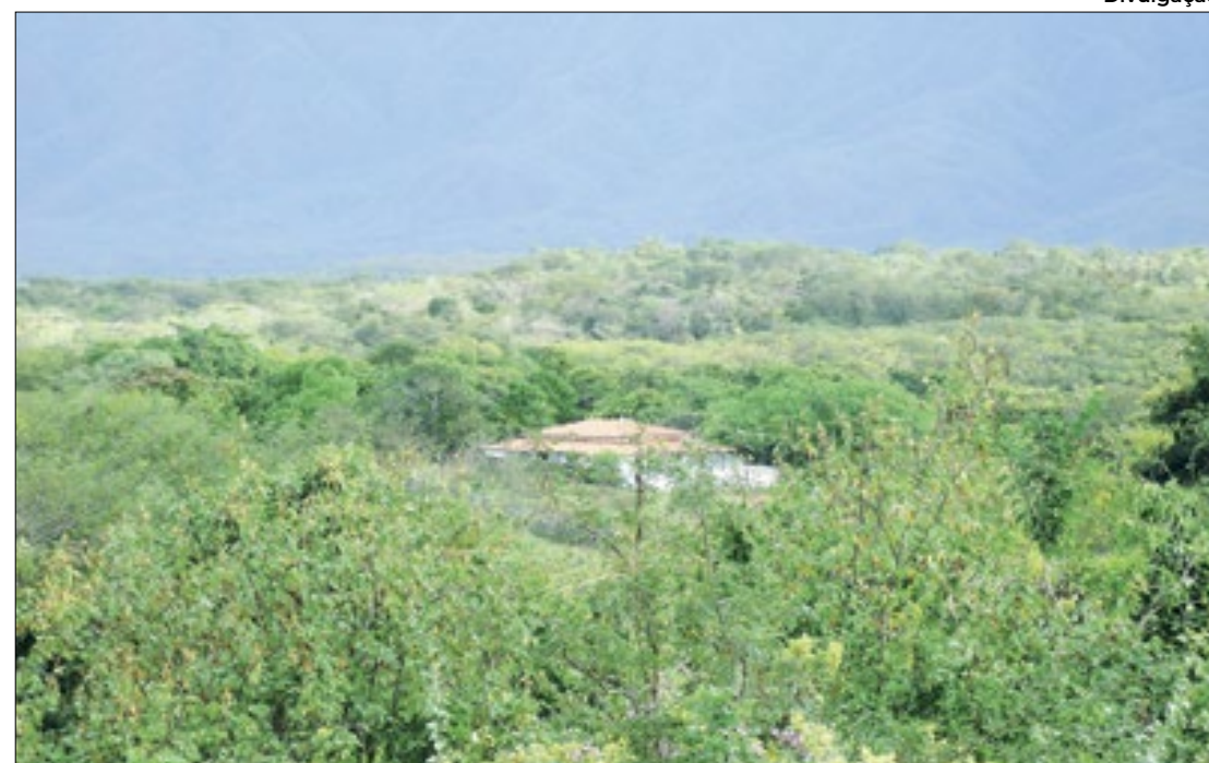
Grupo de Trabalho apresenta análise técnica para definir divisas territoriais

Estudo identifica ocupação piauiense no sopé ocidental da serra