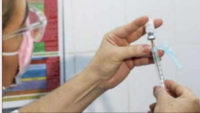
Falsa expectativa: não haverá vacina suficiente