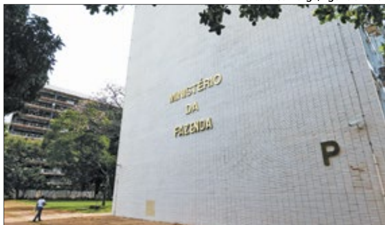
Ministro Haddad quer tentar zerar o deficit fiscal em 2024

Melhor fevereiro da série histórica da Receita Federal (iniciada em 1995) e o melhor desempenho arrecadatório bimestral (desde 2000), a arrecadação federal apresentou crescimento de 12,27% no mês passado (no comparativo anual), chegando ao montante de R$ 186,5 bilhões.