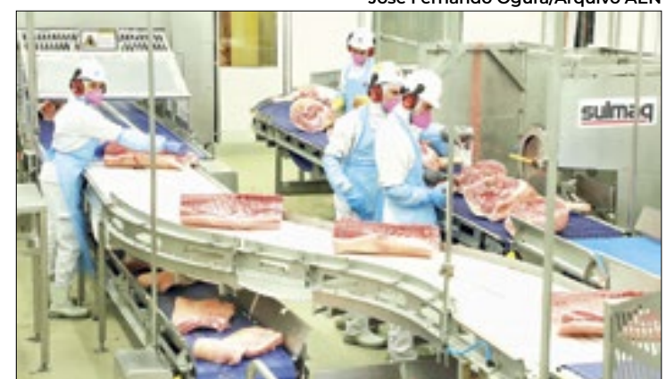
Paraná foi o estado que mais produziu carne suína

Para os beneficiários em situação de vulnerabilidade social e renda, se enquadram nessa linha as famílias que residem no meio rural e que tenham renda anual familiar de até R$ 50 mil. Nesse caso, o valor individual de financiamento é de até R$ 20 mil por família e coletivo de até R$ 100 mil, limitado a R$ 20 mil por família.