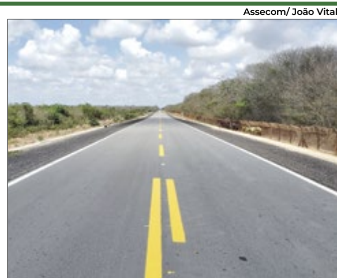
Governo estadual apresentou a pauta em Brasília