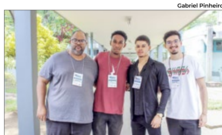
Desafio consiste em projetar e testar veículos exploradores

Em nota, a OAB/SE lamentou o ocorrido e afirmou ter tomado medidas, como o afastamento do suspeito e a abertura de um processo ético-disciplinar.