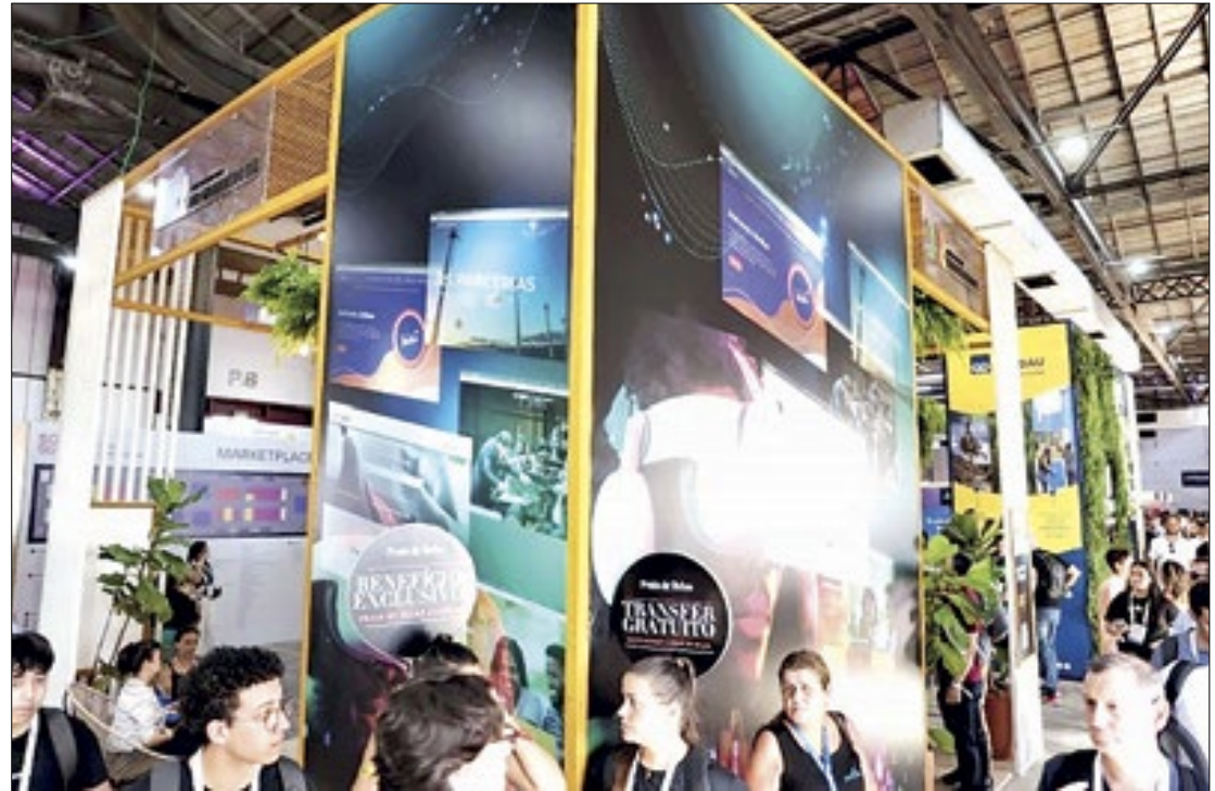
Correalizador do South Summit Brazil, o governo do RS apresenta 18 produtos

“Durante os três dias de SSB, a equipe técnica da SPGG e da Procergs estarão demonstrando soluções em várias plataformas de serviços, como o RS Digital, o Tudo Fácil Empresas, o Portal de Imóveis, e ações voltadas à disseminação da acessibilidade digital em todos os espaços públicos”, detalhou a secretária.