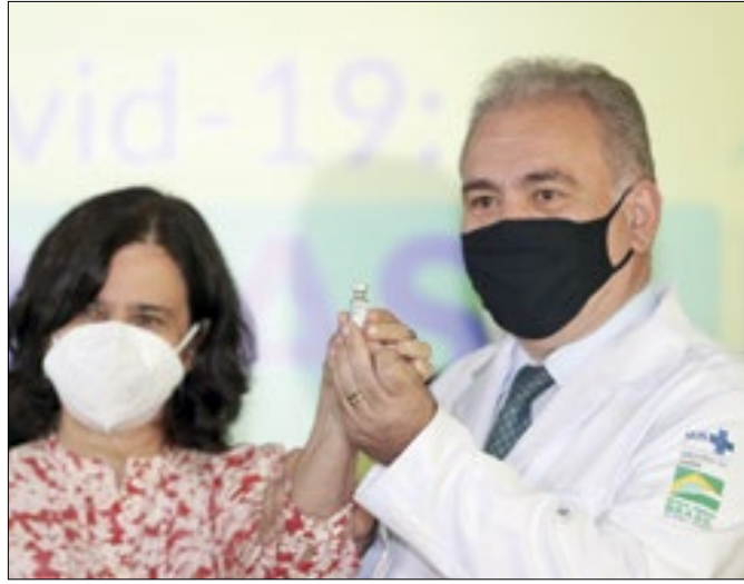
Nísia e Queiroga: a atual ministra e o ex