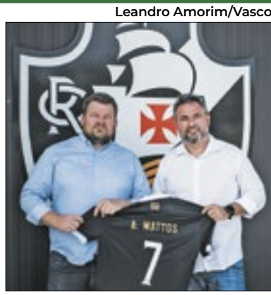
Passagem de apenas 100 dias