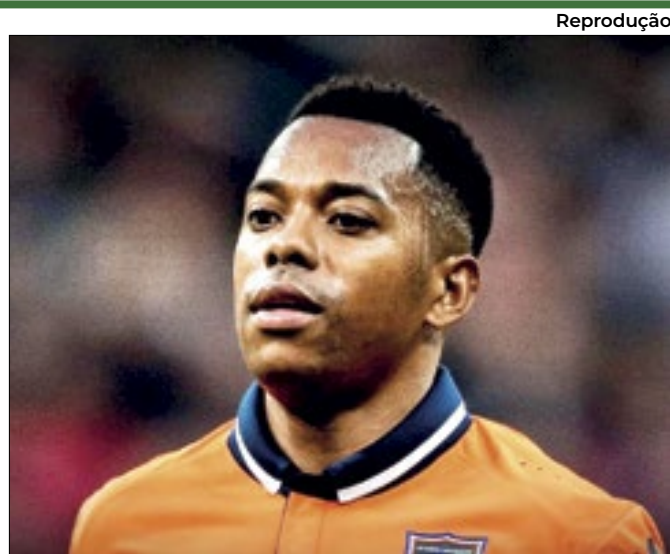
Justiça italiana condenou ex-jogador por estupro