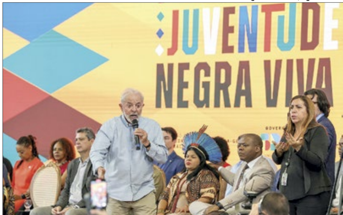
Presidente Luiz Inácio Lula da Silva esteve no lançamento do plano Juventude Negra Viva