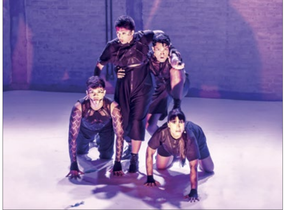
Espetáculo “KARAÍBA” será apresentado neste fim de semana na Baixada Fluminense