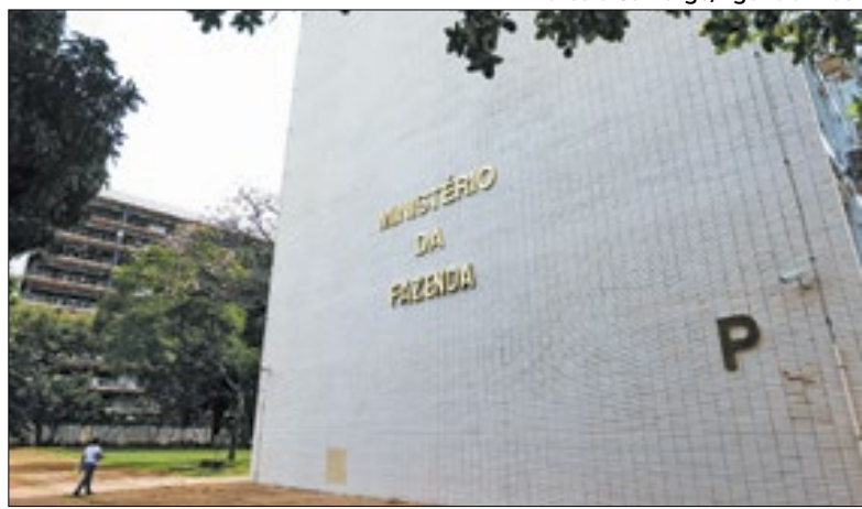
Ministro Haddad quer tentar zerar o deficit fiscal em 2024

Melhor fevereiro da série histórica da Receita Federal (iniciada em 1995) e o melhor desempenho arrecadatório bimestral (desde 2000), a arrecadação federal apresentou crescimento de 12,27% no mês passado (no comparativo anual), chegando ao montante de R$ 186,5 bilhões.