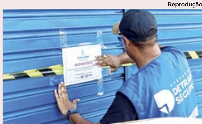
Ferros-velhos foram interditados em Duque de Caxias