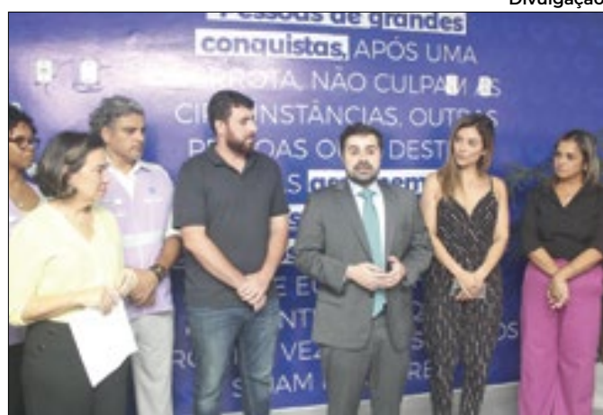
Espaço foi inaugurado na quarta-feira (20)