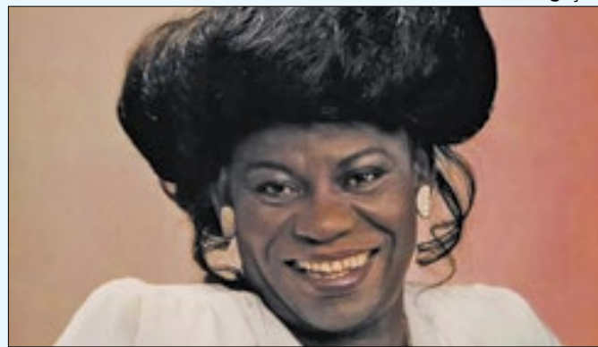
Um dos eventos celebra a sambista Jovelina Pérola Negra