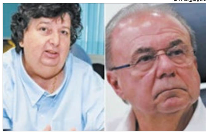
Neto diz que receita caiu e a de Jordão subiu