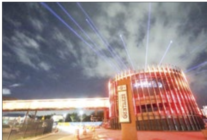
Terminal Gentileza será o hub principal dos ônibus