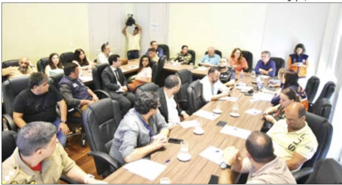
Petrópolis acionou gabinete de crise para monitorar a situação no município

Em contato com as promotorias de Justiça do Ministério Público do Estado do Rio de