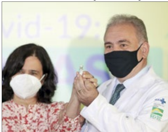
Nísia e Queiroga: a atual ministra e o ex