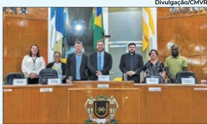
Audiência fala de campanha da fraternidade

sempre pronto a ajudar. "É um campeão", classificou. O prefeito disse ainda que irá reformar a Rodoviária de Volta Redonda, alvo de reclamações. Irá começar a obra com recursos do município.