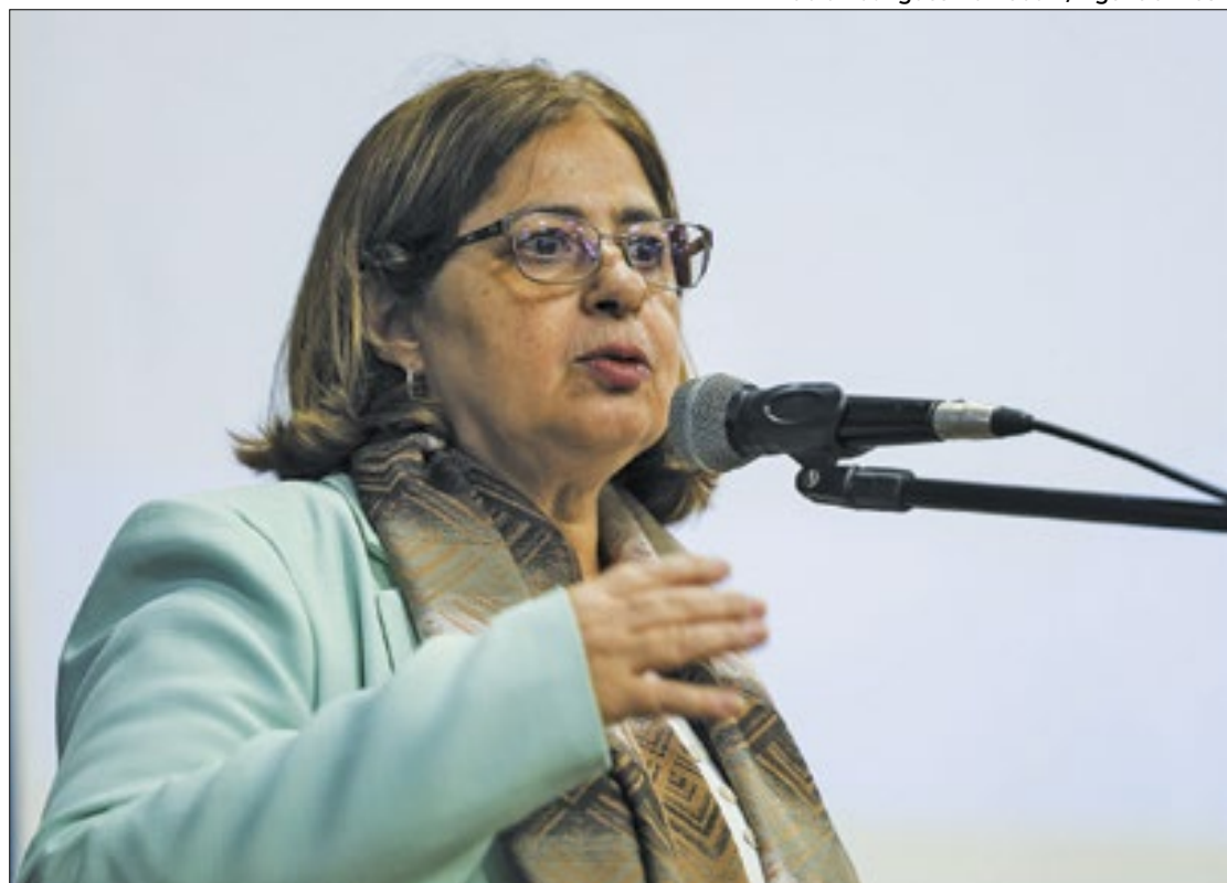
Ministra das Mulheres, Cida Gonçalves critica os questionamentos

Nesta terça-feira (19), a ministra das Mulheres, Cida Gonçalves, protestou contra a ação. “A minha pergunta é: como é