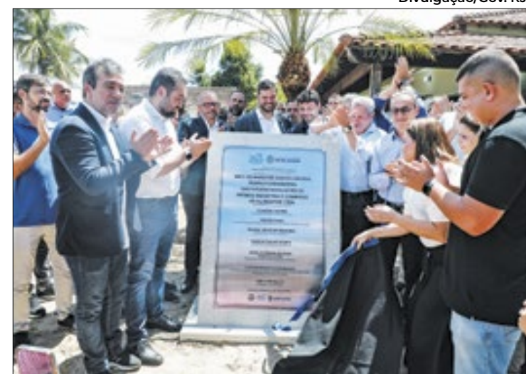
Investimento da empresa chegará a R$ 300 milhões,

Mais de 40 mil pessoas em Angra dos Reis estão cadastradas no sistema gratuito de aviso por SMS, em caso de ocorrências de possíveis tragédias.