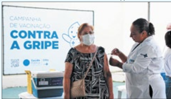
Idosos já podem se imunizar contra a doença