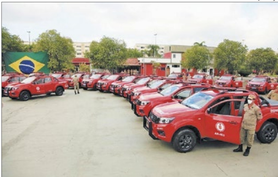
Corpo de Bombeiros RJ dobrou o efetivo de militares de serviço

A Prefeitura de Macaé promoveu, nesta quinta-feira (21), um mutirão de limpeza nos terrenos baldios, visitas e tenda informativa no bairro Lagomar. Mais de 40 profissionais atuaram na ação, que visa orientar a população sobre os riscos do Aedes aegypti.