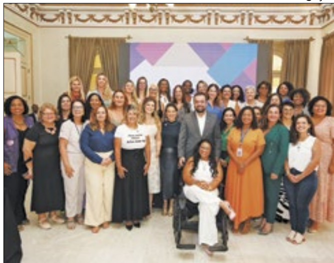
Governador Cláudio Castro participou do lançamento