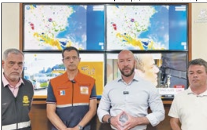
Prefeito de Teresópolis anuncia plano de contingência

A cidade de Teresópolis criou um Gabinete de Crise Preventivo, que decretou a suspen-