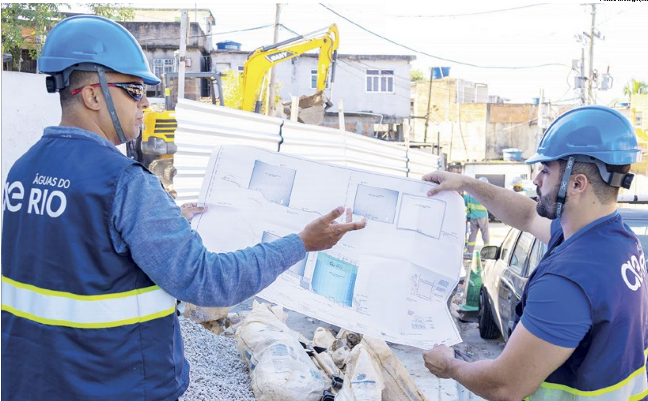
Empresa atua em 27 municípios, incluindo a capital (zonas Norte e Sul, além do Centro) e, ao longo de 35 anos, serão investidos R$ 24,6 bilhões

Especialistas apontam que, quando o assunto é fornecimento de água tratada e esgotamento sanitário, a parceria entre o poder público e a iniciativa privada vai muito além da obrigatoriedade de prestar um bom serviço à população. Ela impacta diretamente na saúde e na preservação do meio ambiente e provoca transformações sociais especialmente em áreas vulneráveis e degradadas. No Rio de Janeiro não é diferente, como mostram os avanços na área registrados pelo IBGE no Censo 2022. O estado saiu na frente nesta corrida por mais saúde e desenvolvimento econômico após o Executivo fluminense e a Águas do Rio assinarem, em 2021, contrato que deu o direito de a empresa atuar em 27 municípios, incluindo a capital (zonas Norte e Sul, além do Centro).