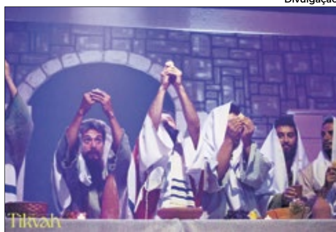
Show apresenta os milagres feitos por Jesus