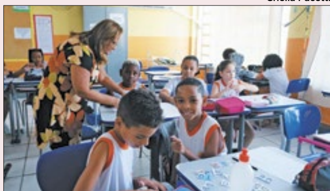
Niterói adquiriu cerca de mil aparelhos de ar condicionado