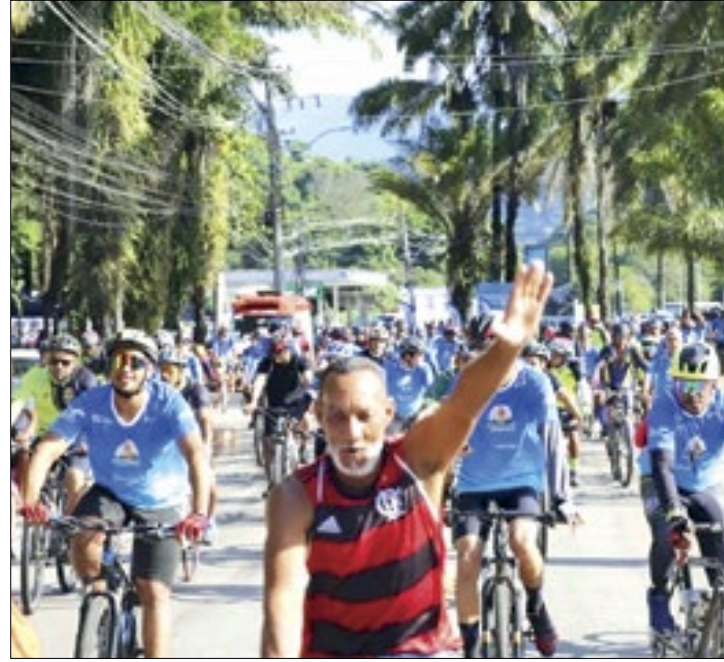
Dia do Pedal no Paraíso é incluído no calendário oficial

A proposta reconhece o trabalho realizado na Fazenda Paraíso, um dos maiores centros de recuperação de dependentes químicos do país, localizado na zona rural do bairro de Xerém. Desde 2022, a Prefeitura de Duque de Caxias realiza o maior