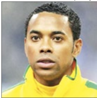
Robinho é preso em Santos

Robinho foi preso pela Polícia Federal, na quinta-feira (21), no prédio em que mora no bairro Aparecida, em Santos, no litoral de São Paulo. Ele vai passar por audiência de custódia na Justiça Federal. O ex-jogador foi detido após a Corte Especial do Superior Tribunal de Justiça (STJ) decidir que ele cumpra a pena de 9 anos pelo crime de estupro coletivo, a partir de condenação da justiça italiana. O crime aconteceu em 2013 na Itália.