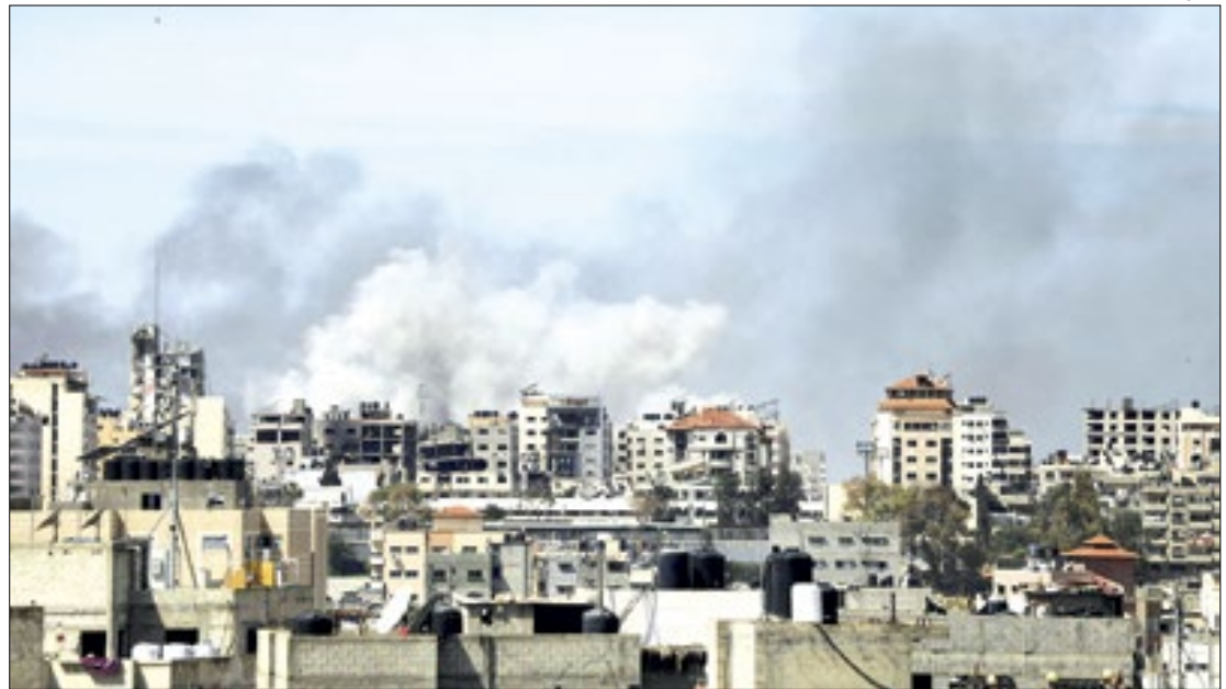
Hamas afirma que mortos eram pacientes palestinos no hospital

Localizado na Cidade de Gaza, maior cidade da faixa, o Shifa era uma das poucas instalações de saúde que seguiam operando, ainda que parcialmente, desde o início da guerra. Quase todas as outras colap-