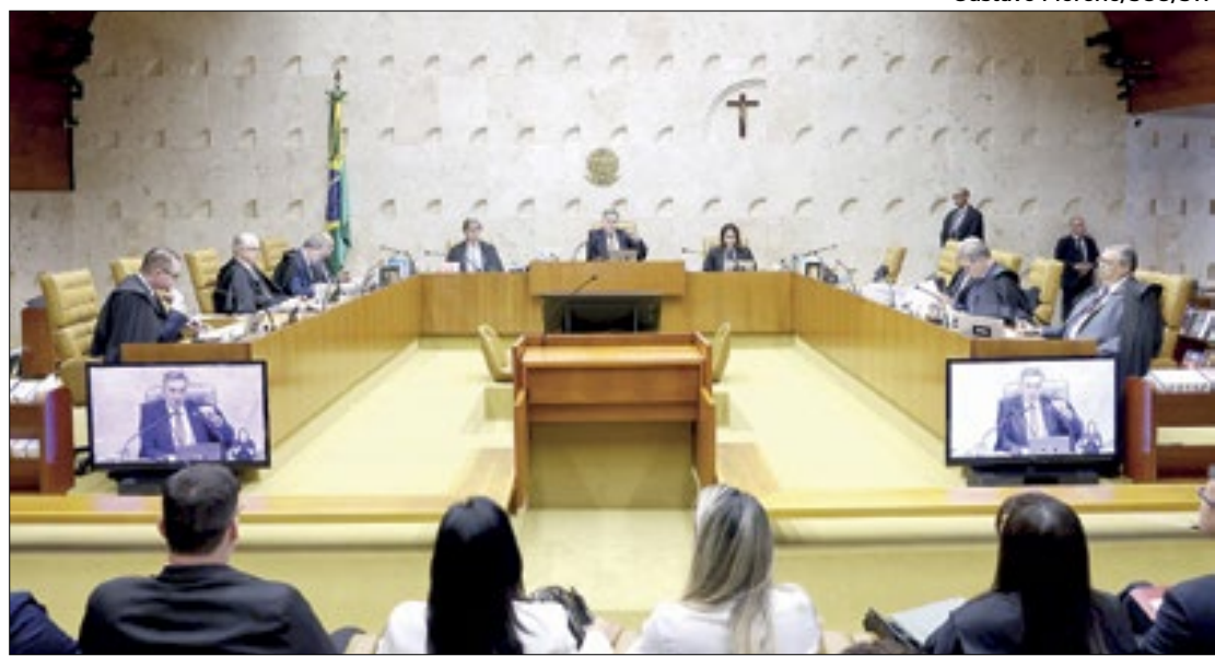
Beneficiários não poderão mais optar por regras

Ou seja, a tese dava a chance do beneficiário escolher a opção mais vantajosa, o que poderia aumentar os rendimentos de parte dos aposentados. A regra