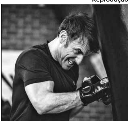
Presidente publicou a foto