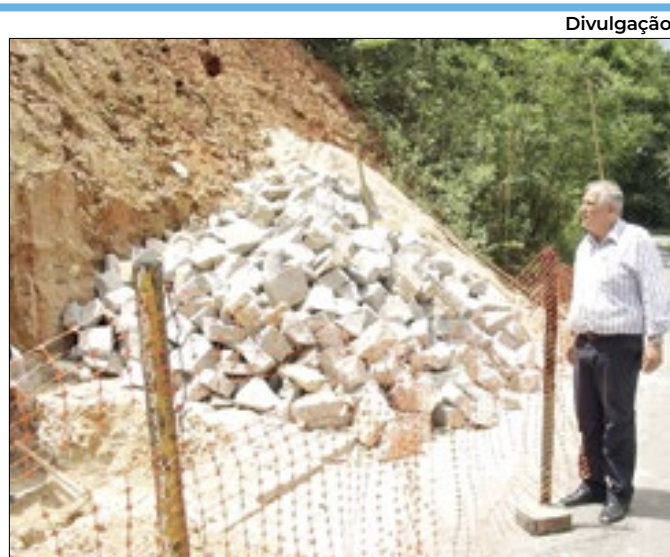
Bomtempo na Rua Antônio Soares Pinto em 2014