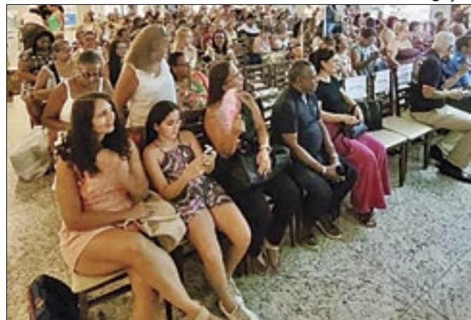
Fenig realizou evento em homenagem aos artesãos