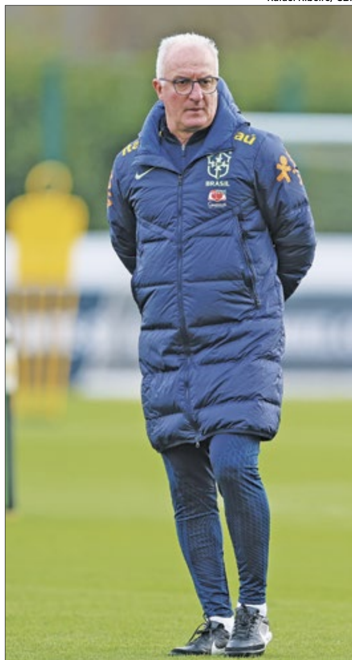
Dorival Júnior fará sua estreia como treinador da Seleção Brasileira contra a Inglaterra

A observação rendeu conversas particulares com jogadores como Richarlison e Andreas Pereira. Na primeira lista de convocados, o treinador chamou 9