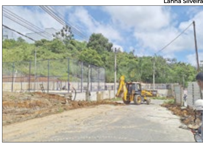
Presença de tratores atrapalha o trânsito no local

Em nota enviada à imprensa, o Saac reforçou a importância da população adotar medidas preventivas, pois a retomada do serviço está ocorrendo de forma gradual. Em caso de dúvidas, o telefone para contato é (24) 3512-4333.