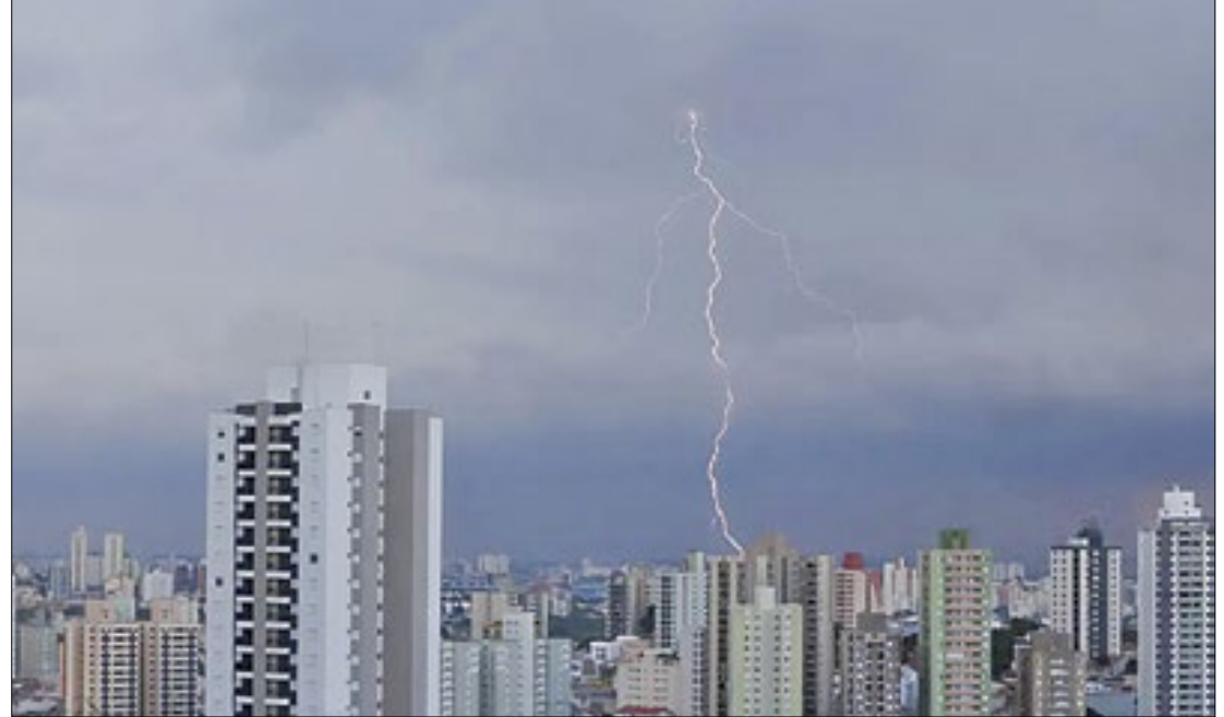
Apesar de nenhuma pessoa ser atingida, região tem maior incidência de raios do Brasil