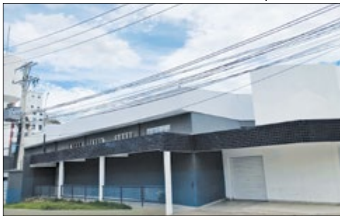
Restaurante popular estava fechado desde 2015