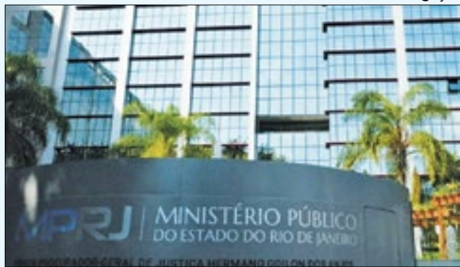
Operação conta com o apoio da DC-Polinter