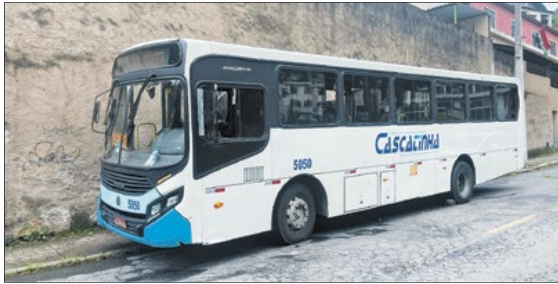
Processo de licitação tramita no Tribunal de Contas do Estado (TCE) desde 2019

"Esperamos que até a homologação do processo licitatório o TCE já tenha analisado esse embargo. Nossa expectativa é que a empresa que vencer a licitação ofereça um serviço de qualidade, e com segurança dentro do