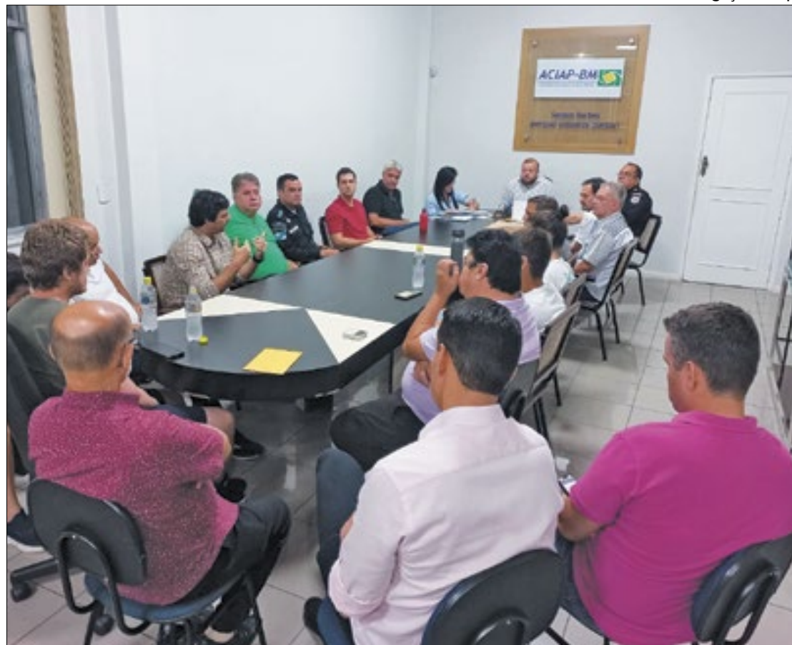
Reunião entre forças de segurança discute ataque a ônibus em Barra Mansa

- Muito rapidamente nós agimos conjuntamente com a Polícia Militar, que colocou seu efetivo nas ruas para o controle da situação não só no dia, mas nos dias seguintes também, a fim de que não se tornasse algo pior. Sob essa perspectiva, a ação foi exitosa no dia e nos dias posteriores também