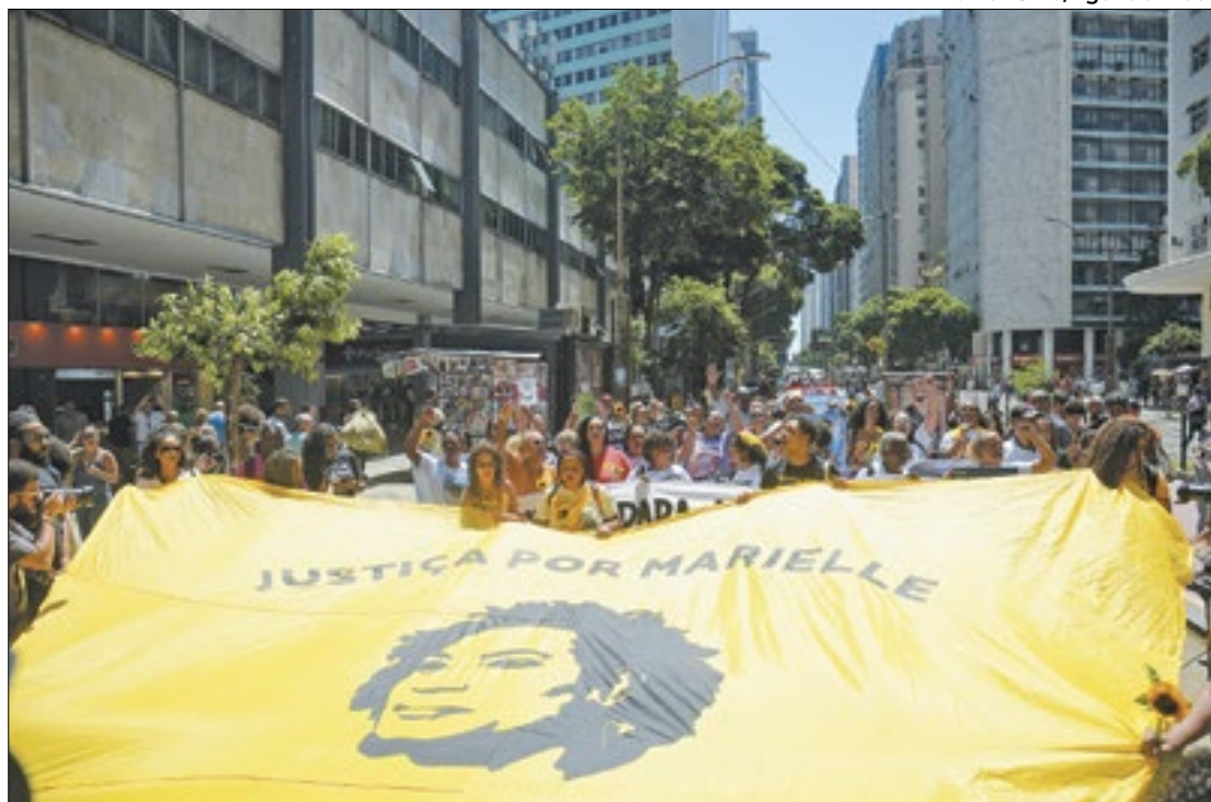
Assassinato de Marielle: seis anos sem esclarecimento