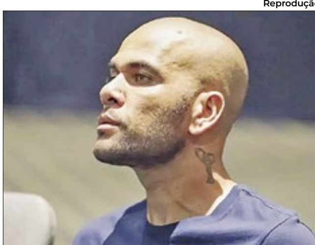
Ex-jogador deve receber ajuda da família de Neymar

O ex-jogador brasileiro Daniel Alves, condenado a quatro anos e meio de prisão pelo estupro de uma jovem de 23 anos em uma boate em Barcelona, poderá ser libertado provisoriamente se pagar fiança de 1 milhão de euros, equivalente a R$ 5,5 milhões.