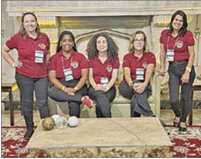
AGP comemora 40 anos de fundação em 2024