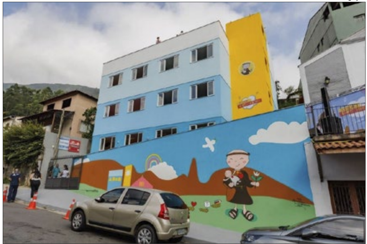
A Creche Escola fica na Rua Cecília Meireles, nº 400, em Santa Cecília

na Rua Cecília Meireles, nº 400, em Santa Cecília, possui três pavimentos e vai atender crianças de 6 meses até 5 anos de idade, em dois turnos de acolhimento. Para a matrícula, uma equipe da SME esteve durante dois dias na unidade para atender pais e responsáveis. Foram feitas também solicitações de transferência para a creche. As aulas começam na próxima segunda-feira, 25.