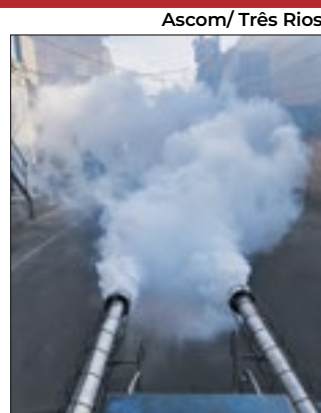
Carro fumacê nos bairros

De acordo com o último levantamento, Três Rios contabilizou 2.455 casos suspeitos de dengue, sendo 1.061 casos confirmados e 01 óbito até o dia 17 de março. Os bairros que apresentaram maiores números de casos, nas últimas semanas, são: Vila Isabel, Centro, Cantagalo e Monte Castelo. Em relação a utilização do carro fumacê, as localidades que estão sendo atendidas foram as que apresentaram maiores índices de transmissão. Na parte da manhã, o carro fumacê percorre as localidades das 5h30 às 08h30, na parte da tarde, das 16h às 19h.