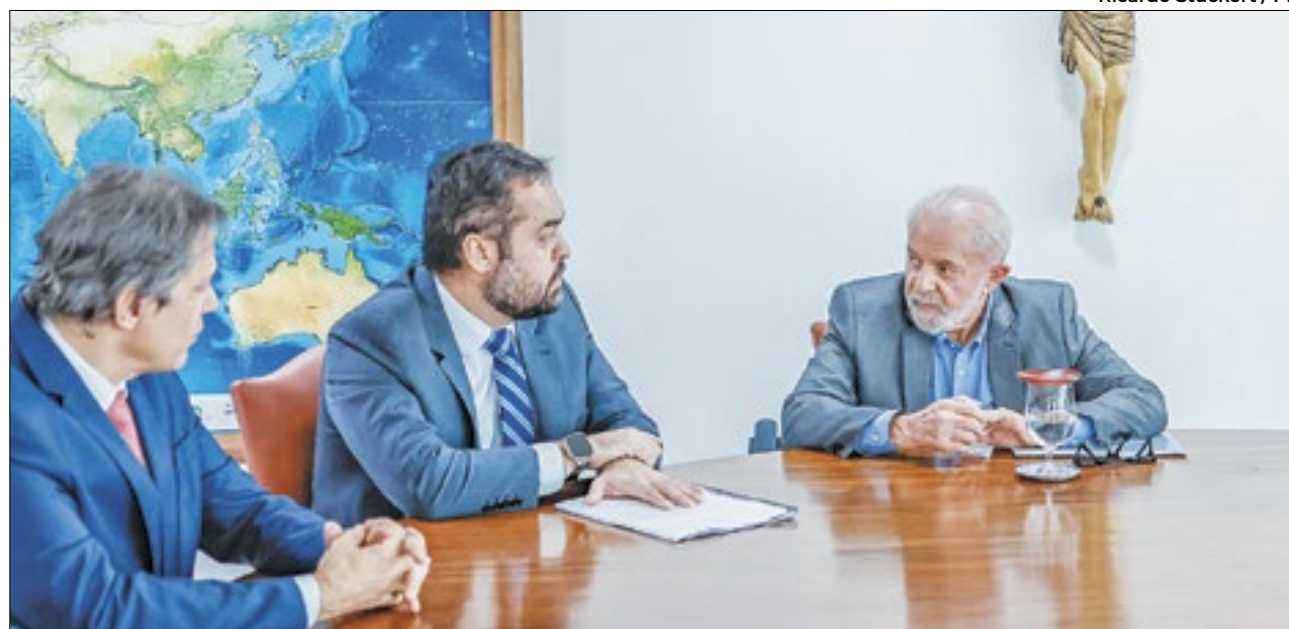
Fernando Haddad, Cláudio Castro e Lula conversam sobre o panorama da dívida do Rio com o Governo Federal

Após reunião com o presidente Lula, nesta quarta (20), o governador do Rio de Janeiro, Cláudio Castro, decidiu adiar o ingresso de uma ação no STF para a renegociação da dívida do estado e alterações nas regras do Regime de Recuperação Fiscal. Segundo Castro, Lula pediu que ele aguarde o encontro com o ministro da Fazenda, Fernando Haddad, e governadores, marcado para 26 de março, quando deve ser apresentado um projeto de lei sobre o tema, para tomar uma decisão. A dívida do Rio com a União, hoje, está em torno de R$ 188 bilhões.