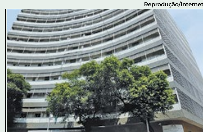
Leitos fechados e falta de insumos no INCA

Os problemas nos hospitais do Rio são um dos principais motivos da crise no Ministério da Saúde. A ministra Nísia Trindade trocou responsáveis pela administração da rede, herdada do governo federal e anunciou a contratação de 500 profissionais de saúde.