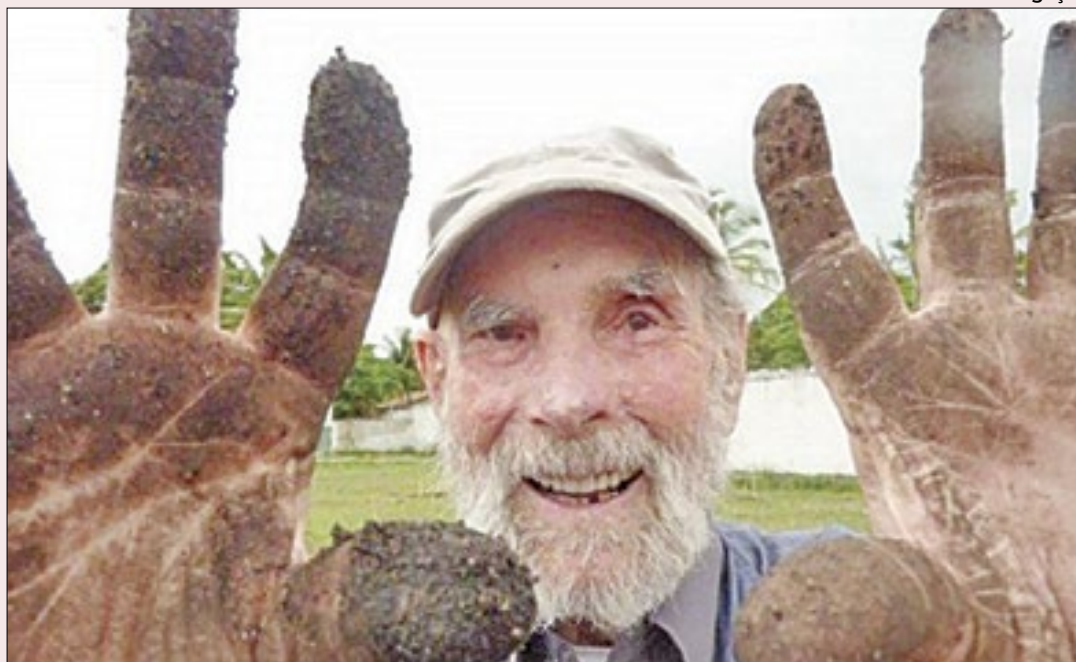
Frans Krajcberg criava com madeira de desmatamentos já nos anos 1970