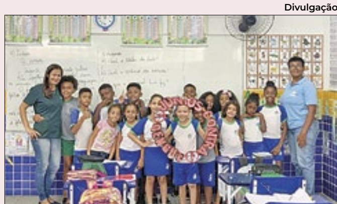
Alunos de todos os segmentos são atendidos