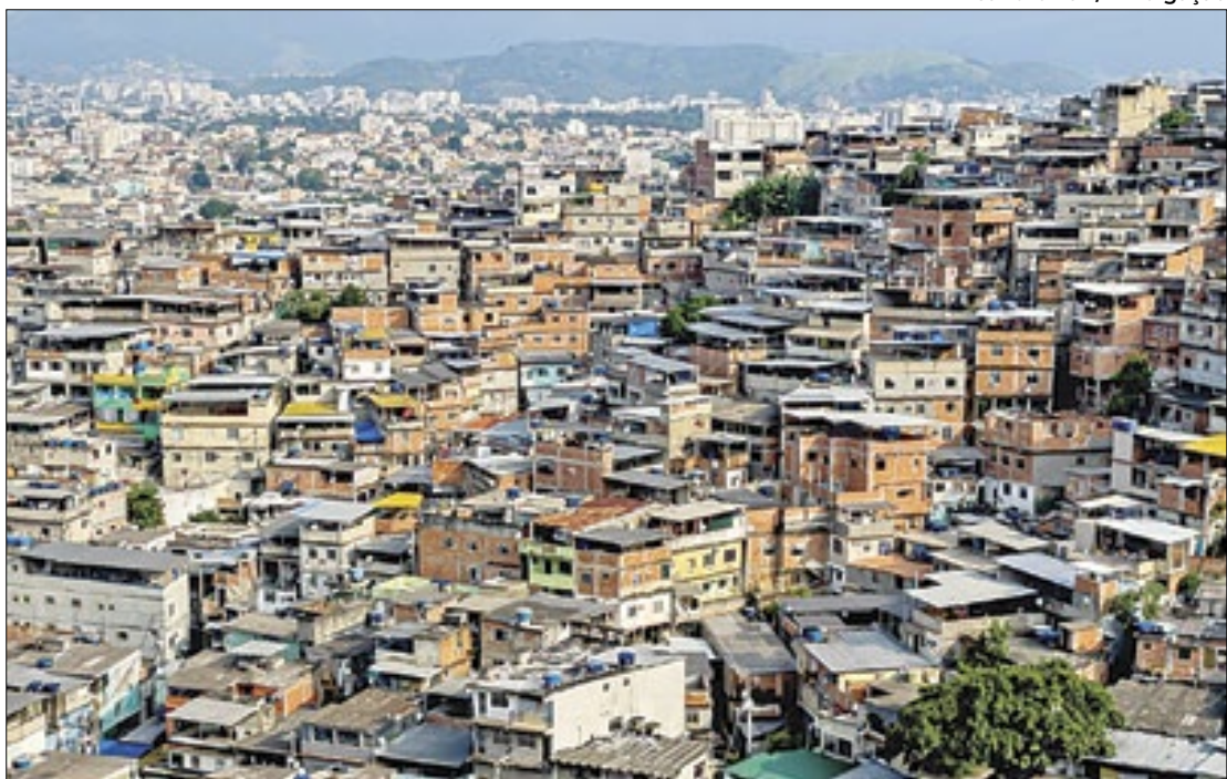
Comunidade terá melhorias nas rede de água e esgoto, bem como nas áreas sociais

O Novo PAC focará em territórios periféricos, em parcerias com os municípios