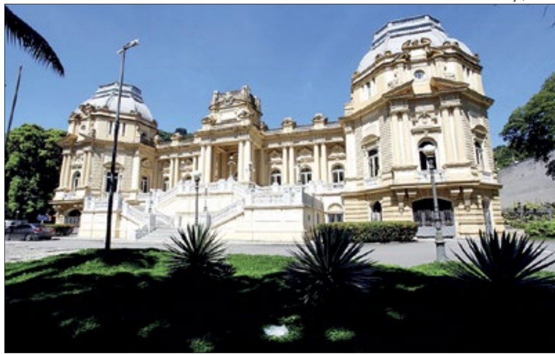
Escola de Gestão Pública oferecerá cursos gratuitos de capacitação para servidores

O projeto prevê a redução da base de cálculo no ICMS para 7%; crédito presumido de 5% nas operações intersetoriais, a ser registrado na Escrituração Fiscal Digital; redução da margem de valor agregada para o cálculo do ICMS — Substituição Tributária para 12,82% nas operações internas.