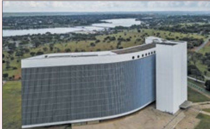
Bolsonaro crê que TSE pode reverter condenação