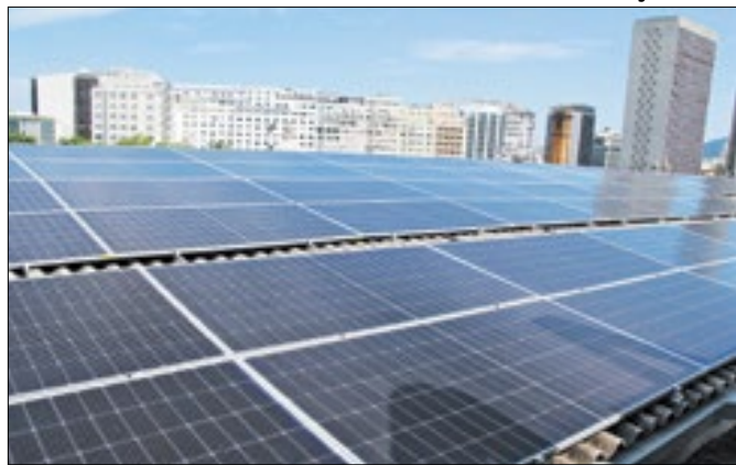
Sistema terá capacidade mínima de 1.290 quilowatts