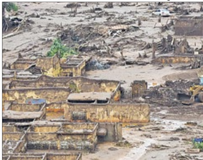
Conta do desastre fatal de Mariana chega à mineradora