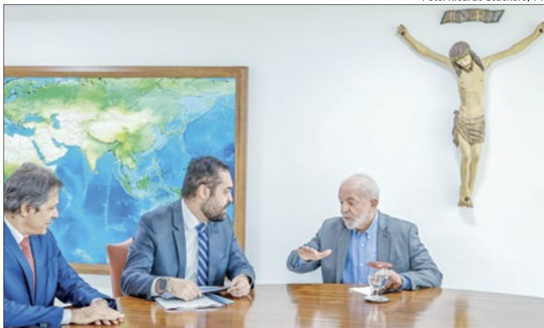
Cláudio Castro discutiu dívida do Rio com Lula e Fernando Haddad

“O ministro Haddad levou nossa proposta inicial para tentar agregar com as propostas que vai apresentar aos governadores.