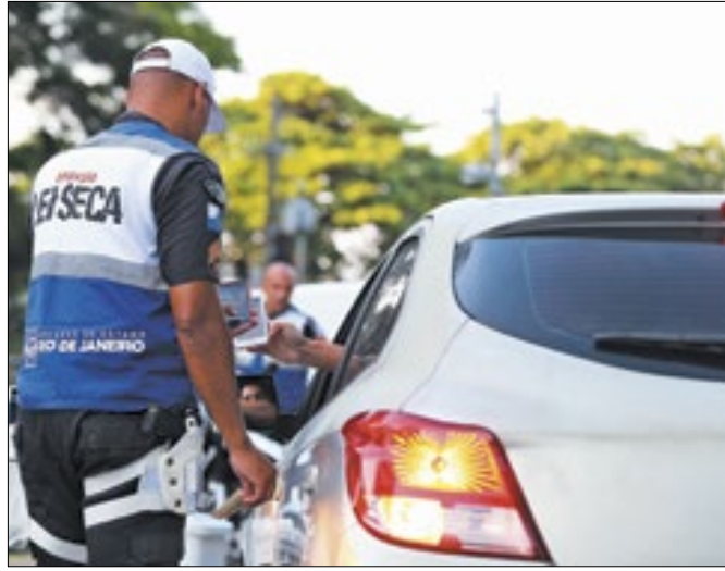
Operação Lei Seca completou 15 anos na terça-feira (19)