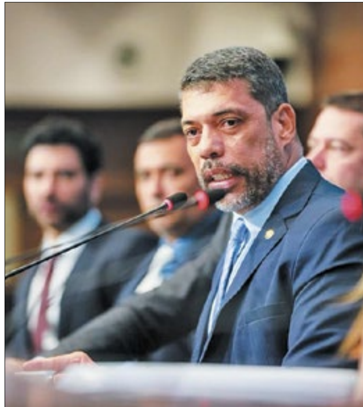
Deputado estadual quer isenção de IPVA para PCDs