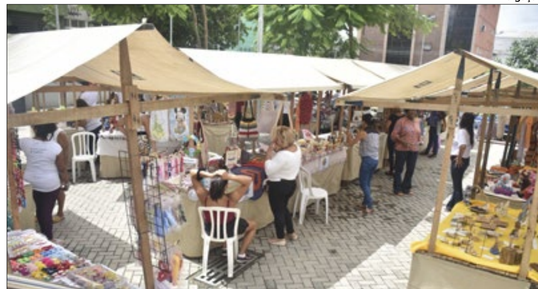
Caxias realiza programação alusiva ao Dia do Artesão

Na última terça-feira (19), foi celebrado o Dia do Artesão, e a Secretaria Municipal de Cultura e Turismo de Duque de Caxias, em parceria com os coletivos de artesanato local, está promovendo,