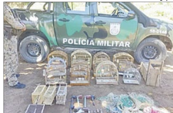
O programa Linha Verde já cadastrou cerca de 50 denúncias

Chegando no local, os agentes da 5ª UPAM puderam observar diversas gaiolas penduradas no quintal da residência. A esposa do suspeito, ao ser questionada, informou desconhecer as licenças necessárias para