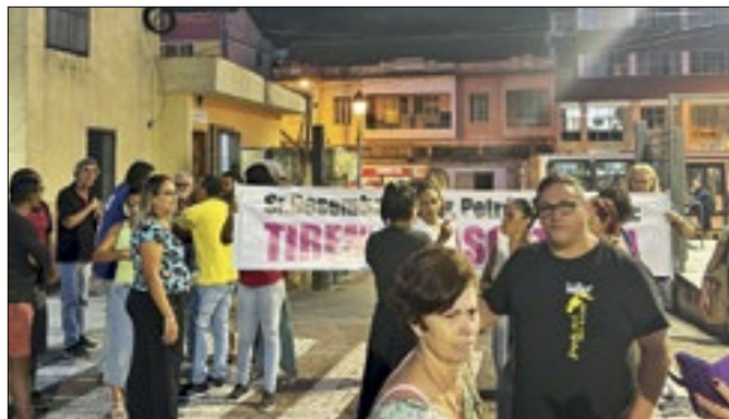
Manifestantes pedem a saída da empresa Cascatinha