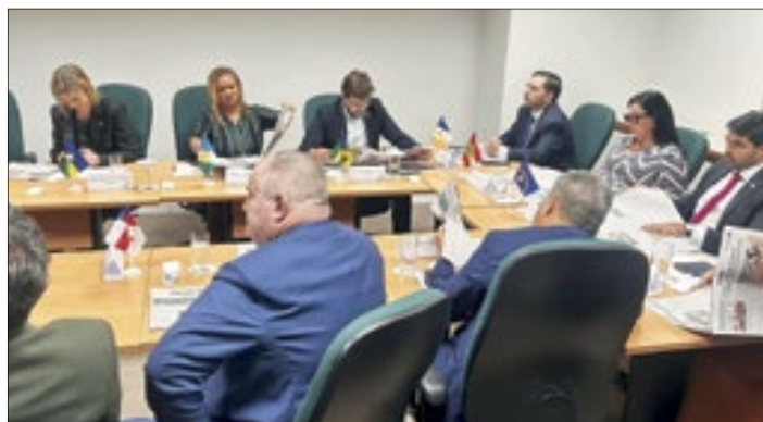
Reunião aconteceu em Brasília. Na foto, os presentes conferindo a edição Nacional do Correio da Manhã