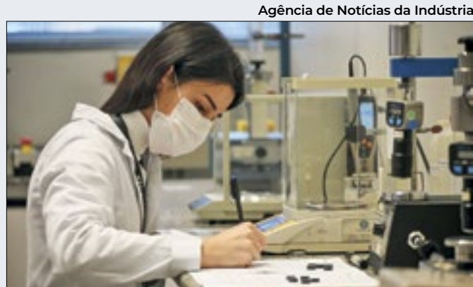
Agência de Notícias da Indústria

Embora criativa, a alternativa de compra de um item de valor relativamente baixo provocou reações negativas na Internet, em especial, de usuários da rede social X, que a associaram a necessidade financeira da varejista ao atual momento econômico crítico do país.