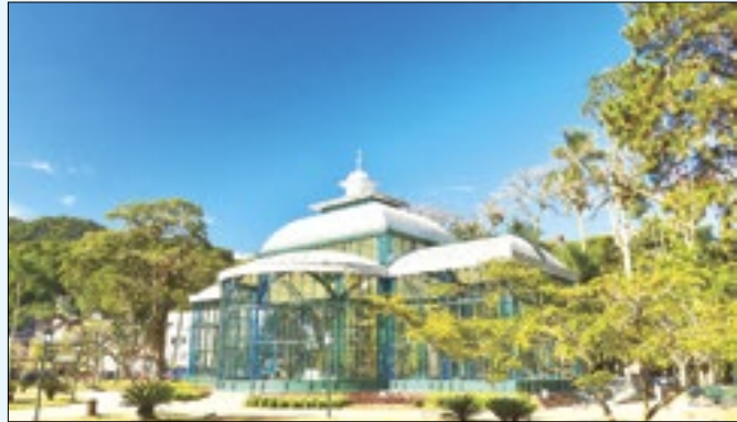
Palácio de Cristal receberá o festival em maio