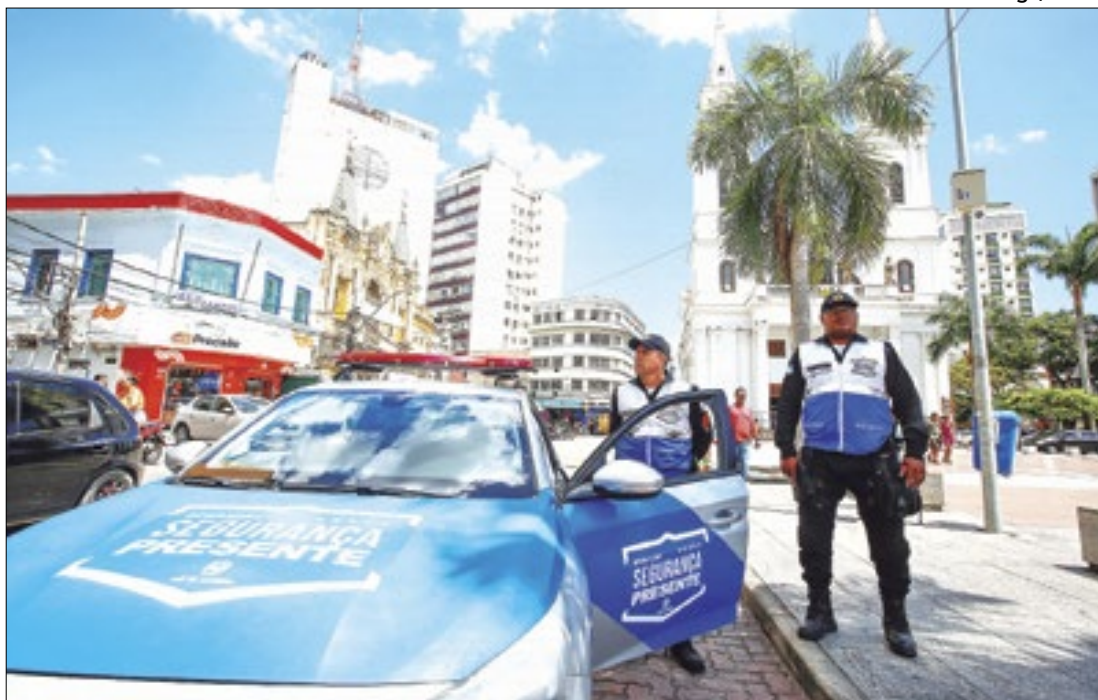
10 anos do Segurança Presente. Base localizada em Campos dos Goytacazes

No CIEE são 758 vagas para Ensino Superior e 593 para Ensino Médio, técnico e jovem aprendiz. Outras informações, no site do CIEE. Já na Fundação Mudes as vagas são nos níveis Superior, Médio e Técnico, com bolsa-auxílio, que pode chegar a R$ 2 mil.