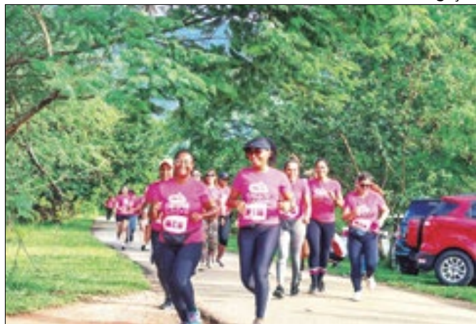
Circuito Delas terá sua terceira edição em Nilópolis