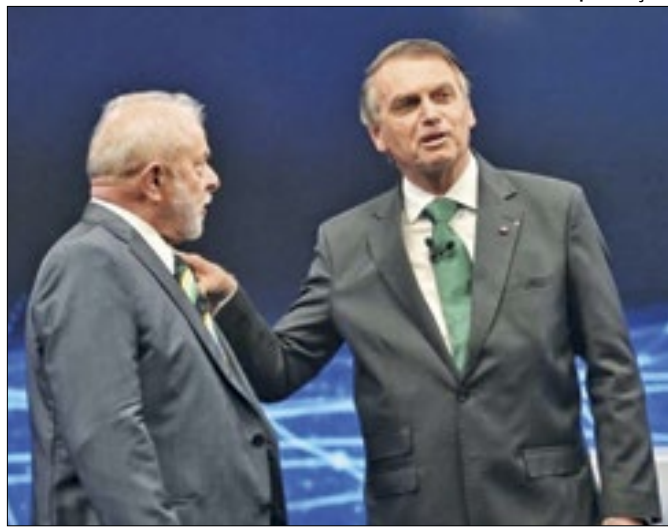
O país segue dividido entre Lula e Bolsonaro