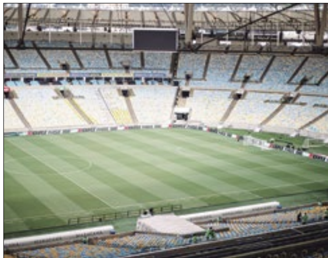
Eventos foram no jogo entre Vasco e Nova Iguaçu