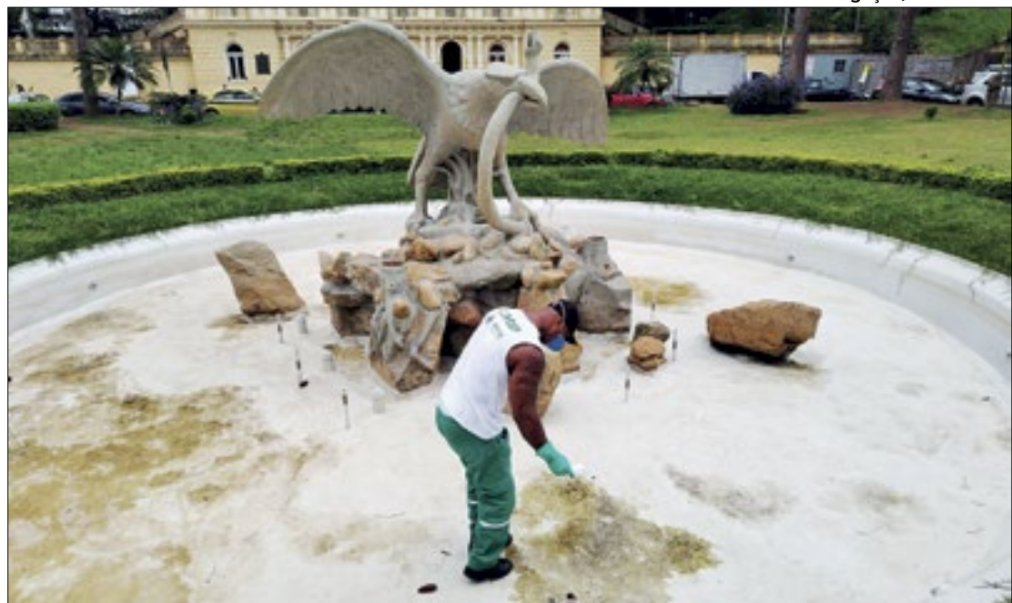
Prefeitura de Petrópolis fez ações de limpeza nos chafarizes do centro da cidade

Até esta segunda-feira (18), foram confirmadas 47 mortes por dengue em todo o estado. Em Petrópolis, são 919 casos registrados somente em fevereiro deste ano. Em março, a cidade já confirmou 23 casos. Em Três Rios, uma morte foi confirmada, com 436 casos em fevereiro. Nos municípios como Nova Friburgo foram 526 casos registrados; Teresópolis com 337; Areal com 330; Paty do Alferes com 319; e São José do Vale do Rio Preto com 171;