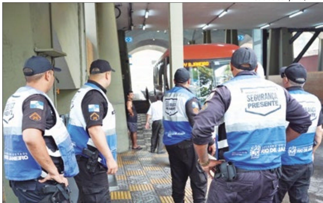
Programa do Governo do Estado atuará em conjunto com a prefeitura