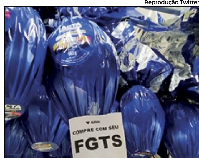
Ovo de páscoa pelo FGTS é o 'apelo' da Americanas