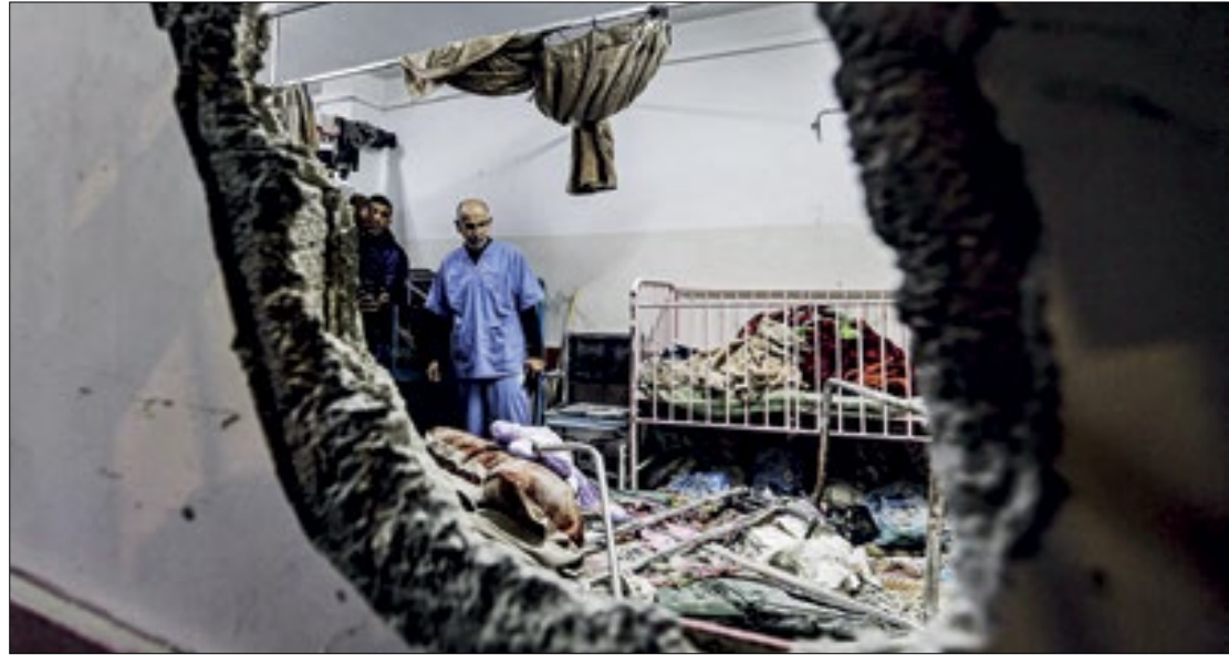
O Exército israelense alega que o local estaria sendo usado por líderes do Hamas

O Exército israelense alega que o centro de saúde estaria sendo usado por líderes do Hamas e que os soldados foram recebidos com tiros ao entrar no complexo. "As tropas respon-