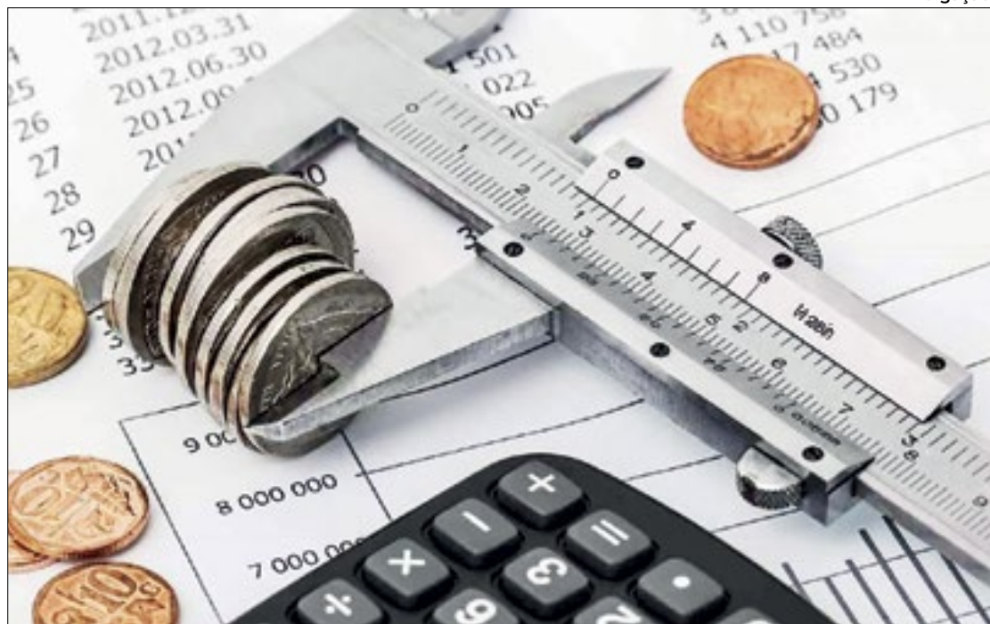
A despeito da queda da Selic, economia brasileira perde ritmo

Como fatores determinantes para a superação de