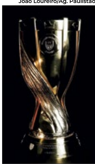
Troféu homenageia São Paulo

O campeão do Paulistão 2024 (Palmeiras, Santos, Bragantino ou Novorizontino) levará para casa uma belíssima taça nova. Inspirada pelo Troféu FIFA, da Copa do Mundo, a nova taça traz os campeões gravados na base. Banhada a ouro, o troféu mede 55 cm, pesa 13kg e tem uma porção de símbolos que remetem a São Paulo na parte superior, como o mapa do Estado e a coroa, remetendo ao Rei Pelé.