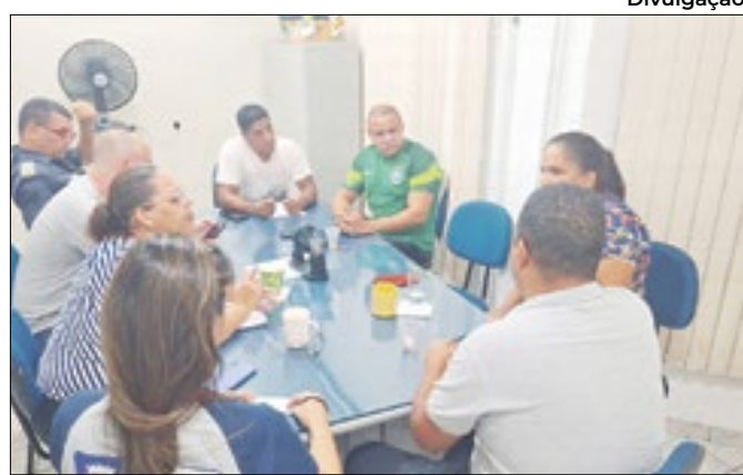
Servidores de Resende discutem pauta de campanha