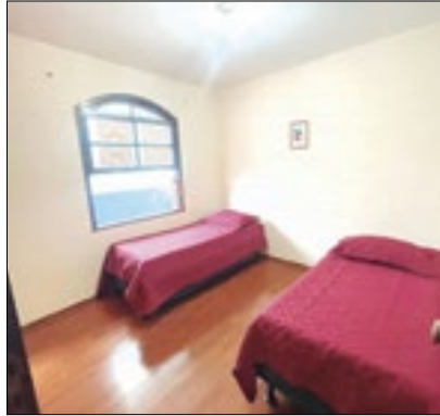
Casa passou por reforma

Após ter passado por uma obra de manutenção, com pintura e limpeza, a residência terapêutica localizada na Rua São Roque, em Olaria, já está atendendo normalmente os pacientes.