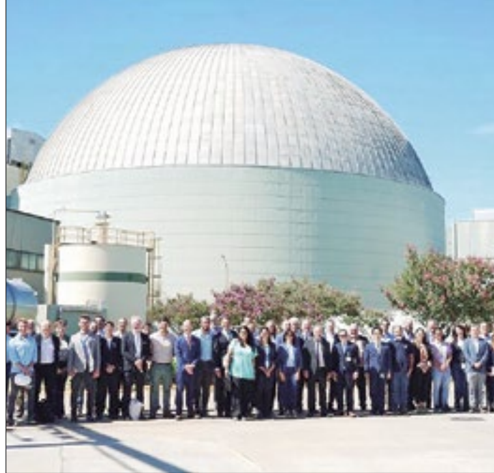
Engenheiros da Eletronuclear na usina nuclear Atucha

Localizada a 100 km a noroeste de Buenos Aires, a usina entrou em operação comercial em 1974 e sua licença de operação atual expira em 2024. Já a Unidade 2 de 745 MWe da