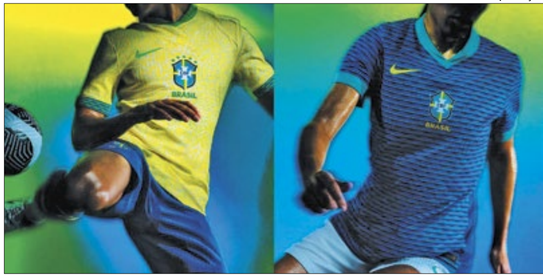
Novos uniformes da Seleção Brasileira foram apresentados, mas não agradaram

Segundo a fornecedora de materiais esportivos, o design da nova camisa amarela incor-