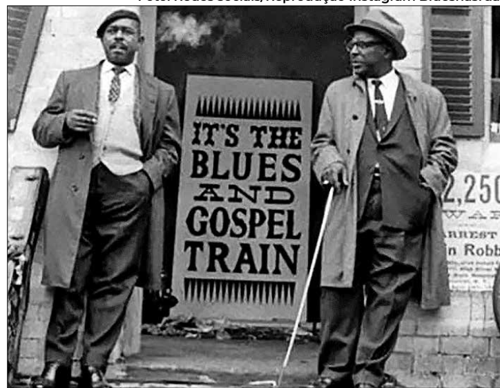
A iniciativa está arrecadando instrumentos musicais

“Estamos doando uma tuba, dois trompetes e um sax. Todos os instrumentos em bom estado, na caixa e funcionando. É de grande orgulho participar desse projeto, acreditamos que é uma semente que estamos