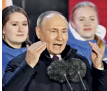
Vitória esmagadora de Putin

Revigorado politicamente pela vitória avassaladora de Vladimir Putin na eleição presidencial russa, o Kremlin rejeitou nesta segunda (18) as críticas de que