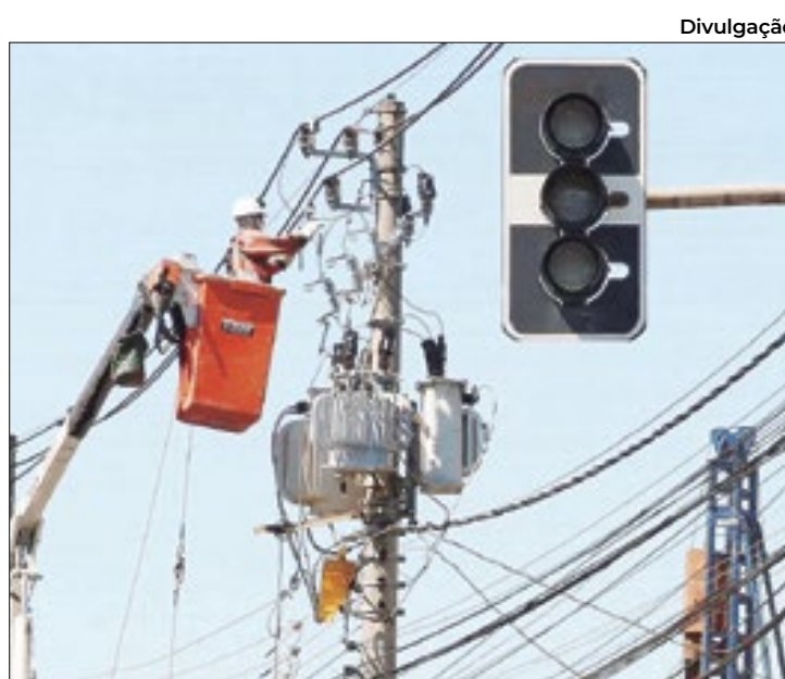
Apagões foram motivados, muitas vezes, por tempestades

Apesar da redução moderada dos incidentes, segundo a avaliação da Aneel, teria havido 'melhoria na qualidade prestação de serviço, no biênio 2022