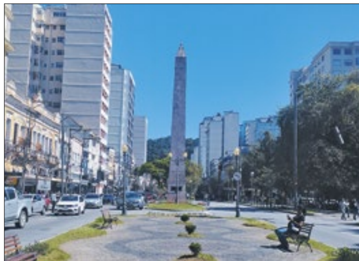
Petrópolis registrou 32°C nesta segunda-feira

O clima para os próximos dias ainda se mantém elevado no estado do Rio e na Região Serrana. Em Petrópolis seguindo os dados do Instituto Nacional de Meteorologia (INMET) a previsão para os próximos dias contará com muito calor e chuvas isoladas. Nesta quinta-feira as temperaturas variam entre máxima de 29°C e mínima de 20°C, a umidade do ar pode alternar entre máxima de 90% e mínima de 70% os ventos terão baixa