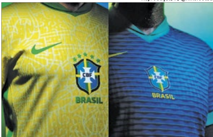
PÁGINA 7 Escudo da CBF volta a ficar no centro e não mais na lateral

A Nike divulgou o novo modelo da camisa que será utilizada pela Seleção Brasileira de Futebol na temporada. A principal mudança em relação ao modelo anterior é o escudo da CBF, de volta ao centro das camisas, depois de 20 anos. Dentro da gola, um emblema traz a inscrição “Brasil Para Todos”. A estreia do novo modelo está prevista para o próximo sábado (23), no amistoso contra a Inglaterra, em Wembley.