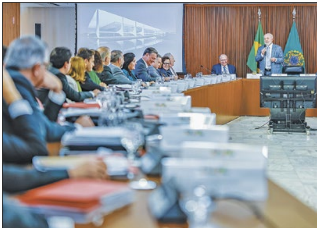
Lula quer mais resultados dos ministros do seu governo

O principal ponto criticado pelo presidente Lula são falhas na comunicação entre