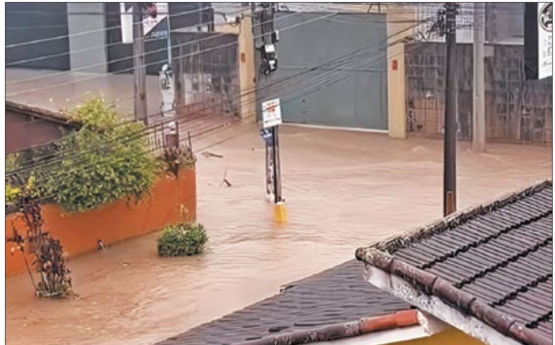
Rua Rosa Wener ficou completamente alagada durante a chuva do fim de semana

No domingo (17/03), a Defesa Civil registrou mais