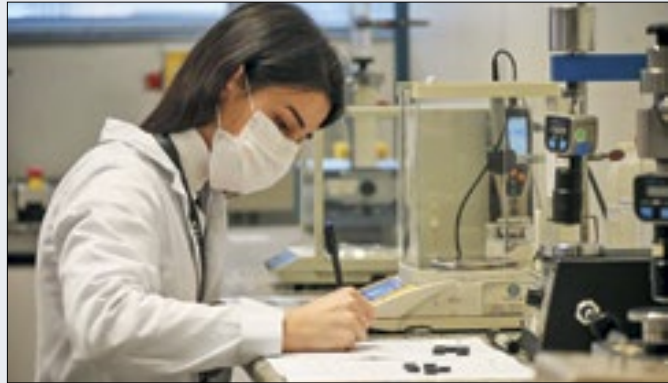
Prêmio IEL de inovação dará ênfase a inovação