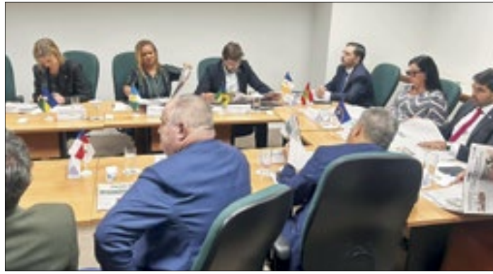
Reunião aconteceu em Brasília. Na foto, os presentes conferindo a edição Nacional do Correio da Manhã