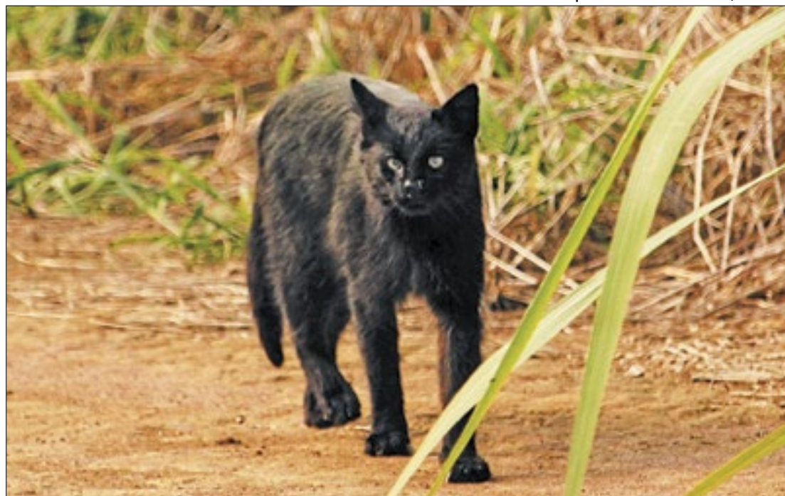
Tecnologia pode alertar os motoristas e evitar acidentes nas estradas.