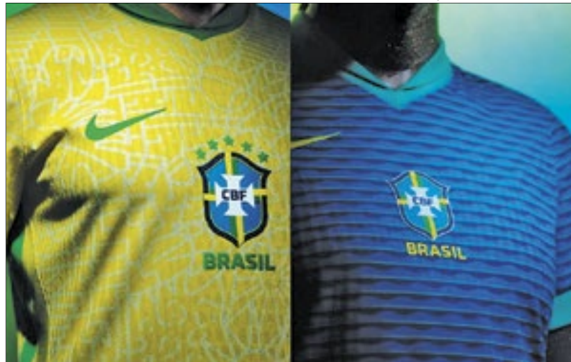
PÁGINA 8 Escudo da CBF volta a ficar no centro e não mais na lateral

A Nike divulgou o novo modelo da camisa que será utilizada pela Seleção Brasileira de Futebol na temporada. A principal mudança em relação ao modelo anterior é o escudo da CBF, de volta ao centro das camisas, depois de 20 anos. Dentro da gola, um emblema traz a inscrição "Brasil Para Todos". A estreia do novo modelo está prevista para o próximo sábado (23), no amistoso contra a Inglaterra, em Wembley.