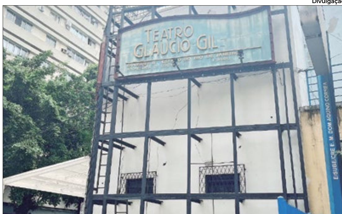
Mezanino, camarins, fachada, letreiro, banheiros, poltronas e bilheteria serão reformados

Glauco Gill será mais moderno por meio do Programa Acelera Funarj