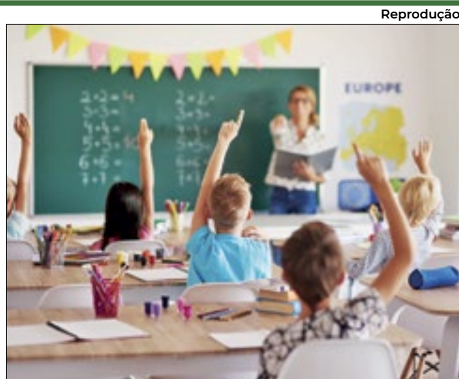
Parte não termina ensino na hora certa