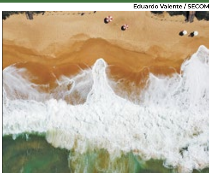
Apresentação dos resultados da Pesquisa de Verão