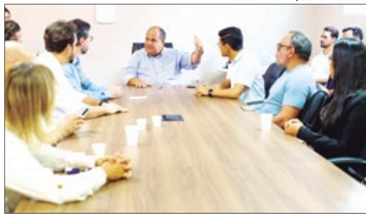
Saúde dos dois estados em intercâmbio