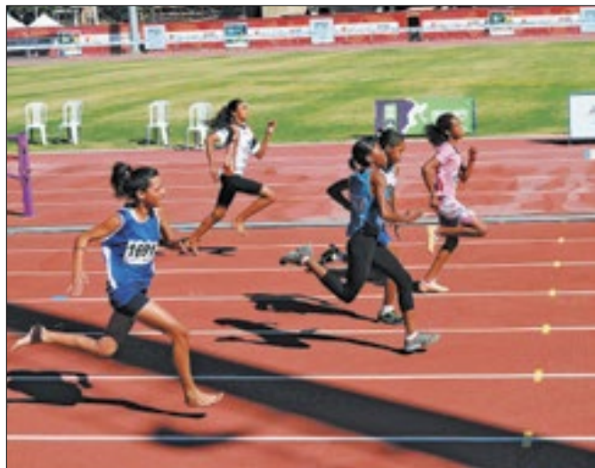
Iniciativa do governo mineiro alcança 580 municípios