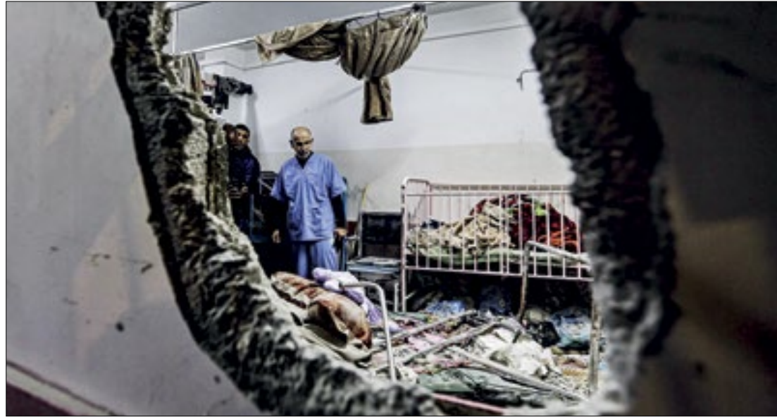
O Exército israelense alega que o local estaria sendo usado por líderes do Hamas

O Exército israelense alega que o centro de saúde estaria sendo usado por líderes do Hamas e que os soldados foram recebidos com tiros ao entrar no complexo. "As tropas respon-