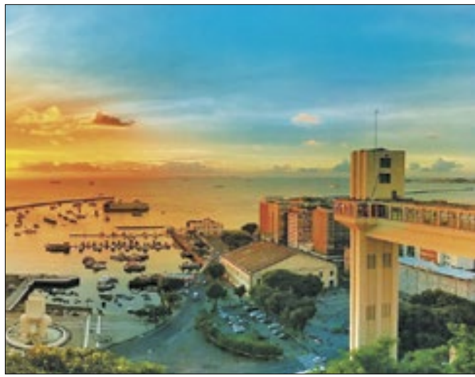
Setor de serviços foi o que gerou mais empregos