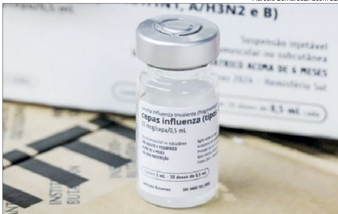
Campanha ocorrerá entre 25 de março e 31 de maio de 2024

A infecção respiratória por influenza se apresenta em formas leves ou agudas. O objetivo da estratégia de vacinação é reduzir as complicações, as internações e