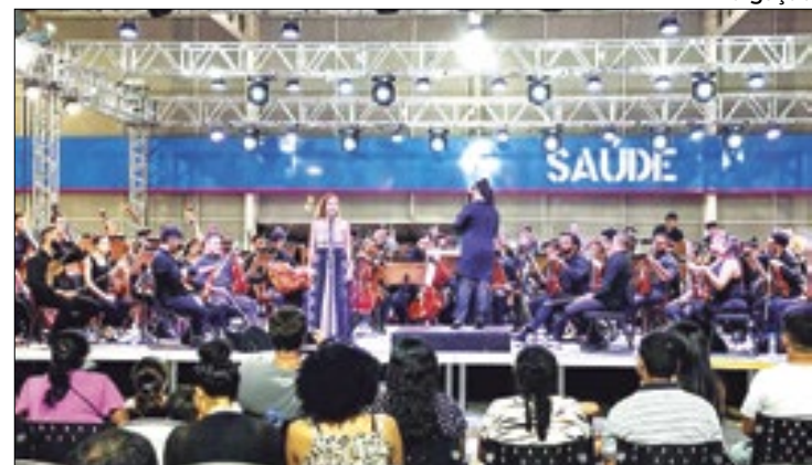
Orquestra do Theatro da Paz toca para a comunidade