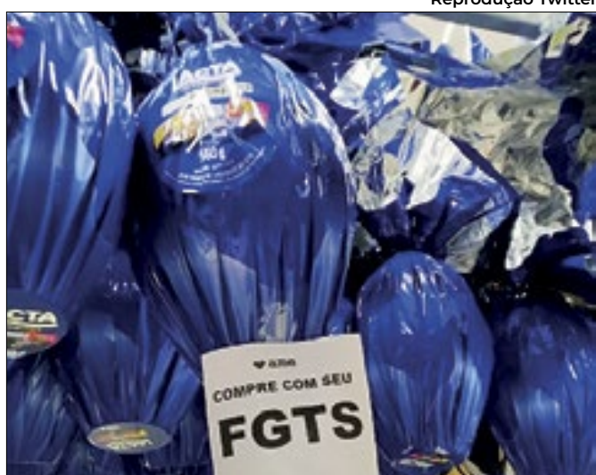
Ovo de páscoa pelo FGTS é o 'apelo' da Americanas