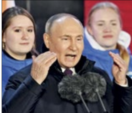
Vitória esmagadora de Putin

Revigorado politicamente pela vitória avassaladora de Vladimir Putin na eleição presidencial russa, o Kremlin rejeitou nesta segunda (18) as críticas de que