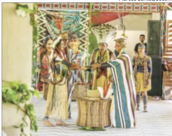
Noivos são filhos e importantes lideranças indígenas