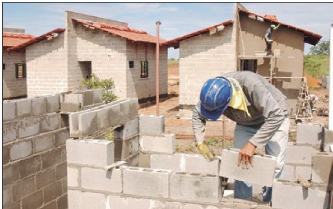
A construção civil foi o setor que mais gerou empregos em Tocantins

O estado de Tocantins teve um saldo positivo entre as admissões e os desligamentos, em janeiro deste ano. Os dados são do Cadastro Geral de Empregados e Desempregados (Caged). De acordo com o levantamento, foram contabilizadas 11.287 admissões, contra 9.840 desligamentos, o que representa 1.447 novos empregos gerados. Em relação à região Norte, o estado é o que mais gerou emprego no período avaliado, seguido do Amapá (1.203) e Amazonas (1.056).