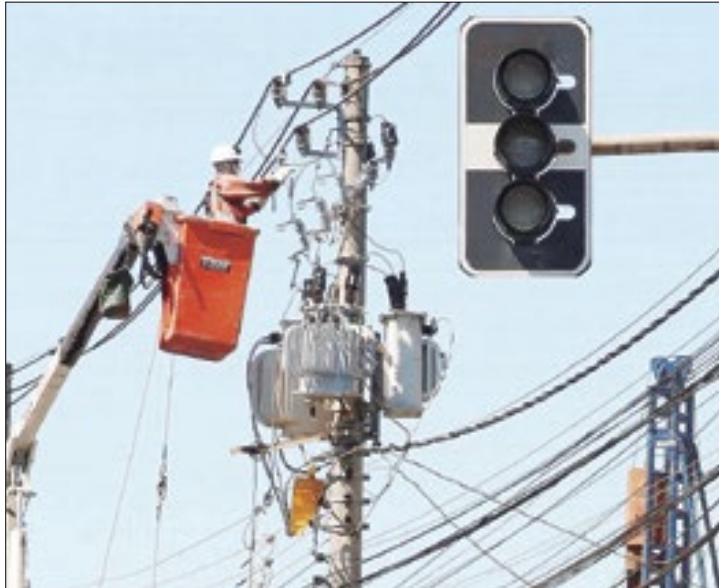
Apagões foram motivados, muitas vezes, por tempestades

Somando todos os apagões de 2023 (muito deles, provocados por tempestades), o consumidor brasileiro ficou nada menos do que 10,4 horas, em média, sem energia elétrica (correspondente a cinco cortes no fornecimento do insumo no ano), revela estudo divulgado, nesta segunda-feira (18) pela Agência Nacional de Energia Elétrica (Aneel).