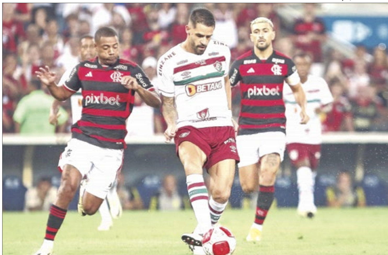
Nos últimos anos, as casas de apostas passaram a integrar o dia a dia do carioca e do brasileiro, patrocinando alguns dos principais times do país

"A Loterj mantém diálogo com todas as esferas do setor público e privado, além dos órgãos de controle, prezando um ambiente federativo e democrático", disse, em nota, a loteria do Rio. O órgão é comandado pelo advogado