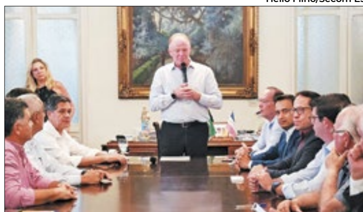
Governador Casagrande esteve na assinatura do contrato