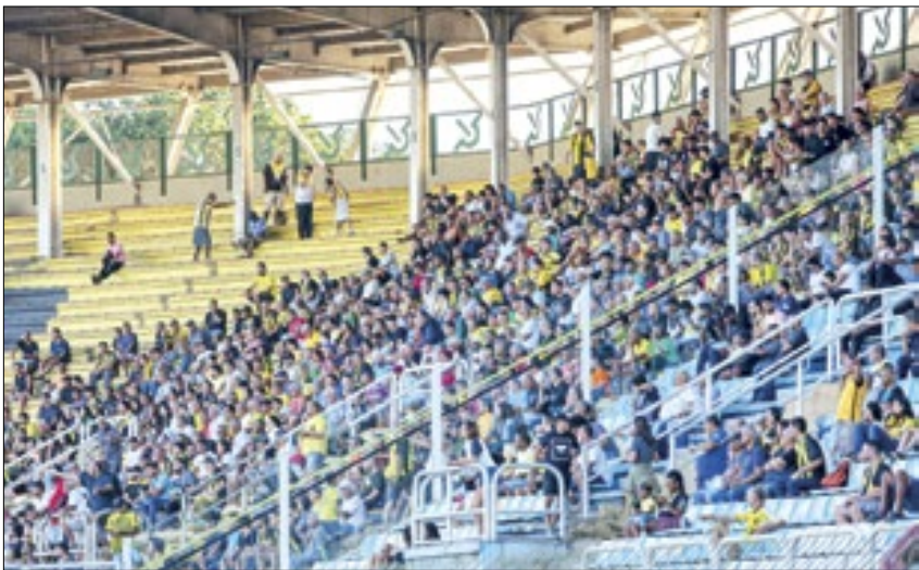
Consórcio Maracanã não libera estádio para Nova Iguaçu e Vasco

Os permissionários temporários do Maracanã, a dupla Flamengo e Fluminense, não responderam a tempo, impedindo que a semifinal do Campeonato Carioca, entre