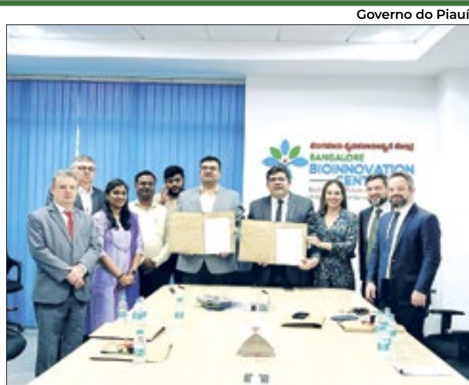
O governador visitou centro de inovação em Bangalore

Durante a reunião, foi discutida também a necessidade de aumentar o número de voos para o Nordeste e aprimorar a infraestrutura portuária e viária.