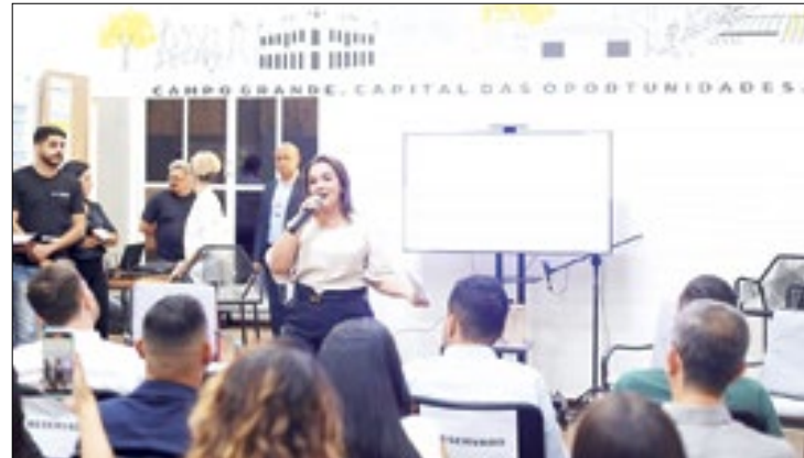
Prefeitura de Campo Grande