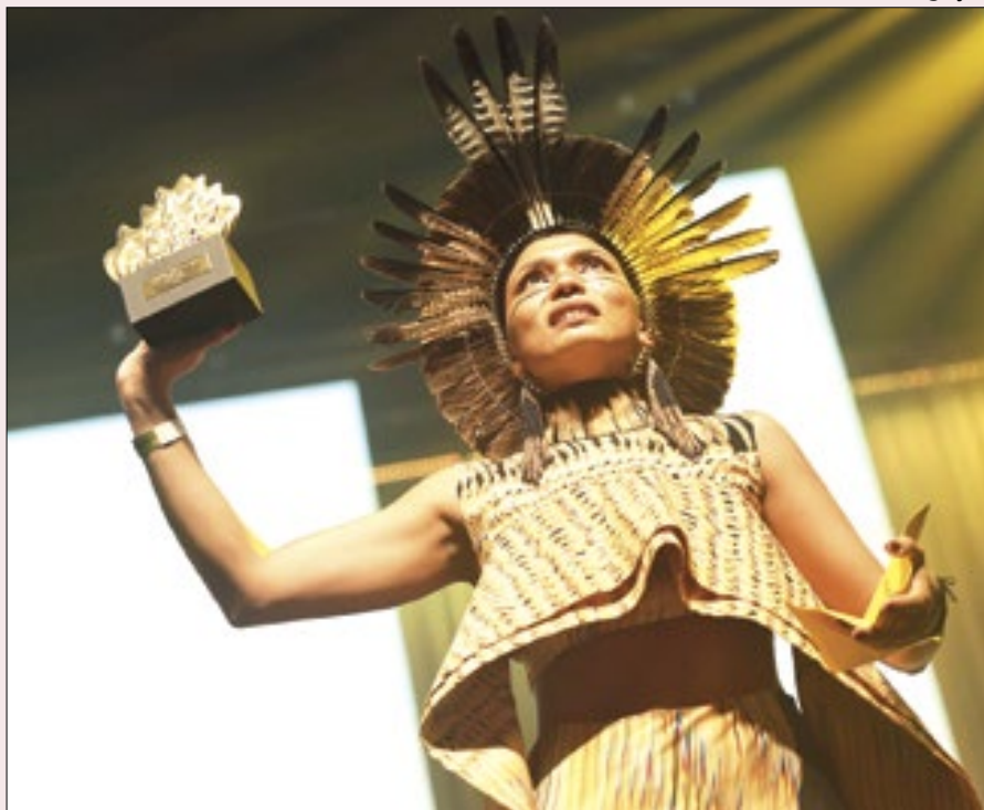
Zahy Tentehar é a primeira atriz indígena a vencer o Prêmio Shell de Teatro