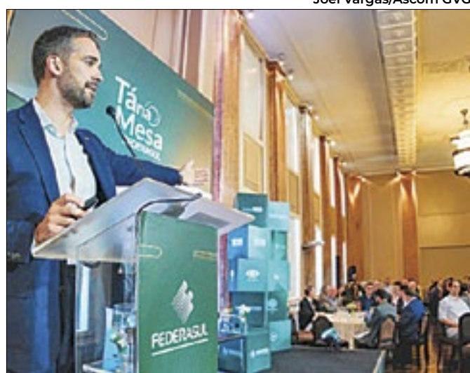
Leite explicou que os 63 setores não pagarão imposto