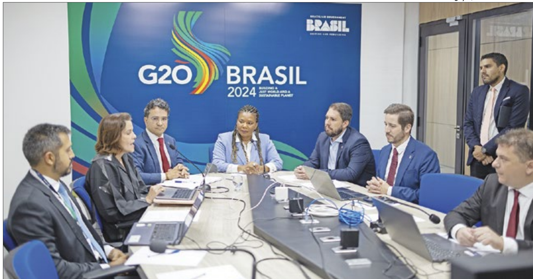
A ministra da Cultura, Margareth Menezes, coordenou a reunião virtual

O fórum pretende fortalecer o papel da cultura na promoção da igualdade na dimensão material e imaterial; e afirmar que a cultura é parte