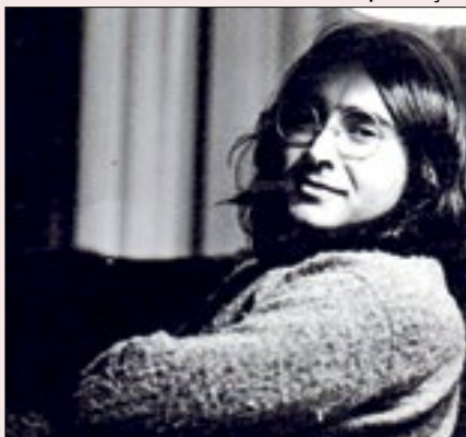
Um dos mais fecundos letrados da MPB, Cacaso (1944-1987) tem sua obra celebrada em coletânea