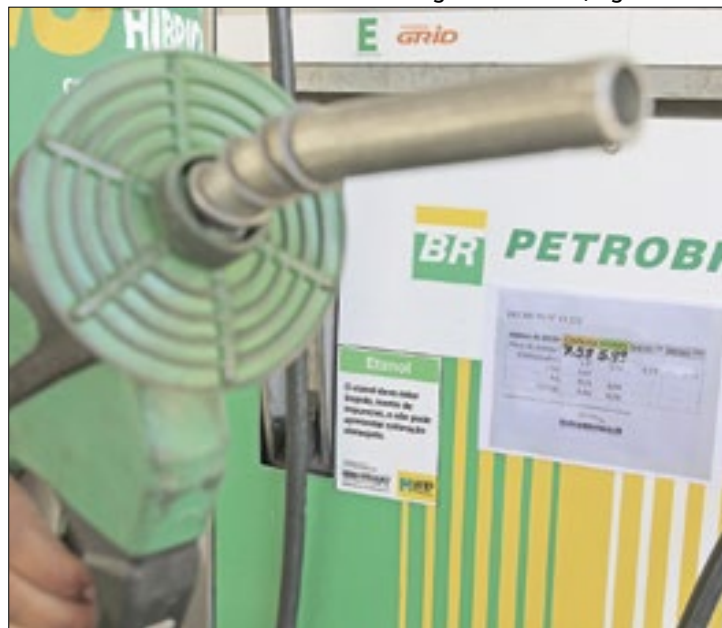
Contrários temem que qualidade do combustível diminua

O projeto cria o Programa Nacional de Combustível da Aviação, o ‘combustível ecológico’ da aviação; o Programa