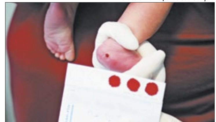
Rede contará com mais 29 serviços