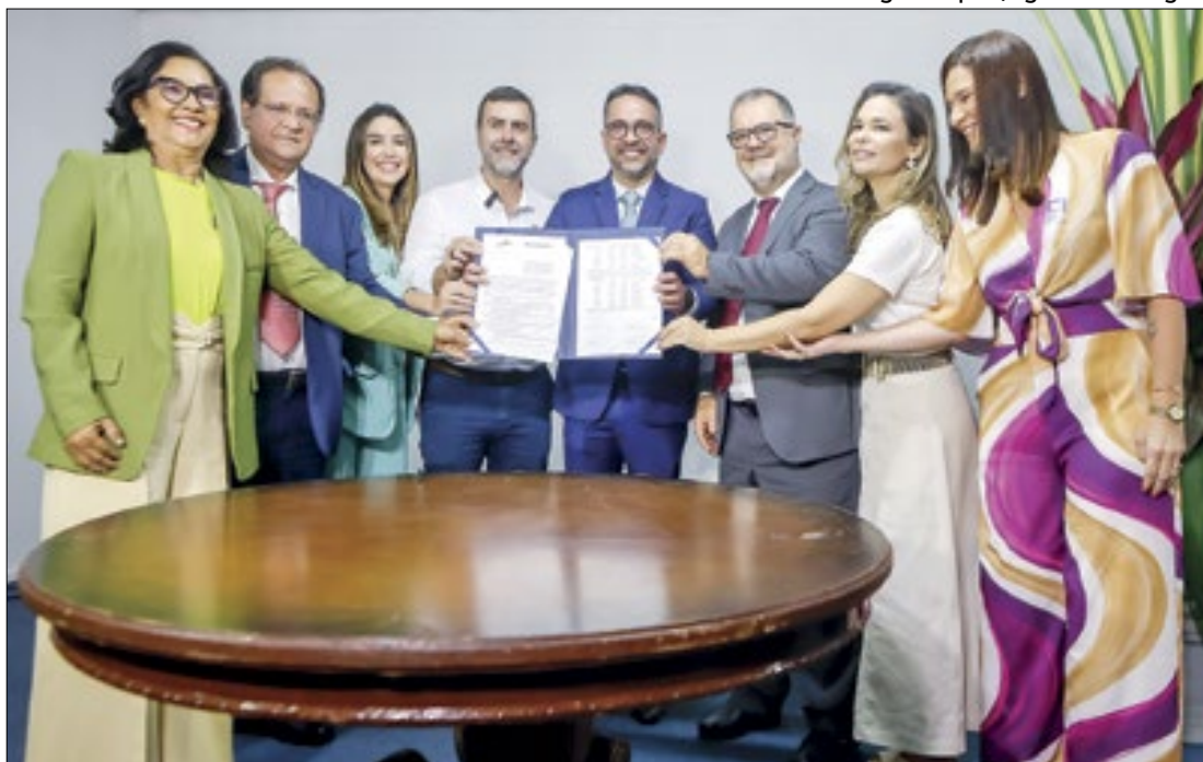
Consórcio Nordeste e Embratur firmam acordo para impulsionar o turismo e economia

Em reunião em Maceió (AL), o Consórcio Nordeste e a Agência Brasileira de Promoção Internacional do Turismo (Embratur) firmaram um Acordo de Cooperação Técnica com o intuito de fortalecer o turismo na região Nordeste.