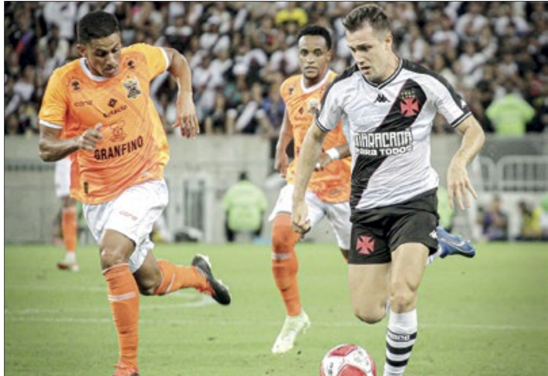
Permissionários temporários não respondem e Nova Iguaçu x Vasco não será na capital

O UOL apurou que o governador do Rio de Janeiro, Cláudio Castro, também não gostou da frase na camisa. Flamenguista, o político chegou a tomar partido