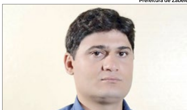
Prefeitura de Zabelê

Segundo o professor, as novas divisões terão um impacto significativo nas definições de áreas de preservação, garantindo que cada linhagem felina seja adequadamente protegida.