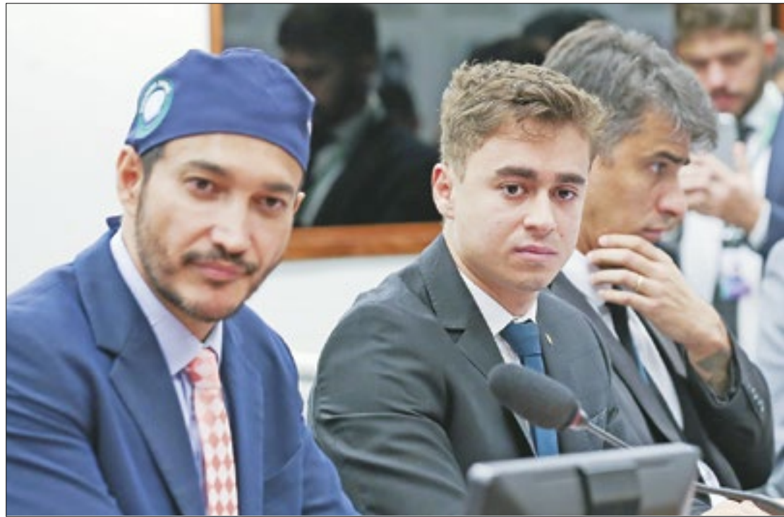
Um Nikolas light na estreia na Comissão de Educação

Nesta quarta-feira (13), o colegiado aprovou um convite ao ministro da Educação,