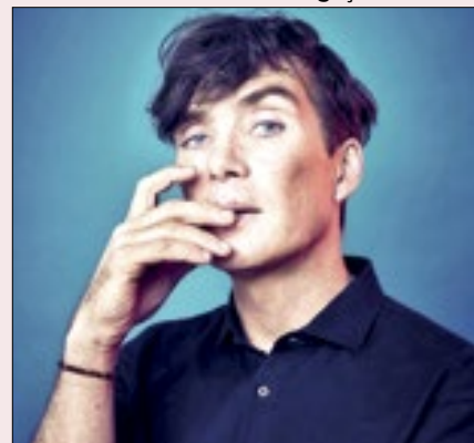
Astro de 'Oppenheimer', o irlandês Cillian Murphy atrai holofotes para um drama sobre delitos da fé