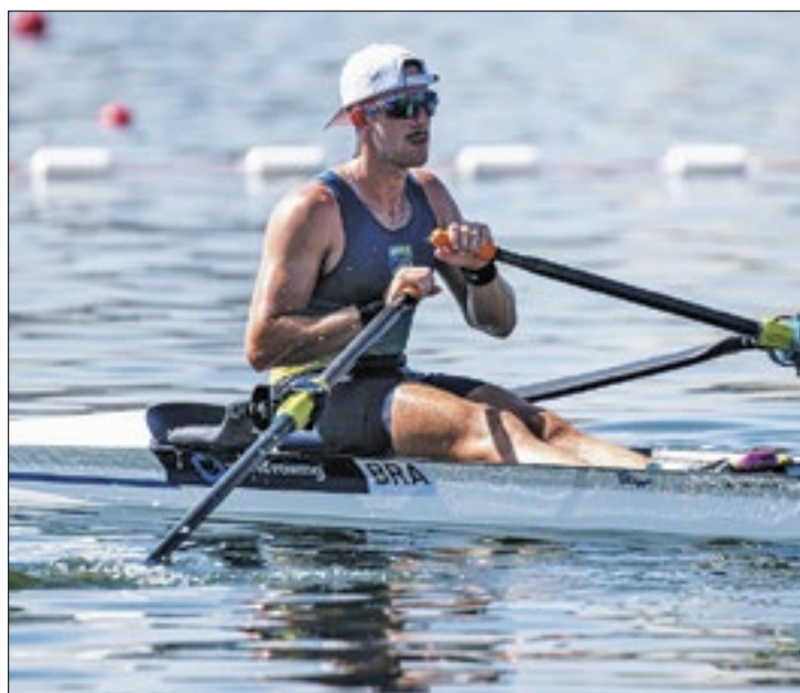
Brasileiros buscam vagas para os Jogos de 2024

Nesta edição do evento garantem vagas nos Jogos Olímpicos de Paris os cinco primeiros colocados nas provas de single skiff e os dois primeiros nas competições de double skiff peso leve. Porém, cada país poderá competir com apenas um barco por regata e obter até duas vagas para ir à França (países que já conquistaram uma vaga terão direito apenas a classificar mais uma