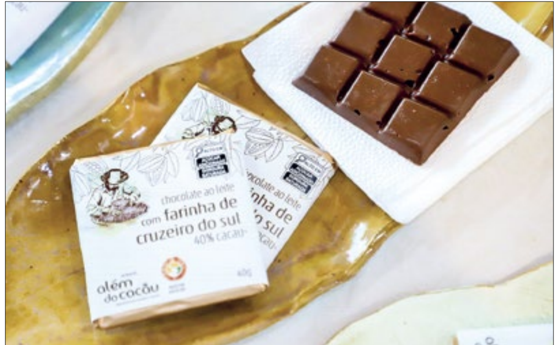
Durante o Exporta Mais Amazônia ficou acordado o envio das unidades aos EUA

Cada barra de chocolate possui 40 gramas. O alimento foi idealizado pela empresa acreana Além do Cacau e, de acordo com o empresário Leandro Brasil, busca unir ingredientes de outras cadeias de produção. No caso da empresa