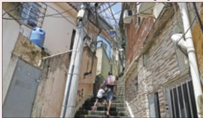
Visão conservadora protege nas favelas