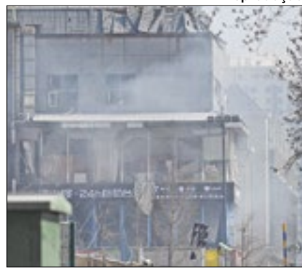
Duas pessoas morreram

Dois pessoas morreram e ao menos 26 ficaram feridas após uma forte explosão destruir um restaurante na província de Hebei, na China, espalhando destroços