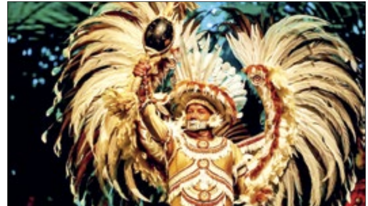
Evento tem alegorias cênicas, danças e cantos indígenas