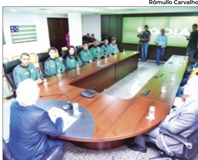
Lutadores participaram do Construindo Campeões