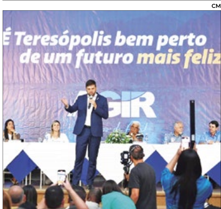
Anúncio foi feito em evento realizado no município