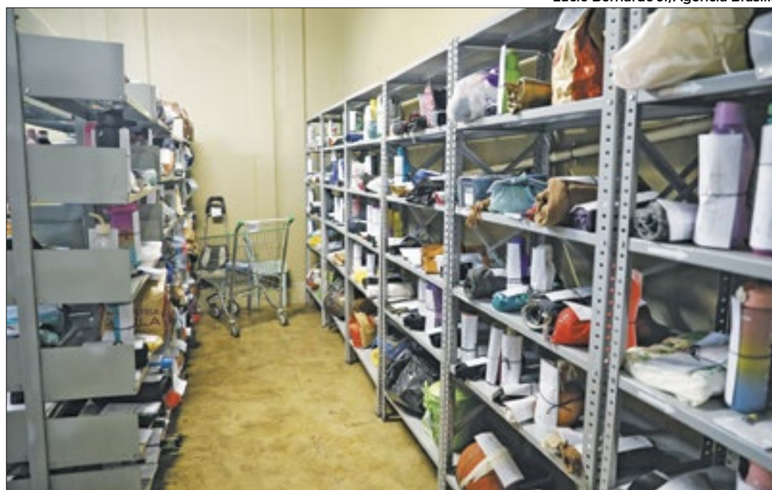
Entre os objetos, estão bengalas, mochilas, chaves e até dentaduras

Mais de 160 mil pessoas pegam o transporte diariamente