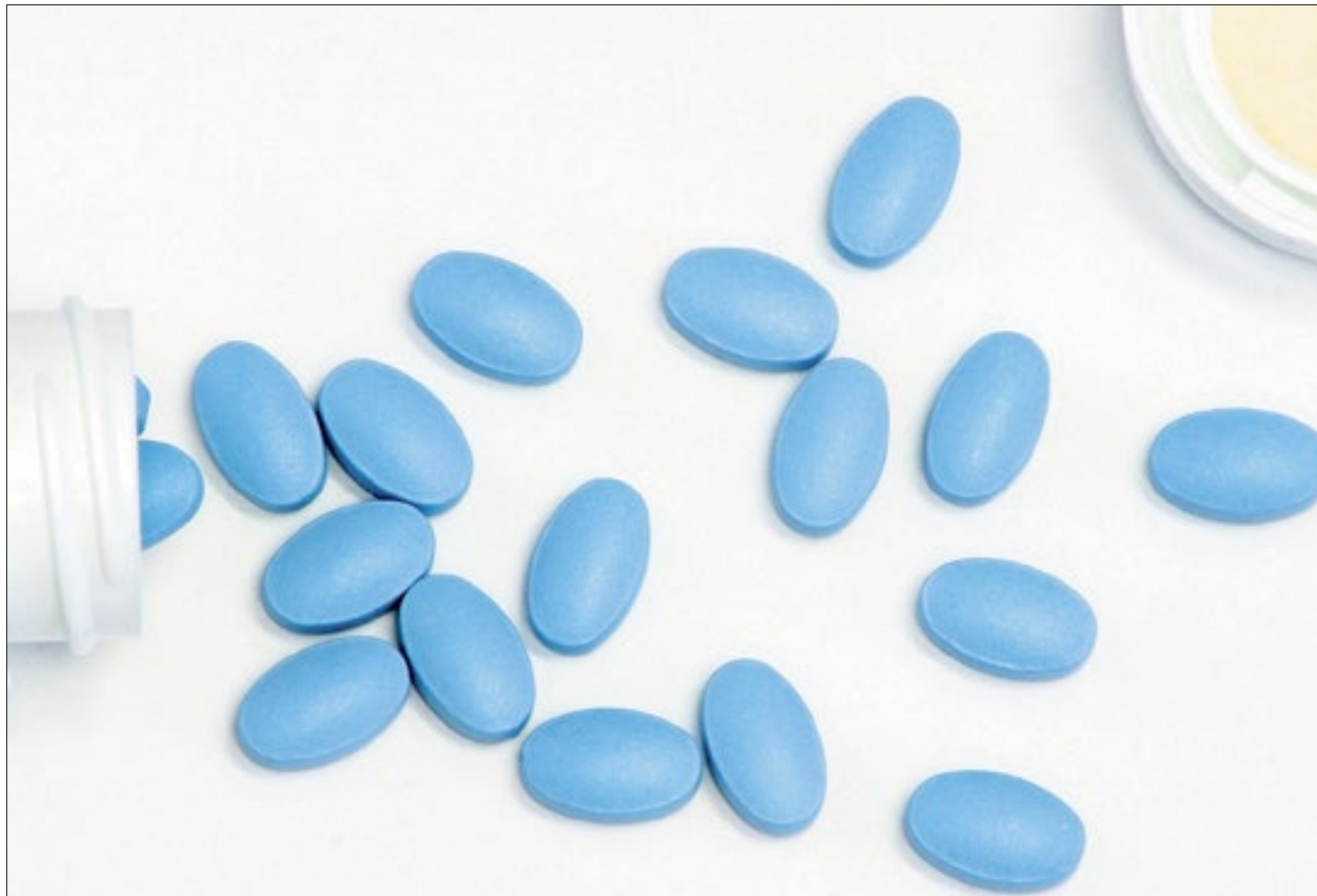
Contrato previa a produção conjunta de Viagra entre EMS e laboratório do doleiro