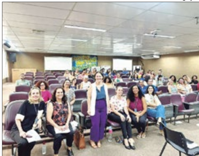
Encontro de gestores da Semas Vitória