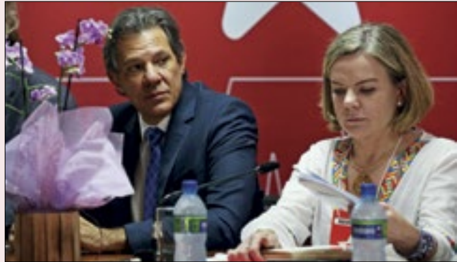
Haddad tem sido alvo preferencial de Gleisi