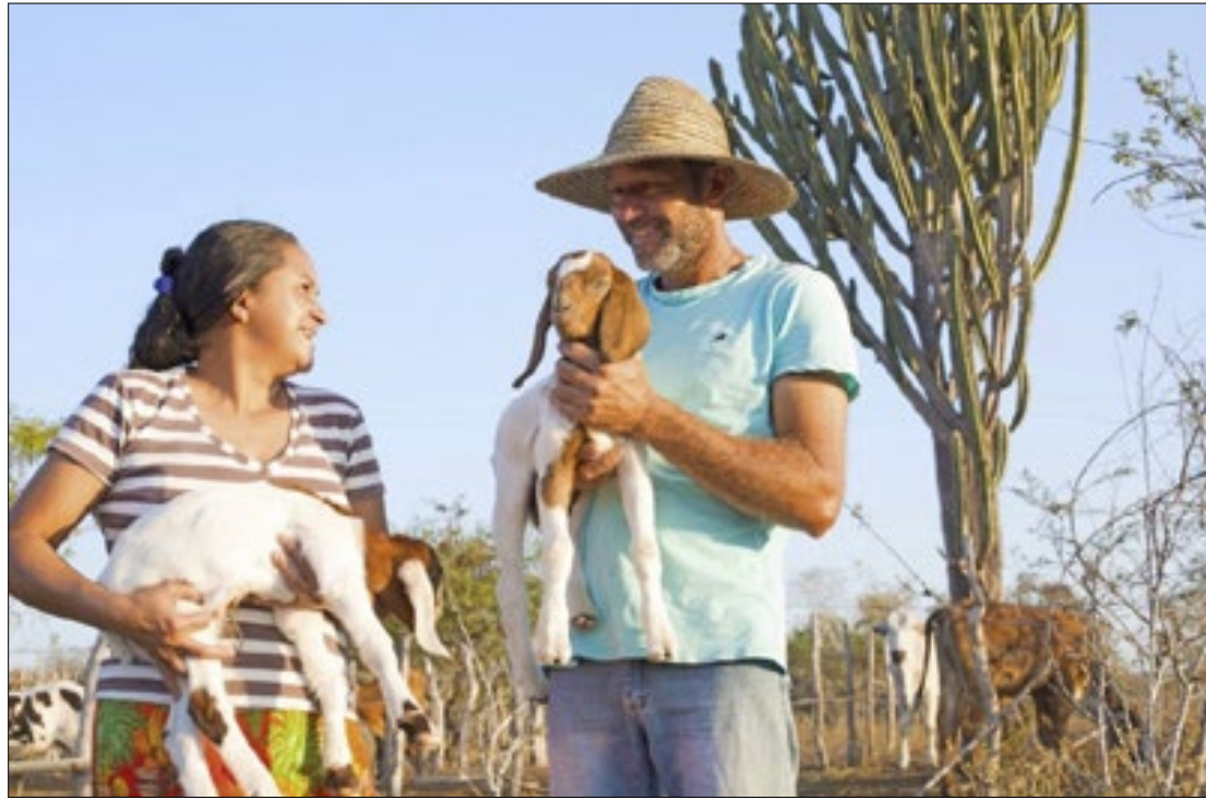
Projeto foi eleito pelo Fundo Internacional de Desenvolvimento Agrícola

O Pró-Semiárido é reconhecido por sua abordagem participativa e metodologias inovadoras, incluindo o levantamento das necessidades das famílias agri-