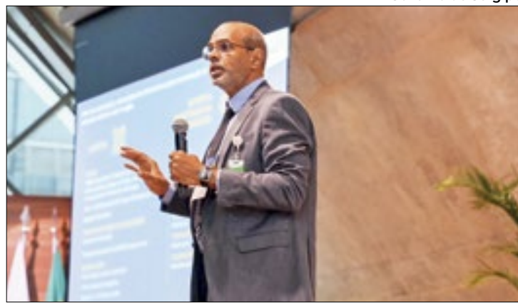
Mitidieri cobrou a Petrobras a continuidade do programa