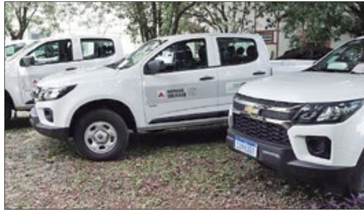
Novos carros vão permitir melhores condições aos servidores