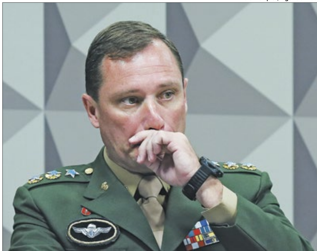
Mauro Cid confirmou detalhes que a PF já investigara

Além disso, o depoimento de Freire Gomes também confirma que o próprio ex-presidente convocou a reunião no