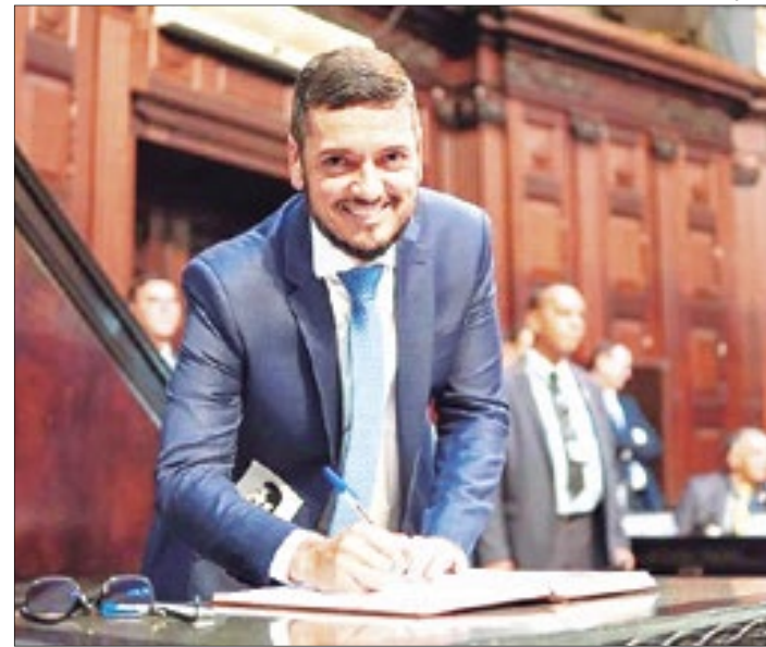
O deputado estadual é o atual presidente da Alerj

Já também confirmaram presença o ex-prefeito de Salvador ACM Neto; o atual prefeito da cidade, Bruno Reis; os ministros Celso Sabino (Turismo) e Juscelino Filho (Comunicações); os senadores Efraim Filho e Davi Alcolumbre, Carlos Portinho e Romário; o líder do partido na Câmara, Elmar Nascimento, e uma infinidade de outros deputados federais.