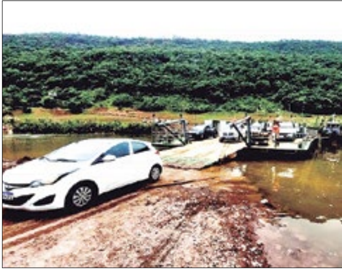
A balsa funciona todos os dias, das 6h às 20h