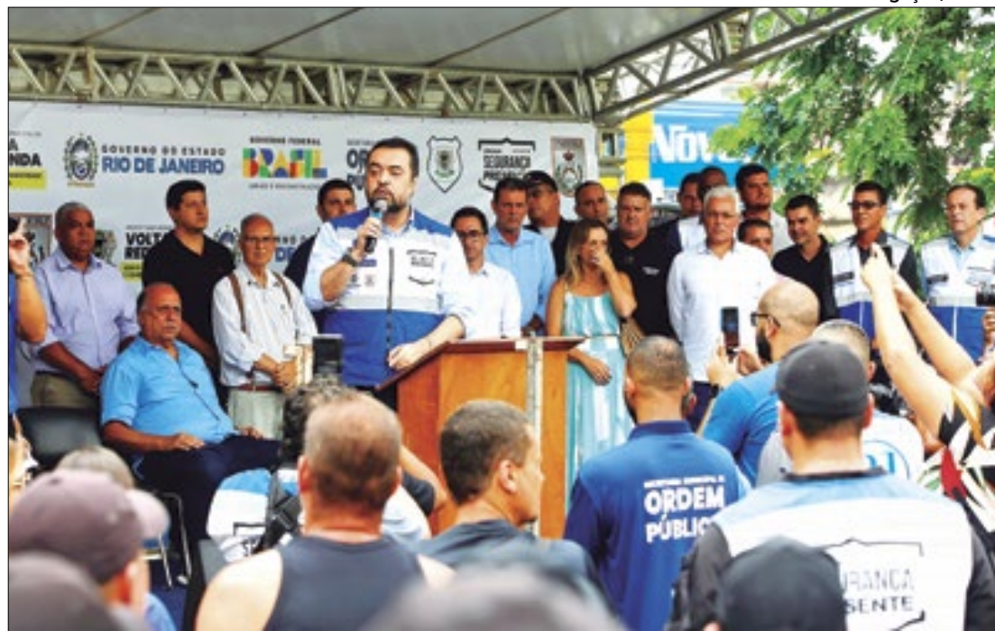
Investimentos do Governo na cidade têm ajudado a reduzir a criminalidade na região

O governador do Rio de Janeiro, Cláudio Castro, entregou, nesta terça-feira (12), ao lado do prefeito de Volta Redonda, Antônio Francisco Neto, 15 novas viaturas que passam a integrar as forças de segurança do município mais populoso do Médio Paraíba, com mais de 450 mil habitantes. Os veículos vão reforçar a Operação Segurança Presente e o Programa Estadual de Integração na Segurança (Proeis), além da Secretaria Muni-