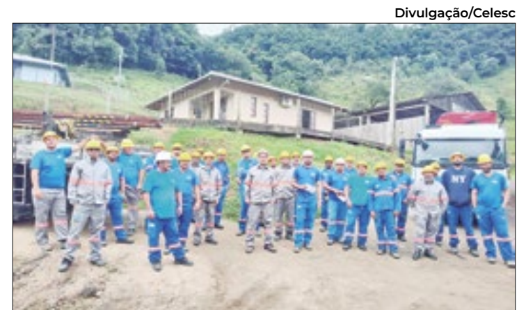
Celesc inicia implantação de rede trifásica