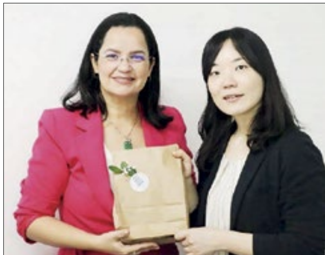
Parceria busca cooperação técnica em diversas áreas.