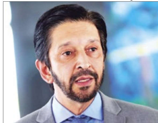
Prefeito quer evitar nacionalização da disputa