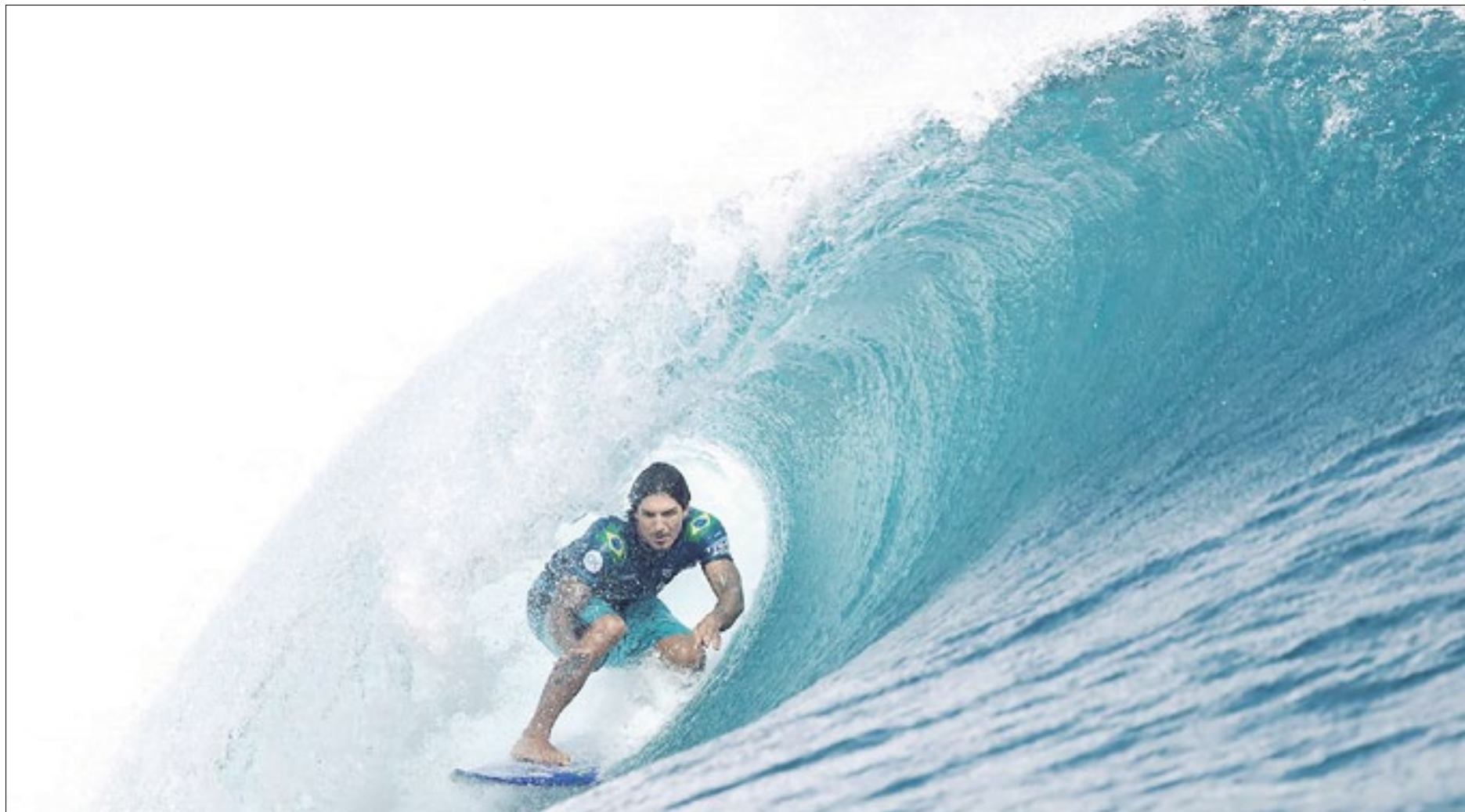
O brasileiro Gabriel Medina é considerado um especialista do surfe nas águas de Teahupoo, o ‘mar dos crânios quebrados’

“É um lugar extremamente perigoso. Os surfistas que nesta terça-feira (12) competem por lá estão acostumados. Eles vêm de um treinamento crescente. A minha maior preocupação é com os surfistas que vão surfar talvez pela primeira vez essa onda, surfistas que se classificaram em outras condições de mar e de repente vão ter que encarar aquela onda”,