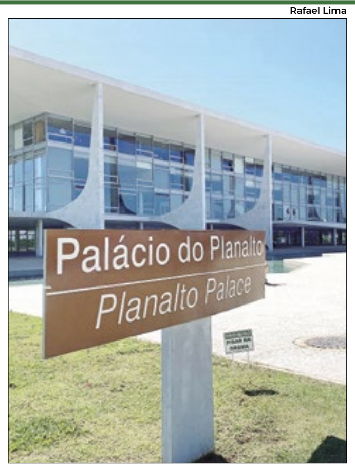
Planalto precisa olhar melhor para a economia