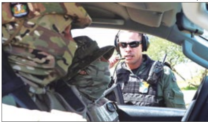
Diminuição foi de 22,6% em comparação entre 2022 e 2023