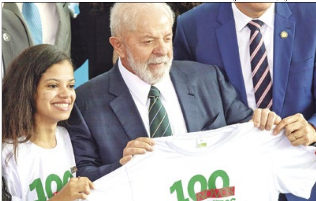
Governo expandirá rede federal de ensino do país com 100 novos campi