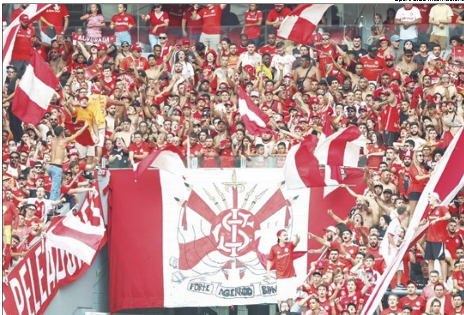
Dirigentes do Inter apostam no maior número de sócios de sua história para reforçar elenco e arrecadar ainda mais

O percentual de inadimplentes também caiu. Hoje, fica perto de 15%, mas com o andamento da temporada