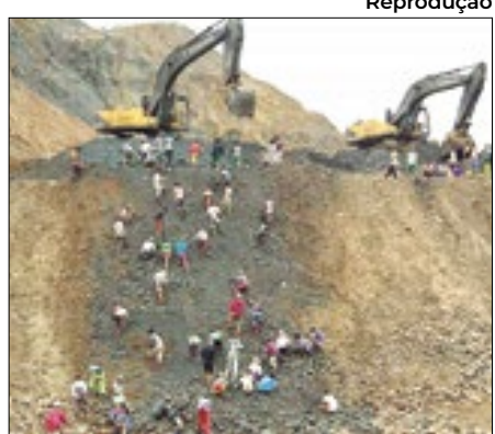
Há desaparecidos na Mina

Uma pessoa morreu e outras quatro ficaram feridas no rompimento de um tanque de rejeitos em uma mina de jade em Mianmar nesta terça-feira (12).