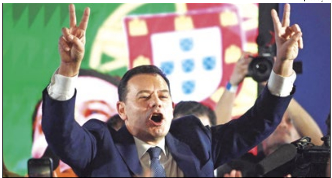
Luís Montenegro, líder da Aliança Democrática, comemora vitória nas eleições de Portugal

A exclusão da terceira força política mais votada complica significativamente o arranjo do Executivo à direita. A sigla populista obteve mais de 18% dos votos e garantiu 48 deputados, quadruplicando as dimensões da atual bancada, que tinha 12 representantes.