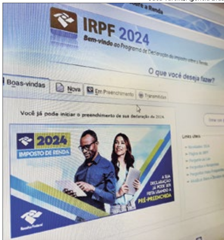
Projeto aprovado aumenta faixa de isenção do IR

turo a isenção de chegar a R$ 5 mil, promessa de campanha do presidente Luiz Inácio Lula da Silva (PT).