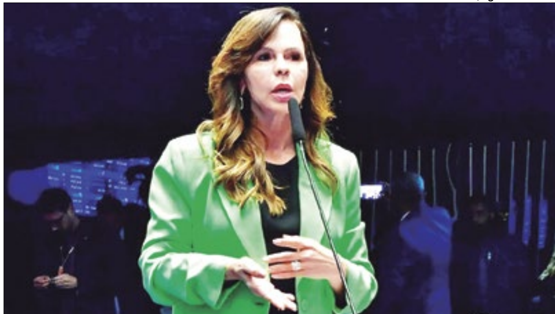
Dorinha esclareceu importância da “educação integral”

“No ano passado, nós votamos um programa do governo federal de escola em tempo inte-