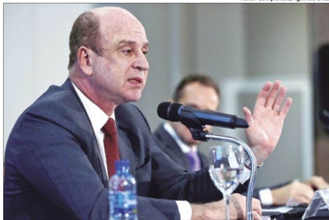
Decisão de Zymler é exemplar ao exigir transparência para parcerias com farmacêuticas

O segundo problema está em como justificar aumento do preço baseado na transferência de tecnologia diante do longo prazo estabelecido nas parcerias. Nos acordos para a eventual co-