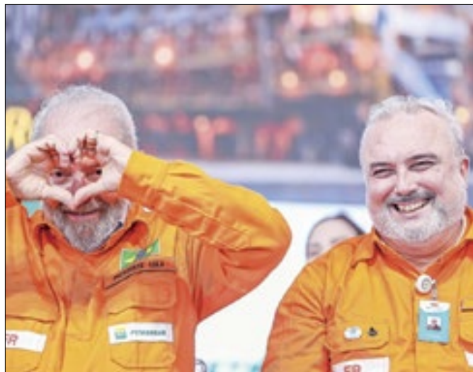
Lula e Prattes: nem só de amor vive um governo