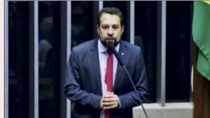
Adversário de Nunes, Boulos tem o apoio de Lula