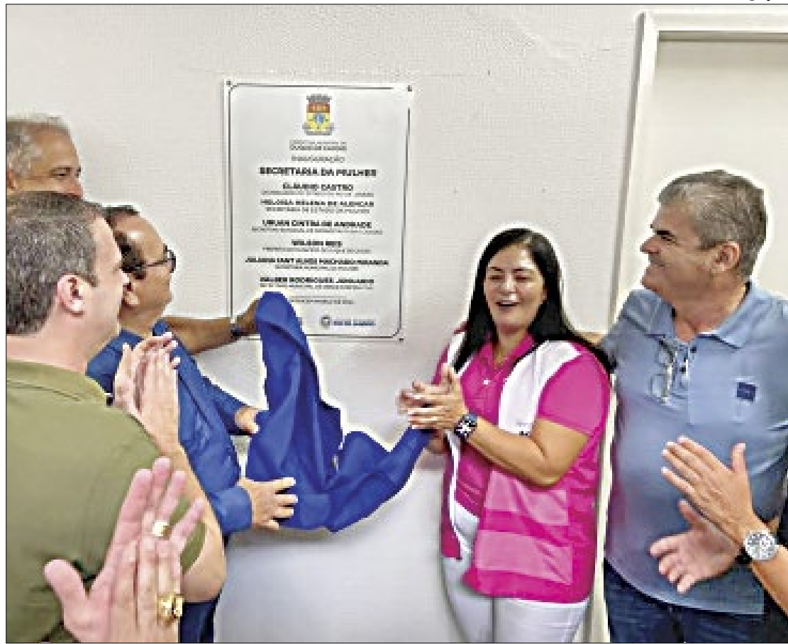
Sede da secretaria da Mulher de Caxias foi inaugurada no último sábado (09)

A gestora da pasta também reforçou que a violência contra a mulher é identificada pelas atitudes contra todas as faixas etárias, econômicas e étnicas. "Qualquer ato ou conduta baseada no gênero, que cause morte, dano ou