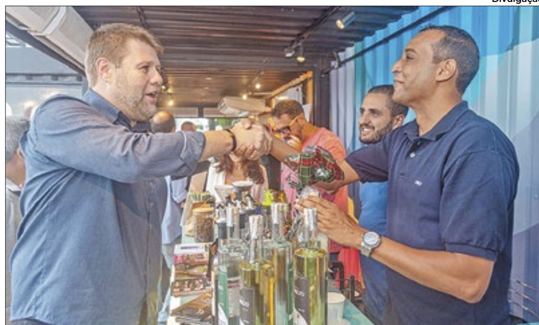
Tutuca cumprimenta um dos produtores de cachaça em evento de Conservatória

A solenidade de assinatura teve a presença do secretário de Estado de Turismo do Rio de Janeiro, Gustavo Tutuca; do secretário de Estado de Agricultura, Pecuária, Pesca e Abastecimento do Rio de Janeiro, Flavio Campos; da subsecretária de Desenvolvimento Econômico, Marina Esteves; do