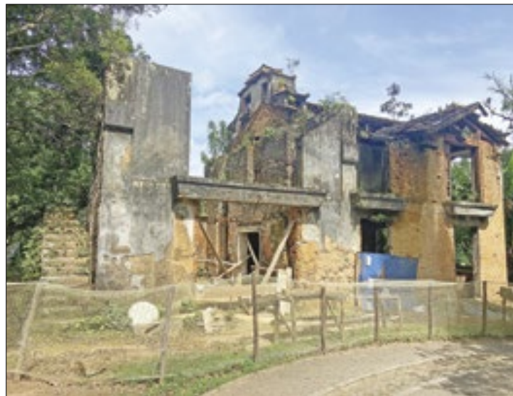
Ruínas do Parque Natural Municipal Padre Quinha

"Compreendemos que os planos de obras ao qual o público teve acesso, além de estarem em ilegalidade frente às Normas de Acessibilidade (NBR9050) atualizadas em 2020 e obrigatórias para o tipo de edificação de uso público pretendida, fere também princípios primordiais em relação aos esforços de preservação do patrimônio histórico e cultural", afirma o documento.