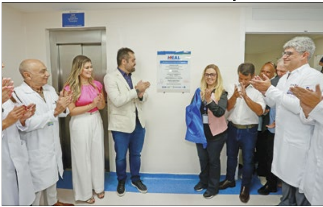
Governador Cláudio Castro inaugurou a nova maternidade do Hospital Azevedo Lima

Quissamã já aprovou e sancionou a lei que proíbe a contratação de pessoas condenadas pela Lei Maria da Penha para cargos de concurso, comissão e terceirização no município. A campanha Quissamã Protege: Não à violência contra a mulher, foi criada no município em 2023.