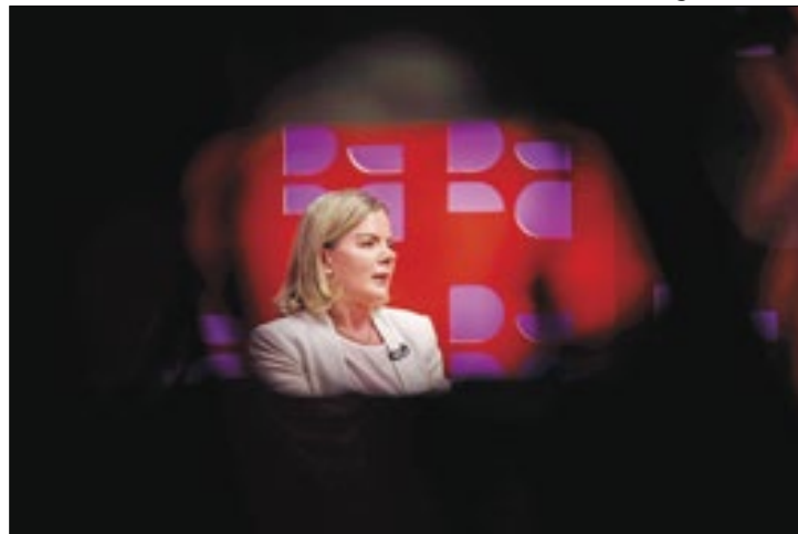
Para Gleisi, extrema-direita é o grande adversário de Lula

desprezando Bolsonaro, nós vamos vencer o bolsonarismo", afirmou Gleisi.