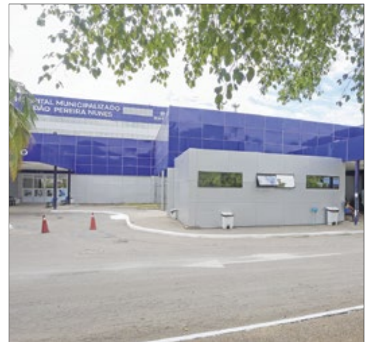
Espaço conta com 23 leitos com equipamentos modernos