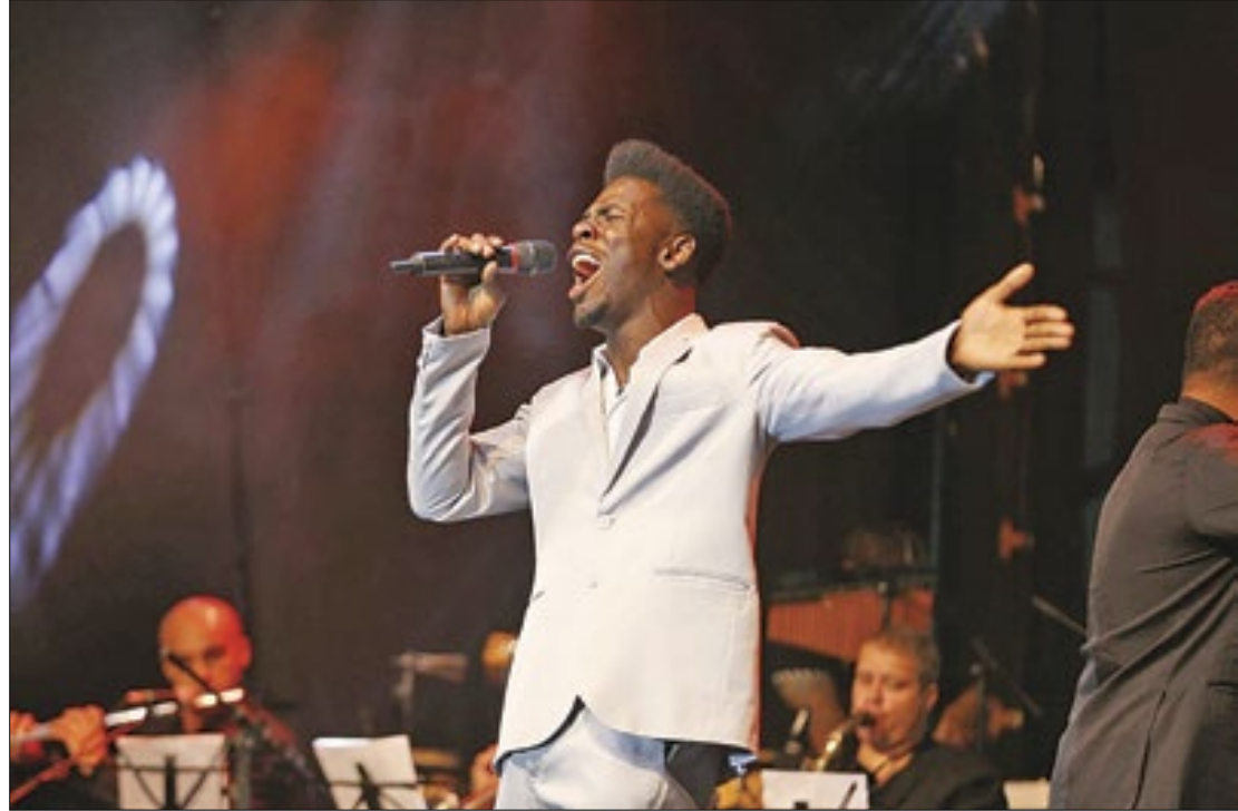
Inscrições para o 'Canta Magé' começam em 14 de março. Edital já está disponível

Neste ano, serão aceitas somente apresentações com músicas de cunho religioso no estilo gospel, em todas as etapas. As inscrições para o Canta Magé Gospel serão feitas por meio de formulário eletrônico no site oficial da Prefeitura ( mage.rj.gov.br ), de 14 a 29 de março de 2024. Podem se inscrever pessoas a partir de 16 anos completos, residentes e/ou domiciliadas em Magé. Quem ficou entre os três primeiros colocados em qualquer edição anterior não poderá