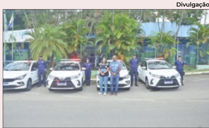
Japeri ganhou novas viaturas para reforçar a segurança

téis, Restaurantes, Bares e Similares da Baixada e Sul Fluminense; Associação Comercial e Industrial de Nova Iguaçu; Universidade Federal Rural do Rio de Janeiro; Associação de Moradores e Adjacentes de Tinguá; Instituto de Proteção; e Ecológica do Iguaçu.