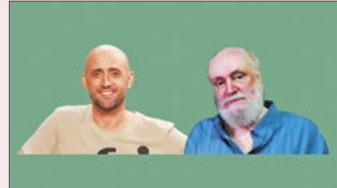
Paulo Gustavo e Aldir Blanc foram vítimas da covid-19