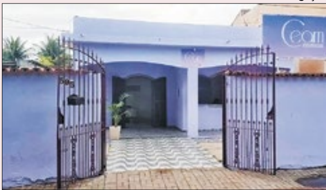
Quissamã se destaca com rede de proteção à mulher