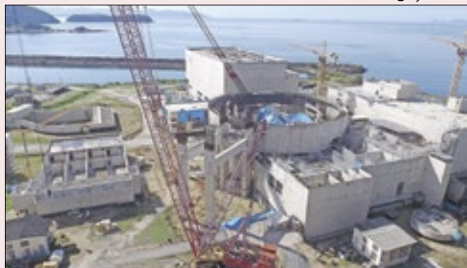
Obras de Angra 3 estão paradas há 20 anos