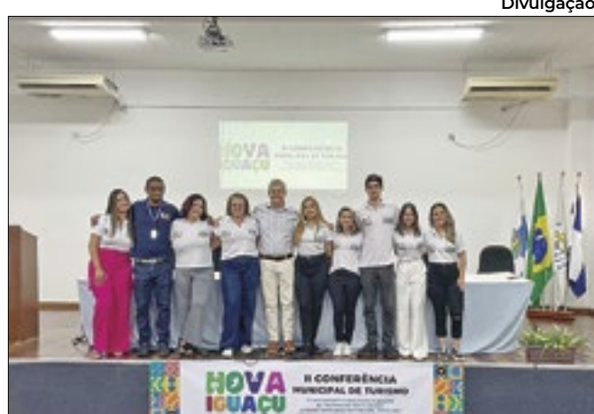
Evento aconteceu no Campus da UFRRJ de Nova Iguaçu