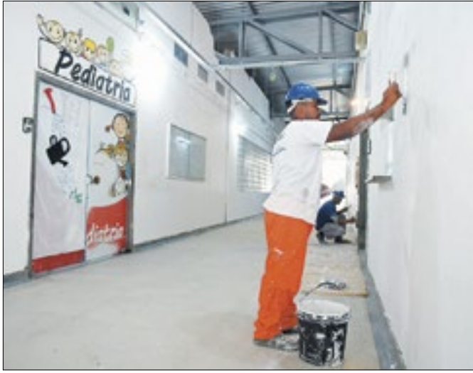
Pediatría do HGG, em Campos, passa por reforma