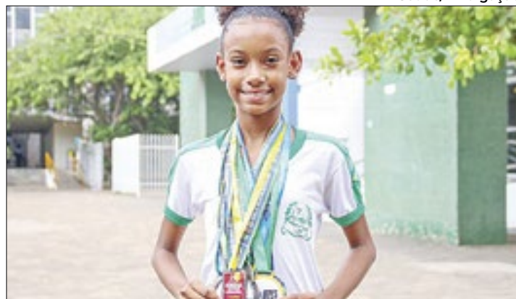
Jovens participam de olimpíadas de conhecimento nacional