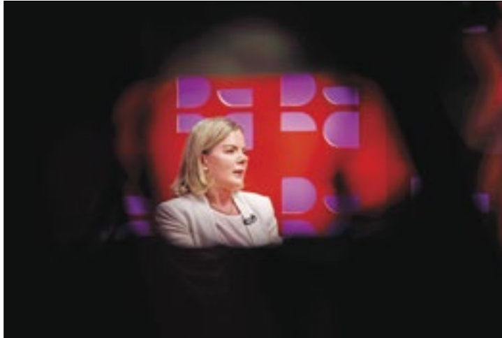
Para Gleisi, extrema-direita é o grande adversário de Lula

desprezando Bolsonaro, nós vamos vencer o bolsonarismo", afirmou Gleisi.