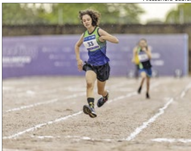
Professores observam a aptidão dos alunos