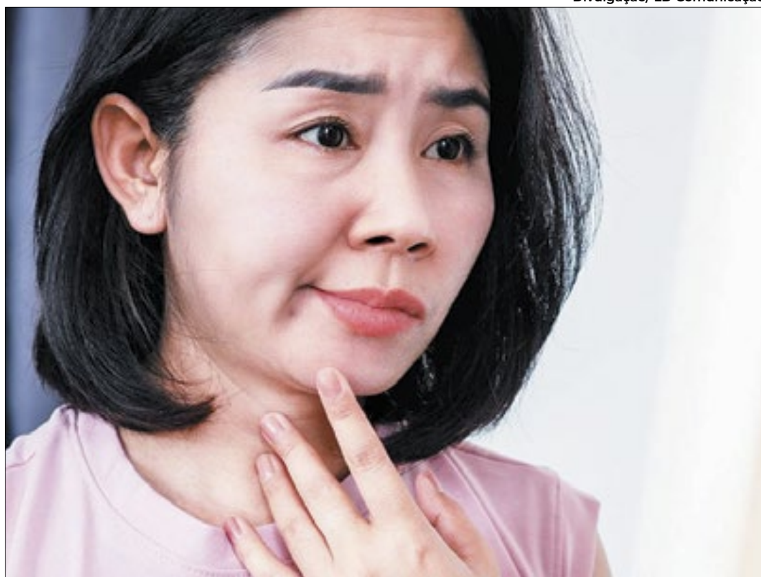
Paralisia de Bell possui boa previsão de cura e AVC pode levar a morte, em alguns casos

A Paralisia Bell costuma ser confundida com o Acidente Vascular Cerebral (AVC), pois alguns sintomas são similares, porém as possíveis causas, recuperação e tratamentos são diferentes. A condição que acometeu a jornalista Fernanda Gentil pode ter causas metabólicas e infecciosas como diabetes, infecções de ouvido, mastoidites e até mesmo influenza. O principal sintoma é o enfraquecimento repentino ou paralisia dos músculos em um lado da face devido à disfunção do nervo facial.