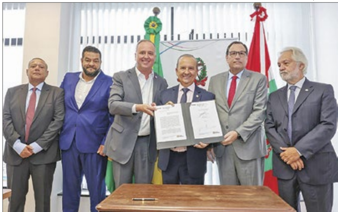
Acordo visa diminuir nos pátios o número de veículos apreendidos pelo Detran

“Essa cooperação com o TJ será de extrema importância para solucionar o problema antigo, de décadas e que não ninguém deu jeito. Agora o nosso Detran junto com o Tribunal de Justiça vai poder dar o encaminhamento necessário a esses veículos que ficam por anos abandonados nos pátios parceiros do Detran. Vamos investir recursos dos leilões que serão feitos e, o mais importante, resolver a questão de saúde pública que é o acúmulo de lixo e água parada”, destacou o governador Jorginho Mello. A medida visa acelerar a desvinculação dos veículos para que possam ir à leilão; agilizar o procedimento de alienação; promover a arrecadação de valores que ficarão depositados em contas judiciais; facilitar o flu-