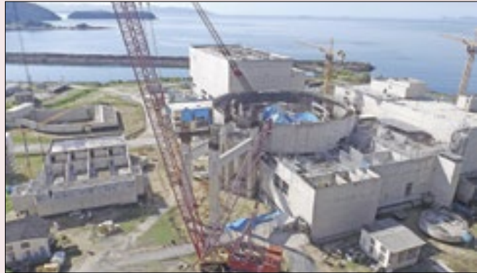
Obras de Angra 3 estão paradas há 20 anos