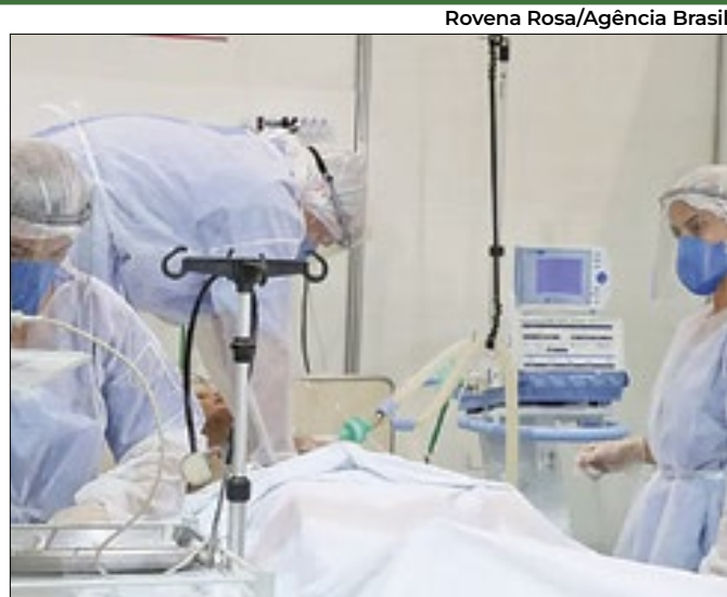
Texto exige acompanhantes em procedimentos

Com a mudança, os usuários podem escolher o fornecedor