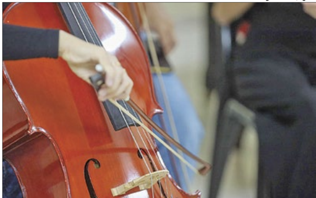
Não é obrigatório ter formação específica em música para participar do processo seletivo

O PPGMUSA oferece duas linhas de pesquisa: Música e Cultura e Música e Formação. As inscrições podem ser feitas até o dia 29 de março. A proposta do programa de pós-graduação da Uepa foi aprovada