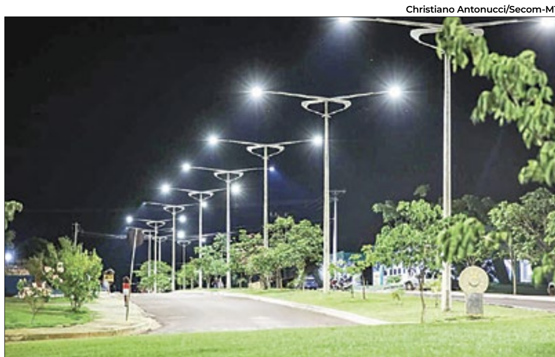
Governo do estado lançou edital de contratação de serviço de fornecimento de energia

A prefeitura de Campo Grande vai realizar de 14 a 16 de março, das 9h às 18h, o 11º Drive-Thru da Reciclagem, Sustentabilidade, Educação, Cultura e Negócio. O foco é conscientizar a população para o descarte correto dos resíduos e informar sobre práticas sustentáveis.