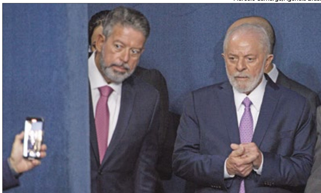
Governo critica Lira por não ter interferido nas comissões

“Nem eu sou dono do plenário, nem presidente de comissão é dono da pauta de comissão. Toda comissão temática é importante. Mas elas não sequestram o Parlamento. Assim como o Parlamento não sequestra o governo”, defendeu o presidente.