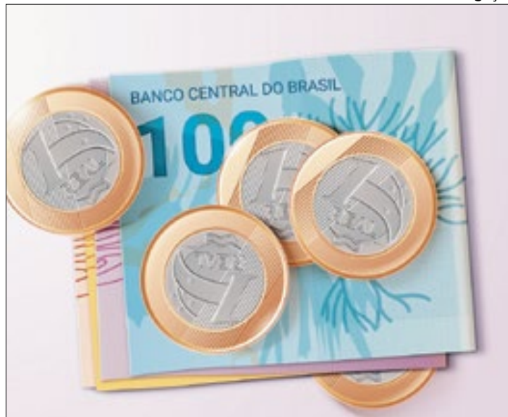
Rendimento médio do brasileiro teve leve alta no ano passado

Sinalização de melhoria, ainda que moderada, do poder aquisitivo da população, dados da Pesquisa Nacional por Amostra de Domicílios (Pnad Contínua) mostram que a renda habitual média do trabalhador brasileiro avançou 3,1% em 2023, ante o ano anterior, segundo estudo divulgado, nessa sexta-feira (8), pelo Instituto de Pesquisa Econômica Aplicada (Ipea).