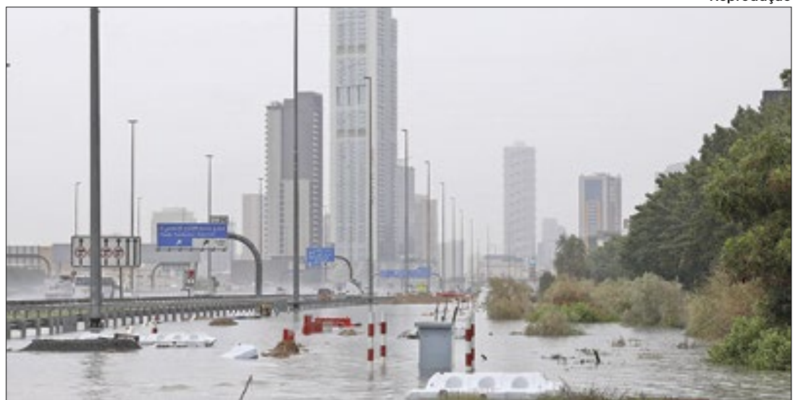
Cidade-capital dos Emirados Árabes Unidos sofreu com os grandes impactos da chuva

Tempestade inunda ruas, cancela eventos e atrasa voos