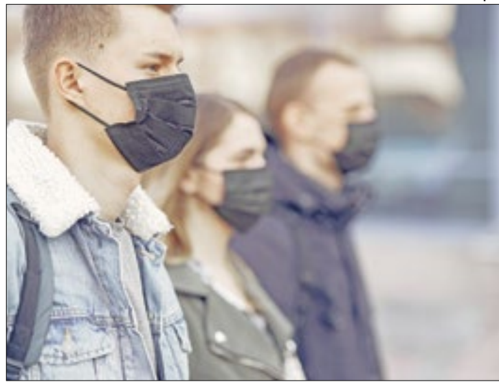
Pacientes graves estão mais suscetíveis; vacinação, por outro lado, tem efeito protetor