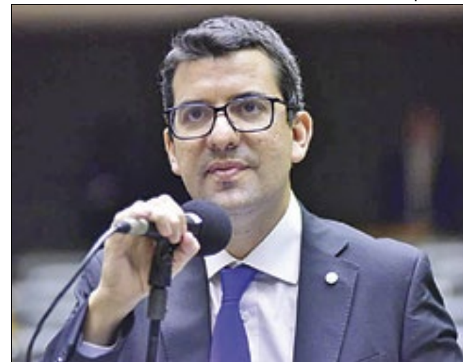
Queiroz: sem os dados não há como discutir mudanças