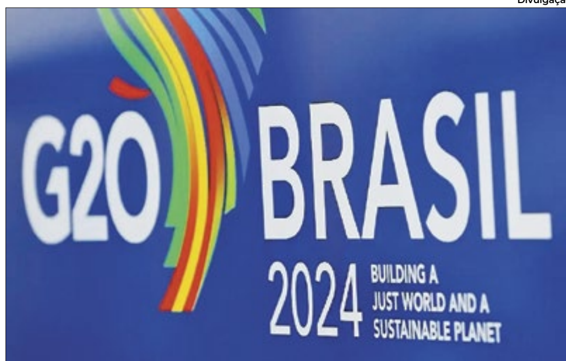
Evento será transmitido nas redes sociais da Associação Científica Brasileira

Inteligência artificial está na pauta de debate dos cientistas