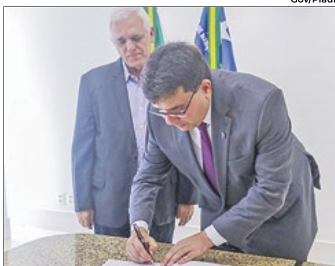
Governador busca parcerias estratégicas para o Piauí