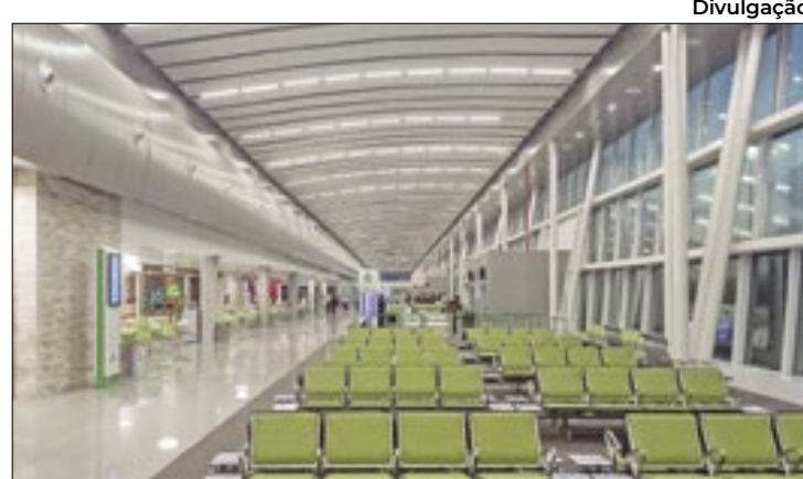
Pouso de emergência aconteceu no terminal potiguar