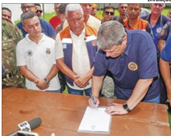
Tarcísio de Freitas assina autorizações de obras