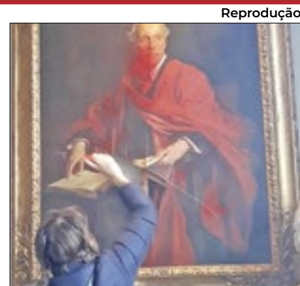
Obra foi vandalizada

O episódio aconteceu na manhã do último sábado (2) e iniciou uma semana sangrenta para Rosário, cidade argentina a cerca de três horas de Buenos Aires onde nem a família de Lionel Messi escapa da crise de violência.