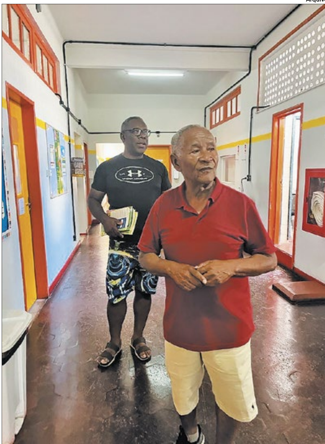
Pai e filho visitam a Casa do Pequeno Jornaleiro

Dessa forma, o livro trata sobre Intolerância religiosa,