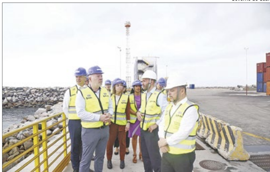
Parcerias internacionais buscam o desenvolvimento de hidrogênio verde

Cooperação internacional impulsiona avanços no setor portuário