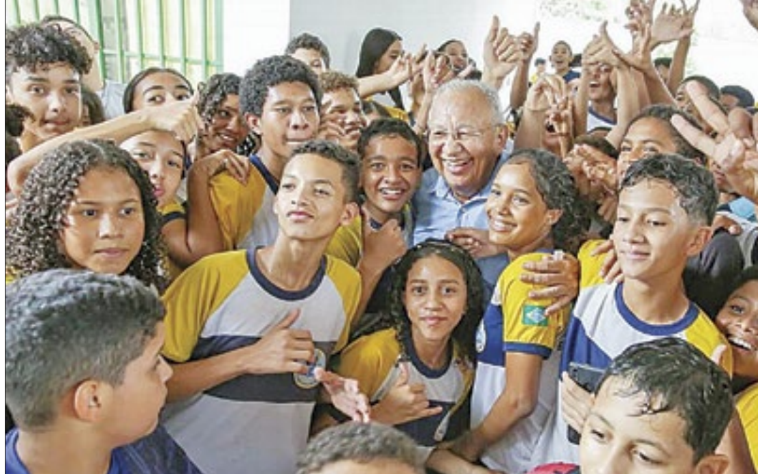
Teresina ampliou a oferta de escolas integrais de 33 para 52 em três anos

“A Educação em Tempo Integral possibilita aos alunos permanecerem por mais tempo no ambiente escolar, contribuindo para o aumento do desenvolvimento da aprendizagem, além do aprimoramento das atividades extracurriculares,