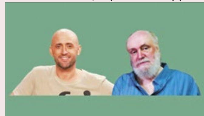
Paulo Gustavo e Aldir Blanc foram vítimas da covid-19