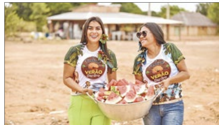
Competições contam com 250 participantes