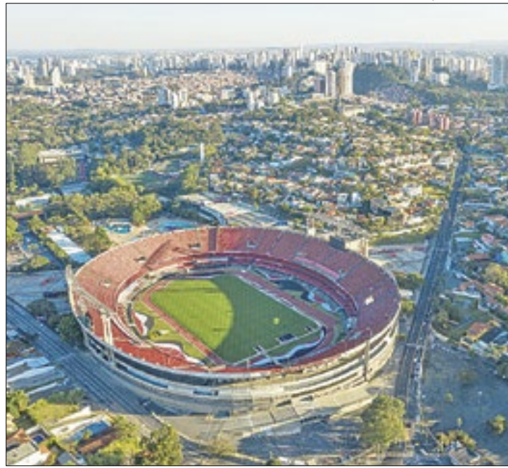
Venda de bebidas alcoólicas é proibida nos estádios paulistas

O ministro Gilmar Mendes, do Supremo Tribunal Federal, negou um recurso do São Paulo Futebol Clube em pedido contra a restrição da venda de bebidas alcoólicas nos estádios paulistas.