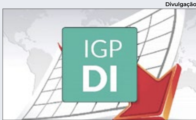
Indicador cai ainda mais, de janeiro para fevereiro

Ante a previsão do ONS, de que a vazão das usinas, este mês, será "inferior à média histórica do período úmido", o ministro Alexandre Silveira frisou que "o setor elétrico tem que estar sempre atento para evitar imprevistos e priorizar a segurança aos consumidores".