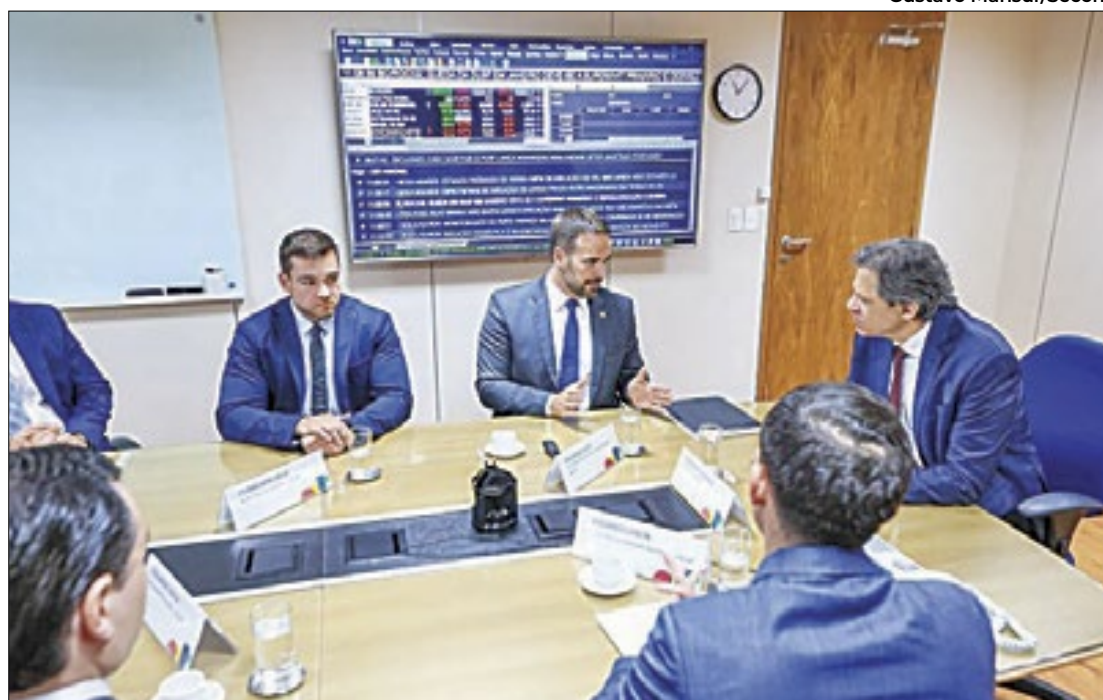
No encontro com o ministro da Fazenda, Leite discutiu sobre endividamento do RS

O Estado entende que o CAM deve ser calculado ex-