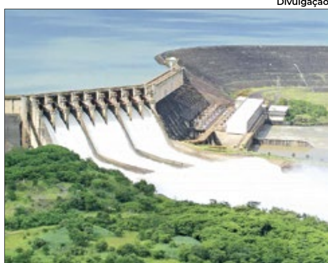
Menor saída de água de usinas visa prevenir déficit