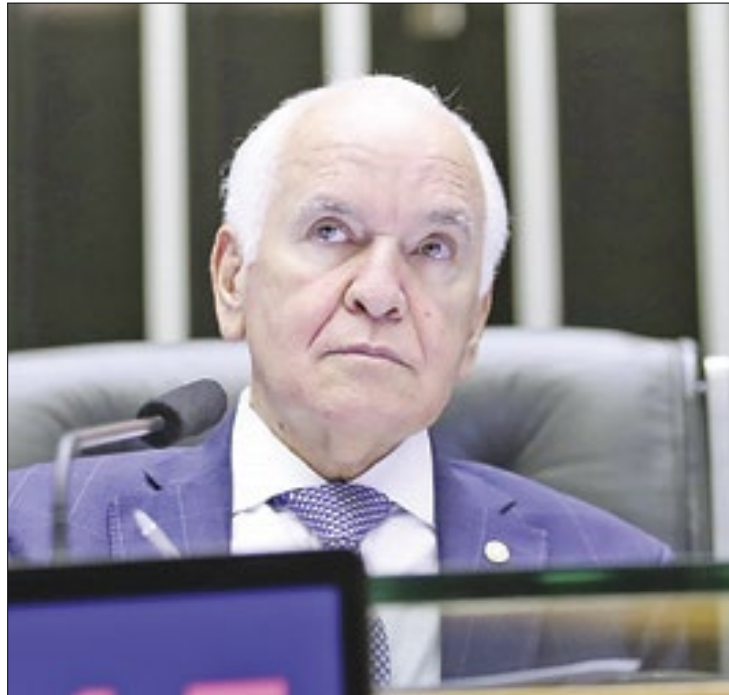
Busca e apreensão seria para que não houvesse ‘qualquer resquício de dúvida’

Ele integra uma investigação aberta em agosto de 2019 pela Abin e que tinha como justificativa apurar suposto uso da advogada e da ONG pelas facções criminosas PCC e Comando Vermelho para derrubar uma portaria que havia endurecido as regras de visitas nas penitenciárias. Como mostrou a Folha de S.Paulo, o documento “Prévia Nini.docx” traz dois parágrafos especulativos que foram usados