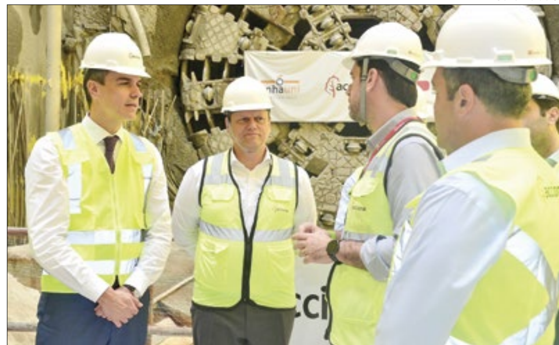
Governo de SP

Estabelecimentos de saúde deverão colocar cartazes informando sobre o dever dos profissionais de saúde em prescrever as receitas de forma clara e legível. É o que determina a Lei 10.292/24, de autoria do deputado Chico Machado (SDD), que foi aprovada pela Alerj.