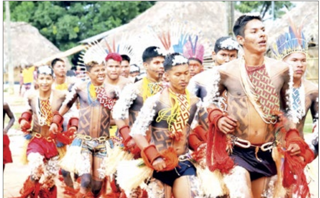
Turistas podem presenciar o Hetohoky, ritual tradicional do povo Karajá

A passagem de turistas trouxe ainda mais valorização para o Hetohoky. Devido a isso, a comunidade decidiu construir