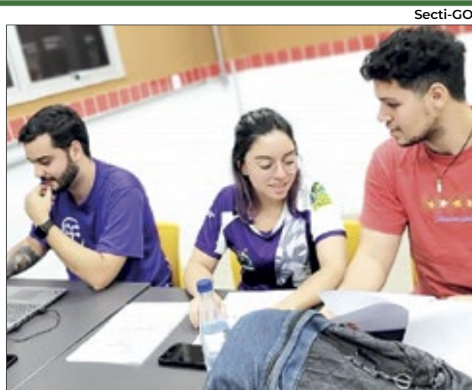
Mulheres representam 56,4% do total de formandos

Grupo debateu sobre prevenção à violência contra mulher