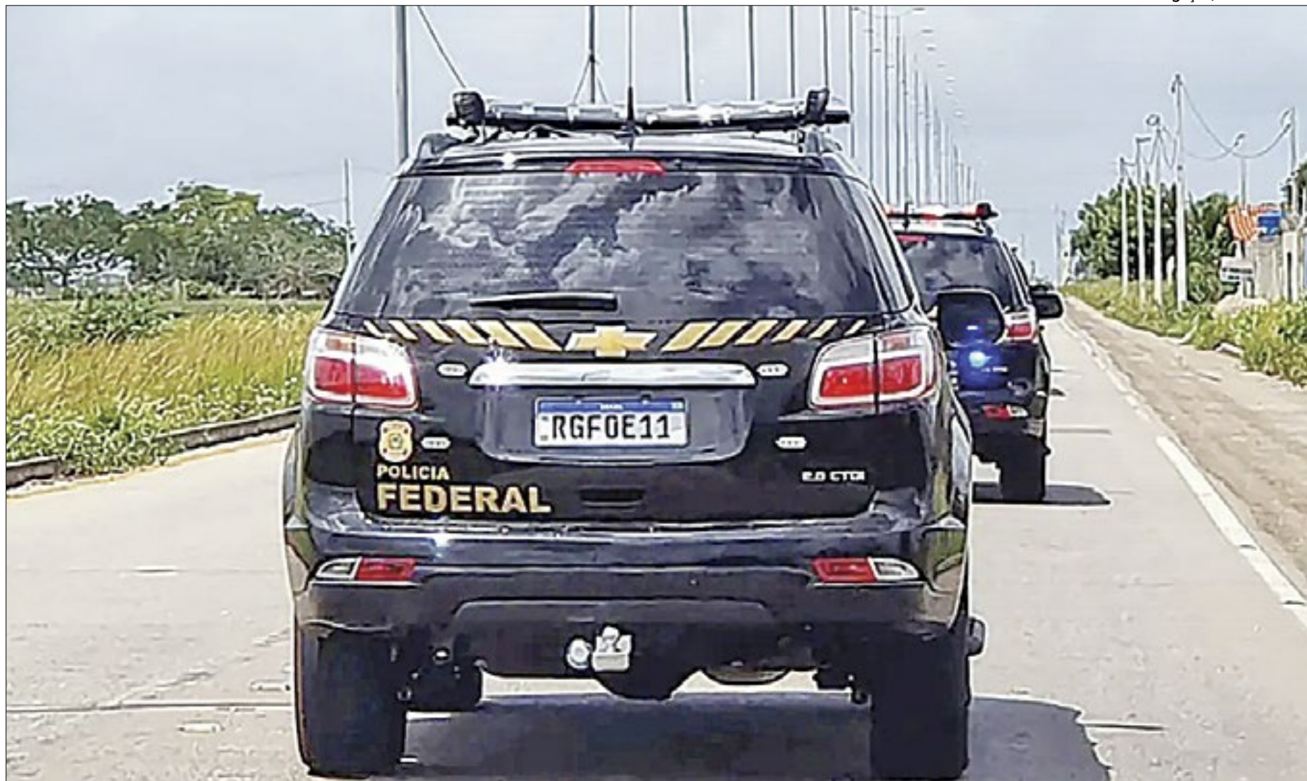
Operação Tempus Veritatis foi deflagrada pela Polícia Federal no último dia 8 de fevereiro de 2024

“Esse prejuízo, avaliado, a princípio, em R$ 28 milhões, é dinheiro público indo para o ralo da corrupção enquanto