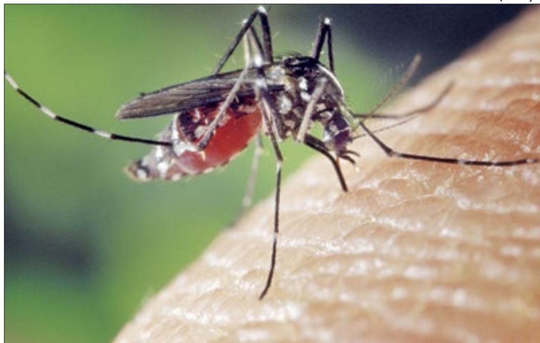
O país totalizou 1.289.897 casos prováveis de dengue com 329 mortes confirmadas

Com a seleção do tópico “casos confirmados” no painel de monitoramento do Ministé-