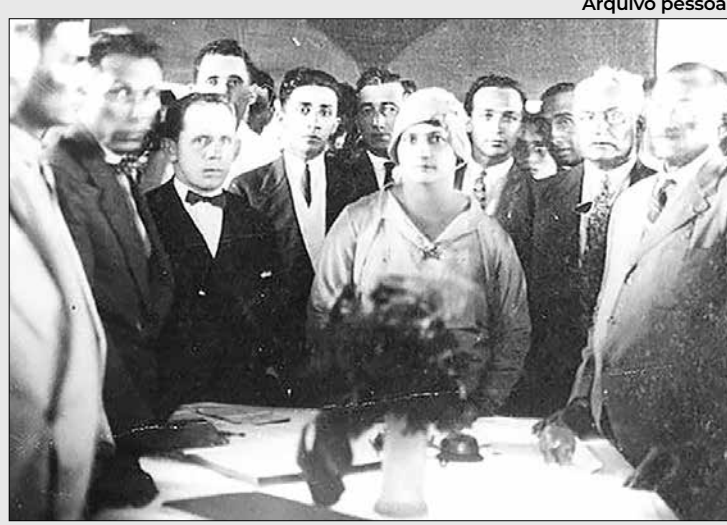
Alzira e seu secretariado: somente homens

A grande alegria, vovó, é que sua memória tem sido resgatada nos últimos anos. Em um esforço que começou a crescer a partir do