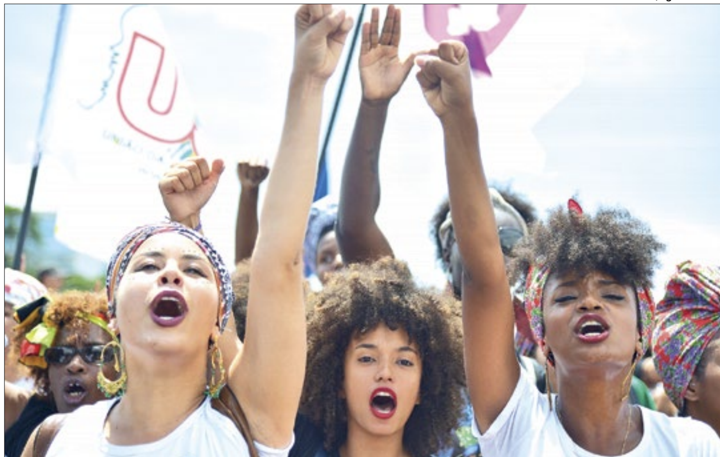
Mulheres precisam lutar por espaço e respeito no mundo masculino

A conselheira acredita que a falta de representatividade feminina no setor público afeta diretamente as decisões tomadas. “Isso impacta sobremaneira na forma como as decisões e políticas são avaliadas pelos Tribunais de Contas. Na medida em que você tem apenas uma perspectiva masculina na análise do gasto público, retira-se da análise a visão feminina, principalmente nas políticas de igualdade de gênero.