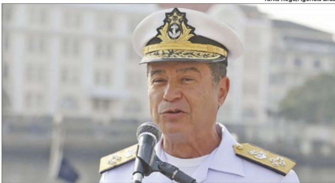
Almirante Almir Garnier, ex-comandante da Marinha, um dos alvos da operação

“Na operação realizada nos endereços do ex-comandante da Marinha, foram procurados documentos que expliquem este negócio nebuloso”