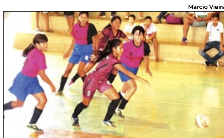
Evento vai sediar primeiro torneio de futsal feminino

“Receber a nossa secretária de Justiça neste dia tão especial, que representa independência e empoderamento para todas nós, foi uma grande honra. Proporcionar isso para as nossas colaboradoras não tem preço”,