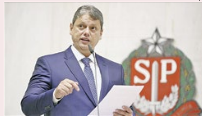
Governador empata em imagem positiva