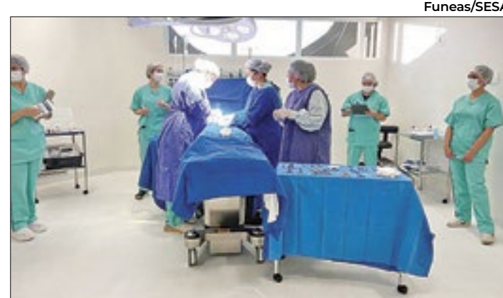
Novos leitos para Hospital Regional de Guarapuava