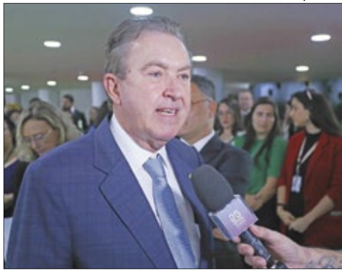
Ducci tenta furar a bolha bolsonarista em Curitiba