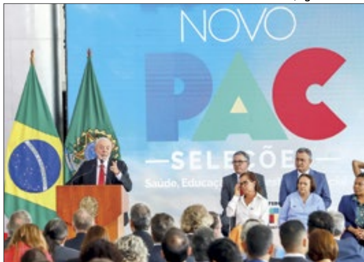
Cerimônia de Divulgação dos Resultados do Novo PAC Seleções

O presidente Luiz Inácio Lula da Silva apresentou, nesta quinta-feira (7), em Brasília, o resultado de 16 das 27 modalidades do Novo Programa de Aceleração do Crescimento (PAC) Seleções, voltado para atender projetos prioritários apresentados por estados e municípios. Foram contemplados programas nos eixos de saúde, educação e infraestrutura social e inclusiva, com R$ 23 bilhões em investimentos.