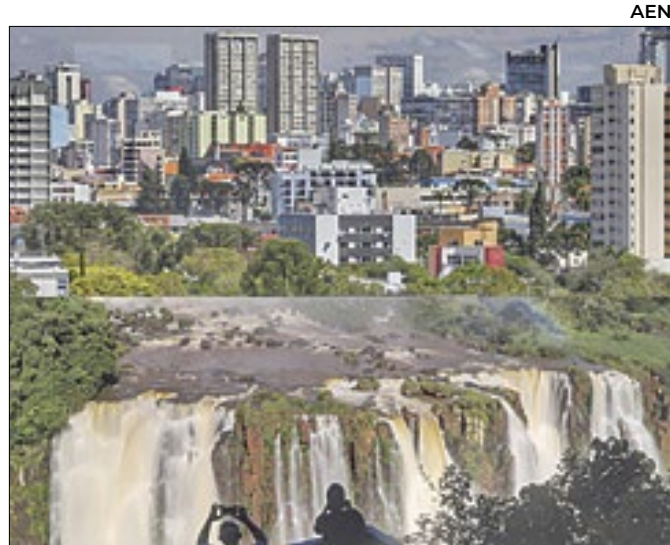
Curitiba é o terceiro principal destino corporativo