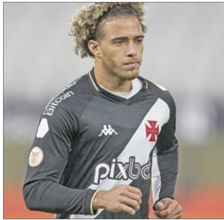
Daniel Ramalho/Vasco da Gama

O regresso ocorre apenas para venda, já que os modelos não serão utilizados em jogos.