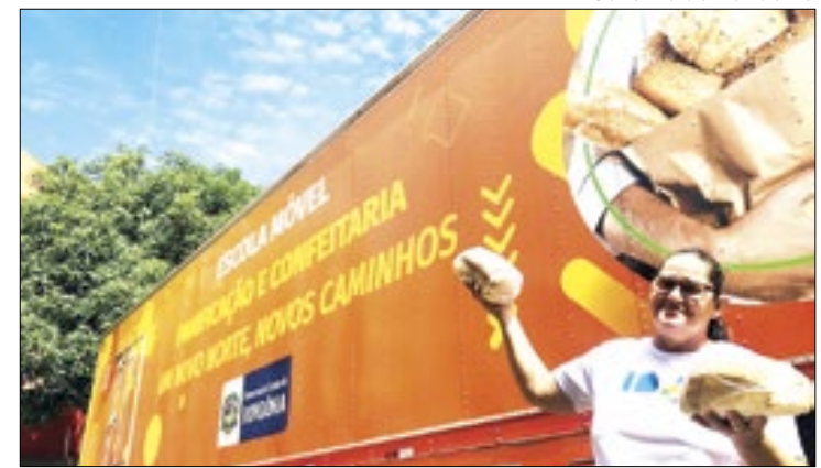
Tereza foi aluna da Escola Móvel de Panificação do Idep