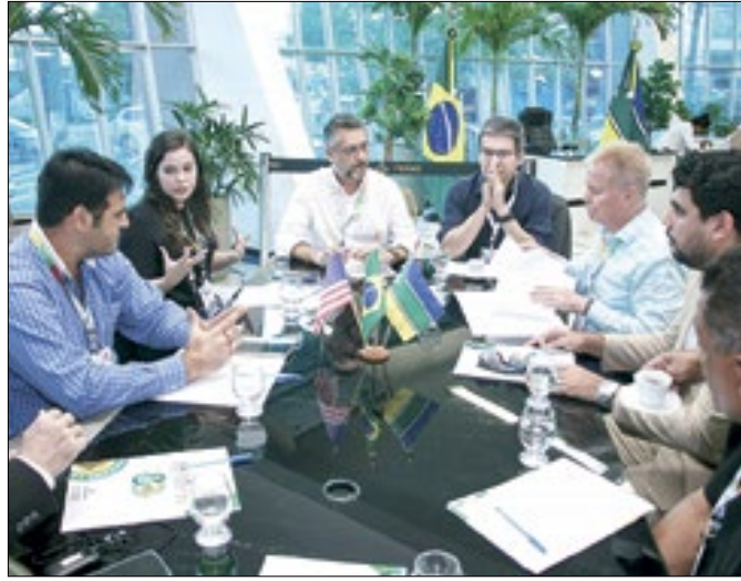
Americanos apresentaram proposta de negócio