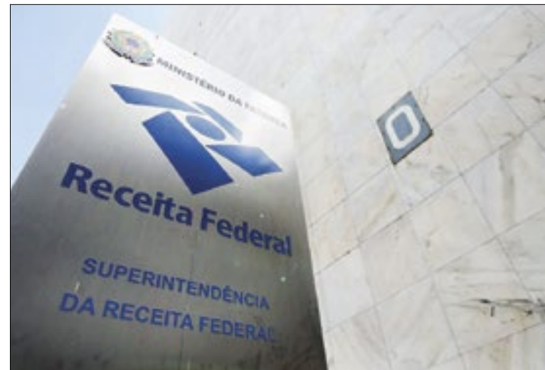
Órgão espera receber 43 milhões de declarações