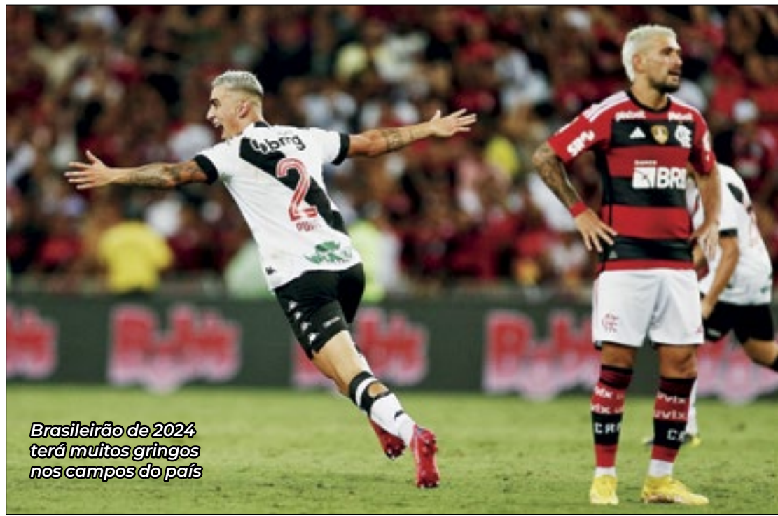
Brasileirão de 2024 terá muitos gringos nos campos do país