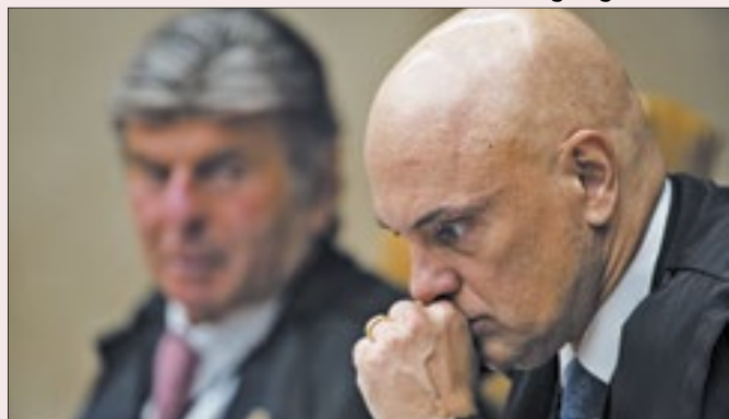
Questão envolve decisão de Moraes na eleição de 2022