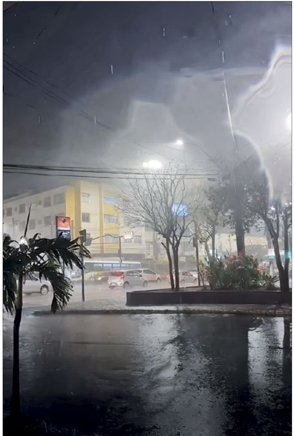
Rua Heitor de Moura Estevão, na Várzea, em Teresópolis, ficou alagada

Os maiores acumulados de chuva nas últimas 24 horas foram observados em Barroso (80.6 mm), Rosário (78.8 mm), São Pedro (70.5 mm), Meudon (69.51 mm) e Parnaso (68.2 mm). Sirenes foram acionadas em Rosário I, Rosário II e Caixangá, enquanto pontos de alagamento foram registrados em diversas áreas, incluindo Rua Manoel José Lebrão / Ermitage, Rua Edmundo Bittencourt / Várzea, Rua Tenente Luiz Meireles / UPA, Rua Carmela Dutra / Agriões e Av. Oliveira Botelho / Alto. A Defesa Civil reforçou a importância de