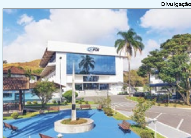
As atividades começam a partir do próximo dia 11

atender até 80 crianças, contando com uma estrutura de seis salas de aula, secretária, setor de arquivo, diretoria, sala de professores, brinquedoteca e outros espaços.