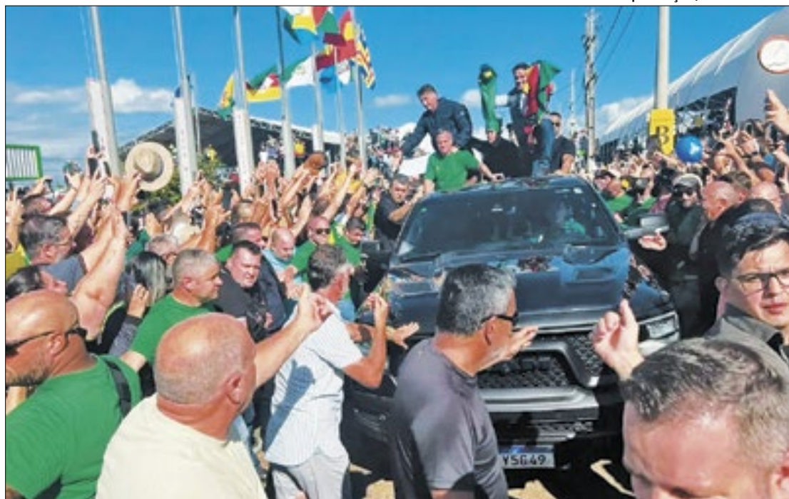
Ex-presidente Jair Bolsonaro esteve em feira agropecuária no Rio Grande do Sul

Vídeos postados pelo próprio Bolsonaro em seu X (antigo twitter) mostram que ele foi ovacionado e abraçado por apoiadores em sua chegada a Expodireto Cotrijal, uma tradicional feira do agronegócio. Ele esteve no meio da multidão e