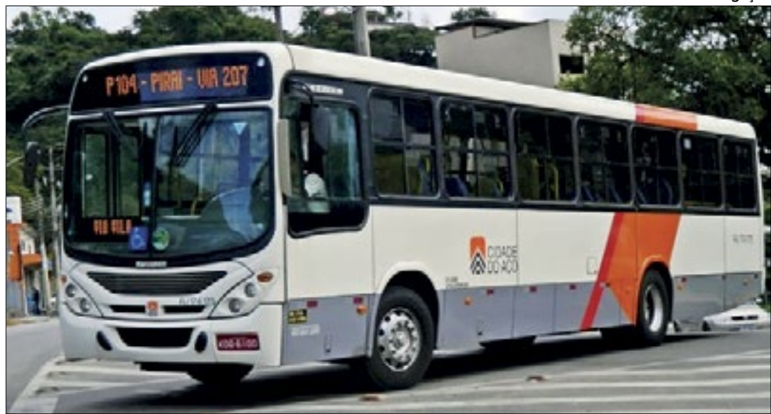
Preços de passagem intermunicipal sofrem redução na região Sul Fluminense

O deputado afirmou ainda que o Detro alega que para resol-