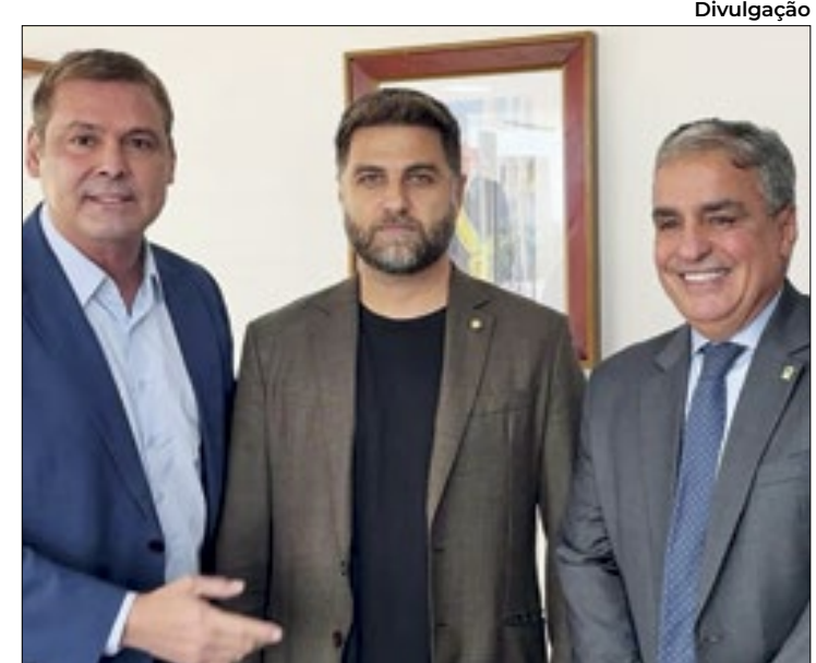
Prefeito Wladimir retornou à Brasília nesta quarta-feira (6)

05 de março, o cercamento eletrônico do Cisp detectou a passagem de duas motocicletas modelo Honda Titan 160cc, envolvidas em diversos furtos de outros veículos na região central e Zona Sul de Niterói. A equipe de monitoramento do Cisp rastreou o deslocamento das motocicletas, ambas com piloto e garupa, e acionou via rádio a Polícia Militar e a Guarda Municipal. O Cisp também recebeu várias informações pelo whatsapp sobre a quadrilha, que havia tentado furtar uma motocicleta estacionada no Ingá, mas o alarme disparou e desistiram do crime.