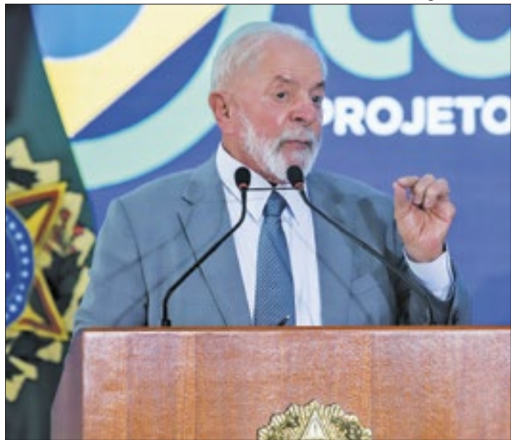
Lula tem aumento de avaliação negativa de seu governo

No recorte dos segmentos da população, a taxa de respostas negativas deu um salto