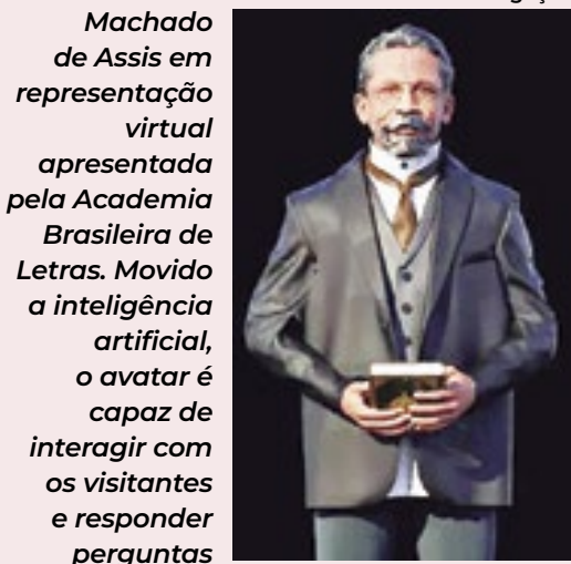
Machado de Assis em representação virtual apresentada pela Academia Brasileira de Letras. Movido a inteligência artificial, o avatar é capaz de interagir com os visitantes e responder perguntas