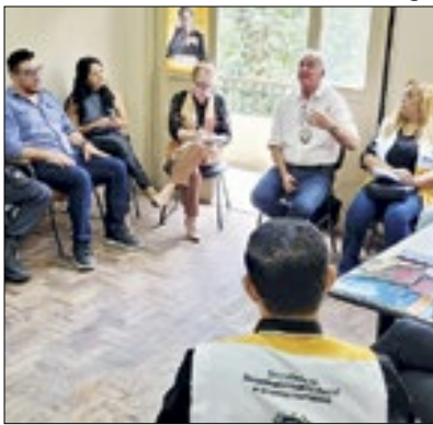
Combate de drogas em Friburgo

Em Nova Friburgo a reativada Secretaria Municipal de Políticas Sobre Drogas, a Subsecretaria Estadual de Prevenção à Dependência Química e representantes das polícias Civil e Militar, realizaram uma reunião para discutir o problema das drogas no município. No encontro, foi apresentado um panorama atual da cidade, além do debate sobre ações de conscientização e combate, com foco no trabalho integrado entre os órgãos.