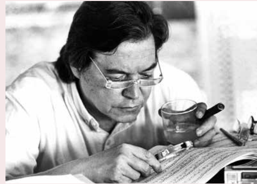
A obra atemporal de Tom Jobim, nosso Maestro Soberano, é celebrada com pompa no ótimo 'Thank You, Tom Jobim', do selo de jazz Arkadia Records