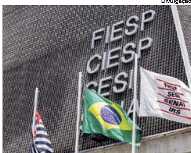
Entidade industrial defende tributação de importados