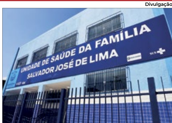
Nova unidade de saúde do Gato Preto, em Meriti