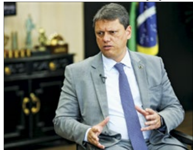
Governador de São Paulo é pressionado por Bolsonaro