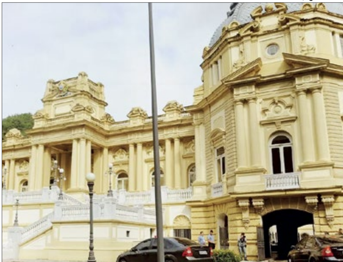
Palácio Guanabara, sede do poder Executivo estadual

O setor também poderá estar disponível nas Circunscrições Regionais de Trânsito e nos Serviços Auxiliares de Trânsito. O texto, aprovado na Alerj, segue para o governador Cláudio Castro. A norma entrará em vigor 90 dias após a publicação em Diário Oficial.