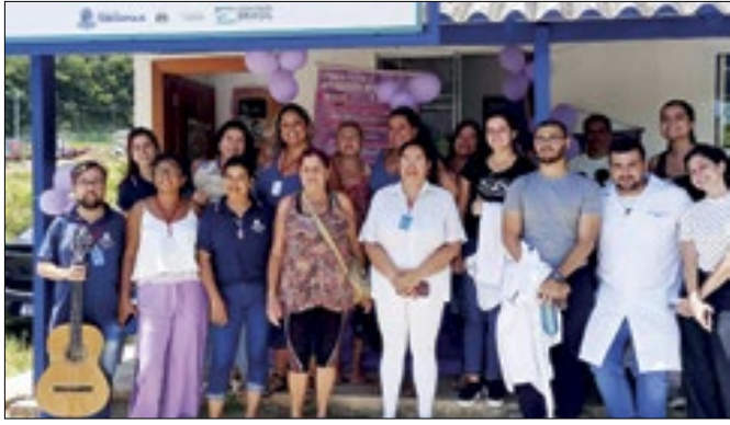
Violência doméstica e a Lei Maria da Penha foram tema