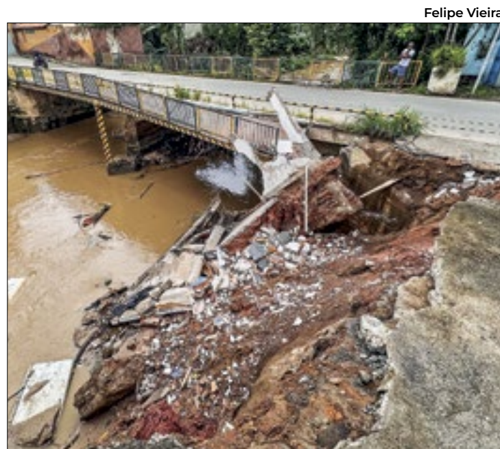
Passarela que liga os bairros Boa Sorte e Piteiras desabou

- Devido ao acúmulo de chuva bem concentrado, houve o desabamento de um imó-