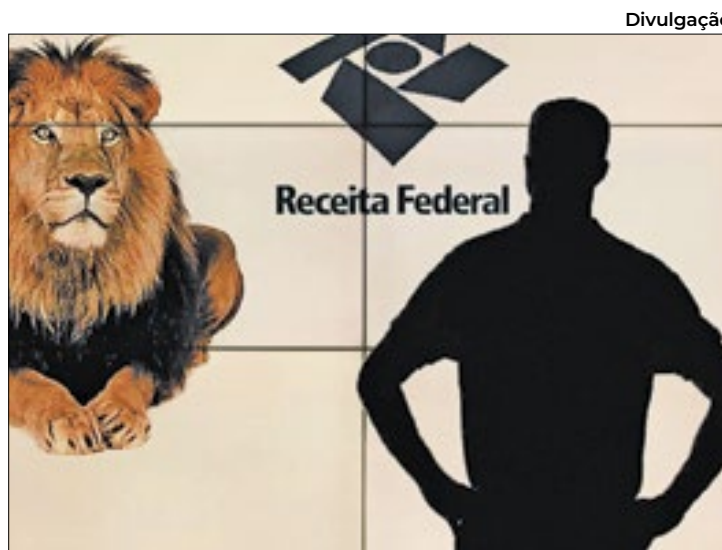
'Leão' conta receber 43 milhões de declarações este ano

no exterior em offshores, titulares de trust e que optarem por atualizar valores de bens ou direitos fora do país integram a lista dos que devem prestar contas.