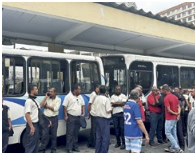
Sindicato busca apoio da Prefeitura