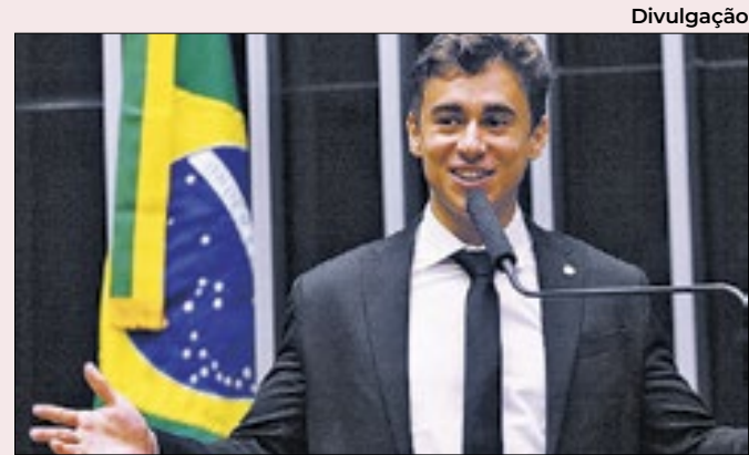
Deputado coleciona polêmicas na Câmara

Tarcísio foi indicado pela então presidente para combater os casos de corrupção no órgão — ficou lá de 2011 a 2015. Na versão do PL, o governador foi para o Republicanos porque o partido ameaçava não dar tempo de TV para Bolsonaro se ficasse sem o candidato ao governo.