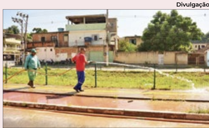
Limpeza faz parte do apoio do Governo do Estado