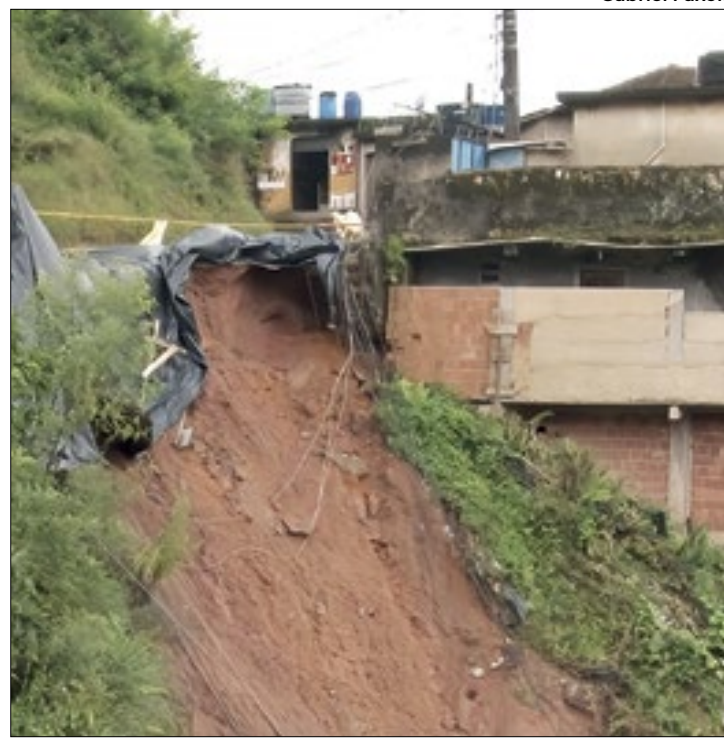
Deslizamento de terra na Rua Nova, em Petrópolis

entrar em contato através do número 199 ou do WhatsApp (21) 2742-7025 em caso de emergência.