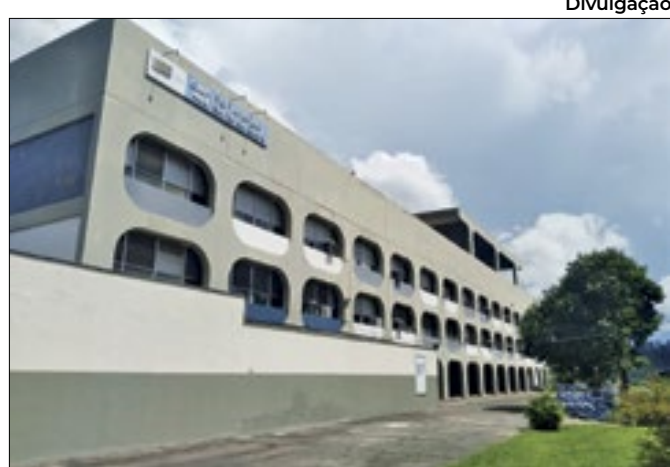
Colégio aguarda reforma de cabos subterrâneos