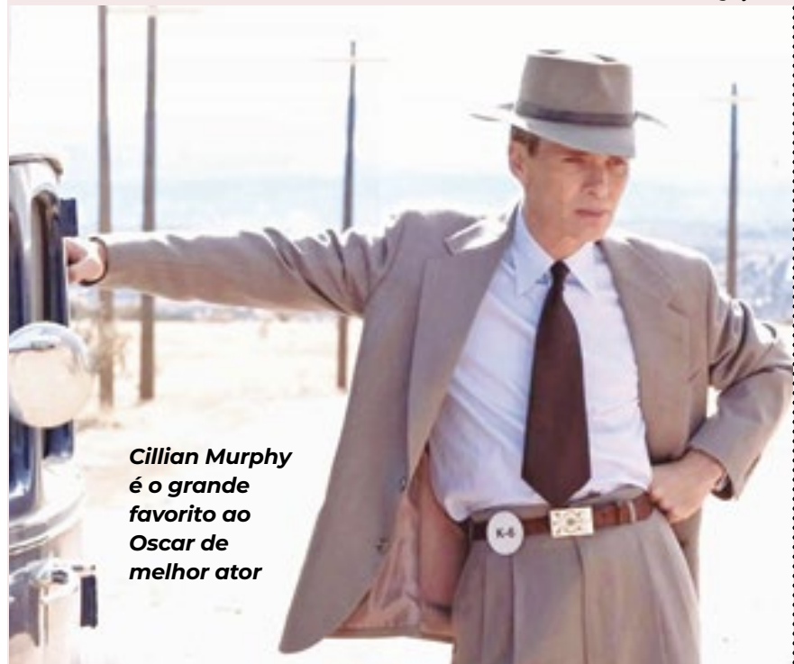
Cillian Murphy é o grande favorito ao Oscar de melhor ator