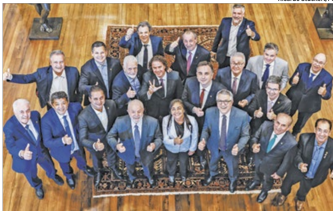
Presidente da República procura maior aproximação com senadores

O projeto que extingue a reeleição ganhou os holofotes do Senado e tem o apoio de Rodrigo Pacheco, que o classifica como "o primeiro passo para a reforma eleitoral". Os parlamentares favoráveis à medida alegam que os últimos anos não