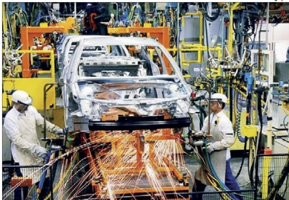
Setor secundário recuou em janeiro último, após dois avanços consecutivos