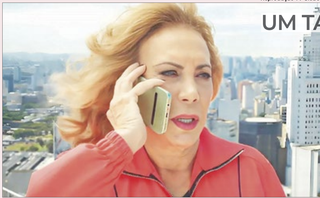
Arlete Salles mostra todo seu talento e carisma no capítulo de estreia de 'Tudo é Família'