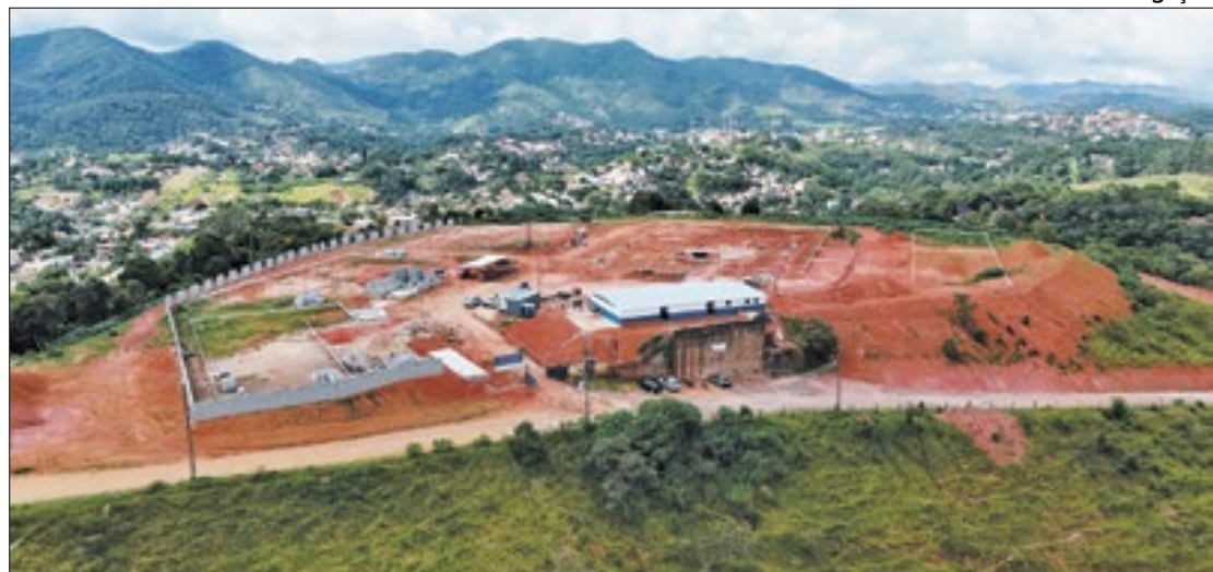
Obras de condomínio em Miguel Pereira geram mais de 160 empregos.

Todos os apartamentos têm 46 metros quadrados, com dois