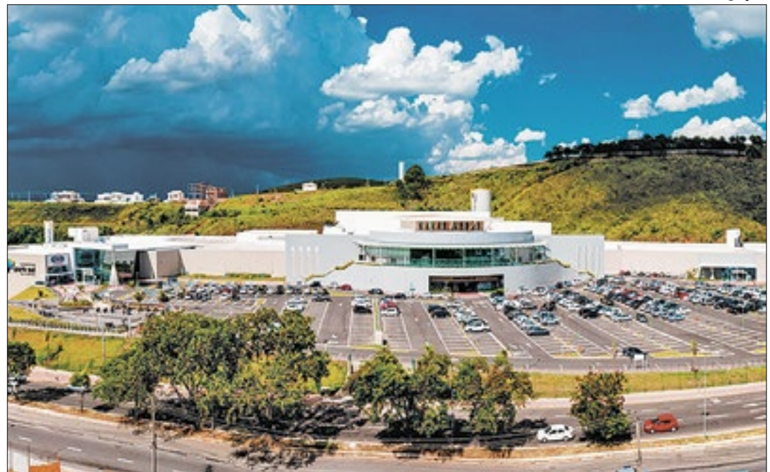
Pai e filho são assaltados no estacionamento do Shopping Park Sul, em Volta Redonda

No vídeo que circula na internet, ele afirma que tentou solicitar um carro da Polícia Militar para averiguar o caso, mas, como o suspeito fugiu, foi orientado a realizar um Boletim de Ocorrência (BO).