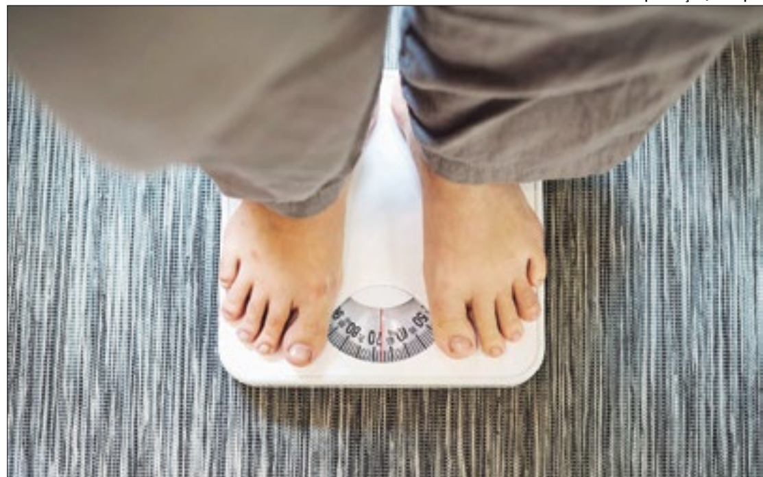
O Dia Mundial da Obesidade foi lembrado nessa segunda-feira (4).

“O excesso de peso é considerado a segunda maior causa