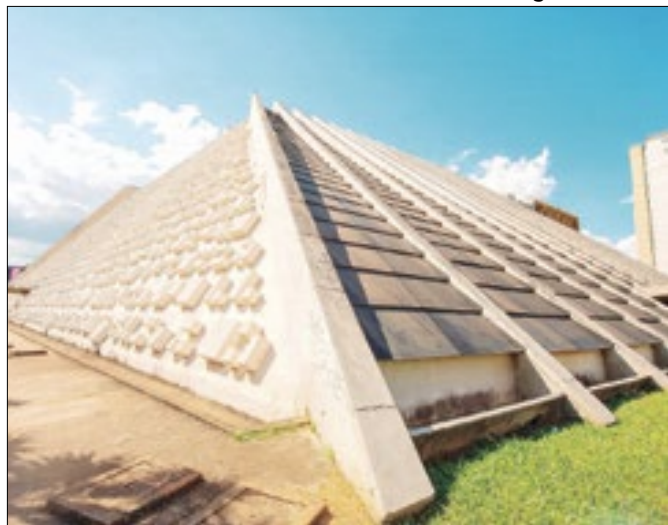
Museu da Democracia será ao lado do Teatro Nacional