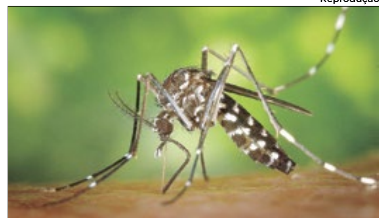
SP passou marca de 300 infectados por 100 mil habitantes