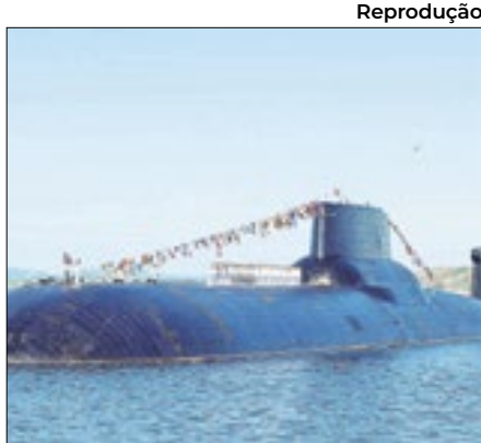
Prejuízo de US$ 65 milhões

As Forças Armadas da Ucrânia disseram ontem que suas tropas atingiram mais um navio de guerra da Rússia no mar Negro, uma das principais frentes do conflito