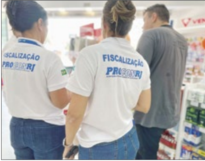
Ação do Procon RJ interdita parcialmente uma farmácia