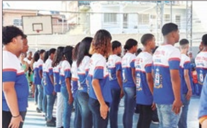
Projeto transforma jovens em agentes multiplicadores