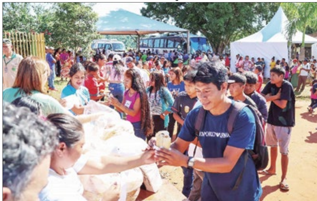
Indígenas de outras comunidades chegaram ao local de ônibus