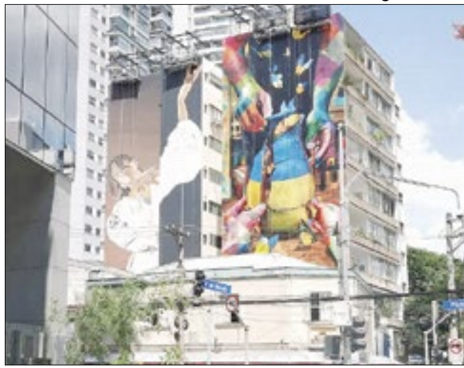
Artes feitas pelo Kobra e Korban, na região de Pinheiros