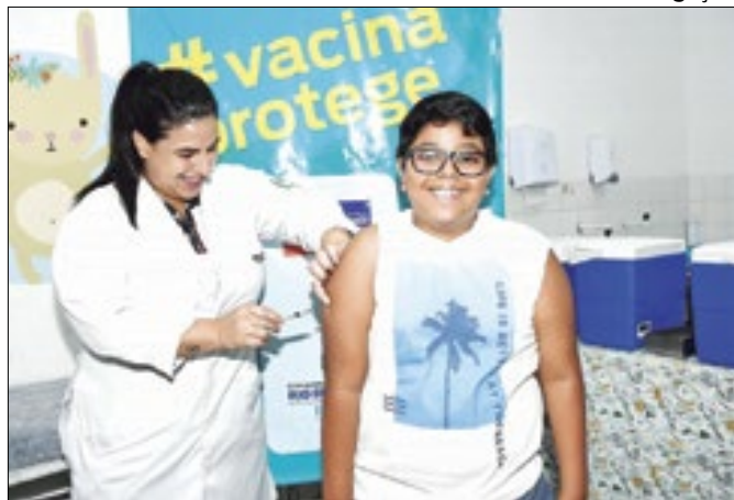
Nova Iguaçu tem baixa procura de vacinação