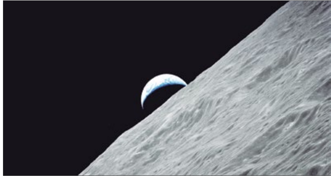
A suposta instalação aconteceria entre 2033 e 2035, segundo Yury Borisov

Ainda segundo ele, painéis solares não seriam capazes de fornecer eletricidade suficiente para alimentar futuros assenta-