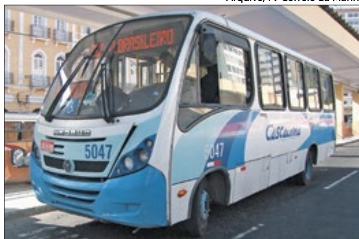
Ônibus da viação Cascatinha em Petrópolis