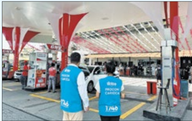
Prefeitura do Rio

Responsável por administrar todo o BRT, a MOBI-RIO verificou que o transporte de passageiros saltou de 1.663.392 em fevereiro de 2023 para 2.778.454 em fevereiro deste ano, o que totalizou um aumento de 67%. Somente em dias úteis, a demanda de passageiros registrou um acréscimo de 58%. Inaugurada em 2014, a Transcarioca tem 45 estações, que foram totalmente reformadas pela Prefeitura do Rio, e dois terminais. O corredor já está conectando com o Terminal Gentileza, por meio do serviço 80 (Penha x Gentileza), parando nas seguintes estações: Penha 2, Ibiapina, Olaria, Cardoso de Moraes e Santa Luzia, seguindo pela Transbrasil até o Gentileza.