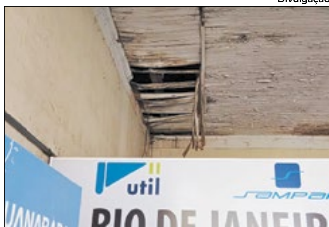
O teto está aos pedaços e com possibilidade de cair