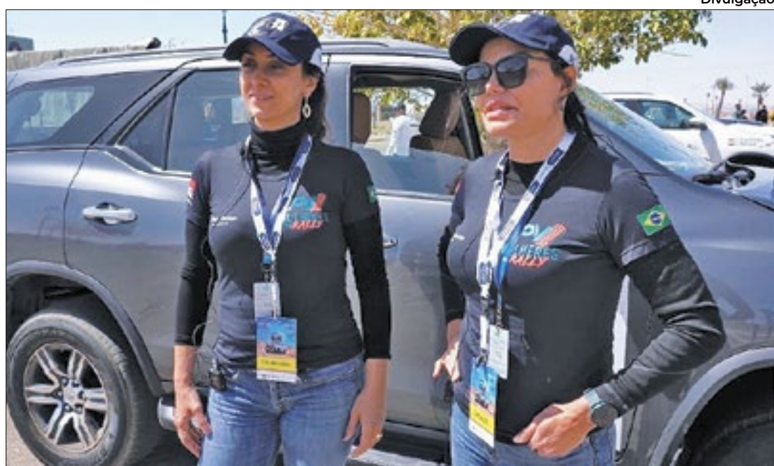
Dupla do Rio de Janeiro é a primeira formada por brasileiras a disputar o rali feminino