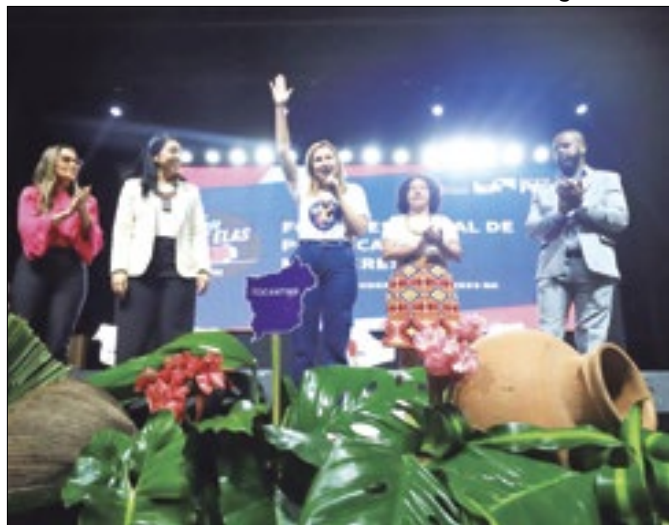
Evento do mês da mulher teve 400 participantes