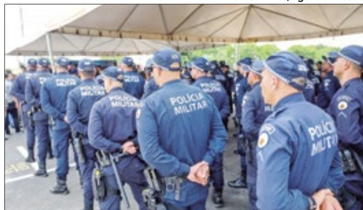
Corporação vai ganhar novo centro de atendimento