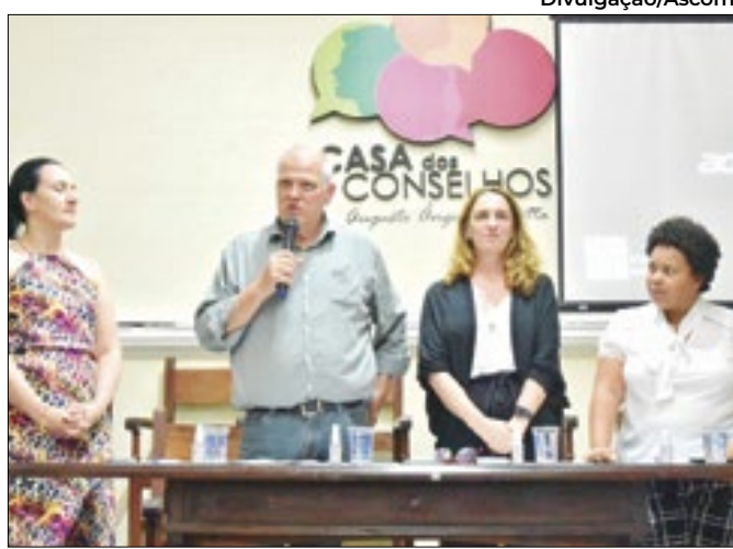
Anúncio de criação de nova secretaria em Petrópolis