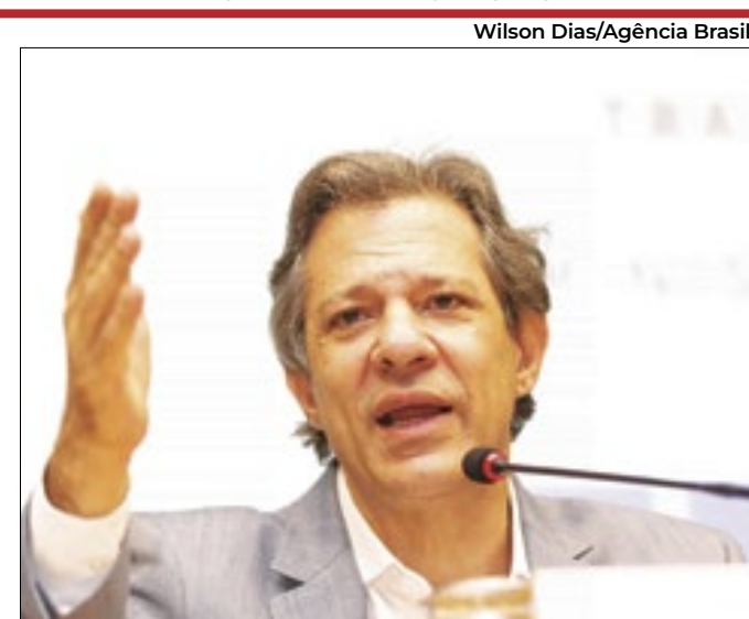
Haddad procura controlar excesso de bondades