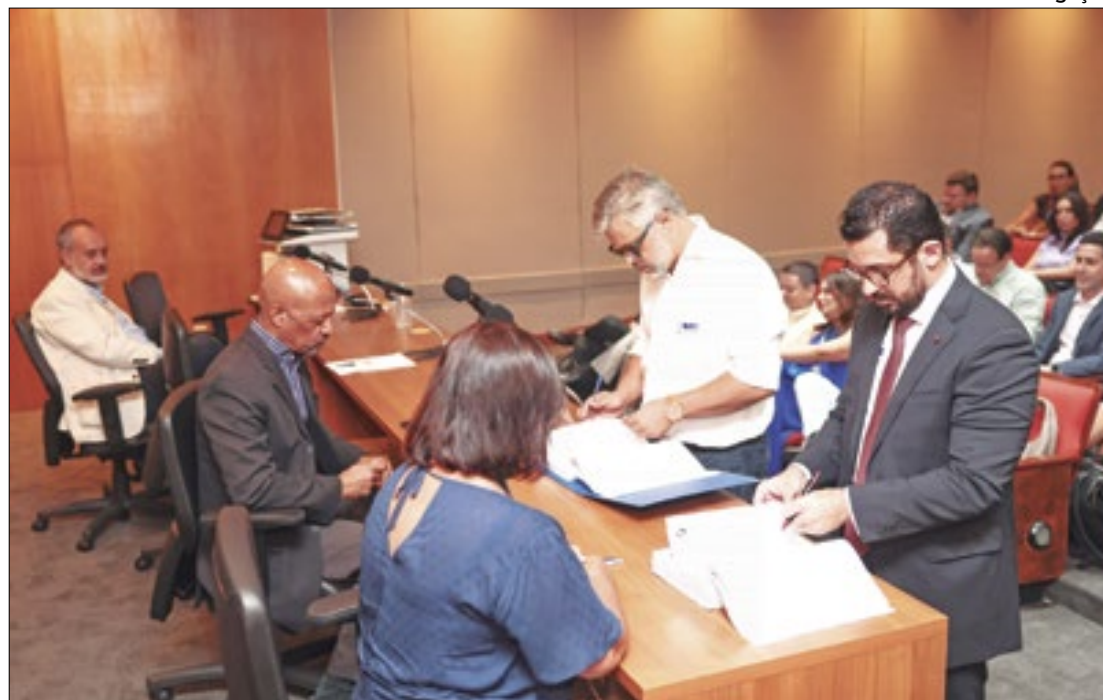
Edital prevê que o vencedor faça investimentos de cerca de R$ 186 milhões

O Governo do Estado do Rio de Janeiro realizou, nesta terça-feira (5), a segunda etapa do processo de concessão do Complexo Maracanã, com a abertura das propostas técnicas dos três interessados: Consórcio Maracanã para Todos, formado pelo clube Vasco da Gama e pela W Torre Entretenimento e Participações Ltda; Consórcio Fla/Flu, compostos pelos clubes Flamengo e Fluminense; e a empresa RINGD Consultoria de Negócios Ltda. O contrato será de 20 anos e o edital prevê que, até o fim da concessão, o vencedor faça investimentos de cerca de R$ 186 milhões.