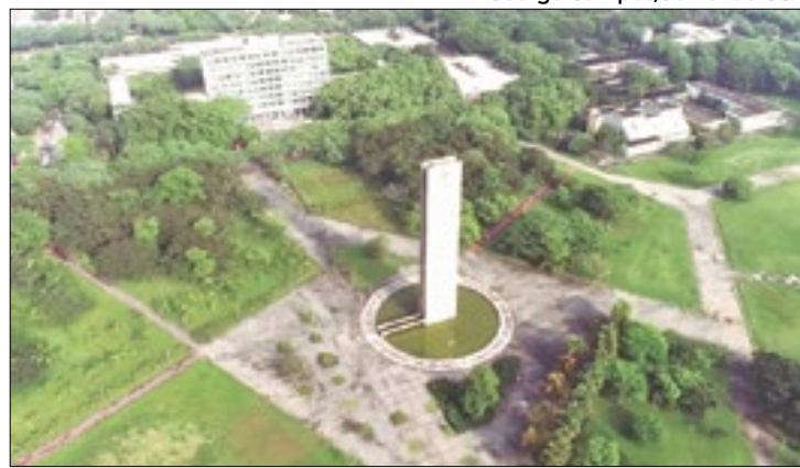
Instituição negou etnia de jovem aprovado