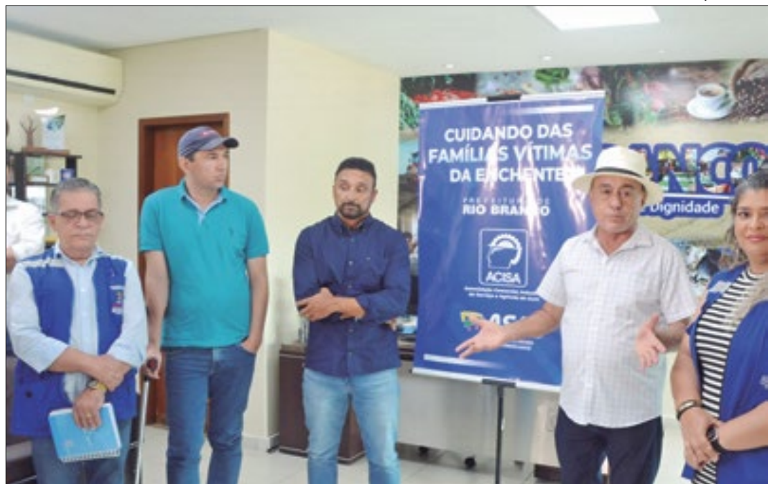
Prefeitura formou parceria com rede de supermercados para arrecadar suprimentos

"Cada momento que passa está ficando mais grave, pois o rio continua subindo, mais famílias desalojadas, os custos aumentam. A prefeitura está pronta para bancar esses custos, mas o mais importante é que a gente tenha ajudas como da Acisa e da Associação Acreana de Supermercados, na coleta, porque o povo, acreano, como eu disse agora, é um povo muito solidário, e a gente vê muita gente querendo saber onde é que vai fazer a doação. Então vamos ter mais de 20 pontos agora com essa parceria", disse o prefeito