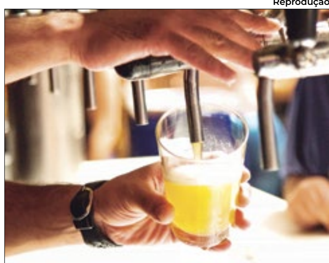
Reprodução Apesar do avanço, produtores reclamam de burocracia