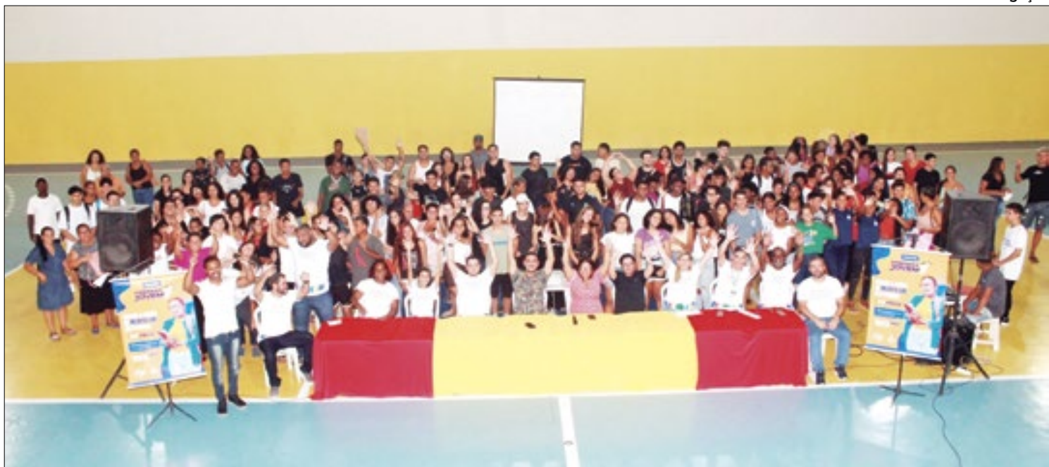
Prefeitura de Magé iniciou aulas do projeto Prepara Jovem, com 400 vagas disponibilizadas

ses. Durante o curso, eles aprendem sobre primeiros socorros, prevenção de acidentes domésticos e combate a princípios de incêndios, entre outros temas. Assim, estimulamos na juventude o sentido de autoproteção e cuidado com a comunidade em geral", declarou o secretário.