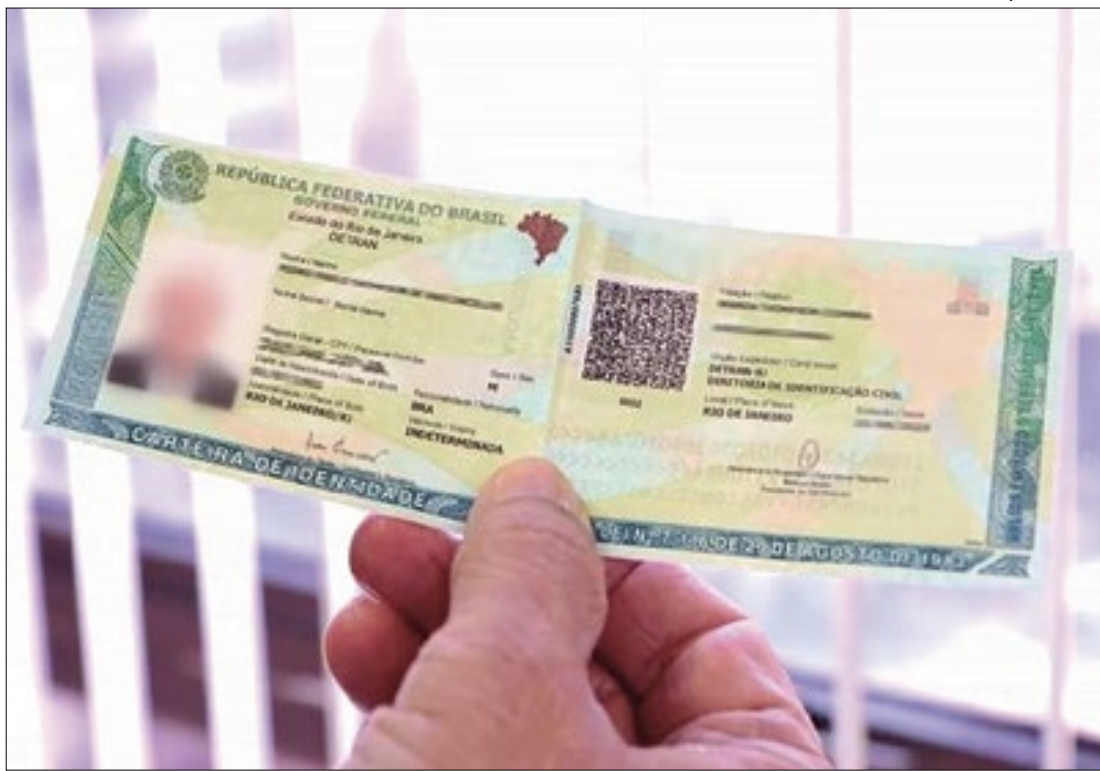
Nova carteira de identidade nacional (CIN) já pode ser emitida no Detran.RJ

Segundo o Observatório do Trabalho da Secretaria de Trabalho e Renda, 73,1% das vagas captadas são do setor de Serviços e 26,9% do Comércio. Por nível de escolaridade, 54% exigem o Ensino Médio completo e 40,3% o Ensino Fundamental. A maior parte das vagas (1.534) requer experiência.