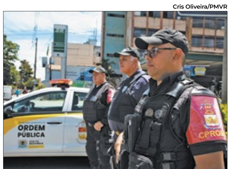
Profissionais serão incorporados à segunda etapa do Proeis

Já em Barra Mansa, além do reforço na equipe de combate ao Aedes aegypti, mosquito transmissor da infecção, o município está em constante contato com o estado, para intensificar a prevenção e o tratamento. Nesta segunda-feira (04), a cidade recebeu