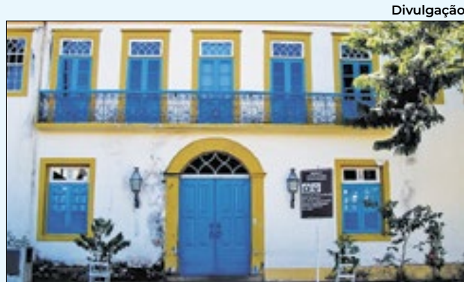
Mostra pode ser conferida a partir do dia 5 de março

nhos, velhos, marujos, lanceiros e jardineiras. As inscrições podem ser feitas na Casa Larangeiras. A festa acontece do dia 10 a 19 de maio e a programação será divulgada em breve.