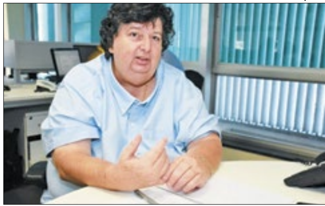
Neto terá contas de 2022 votadas pelo tribunal