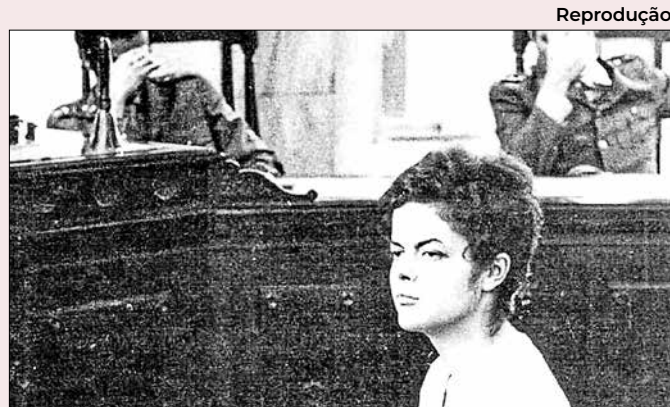
Ato em Juiz de Fora relembra histórica foto de Dilma

“Quando ele me escolheu ministro dos Direitos Humanos em seu primeiro governo, o foco era o direito à memória e à verdade”, diz Nilmário. Para Nilmário, o que Lula não deve querer é aumentar ainda mais possíveis zonas de atrito com os militares.