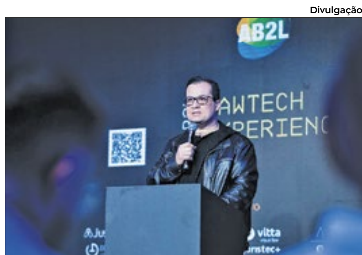
De acordo com a AB2L, o Brasil está liderando a corrida

O que poderia demorar semanas e concentrar vários profissionais, o serviço de análise de dados de documentos, tarefa primordial para a rotina dos advogados, está