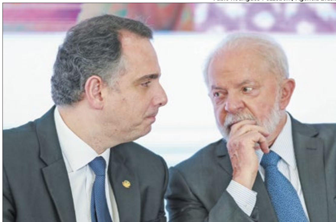
Lula tenta azeitar relações com Pacheco e demais senadores

Na intenção de ampliar o diálogo entre os poderes Executivo e Legislativo, inclusive para garantir as pautas prioritárias do governo ainda neste primeiro semestre, diversas pautas estavam em jogo. No geral, Rodrigo Pacheco tem menos atritos com o presidente da República em comparação a Lira. Porém, isso não invalida a insatisfação dos senadores com