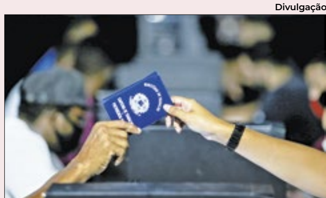
Oportunidades com carteira assinada em diversas regiões

Segundo Cássio Coelho, presidente do Procon-RJ, os agentes também constataram em algumas farmácias aumento de cerca de 20%. Foi exigida a apreensão de documentos que justifiquem essa majoração. Durante a ação, 14 farmácias e um supermercado foram fiscalizados.