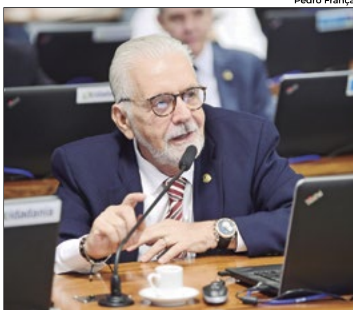
Jaques Wagner defende o fim da reeleição

“Pessoalmente, acho muito ruim o sistema que temos hoje