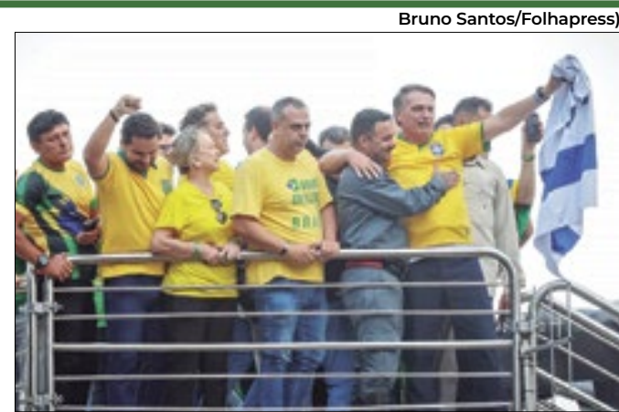
Jair Bolsonaro no ato da Avenida Paulista