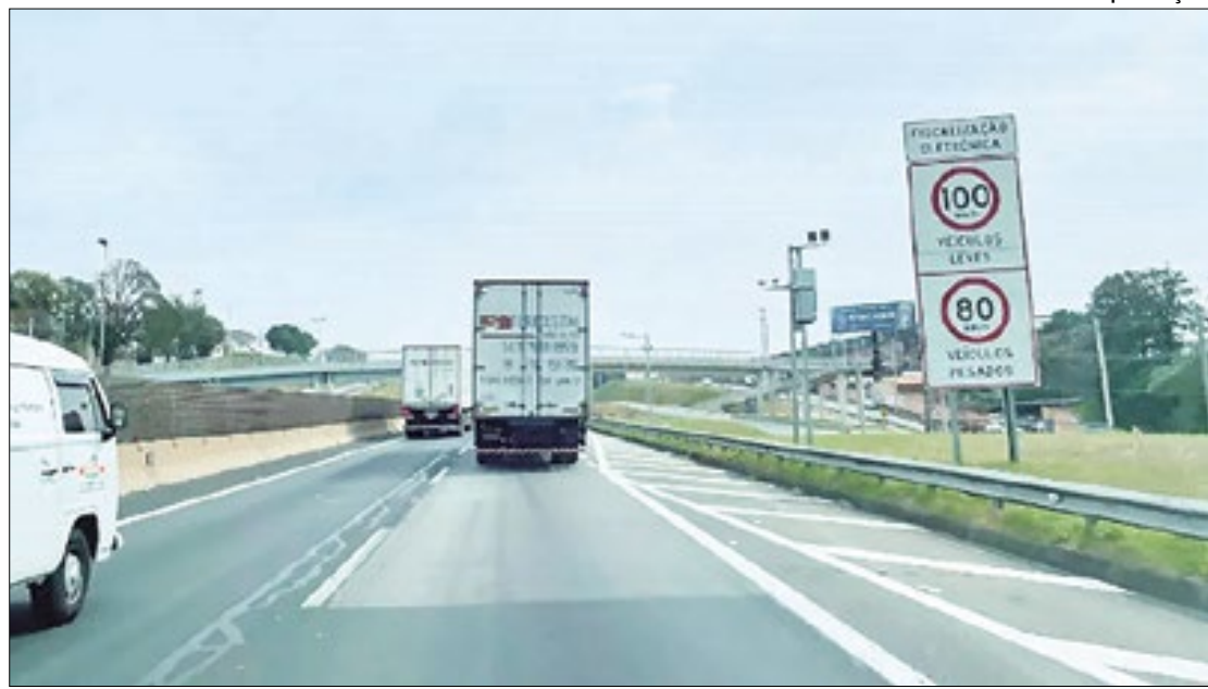
Novos radares começam a operar hoje (06) na Dutra

De acordo com a concessionária, a instalação dos 75 rada-