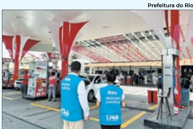
Prefeitura do Rio

Responsável por administrar todo o BRT, a MOBI-RIO verificou que o transporte de passageiros saltou de 1.663.392 em fevereiro de 2023 para 2.778.454 em fevereiro deste ano, o que totalizou um aumento de 67%. Somente em dias úteis, a demanda de passageiros registrou um acréscimo de 58%. Inaugurada em 2014, a Transcarioca tem 45 estações, que foram totalmente reformadas pela Prefeitura do Rio, e dois terminais. O corredor já está conectando com o Terminal Gentileza, por meio do serviço 80 (Penha x Gentileza), parando nas seguintes estações: Penha 2, Ibiapina, Olaria, Cardoso de Moraes e Santa Luzia, seguindo pela Transbrasil até o Gentileza.