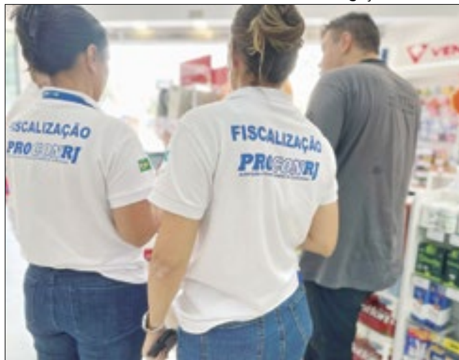
Ação do Procon RJ interdita parcialmente uma farmácia