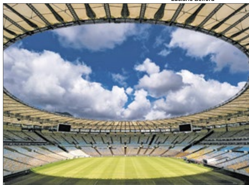
Três consórcios brigam para gerenciar o estádio

O Governo do Rio realizou, nesta terça (5), a segunda etapa do processo de concessão do Complexo Maracanã, com a abertura das propostas técnicas dos três interessados: Consórcio Maracanã para Todos, formado pelo clube Vasco da Gama e pela W Torre Entretenimento e Participações Ltda; Consórcio Fla/Flu, compostos pelos clubes Flamengo e Fluminense; e a empresa RNGD Consultoria de Negócios Ltda. O contrato será de 20 anos e o edital prevê que, até o fim da concessão, o vencedor faça investimentos de cerca de R$ 186 milhões.