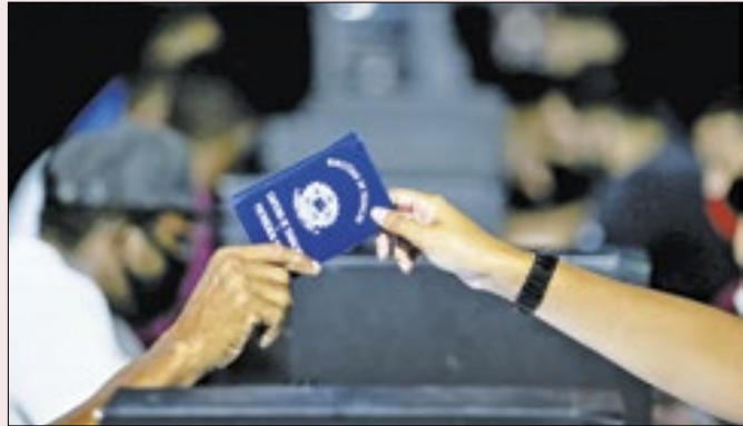
Oportunidades com carteira assinada em diversas regiões