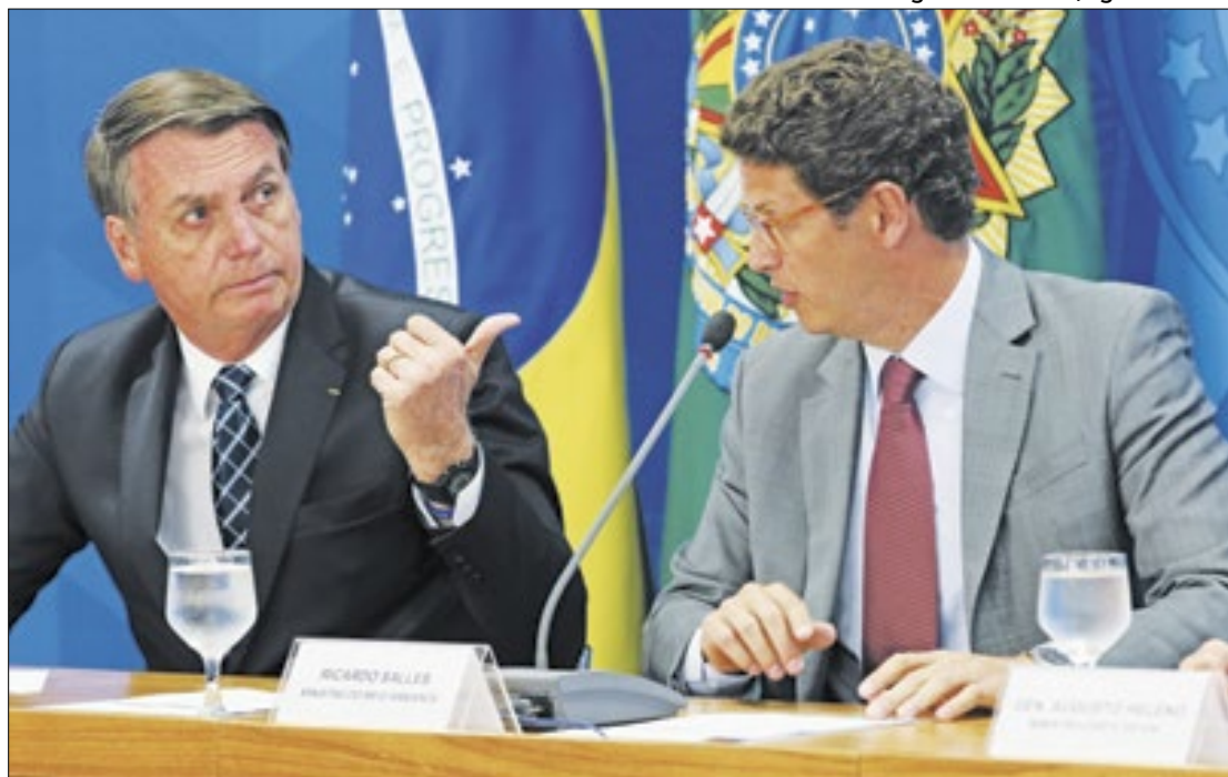
Disputa em São Paulo pode gerar expulsão de Salles do PL

Já no final de janeiro, Ricardo Salles chegou a declarar que não disputaria a prefeitura paulista por acreditar que não