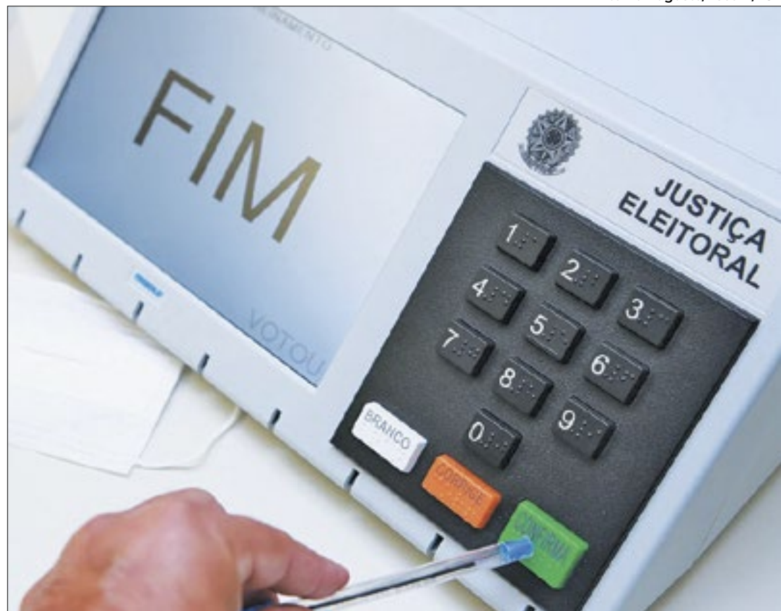
Atuação prevê fiscalização para coibir ações às trabalhadoras nas eleições

Entre as ações, o documento estabelece a realização de campanhas de conscientização sobre o tema, a organização de fóruns de discussão voltados para o público interno e externo, a capacitação de membros e servidores, assim como a troca de informações permanente. Para isso, os órgãos signatários terão que estabelecer planos de trabalho com diretrizes detalhadas, compreendendo abordagens, estratégias e responsabilidades. As instituições também se