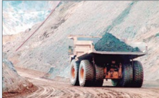
Terceiro recuo de preços atesta fragilidade industrial