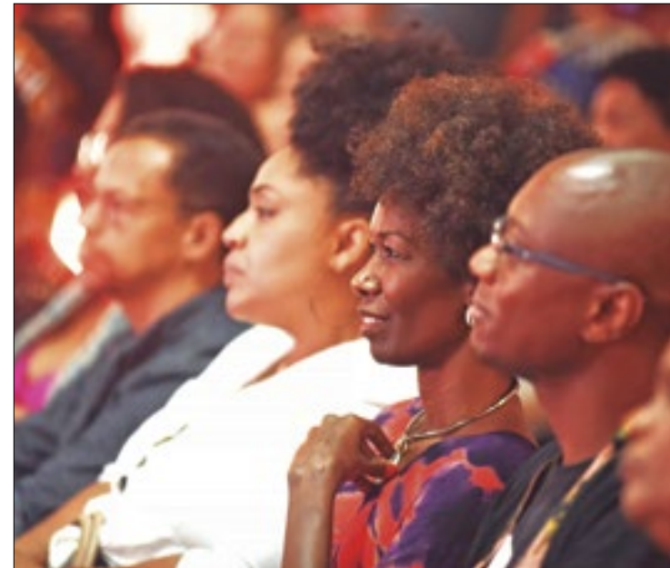
Unidades vão promover debates na luta antirracista