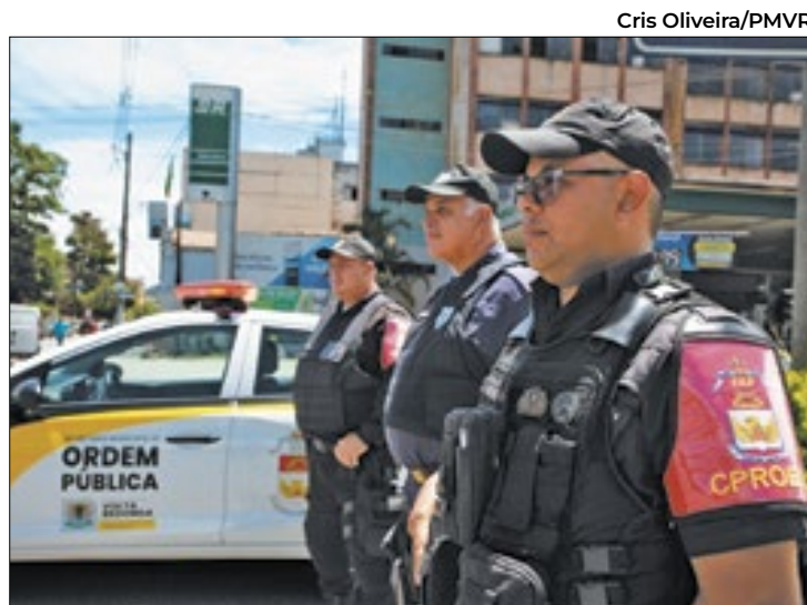
Profissionais serão incorporados à segunda etapa do Proeis

Já em Barra Mansa, além do reforço na equipe de combate ao Aedes aegypti, mosquito transmissor da infecção, o município está em constante contato com o estado, para intensificar a prevenção e o tratamento. Nesta segunda-feira (04), a cidade recebeu