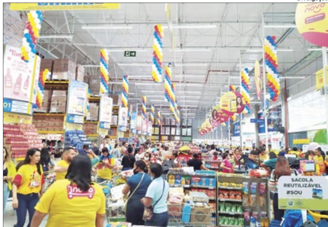
Enquanto recuo gradual de inflação se consolida, PIB também avança

No que se refere aos chamados 'preços administrados', os prognósticos para este ano