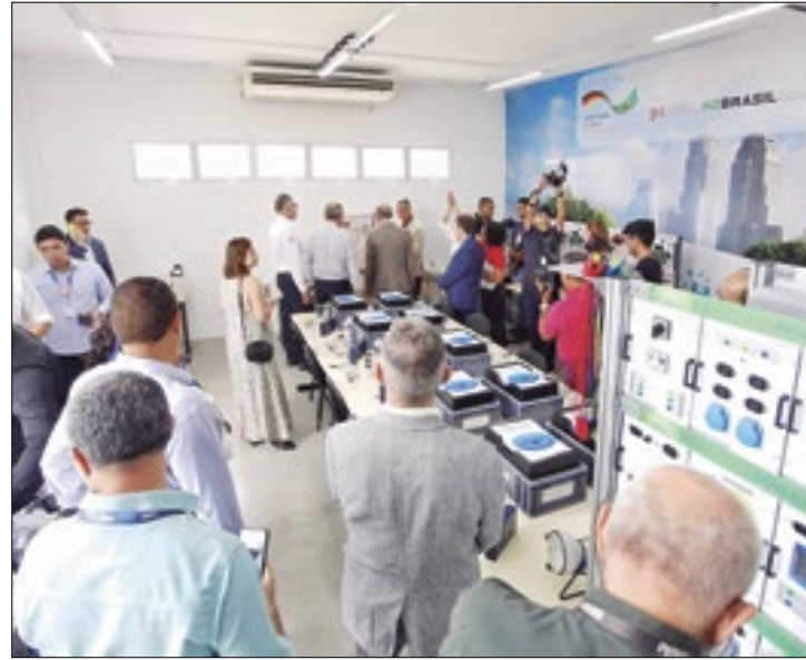
Novo centro formará profissionais na nova tecnologia

Voltado a aulas, experimentos e atividades direcionadas à área de educação, o Senai, em parceria com a GIZ, acaba de inaugurar o primeiro Centro de Excelência em Formação Profissional para Hidrogênio Verde do Brasil, que vai funcionar, no Centro de Tecnologias do Gás e Energias Renováveis (CTGAS-ER), do Senai do Rio Grande do Norte. (Senai-RN). A previsão é de que os primeiros cursos já deverão ter início neste semestre.