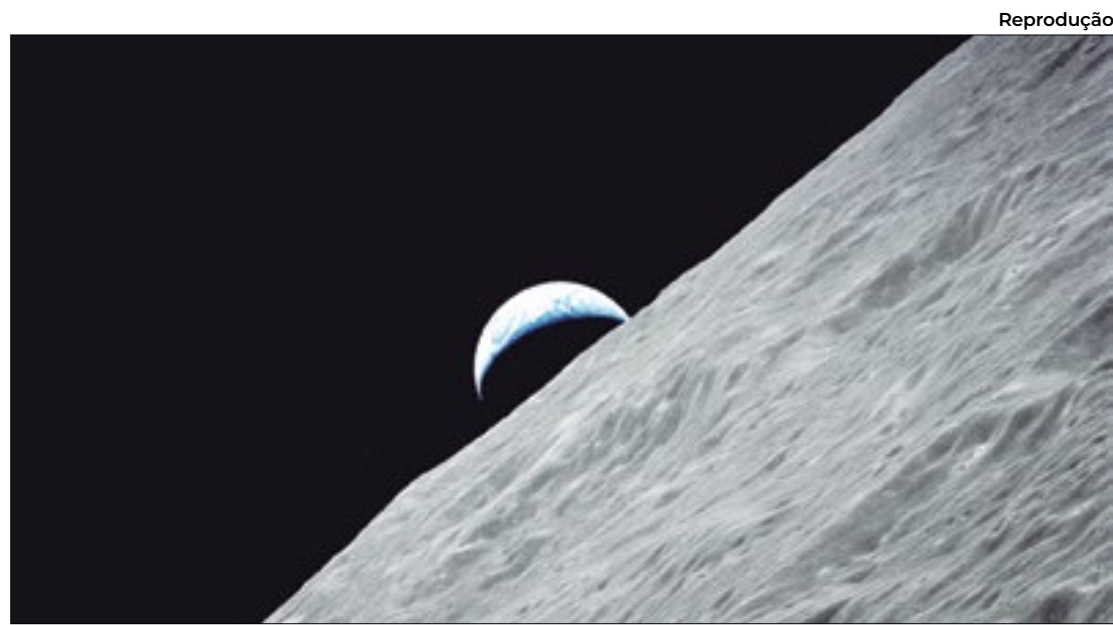
A suposta instalação aconteceria entre 2033 e 2035, segundo Yury Borisov

Ainda segundo ele, painéis solares não seriam capazes de fornecer eletricidade suficiente para alimentar futuros assenta-