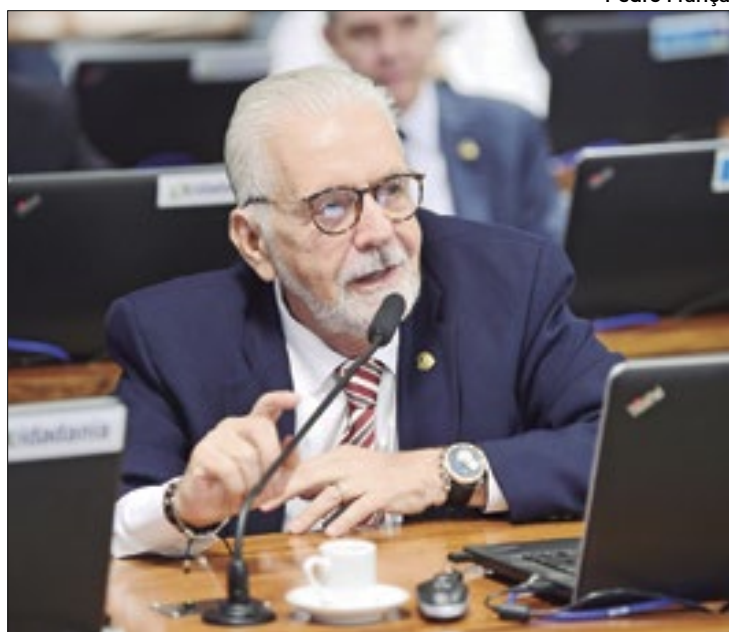
Jaques Wagner defende o fim da reeleição

“Pessoalmente, acho muito ruim o sistema que temos hoje