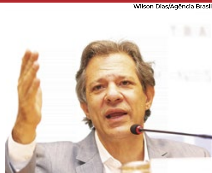
Haddad procura controlar excesso de bondades