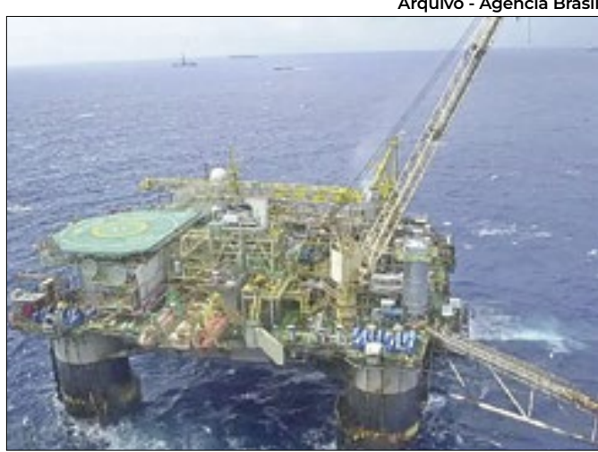
Recuo da estatal levou junto resultado nacional