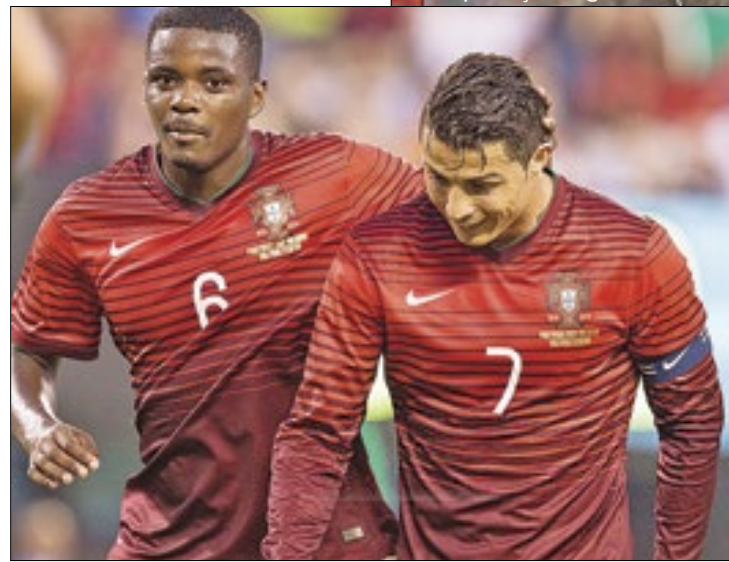
William Carvalho ao lado de Cristiano Ronaldo. Acusado de estupro, volante português negocia com o Flamengo.

Só que, na manhã da segunda (4), o Athletico anunciou a contratação de Cuca para a