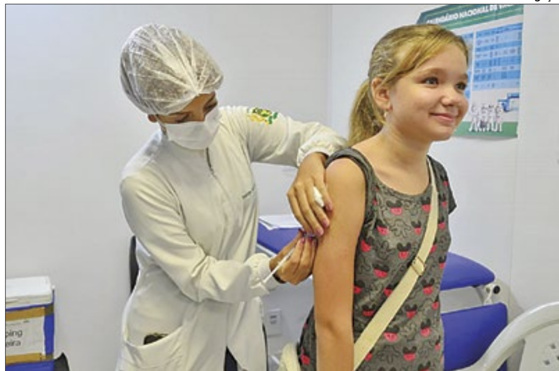
Dia D da Campanha Nacional de Combate à Dengue nos shoppings de Nova Iguaçu