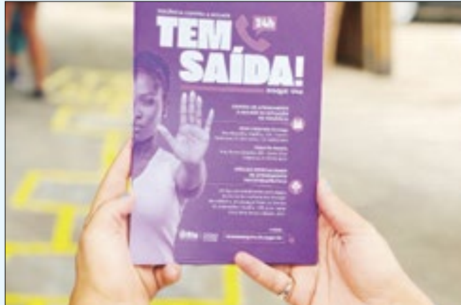
Campanha incentivada pelo mês da mulher