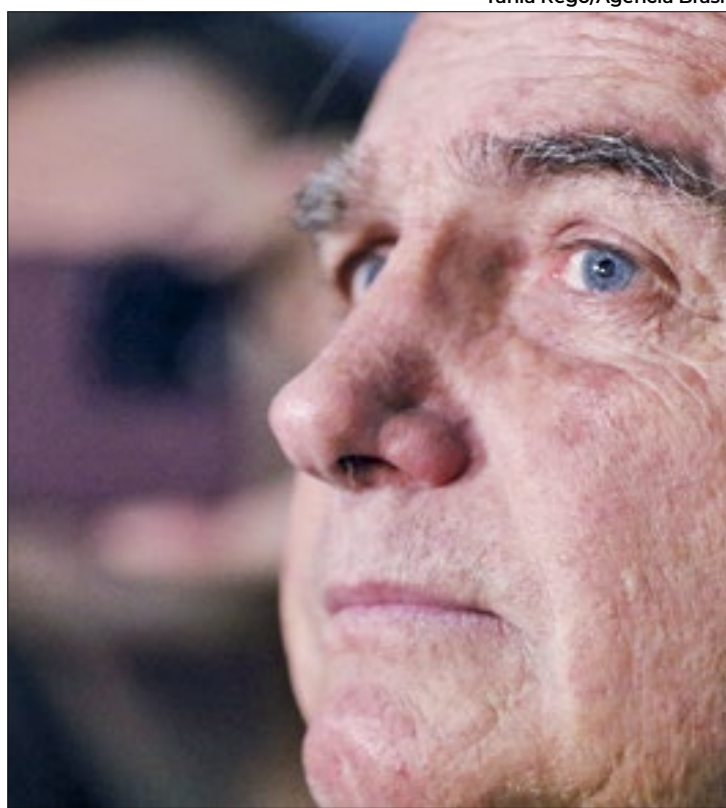
Depoimentos agravam situação de Bolsonaro

O ajudante de ordens Mauro Cid contou aos investigadores que o ex-assessor Filipe Martins apresentou a minuta a Bolsonaro. O texto previa a decretação de Estado de Defesa, para que houvesse uma intervenção no Tribunal Superior Eleitoral (TSE), anulando o resultado das eleições e convocando novo pleito. Também discutiu-se a possibilidade de prisão de autoridades como o presidente do TSE, Alexandre de Moraes. Segundo o relato de Mauro Cid, Bolsonaro então