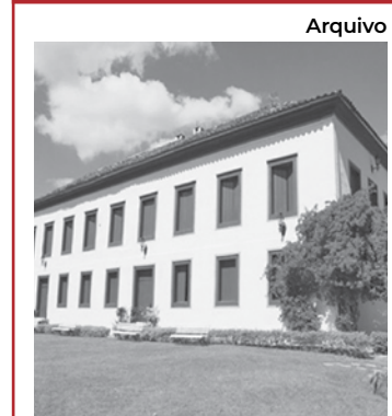
Local é aberto à visitação