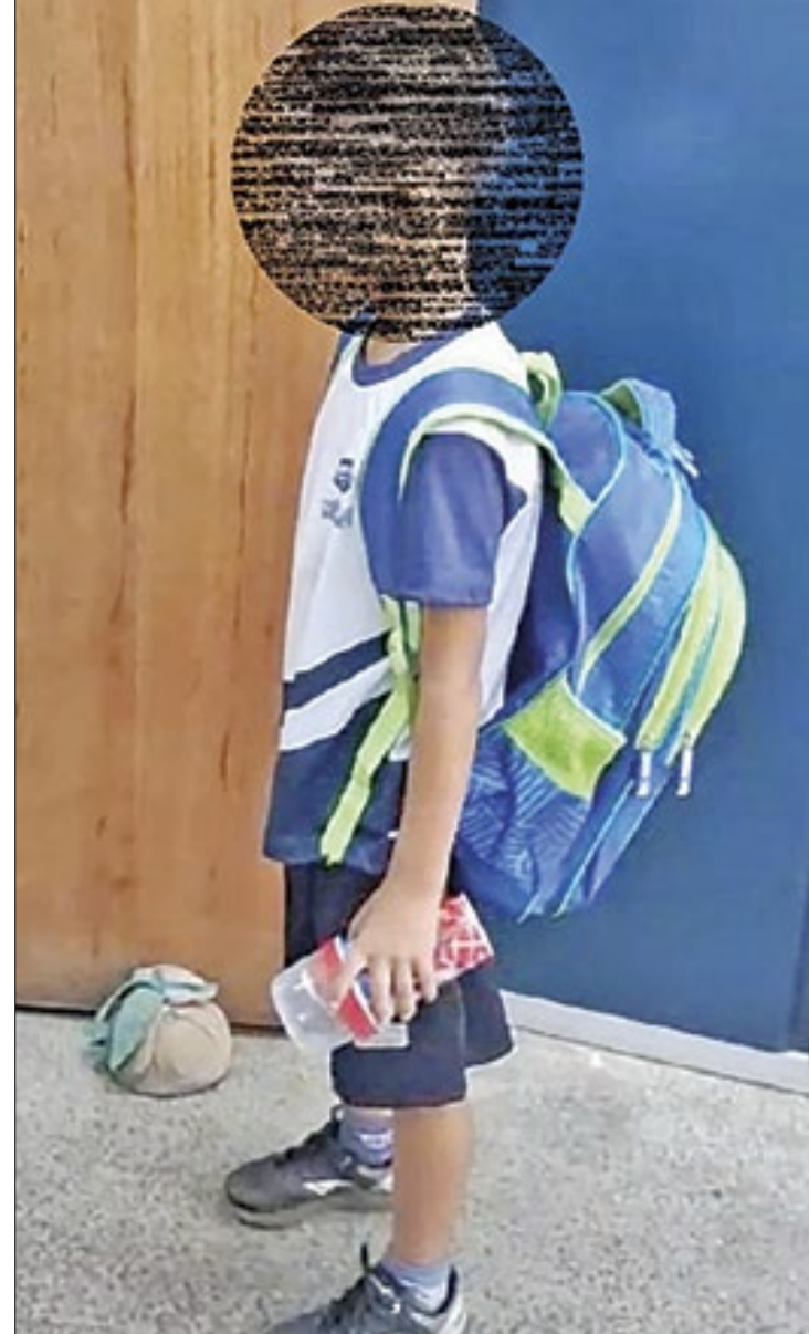
Vídeo tem mais de cinco minutos e não mostra nenhum tipo de acolhimento ao menino

Preferindo manter o anonimato, a mãe do menino fez um apelo para a retirada do vídeo. "A escola do meu filho gravou um vídeo dele alterado. Ele está passando por problemas psico-