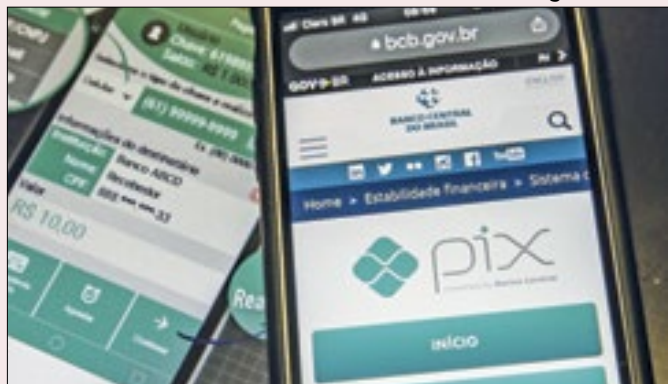
BC diz que falta de orçamento pode comprometer PIX