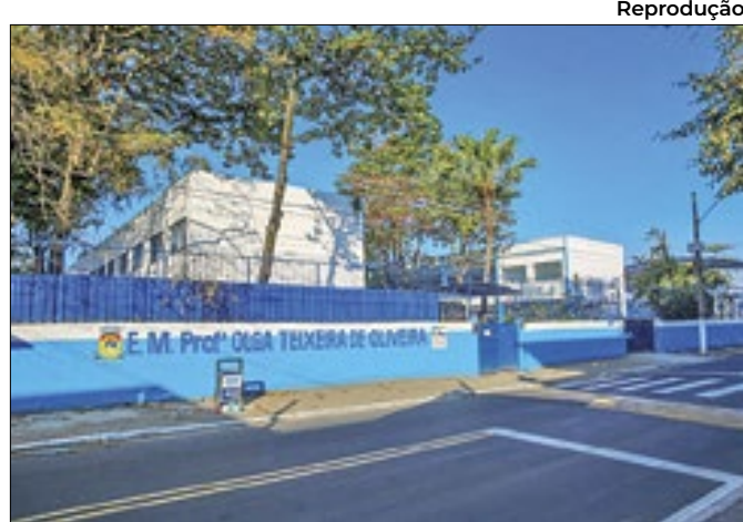
Plataforma visa transformar a gestão educacional