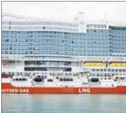
Menor consumo de gás

O consumo de gás na Europa em 2023 caiu para o seu nível mais baixo em 10 anos, à medida que os países melhoram a eficiência energética e implantando mais fontes renováveis. Nos dois