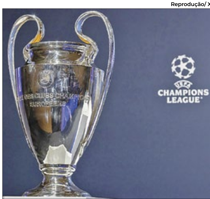
Champions League terá novo formato a partir de 2025

Metade das partidas será jogada como visitante e a outra metade como mandante, mantendo a isonomia do torneio. Cada time enfrentará duas equipes de cada 'pote' sorteado, totalizando os oito jogos. Assim, os oito clubes de melhor desempenho nessa