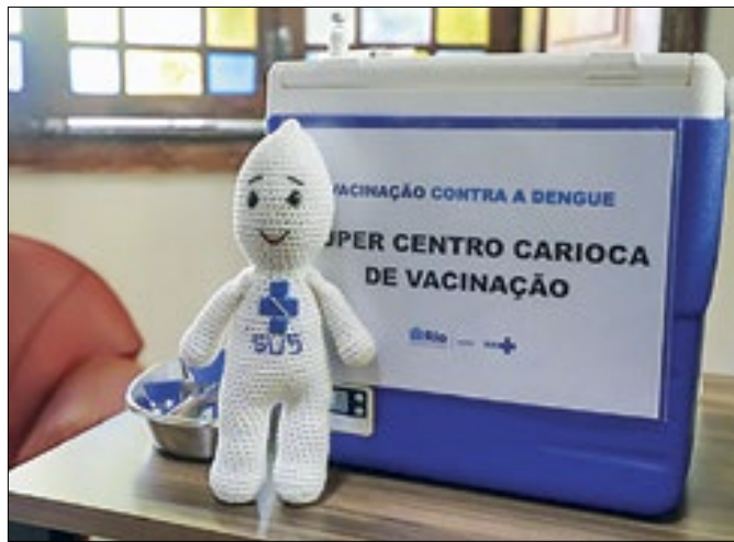
Vacina está em todas as unidades de Atenção Primária