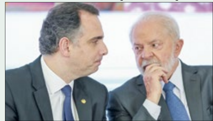
Pacheco: críticas à demora para marcar sessão