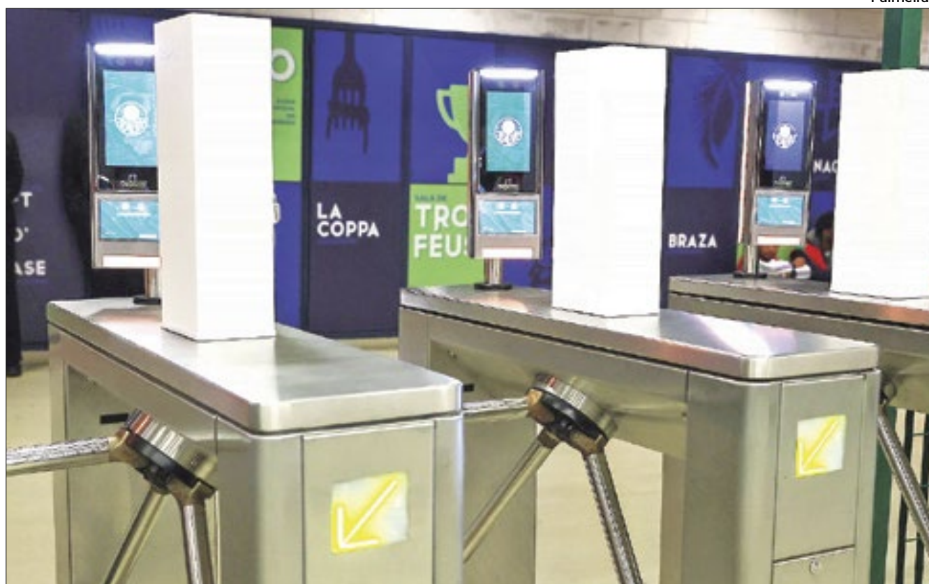
Catracas com reconhecimento facial no Allianz Parque, do Palmeiras

O resultado da parceria incluiu a captura de 39 indivíduos procurados pela Justiça com mandados de prisão em aberto. Além disso, o sistema também contribuiu para localizar 275 pessoas reportadas como desaparecidas, identificou 56 indivíduos que violaram medidas judiciais, detectou 12 casos de uso de documentos falsos e impediu a entrada de cinco torcedores de acordo com o estatuto do torcedor. Ao todo, mais de 200 mil torcedores foram submetidos à fiscalização.