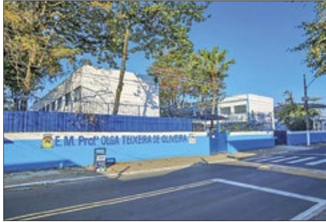
Plataforma visa transformar a gestão educacional