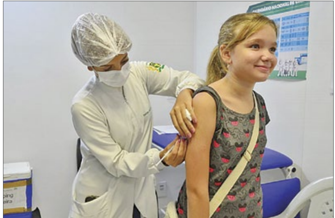
Dia D da Campanha Nacional de Combate à Dengue nos shoppings de Nova Iguaçu