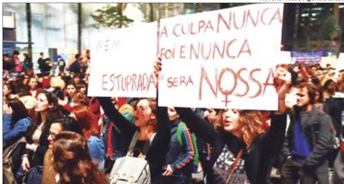
Projeto de lei segue agora para sanção do Executivo

Na cidade, segundo dados do Instituto de Segurança Pública (ISP), o crime de estupro vem ocorrendo com maior incidência, em 2022, foram 104 casos, no ano seguinte, em 2023,