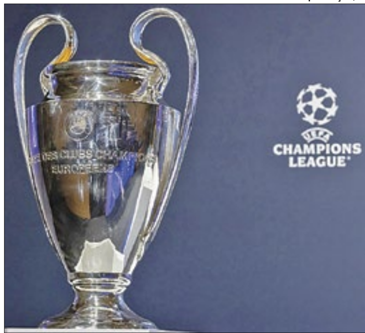
Champions League terá novo formato a partir de 2025

Metade das partidas será jogada como visitante e a outra metade como mandante, mantendo a isonomia do torneio. Cada time enfrentará duas equipes de cada 'pote' sorteado, totalizando os oito jogos. Assim, os oito clubes de melhor desempenho nessa