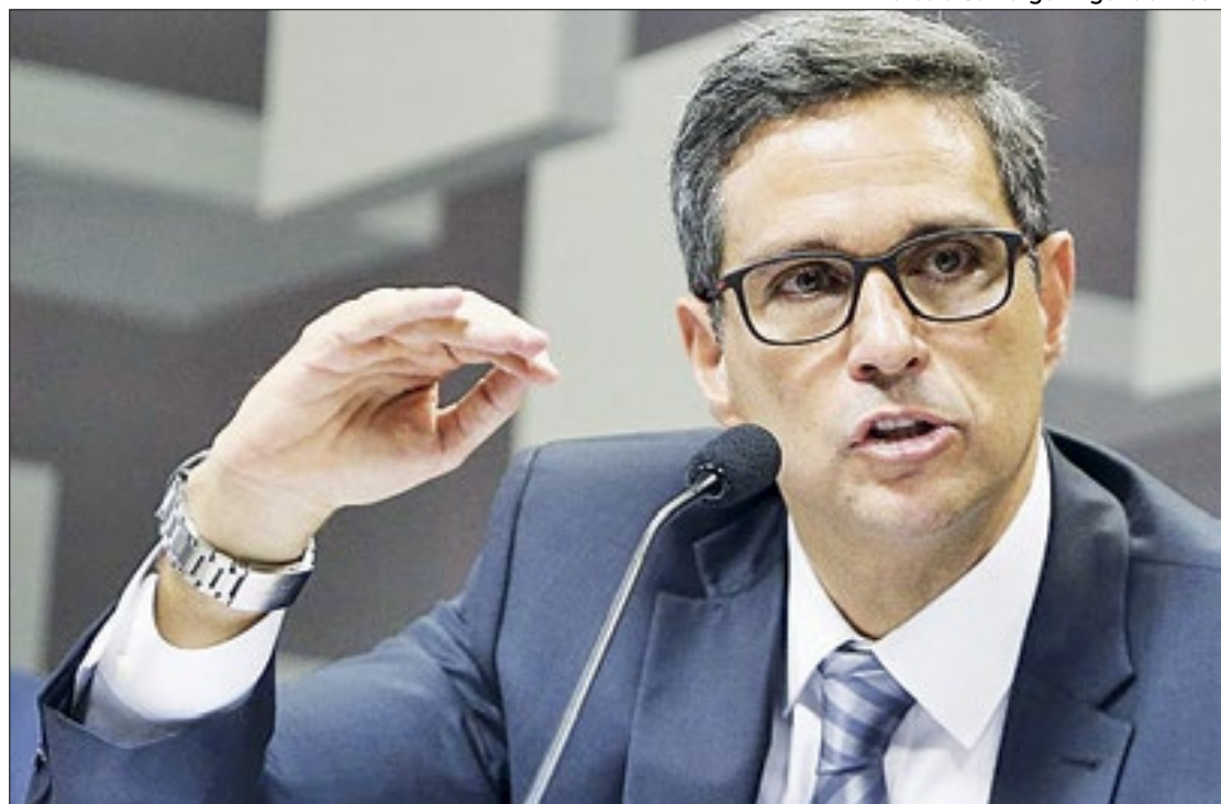
Para comandante do BC, quadro externo inibe flexibilização monetária

os preços caminham na direção da meta, embora a inflação de serviços "ainda rode acima do observado no período anterior à pandemia".