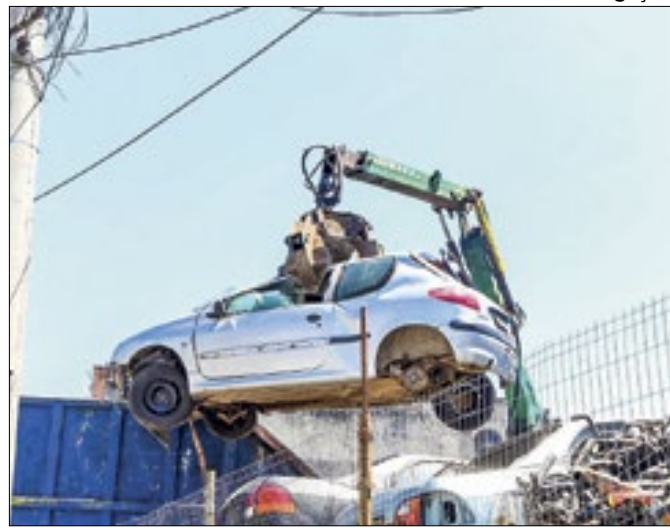
Detran.RJ realiza fiscalização em ferro-velho