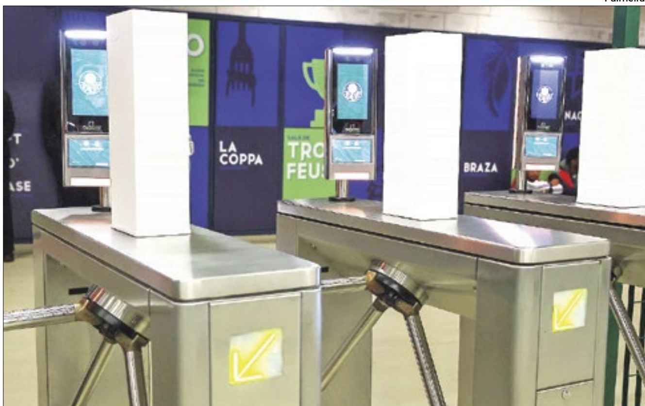
Catracas com reconhecimento facial no Allianz Parque, do Palmeiras

O resultado da parceria incluiu a captura de 39 indivíduos procurados pela Justiça com mandados de prisão em aberto. Além disso, o sistema também contribuiu para localizar 275 pessoas reportadas como desaparecidas, identificou 56 indivíduos que violaram medidas judiciais, detectou 12 casos de uso de documentos falsos e impediu a entrada de cinco torcedores de acordo com o estatuto do torcedor. Ao todo, mais de 200 mil torcedores foram submetidos à fiscalização.