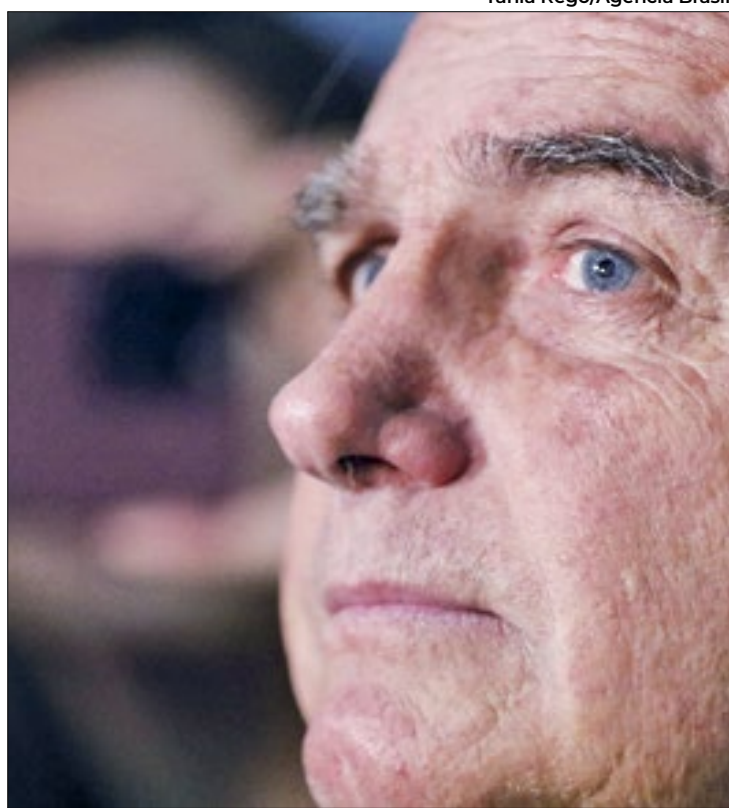
Depoimentos agravam situação de Bolsonaro

O ajudante de ordens Mauro Cid contou aos investigadores que o ex-assessor Filipe Martins apresentou a minuta a Bolsonaro. O texto previa a decretação de Estado de Defesa, para que houvesse uma intervenção no Tribunal Superior Eleitoral (TSE), anulando o resultado das eleições e convocando novo pleito. Também discutiu-se a possibilidade de prisão de autoridades como o presidente do TSE, Alexandre de Moraes. Segundo o relato de Mauro Cid, Bolsonaro então