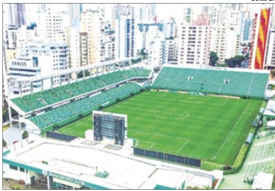
O estádio do Goiás também usa a tecnologia nas catracas

Instituída em 2018, a Lei Geral de Proteção de Dados Pessoais (LGPD)