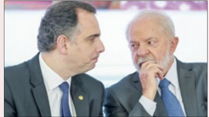
Pacheco: críticas à demora para marcar sessão