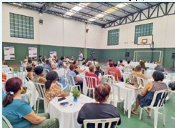
Tema escolhido foi "Cidades saudáveis e sustentáveis"