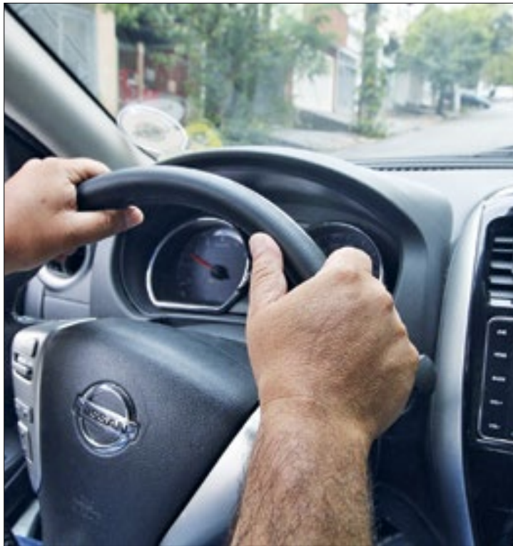
Projeto cria direitos e garantias para os motoristas