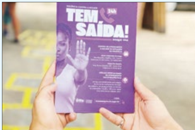
Campanha incentivada pelo mês da mulher