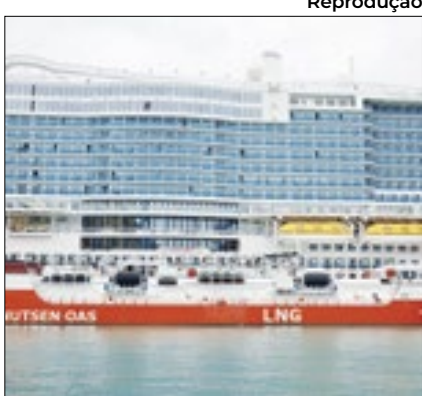
Menor consumo de gás

O consumo de gás na Europa em 2023 caiu para o seu nível mais baixo em 10 anos, à medida que os países melhoram a eficiência energética e implantando mais fontes renováveis. Nos dois