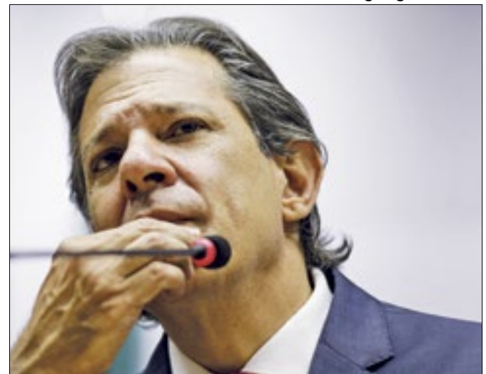
Ministro tentará contornar divergências