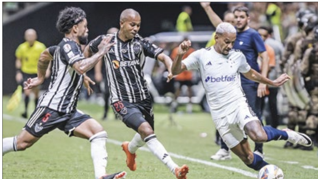
Em campo, rivais disputam o clássico com garra e vontade. Porém, do lado de fora dos estádios, "torcedores" organizados travam guerras pelas ruas

Futebol ainda precisa ratificar a decisão do MP, e publicar a decisão em seu site e da CBF, fazendo constar que se trata de Resolução das entidades organizadoras dos campeonatos de futebol que tenham a participação do Cruzeiro e do Atlético.