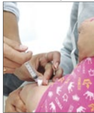
imunizante em falta

A Secretária Municipal de Saúde de Nova Friburgo informou que devido à falta de doses no Estado do Rio, a vacinação contra covid-19 para o público entre 6 meses e menores de 4 anos, 11 meses e 29 dias com o imunizante Pfizer Baby está temporariamente suspensa. O município aguarda a chegada de novos lotes da vacina para que a aplicação seja normalizada. A Secretária reforça que é importante imunizar as crianças contra o vírus, pois é um dos métodos mais eficazes de prevenção da doença.