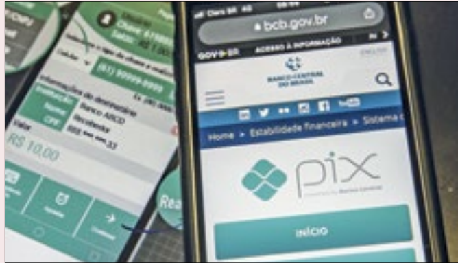
BC diz que falta de orçamento pode comprometer PIX