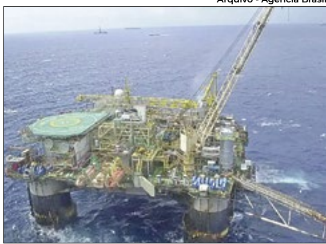
Recuo da estatal levou junto resultado nacional