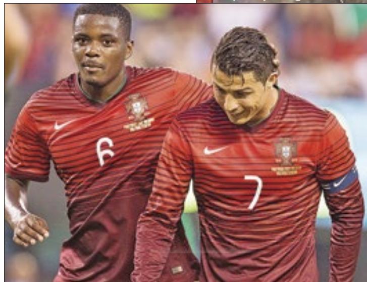
William Carvalho ao lado de Cristiano Ronaldo. Acusado de estupro, volante português negocia com o Flamengo.

Só que, na manhã da segunda (4), o Athletico anunciou a contratação de Cuca para a