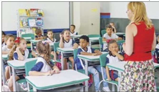
Gestão reforça quadro de professores municipais