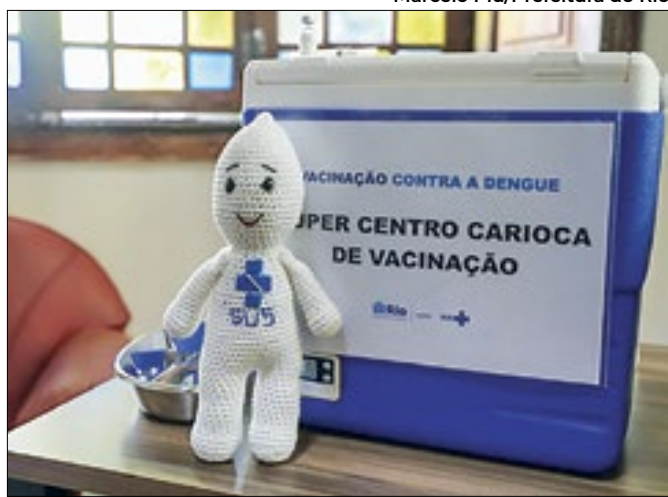
Vacina está em todas as unidades de Atenção Primária