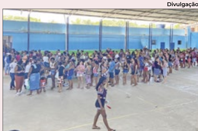
Prefeitura em ação chegou ao bairro Jardim Delamare

identificar áreas de melhoria e melhorar o desempenho acadêmico. O e-Duque prioriza a segurança dos dados dos alunos e a integridade das informações, garantindo que todos os dados se mantenham protegidos. O sistema já começou a ser implementado nas escolas municipais.