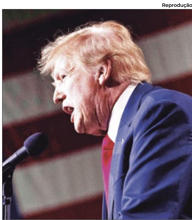
Trump é o favorito para representar o Partido Republicano na eleição presidencial

Trump é o favorito para representar o Partido Republicano na eleição presiden-