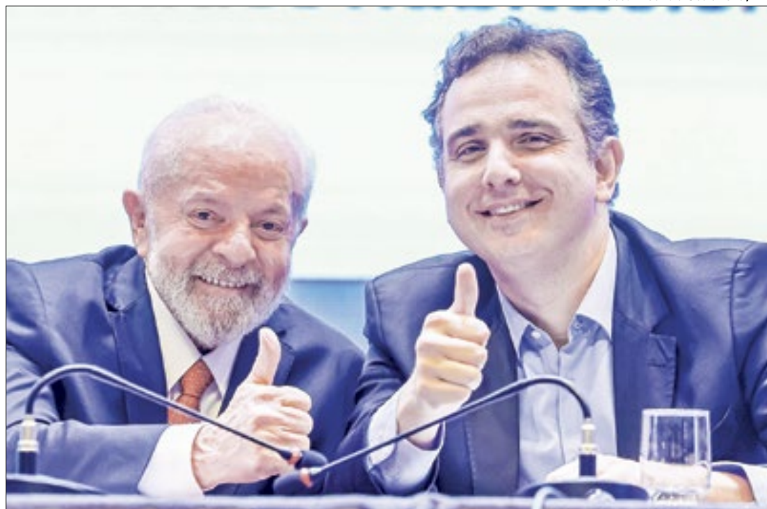
Lula se reunirá com Pacheco e os demais senadores

discutido na reunião e ao longo desta semana são as Propostas de Emenda à Constituição (PECs) para tratar do fim da reeleição para cargos do Executivo e mudanças no Código Eleitoral. O texto propõe o fim da reeleição para presidente da República, governadores e prefeitos. O relator da proposta, senador Marcelo Castro (MDB-PI), defendeu que as reeleições não têm se mostrado benéficas para a política nacional.