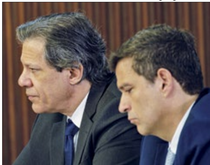
Entrevista de Campos Neto gerou reação de Haddad