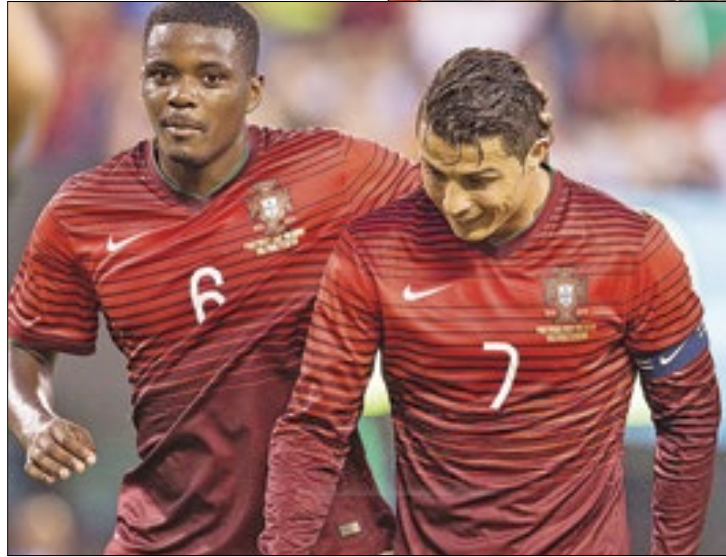
William Carvalho ao lado de Cristiano Ronaldo. Acusado de estupro, volante português negocia com o Flamengo.

Só que, na manhã da segunda (4), o Athletico anunciou a contratação de Cuca para a