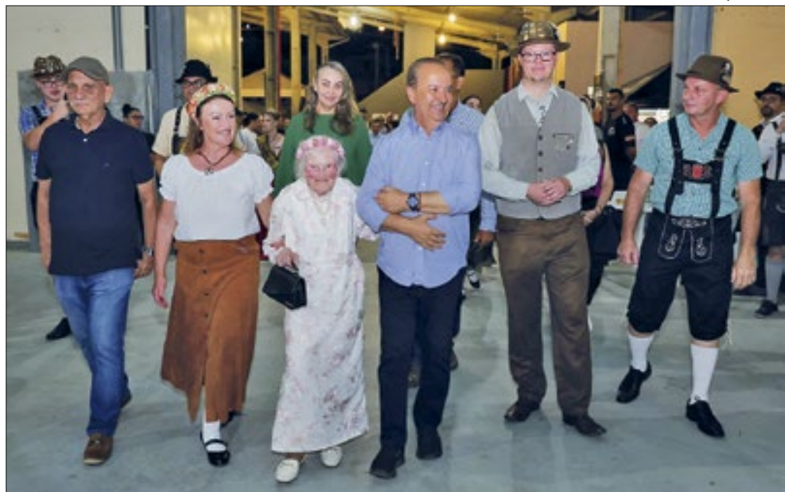
O governador participou da solenidade em comemoração aos 195 anos de imigração