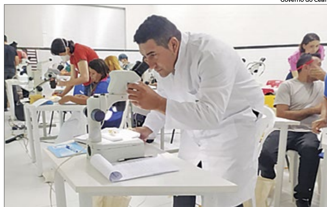
Amadeu sugeriu a implantação de um laboratório de análise de animais peçonhentos

Capacitações inspiram servidor a propor mudanças na saúde