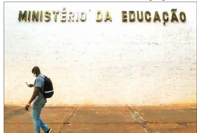
Ministério elabora Plano Nacional da Educação