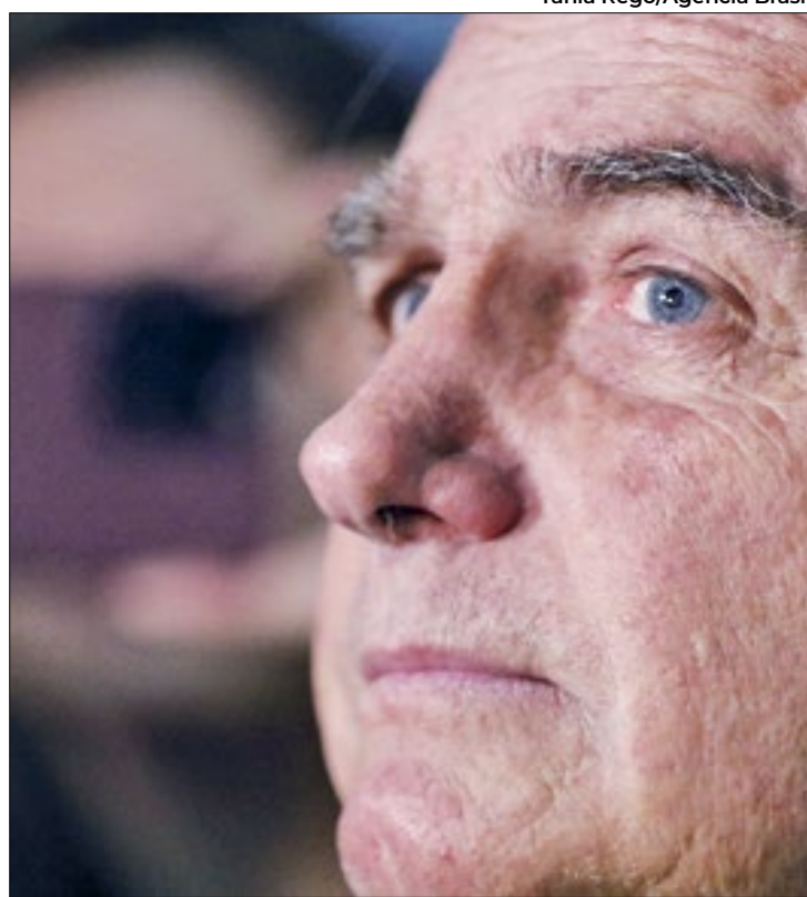
Depoimentos agravam situação de Bolsonaro

O ajudante de ordens Mauro Cid contou aos investigadores que o ex-assessor Filipe Martins apresentou a minuta a Bolsonaro. O texto previa a decretação de Estado de Defesa, para que houvesse uma intervenção no Tribunal Superior Eleitoral (TSE), anulando o resultado das eleições e convocando novo pleito. Também discutiu-se a possibilidade de prisão de autoridades como o presidente do TSE, Alexandre de Moraes. Segundo o relato de Mauro Cid, Bolsonaro então