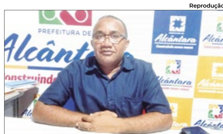
Nomeação de companheira levantou questionamentos

No interior, houve uma redução de 26% na quantidade de homicídios dolosos nos 71 municípios do interior em comparação com em 2023.