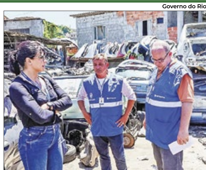
Fiscais do Detran autuam dois estabelecimentos