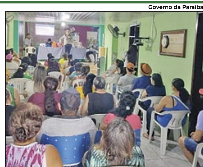
Evento apresenta direitos previdenciários para mulheres