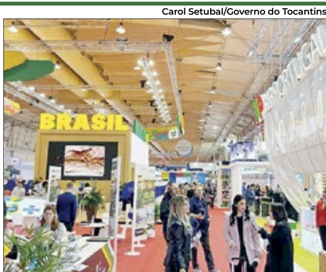
Carol Setubal/Governo do Tocantins

Estande reservado ao estado foi um dos mais visitados