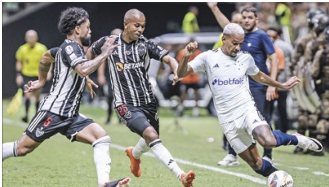
Em campo, rivais disputam o clássico com garra e vontade. Porém, do lado de fora dos estádios, "torcedores" organizados travam guerras pelas ruas

Futebol ainda precisa ratificar a decisão do MP, e publicar a decisão em seu site e da CBF, fazendo constar que se trata de Resolução das entidades organizadoras dos campeonatos de futebol que tenham a participação do Cruzeiro e do Atlético.