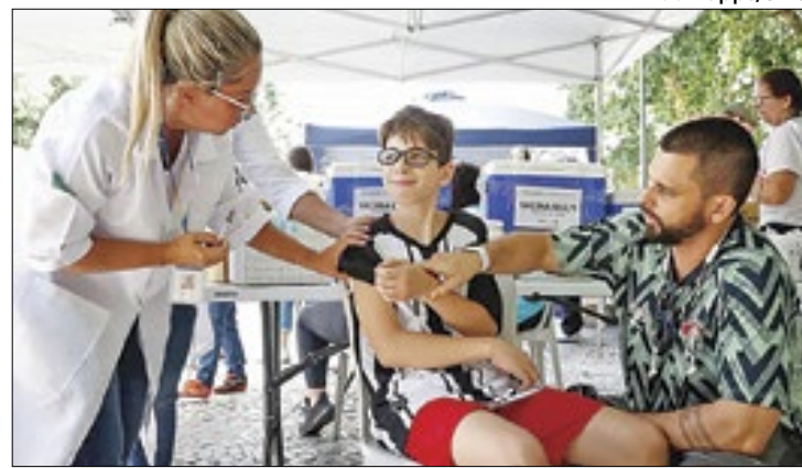
Cidade também vacina público de 10 e 11 anos