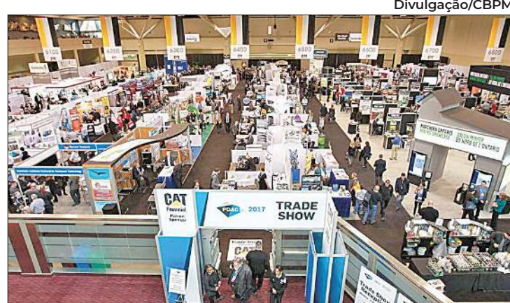
CBPM participa de convenção mundial de mineração

A prefeitura destaca que tem feito esforços para atrair turistas durante períodos fora da alta temporada de verão. Um exemplo é o São João Massayó, que gerou uma movimentação econômica superior a R$ 350 milhões na região, consolidando-se como o principal evento junino do litoral nordestino.