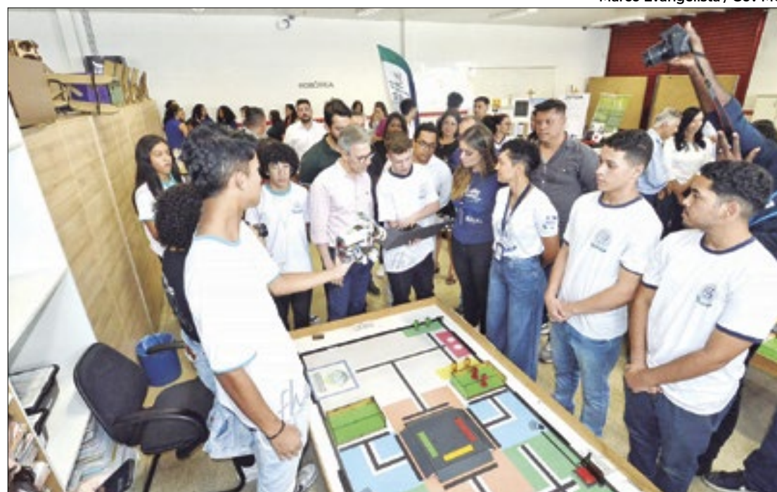
Governador Romeu Zema esteve na instituição nesta segunda-feira

Iniciativas de alunos têm feito sucesso em feiras e competições