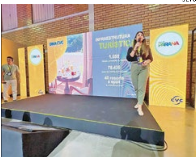
Atrativos foram apresentados no Rio Grande do Sul