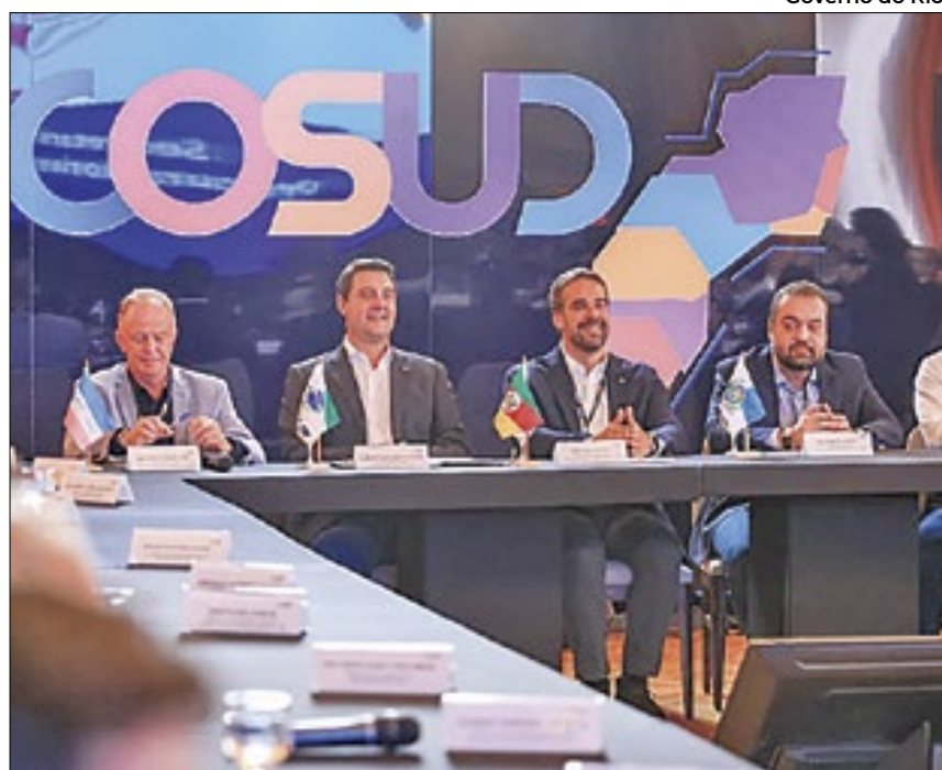
Governadores do Sul e Sudeste mais entrosados politicamente