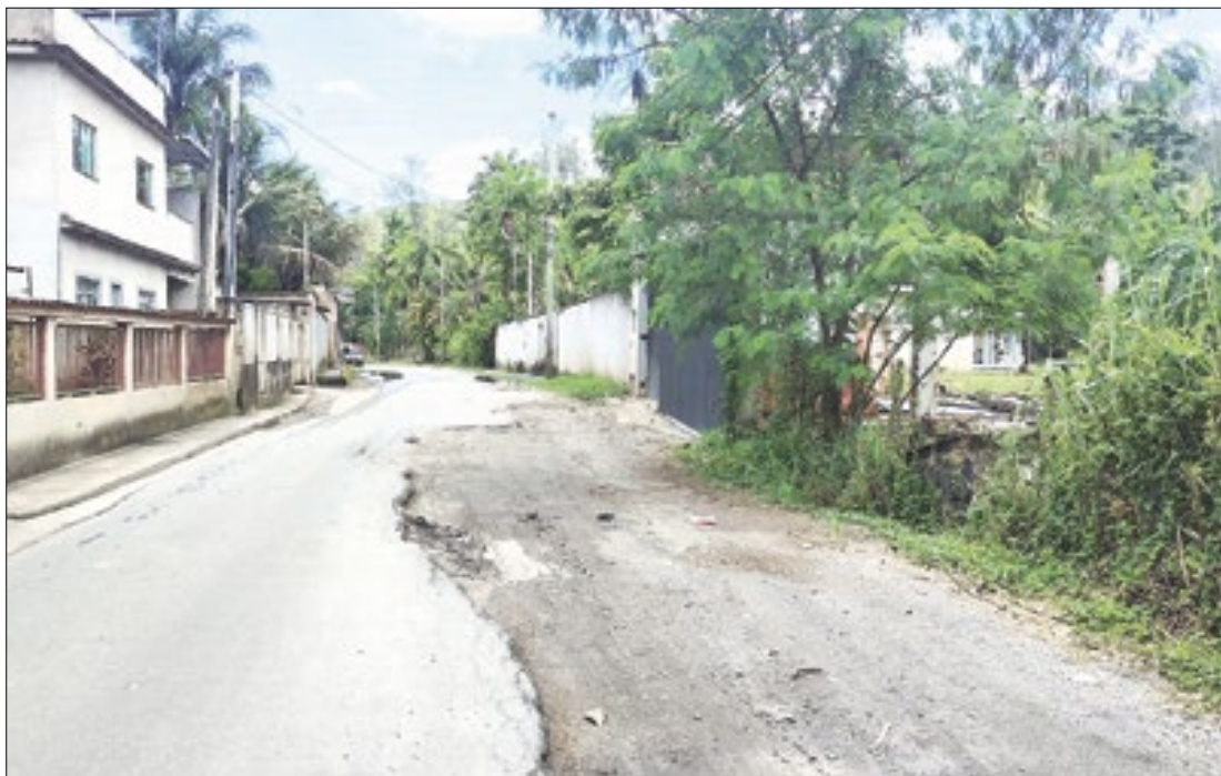
Entre vários problemas, rua possui desnível extenso que dificulta passagem de veículos

O morador cita que, após o asfaltamento da rua, os buracos começaram a surgir com o passar dos anos, citando especificamente uma fissura presente em um dos quebra-molas da rua, localizado na descida de um morro. "Estava vazando água naquele local. Mexeram pra consertar e fecharam o buraco com terra, sem recapar o asfalto". Pedro também aponta para um extenso desnível, coberto por pedregulhos e também sem asfalto, presente na via, que