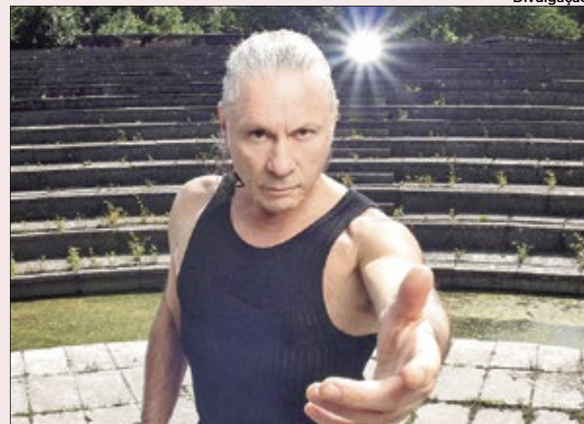
Bruce Dickinson gravando canções escritas há alguns anos