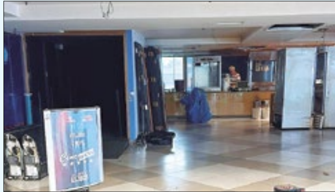
Paralisação deve-se pelas obras de expansão do local