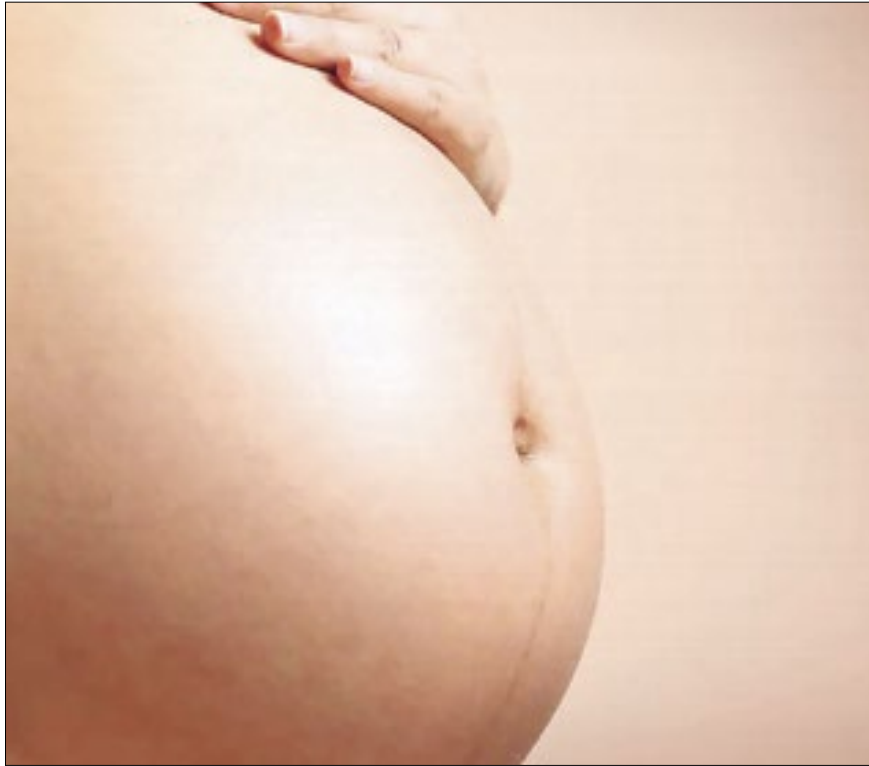
Alerta é da Federação Brasileira de Ginecologia Obstetrícia

Outra variável importante é a preferência de cor para a qual o