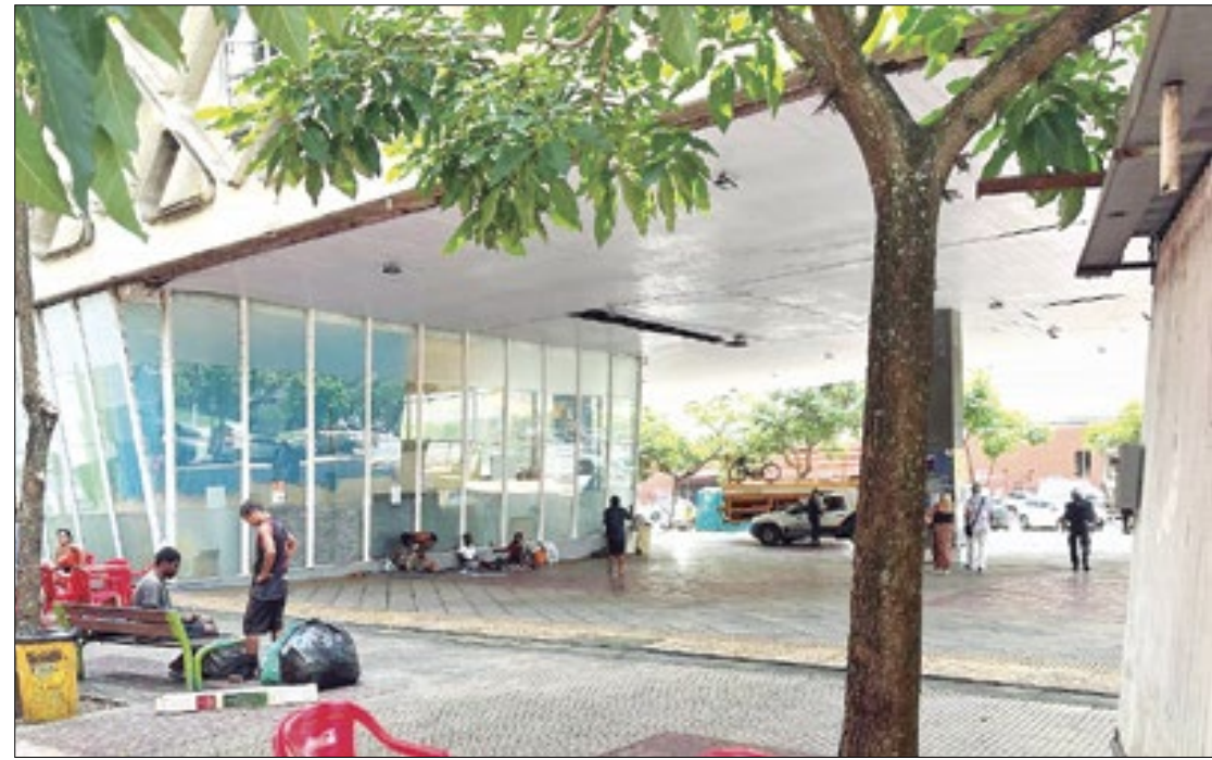
Moradores em situação de rua costumam ficar embaixo da biblioteca na Vila Santa Cecília