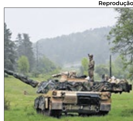
Primeiro M1A1 Abrams perdido

A Ucrânia perdeu pela primeira vez um dos 31 tanques pesados M1A1 Abrams enviados pelos Estados Unidos para ajudar no esforço de guerra contra a Rússia.