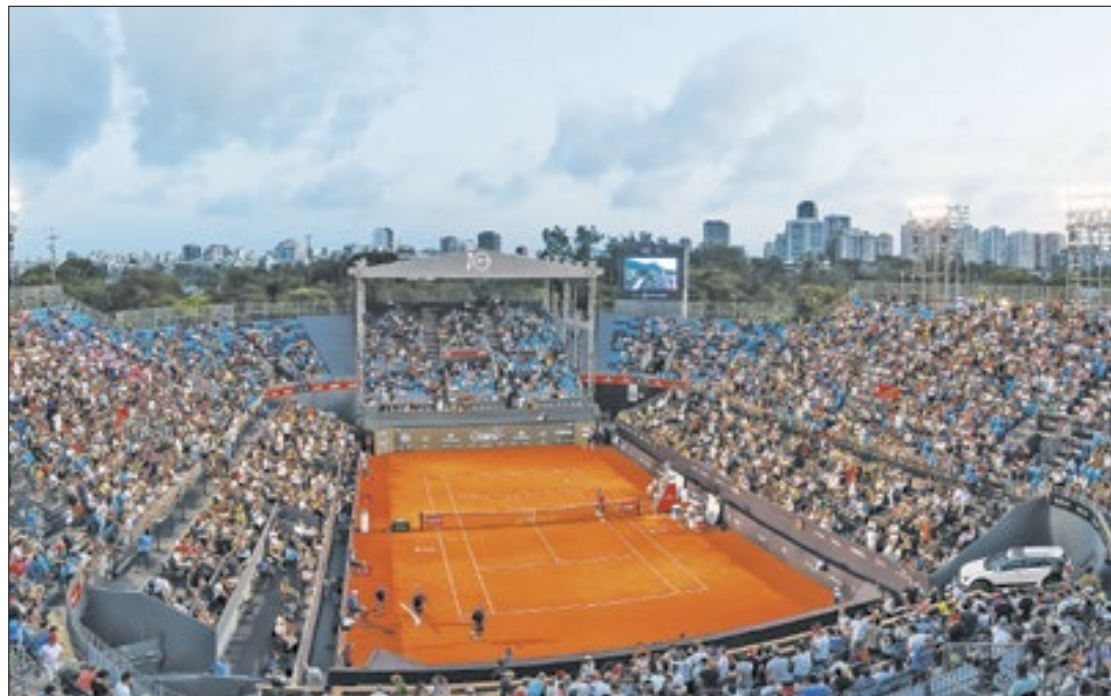
Torneio se consolida no calendário esportivo da cidade

A edição comemorativa pelos dez anos do Rio Open, o maior torneio de tênis na América do Sul, chegou ao fim neste domingo (25), com o título do argentino Sebastian Baez sobre o conterrâneo Mariano Navone. Realizado com apoio de R$ 15,4 milhões da Lei estadual de Incentivo ao esporte, o evento recebeu mais de 60 mil pessoas ao longo de nove dias, gerou cerca de 5 mil empregos, atraiu turistas nacionais e internacionais e ajudou a consolidar o Rio como o epicentro da modalidade no país. A estimativa é que a competição promova um impacto de mais de R$ 150 milhões na economia fluminense.