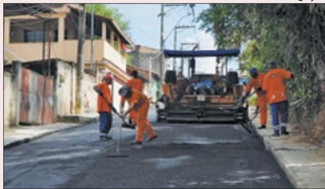
Seis ruas do bairro estão recebendo pavimentação