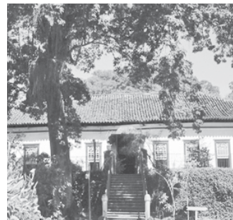
Fazenda Cachoeira do Mato Dentro