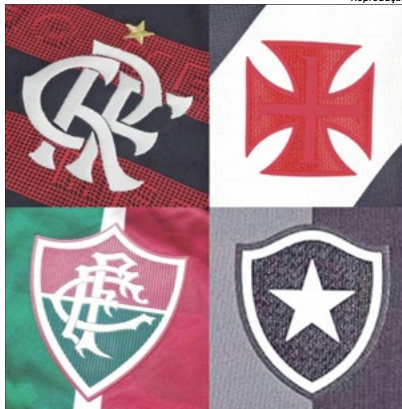
Futebol Carioca viverá uma semana importante para a temporada

Por mais que a fase do Glorioso não seja boa, parece muito improvável sofrer uma goleada desse porte. A situação fica ainda mais complicada para o Nova Iguaçu, que tem apenas quatro gols de saldo. Para surpreender a todos, teria que vencer o Volta Redonda, fazendo ao menos 16 gols no Voltaço.