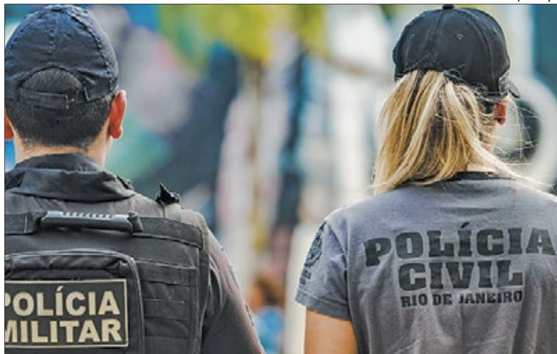
Atuação das forças de segurança resultou em quedas nos indicadores de criminalidade

Cabo Frio vai se vestir de rosa no domingo (3) com a realização da 1ª Corrida e Caminhada Enel Mulher Ativa, na orla da Praia do Forte. A concentração será na Praça da Cidadania, às 8h. A atividade marca o encerramento do projeto, sendo uma iniciativa que tem o patrocínio da Enel.