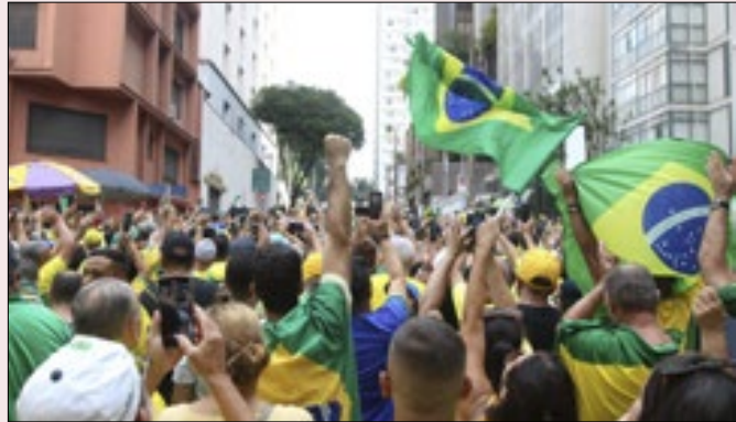
Ato demonstra força política de Bolsonaro