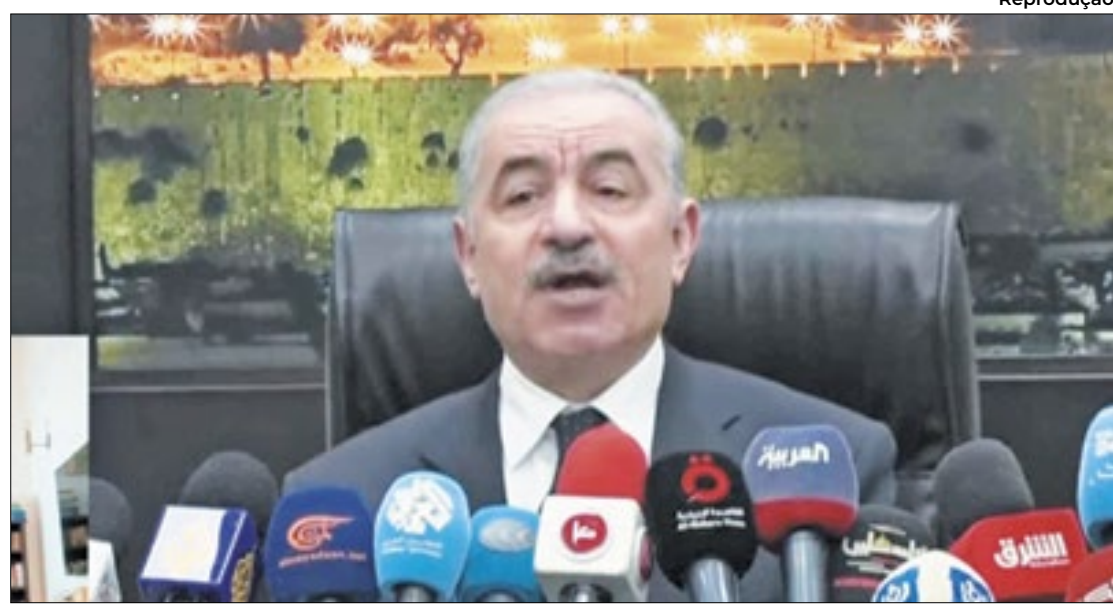
Acadêmico e economista, o premiê assumiu o cargo em 2019

Constituída em 1993, a ANP governa apenas parcialmente a Cisjordânia, um território palestino ocupado cuja governança se assemelha a uma colcha de retalhos depois da di-