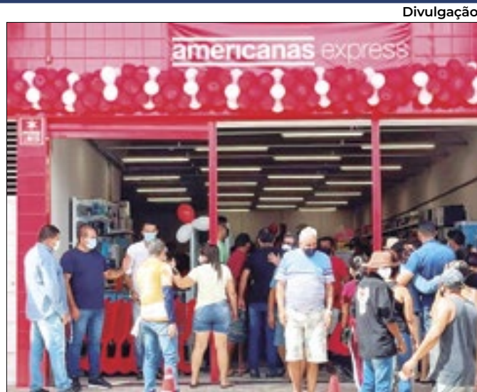
Redução de perdas no balanço não esconde dívida colossal