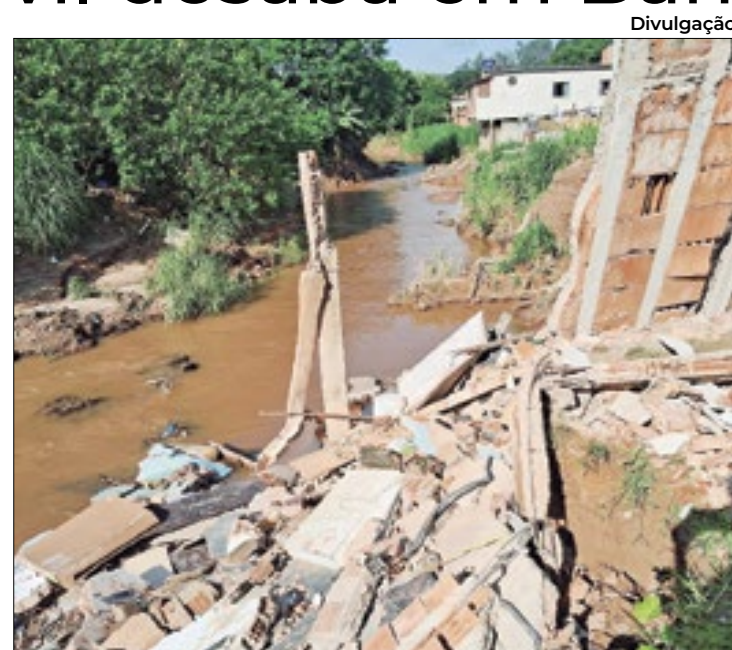
Moradores são acompanhados pela Assistência Social