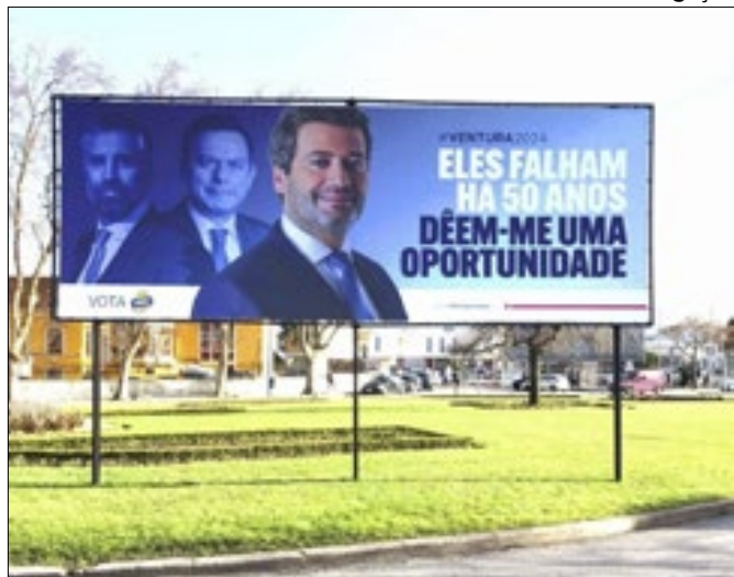
Chega inspira-se no crescimento da direita brasileira