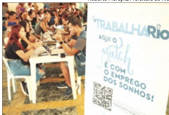
Roberto Moreyra/Prefeitura do Rio

São 418 para trabalhador em geral e 403 para PcD