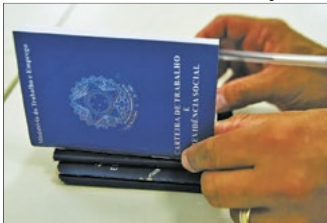
Caxias receberá Mega Feirão de Empregos