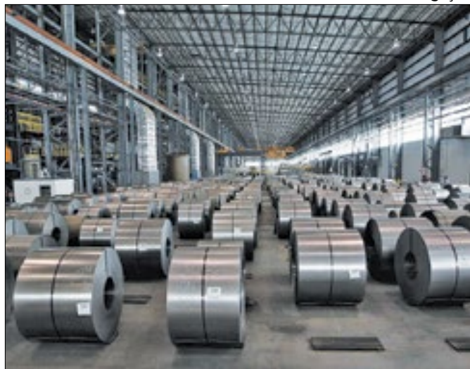
Rio produziu 8,6 milhões de toneladas ano passado