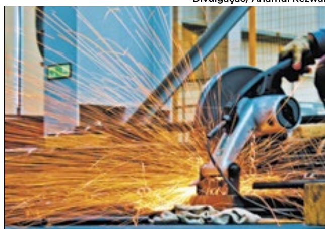
Crescimento da violência vem afugentando investidores

A insegurança social, alimentada pelo temor da escalada da criminalidade no país, é um dos principais fatores causadores do avanço da desindustrialização, em determinadas regiões brasileiras. A constatação faz parte de estudo desenvolvido pelo Ipea.