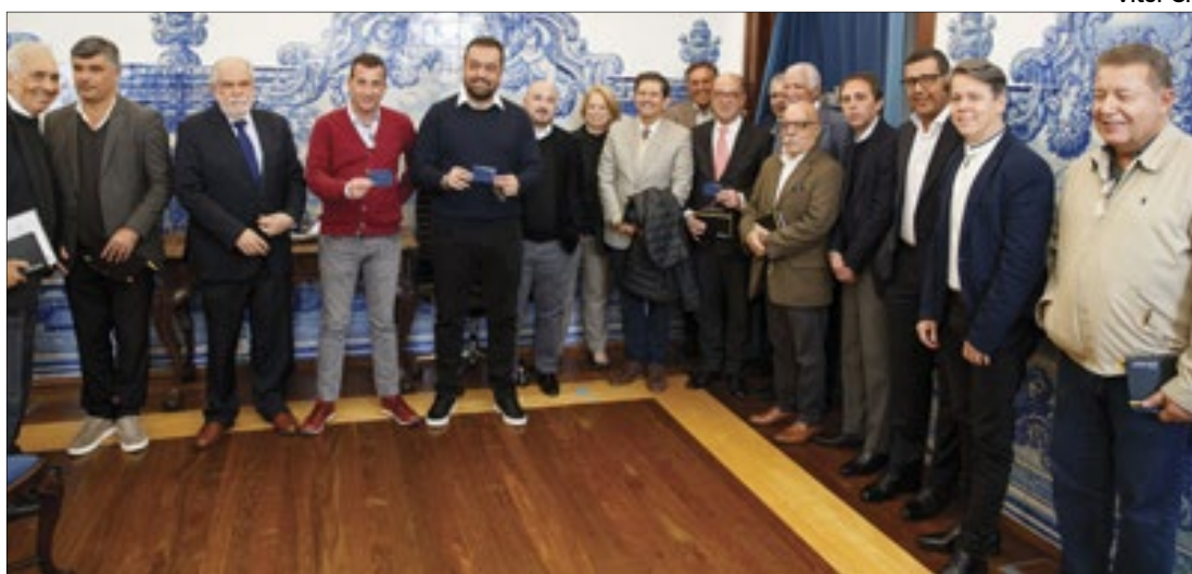
O governador do Rio, Cláudio Castro (5º), esteve em Cascais, em Portugal, e se encontrou com o prefeito Carlos Carreiras (10º). Em encontro de negócios para ampliar a relação comercial entre o estado e Portugal, estiveram presentes também investidores europeus