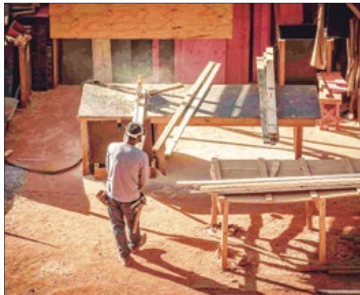
Portal da Indústria

De acordo com a economista da CNI, Paula Verlangero, “as pequenas indústrias são as mais penalizadas com as mudanças econômicas como, por exemplo, o aumento da taxa básica de juros. Também são as que tem menos disponibili-