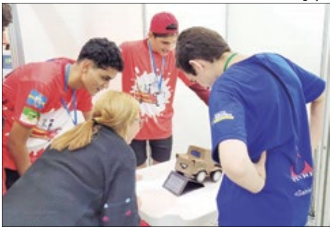
Grupo foi o único da cidade a conquistar o resultado

Moradores temem por segurança em algumas áreas da cidade