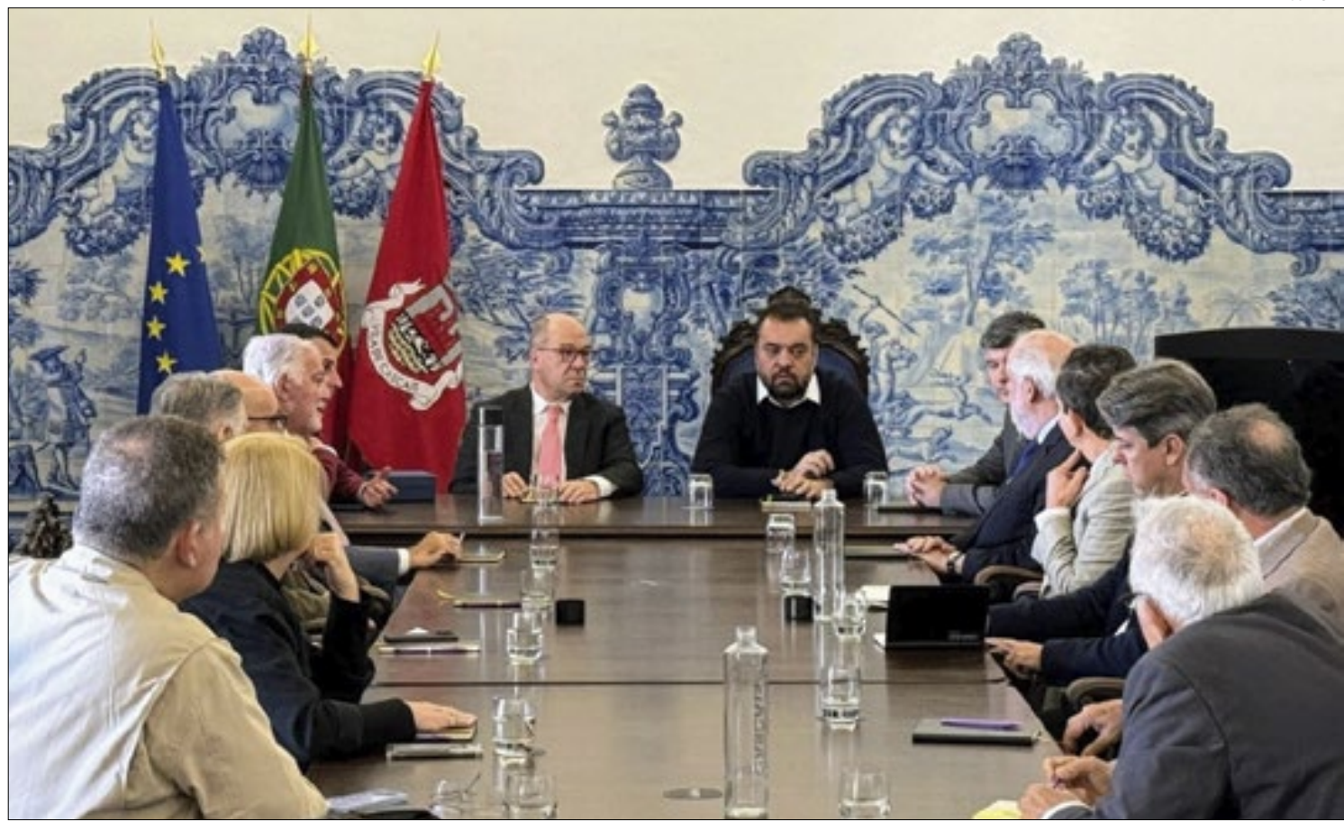
Reunião entre o governador do Rio, Cláudio Castro, com o prefeito de Cascais, Carlos Carreiras, nesta segunda-feira

Na reunião desta segunda, o governador reforçou os laços culturais e turísticos entre o Estado do Rio de Janeiro e a cidade portuguesa que está a 30 km da capital Lisboa. Em 2023, foi assinado um acordo de cooperação entre o Governo do Estado e a Prefeitura de Cascais para promover a troca de conhecimentos e oportunidades entre as duas cidades.