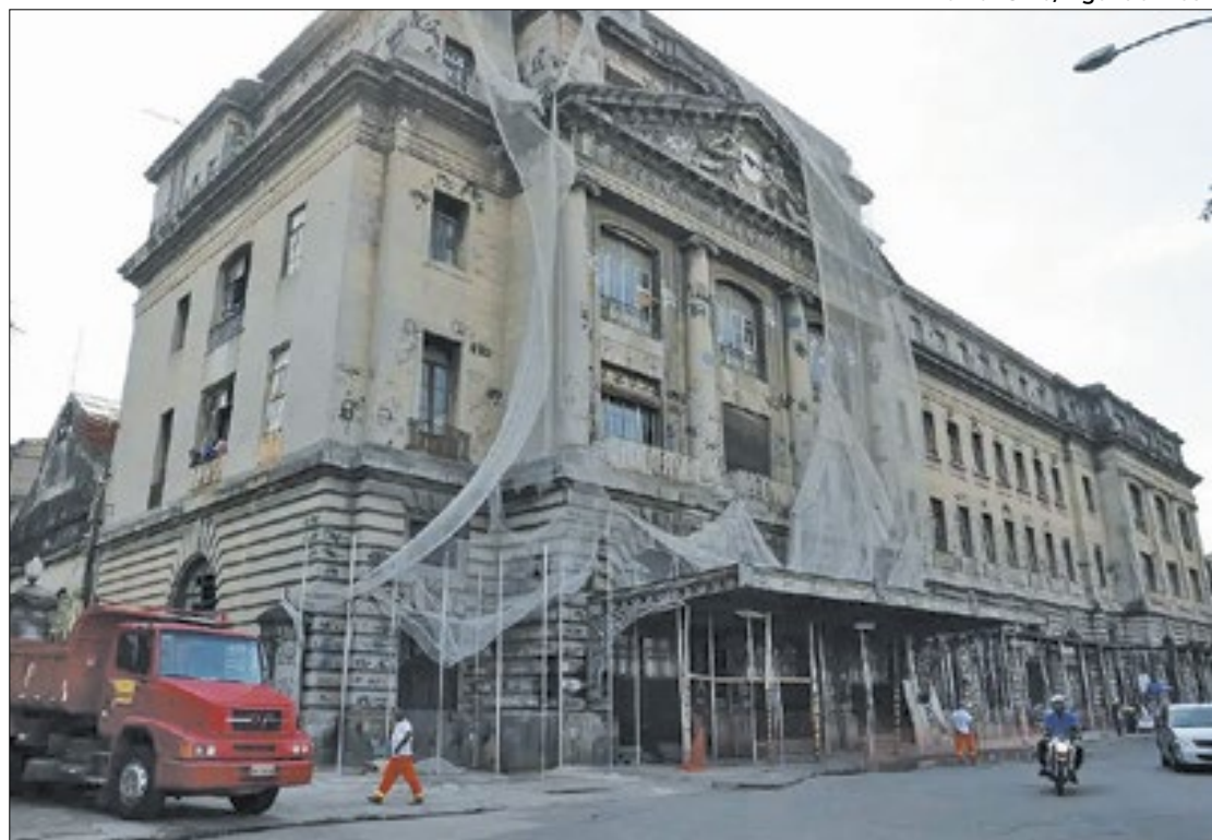
Prédio abandonado dará lugar a Cidade do Samba 2 e centro de convenções

Símbolo de um Rio de Janeiro de progresso e modernidade, a Estação Leopoldina, localizada na Avenida Francisco Bicalho, ganhará novos ares. Criada para servir de ligação entre a capital fluminense e Região Serrana, servindo de linha férrea para Petrópolis e Três Rios, ela foi bastante utilizada até meados da década de 1980, quando o sistema ferroviário no Rio perdeu força. Em 2001, ela foi totalmente desativada para passageiros e seu prédio, praticamente jogado as traças. Hoje, quem passa por ela nem percebe sua imponência, tanhamo descaso e pichações. Mas tudo mudará a partir de agora