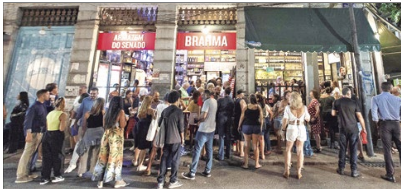
Grande movimento na região da rua do Senado, no centro da capital fluminense

prou o ponto de um desses antigos botequins, fechado após um desentendimento entre os donos. O espaço tem 18 m 2 e não cabe a freguesia. O público então se espalha: uns ficam em cadeiras de praia na calçada, à moda dos bares modernos, outros vão para dentro do Armazém. Neste bate-bola em que o velho bar vende as bebidas e o novo, as comidas, jovens e fregueses antigos se misturaram.