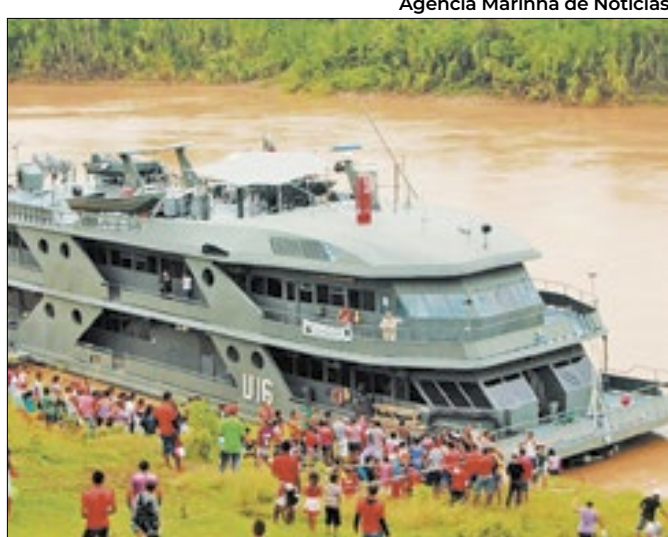
Navio é preparada para a realização de exames