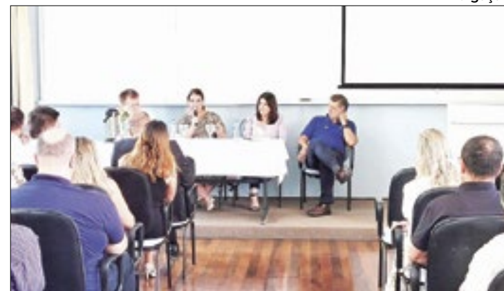
Apresentadas à estrutura do Complexo Multi-Hospitalar