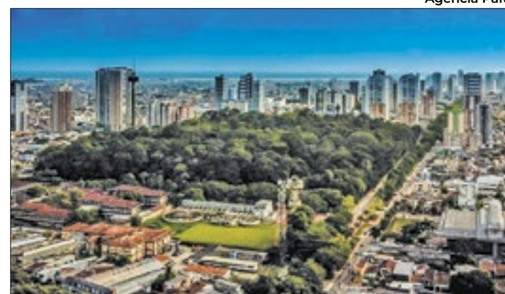
Palestina do Pará e São João do Araguaia são pioneiros