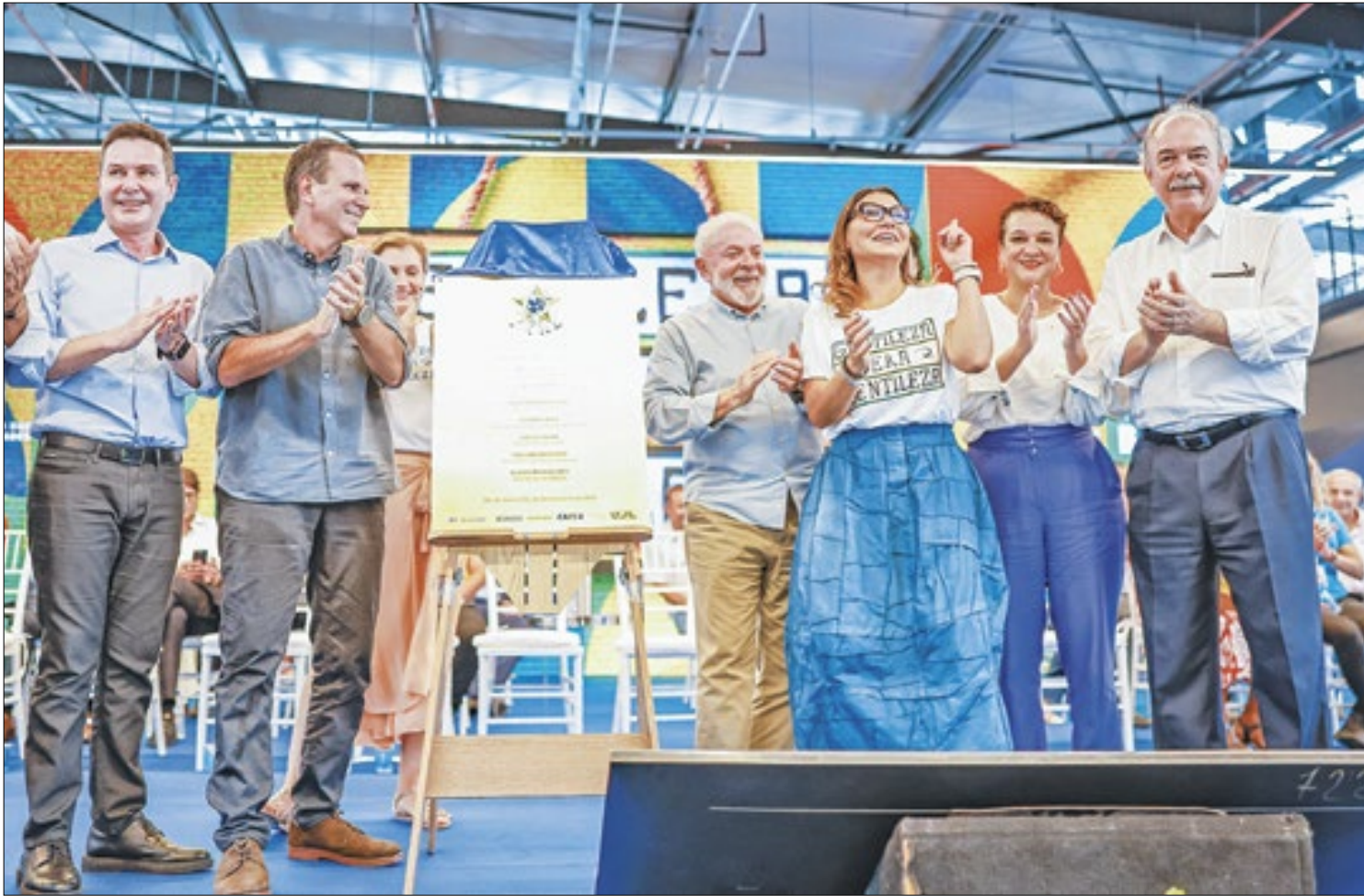
Presidente Lula com, Eduardo Paes, Jader Filho e Aloizio Mercadante, inaugurando o Terminal Intermodal Gentileza