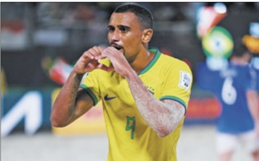
Rodrigo foi o destaque da finalíssima, com três gols marcados

Pela primeira vez na história, o Brasil conquistou o hexacampeonato de um torneio organizado pela FIFA. A vitória veio na finalíssima da Copa do Mundo de Beach Soccer FIFA 2024, disputada em Du-