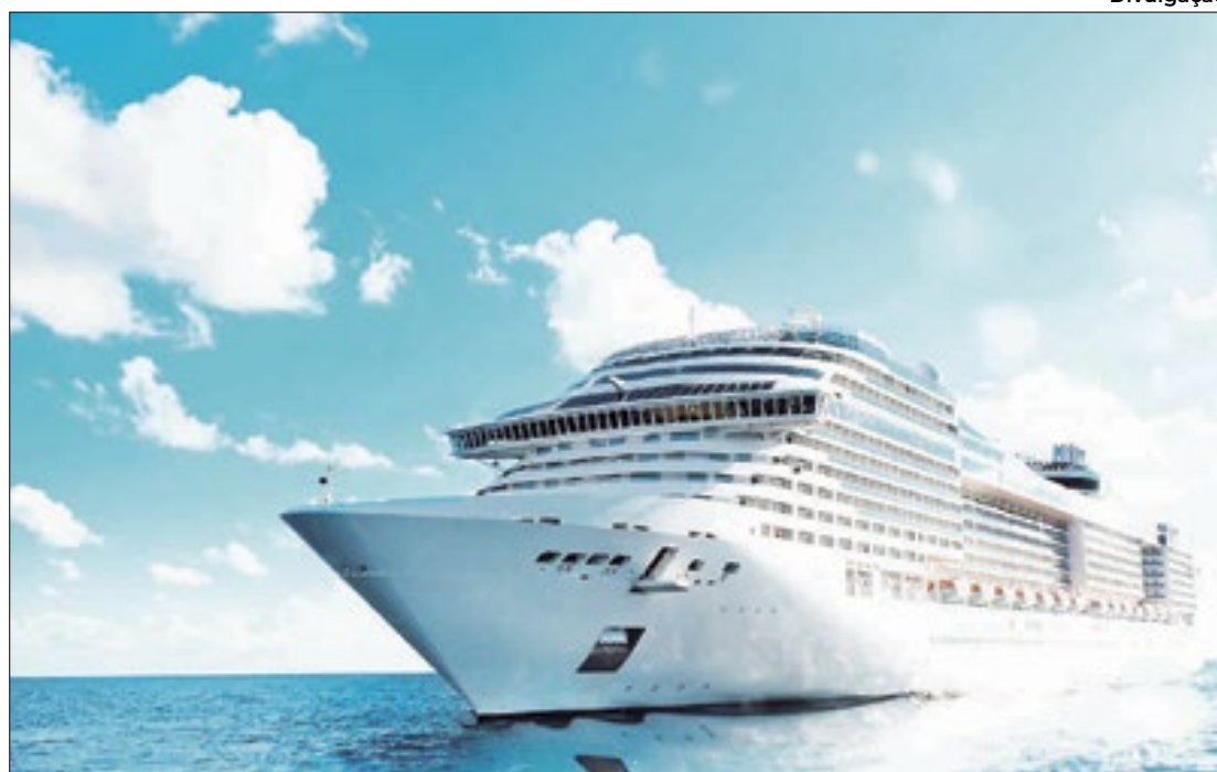
A embarcação atraca no Porto de Paranaguá nos próximos dias 01 e 08 de março

Duas linhas de turismo distintas foram colocadas à disposição dos turistas do navio de cruzeiros MSC Lirica incentivando passeios na cidade-mãe do Paraná, Paranaguá. Os ônibus trafegaram pelos pontos turísticos que remontam a história de fundação do Estado. Uma das linhas, ofertada gratuitamente pela prefeitura, foi realizada em um ônibus convencional. Os turistas também puderam fazer o city tour histórico em Paranaguá no ônibus panorâmico ofertado pela Adetur Litoral, a um custo de R$ 30,00 por pessoa. Os passeios contaram com guias trilingües que contaram a história do Estado.