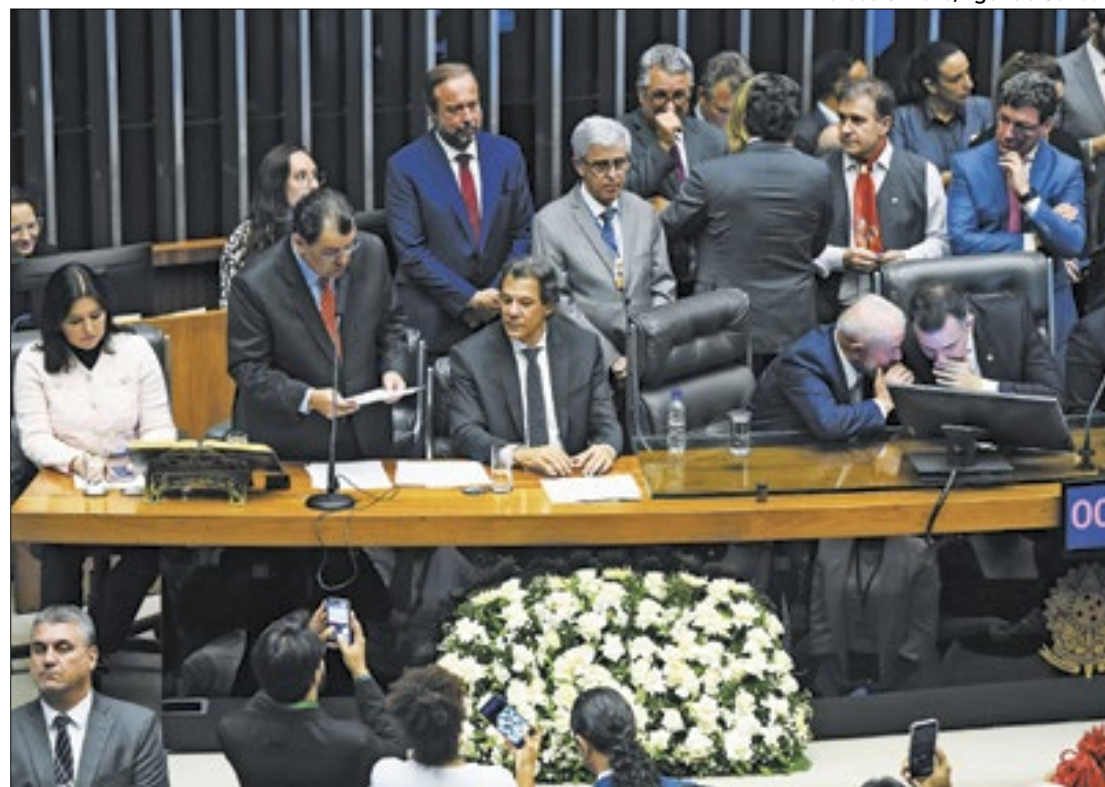
Haddad negociou retirada da MP e envio do projeto de lei

Ainda no Congresso, a Comissão Parlamentar de Inquérito (CPI) da Braskem terá sua primeira reunião nesta terça-feira (27) para apresentação do plano de trabalho do colegiado. Desde seu início, a instalação da CPI tem causado polêmicas. O senador Renan Calheiros (MDB-AL) retirou na última quarta-feira (21) seu nome da composição da comissão. Ele