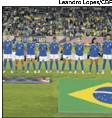
Canarinhas estão classificadas