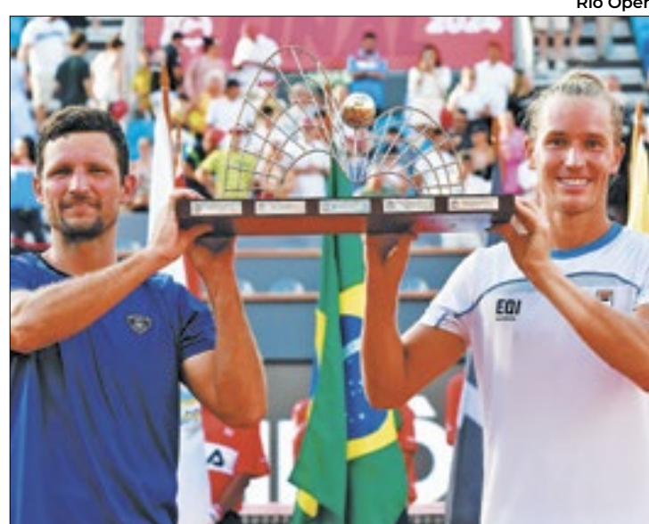
Rafa Matos é o primeiro brasileiro a vencer o Rio Open

O tenista Rafa Matos se tornou, no domingo (25), o primeiro brasileiro a vencer um título no Rio Open, o maior torneio sul-americano do circuito profissional, disputado desde 2014. Ao lado do colombiano Nicolas Barrientos, Matos, 58º colocado no ranking de duplas, derrotou na final a parceria austríaca de Alexander Erler e Lucas Miedler por 2 sets a 0 (6-4 e 6-3).