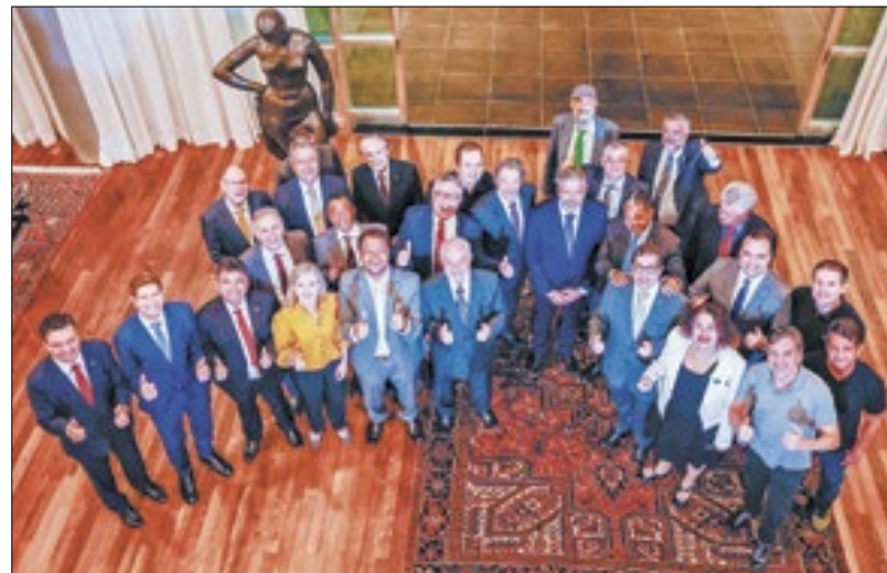
Lula reunido com os líderes no Alvorada