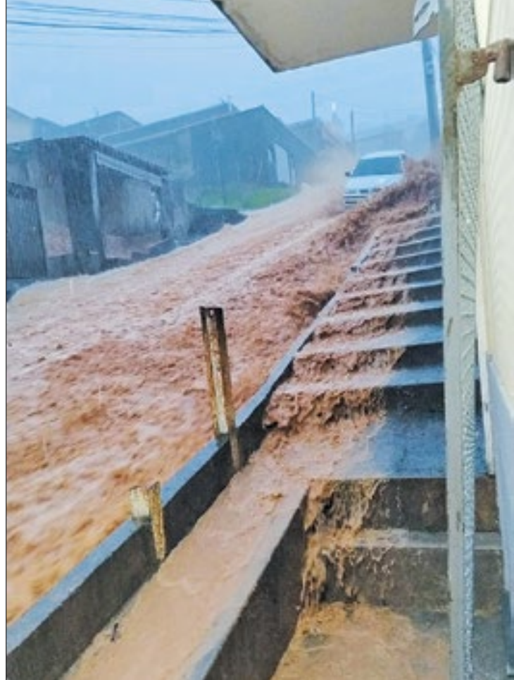
A região do Jaqueira foi uma das mais afetadas pela enxurrada

secretaria, equipes percorreram os locais afetados cadastrando as famílias que precisam de cesta básica, água, colchonete, material de limpeza ou material de higiene pessoal. Aquelas famílias que ainda não foram cadastradas, podem procurar a Secretaria de