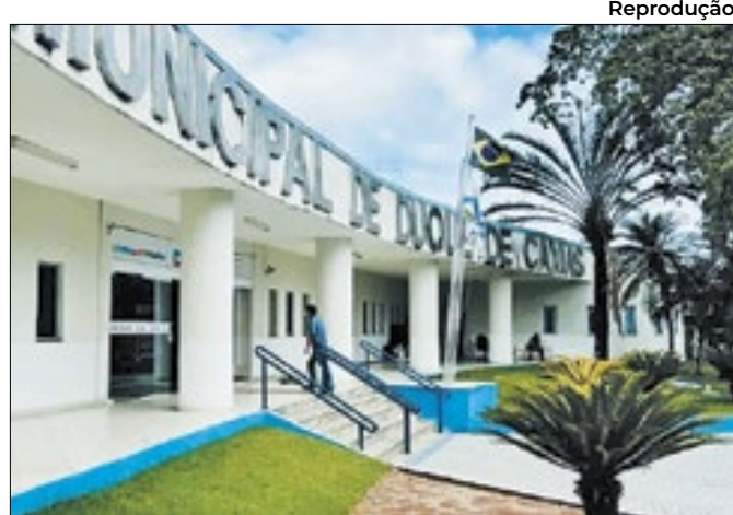
Sede da prefeitura de Duque de Caxias