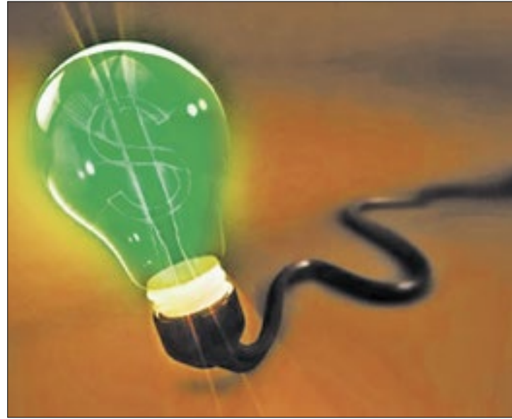
Por enquanto, contas de luz não sofrerão acréscimo

Tal cenário tranquilo, porém, poderá ser alterado, a depender do comportamento do regime de chuvas, até o final do mês que vem, quando, então, a autarquia poderá efetuar uma mudança na bandeira tarifária. Essa possibilidade é reforçada pelo fato de os volumes de chuva no país estarem abaixo da média histórica, em pleno período úmido, o que limita a