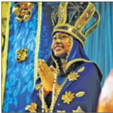
Escola é bicampeã do carnaval

Com o enredo "Rituais de fé", a Escola de Samba Bom das Bocas foi campeã do Carnaval de Três Rios 2024. A agrêmiação é bicampeã e se tornou a maior detentora de títulos carnavalesco trirriense. A apuração do desfile das escolas de samba do município aconteceu na última quinta-feira (22), foram analisados quesitos, de bateria, harmonia, samba-enredo, enredo, mestre-sala, porta-bandeira, alegorias, adereços, fantasias e evolução.