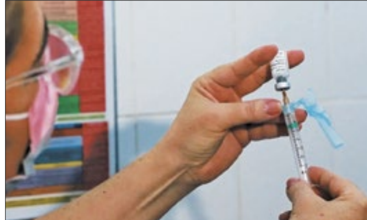
Estado do RJ recebeu lote da vacina contra dengue

muitas pessoas estão revivendo o mito do sangue doce que atrai mosquitos. Em relação a isso, o médico Luiz Arnaldo Magdalen diz que não existe uma relação entre os dois fatores. "Não há relação com o tipo sanguíneo ou algumas patologias apresentadas pelo paciente, no sentido de atrair o mosquito causador da dengue. Por tanto, qualquer pessoa está propensa a ser picada, basta estar em uma área que ocorra a transmissão do vírus", disse.