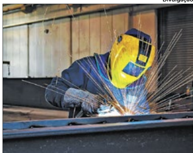
Divulgação Dos 19 segmentos pesquisados pelo ICI, 15 avançaram