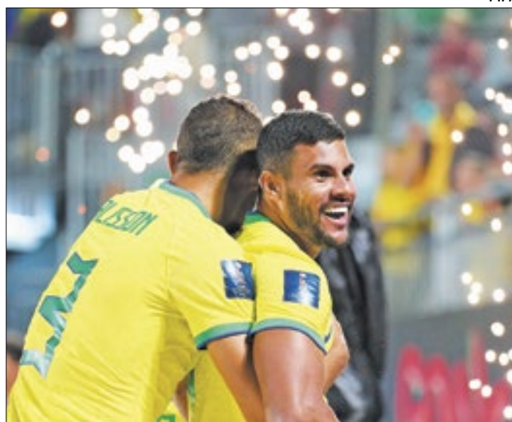
Brasil ganhou um hexacampeonato FIFA pela primeira vez

E até a tarde deste domingo (25), a Seleção Brasileira também era pentacampeã no Futebol de Areia. Mas isso mudou com a vitória maiú-