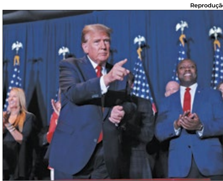
Republicano disse que com ele não haveria guerras

Espécie de meca da direita, a CPAC também contou neste ano com discursos de representantes da América Latina, como o presidente da Argentina, Javier Milei, e o deputado federal