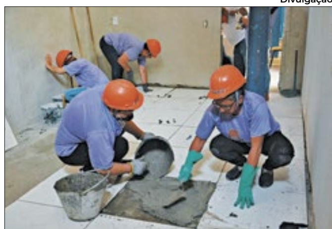
O curso de capacitação dura quatro meses