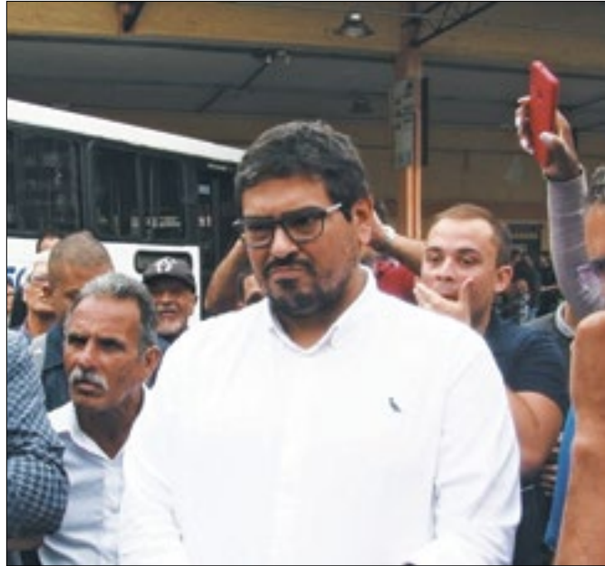
Rodoviários da Cascatinha pressionam CPTans