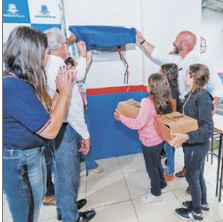
Alunos receberam o kit de material escolar

"As crianças da Escola Fazenda Alpina são as primeiras a receber o kit de material. É uma enorme satisfação ver a alegria delas recebendo esse material. Lembramos que, a partir da semana que vem, o kit será entregue para todos os 23 mil alunos da Rede. Além disso, essa é a 18ª escola a ser beneficiada com o programa Escola em Tempo