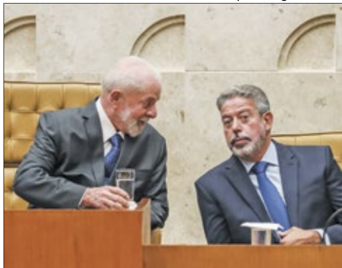
Cronograma foi solução acertada entre Lula e Lira