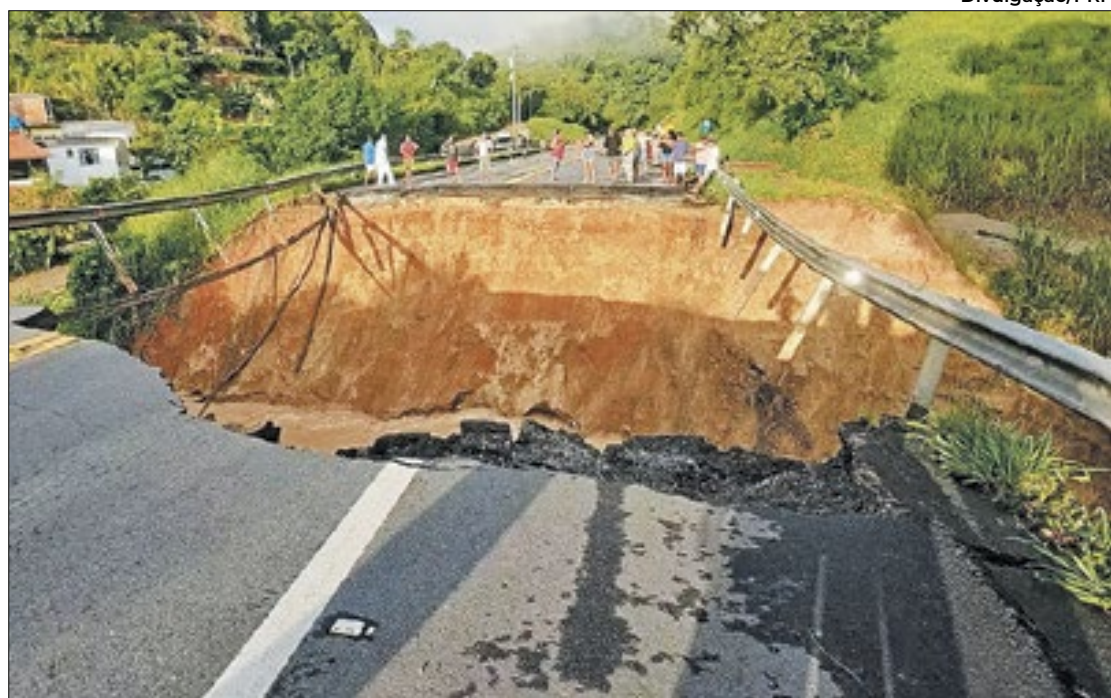
Tráfego na BR-393 é interditado nos dois sentidos

Ainda, a concessionária está trabalhando para restabelecer o tráfego normal na BR-393 o