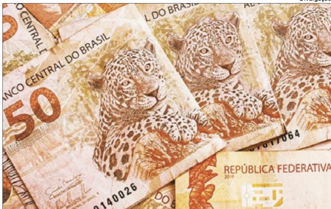
Divulgação Avaliação do instituto é que o Executivo federal teria 'superestimado' a receita

Entre as maiores disparidades de estimativas com a Esplanada, o instituto destaca a subvenção estadual (R$ 27,7 bilhões) e o Carf (R$ 65,6 bilhões), mesmo que este tenha ampliado as estimativas de receita da tributação dos fundos exclusivos, devido ao ingresso de recursos em dezembro (R$ 3,9 bilhões) e em janeiro de 2024 (R$ 4,0 bilhões). Neste