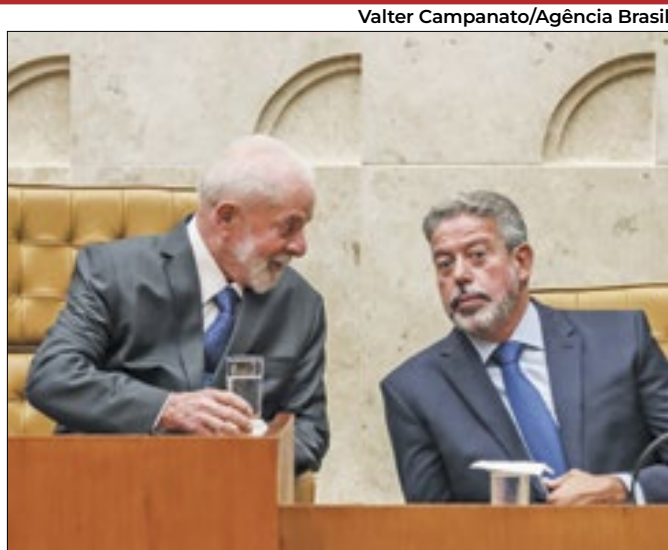
Cronograma foi solução acertada entre Lula e Lira