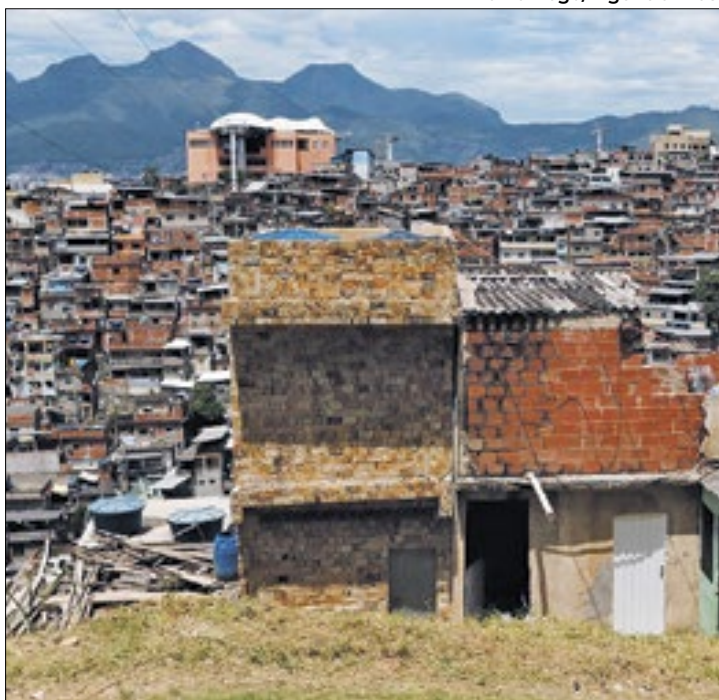
Complexo do Alemão contará com observatório do clima

O Complexo do Alemão vai contar, a partir deste ano, com um observatório climático. A intenção é monitorar o calor no local e, a partir dos dados colhidos, elaborar políticas públicas que possam ajudar a população a enfrentar esse fenômeno.