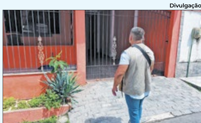
Vistorias e varreduras foram feitas durante a ação

légio passou por serviços estruturais e recebeu pintura e nova iluminação, além de uma nova cobertura na quadra e restauração do pátio. O espaço se localiza na Rua João Xavier Itaboraí, número 25.