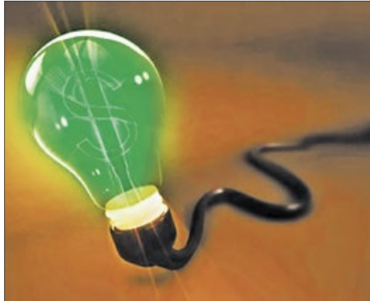
Por enquanto, contas de luz não sofrerão acréscimo

Tal cenário tranquilo, porém, poderá ser alterado, a depender do comportamento do regime de chuvas, até o final do mês que vem, quando, então, a autarquia poderá efetuar uma mudança na bandeira tarifária. Essa possibilidade é reforçada pelo fato de os volumes de chuva no país estarem abaixo da média histórica, em pleno período úmido, o que limita a