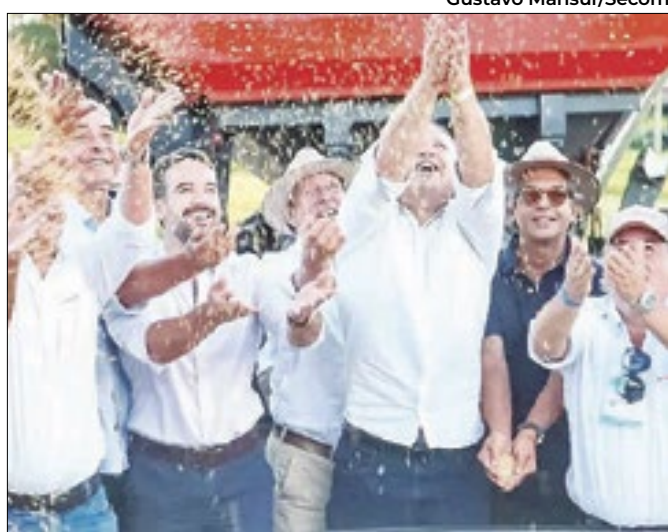
Solenidade contou com atos simbólicos