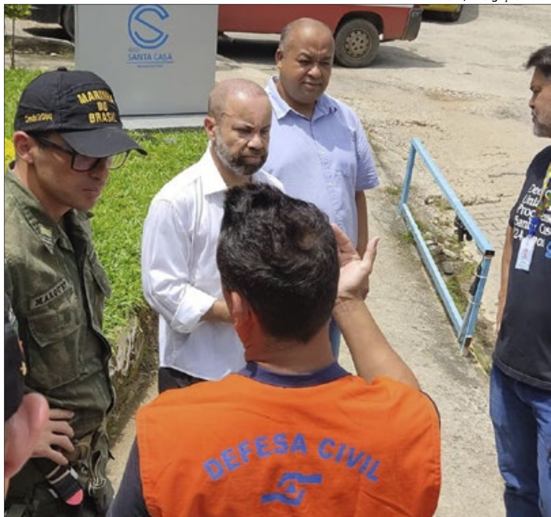
Diversas equipes estão mobilizadas para ajudarem população atingida

"O governador Cláudio Castro determinou que os municípios atingidos por esta tempestade fossem assistidos de forma rápida. E já estamos recebendo apoio da Leão XIII nessa área. Esse elo será funda-