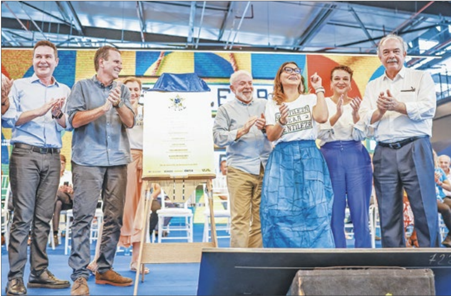
Presidente Lula com, Eduardo Paes, Jader Filho e Aloizio Mercadante, inaugurando o Terminal Intermodal Gentileza