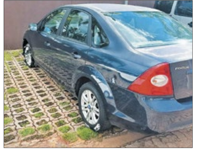
Veículo foi apreendido pelos policiais federais