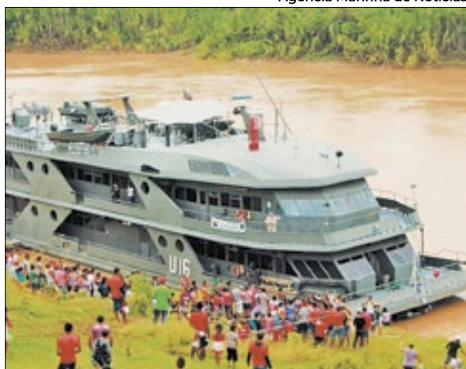
Navio é preparada para a realização de exames