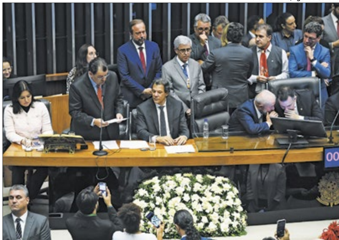
Haddad negociou retirada da MP e envio do projeto de lei

Ainda no Congresso, a Comissão Parlamentar de Inquérito (CPI) da Braskem terá sua primeira reunião nesta terça-feira (27) para apresentação do plano de trabalho do colegiado. Desde seu início, a instalação da CPI tem causado polêmicas. O senador Renan Calheiros (MDB-AL) retirou na última quarta-feira (21) seu nome da composição da comissão. Ele