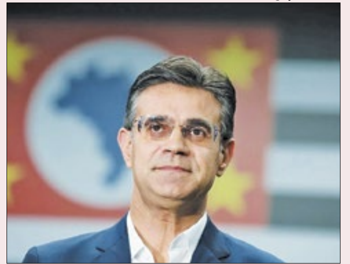
Ex-governador de São Paulo retomou vida política