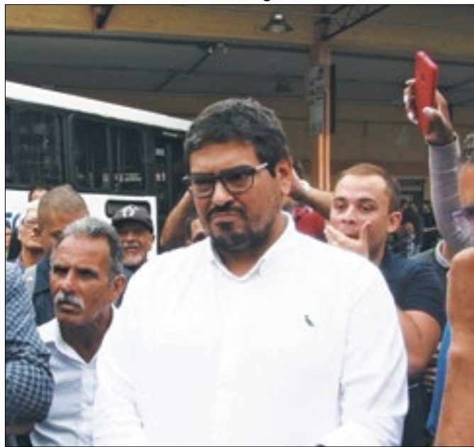
Rodoviários da Cascatinha pressionam CPTans