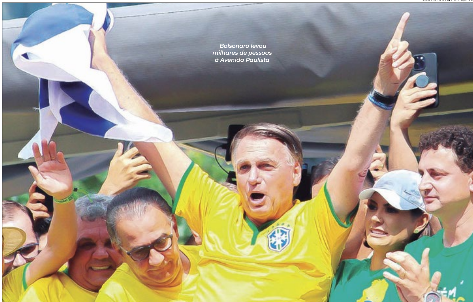
Bolsonaro levou milhares de pessoas à Avenida Paulista