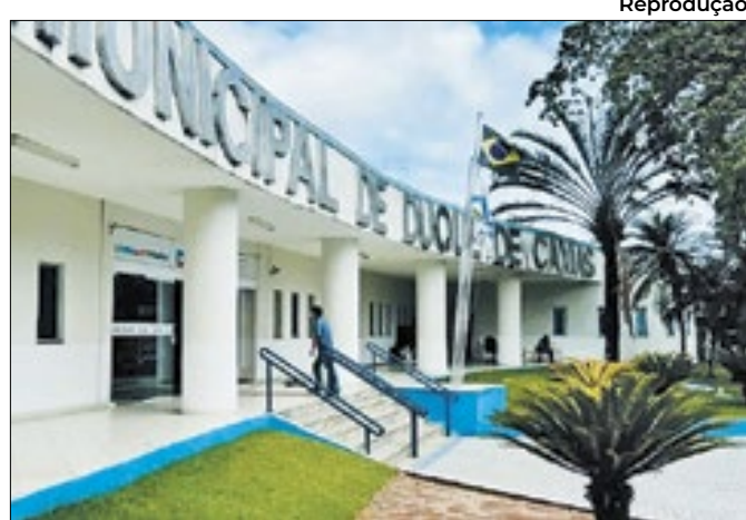
Sede da prefeitura de Duque de Caxias