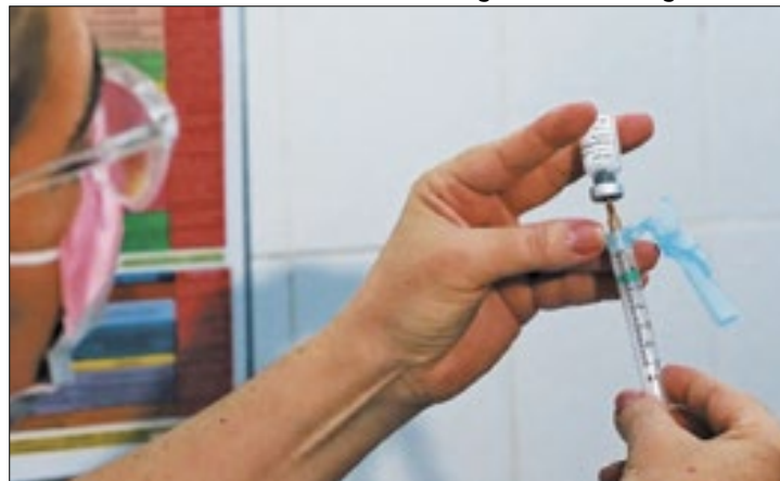
Estado do RJ recebeu lote da vacina contra dengue