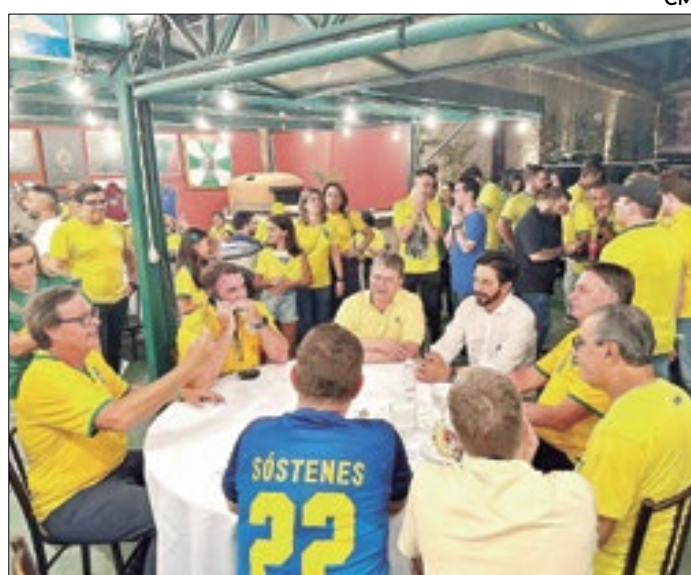
O governador Tarcísio Freitas recebeu as lideranças nacionais no Palácio Bandeirantes, no Morumbi, antes da manifestação. Na mesa, Bolsonaro com o Silas Malafaia, Flávio Bolsonaro, Tarcísio e deputado Sóstenes

A manifestação foi custeada pessoalmente por Malafaia. Segundo ele, o custo ficou em torno de R$ 100 mil. Ele alugou dois trios elétricos para o evento. O maior, onde discursaram Bolsonaro e as demais autoridades, teria custado, segundo o pastor, R$ 55 mil. O outro, utilizado como ponto de apoio, teria sido alugado por R$ 19 mil.