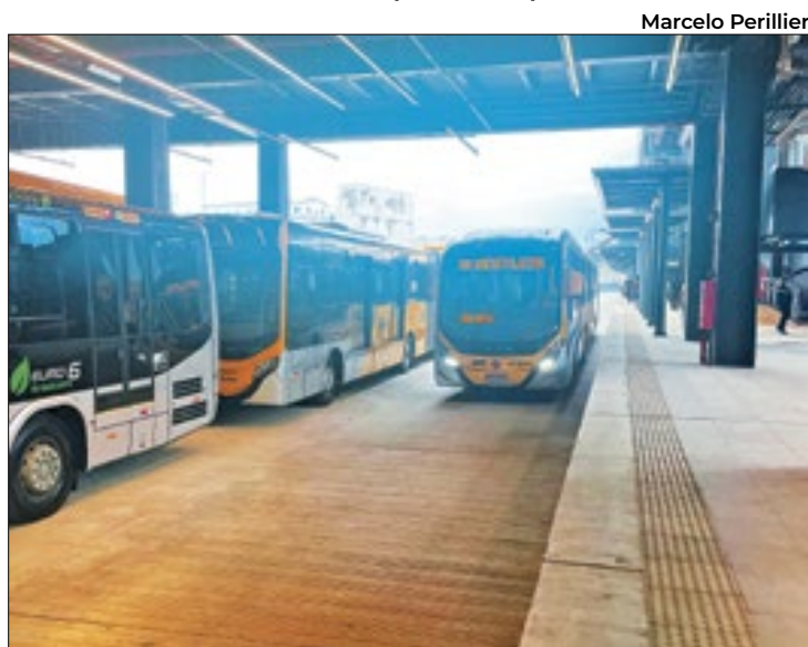
BRT Transbrasil interligado com 14 linhas de ônibus e VLT

mais tempo com a mulher e a família”, finalizou Paes.