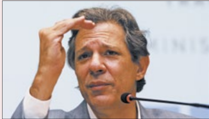
Haddad: expectativa de maior arrecadação à vista