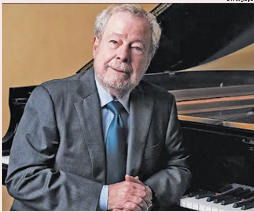
Biografia escrita pelo francês Olivier Bellamy choca amigos do pianista