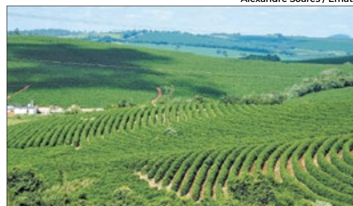
Qualidade da produção e geração de 1,2 mil empregos