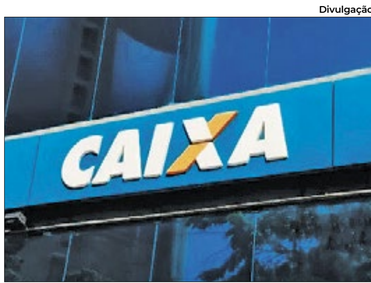
Vagas contemplam candidatas de ensino médio e superior

A taxa de inscrição para as vagas de nível médio custam R$50,00 enquanto as de ní-