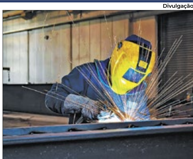
Dos 19 segmentos pesquisados pelo ICI, 15 avançaram