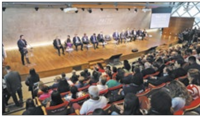
Governador explicou posição em seminário na FGV