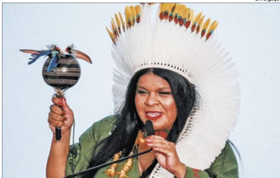
Anúncio foi feito pela ministra Sônia Guajajara, que vai acompanhar o projeto

Além do hospital, o governo federal também objetiva construir e reformar mais 22 unidades básicas de saúde indí-