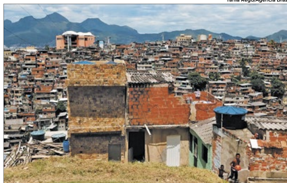
Alemão, na Zona Norte, é um dos maiores complexos de favelas do Rio de Janeiro

Rio: Pesquisadores e população local vão trabalhar no projeto