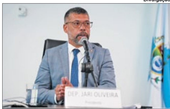
Deputado protocolou ofício pedindo providências