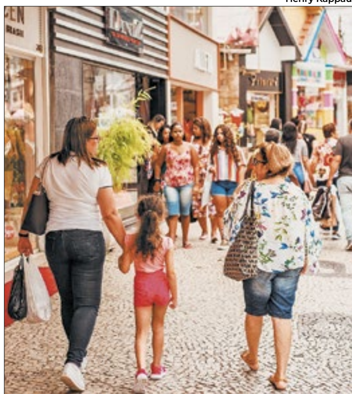
Principal polo de moda da Região Serrana

"Essa é uma oportunidade única para os empresários da Rua Teresa. A escolha da ARTE (Associação da Rua Teresa) como parceiro local representando nosso Polo de Moda nos deixa muito felizes. Convidamos os clientes e os empresários para que participem do evento, que vai trazer informações importantes nos encontros do Enel Summit e a melhor expectativa possível para o desfile de encerramento