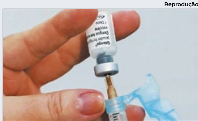
Vacinação contra a dengue começa em Mesquita