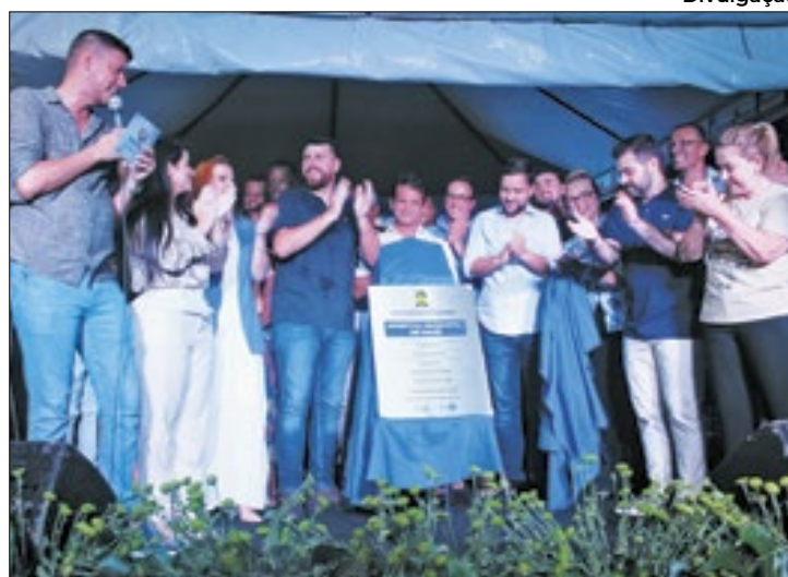
Hospital de Magé foi inaugurado na última sexta-feira (23)

Conta também com 21 leitos de clínica médica para adul-