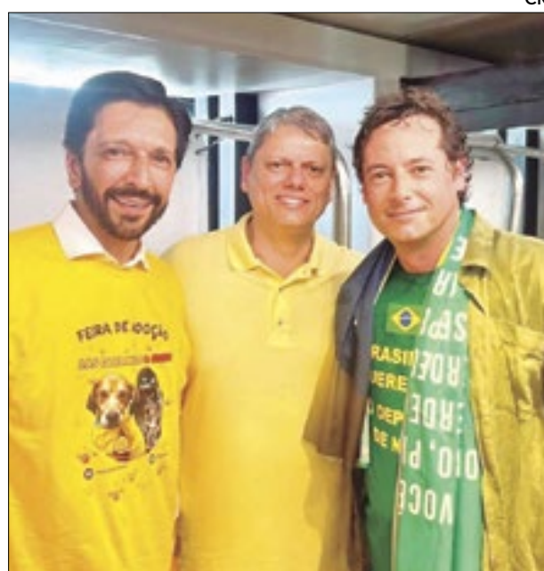
O prefeito de São Paulo Ricardo Nunes e Fábio Wajngarten ladeando o governador Tarcísio Freitas