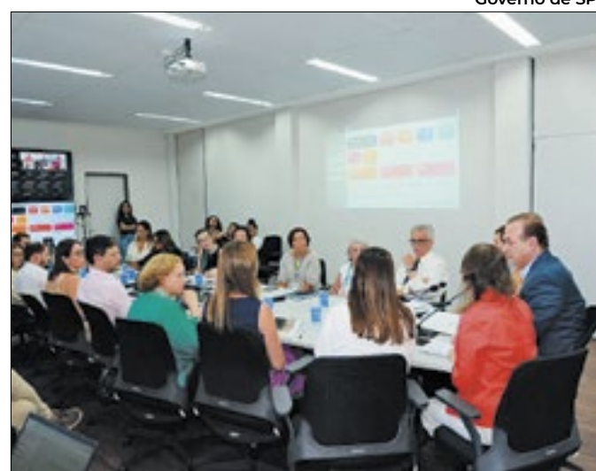
Reunião do Centro de Operações de Emergências