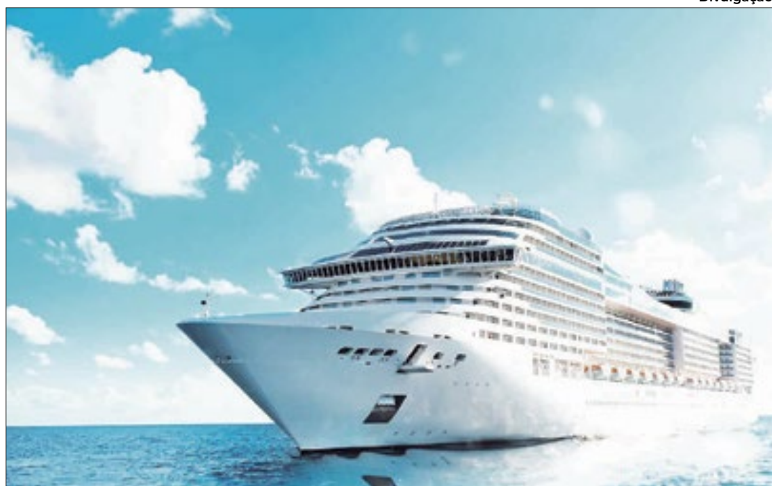
A embarcação atraca no Porto de Paranaguá nos próximos dias 01 e 08 de março