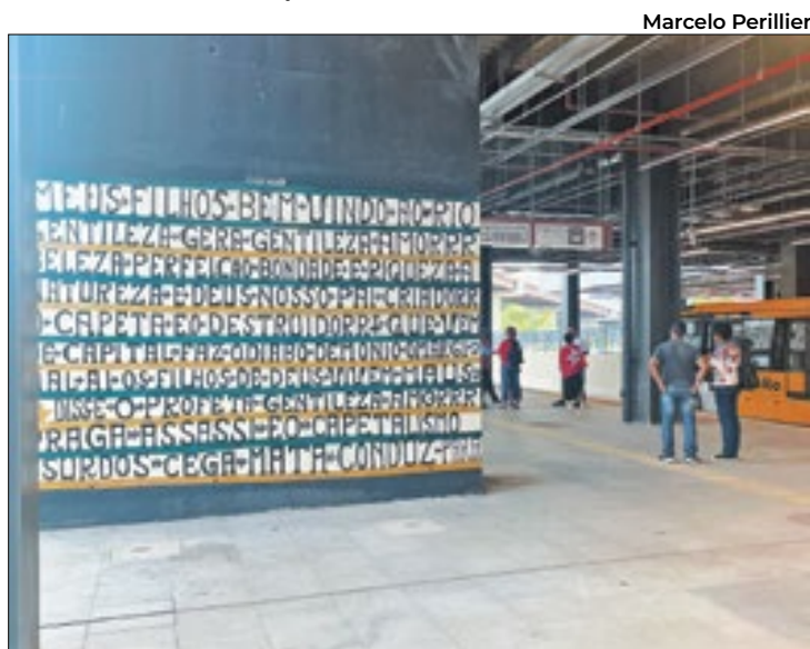
Palavras do Profeta estão espalhadas pelo terminal