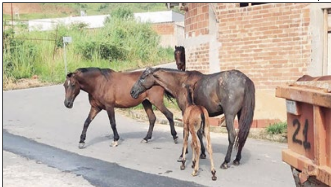
Animais soltos geram diversos tipos de transtornos a moradores e motoristas

Segundo uma moradora, que preferiu não se identificar, as reclamações sobre os animais sempre existiram, mas cresceram em 2024. Ela explica que é mais comum encontrar vacas, bezerras e cavalos andando pelo bairro, ressaltando que a presença dos equinos é quase diária. Embora não saiba dizer de onde surgem, a entrevistada acredita que eles possam pertencer a donos de propriedades rurais próximas à área.