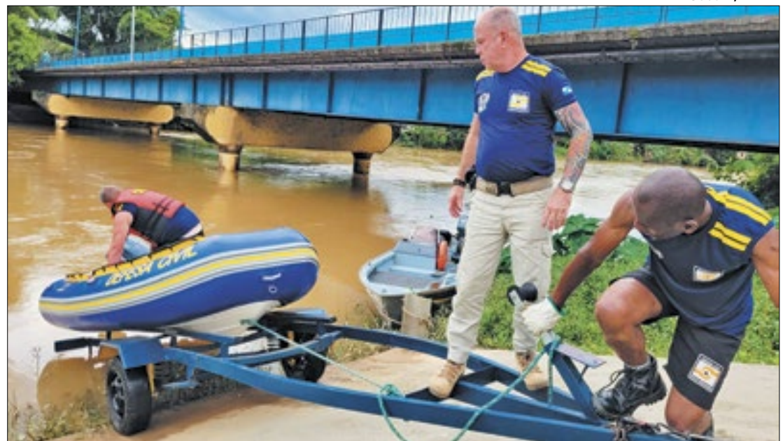
Defesa Civil de Volta Redonda também segue em alerta

sa Civil seguirá em alerta e de prontidão", informou.