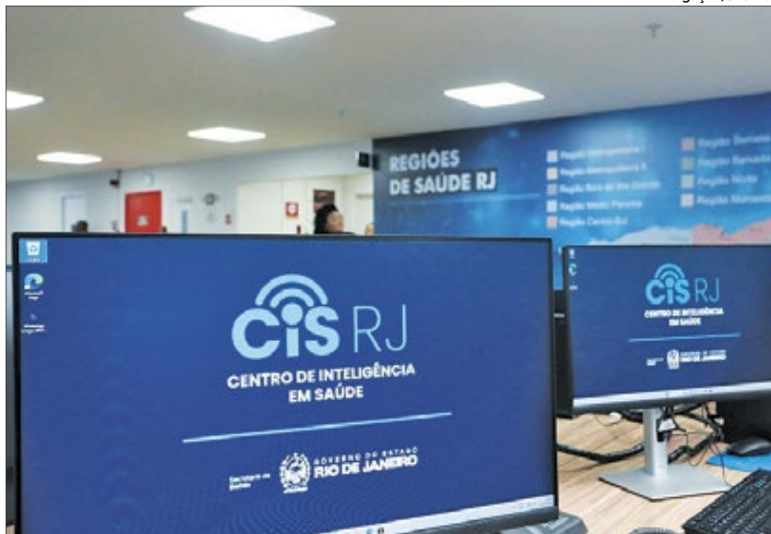
Estado montou central de monitoramento para acompanhar evolução dos casos

"O momento requer forte adesão da sociedade, além de articulação de todos os órgãos governamentais no enfrentamento à dengue. É hora de todos fazerem a sua parte, como eliminar criadouros e conversar com seu vizinho sobre a importância da prevenção.