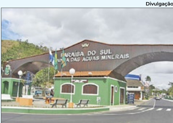
Paraíba do Sul com contas em dia

após lutar contra um câncer. Ele também foi deputado federal de 1991 a 1995. Iniciou sua carreira política em 1982, quando elegeu-se vereador na legenda do Partido Democrático Trabalhista (PDT).