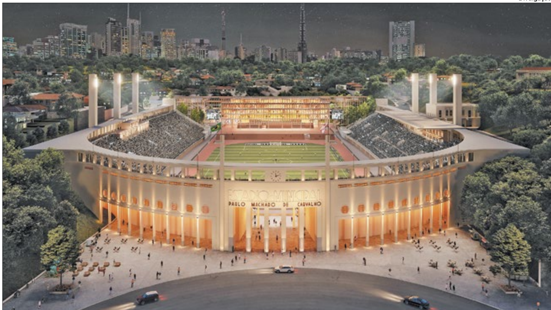
Arena Mercado Livre Pacaembu fechou parceria de exploração publicitária com a Formato Mídia, que comandará telões pelos próximos cinco anos.