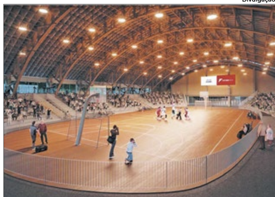
O ginásio poliesportivo do Pacaembu também terá o espaço publicitário explorado

as marcas diretamente com um público ávido pelo consumo.