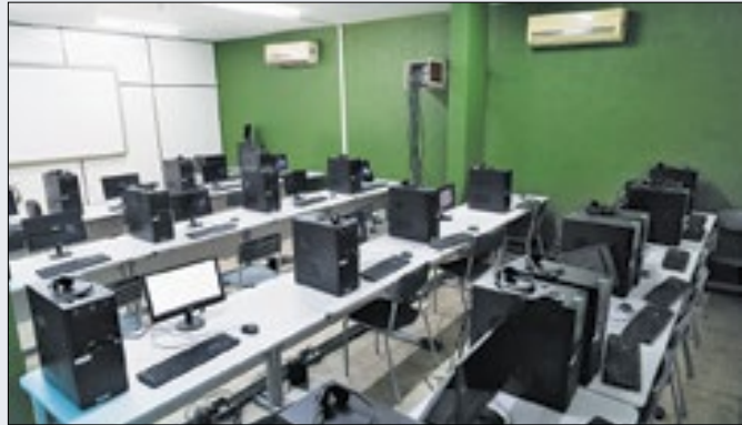
Casa da Juventude com inscrições abertas