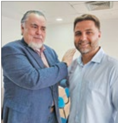
Magnavita com prefeito de Campos, Wladimir Garotinho, na sede do partido