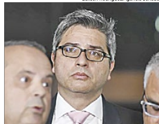
Portinho: fim do PL mostraria perseguição