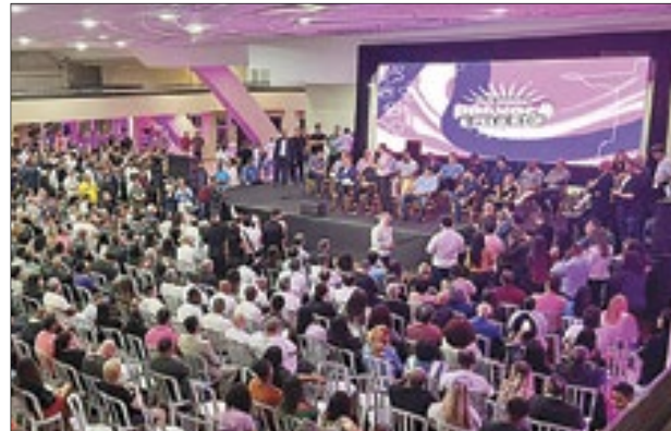
Evento do deputado Marcelo Queiroz reuniu mais de mil pessoas em um dia chuvoso no Rio