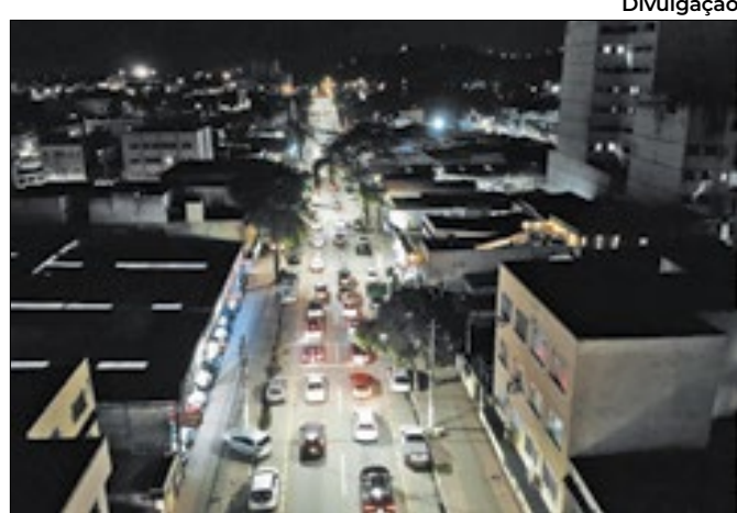
Cidade já conta com mais de 18 mil novos pontos de luz