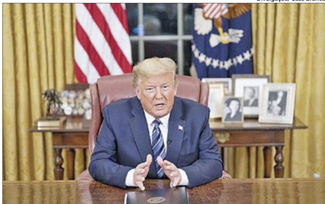
Ex-presidente dos EUA, Donald Trump será julgado por pagamentos a atriz pornô

Um juiz de Nova York negou na quinta-feira (15) o pedido de Donald Trump para arquivar as acusações criminais contra ele decorrentes do pagamento de dinheiro para silenciar uma estrela pornô, abrindo caminho para o primeiro julgamento criminal de um ex-presidente dos Estados Unidos.