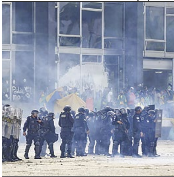
Para STF, Polícia Militar foi omissa no 8 de janeiro

Atualmente, a 1ª Turma é composta somente por esses