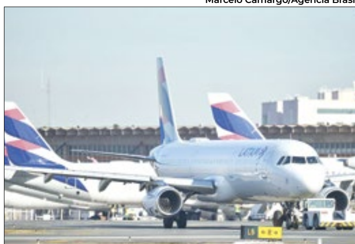
Solução, porém, enfrenta resistências de Mercadante