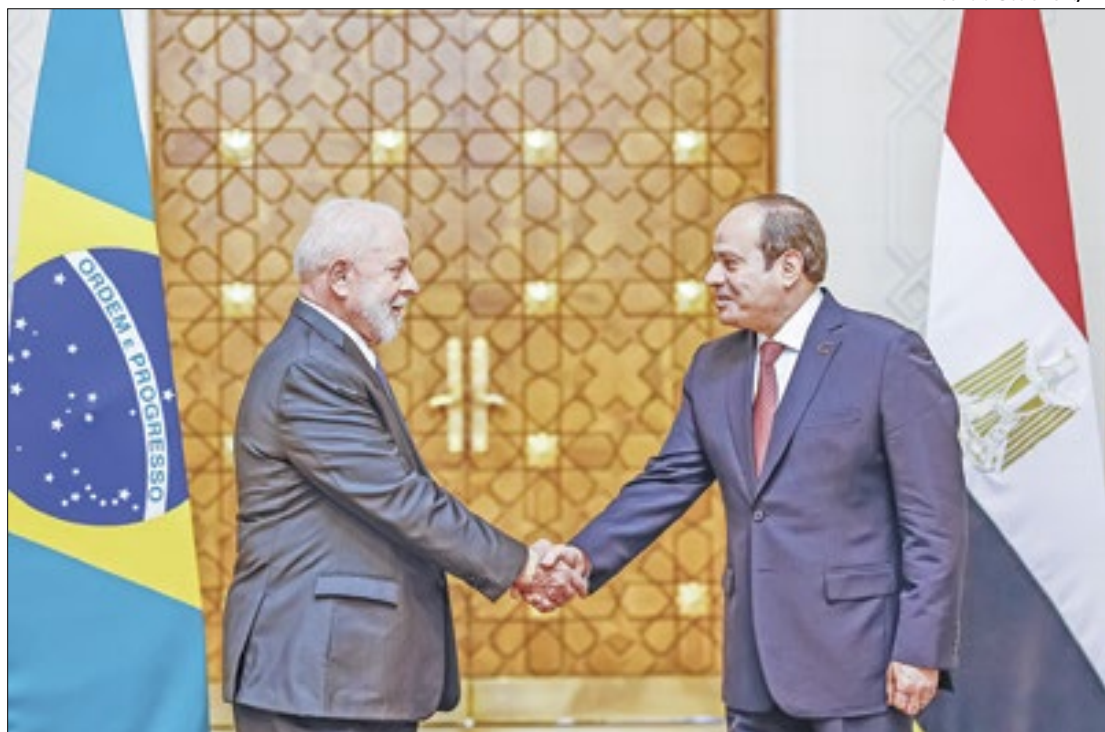
Lula na reunião com o presidente do Egito, Abdel Fatah El-Sisi

“Os países que colonizaram a África têm deixado de ter uma grande relevância para a África, como a França, e há uma nova influência no continente, principalmente vindo