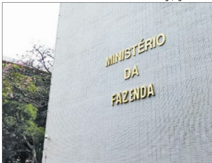
Governo se alia ao Serasa para ampliar alcance do programa

O Ministério da Fazenda anunciou nesta quinta-feira (15) a extensão do acesso ao Desenrola Brasil para inadimplentes renegociarem dívidas. Por meio do birô de crédito Serasa, pessoas com dívidas inscritas no programa do governo federal terão acesso ao Desenrola sem a necessidade de cadastro no Gov.br.