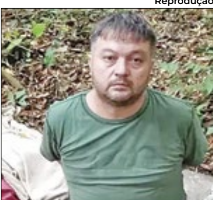
'Gordinho' foi preso no Paraguai

Um brasileiro foi preso pela polícia paraguaia suspeito de ser um dos mentores do assalto cinematográfico que levou US$ 16 milhões (cerca de R$ 80 milhões) em Ciudad del Este, fronteira com