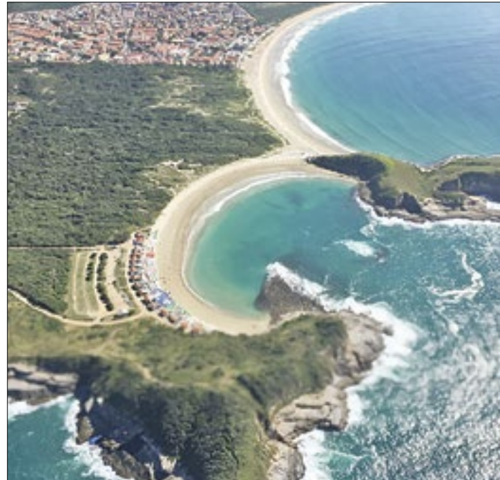
Praia do Peró é um dos pontos turísticos de Cabo Frio

O Ministério Público Federal (MPF) firmou termo de ajustamento de conduta (TAC) com o Município de Cabo Frio (RJ) para conter os impactos ambientais causados pela superexploração das praias, no âmbito do projeto MPF Praia Limpa. O documento contém 15 itens, que norteiam a atividade de fiscalização do Município sobre o comércio nas praias (ambulantes, barracas e quiosques), a circulação de veículos e coleta de lixo, entre outros compromissos.