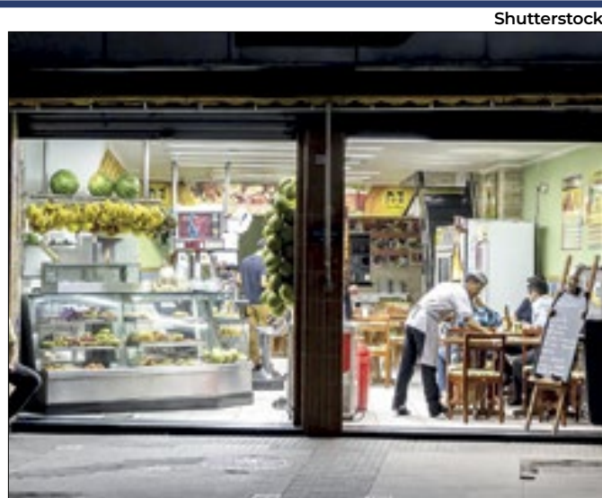
Queda da taxa Selic dá 'novo fôlego' ao segmento