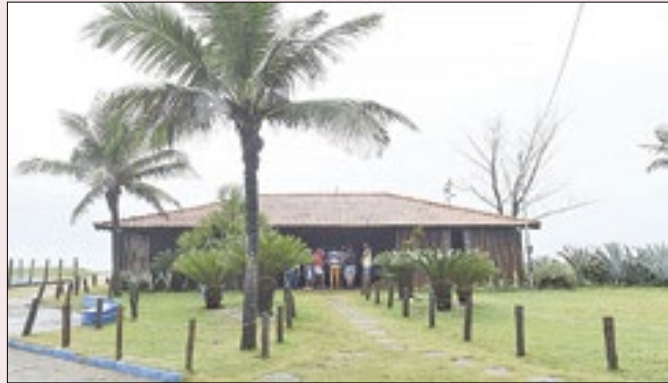
Ação é do Centro de Educação Ambiental Prata Tavares