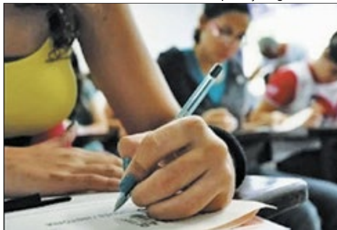
Serão 90 vagas disponibilizadas para o município