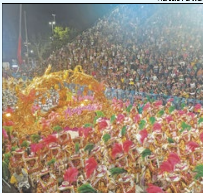
Verde e Rosa não foi nem para o desfile das campeãs