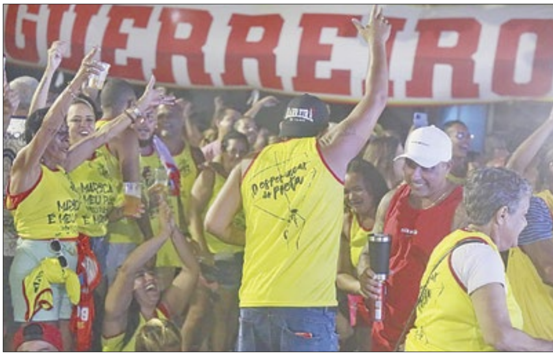
Escola estará de volta à Marquês de Sapucaí para o desfile do carnaval de 2025

A Prefeitura de Cabo Frio está ampliando a oferta de atividades esportivas, de lazer e de melhoria da qualidade de vida da população em vários pontos da cidade. Aulas de hidroginástica estão sendo fornecidas, sempre às terças e quintas-feiras às 8h, no canto direito da Praia das Conchas.