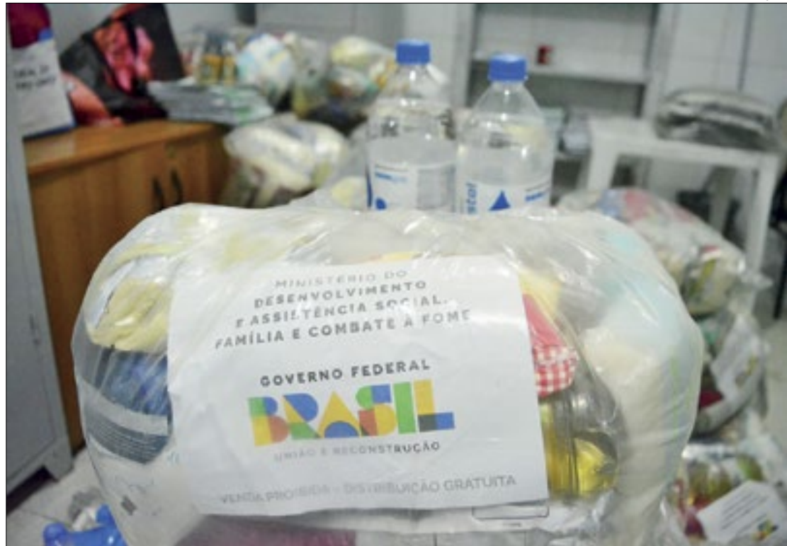
Atendimentos da assistência social de Japeri

“As pessoas que estão acessando o Cras hoje, são dos bairros que tiveram as ações no Carnaval. Não estavam em casa e tiveram informações do Pre-