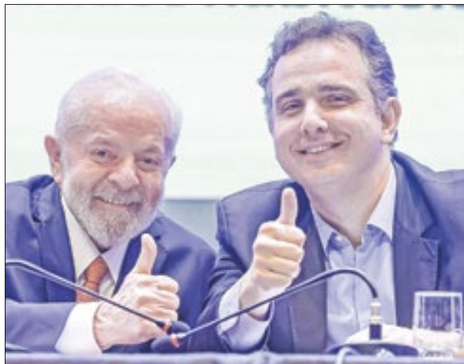
Com Pacheco, Lula construiu ambiente favorável