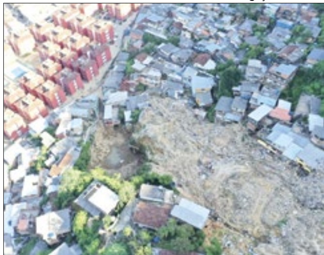
Região foi o epicentro da tragédia de fevereiro de 2022