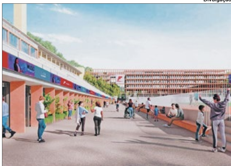
Futuro Mídia fechou parceria e tem planos ambiciosos para a Arena Mercado Livre Pacaembu