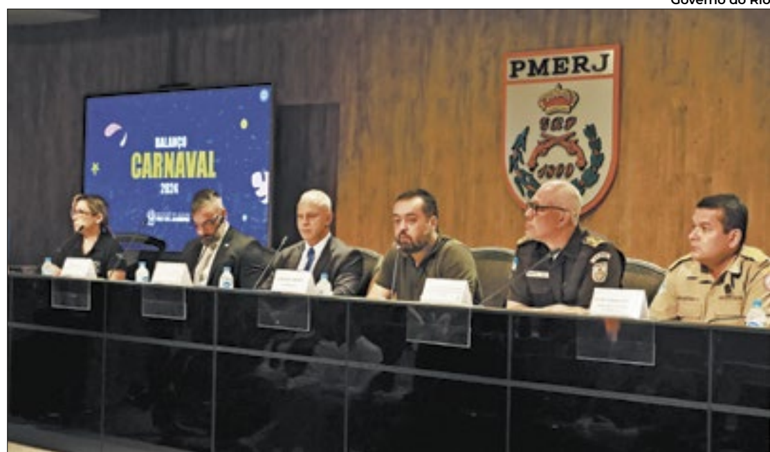
Governador Cláudio Castro com a equipe da segurança pública estadual na coletiva

Com a atuação de mais de 12 mil policiais militares nas ruas, foram apreendidas 75 armas de fogo, incluindo sete fuzis, e 423 pessoas presas. O videomonitoramento avançado com reconhecimento facial, lançado no Réveillon de 2023,