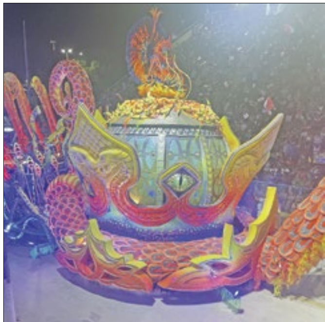
Abre-alas já vinha com o olho da serpente e guerreiras