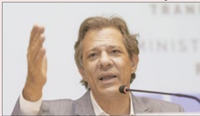
Haddad convenceu senadores de exagero no Perse