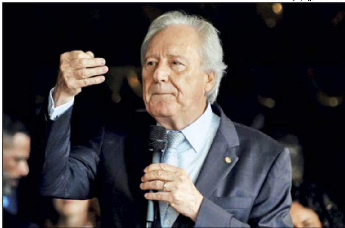
Lewandowski enrola-se com a fuga dos presidiários

O exemplo dado por Lewandowski é o Complexo Penitenciário da Papuda, que fica em Brasília. A unidade federal está cercada por uma muralha criada com a reforma da unidade em novembro de 2022 que possui quatro torres de segurança.