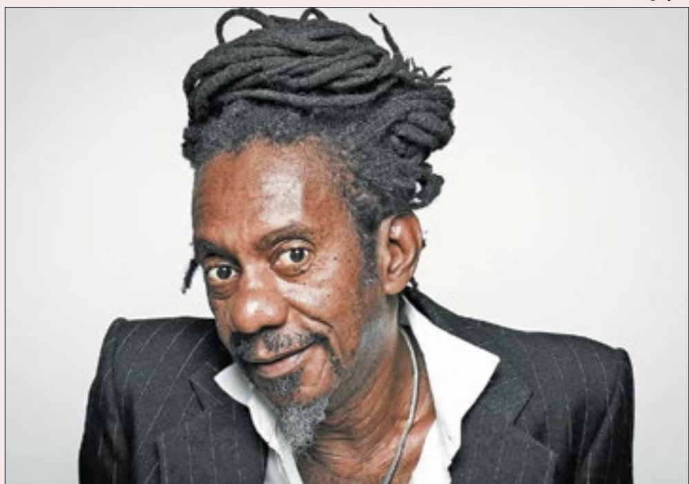
Luiz Melodia tem parte de seu impressionante álbum de estreia reavivado