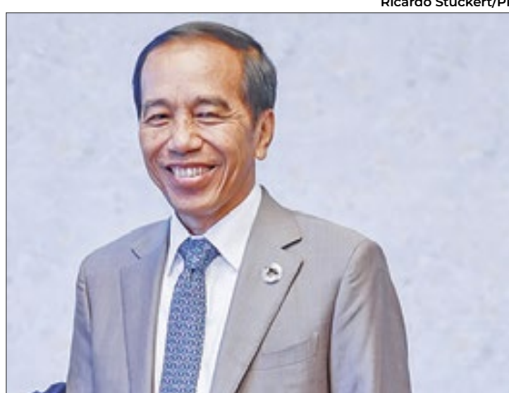
Legado de Joko Widodo está em jogo

O atual titular da Defesa foi genro de Suharto e serviu como general em seu Exército, famoso por violações dos direitos huma-