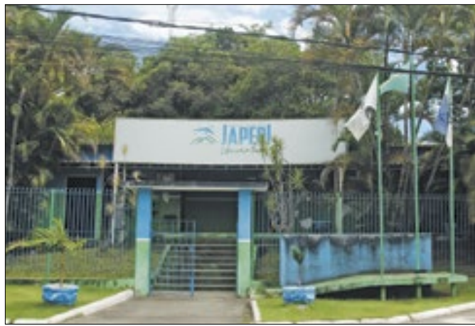
Sede da prefeitura municipal de Japeri