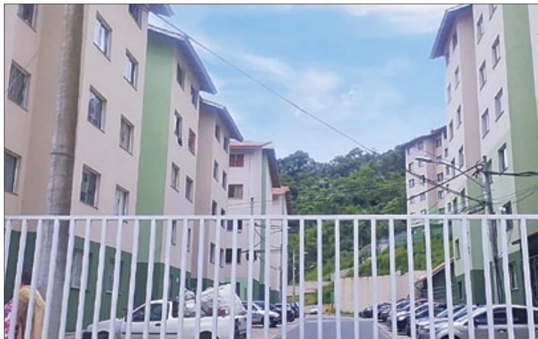
Condomínio 3 do Conjunto Habitacional Vincenzo Rivetti vive problema crônico

O Correio acompanhou o drama vivido pelos moradores em dezembro do ano passado. De acordo com eles, o problema é antigo e vem se agravando desde setembro de 2023 e se estende até o momento. Para eles, o problema acontece por conta de uma falha na bomba distribuidora, que joga água para todo o conjunto, sobre esta questão eles questionaram a concessionária, mas a resposta dada foi que por conta da