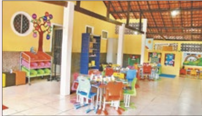
Unidade poderá atender até quinze crianças