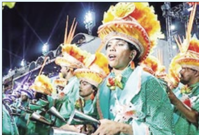
Jovens mostram que também têm samba no pé