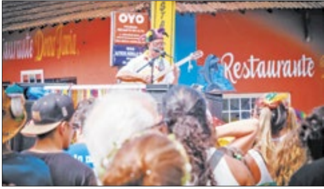
Carnaval Terê Alegria em Família em Teresópolis