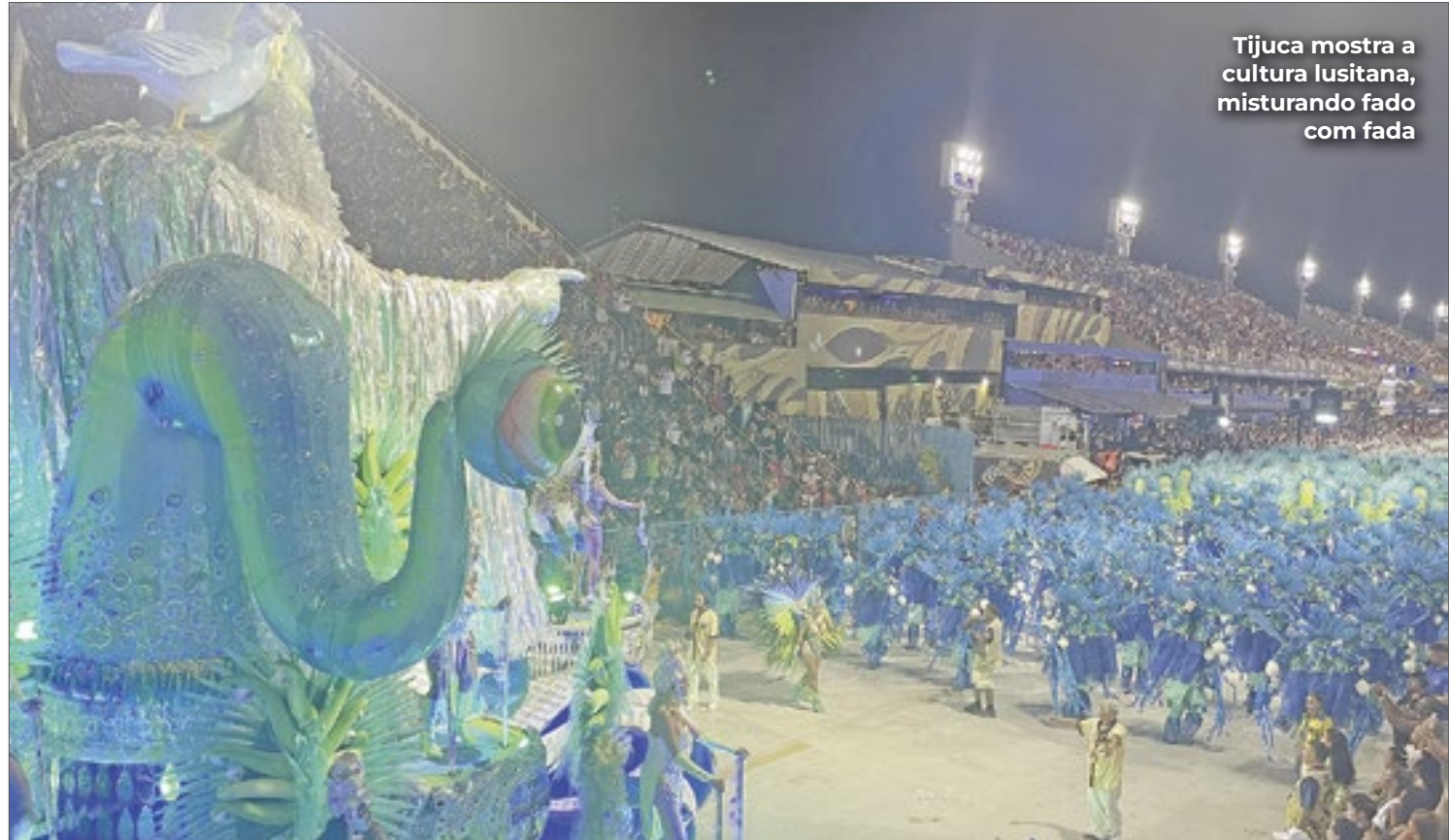
Tijuca mostra a cultura lusitana, misturando fado com fada