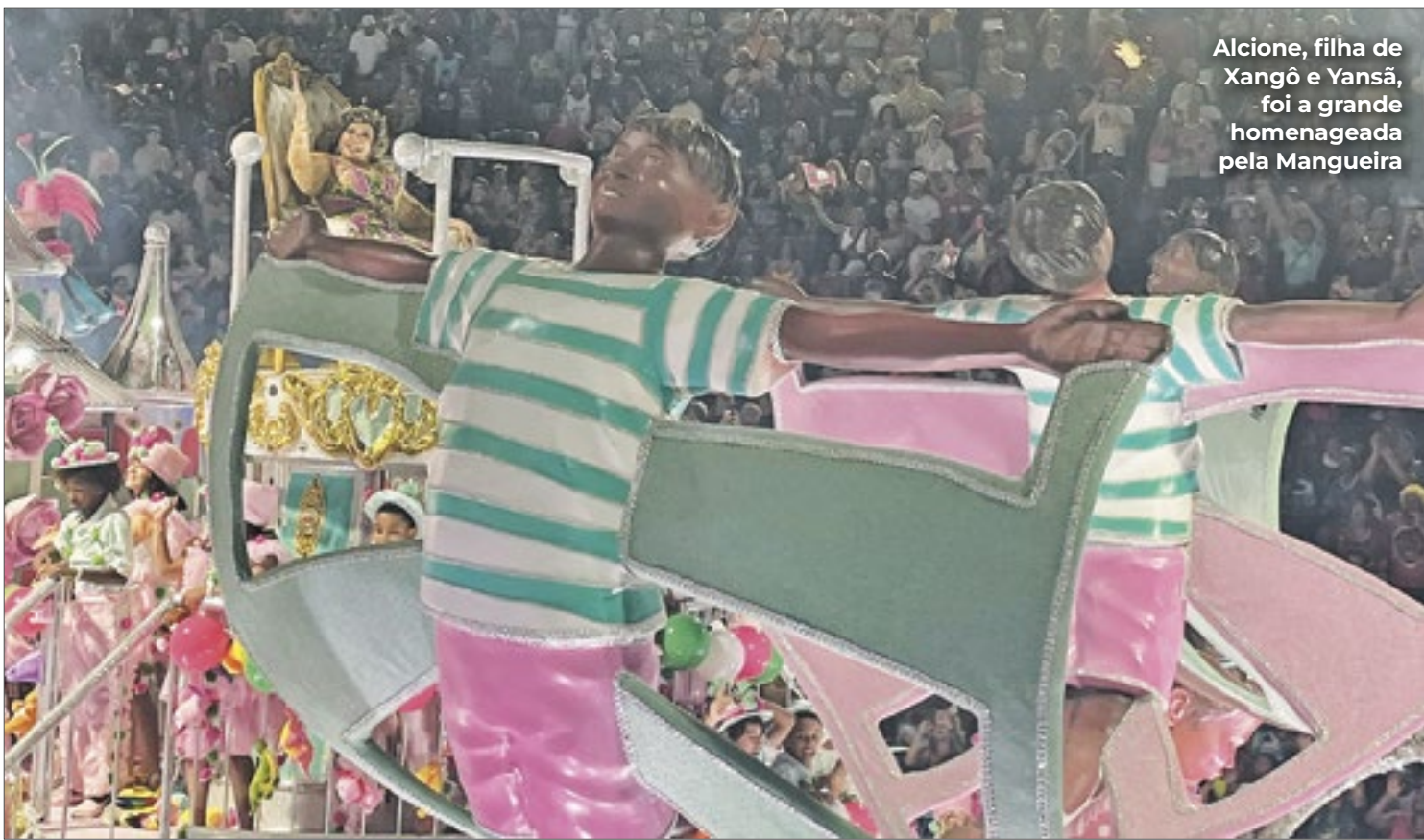
Alcione, filha de Xangô e Yansã, foi a grande homenageada pela Mangueira