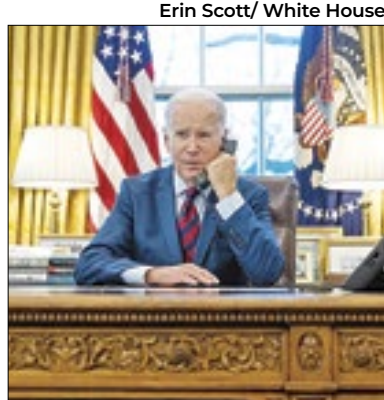
Biden quer aprovar pacote

Pode ter naufragado nos Estados Unidos o objetivo do presidente Joe Biden de enviar um pacote de ajuda adicional para a Ucrânia, em guerra contra a Rússia, e Israel, em guerra contra o Hamas, no valor de US$ 95 bilhões. Ainda que o projeto avançasse no Senado em meio a rachas no Partido Republicano, o presidente da Câmara dos Representantes, o também republicano Mike Johnson, afirmou que a Casa rejeitará o conteúdo. Republicanos são maioria.