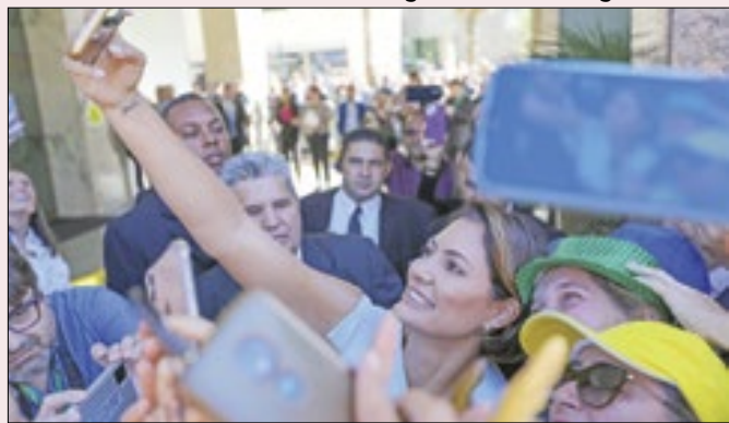
Desempenho de Michelle na pesquisa impressiona