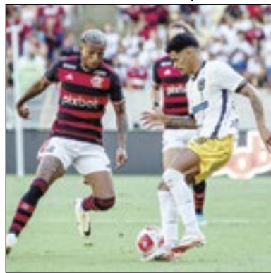
Voltaço perdeu de 3 a 0 pro Fla

Nesta quarta-feira (14), às 19h, o Voltaço enfrentará o Botafogo, no Estádio Raulino de Oliveira, em Volta Redonda. Na tarde do último sábado (10), em jogo atrasado da terceira rodada do Carioca, o Flamengo bateu o Volta Redonda por 3 a 0. Gabi, Pedro e Ayrton Lucas balançaram as redes. Com o resultado, o Fla somou 15 pontos e se consolidou na segunda colocação do campeonato.