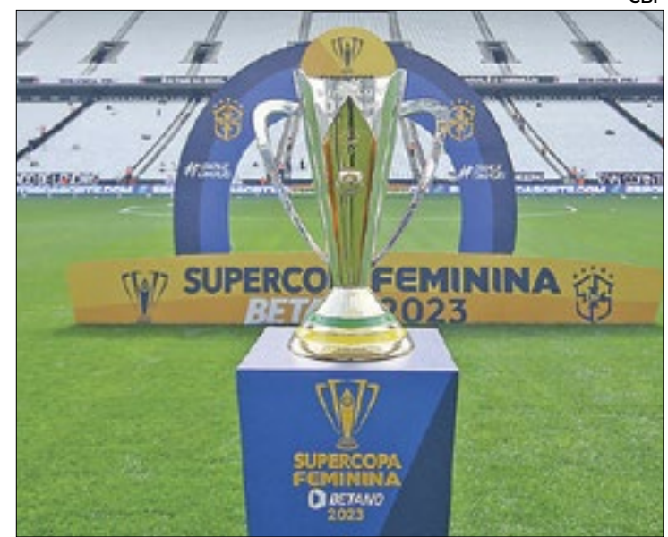
Semifinais da Supercopa acontecem nesta quarta-feira

Já o Cruzeiro se garantiu nas semifinais após superar o Real Brasília por 1 a 0 no último sábado (10), enquanto o Avaí avançou ao superar o Fluminense por 3 a 1 na sexta (9).