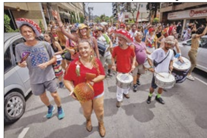
Terê Alegria em Família levou blocos às ruas