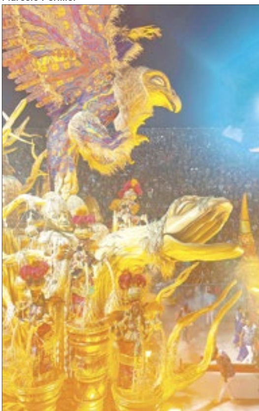
Portela se redimiu do ano passado e fez um desfile colorido