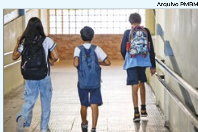
Cerca de 80 alunos serão beneficiados

das diversas praças esquecidas, seja por mato alto, brinquedos quebrados ou mesmo algumas que se tornaram depósito de entulho”, criticou o vereador Rodrigo na postagem.