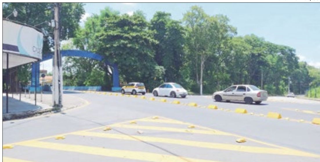
Av. Beira Rio se tornou via única e moradores precisam retornar na Ilha São João

Com a proposta de melhorar o fluxo de veículos e ampliar a segurança no trânsito, a Secretaria de Transporte e Mobilidade Urbana (STMU) alterou o sentido de trechos de duas vias no bairro Voldac, em Volta Redonda. No entanto, a mudança não agradou em nada os moradores da Avenida Beira Rio, e ocasionou duras queixas para a associação do bairro.