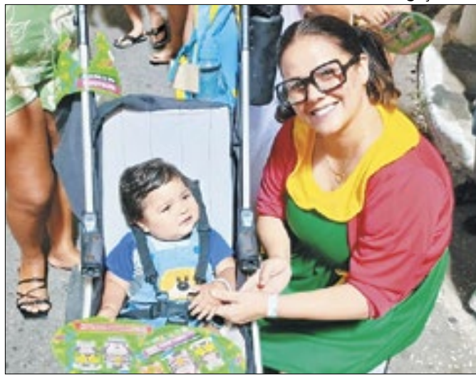
Foram utilizadas pulseiras nas crianças e adolescentes