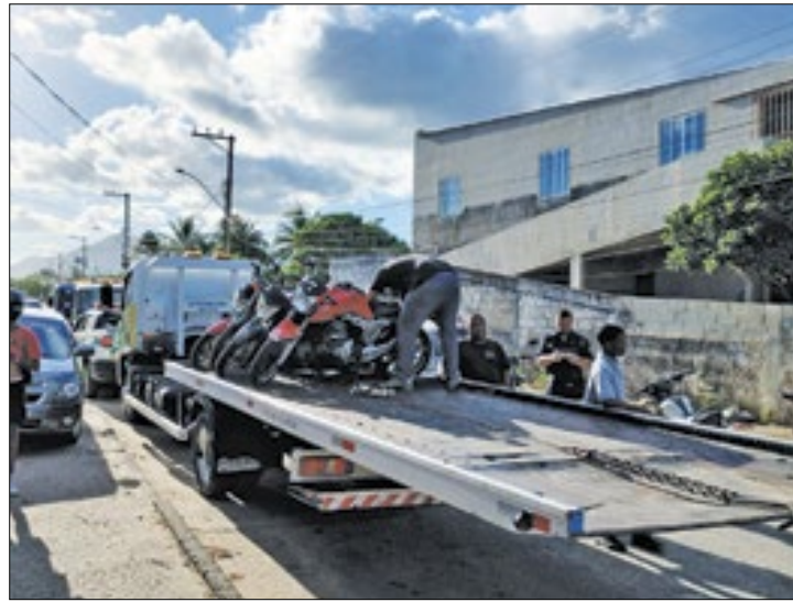
Operações no combate aos veículos irregulares

A Prefeitura de Saquarema, por meio da Secretaria Municipal de Segurança e Ordem Pública, seguiu com as equipes em esquema de prontidão, 24 horas por dia, nas ruas da cidade. O objetivo do trabalho foi realizar ações de prevenção e combate à irregularidades!