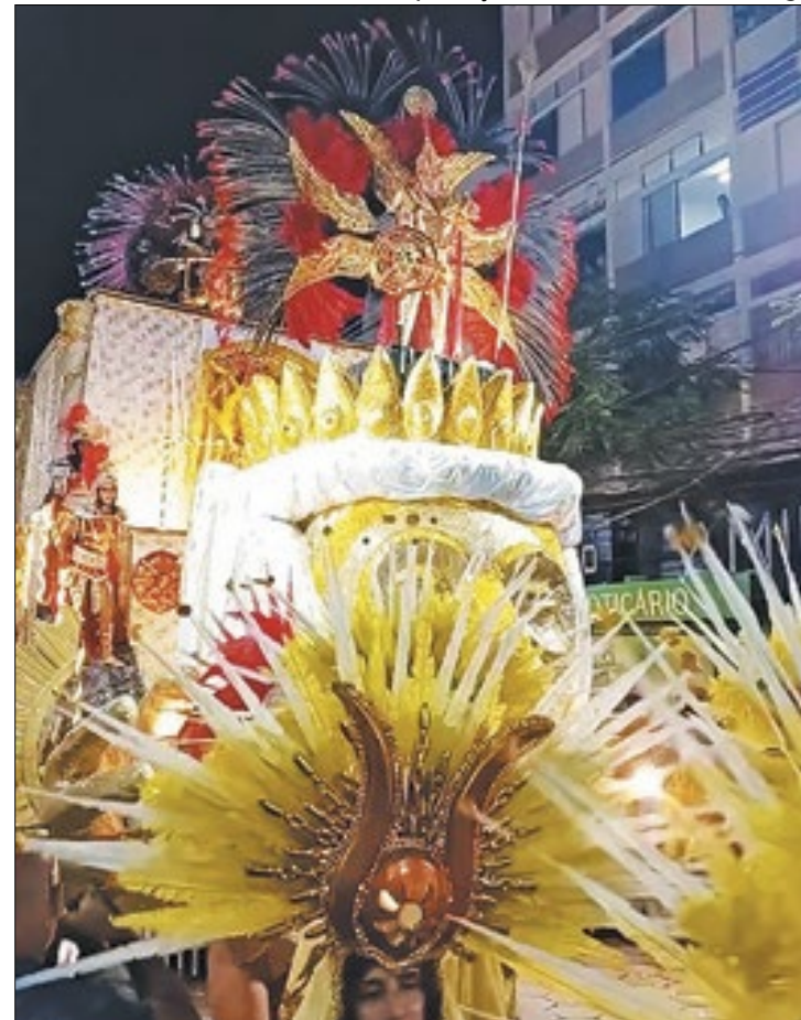
Alunos do Samba foi um dos destaques em Nova Friburgo