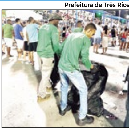
Material colhido será processado

A prefeitura de Três Rios, o Instituto Recicleiros e a Cooperativa Recicla do município fecharam uma parceria para que fosse realizada a Coleta Seletiva durante todo o Carnaval 2024. Todo o material arrecadado será enviado para a Unidade de Processamento de Materiais Recicláveis da cidade. Além de ajudar o meio ambiente, depois irá se tornar renda para mais de 20 famílias que tiram o sustento da reciclagem.