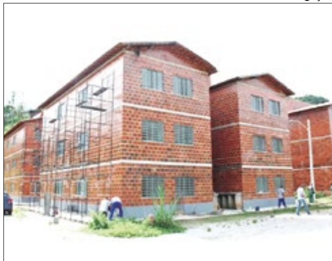
Conjunto Habitacional na Posse em Petrópolis