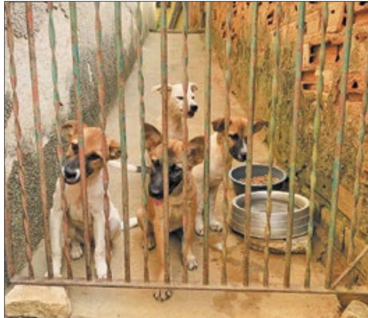
Caso de maus-tratos foi solucionado em Barra Mansa

toridades que possam localizar e punir os culpados.