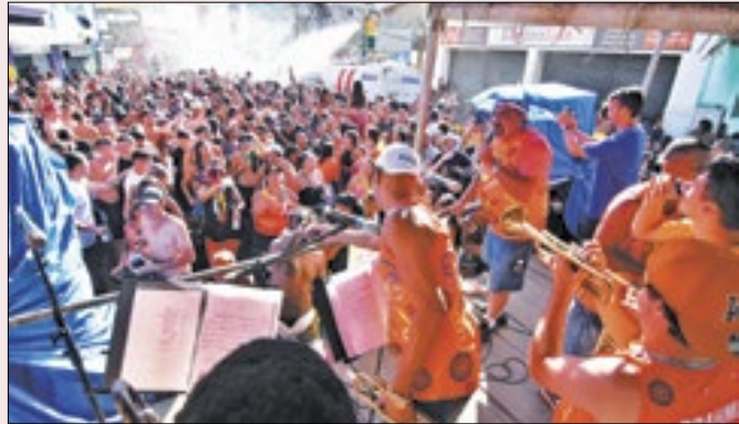
Banho à Fantasia foi animado pelo Bloco Vai Dar M