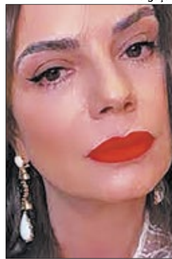
Luiza Brunet defende alterações na Convenção de Haia

“Hoje em dia, todo mundo sabe o que é violência doméstica, racismo, homofobia. São temas que as pessoas falam de uns anos para cá. É algo recente. ‘Mães de Haia’, por ser algo recente, vem com uma carga de preconceito, as pessoas têm muito medo de falar. É preciso dar continuidade ao debate, senão o assunto morre. É preciso ter um compromisso de ‘não deixar a peteca cair’ e nós da sociedade também pre-