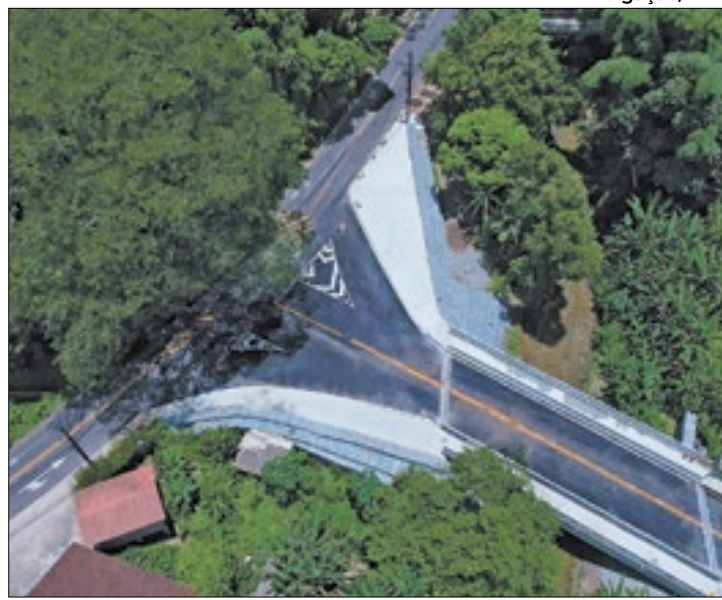
Obras melhoraram a ida e vinda dos turistas ao interior

Os turistas que chegam ao estado e escolhem explorar as experiências do interior, em especial nas cidades da Região dos Lagos, contam com estradas recuperadas e mais segurança nas estradas recuperadas a partir dos investimentos do Governo do Rio. Foram mais de R$ 65 milhões investidos em infraestrutura e renovação de trechos das pistas da RJ-102 e RJ-106. Quem escolher se refugiar em Lumiar, distrito de Nova Friburgo, também pode contar com o novo Contorno de Lumiar, na RJ-142, obra executada pelo Departamento de Estradas de Rodagem (DER-RJ) que foi aberta para o Carnaval, mas que ainda será entregue oficialmente