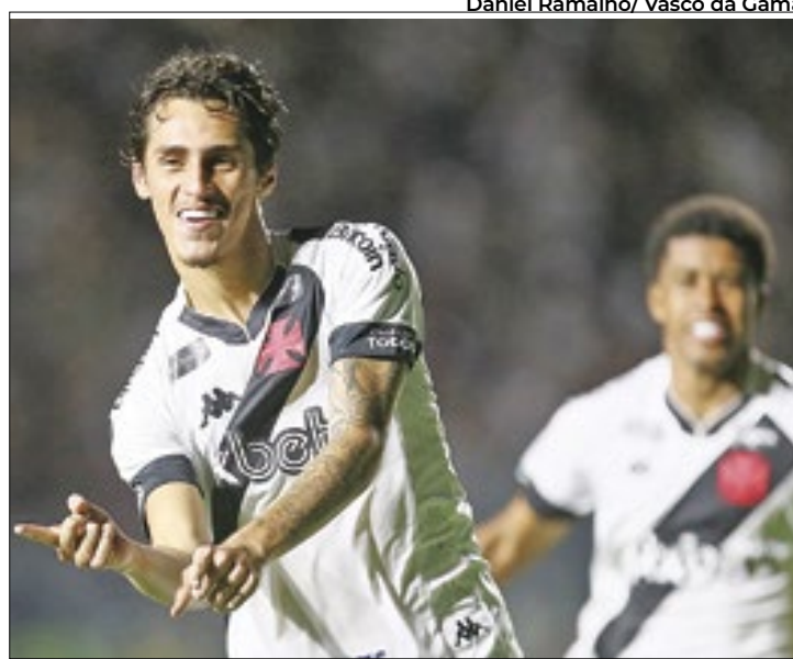
Clubes brasileiros faturam muito com as vendas da base

Na 13ª posição, o Flamengo é o primeiro sul-americano no ranking. Impulsionado pela venda de Vinícius Júnior, em maio de 2017, por 45 milhões de euros (R$ 164 milhões, na época), o clube ar-