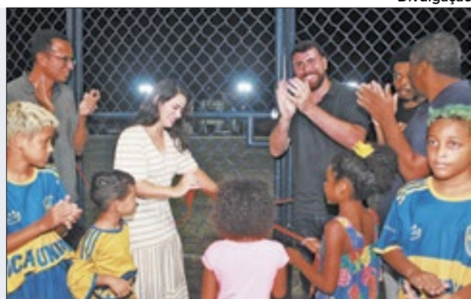
Inauguração do complexo foi na última quinta-feira

prefeitura, se destacam a limpeza de vias públicas, desobstrução de bueiros, remoção de entulhos, troca de lâmpadas, pintura de meio fio, e lavagem da Wendel Coelho. As pessoas afetadas pelas chuvas também realizaram cadastro nos programas sociais do município.