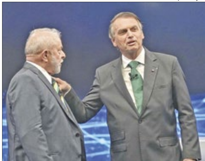
O país segue dividido entre Lula e Bolsonaro