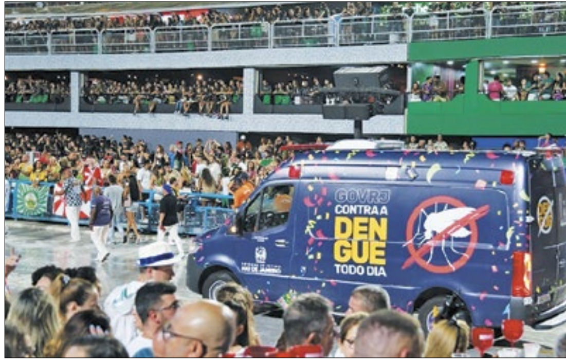
Ambulância do Samu adesivada com a campanha encerrou as apresentações de cada escola