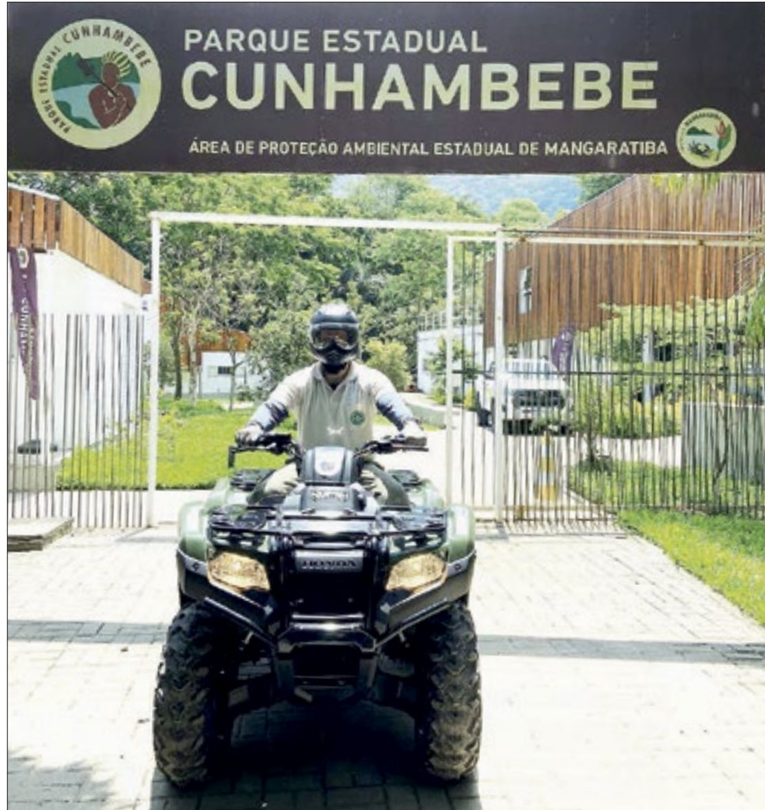
Novos veículos irão aprimorar a fiscalização e o monitoramento ambiental

O Instituto Estadual do Ambiente (Inea) entregou, neste mês, 19 novos quadriciclos como parte do projeto de Fortalecimento das ações de proteção, monitoramento e fiscalização nas Unidades de Conservação Estaduais. A iniciativa visa aprimorar as condições de fiscalização e monitoramento ambiental, essenciais para preservar nossos recursos naturais.