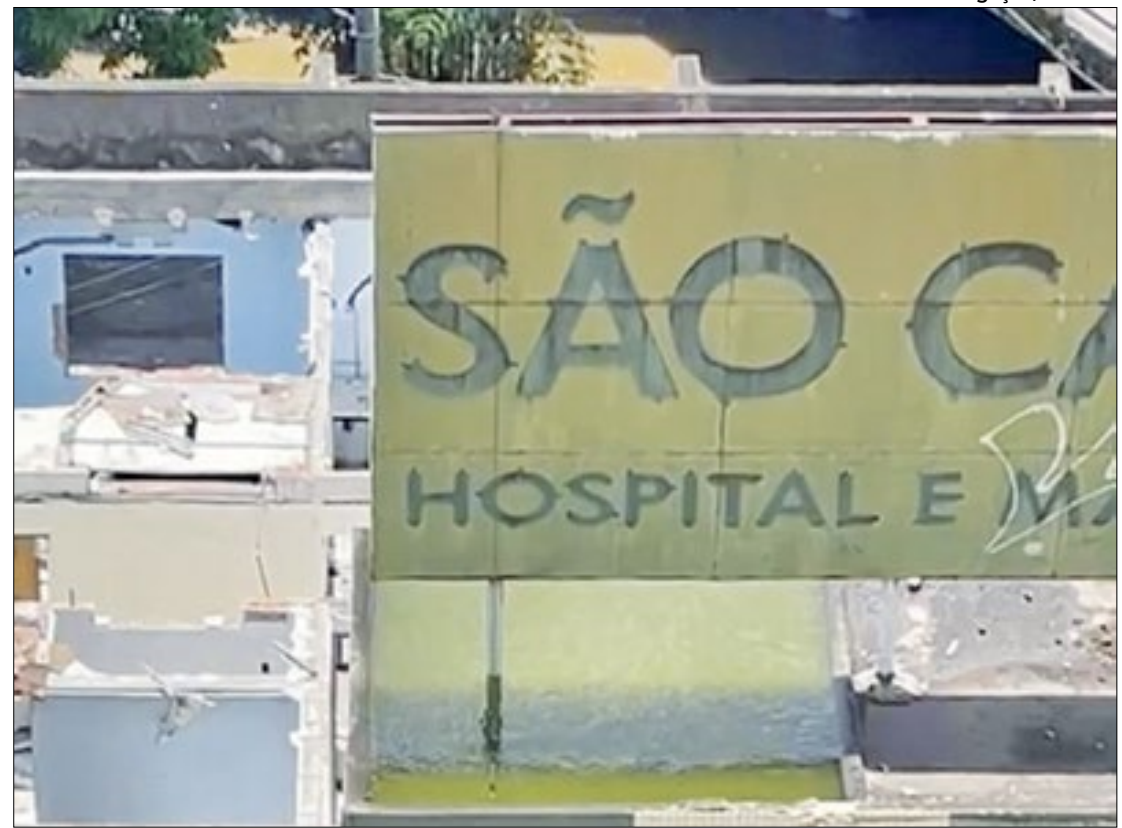
Vídeo mostra terraço do antigo Hospital São Camilo cheio de água parada

"A ação foi realizada já na manhã desta quinta-feira com os agentes utilizando o UBV costal, terminando de eliminar possíveis situações de risco", declarou Janaína Soledad, acrescentando que, ainda no período da tarde, a SMI retornaria ao prédio para concluir a