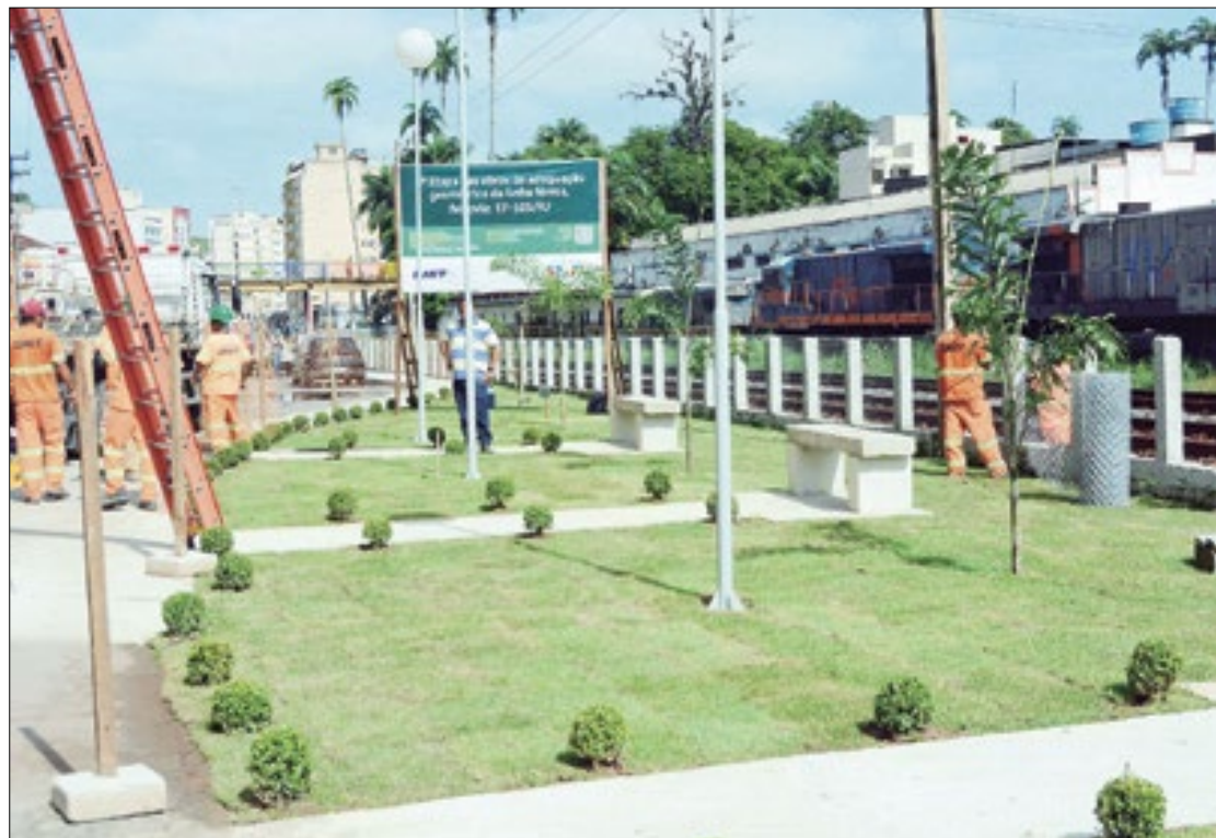
Obras em Barra Mansa terão projeto de paisagismo em seu entorno