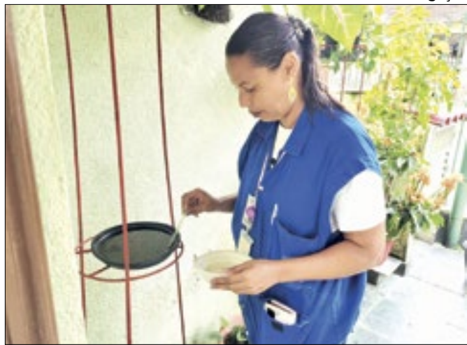
Agentes vão estar na Sapucaí orientando o público