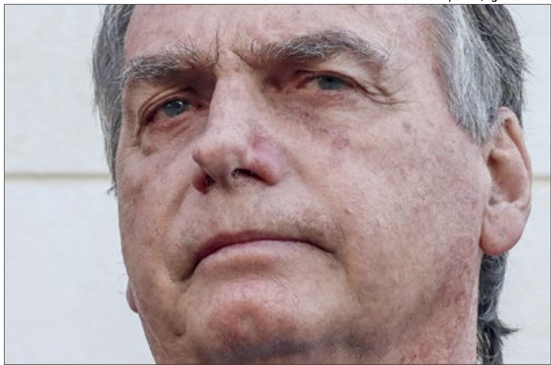
A ação da PF investiga Bolsonaro e outros por suposta tentativa de golpe

Além do documento em si, a PF também encontrou um vídeo