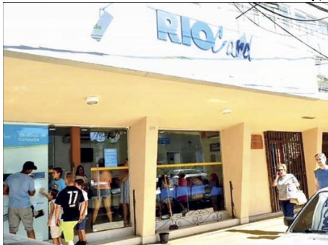
Alunos e responsáveis devem ir numa das unidades do Riocard para fazer o cartão

Os novos alunos devem ficar atentos ao passo a passo para a emissão da primeira. Após a confirmação da matrícula em uma escola municipal, os estudantes (e responsáveis) podem procurar uma das lojas com atendimento à gratuidade da Riocard Mais (Campo Grande, Carioca, Méier ou Siqueira Campos), munidos dos seguintes documentos — documento de identificação oficial com foto ou certidão de nascimento (se for menor, o original); CPF (original); declaração escolar original, carimbada e assinada pelo diretor, com validade de 30 dias; e comprovante de residência original (conta de água, luz, gás ou telefone) dos últimos 90 dias —, onde será feita uma foto do aluno. Vale destacar que cópias dos documentos não serão aceitas, e a presença do estudante é obrigatória. Caso o aluno ainda não assine, deverá estar acompanhado do responsável (pai ou mãe, avô ou avó), que deve apresentar o seu documento de identificação original com foto. Se for avô ou