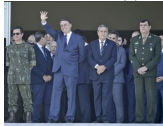
Bolsonaro e militares: todos foram alvo da PF