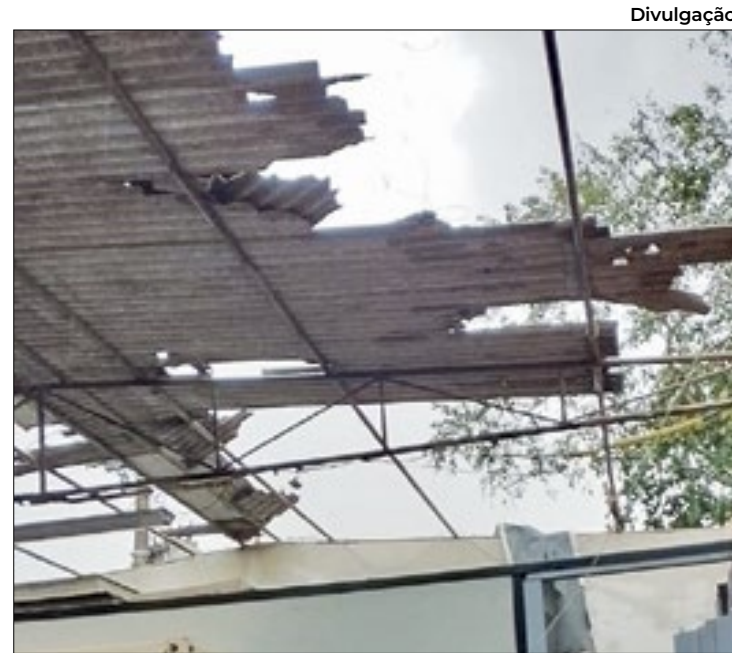
Unidade no bairro Santa Cruz perdeu parte do telhado

"Foi retirada parte do telhado junto com o forro. As luminárias quebraram e os equipamentos de som também. A estrutura onde fornecemos os cursos teve todo telhado arrancado, houve dano nos computadores do nosso laboratório, boa parte dos livros da biblioteca também foram da-