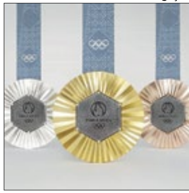
Medalhas trazem novidades

Os organizadores revelaram as medalhas que serão entregues aos atletas nos Jogos Olímpicos de Paris 2024. A novidade da vez é que todas as 5.084 medalhas, olímpicas e paralímpicas, terão pedaços hexagonais retirados da Torre Eiffel nas reformas pela qual o monumento passou nos últimos anos. Os pedacinhos inseridos no centro das medalhas trazem também os logos oficiais da Olimpíada e da Paralimpíada marcados nas plaquinhas de metal.