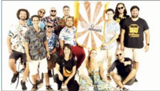
Blocos e grupos vão se apresentar até terça (13)