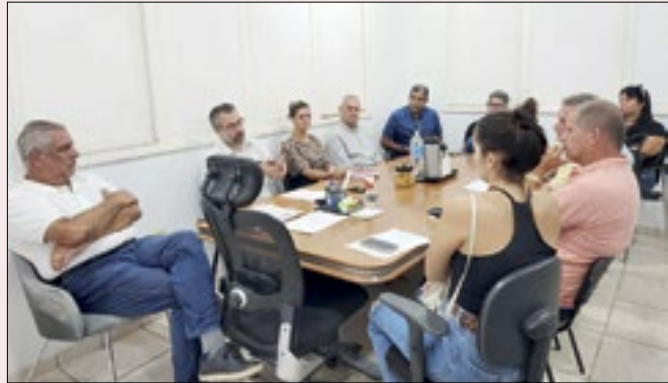
Previsão de um grande Dia D de combate ao mosquito