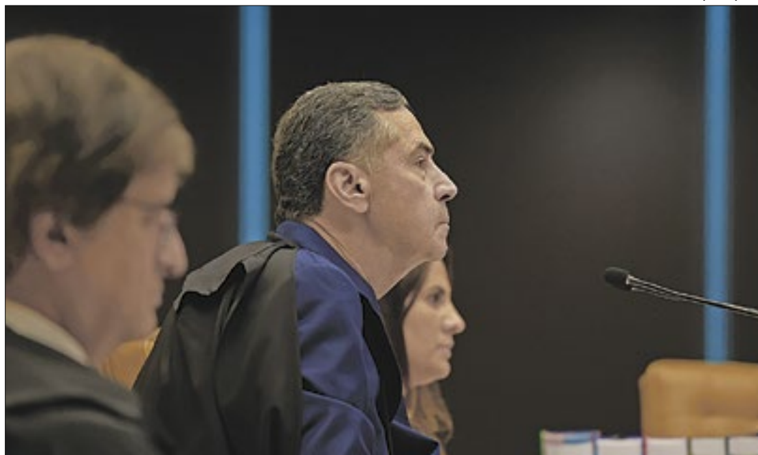
Barroso adiou novamente julgamento que pode alterar Câmara

Barroso decidiu adiar o julgamento das ações para 21 de fevereiro após afirmar existir “inúmeros pedidos” para adiar ainda mais o debate, porém disse não ser seu propósito. “A única matéria que adiei indefinitivamente foi a questão da interrupção da gestação por razões institucionais e por ser um debate que a sociedade precisa aprofundar. Fora isso, a regra geral é pautar as coisas na medida em que surjam, sem adiamentos que não tenham fundamento”, declarou o presidente do Supremo, referindo-se ao julgamento sobre a questão do aborto.