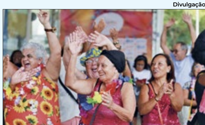
Grupo também será anfitrião do Grupo Especial

teiras e iniciarão o tratamento de seus próprios resíduos orgânicos, além de servir como material de estudo sobre a área de educação ambiental para os alunos.