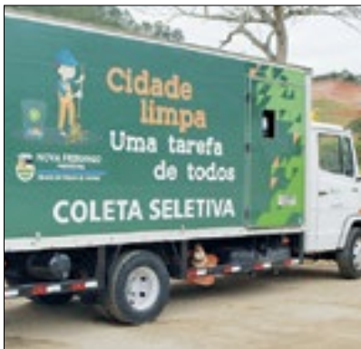
Bloquinho da limpeza

A Secretaria de Serviços Públicos da Prefeitura de Nova Friburgo, com o apoio da Secretaria de Obras e da Subprefeitura de Olaria, Cônego e Cascatinha, anunciou que estará com um cronograma operacional