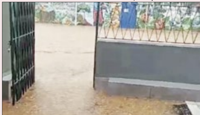
Chuva provoca alagamentos em Petrópolis