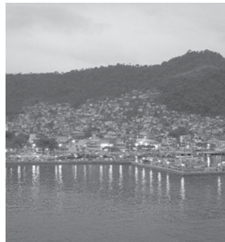
Porto de Angra dos Reis