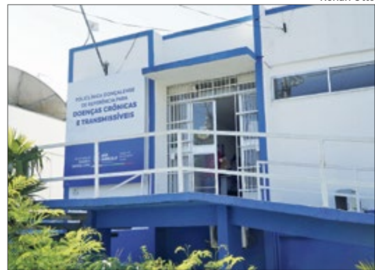
Saúde reforça alerta para cuidados contra ISTs

O feriadão do Carnaval chegou e é sempre bom esclarecer a população sobre as Infecções Sexualmente Transmissíveis (ISTs), incluindo a HIV. A coordenação do Programa Ist/Aids e Hepatites Virais alerta para a importância de se proteger e informa quais são os meios e onde encontrá-los em São Gonçalo. Durante a folia em São Gonçalo, os sete pontos da festa do Carnaval Raiz 2024 também terá distribuição de preservativos masculino e feminino.