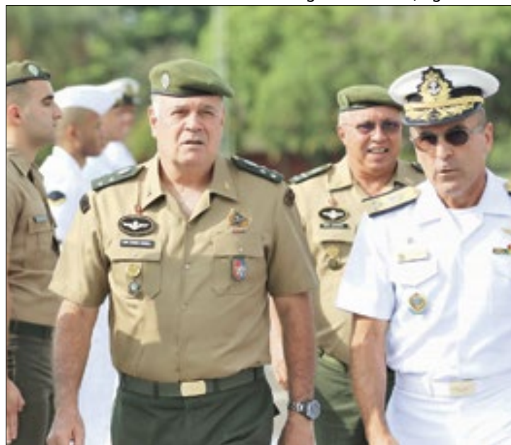
A não adesão de Freire Gomes é ponto importante

A “minuta de golpe” seria uma proposta de decreto presidencial. Por ele, Bolsonaro, ainda presidente, decretaria Estado de Defesa no Tribunal Superior Eleitoral (TSE). Uma espécie de