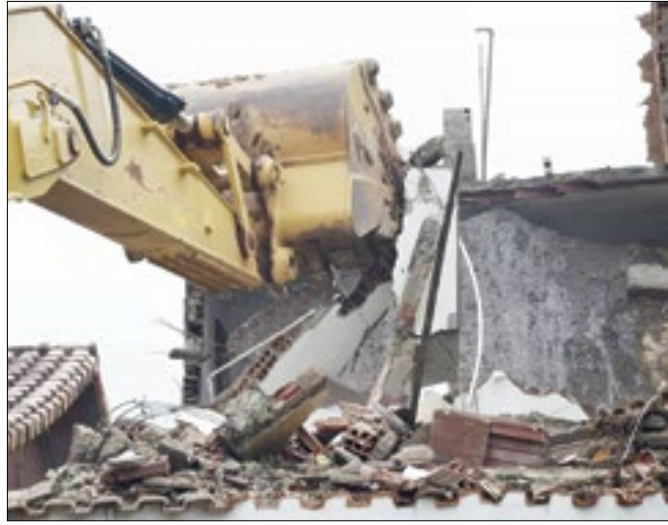
Famílias já haviam sido reassentadas