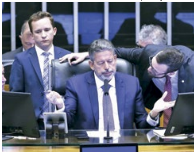
Lira teria bala na agulha para retaliar PSB