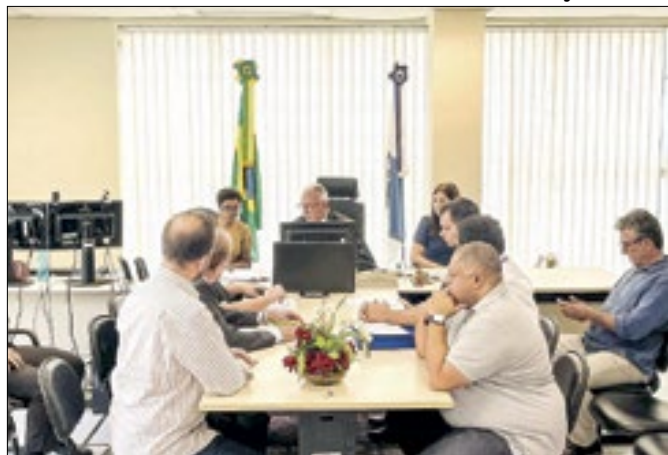
Audiência aconteceu nesta quarta-feira na 4ª Vara