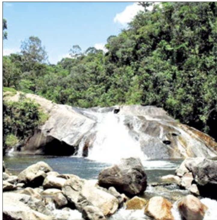
Região tem paisagens belíssimas e atrai turistas

Localizado na região turística das Agulhas Negras, no Médio Paraíba, Resende, que faz divisa com São Paulo e Minas Gerais, destaca-se ainda por abrigar uma natureza exuberante propícia à prática de caminhadas, escaladas e saltos de paraquedas em uma das melhores áreas de salto do Brasil. Além da Cachoeira da Fumaça, situada na Área de Proteção Ambiental da Serra da Mantiqueira, o município abriga a Área de Proteção Ambiental (APA) da Serrinha do Alambari; e o Parque Estadual da Pedra Selada.