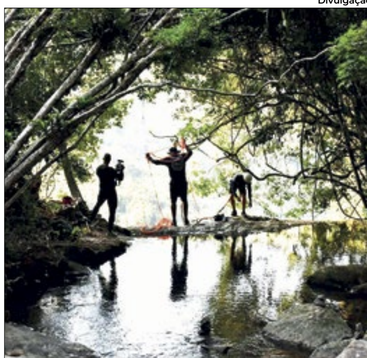
Parque Natural Municipal de Nova Iguaçu

Há dois acessos ao parque. Um deles, o chamado Acesso Sul, pode ser feito por dois caminhos. Por Nova Iguaçu, pelo bairro Caonze, passando pelas ruas Benjamin Chambarelli, Capitão Edmundo Soares e Juvenal Valadares até chegar à Estrada da Cachoeira, onde fica a portaria. Ou então por Mesquita, no bairro Coreia. Ao final da Avenida Brasil, basta cruzar