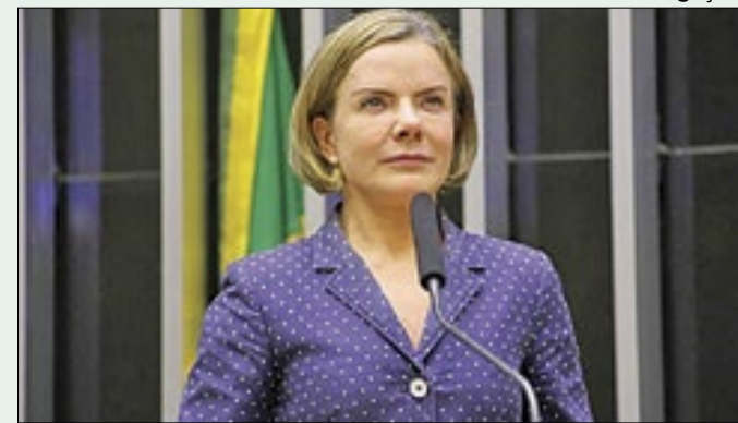
Presidente do PT: PEC entra na pauta