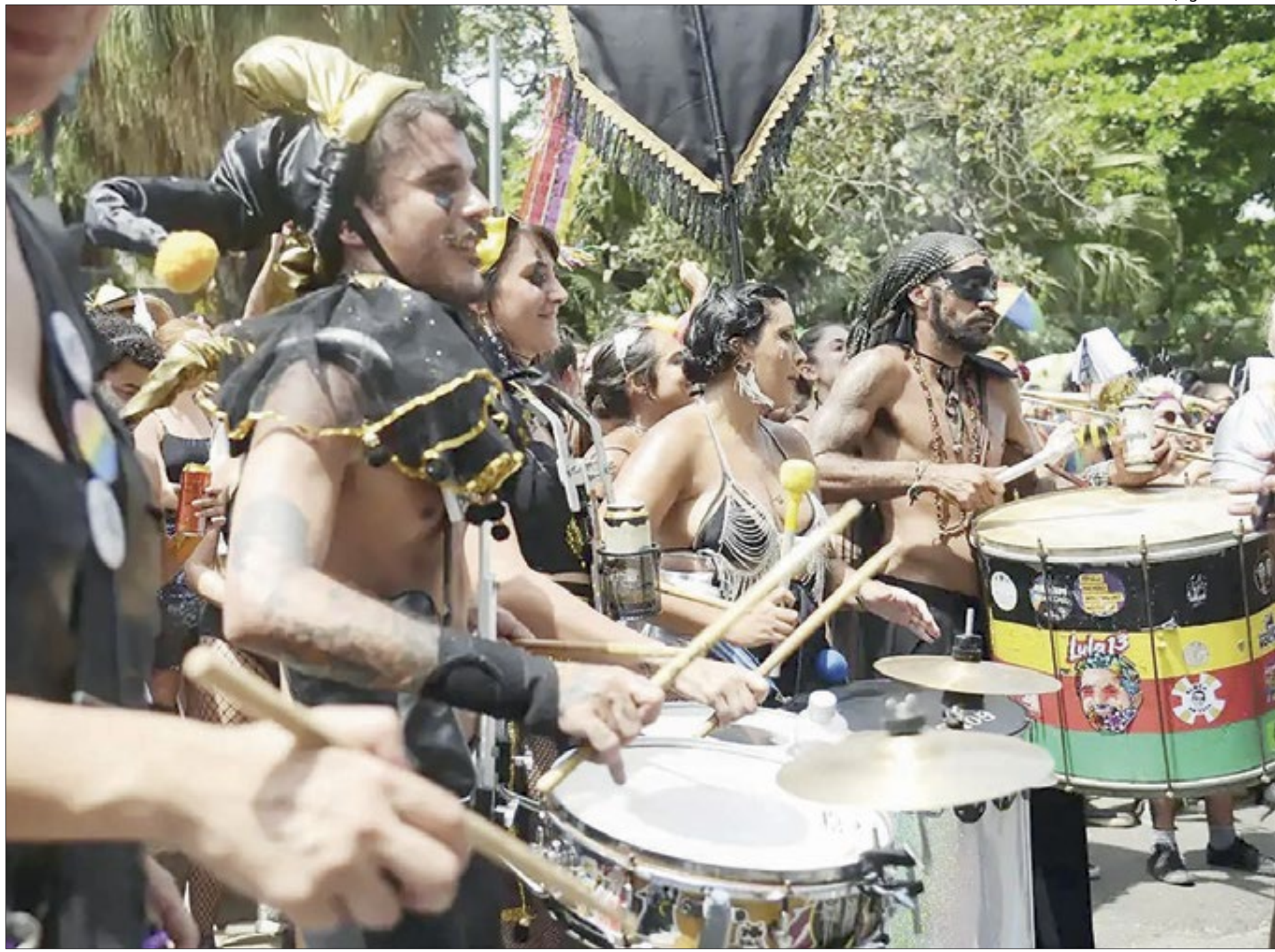
Donos de restaurantes e bares esperam enorme movimentação nos próximos dias no Rio

Em relação ao número de empregos que estão sendo criados ele comenta que por enquanto a pesquisa da Abrasel RJ