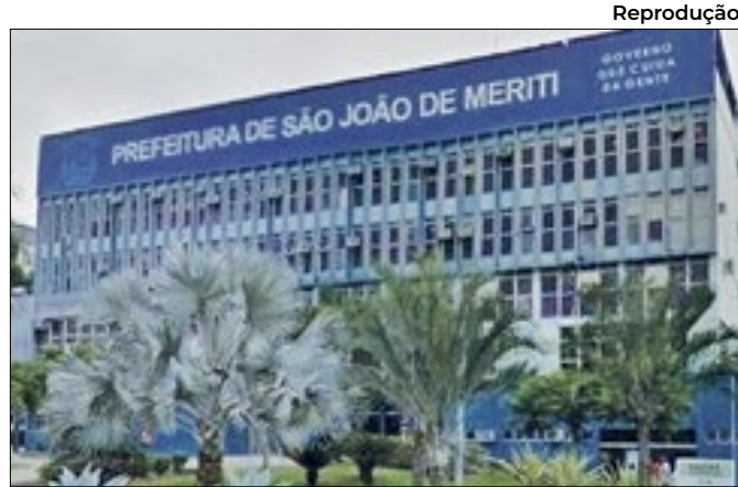
Pagamento na conta de aposentados e pensionistas