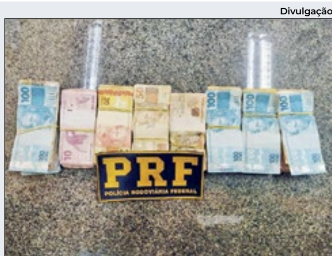
Equipe fazia fiscalização na Rodovia Presidente Dutra

diversas cobranças da categoria e da imprensa. Agora o município precisa equacionar o problema dos pagamentos que caíram pela metade. Já demorou a cair, e quando cai, vem a metade do pagamento? Inaceitável! E vamos seguir acompanhando.