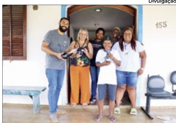
Prefeitura planeja ampliar o projeto em 2024