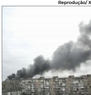
Mariupol foi devastada

As organizações pedem investigação sobre “aparentes crimes de guerra” que podem ter sido cometidos pelo presidente Vladimir Putin, pelo ministro da Defesa, Serguei Choigu, e por outras oito autoridades russas. No documento, há a recomendação de que esses indivíduos, e potencialmente outros 17 comandantes de unidades militares, sejam processados por seus possíveis papéis em graves violações cometidas na cidade ucraniana de Mariupol.