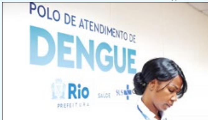
Mais quatro unidades serão abertas na semana