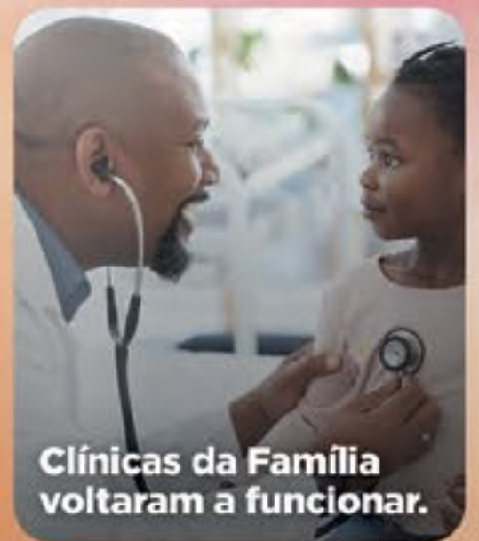
Clínicas da Família voltaram a funcionar.