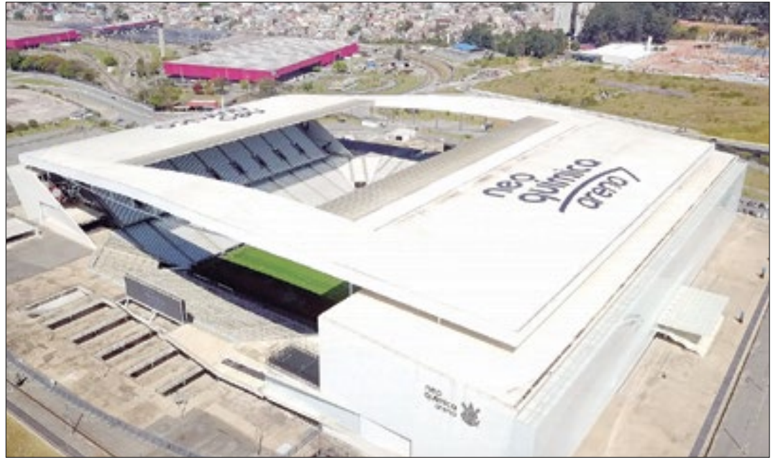
A Neo Química Arena, estádio do Corinthians, vai receber jogo de futebol americano

"O Philadelphia Eagles está honrado por ser selecionado para o primeiro jogo da NFL na América do Sul. Como o crescimento global do nosso esporte é uma prioridade para nossa liga, abraçamos a oportunidade de aumentar nossa base de fãs ao redor do mundo e levar a identidade dos Eagles aos 38 milhões de fãs do esporte no Brasil. Como uma das nações com maior diversidade cultural do mundo, o Brasil é um verdadeiro caldeirão inter-