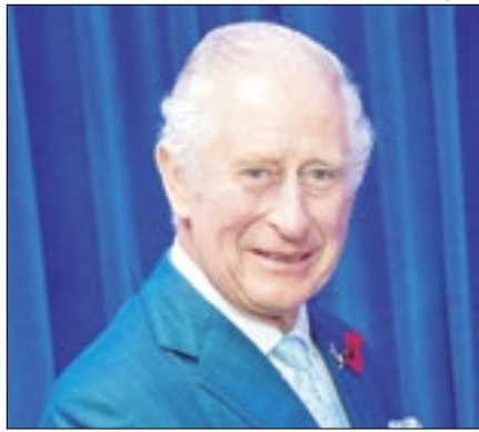
Rei Charles tem câncer

O rei Charles 3º adiou seus compromissos oficiais para tratar um câncer. O que acontece caso ele se afaste do cargo? A princípio, ele pode delegar funções para os Conselheiros do Estado. Tradicionalmente, o grupo é formado pelo cônjuge do monarca e os quatro adultos seguintes na linha de sucessão: rainha Camilla, príncipe William, príncipe Harry, príncipe Andrew e princesa Beatrice.