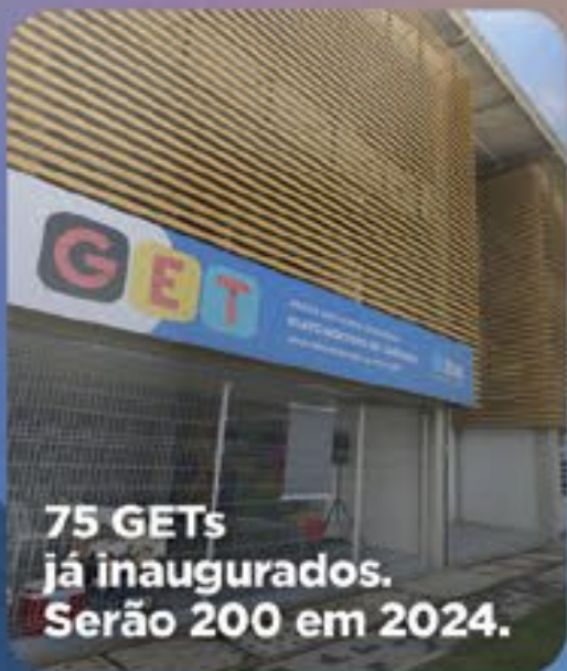
75 GETs já inaugurados. Serão 200 em 2024.