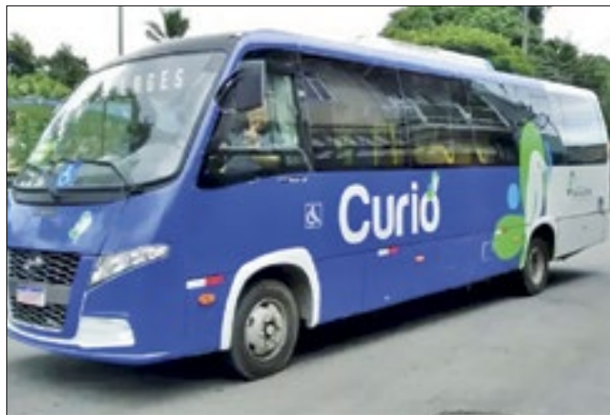
Um ano do programa de tarifa zero em Paracambi