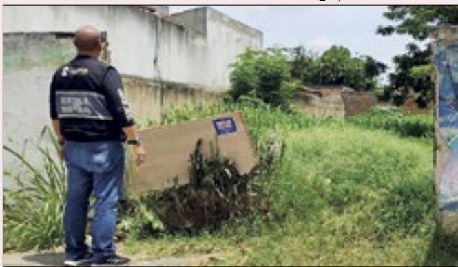
Em 2023, 1.972 notificações foram expedidas