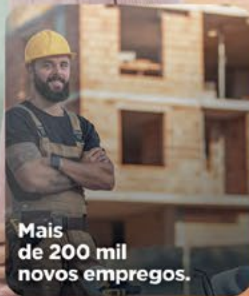
Mais de 200 mil novos empregos.