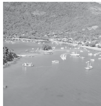
Angra e seus recursos