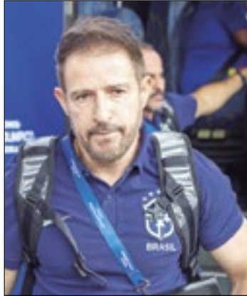
Brasil se complicou no pré-olímpico

O técnico Ramon Menezes utilizou um lema de Vitor Pereira para tentar animar o elenco do Brasil após derrota para o Paraguai por 1 a 0, na segunda (5), que complicou a seleção no quadrangular do Pré-Olímpico.