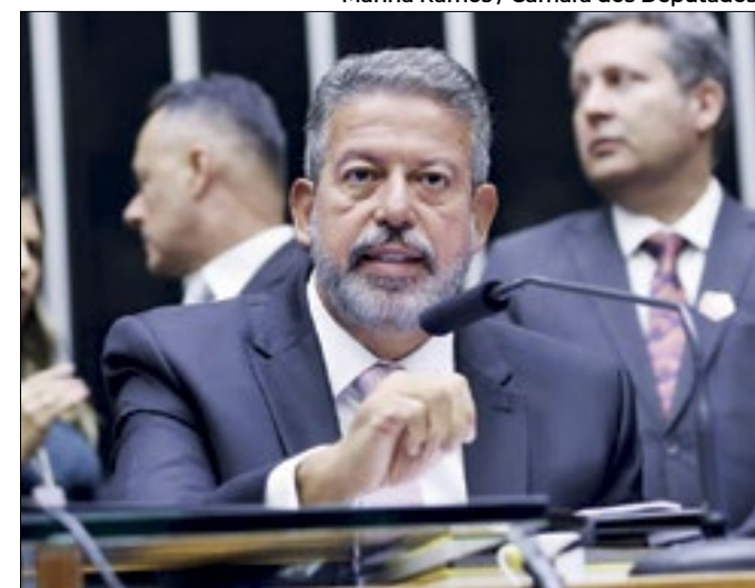
Deputado quer manter seu poder na Câmara