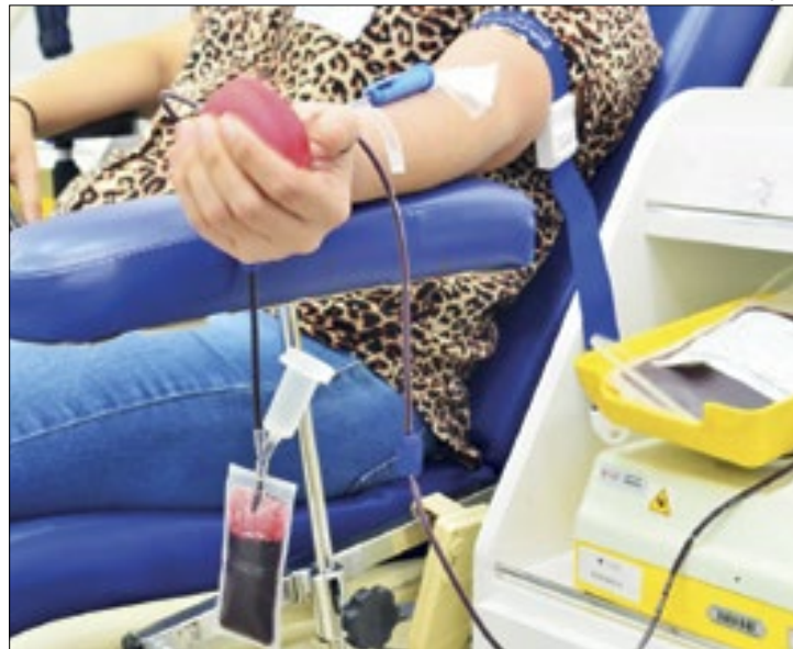
Objetivo é garantir que o estoque fique abastecido

“Este é um hospital de emergência com portas abertas que está preparado para atender a população durante o Carnaval. Contamos com a solidariedade dos doadores