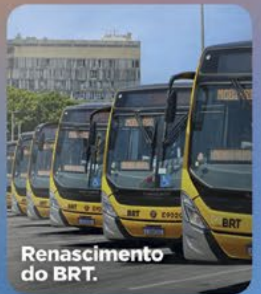
Renascimento do BRT.