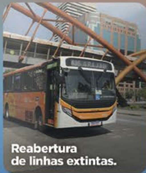
Reabertura de linhas extintas.