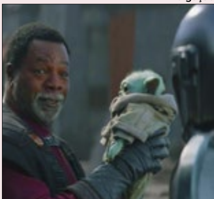
Streaming imortaliza o legado de Carl Weathers, o rival de Balboa em 'Rocky' e destaque em 'O Mandaloriano'