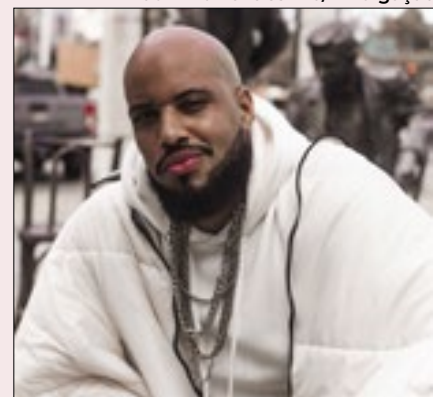
Cria de Vila Isabel, Muato acumula prêmios como autor de trilhas sonoras para espetáculos teatrais