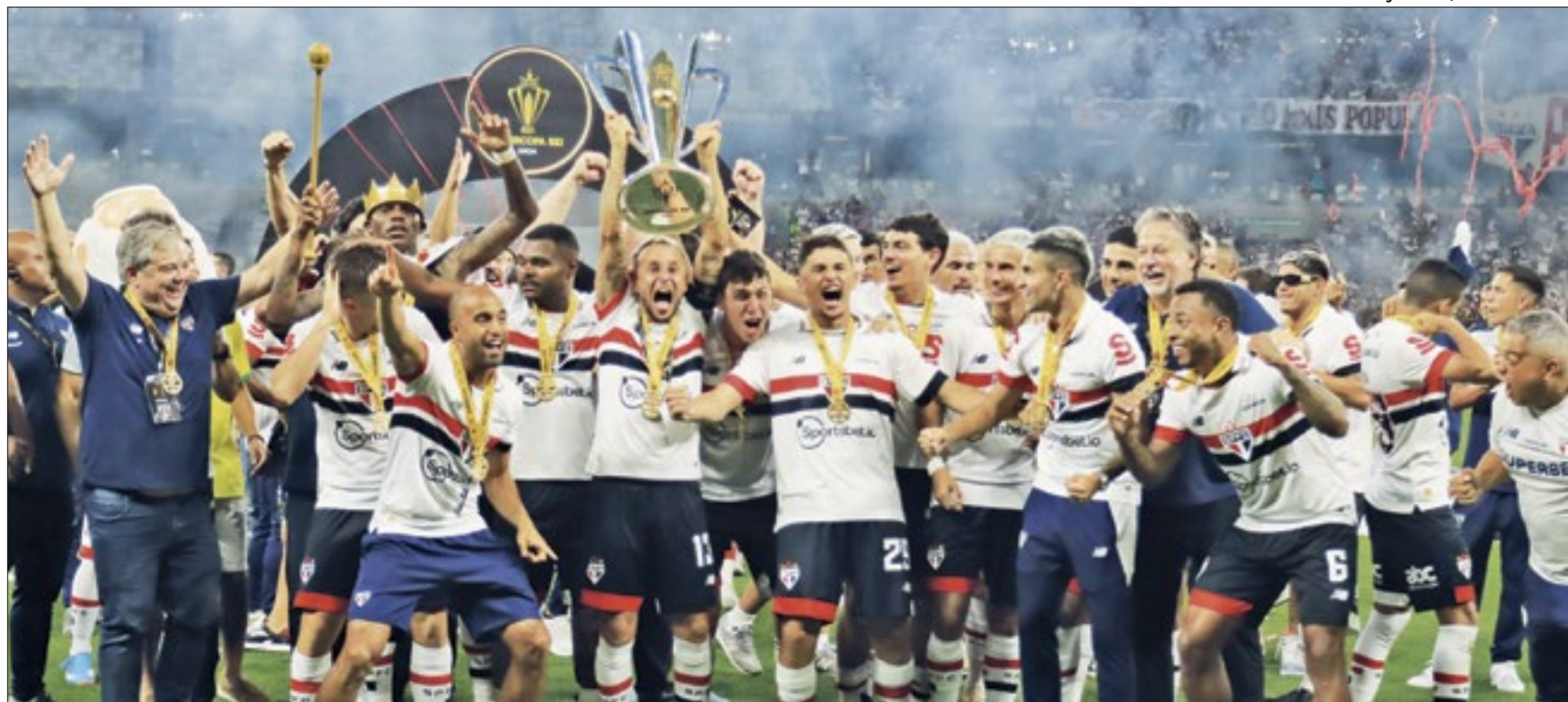
No Mineirão, o São Paulo bateu o rival Palmeiras, nos pênaltis, e conquistou a Supercopa do Brasil. Agora, Tricolor virou 'Campeão de Tudo'

Internacional: Supercopa do Brasil Embora seja tricampeão brasileiro (1975, 1976 e 1979) e campeão da Copa do Brasil (1992), o Internacional ainda não teve a oportunidade de disputar a Supercopa do Brasil - o torneio em que os campeões nacionais se enfrentam teve duas edições em 1990 e 1991 e passou por um hiato entre 1992 e 2019, voltando a ser disputado a partir de 2020.