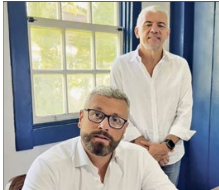
O novo sistema facilitará integração dos pais com a escola

De acordo com o site da empresa, pelo menos 12 mil escolas e 2,3 mil municípios do Brasil e Argentina já foram atendidos com esse sistema.