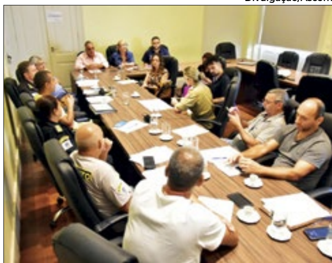
Reunião de alinhamento com as forças de segurança