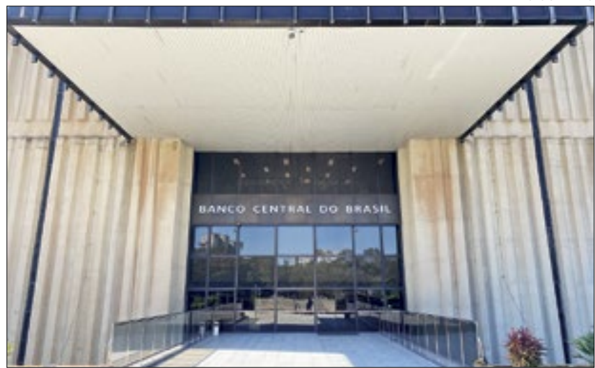
Banco Central prevê inflação a 3,81% e PIB em alta de 1,6%

Estabilidade para a inflação, acompanhada de uma sinalização de 'marcha lenta' na economia. Esse cenário sintetiza as projeções, pelo menos, no momento, dos principais indicadores econômicos, constantes