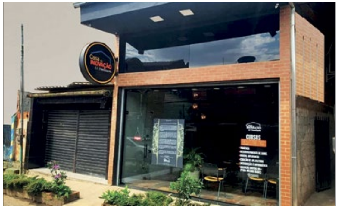
Casa da Inovação Estrada de Ferro Therezópolis

São oferecidas vagas para os cursos gratuitos de Robótica (8 a 17 anos), Criação de Games (8 a 17 anos), Operador de Drone (a partir dos 18 anos), Introdução à Informática (a partir dos 12 anos), Inclusão Digital 60+ (a partir dos 60 anos), Criação de Aplicativos (a partir dos 12 anos), Iniciação na Língua Inglesa (a partir dos 12 anos), Youtuber (a par-