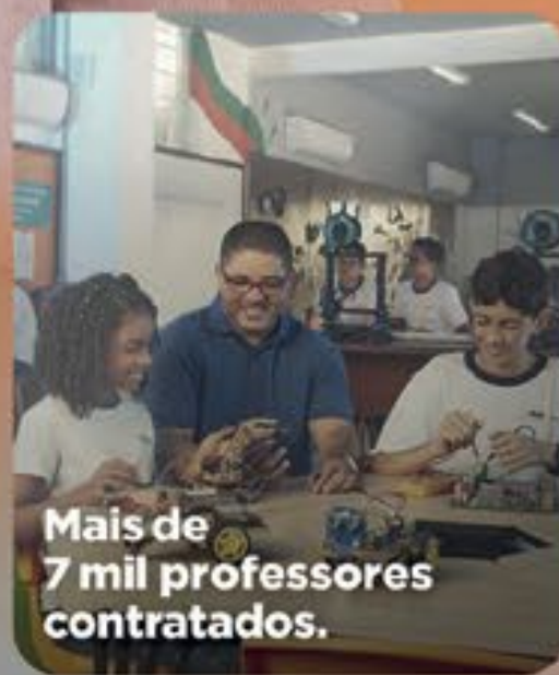
Mais de 7 mil professores contratados.