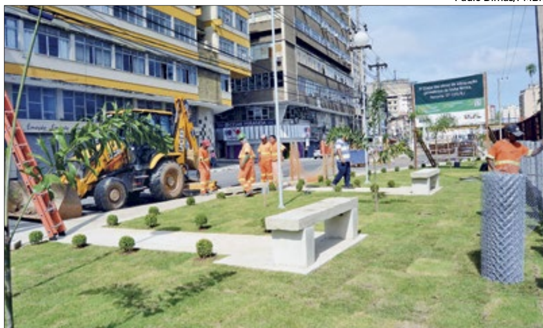
Os trabalhos foram iniciados na nova avenida próxima à Gare da Estação

A readequação ferroviária consiste em três grandes