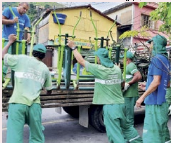
Limpeza e roçada para o Carnaval em Petrópolis