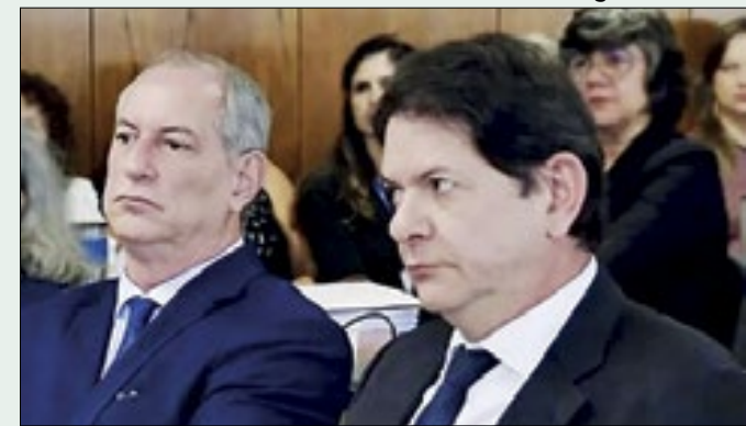
Ciro e Cid Gomes: pedras no caminho de federação