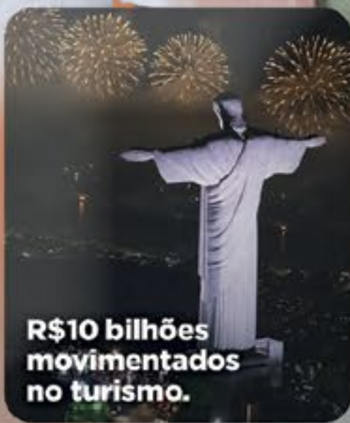
R$10 bilhões movimentados no turismo.