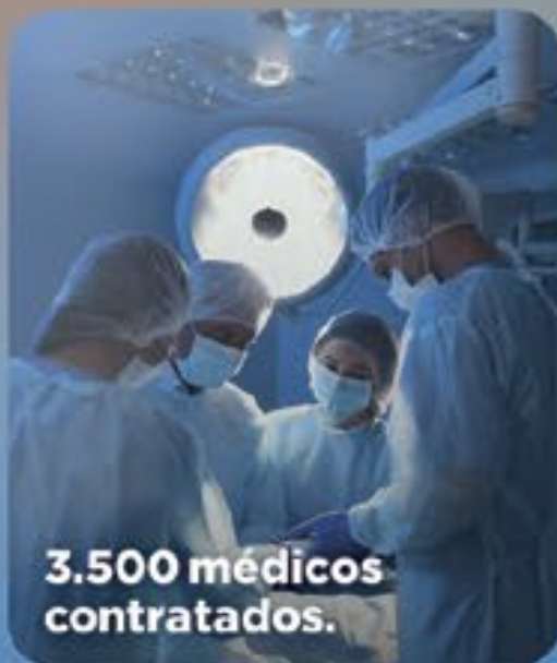
3.500 médicos contratados.