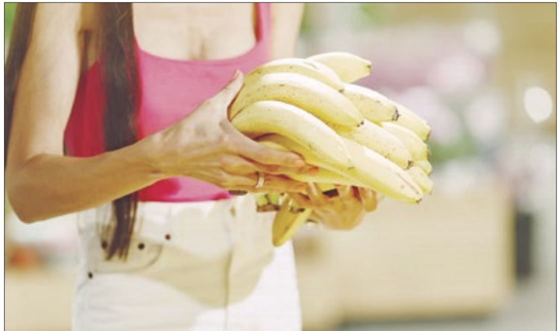
Com a guerra na Ucrânia, Equador vê país embarrear compra de suas bananas

Os EUA têm procurado parcerias semelhantes em todo mundo, para tentar mitigar o esvaziamento dos depósitos ucranianos com a guerra, já que o ritmo de produção ocidental para supri-los é insuficiente, prejudicando as ações de Kiev.