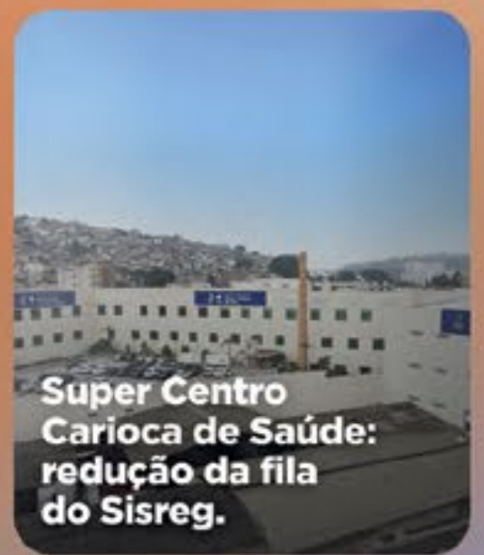
Super Centro Carioca de Saúde: redução da fila do Sisreg.