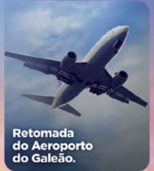
Retomada do Aeroporto do Galeão.