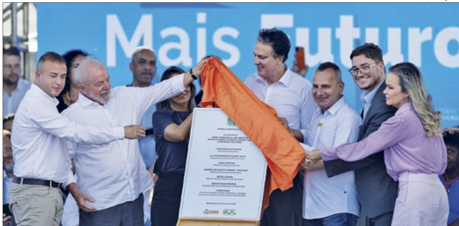
Presidente Lula durante anúncio de investimento na saúde e na educação, no centro de Belford Roxo