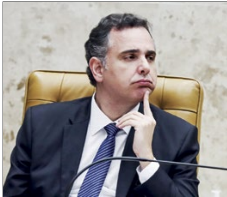
Pacheco reforça disposição de discutir poderes do STF

O discurso de Pacheco aconteceu pouco após a investigação da Polícia Federal (PF), autorizada pelo STF, que mirou congressistas da oposição, principalmente deputados bolsionistas. Em 18 de janeiro, por exemplo, a PF realizou busca e apreensão no gabinete do líder da oposição na Câmara, Carlos Jordy (PL-RJ). Ele é investigado por possível envolvimento no planejamento e financiamento da tentativa de