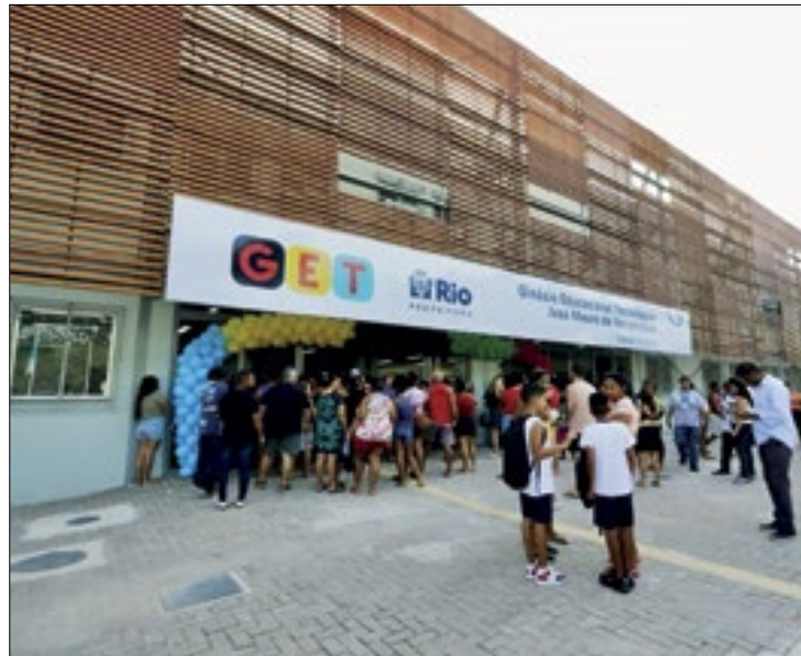
Unidades foram abertas em Bangu e Santa Cruz

O chamado Legado Olímpico vai ganhando força na capital fluminense, com o reaproveitamento de estruturas de arenas construídas para os Jogos Rio 2016, para obras em escolas e hospitais. Nesta terça (6), a Prefeitura inaugurou dois Ginásios Educacionais Tecnológicos em Bangu e Santa Cruz, com materiais da Arena do Futuro, que abrigou partidas de handebol e goalball nas Olimpíadas.