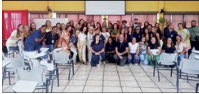
Capacitação reuniu servidores do município