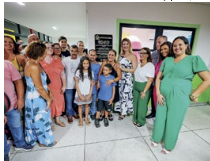
A nova creche passará a atender cerca de 100 crianças