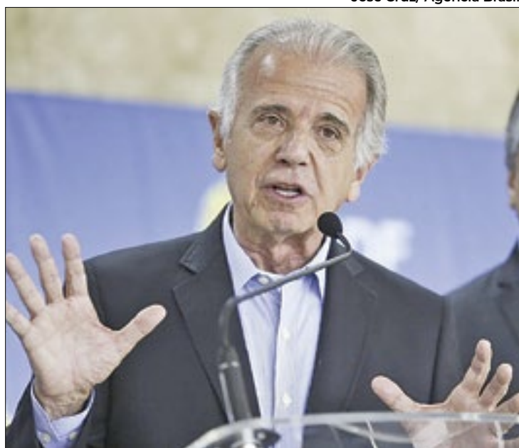
Manutenção de investimentos é vitória de José Múcio

Segundo dados do Siga Brasil, sistema do Senado que monitora quanto o governo gasta