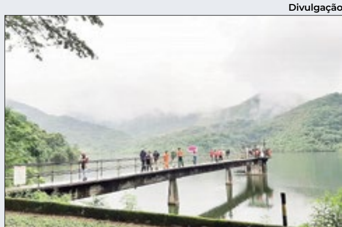
Simulado de rompimento de barragem em Saracuruna

Na sexta-feira (26), em alusão ao dia mundial da educação ambiental, a Prefeitura de Caxias realizou, em Jardim Primavera, a primeira reunião do Programa Municipal de Educação Ambiental que servirá como uma ferramenta para direcionar os trabalhos da gestão municipal na área.