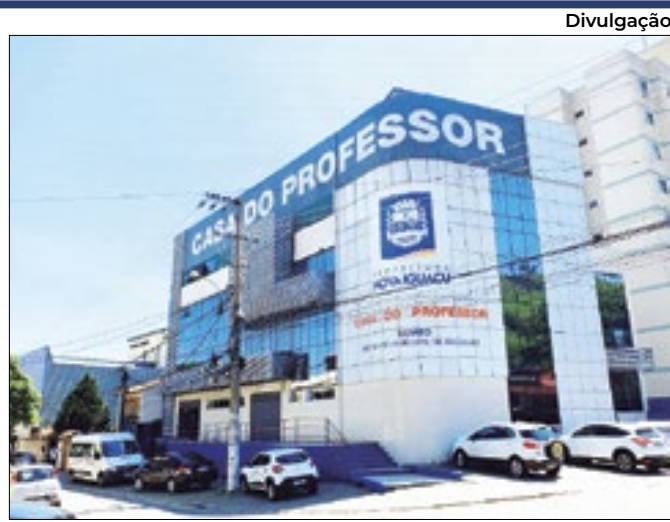
Sede da secretaria de Educação de Nova Iguaçu