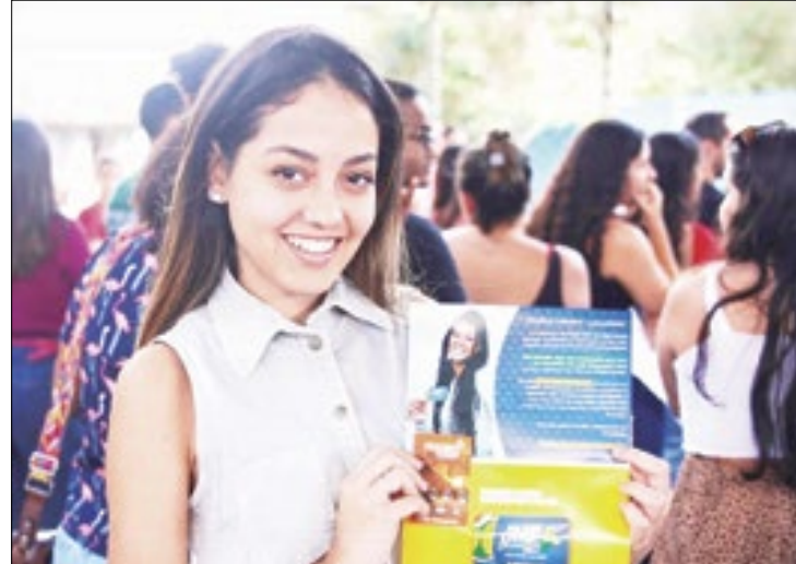
Passe livre universitário no município de Magé

"O Programa Passe Livre Universitário é uma iniciativa que vai além de passagens gratuitas, é um compromisso com o futuro. Convido todos os estudantes a se inscreve-