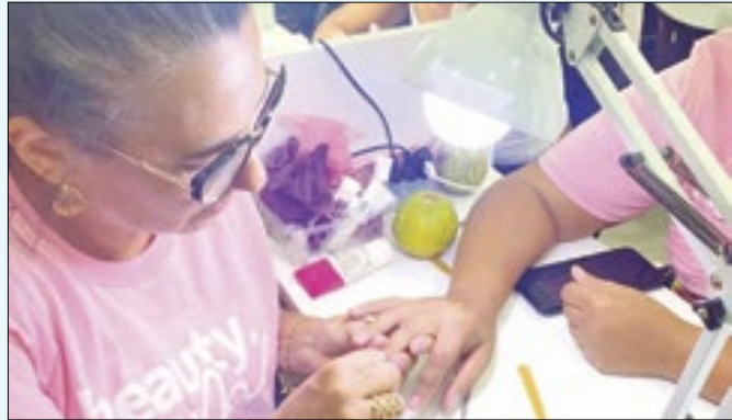
Inscrições vão até hoje, no site da secretaria