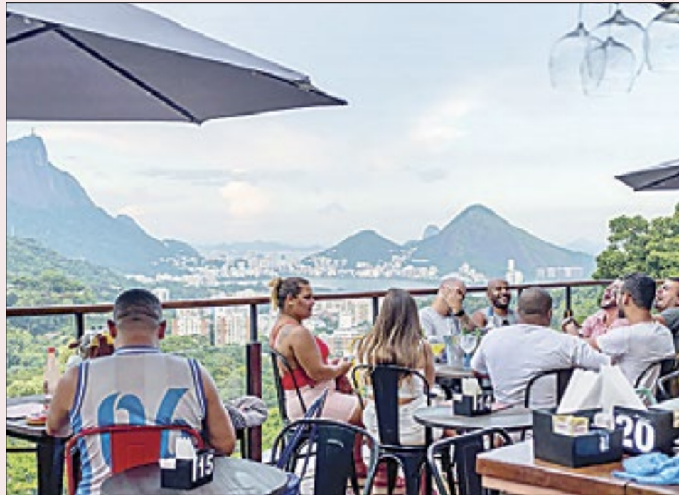
Com visão privilegiada, o Mirante da Rocinha é um dos destaques do almanaque