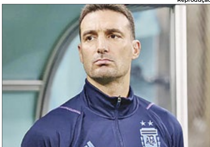
Scaloni fala em 'engessamento técnico' no futebol

Atual campeão da Copa do Mundo como técnico da Seleção da Argentina, Lionel Scaloni deu uma entrevista espetacular ao jornal 'Marca', da Espanha. Na conversa, refletiu sobre o futebol moderno e apontou que a causa para a redução dos talentos geniais, tão comuns no passado, vem do modelo comercial imposto ao esporte.