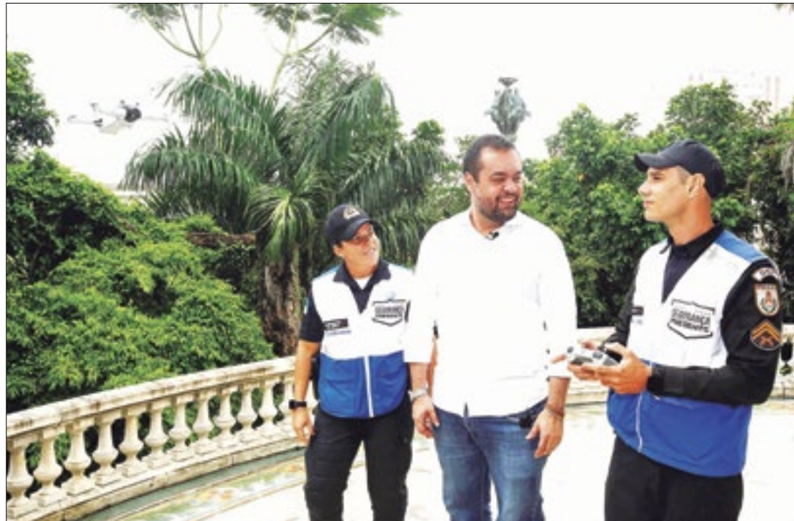
Governador observa demonstração dos drones por um dos agentes capacitados

O Governo do Estado está empenhado em melhorar a segurança pública do Rio. Tanto que adquiriu drones para reforçar as equipes do Segurança Presente em suas operações.