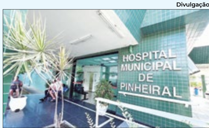
Exames serão feitos com agendamento prévio

com as Honras de Gala, na Avenida do Exército, seguida da inauguração do retrato do Gen. Felipe na galeria dos Comandantes e da solenidade de transmissão do cargo.