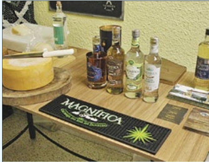
Queijos artesanais e chachaça do Vale do Café