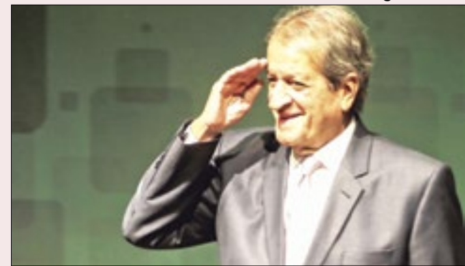
Presidente do PL acena para os dois lados