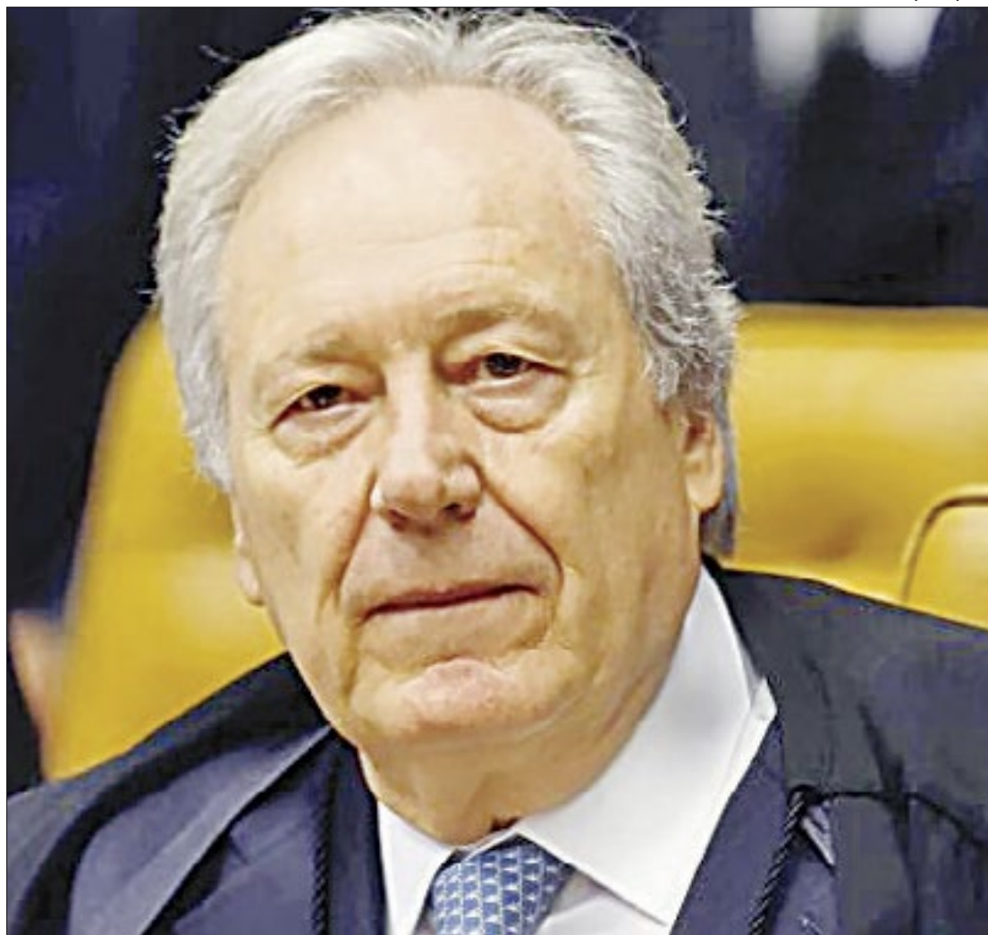
Futuro ministro será empossado no comando da pasta em 1º de fevereiro

No total, há R$ 21,89 bilhões reservados para o ministério este ano. A pasta teve