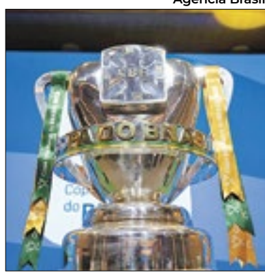
Sorteio será feito na terça (30)

O sorteio dos confrontos da primeira fase da Copa do Brasil, que reúne ao todo 92 times de diversas divisões do futebol nacional, será nesta terça (30), às 15h, na sede da CBF, no RJ. Também serão definidos os mandos de campo da segunda fase. A primeira fase está programada para começar em 21/02. Além dos 80 clubes da fase inicial contemplados no sorteio, outros 12 times previamente classificados entrarão na Copa do Brasil na terceira fase.