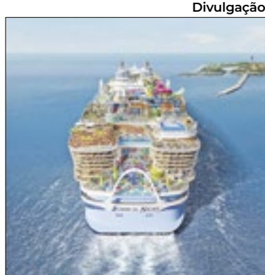
'Icon' é o maior do mundo

O maior cruzeiro do mundo fez sua viagem inaugural no sábado (27). O Icon of the Seas, da Royal Caribbean International, zarpu de Miami, nos EUA, rumo a uma ilha privada pertencente à empresa dona do