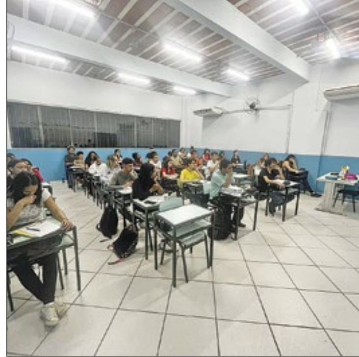
Medida visa reduzir a carência de professores nas salas

Logo antes de expirar o prazo do concurso, em agosto de 2023, a Defensoria ingressou com Ação Civil Pública para assegurar a convocação das pessoas aprovadas e a reestrutur-