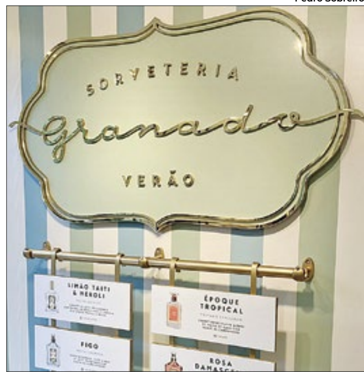
São oito sabores exclusivos, incluindo opções veganas

O 'fenômeno Granado' se popularizou quando a Família Real tomou conhecimento dos produtos, fazendo de Coxito amigo pessoal de Dom Pedro