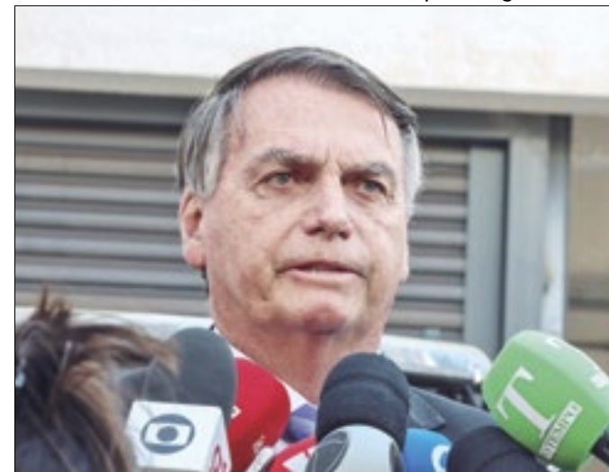
Poder de Bolsonaro é questionado no partido