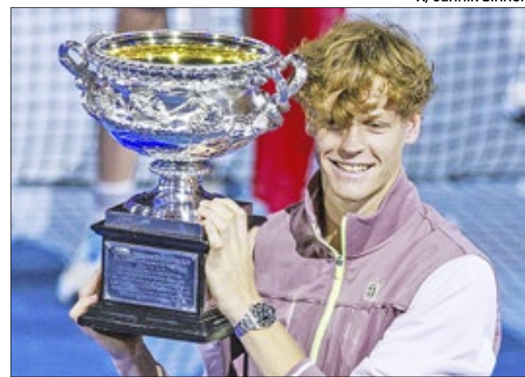
Sinner conquistou o primeiro Grand Slam da carreira

Jannik, porém, mostrou força e ganhou apoio do público, disposto a ver mais tênis. O jovem, cujo melhor resultado era uma semifinal em Wimbledon, passou a pressionar o rival nas devoluções, cresceu no jogo e construiu a virada que lhe rendeu seu maior troféu.