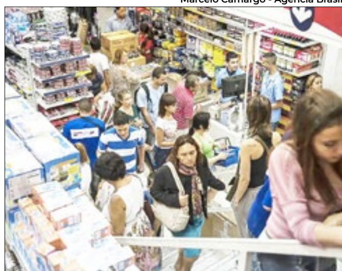
Prévia da inflação apresenta tendência declinante