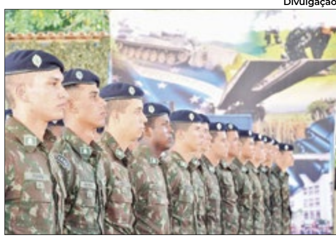
Semana foi marcada por cerimônia de cadetes