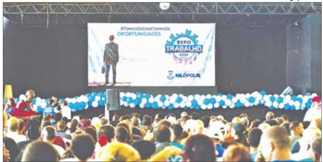
Expo Trabalho foi sucesso de público na última sexta-feira (26) no Clube Nilopolitano