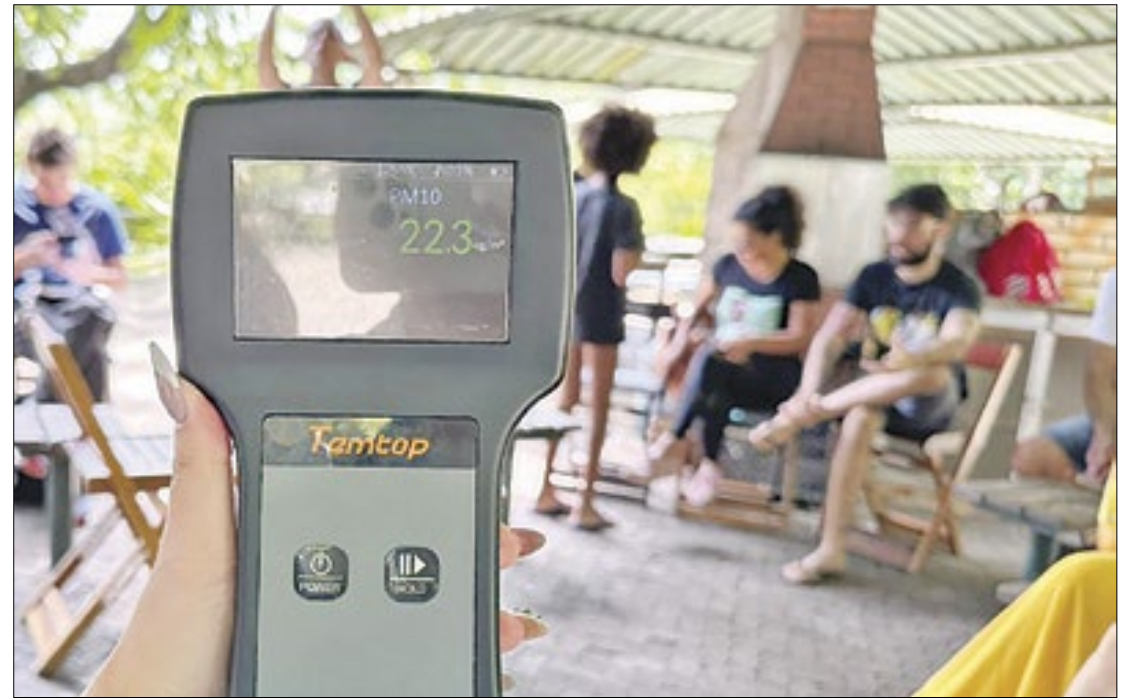
O aparelho foi apresentado por coletivo que também fiscaliza siderúrgica do Rio

Na assembleia, o grupo pode explicar sobre os procedimentos de medição e alguns