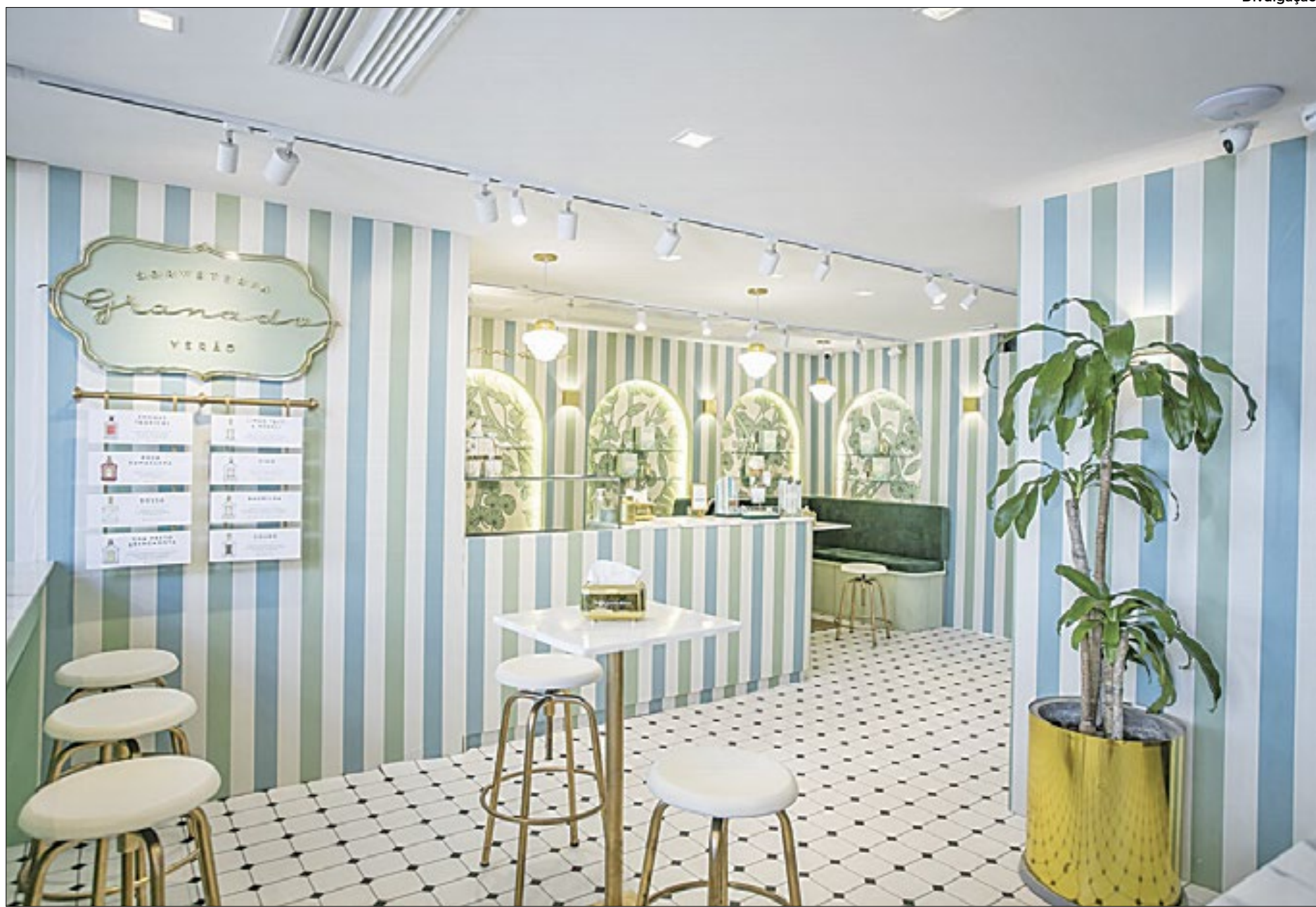
A sorveteria adota uma estética Vintage, proporcionando uma experiência sensorial ao cliente, que embarca nos aromas e sabores do Rio de Janeiro

Além dos sorvetes, há uma linha de produtos desenhados sob influência estética da sorveteria, como aventais de cozinha, livros de receita, jogos-americanos, bolsas e pins.