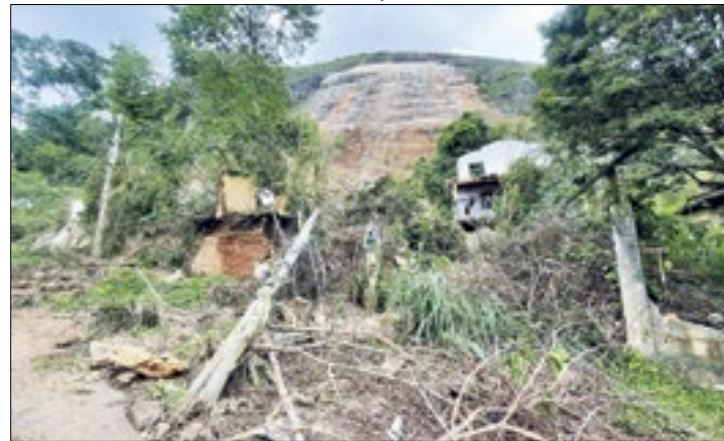
Geólogos estudam impactos dos deslocamentos na região

Por Raphaela Cordeiro, com informações de Wellington Daniel