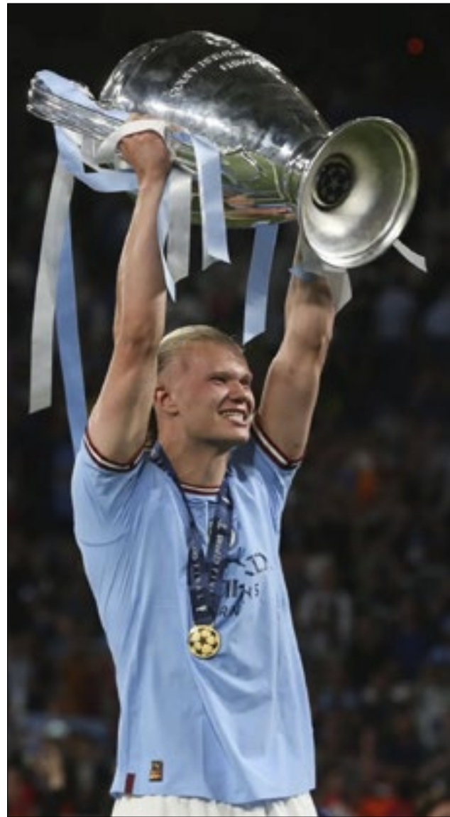
Erling Haaland é jogador mais caro do mundo