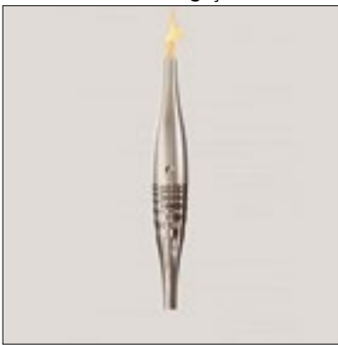
Tocha terá atenção especial