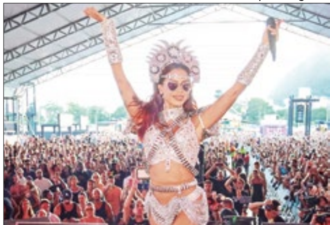
Show aconteceu no último domingo na Zona Sul do Rio