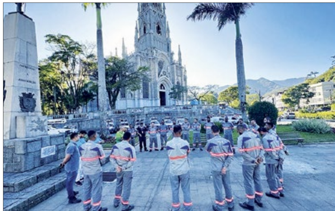
Além da quantidade de equipes, empresa ganhou novo prazo para informar Plano Verão

CNN Brasil, a empresa Enel São Paulo diminuiu em 36% a quantidade de funcionários, desde que assumiu a concessão no estado. Em 2019, eram 23.835 funcionários, entre próprios e terceirizados que vinham da antiga Eletropaulo. Já em 30 de setembro de 2023, eram 15.366 colaboradores, sendo 3.863 empregados próprios da Enel SP e 11.503 terceirizados.