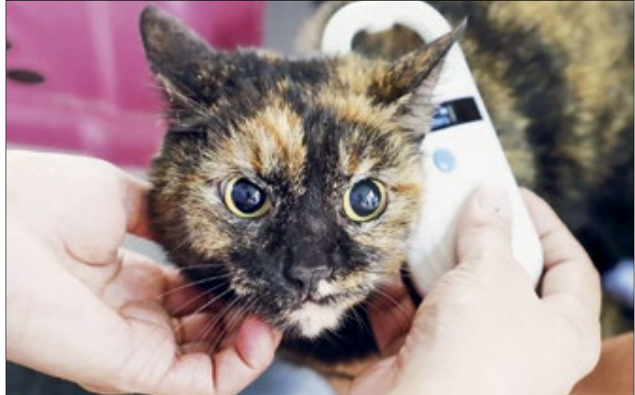
Animais terão chip para identificação em sistemas municipais

A Prefeitura do Rio, por meio da Subprefeitura da Zona Sul e do Instituto de Vigilância Sanitária (Ivisa-Rio) organizou, na segunda (22), uma campanha de vacinação antirrábica e microchipagem de cães e gatos na Praça Nelson Mandela, em Botafogo, e no Largo do Machado. Foram 185 vacinas administradas nas duas localidades, sendo 100 no Largo do Machado e 85 em Botafogo.