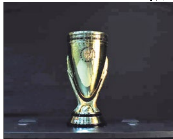
Copinha será decidida com um Corinthians x Cruzeiro

Como manda a tradição, a finalíssima da Copinha acontece nesta quinta-feira (25), celebrando o aniversário da cidade de São Paulo. Como o Pacaembu está fechado para reformas, o palco da final será a Neo Química Arena, estádio do próprio Corinthians, finalista desse ano. Ou seja, a expectativa é de casa cheia. O horário ainda será divulgado pela FPF.