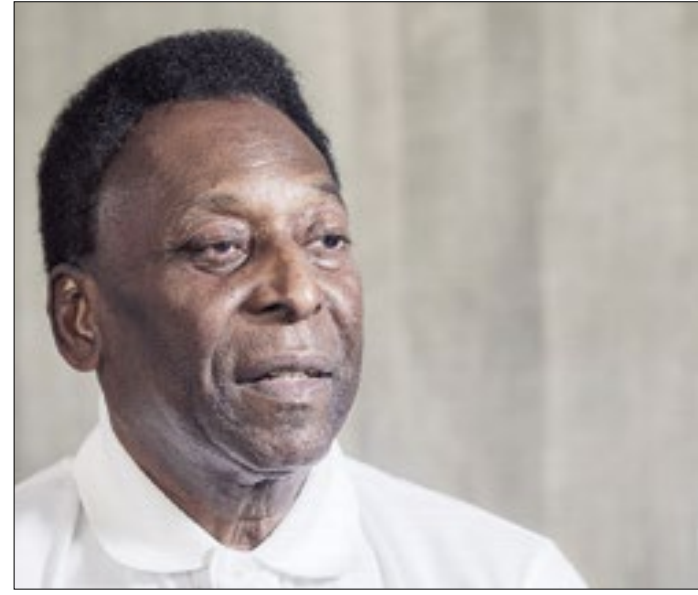
Suposta filha de Pelé precisa de exame de DNA