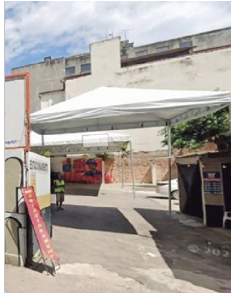
Caso aconteceu em uma casa de samba da Lapa

Informações de Aléxia Sousa (Folhapress)