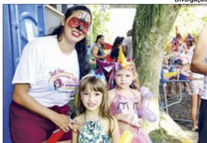
Folia de Pré-Carnaval acontecerá ainda em janeiro