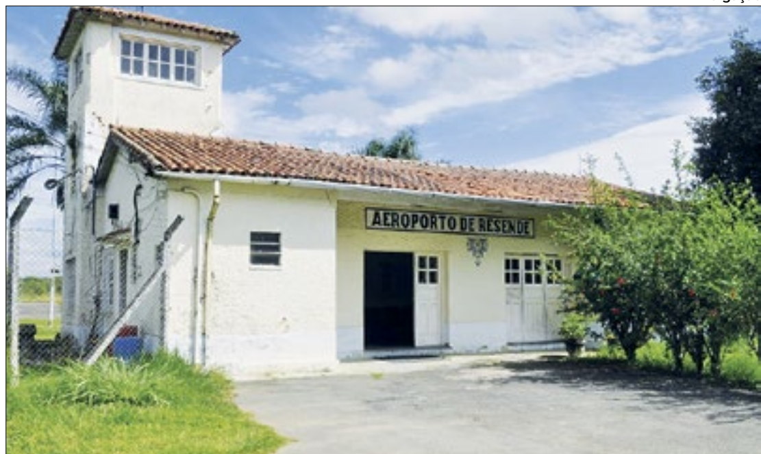
Aeroporto de Resende recebe investimentos da ordem de R$ 9 milhões para reformas

Atualmente, o aeroporto só recebe voos particulares. Após a reforma, passará a receber voos comerciais. Segundo a