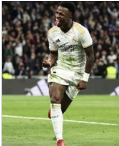
O brasileiro Vini Jr. completa o Top 3