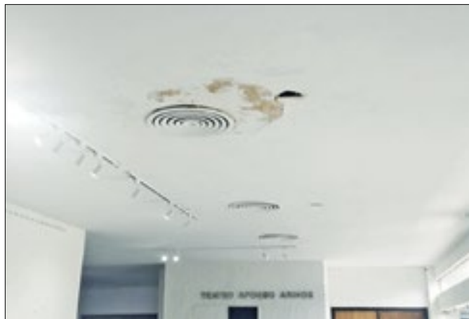
Espaço chega aos 47 anos com diversas avarias