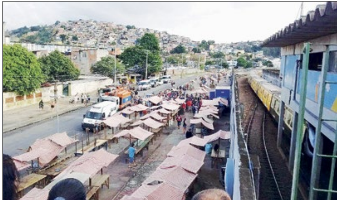
Local existe desde 1970, perto da estação de metrô do bairro

Muitos moradores do bairro criticaram a decisão de Paes,