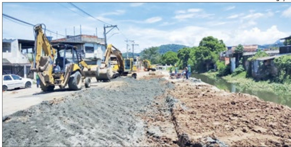
Obras de infraestrutura em Caxias acontecem com recursos do Governo do Estado

Na segunda fase, já iniciada, realizada com recursos esta-