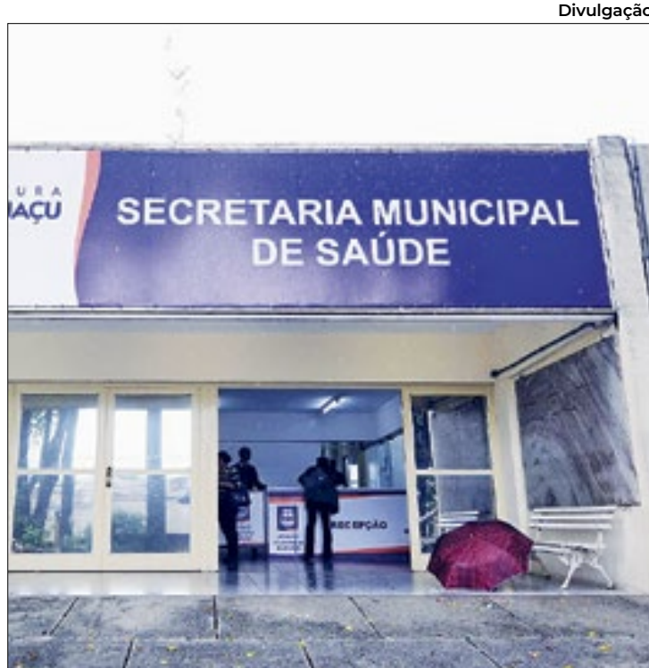
Secretaria de Saúde conta com posto previdenciário

Os pensionistas seguem sendo o grupo com menor taxa