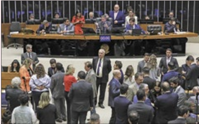
Nas contas de Lira, Lula só tem 25% da Câmara