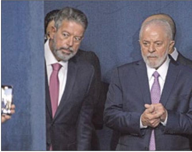
Lira não anda nada feliz com Lula