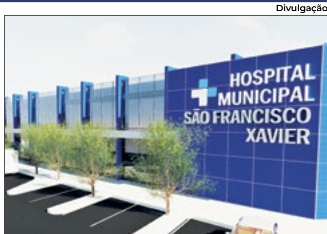
Modelo do novo Hospital Municipal São Francisco Xavier