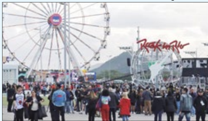
Maior festival de música do mundo comemora 40 anos