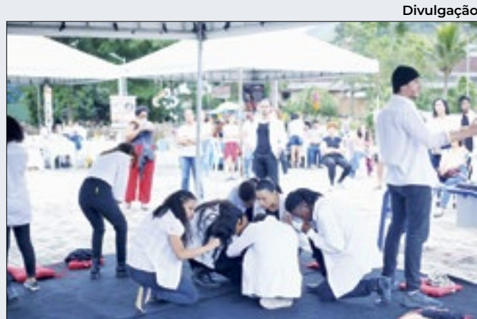
Município de Magé faz oitivas para Lei Aldir Blanc

prejudicados com o transbordamento do Rio Botas. Acima das disputas municipais, que irão acontecer somente em outubro, deve estar os interesses da população de cada município afetado. Foco na solução dos problemas enfrentados pelos cidadãos.