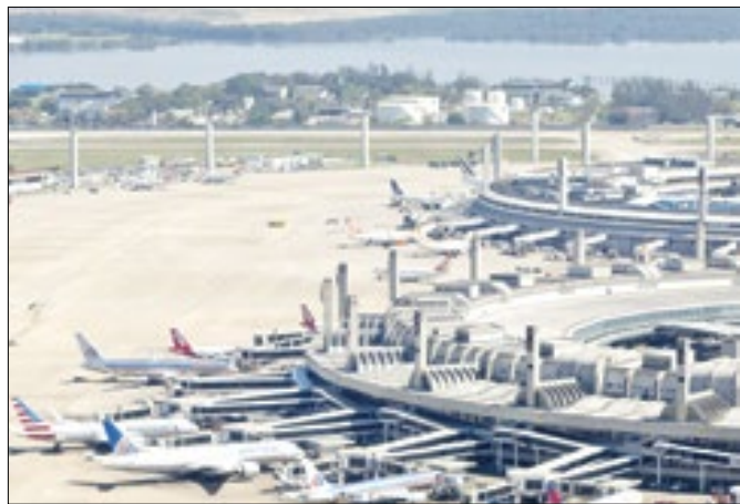
Aeroporto quer chegar a 14 milhões de passageiros