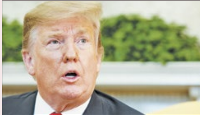
Desempenho de Trump pode influenciar no Brasil