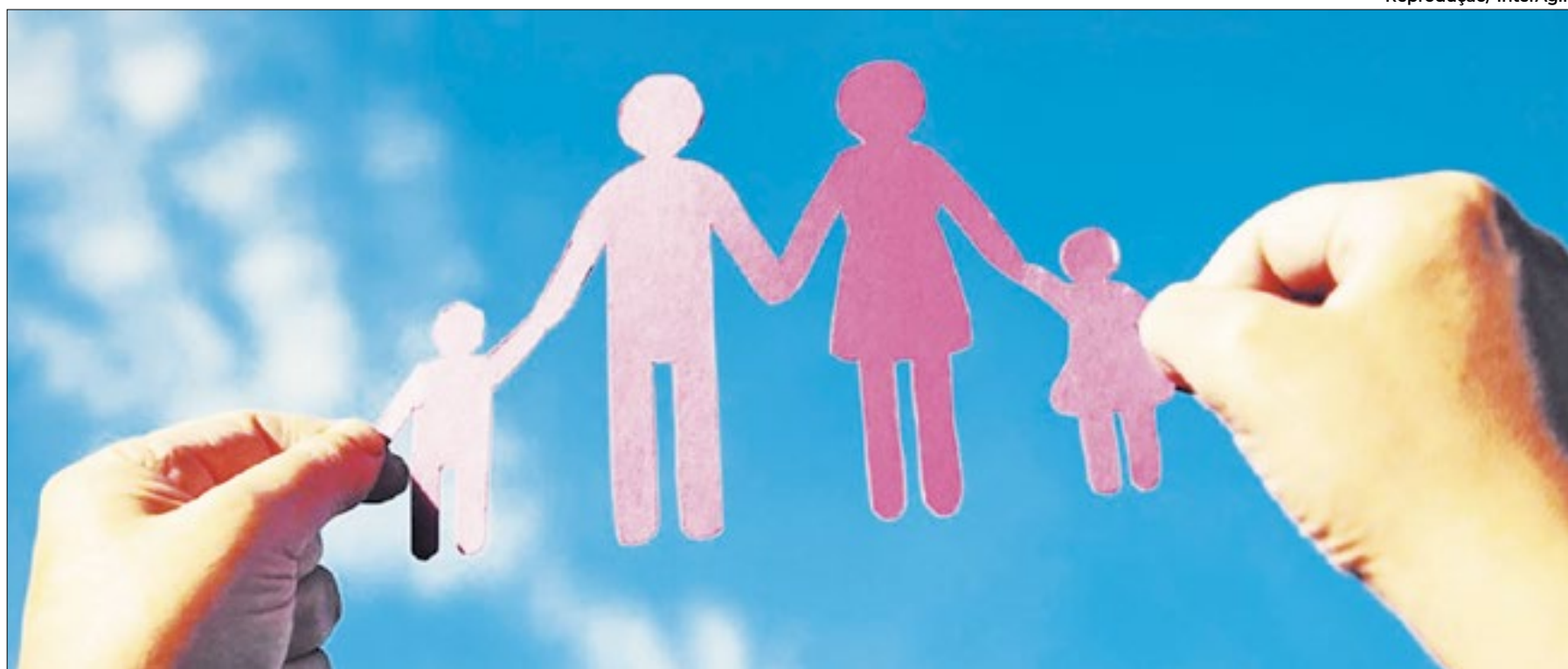
A ‘Educação Parental’ visa reeducar pais e responsáveis na hora de criar a molecada por meio da empatia e do respeito