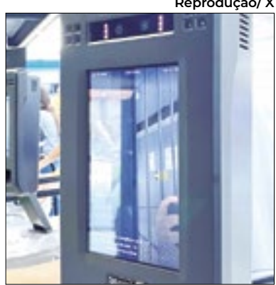
Biometria Facial no Carioca

O Campeonato Carioca de 2024 já veio cheio de mudanças tecnológicas. Agora, os jogos em que Vasco, Botafogo, Flamengo e Fluminense forem mandantes terão a 'biometria facial' para registro dos torcedores. O Vasco já adota a tecnologia em São Januário desde 2023. O Maracanã começou a instalar e deve ficar pronta até o próximo dia 7, no clássico entre Flamengo e Botafogo. O Estádio Nilton Santos também começou a instalar a tecnologia.