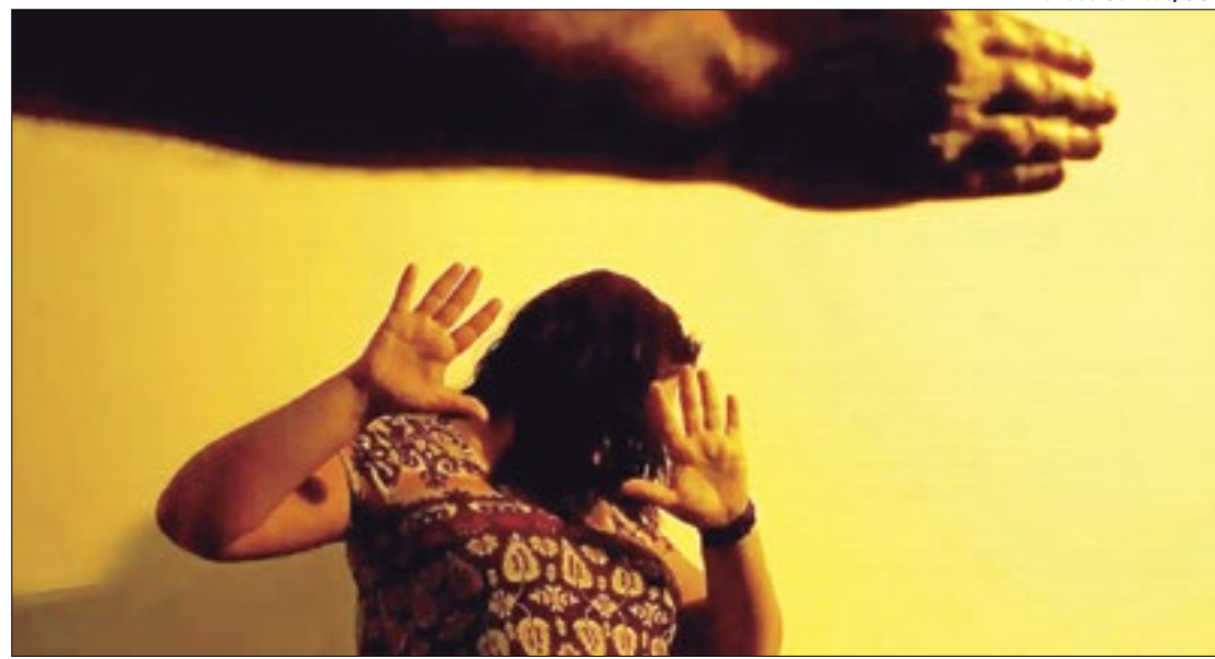
Só em Petrópolis, foram 133 casos a mais de ameaças; estelionatos também preocupam