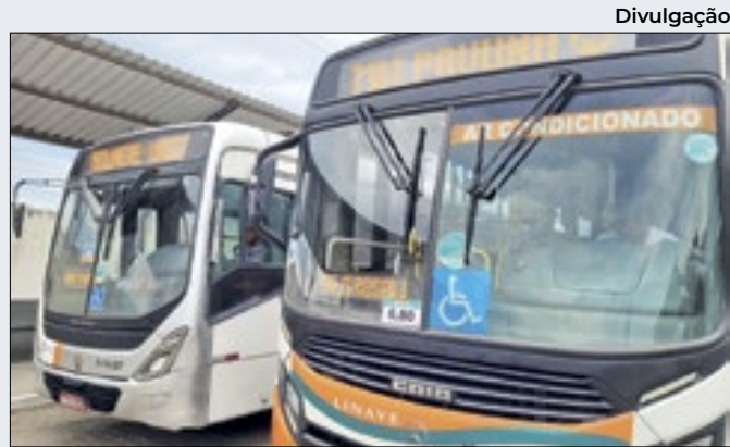
Linha para a Pavuna começou a circular em Queimados

Profissionais que atuam no Hospital Geral de Nova Iguaçu participaram na última quinta-feira (18), de uma roda de conversa sobre o Janeiro Roxo, mês dedicado à conscientização sobre a Hanseníase. Essa é mais uma ação promovida pela unidade de saúde para orientar e capacitar os funcionários sobre o tema.