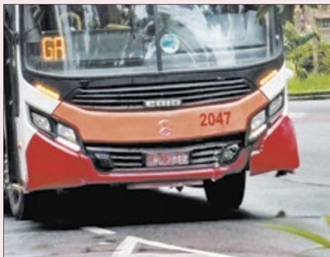
No domingo, ônibus colidiu em um poste no Centro