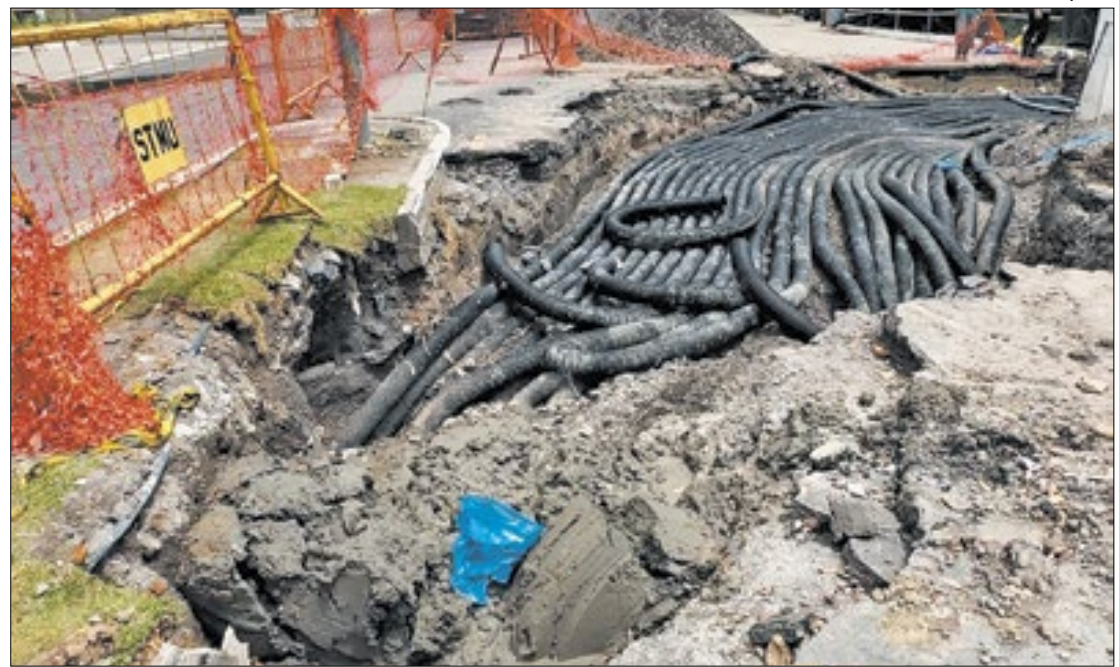
Mangueiras de PVC foram instaladas para passar os cabamentos elétricos da Rua 33

Outro acesso bloqueado foi entre as transversais da Rua 50 e 52, próximo a base do Samu. Segundo informações da prefei-