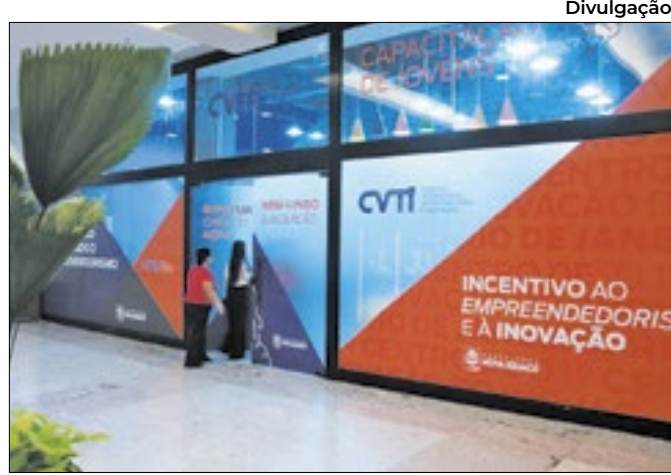
Nova Iguaçu oferece vagas em sete cursos gratuitos