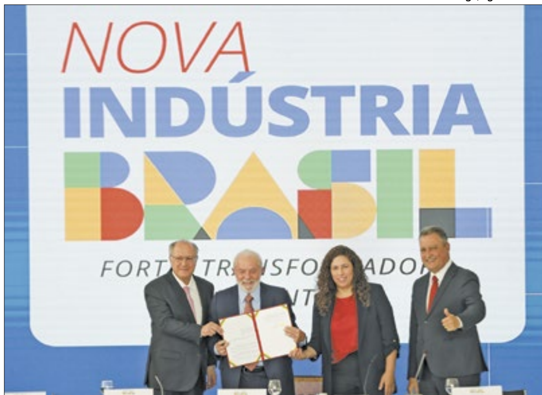
Plano visa impulsionar indústria brasileira e torná-la mais competitiva