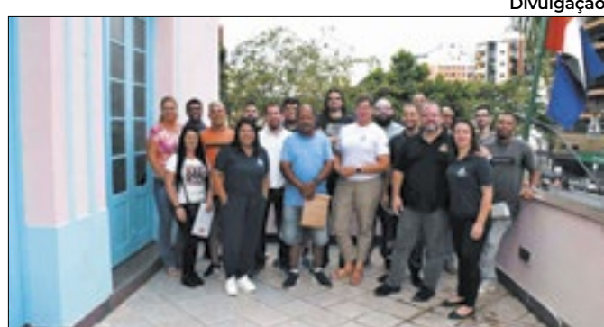
Também foram escolhidos vendedores reserva