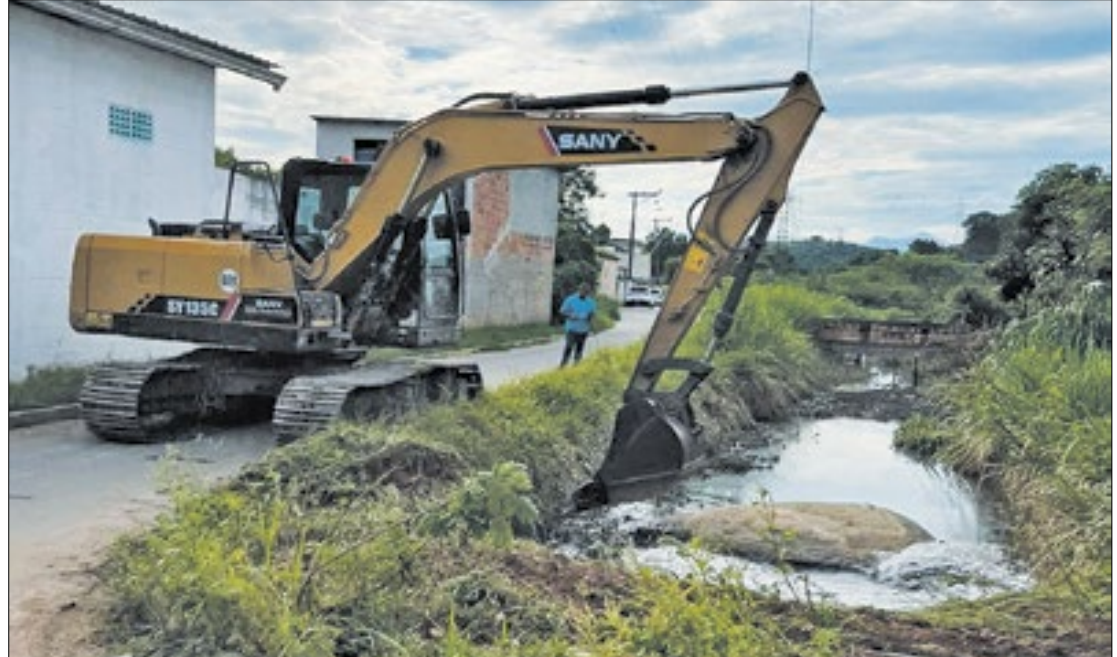
Equipes da prefeitura de Duque de Caxias estão mobilizadas por toda a cidade

A Prefeitura também pede à população de regiões consideradas de risco que, ao notar qualquer anormalidade, procurem um local seguro ou pontos de apoio e liguem imediatamente para os telefones 199 e 08000230199, ou para o Corpo de Bombeiros, no número 193. Pede, também, que fique alerta ao acionamento das sirenes para mobilização de moradores ex-