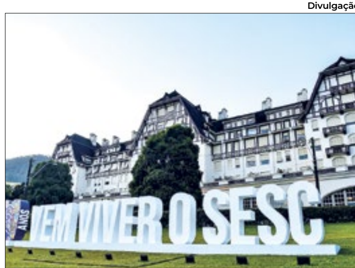
Evento chega em sua sexta edição com atrações gratuitas

A programação do festival começou logo no início de janeiro e segue até 4 de fevereiro, é gratuita e acessível a todos os públicos. Nela, estão inclusas experiências de lazer, culturais e modalidades esportivas. O Presidente do Sistema Fecomércio RJ, Antônio Florêncio de Queiroz Junior, fala que o Sesc Verão RJ é um dos eventos mais inclusivos do país. "O projeto