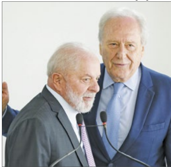
Expectativa de um perfil mais discreto com Lewandowski

Lewandowski já anunciou que manterá o diretor da Polícia Federal, Andrei Rodrigues, no cargo. Além disso, em declarações à imprensa, o futuro ministro afirmou que focará esforços na