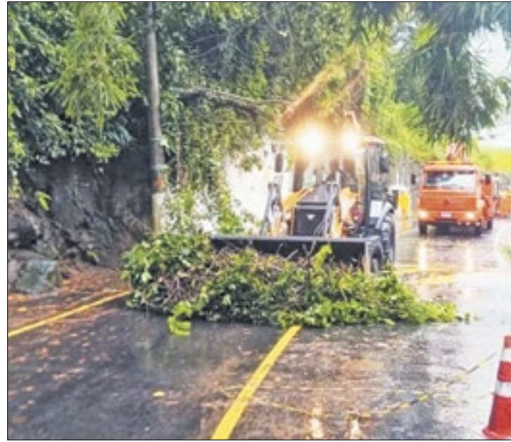
A desobstrução da estrada foi feita ainda nesta segunda (22)

Numa área conhecida como Belvedere, próxima ao bairro Ribeira, na BR-101, houve queda de árvores na estrada, com deslizamento de encosta. A CCR foi acionada, e houve obstrução parcial no trecho. Na Estrada do Contorno, na altura do bairro Bonfim, a queda de uma árvore de grande porte, com risco de outras quedas, fez com que as equipes da Defesa Civil se dirigissem ao local para resolver o problema, nesta manhã, já que o serviço apresentava dificuldades de ser efetuado