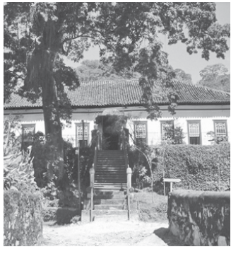
Fazenda Cachoeira do Mato