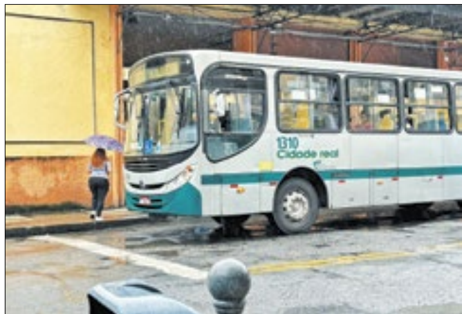
Passageiros reclamam de horários da empresa