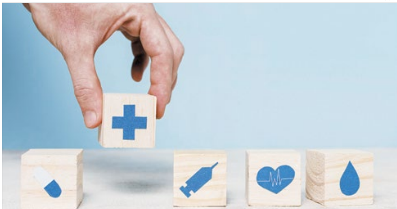
Planos de saúde vêm causando dor de cabeça nos assinantes

Nos dois últimos anos, os planos coletivos por adesão tiveram aumentos acima de 20%. Neste ano, o percentual deve variar entre 20% e 25%, segundo estimativa da consultoria Arquitetos da Saúde. A inflação medida pelo IPCA (Índice Nacional de Preços ao Consumidor Amplo)