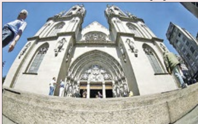
Requerimento de abertura ainda precisa ser aprovado