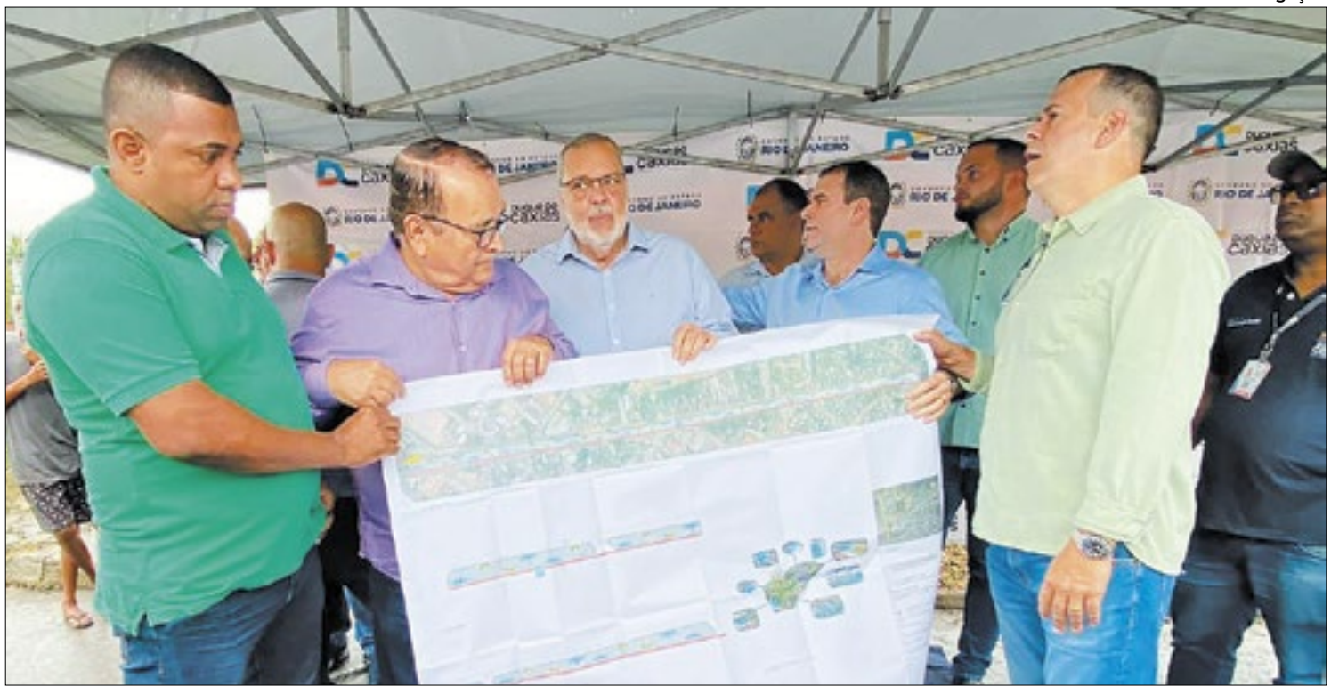
Autoridades do município e do estado no lançamento de obras no Canal Rui Barbosa, localizado em Jardim Gramacho

É comum o forte impacto das chuvas de verão. É evidente que a força da natureza prevalece em determinadas situações. Mas as cidades precisam estar preparadas para esses episódios, especialmente se tratando de pontos de alagamentos. Algo precisa ser feito!