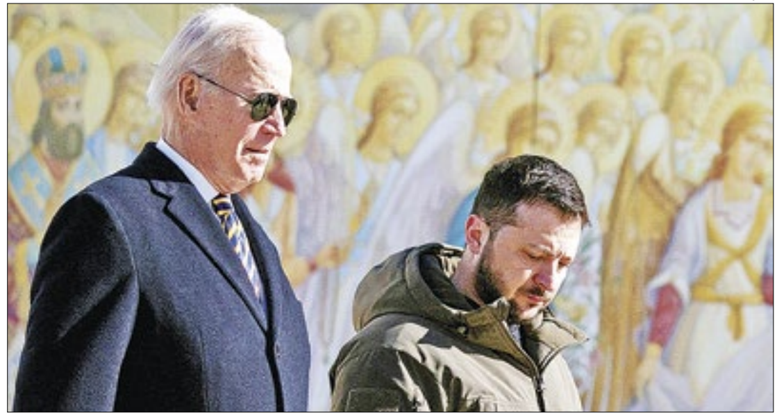
Novo pacote de apoio teria que ser aprovado pelo Congresso dos Estados Unidos

Ainda há US$ 4,4 bilhões (R$ 21,6 bilhões hoje) à disposição de Biden para livre manejo, mas Kirby sinalizou que não há chance de isso acontecer sem apoio parlamentar ao pacote de segurança de R$ 520 bilhões, R$ 300 bilhões deles para a Ucrânia, apresentado pelo governo e rejeitado no Congresso.