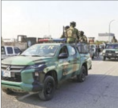
EUA matam líder de grupo

Após Israel matar um líder do Hamas no Líbano e o Irã sofrer um atentado que deixou ao menos 84 mortos, mais uma ação violenta elevou a tensão na região. Nesta quinta, os EUA