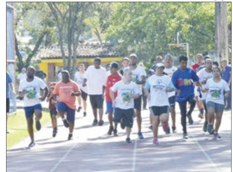
Nova Iguaçu prorroga inscrições para o Bolsa Atleta

Os candidatos devem apresentar documentos de identificação no ato da inscrição, assim como a declaração em papel timbrado da Entidade Nacional de Administração do Esporte (Confederado) – específica para atletas/paratletas de modalidades olímpicas e paraolímpicas.