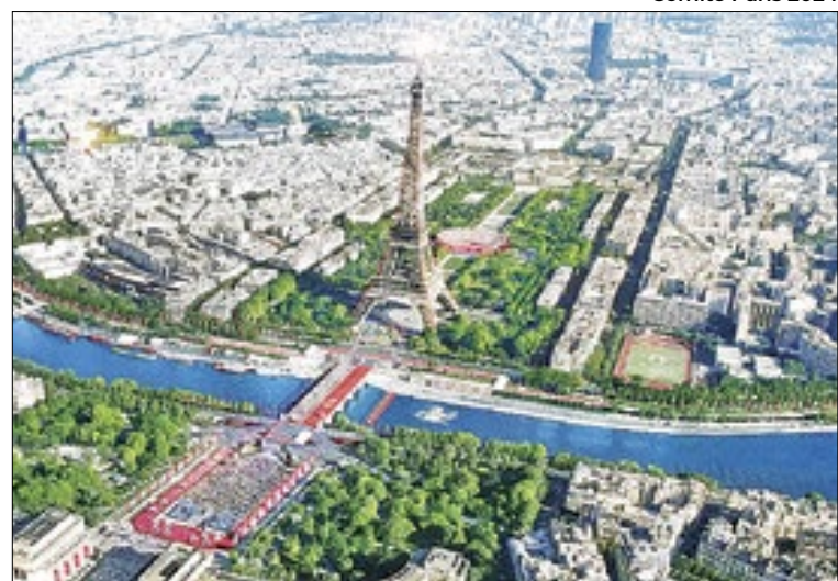
Rio Sena pode ser palco da cerimônia de abertura dos Jogos

O ano reserva o principal torneio olímpico: os Jogos Paris 2024. Mesmo a alguns meses da abertura, muitas modalidades ainda têm vagas em disputa e o Brasil pleiteia algumas. Veja o calendário dos pré-olímpicos e os atletas que vão representar o país na capital francesa.