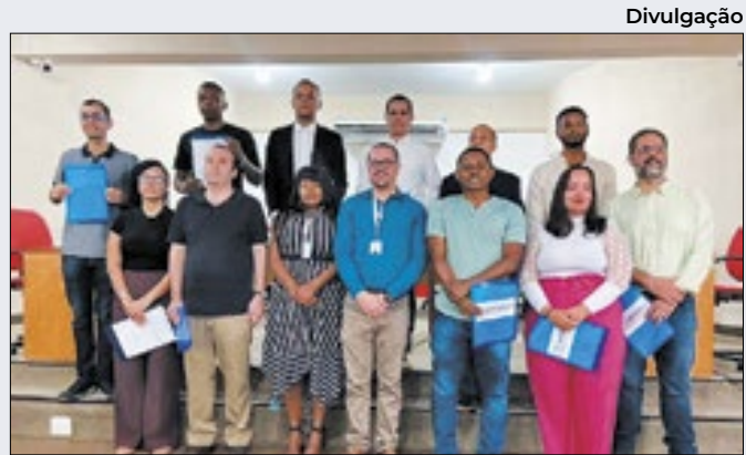
Seropédica: novos servidores efetivos tomaram posse

A forte chuva também causou impactos e transtornos em diversas cidades da Baixada. Além de Japeri, os municípios de Nova Iguaçu, Mesquita e Nilópolis, ficaram debaixo d'água. Em Nilópolis, o recém-inaugurado calçadão da Mirandela, virou um 'piscinão'.