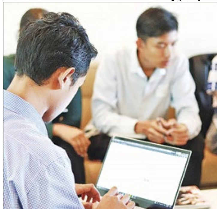
Microempresários terão ajuda para participar de pregões

As micro e pequenas empresas são responsáveis por 79%