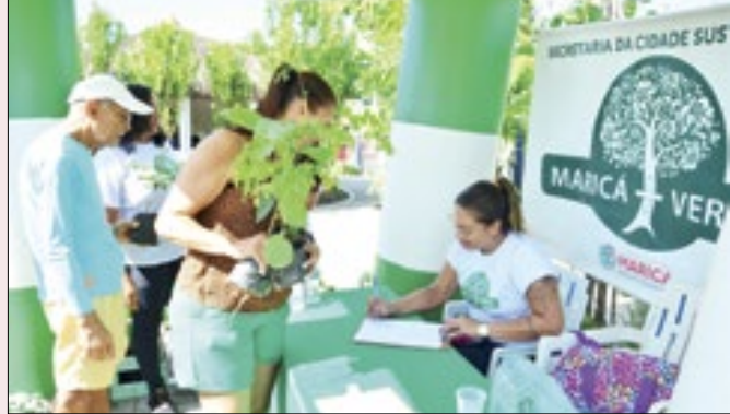
Está programado ainda, mutirão de limpeza das praias