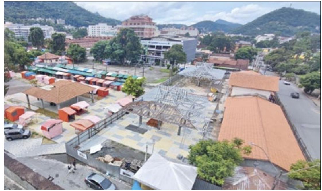
Obra na praça de alimentação está em andamento