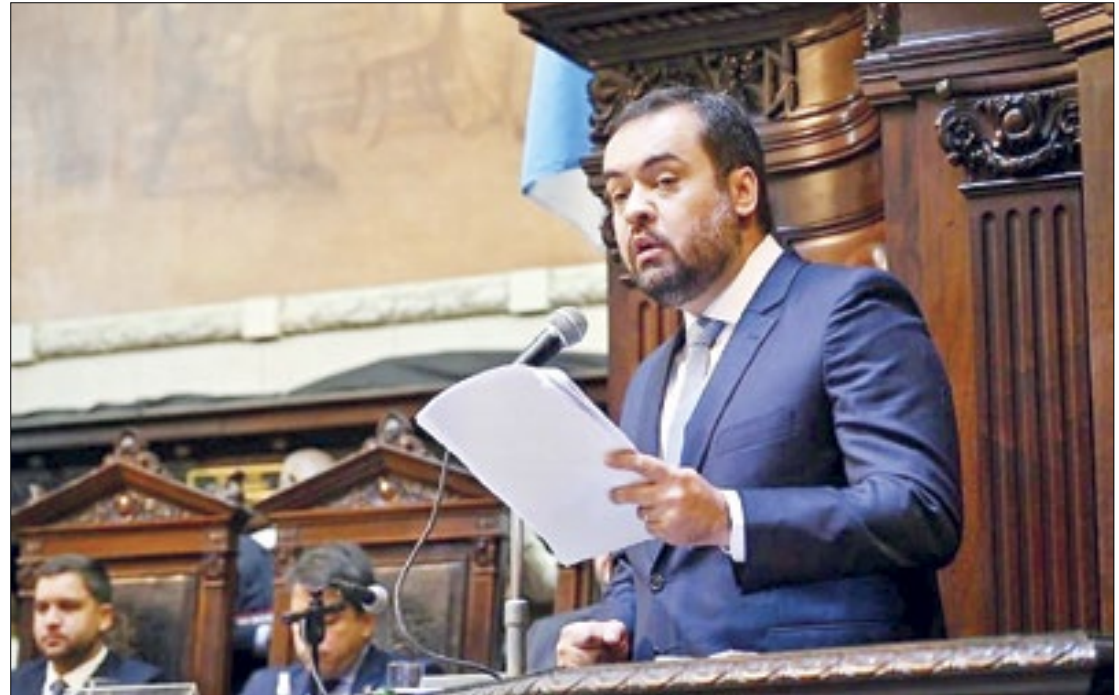
A nova data da primeira prova objetiva escrita do concurso da PM será dia 7 de abril

"A aplicação da primeira prova objetiva representa uma grande vitória para a área de segurança do estado, que contará com a recomposição do