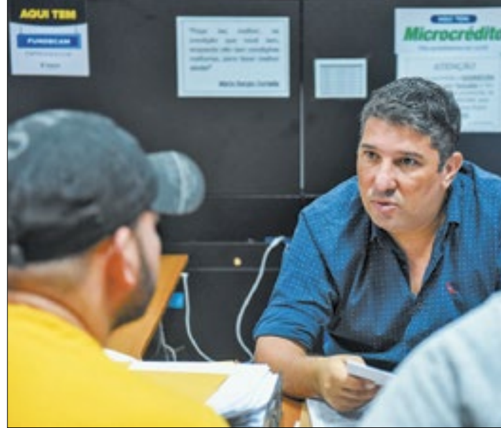
Até novembro de 2023, foram 4.446 novos postos

De janeiro a novembro de 2023, o município apresentou saldo positivo de empregos superior a todo o ano de 2022, segundo dados do Cadastro Geral de Empregados e Desempregados (Caged) do Ministério do Trabalho e Emprego (MTE). Foram gerados um total de 4.446 novos postos de trabalho, enquanto em 2022 foram 4.077. Os setores que mais se destacaram em 2023 foram Serviços (3.135),