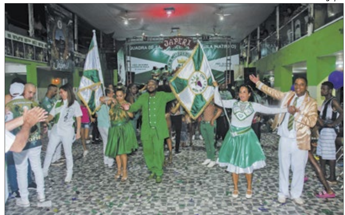
Esquentando os tambores: Império da Uva vai homenagear Japeri no Carnaval 2024

O G.R.E.S Império da Uva irá homenagear Japeri no Carnaval de 2024 com o enredo "Dos trilhos do passado a Um Novo Tempo: Japeri!", que ver-