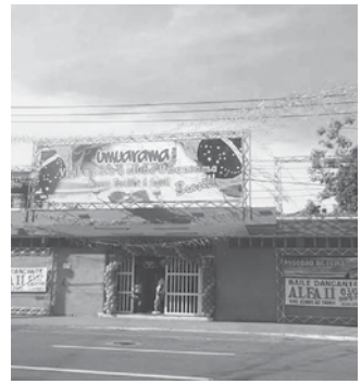
Clube de Campo Umuarama