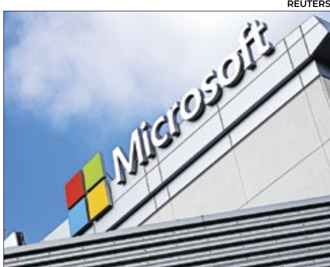
Microsoft traz novo teclado após 30 anos