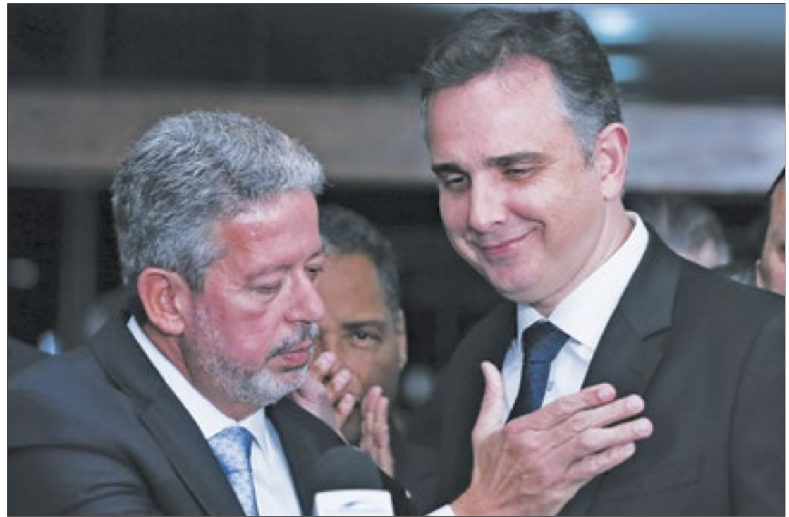
Parlamentares especulam substitutos de Lira e Pacheco

Essas situações pesarão na escolha dos sucessores de Lira e Pacheco. Uma discussão que já vinha intensa mesmo em 2023. No Judiciário, também a perspectiva de mudanças, com a entrada de Flávio Dino no Supremo Tribunal Federal (STF), alguém de perfil bem diverso ao de sua antecessora, a ministra Rosa Weber, bem mais discreta e menos política.