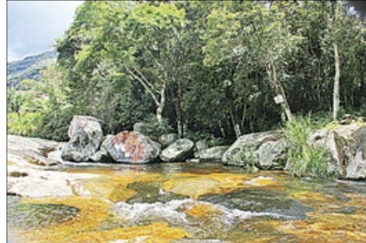
Cachoeiras são uma opção de lazer, mas requerem cuidados

Para muitas pessoas, poder desfrutar de momentos de lazer ao ar livre é um luxo nos dias atuais. As cachoeiras são uma das melhores formas de relaxar e descansar da rotina. Entretanto, por mais que a natureza seja considerada sinônimo de tranquilidade, conhecer os atrativos sem se preocupar com a segurança pode ser perigoso. No verão, as tempestades são mais comuns, o que pode ser um risco para quem está nas