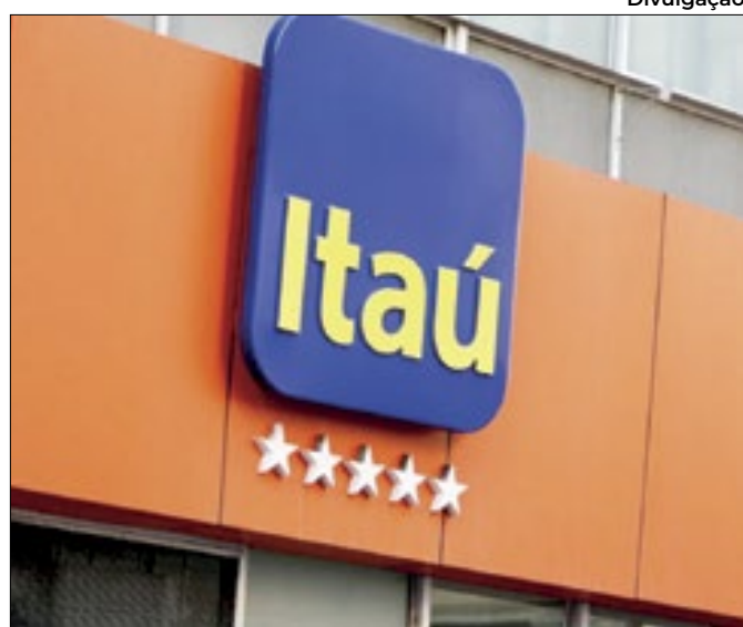
Instituição foi a vencedora da licitação