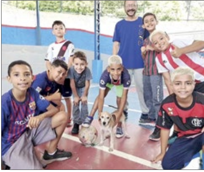
Acolhido, Serelepe já faz a festa das crianças