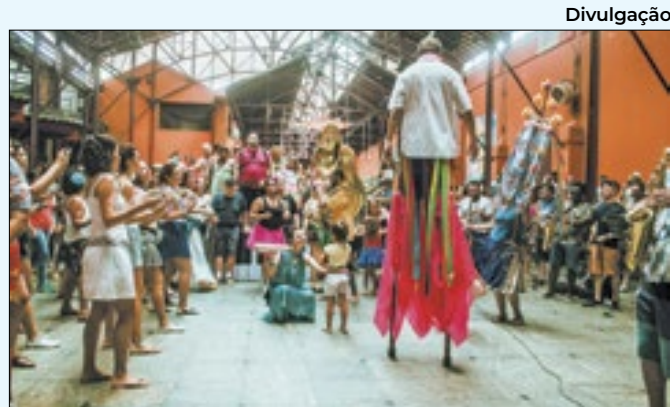
Bloco Céu da Terra fará ensaios na casa de shows

impactos e os tempos semaforizados serão ajustados para melhorar a fluidez nas rotas alternativas e nos principais corredores de tráfego da região. Agentes de trânsito da Guarda Municipal e da CET-Rio também orientarão os motoristas nos dias de eventos.