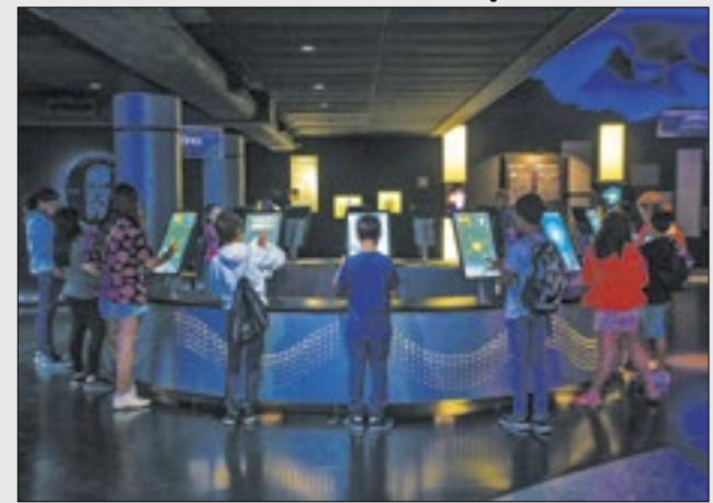
Planetário conta com atividades para toda família