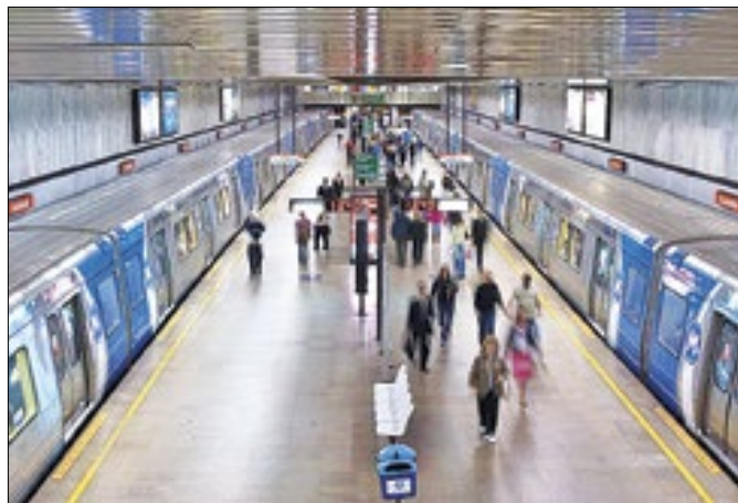
Estações do Sambódromo ficarão abertas até meia-noite