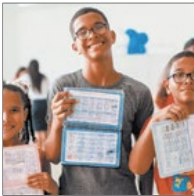
Vacina estará na caderneta

Segundo determinação do Ministério da Saúde, que incluiu a vacinação contra Covid no calendário nacional de imunização infantil, a Prefeitura de Três Rios, através da Secretaria Municipal de Saúde, também efetivou a mesma no calendário do