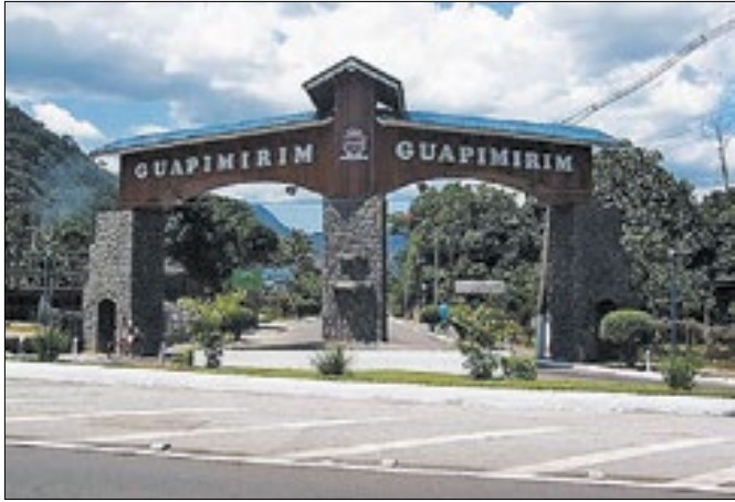
Guapimirim: rede municipal abre inscrições na segunda (8)