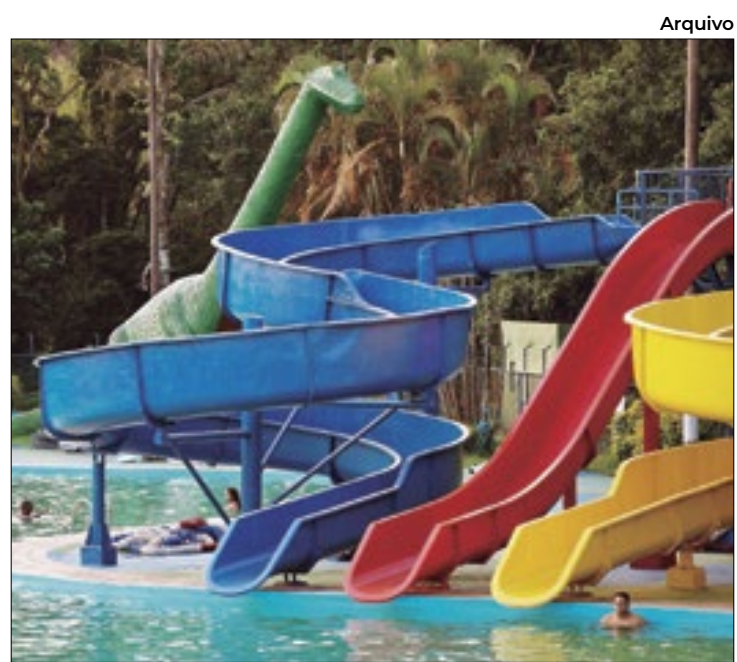
Licitação era para limpeza no Parque Aquático