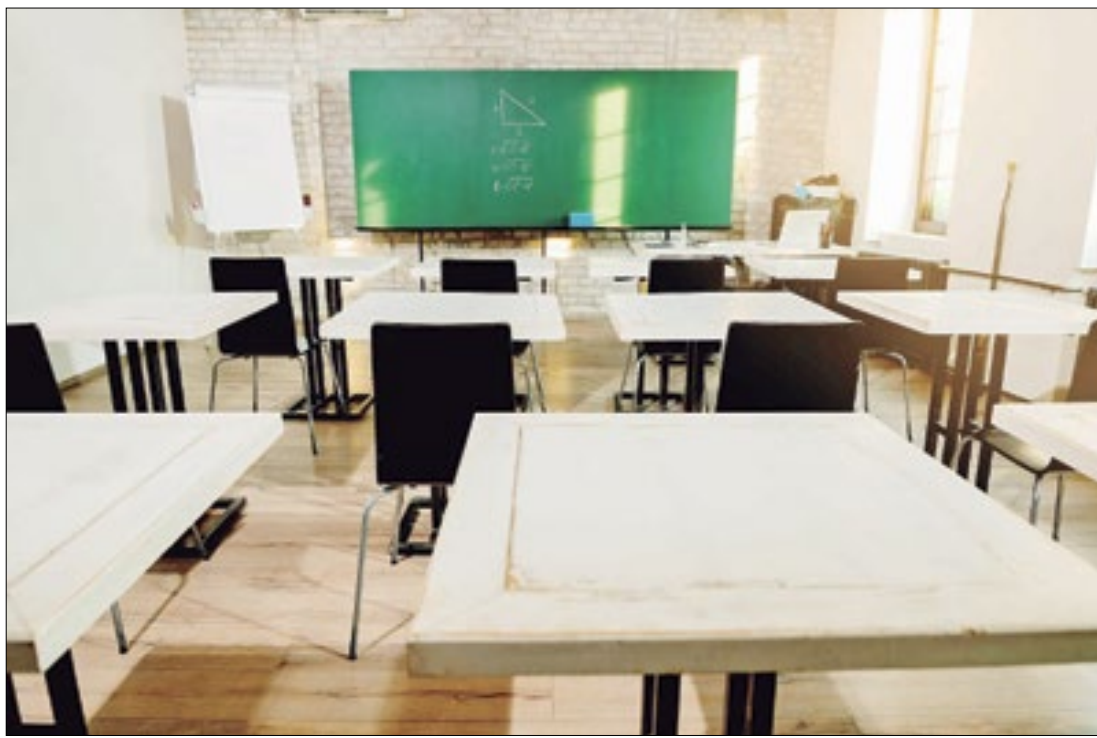
O Pisa avaliou 690 mil estudantes de 15 anos, em 81 países e regiões do mundo

Tarcísio Motta (PsoL-RJ) frisa que Arthur Lira entregou a relatoria a Mendonça Filho (União-PE) que, como ministro da Educação, criou as normas que o governo quer modificar. Segundo ele, o ex-ministro não aceita mudar nada, o que facilita a rejeição do projeto.