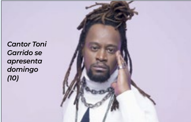
Cantor Toni Garrido se apresenta domingo (10)