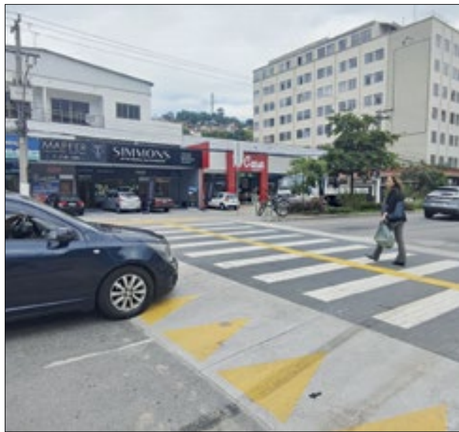
Pedestre atravessa faixa elevada na reta