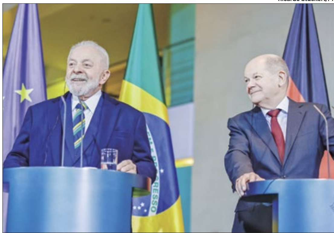
Lula foi em busca do apoio de Scholz para o acordo

deixará de ser presidente com a posse do novo governante eleito, Javier Milei. Na campanha, Milei posicionou-se contrário à própria existência do