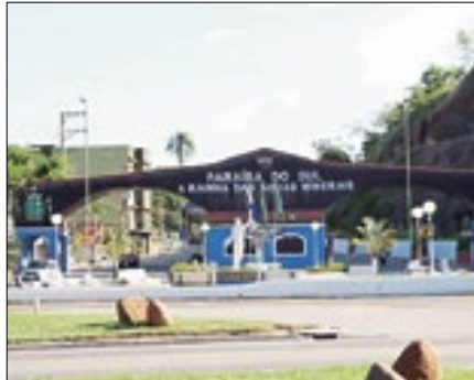
5º lugar no ranking estadual

Paraíba do Sul, mais uma vez, é destaque no cenário econômico regional. De acordo com os dados mais recentes do Novo CAGED do Ministério do Trabalho e Previdência, elabo-