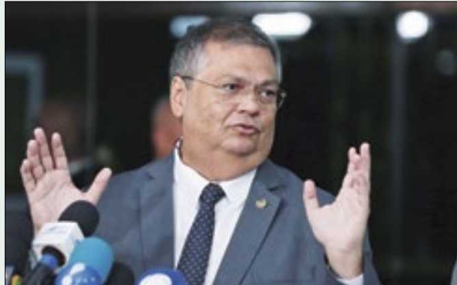
Sabatina do ministro será no próximo dia 13