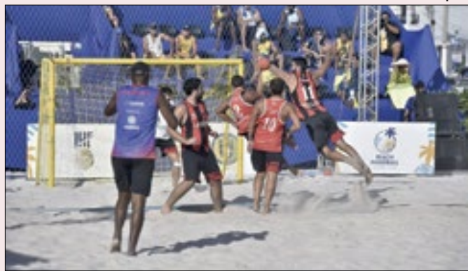
Expectativa é de que 30 equipes participem do evento