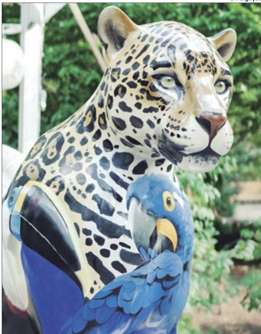
Serão 50 estátuas de onças espalhadas pela Cidade Maravilhosa

taram com a participação de 176 artistas que customizaram 185 obras, expostas durante cerca de 209 dias para um público estimado em 31 milhões de pessoas.