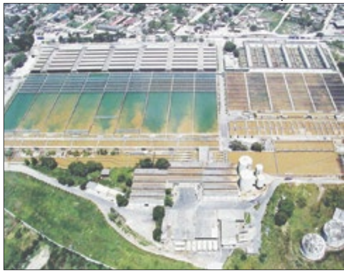
Sistema Guandu passa por manutenção preventiva