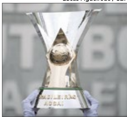
CBF triplicou taças e medalhas

Com Palmeiras, Atlético-MG e Flamengo podendo ganhar o Brasileiro, a CBF produziu três taças e triplicou as medalhas para enviar para o Mineirão, para a Arena Itaipava Fonte Nova e para o Morumbi, onde acontecem os jogos das três equipes, nesta quarta. Porém, a menos que o Palmeiras perca e o Atlético goleie o Bahia por 10x0, é muito difícil que a taça não seja entregue para o Palmeiras no Mineirão.