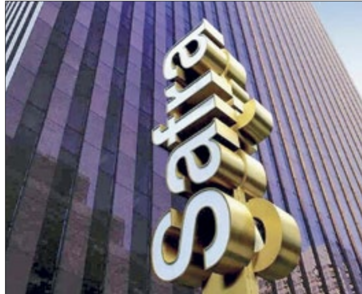
Banco Safras continua na luta contra Americanas

Para que seu plano judicial seja aprovado em assembleia, ela precisa do apoio de credores que representem 50,01% da sua dívida. Na petição apresentada nesta segunda à 4ª Vara Empresarial da Comarca da Capital