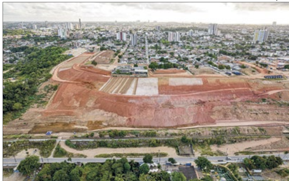
Para o CEO da companhia interesses políticos estão atrapalhando as informações reais

entanto, quais seriam as situações políticas envolvidas no caso. No fim de semana, a Folha mostrou que o risco de desabamento de uma das minas da Braskem, com a possibilidade de abrir uma cratera em Maceió, vem provocando um embate entre o governo de Luiz Inácio Lula da Silva (PT) e o grupo político do presidente da Câmara dos Deputados, Arthur Lira (PP-AL).