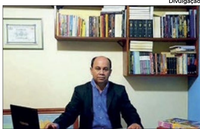
Dione tem contas do Instagram e Facebook invadidas