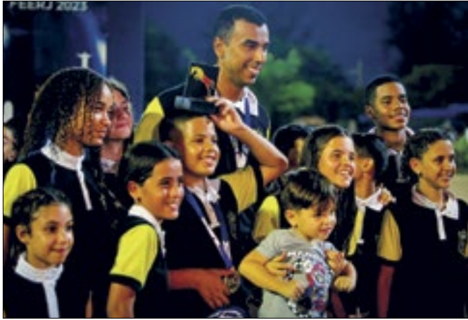
Alunos conquistaram títulos