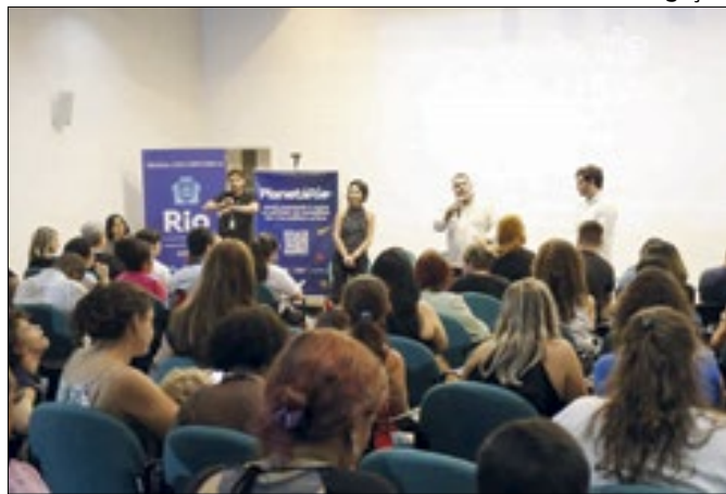
Evento aconteceu no Planetário, na Gávea