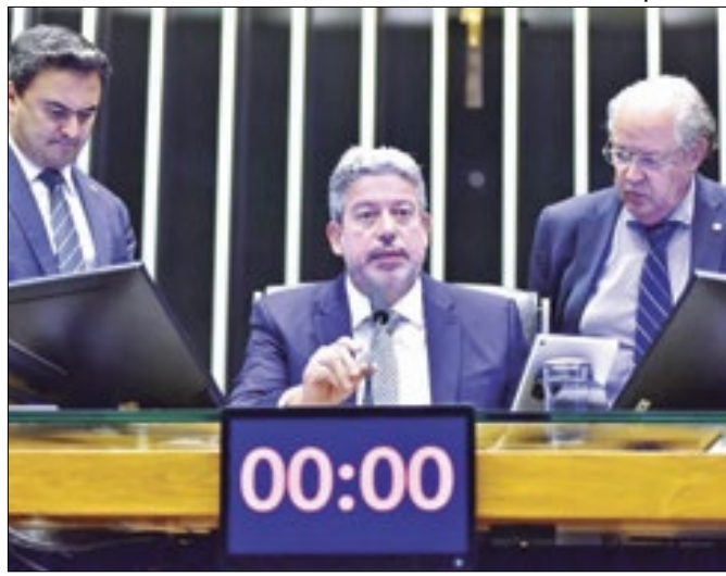
Presidente da Casa põe o Planalto no alvo