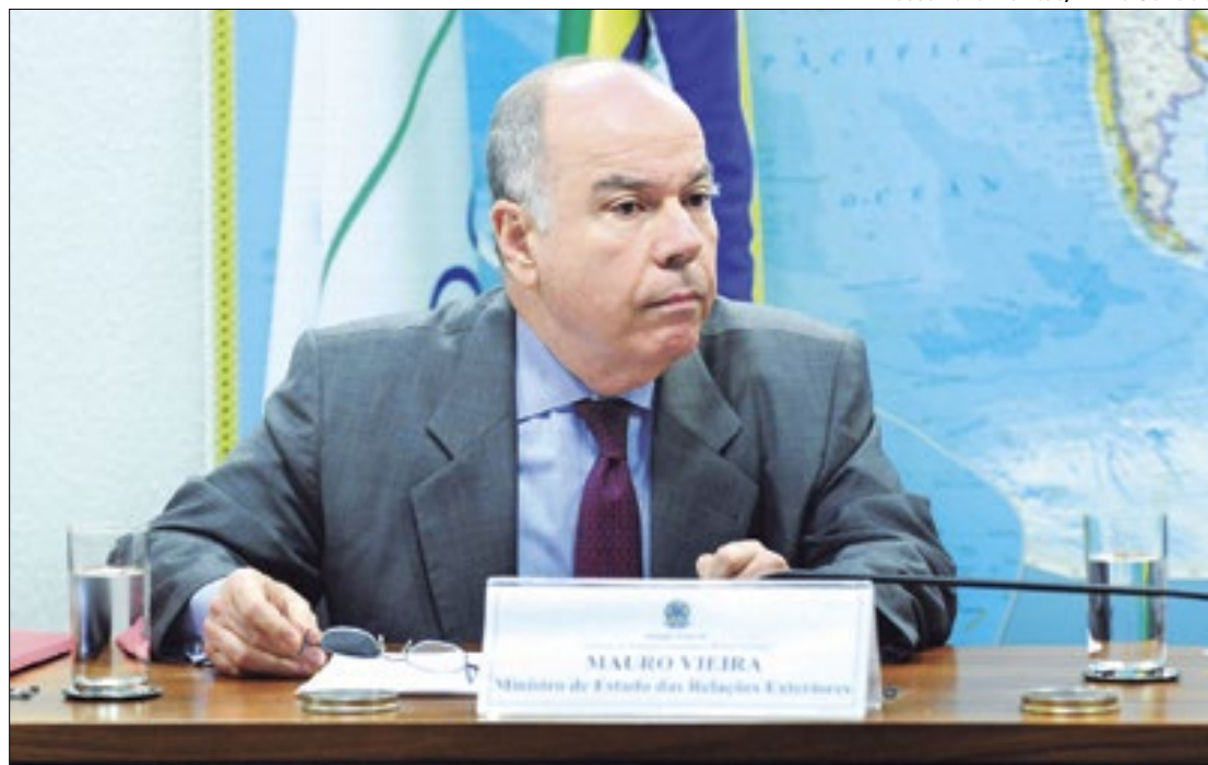
Mauro Vieira representará o Brasil na posse de Milei

Lula e Milei trocaram farpas durante toda a campanha eleitoral do argentino, por posicionamentos políticos e econômicos antagônicos. O ultradireitista acusou o petista de “corrupto”, “comunista” e disse que não se encontraria com o brasileiro, caso fosse eleito. Porém, após ser eleito, o candidato do partido La Libertad Avanza (LLA) adotou um discurso mais brando e diplo-