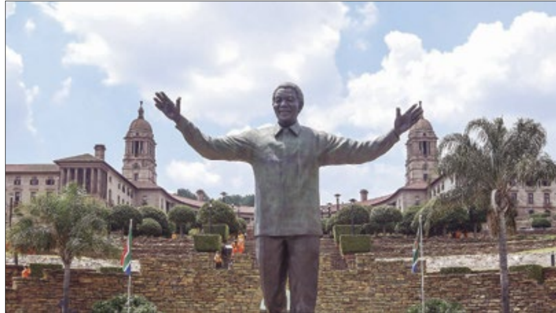
País vive distante da harmonia racial sonhada pelo ex-presidente

Impopular, ele poderia estar dando um recado a si próprio. Pela primeira vez desde o fim do apartheid, em 1994, o Congresso Nacional Africano (CNA), partido de Mandela e do atual presidente, corre sério risco de ser derrotado, em eleições no ano que vem. Se Mandela andasse pelas