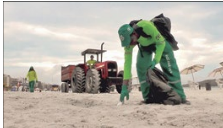
Reforço de efetivo e lixeiras estão entre as iniciativas

O verão está batendo à porta e a Comsercaf já definiu algumas ações estratégicas para garantir a limpeza da cidade, principalmente das praias que são alvos da maioria dos turistas que chegam a Cabo Frio. Para a alta temporada a autarquia prevê reforço de efetivo, maquinários e lixeiras, além de distribuição de sacolas biodegradáveis para banhistas para manter a cidade limpa e organizada.