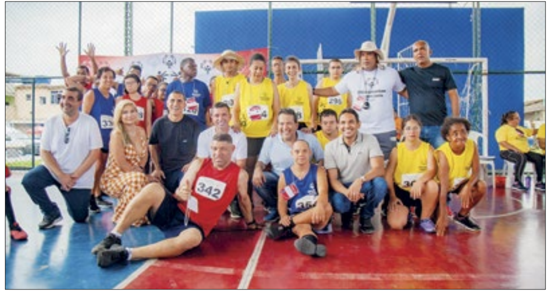
Vila Olímpica de Nilópolis se tornou um dos locais para competições das Olimpíadas Especiais

soa com Síndrome de Down que participou pelo Rio, encantou Abraozinho. Ele convidou todos a seguirem sua página no instagram. Os participantes vestiam uniformes nas cores azul (Rio), amarelo (Minas) e vermelho (São Paulo). "Agradeço o carinho com que me receberam, deram quatro voltas na pista de corrida mesmo com