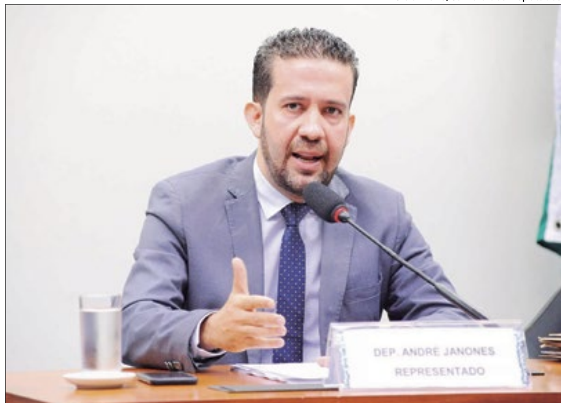
Janones responderá por suposta prática de rachadinha

Na acusação da PGR estão as condutas de associação criminosa, peculato, concussão — quando uma pessoa que tem ou vai assumir um cargo público usa a posição para exigir algum tipo de vantagem — e continuidade delitiva, quando existe a prática de 2 ou mais crimes subsequentes da mesma espé-