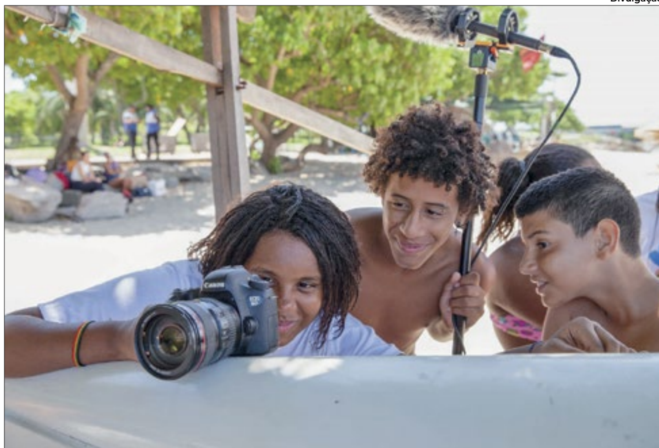
Alunos da Escola Municipal Brant Horta (Penha) no processo de filmagem do curta

A sessão do dia 6 de dezembro no Cine Estação NET Botafogo vai apresentar os trabalhos de jovens cineastas alunos do Colégio Estadual Souza Marques (Brás de Pina), Escola Municipal José Emygdio Oliveira (Oswaldo Cruz), Escola Municipal Brant Horta (Penha) e Escola Municipal Calouste Gulbenkian (Centro) do Rio de Janeiro, que participa-