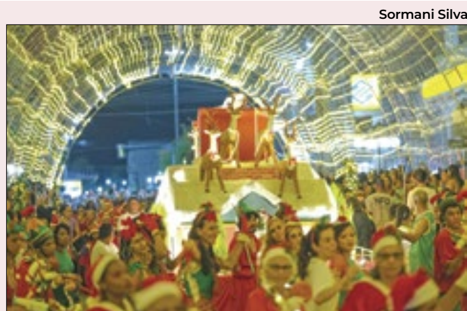
Mais de 50 artistas petropolitanos se apresentaram