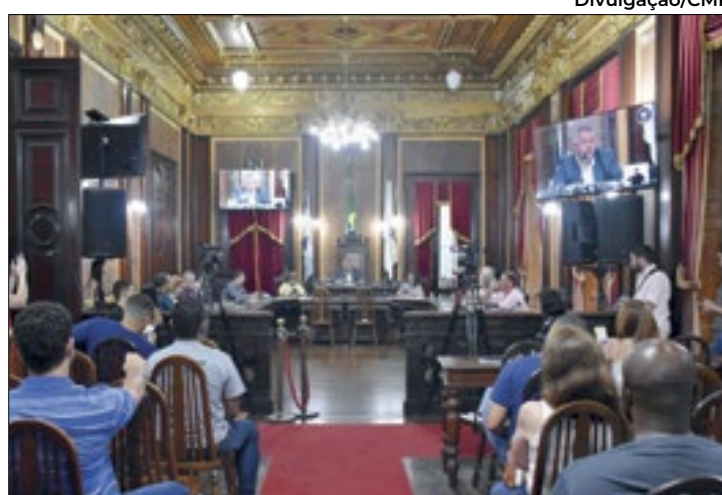
Audiência na Câmara Municipal discute serviços da Enel