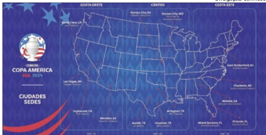
Copa América 2024 acontecerá nos Estados Unidos, em 14 estádios modernos e amplos

"Teremos uma Copa América inesquecível, sentindo as emoções do melhor futebol do mundo em 14 magníficos estádios. A paixão do futebol percorrerá este enorme país de leste a oeste e de norte a sul, levando vibração e