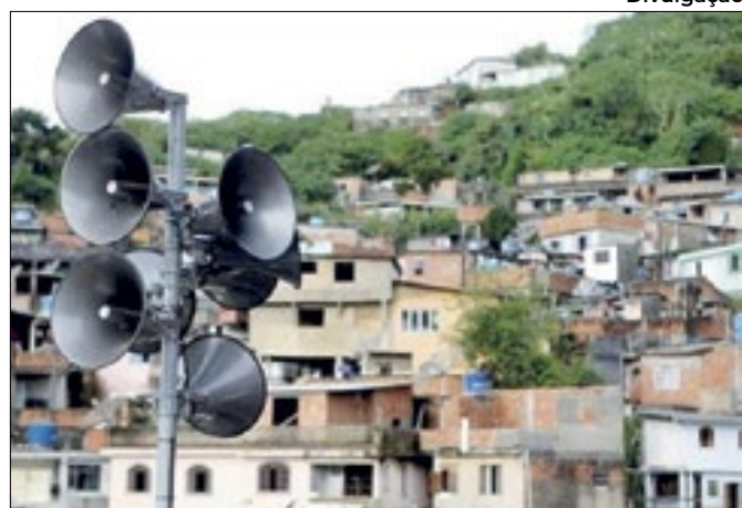
Sirenes do sistema de alerta e alarme no RJ