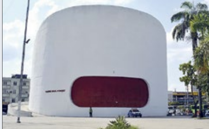
Teatro Raul Cortez, localizado na Praça do Pacificador