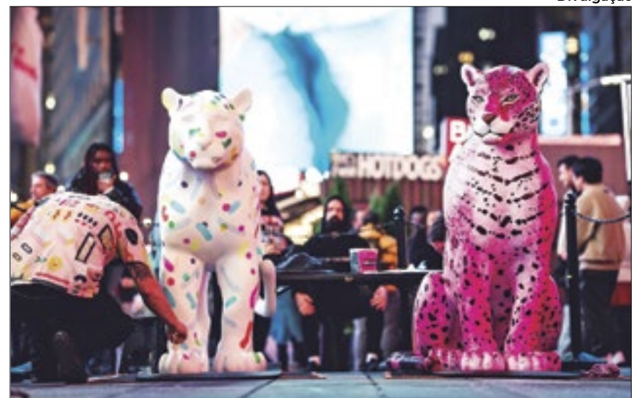
Exposição foi um fenômeno em Nova York e pretende repetir sucesso no Rio