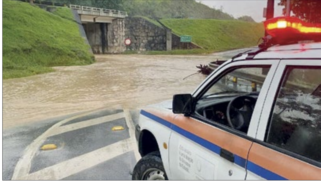
As chuvas torrenciais podem causar problemas como alagamentos e enxurradas