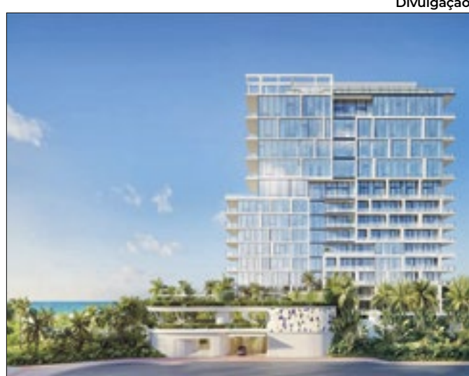
Condomínio será o mais valioso da história de Miami