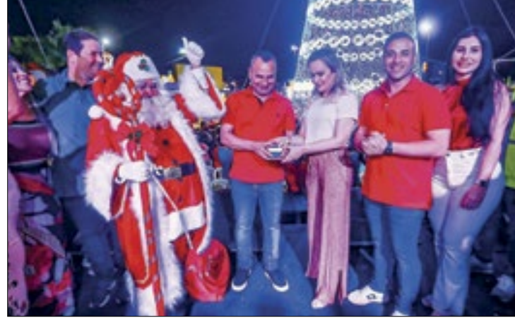
Natal Luz de Belford Roxo foi aberto no último sábado (2)

A magia do Natal está no ar na cidade de Belford Roxo. O prefeito Wagner dos Santos Carneiro, o Waguinho, abriu oficialmente o Natal Luz no último sábado (02), na Praça de Heliópolis, ao acender a árvore enquanto uma sequência de fogos de artifício iluminavam o céu. Centenas de pessoas vibraram e se emocionaram com o show. Em seu quarto ano, o Natal Luz está abrilhantando diversos bairros do município. A festa em Heliópolis também contou com música ao vivo, apresentação de dança e coral dos alunos da rede municipal de ensino.