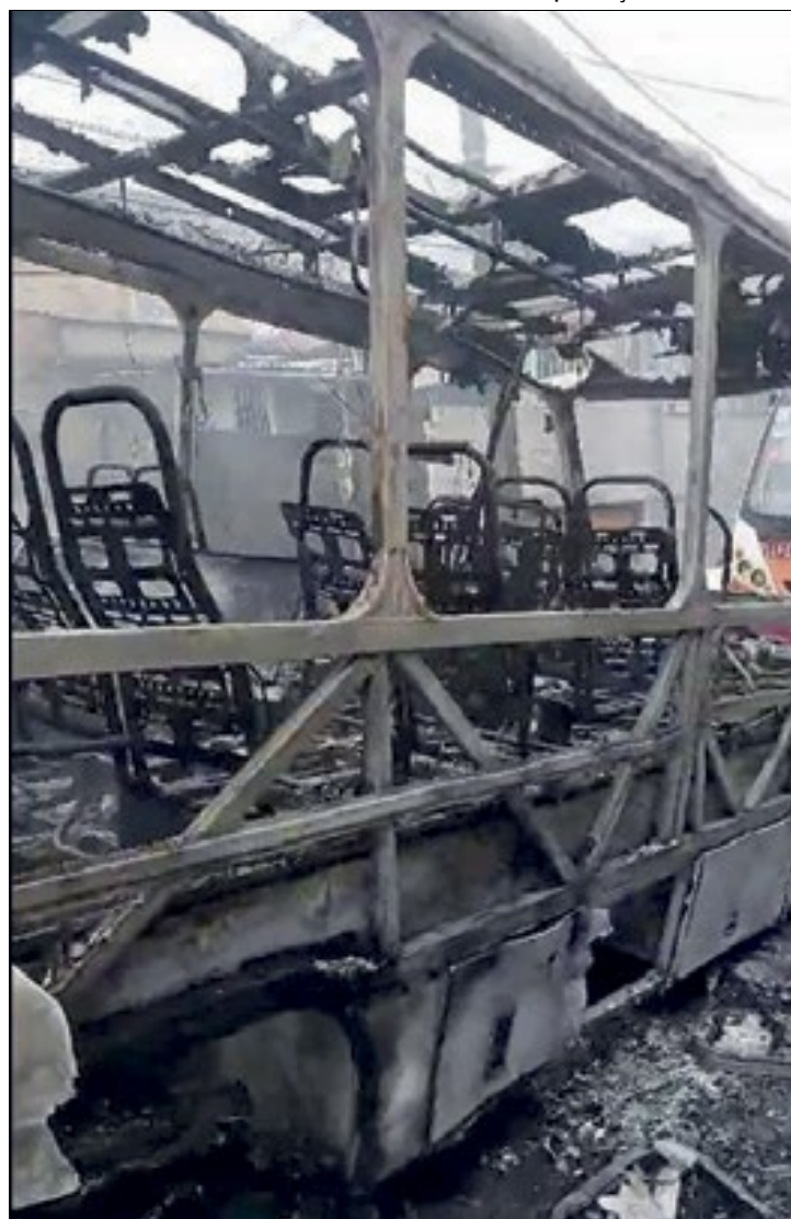
Caso aconteceu na madrugada desta terça-feira (05), no bairro Siméria em Petrópolis