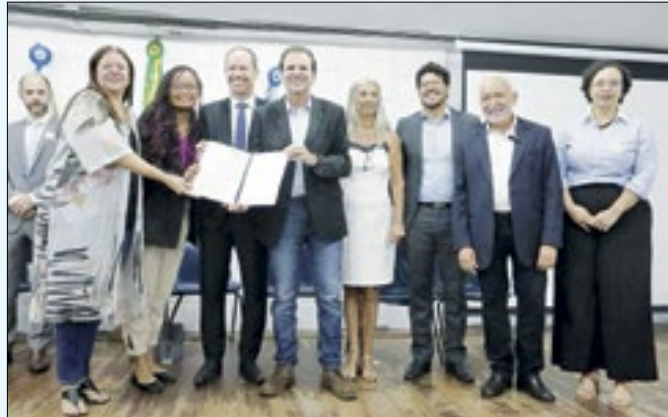
Parceria vai permitir ampliação do projeto 'Tô de Boa'