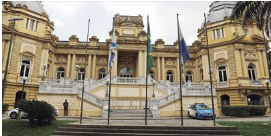
Repasse virão dos fundos de participação dos municípios e dos estados

"O presidente Lula cumpriu sua promessa, quando garantiu que nenhuma cidade receberá menos recursos do que recebeu em 2022. Nesses 11 meses de