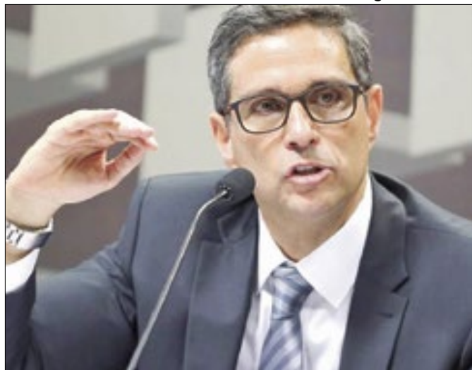
Campos Neto falou em queda lenta da taxa de juros