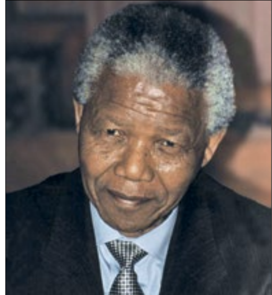
Mandela pacificou a África do Sul