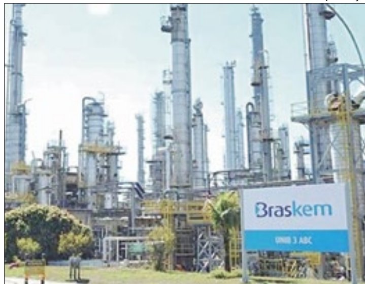
Braskem terá que financiar realocação das famílias

Entre as multas anunciadas pelo órgão ambiental de Alagoas, a maior refere-se à “degradação ambiental decorrente de atividades que, direta ou indiretamente, afetam a segurança e o bem-estar da população”. São R$ 70,2 milhões. Segundo o instituto, trata-se de reincidência da Braskem em uma área que já havia sido objeto de estudo a partir de outro dano ambiental.