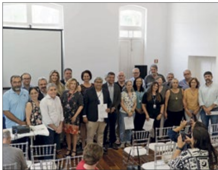
Projeto pretende fortalecer as principais cadeias do setor

O programa é fruto de uma parceria entre as secretarias de Agricultura e Ciência, Tecnologia e Inovação, que através da Fundação de Amparo à