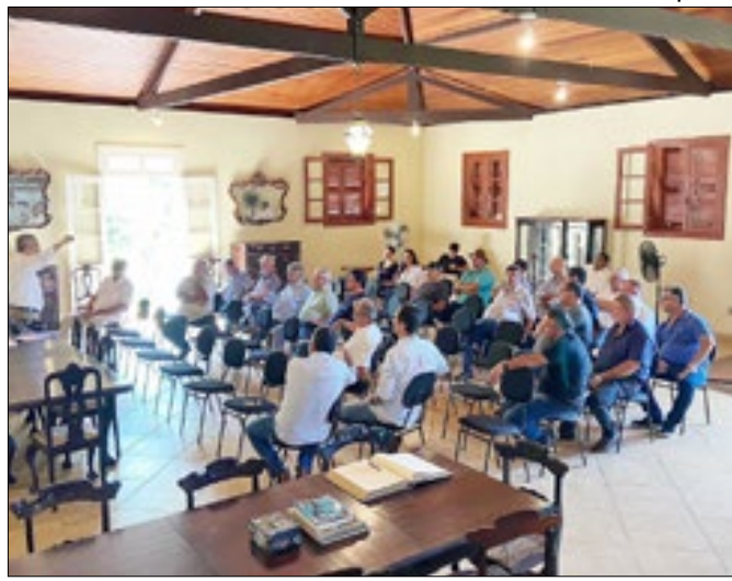
O objetivo é discutir ações de apoio ao agronegócio