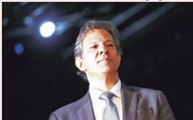
Frente não dará apoio a Haddad na votação da MP