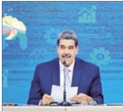
Ditador falou sobre Essequibo

O ditador da Venezuela, Nicolás Maduro, acusou os Estados Unidos de incentivarem a Guiana a provocar Caracas em meio à disputa entre os dois países pela região de Essequibo e afirmou