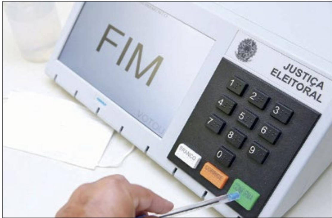
O primeiro turno das eleições municipais será no dia 6 de outubro de 2024

A advogada também acrescenta que é importante a participação popular. "Embora algumas pessoas tenham seus receios com relação a questões eleitorais, ela é muito im-