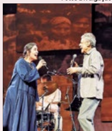
O festejado show da turnê 'Que Tal Um Samba?', com Chico Buarque e Mônica Salmaso, é lançado em CD e DVD