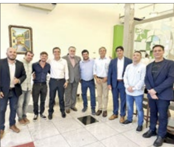
Durante o almoço realizado na sede do CBMERJ, no centro do Rio, a equipe do grupo Correio da Manhã