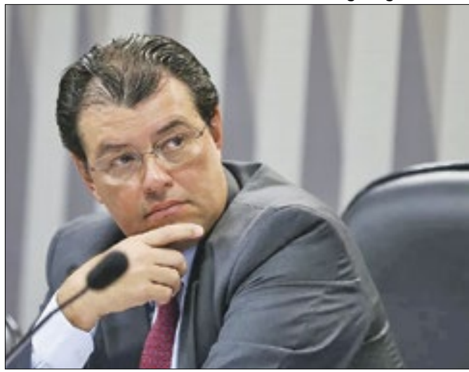
Braga, relator da reforma tributária no Senado