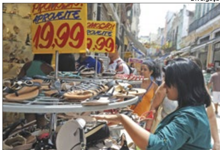
Compra por impulso pode afetar orçamento familiar

Segundo a entidade, que propõe reflexões sobre consumo consciente, é ótimo para o consumidor aproveitar as promoções que realmente precisa, mas é preciso evitar cair em tentações que sejam prejudiciais para ele, para a sociedade e para o meio ambiente. O Akatu ressalta que empresas e comerciantes conseguem induzir o consumidor a comprar com estímulos que eles nem registram conscientemente.