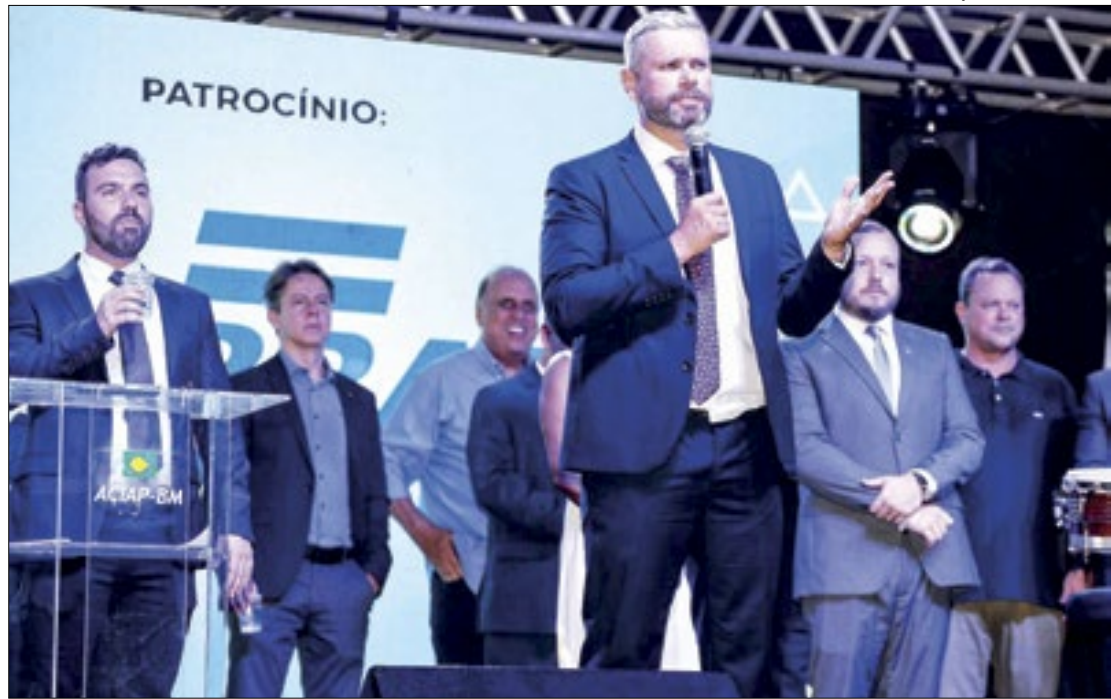
Rodrigo Drable anuncia condomínio industrial durante abertura da Flumisul

Um dos anúncios mais esperados para esta edição da Flumisul, iniciada na noite de quarta-feira, dia 22, foi o lançamento do Condomínio Industrial feito pelo prefeito Rodrigo Drable, do Solidariedade. O empreendimento vai funcionar em uma área de 700 mil metros quadrados, às margens da Rodovia Presidente Dutra, em um local estratégico e de fácil acesso.