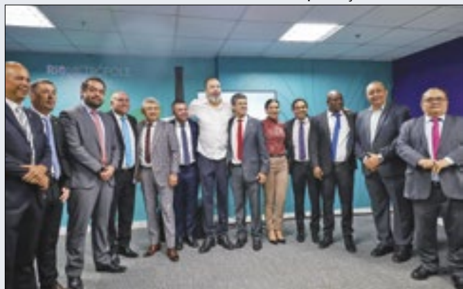
Nova sede do Instituto Rio Metrôpole foi inaugurada