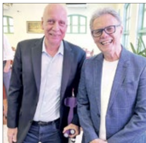
A alta cúpula do PL carioca: o presidente do partido e vice-prefeito do Rio, Nilton Caldeira (e) e o vice-presidente, Ronald Ázaro