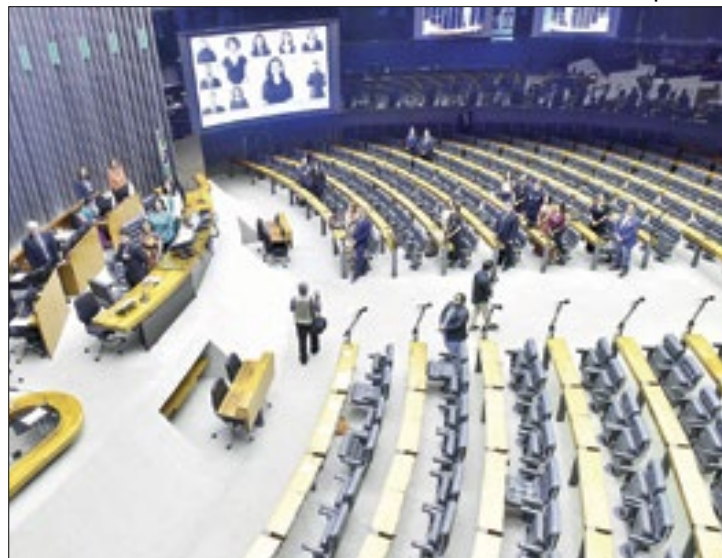
Impasses empacam pauta do Congresso