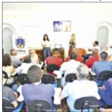
Centro de atendimento

A Prefeitura de Petrópolis, por meio da Companhia Petropolitana de Trânsito e Transportes (CPTrans), lançou a Central de Atendimento ao Cidadão, o Alô CPTrans. O feito aconteceu na sede da Companhia e contou com a presença