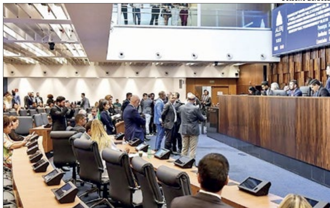
Alerj aprovou o texto em discussão única, que segue para sanção do Poder Executivo

O texto prevê que o tratamento tributário valerá até 31 de dezembro de 2032 e isenta a produção de cimento do recebimento dos benefícios previstos no tratamento. Atualmente,