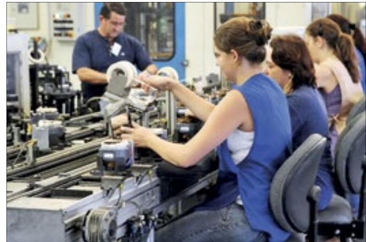
Com isso, medida perde a validade em dezembro