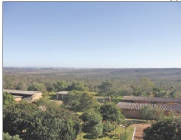
Técnicos avaliam 22,5 milhões de registros da fauna e flora

Por se tratar de uma investigação experimental, aperfeiçoamentos serão feitos a partir da recepção dos usuários. Leitores interessados na temática podem escrever ao IBGE suas per-