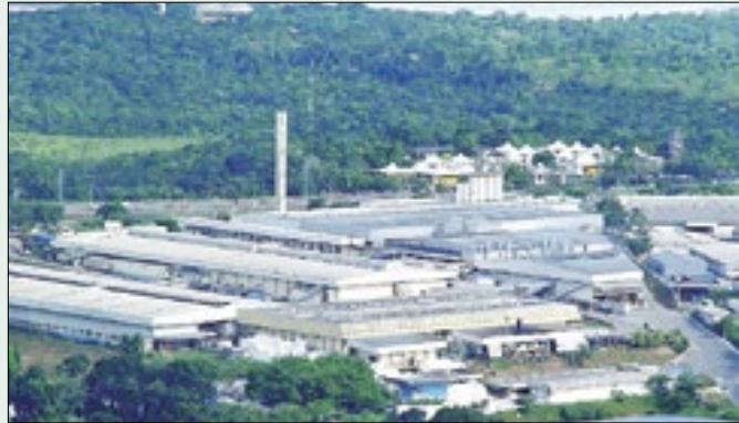
Indústrias instaladas em Manaus