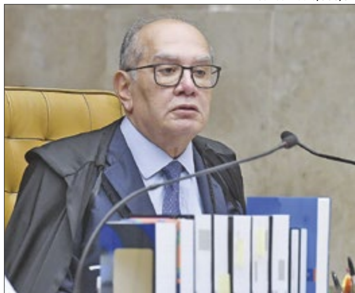
Gilmar Mendes fez duro discurso contra a decisão do Senado