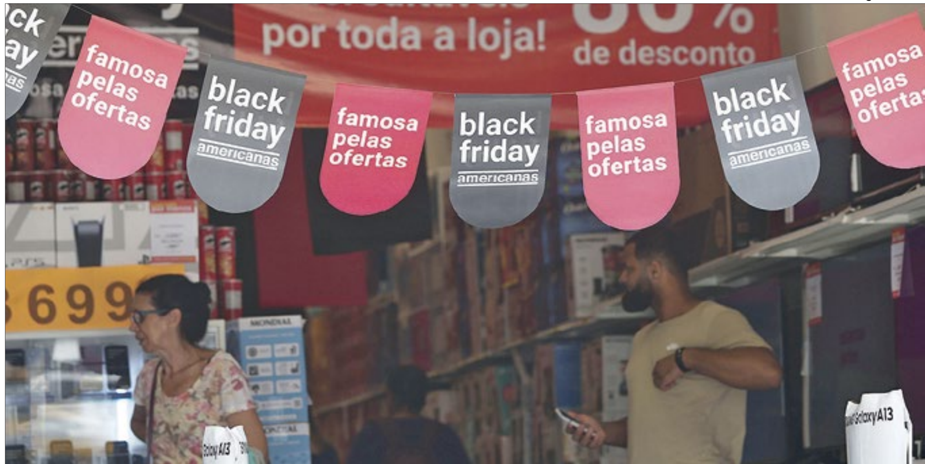
Cuidado com o “tudo pela metade do dobro”. Black Friday acontece nesta sexta-feira e comerciantes anunciam inúmeras ‘promoções’