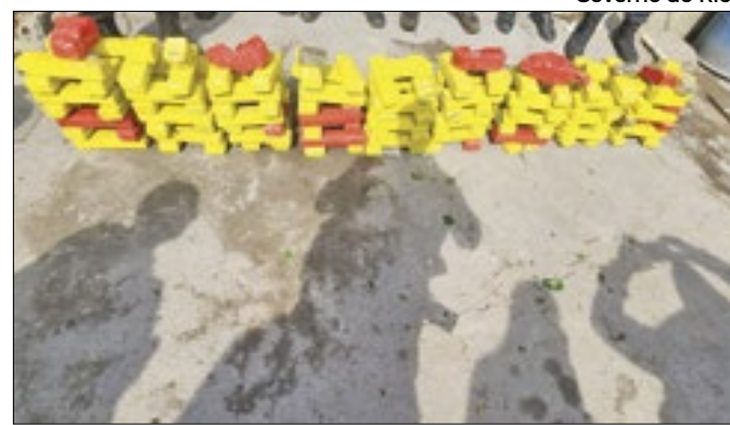
Fios estavam nas comunidades Fallet, Fogueteiro e Coroa