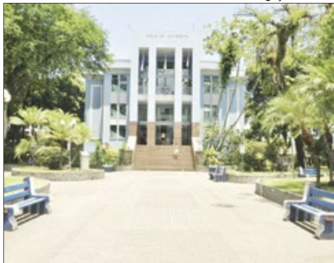
O processo se baseia na Lei Federal de nº 7.347/85