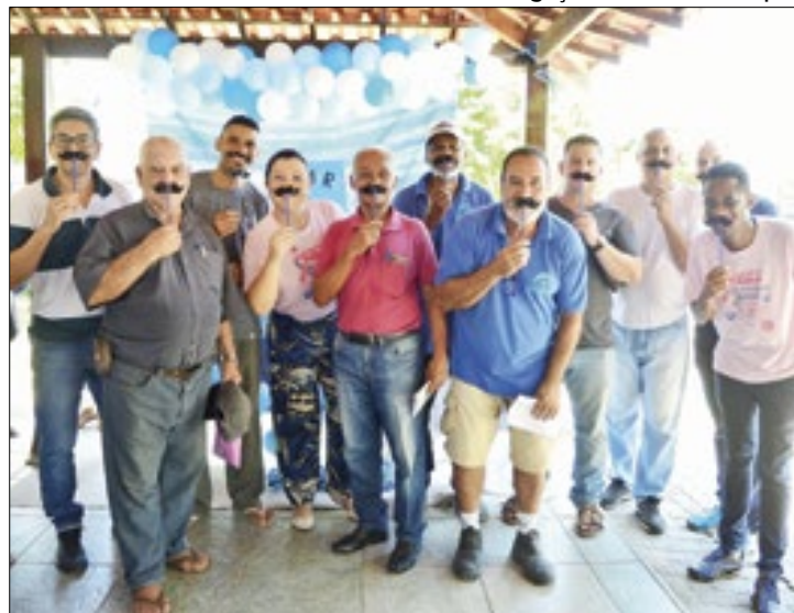
Ação de conscientização aconteceu na última quarta-feira (22)