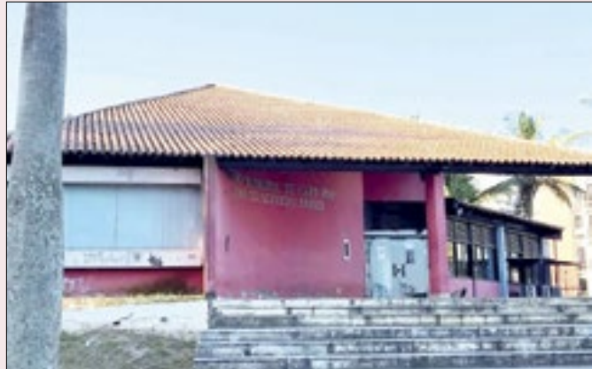
A abertura dos envelopes será no dia 7 de dezembro