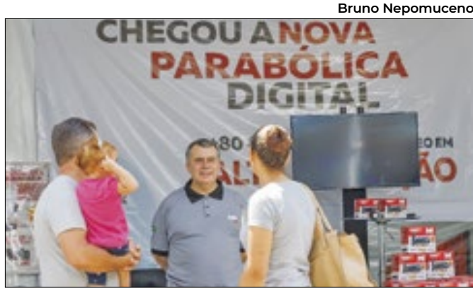
Evento acontece na Praça Baltazar da Silveira