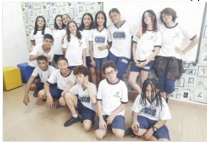
O Colégio Estadual Oliveira Botelho faz parte da ação