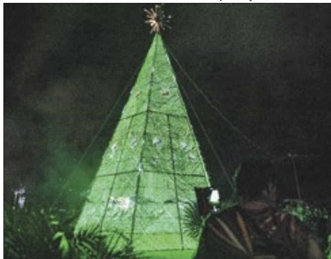
Decoração natalina em Guapimirim, no ano passado