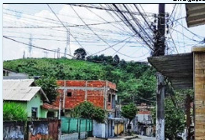
Falta de luz em poste do bairro Ponte Alta

mentos são realizados na escola às terças e quintas-feiras, das 8h às 22h. As atividades são desenvolvidas pelo Departamento de Esporte da Secretaria de Esporte, Cultura, Lazer, Juventude e Turismo.