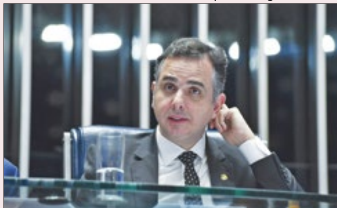
Quais as consequências de uma derrota de Pacheco?