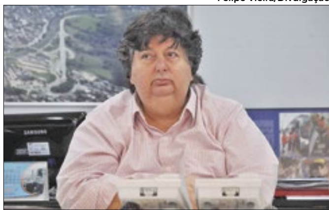
Prefeito Neto está internado no Rio e passa bem