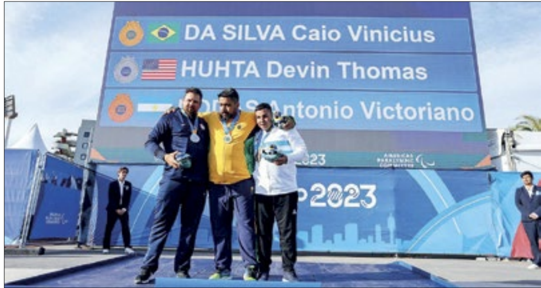
Brasil ultrapassa marca de 200 medalhas nos Jogos Parapan-Americanos de Santiago

Uma das medalhas douradas veio com o bicampeão paralímpico e tricampeão mundial Alessandro da Silva, na prova do lançamento de disco masculino F11 (atletas cegos) com a marca de 44,95 metros. O pau-