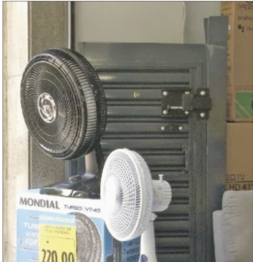
Onde de calor fez aumentar as vendas de ventiladores

No Centro da cidade, a maior parte das lojas vendeu todos os produtos nos primeiros dias desta semana. Quando o estoque esgotou, os ventiladores do mostruário foram parar na casa dos petropolitanos. Em uma das lojas, a venda aumentou quase 100% nos últimos 7 dias, expectativa que não era esperada pela gerência. "A gente vendeu tudo na segunda-feira, às 17h, já tinha acabado. Na terça, tinham 25 unidades e vendemos tudo. Na quarta-feira, tinha acabado em todas as revendas, inclusive