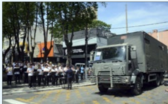
Militares participaram de exercício avançado