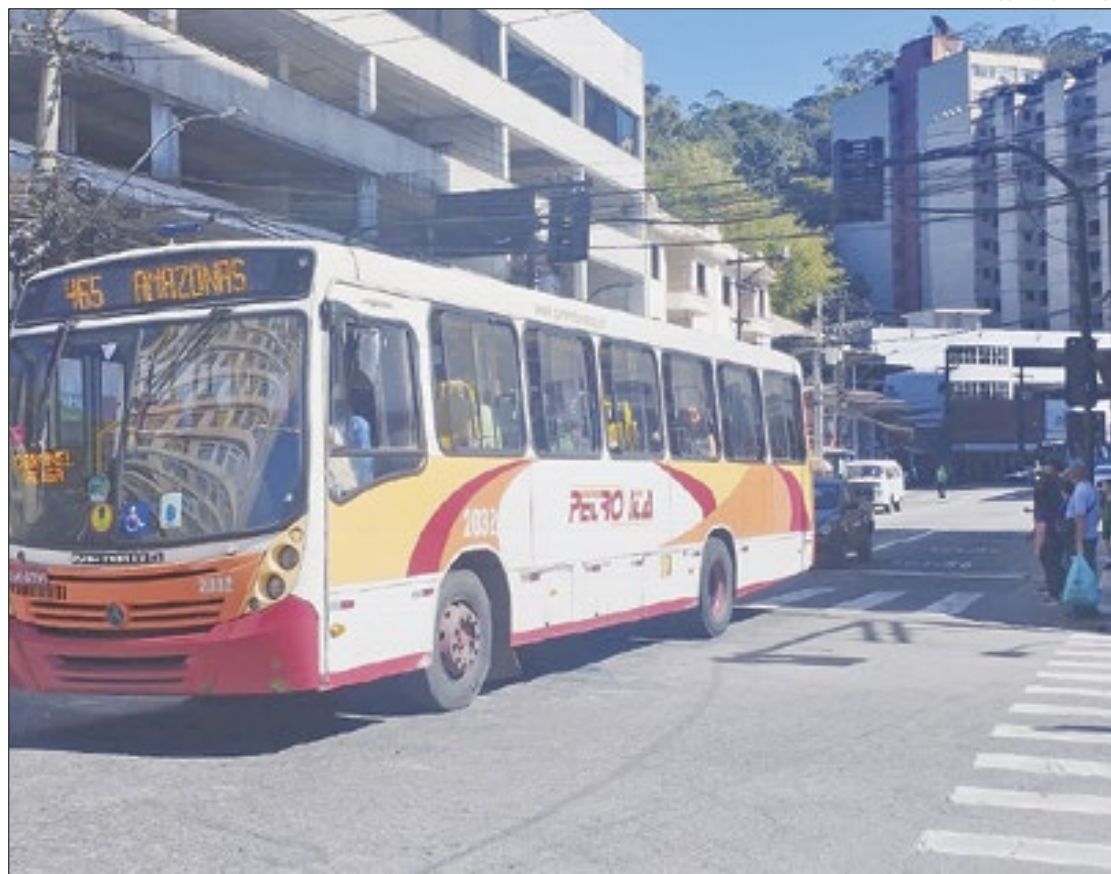
O acordo foi condicionado à renovação da frota de ônibus na cidade

Outro subsídio importante, e que não deve se repetir neste ano, foi o chamado "vale idoso". Um aporte federal para cobrir gratuidades de idosos no sistema de transporte. Sem os dois auxílios, a tarifa dos ônibus poderia custar, hoje, R$ 6,19.