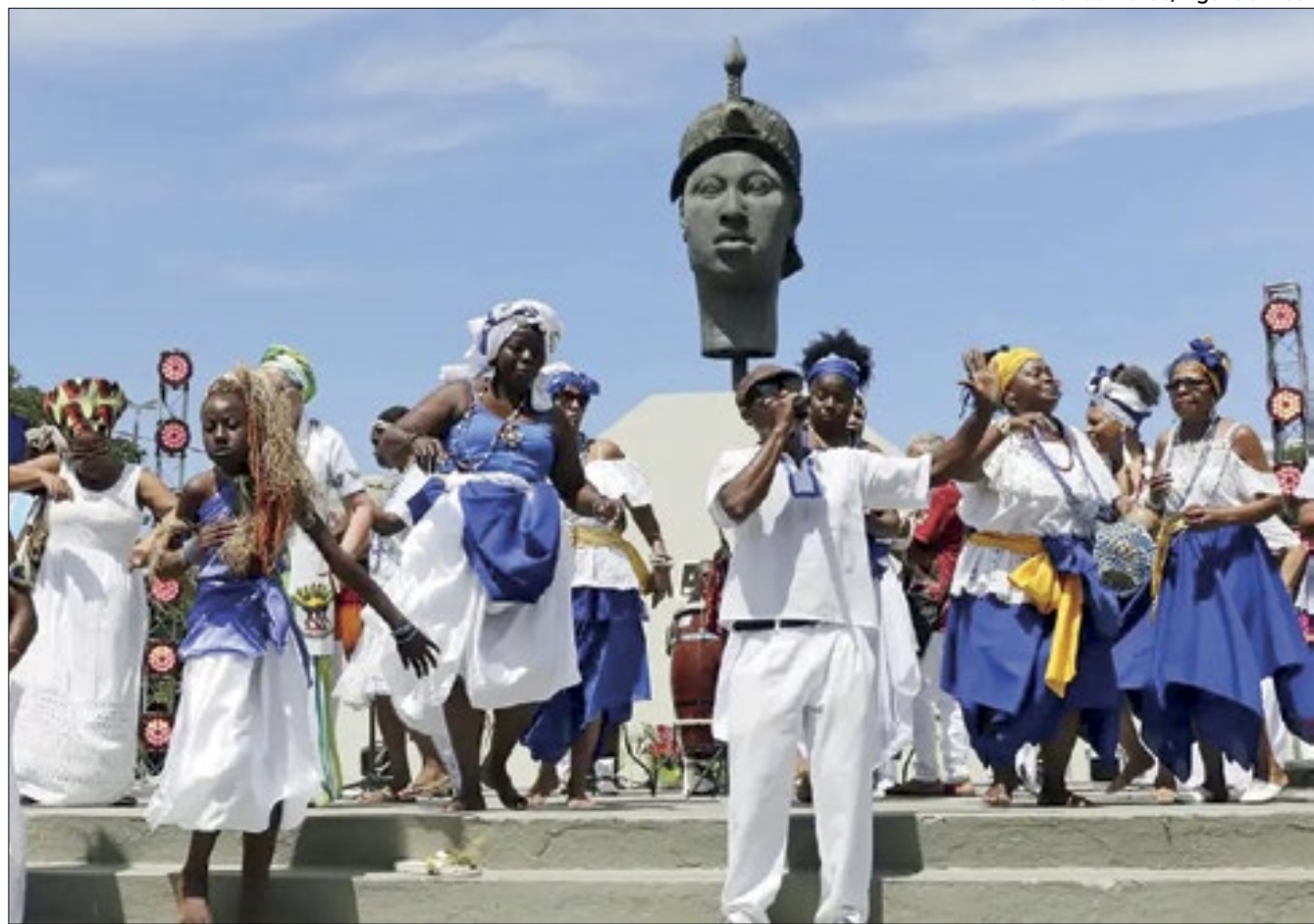
Celebração da data no Rio de Janeiro é no Centro, no monumento de Zumbi dos Palmares