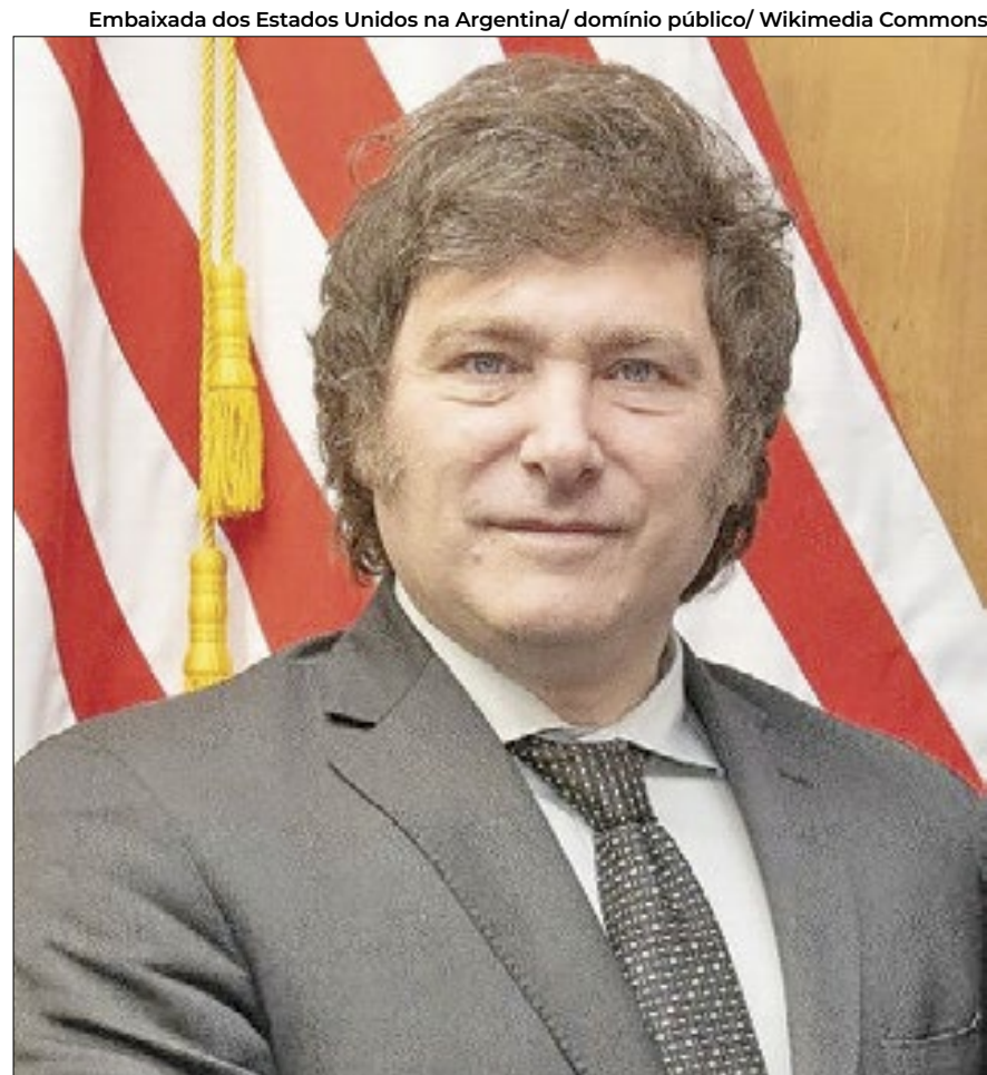
Milei pode colocar a direita novamente no poder na Argentina

Além disso, apesar de Milei defender a saída da Argentina do Mercosul por contrariedades com o presidente Lula (PT), nos bastidores a situação é outra. De acordo com o jornal O Globo, a equipe do economista entrou em contato com diplomatas brasileiros afirmando