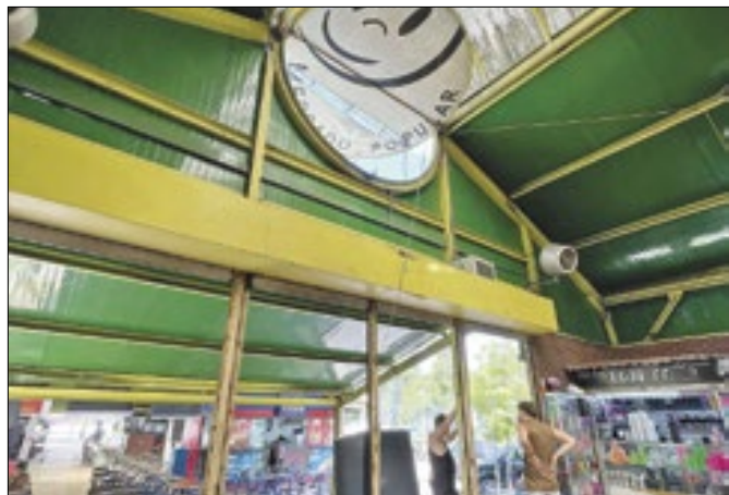
Conservação do local é insuficiente