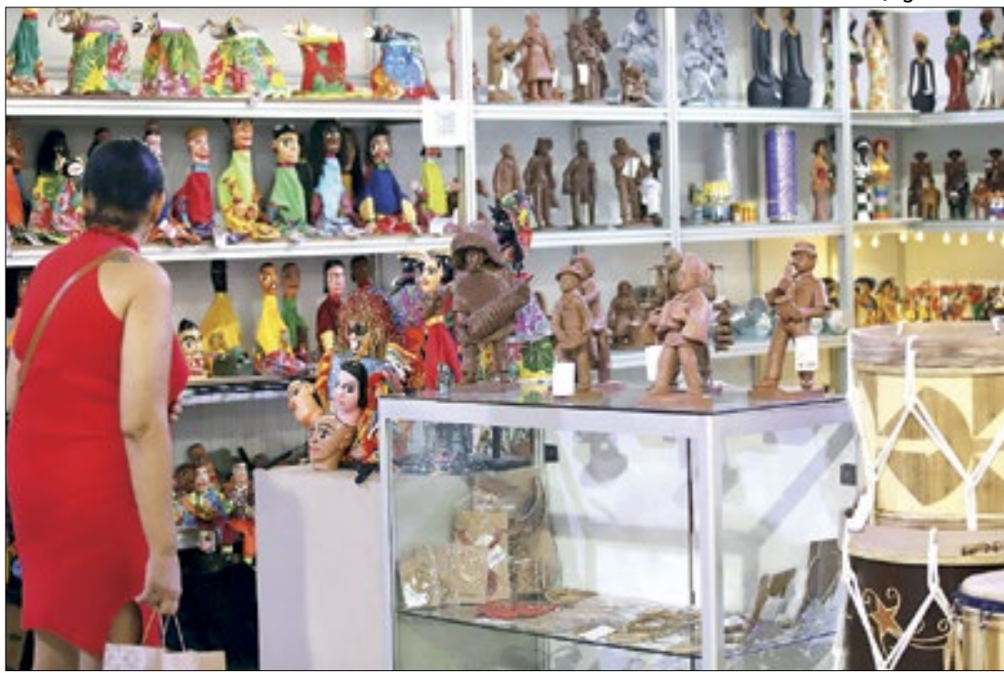
Público encontrará trabalhos em cerâmica, madeira, fios, entre outros