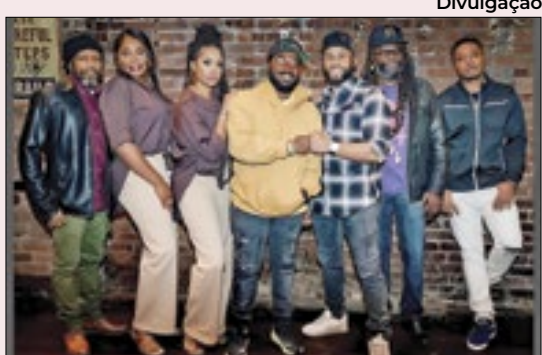
Banda que revelou Bob Marley, The Wailers se apresenta nesta sexta-feira no palco do Qualistage