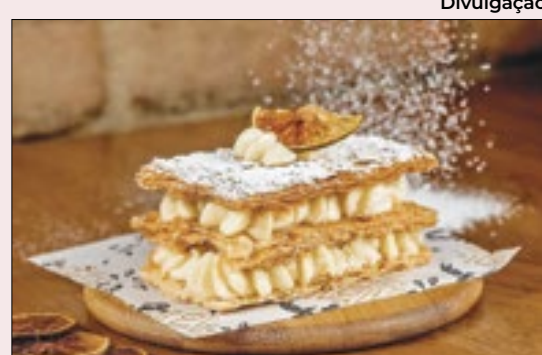
Iguaria tradicional da culinária francesa, o mil-folhas é atração em vários restaurantes cariocas