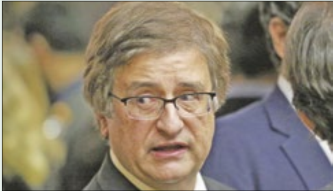
Paulo Gonet Branco poderá ser o sucessor de Aras