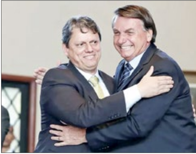
Ex-presidente fala de relação com o governador de SP