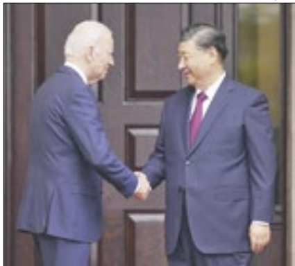
Biden chama Xi de ditador

A violência na região está em alta desde o início da guerra entre Israel e o Hamas. A Cisjordânia é comandada pela Autoridade Nacional Palestina de forma parcial, sendo reconhecida por Israel e pela ONU.