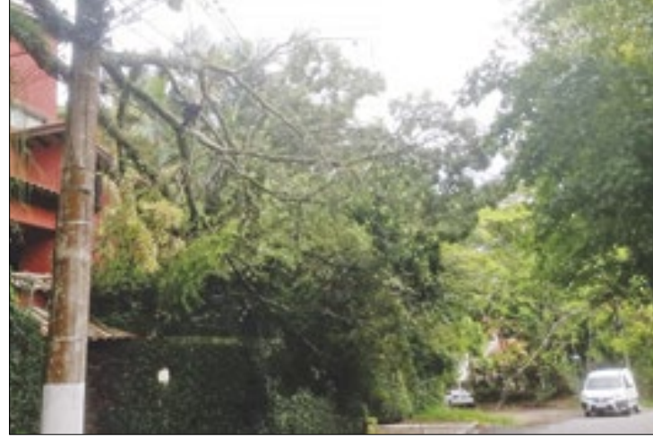
Cidade registrou várias quedas de árvores

A Defesa Civil de Resende está em alerta. Essa semana várias ocorrências foram registradas em decorrência de ventos que atingiram 75,2 KM/H. Na última quarta-feira, dia 15, diversos acionamentos foram feitos ao órgão, através do telefone de emergência - 199, sobre quedas de árvores, destelhamento e rompimento de cabos de energia.