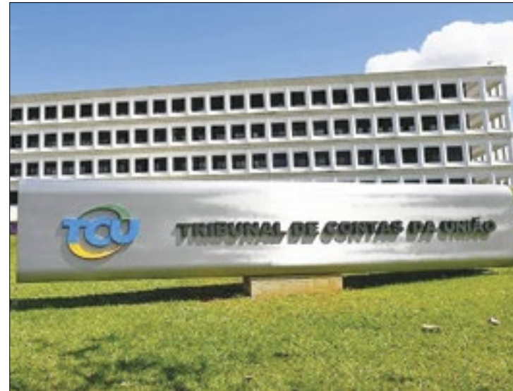
Sede do Tribunal de Contas da União, em Brasília

pelo menos 100 itens são analisados. Os dados podem ser conferidos no painel disponibilizado no link Radar da Transparência Pública ( tce.mt.gov.br ). Nele, é possível verificar o nível de transparência de entidades ligadas aos Poderes Executivos, Legislativos, Judiciário, dos Ministérios Públicos, dos Tribunais de Contas e das Defensorias Públicas das três esferas de governo: União, Estados, Municípios, além do Distrito Federal.