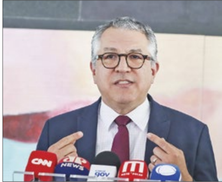
Padihla: nada de déficit. A meta continua zero