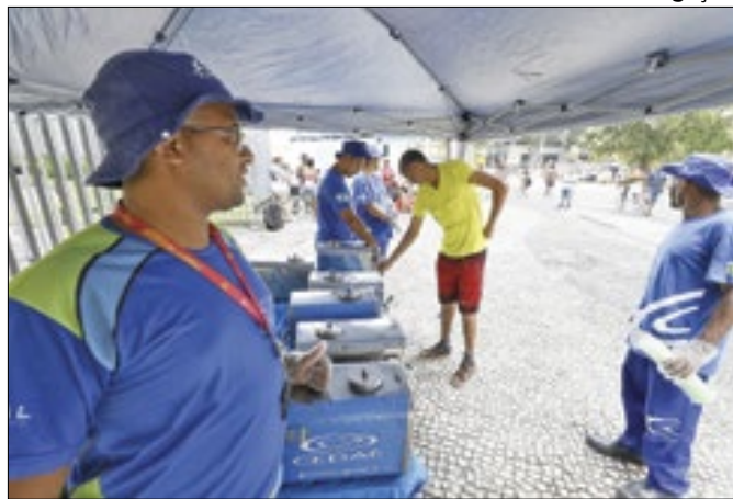
Ação aconteceu no Largo da Carioca, no Centro