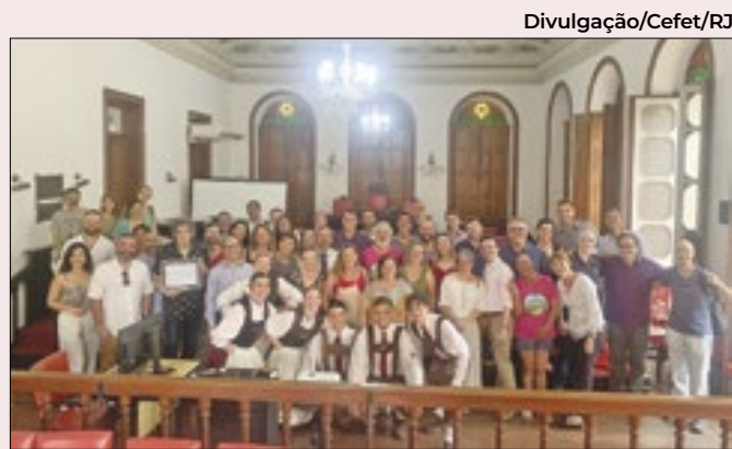
Comemoração contou com a presença de autoridades

sabilidade dos tutores, em abrigos emergenciais, casas de passagem, albergues e centro de serviços destinados ao atendimento de pessoas em situação de rua, vítimas de desastres naturais ou quaisquer eventos que criem a necessidade do acolhimento.