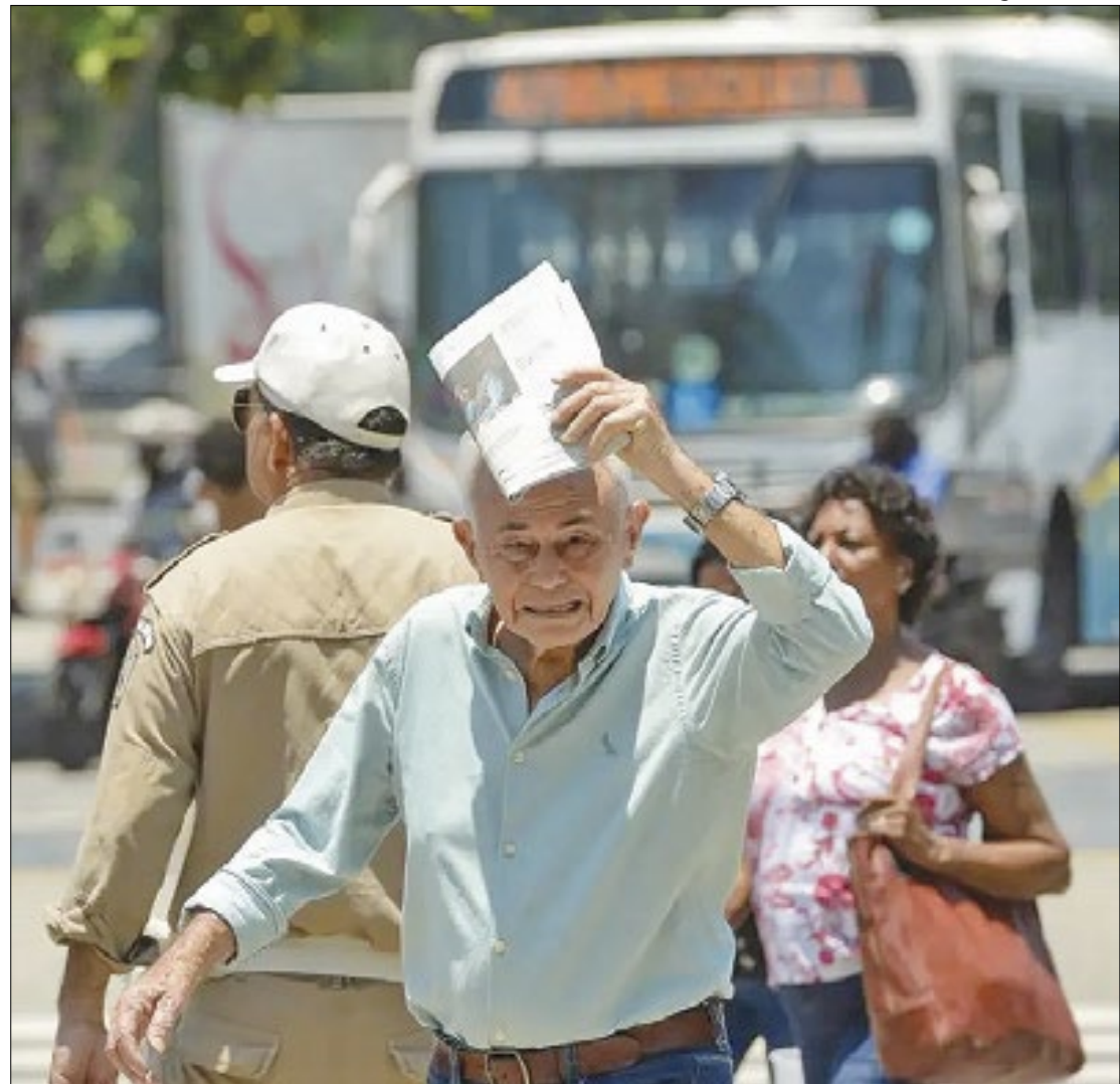
População idosa, crianças e pessoas com alguma comorbidade são as mais vulneráveis

O estresse térmico pode acometer a todos os indivíduos e pode causar sintomas leves como: fraqueza; náuseas; tonturas; febre baixa; lábios secos; suor excessivo; câibras; dores de cabeça; erupção cutânea e cansaço. E também podem gerar casos graves como: confusão mental; convulsão; coma; temperatura corporal alta (acima dos 40°C); desmaio; não urinar em um período de 8 horas ou urina escura; batimentos cardíacos e respiração acelerados; irritabilidade; olhos ou testas fundos; vômito; diarreia e insolação, a Secretaria de Saúde informou que na presença de algum destes sintomas é importante permanecer em local fresco ou refri-