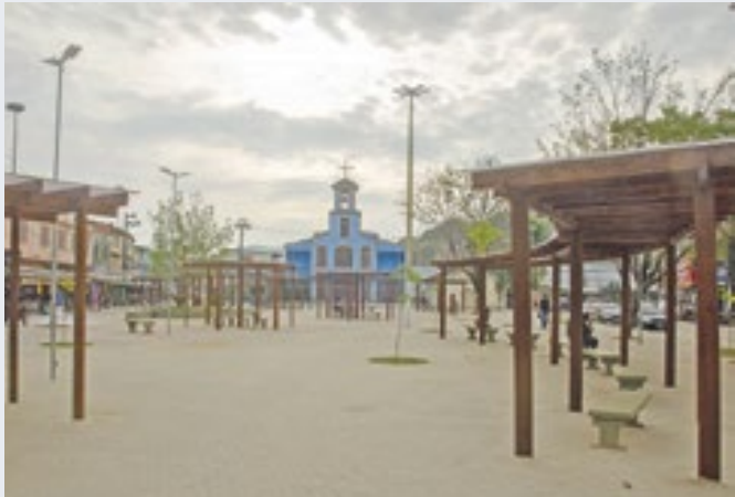
Dia da Consciência Negra terá programação em Japeri