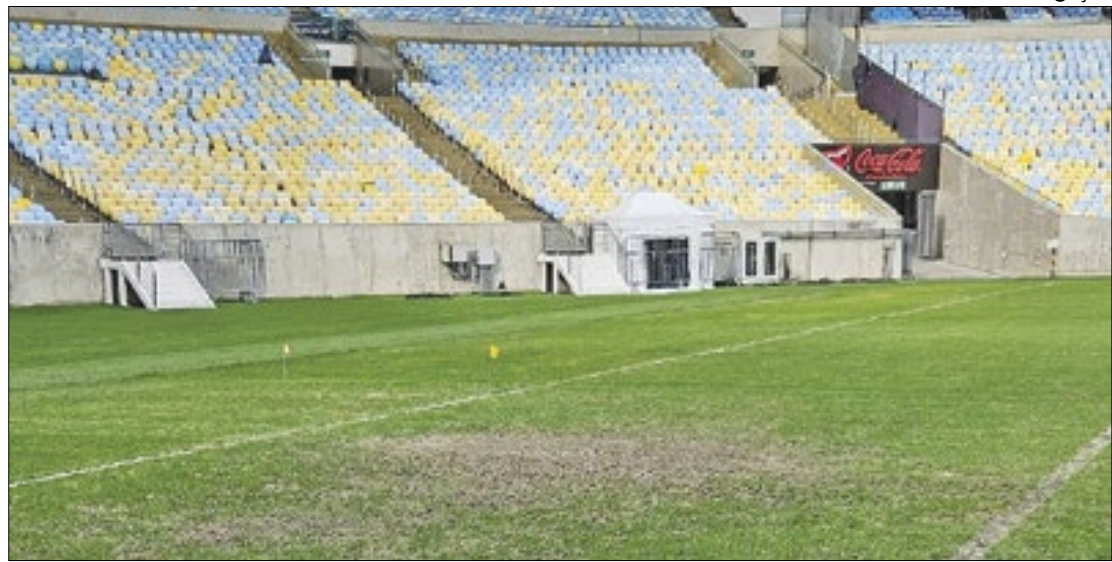
Gramado do Maracanã deu muita dor de cabeça para os times que jogaram lá em 2023

No Rio de Janeiro, a situação é ainda mais complicada. Dada a má gestão do Maracanã, o gramado vive em péssimas