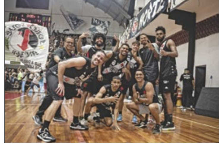
Vasco venceu o Cerrado e agora enfrenta o Brasília, em SJ

Vasco vem se saindo melhor do que o esperado. Após uma derrota brigada na estreia contra o Minas, em São Januário, o time engatou um sequência excelente de vitórias, venceu o clássico contra o Botafogo e perdeu contra o FlaBasquete no último lance do jogo mais disputado desta edição do NBB. E a vinda do craque Marquinhos permite até mesmo sonhar com um bom desempenho nos playoffs. É um início muito promissor do Gigante das Quadras.