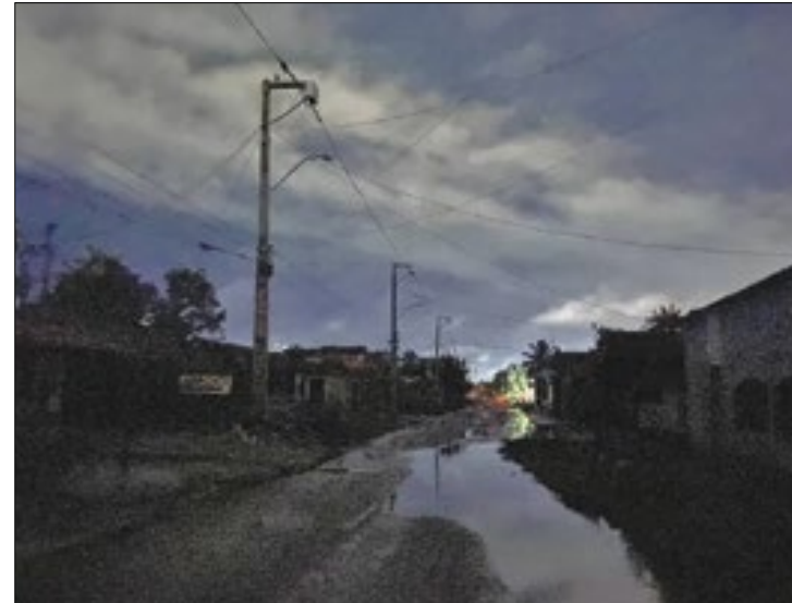
O temporal deixou sem luz 2,1 milhões de pessoas

De acordo com o prefeito, unidades básicas de saúde (UBSs) e conjunto habitacionais ainda não foram inaugurados por causa da demora da empresa em começar o fornecimento de energia. "Eu tenho cinco UBS que estão prontas, aguardando a Enel fazer a ligação de energia. Há um con-