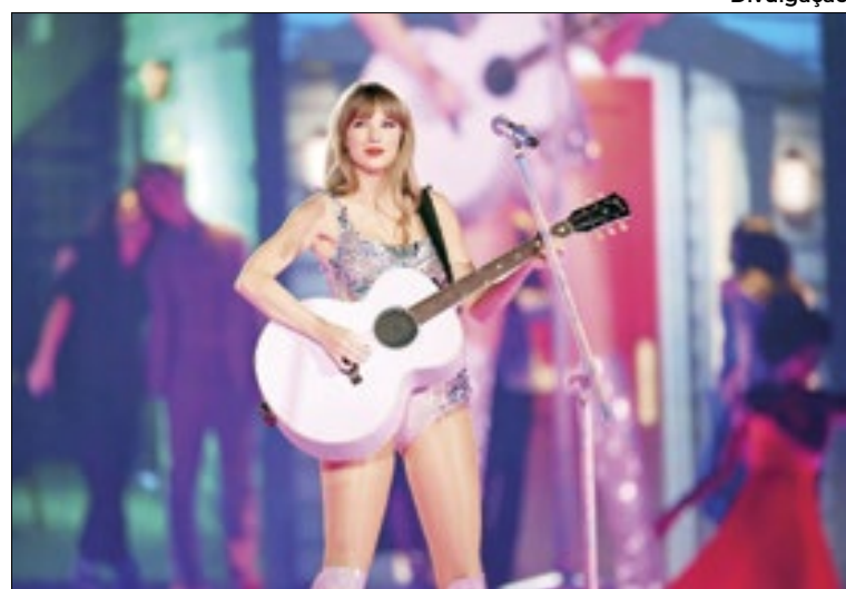
Cantora viaja pelas fases da carreira em três shows no Nilton

O 'The Eras Tour' está sendo definido pela imprensa especializada em música do mundo como um verdadeiro marco cultural do século XXI. Para receber a 'Loirinha', a Cidade Maravilhosa montou um esquema especial de trânsito e transporte para os três dias de show.