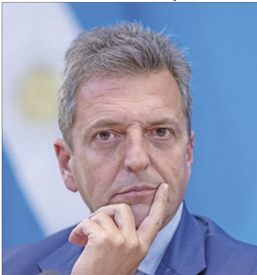
Sérgio Massa pode dar continuidade ao peronismo na Casa Rosada

Após ficar em terceiro lugar no primeiro turno com 23,83% dos votos, Patricia Bullrich declarou apoio ao candidato de extrema direita.