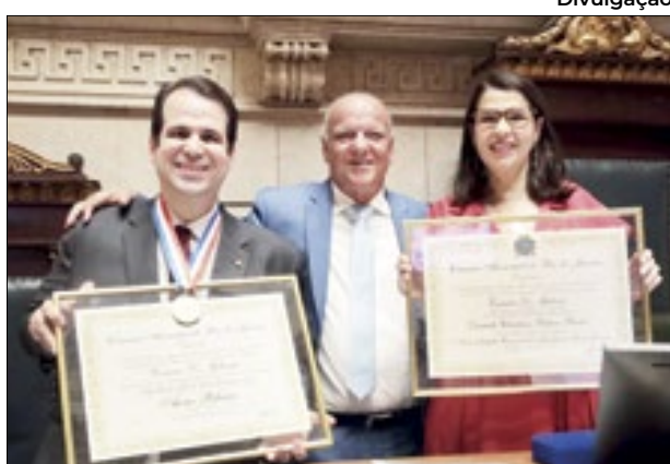
Os irmãos apaixonados pela cultura, o deputado federal Aureo Ribeiro (Solidariedade - RJ) e Danielle Barros, secretária de Estado de Cultura e Economia Criativa do Rio, foram homenageados com a medalha de mérito Pedro Ernesto, a mais alta condecoração da cidade do Rio, em concorrida solenidade por iniciativa do vereador Dr. Gilberto (Solidariedade), em Sessão Solene na Câmara, na última semana (13)