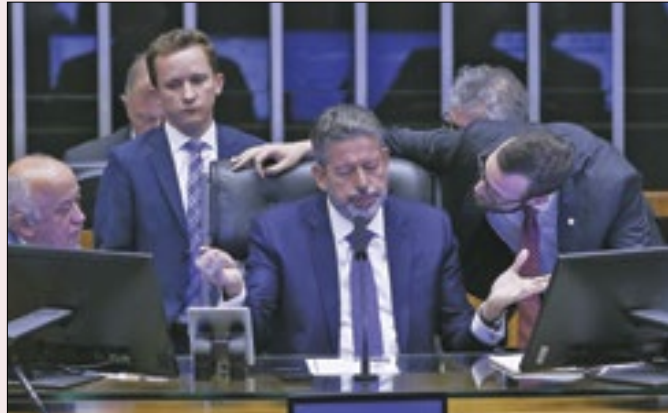
Ciúmes das conquistas de Arthur Lira