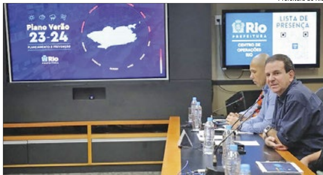
Eduardo Paes destacou que o poder público está atuante na prevenção de desastres

“Fizemos um apanhado de todas as ações, como limpeza de bueiros, dragagem de rios e obras de infraestrutura. Mas o importante é que as pessoas tenham clareza que esses efeitos climáticos mais severos, que sempre aconteceram no Rio de Janeiro, só têm aumentado. Ao longo da última década, tive-