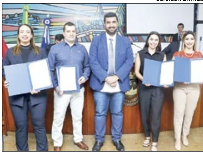
Solenidade foi realizada na última terça-feira (14)