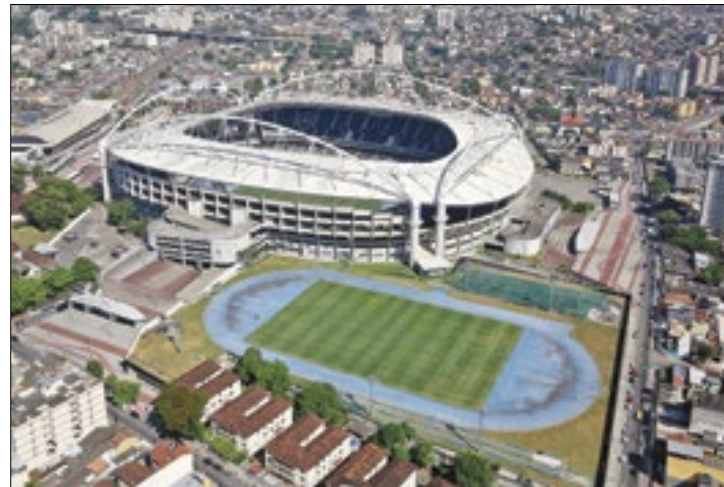
Estádio do Botafogo vai receber uma turnê histórica

as travessias nas faixas de pedestres e passarelas;