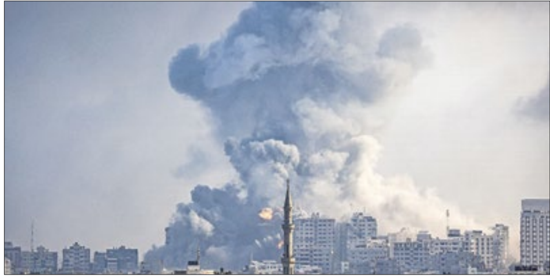
Um avião militar de Israel atingiu a casa do líder do Hamas, Ismail Haniyeh, em Gaza

Ismail Haniyeh mora atualmente no Qatar, de acordo com o The Times Of Israel. O Hamas confirmou o bombardeio, segundo os extremistas, duas casas pertencentes a Haniyeh