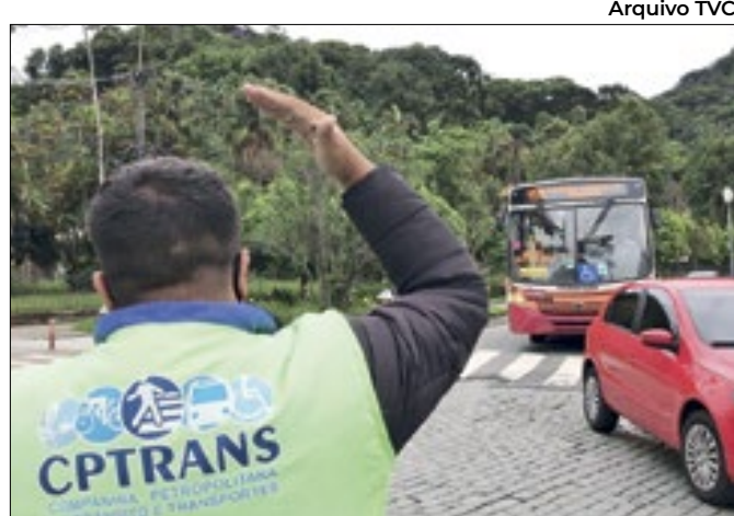
Contratação futura e eventual de agentes de trânsito