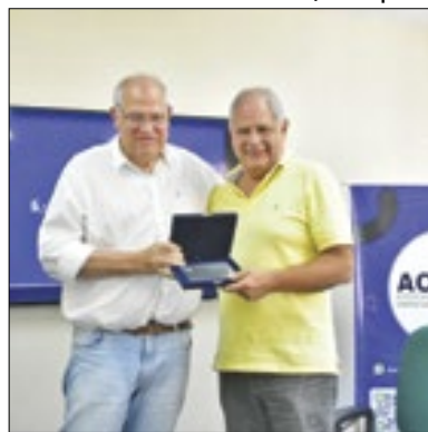
Evento reuniu empresários

O Comitê Gestor do Petrópolis Business apresentou durante reunião feita nesta semana, um balanço sobre o evento. A maior feira de negócios da região atraiu quase 28 mil pessoas. De acordo com a pesquisa apresentada na reunião, mais de