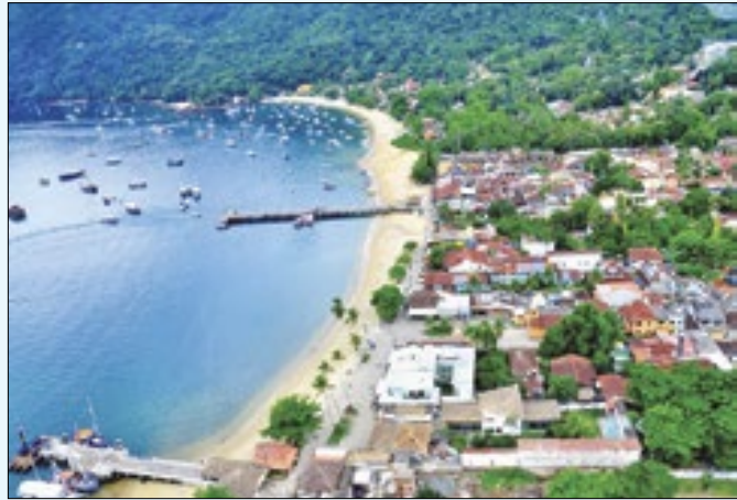
Evento visa promover turismo de casamento em Angra