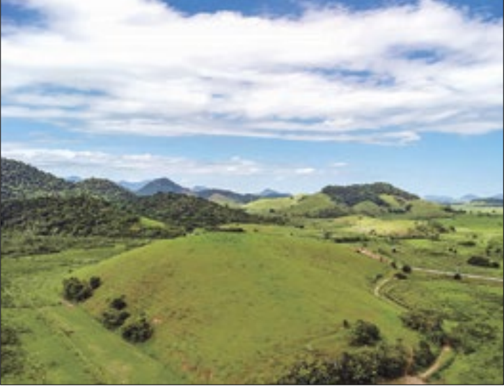
Terra de Gigantes começa às 22 horas desta sexta-feira (17)

O potencial da Serra Macaense ganha destaque internacional de sexta-feira (17) a domingo (19) com a final do campeonato brasileiro de corrida de aventura, a Expedição Terra de Gigantes 250 km Macaé, que será promovida a partir do Arraial do Sana (RJ). A Prefeitura de Macaé apoia o evento, com ênfase para as secretarias de Esportes e Turismo. As modalidades serão canoa-gem, mountain bike, trekking e escalada.