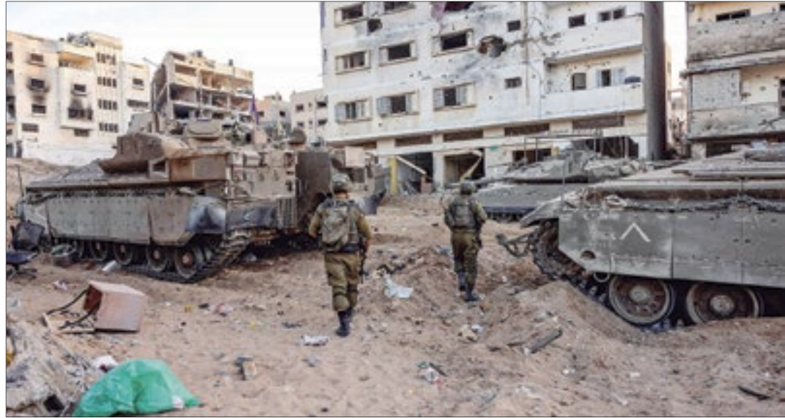
Israel afirma que terroristas se abrigam em uma espécie de quartel-general

Após o cerco, médicos disseram que pacientes, incluindo bebês recém-nascidos, estavam morrendo por falta de medicamentos. Os profissionais afirmam ainda que a unidade não tem mais combustível necessário para manter a energia elétrica e equipamentos hospitalares em funcionamento.