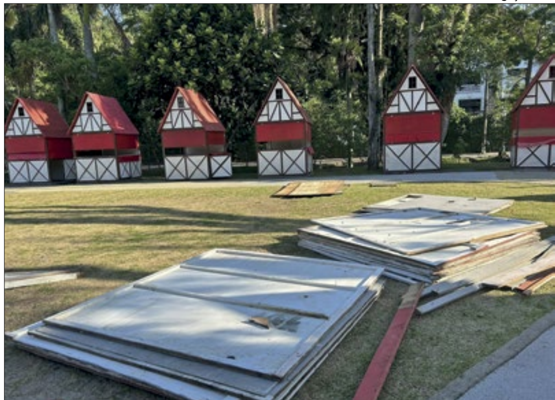
Montagem do Natal Imperial começa com itens da Prefeitura

Os problemas também ocorrem nas barracas. Na sexta (10), a Prefeitura anunciou o