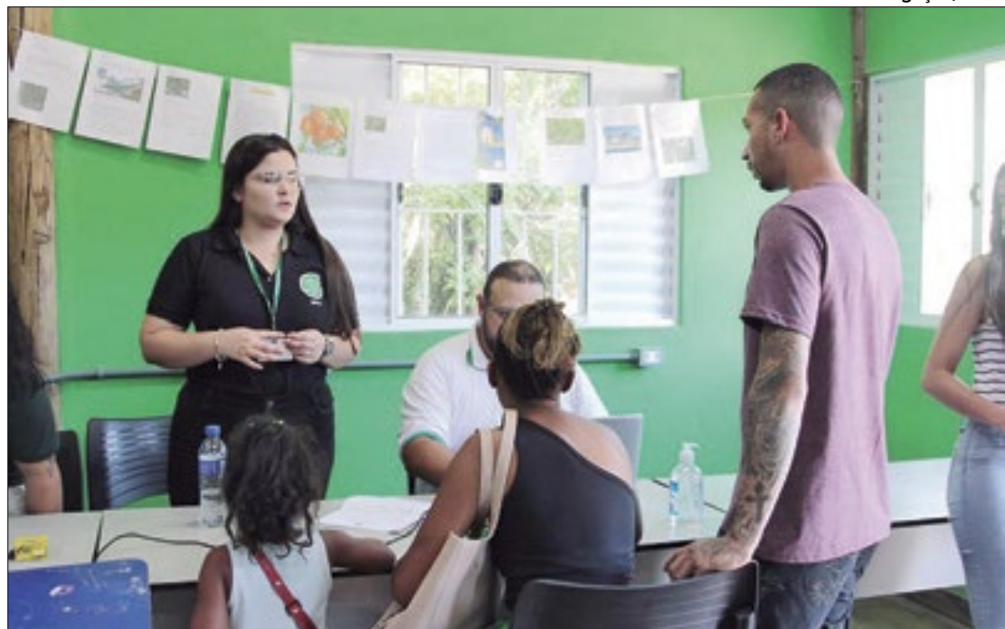
Defensoria atende população de Paraty Mirim que fica na região da Costa Verde

- Agora, faremos um relatório descrevendo as demandas como: poucas opções de transporte, apenas quatro horários; precariedade da estrada, dificultando o acesso e o deslocamento; problemas nas fiações e problemas com a escola local, que serão encaminhadas para a Tutela Coletiva tomar as medidas necessárias - disse o defensor