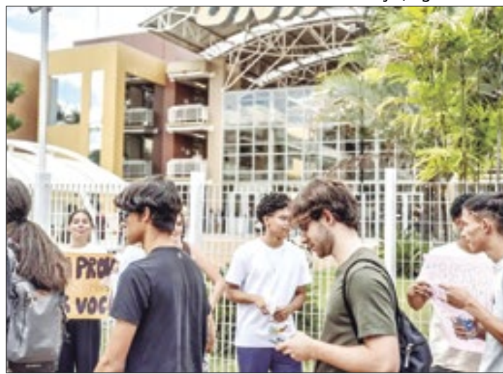
Alunos farão a nova prova em dezembro deste ano