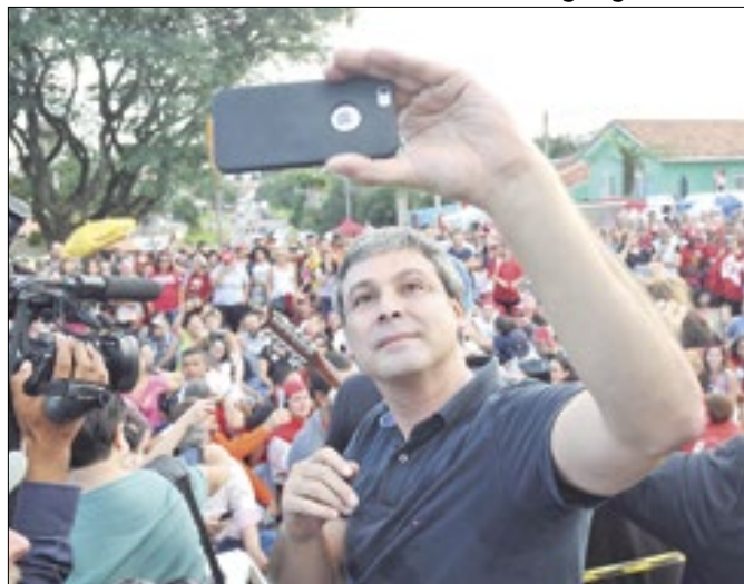
Lindbergh fez duas emendas alterando a meta