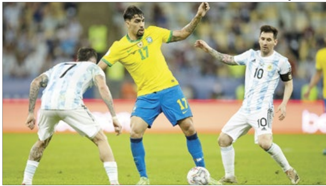
Em 2021, Lionel Messi conquistou a Copa América com a Argentina em pleno Maracanã

Até mesmo pessoas próximas a jogadores procuraram a entidade para adquirir camarotes, mas não conseguiram efetuar as compras para o clássico.