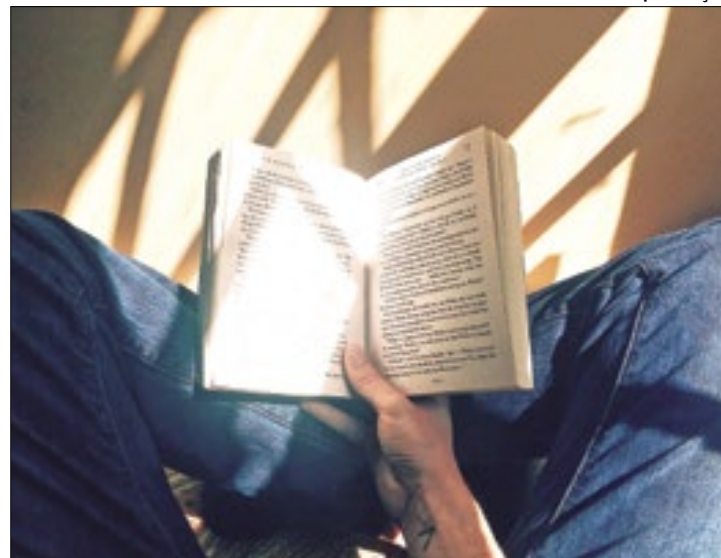
Propostas serão base de plano nacional para a meta

grar o Plano de Ações Articuladas (PAR), vigente de 2021 a 2024, para atendimento do CNCA, terão que observar critérios de prioridade para formação continuada dos profissionais de educação, aquisição de material didático e equipamentos em técnica digital (TIC). As unidades federativas poderão apresentar demandas do território estadual e demandas individuais.