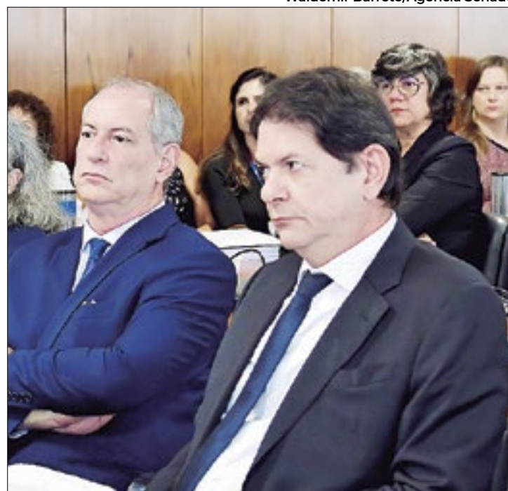
Briga entre os irmãos Gomes atrapalha planos do PDT

Até então, o PDT apoiava o então governador Camilo Santana no Ceará. Cid defendia, nas eleições para governador no ano