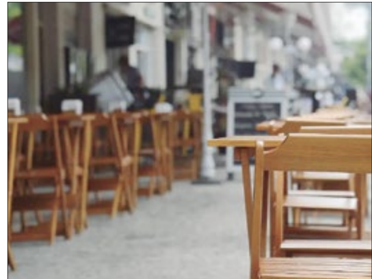
Pesquisa mostra pretensão em 35% dos estabelecimentos