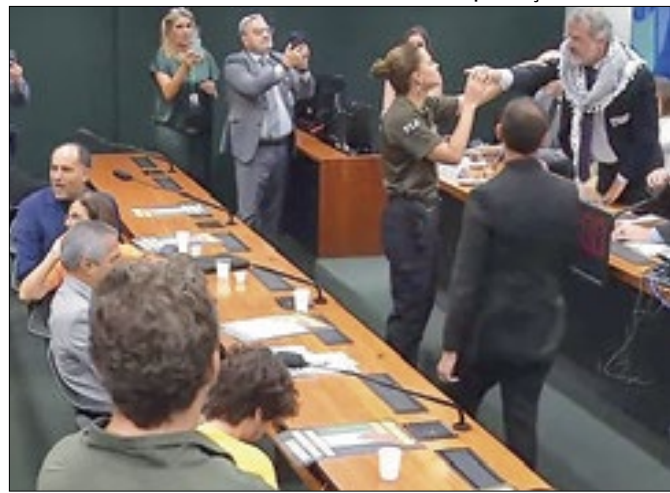
Confusão durante debate sobre questão palestina