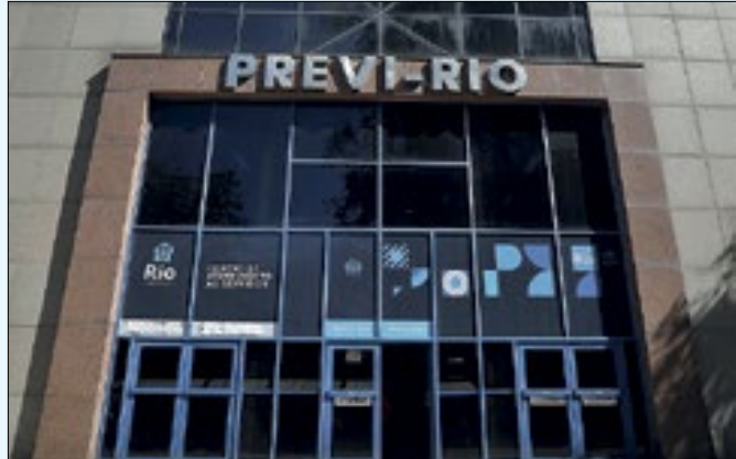
Prédio ficará fechado na quinta e sexta-feira