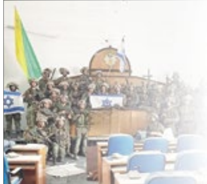
Israel: 'Hamas perdeu controle'

"O Hamas não tem poder de parar as IDF (sigla inglesa para For-