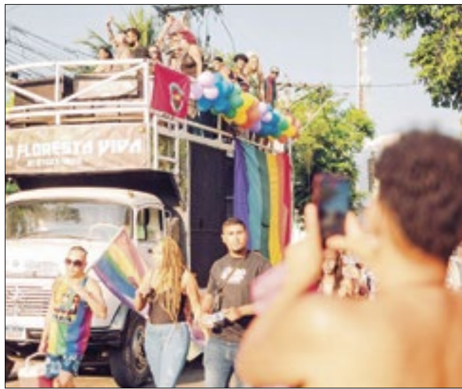
Palco e trio elétrico receberam apresentações de DJs