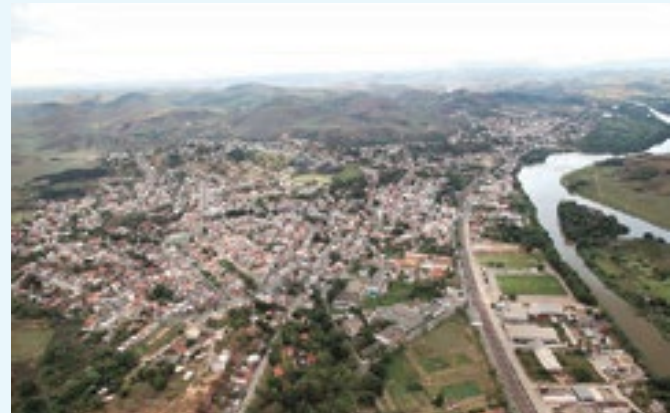
Evento antecederá as comemorações pelo Natal