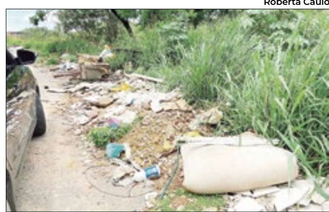
Pneus, restos de obra e até sofá estão no local