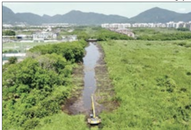
Serviço é para diminuir índices de alagamentos na região