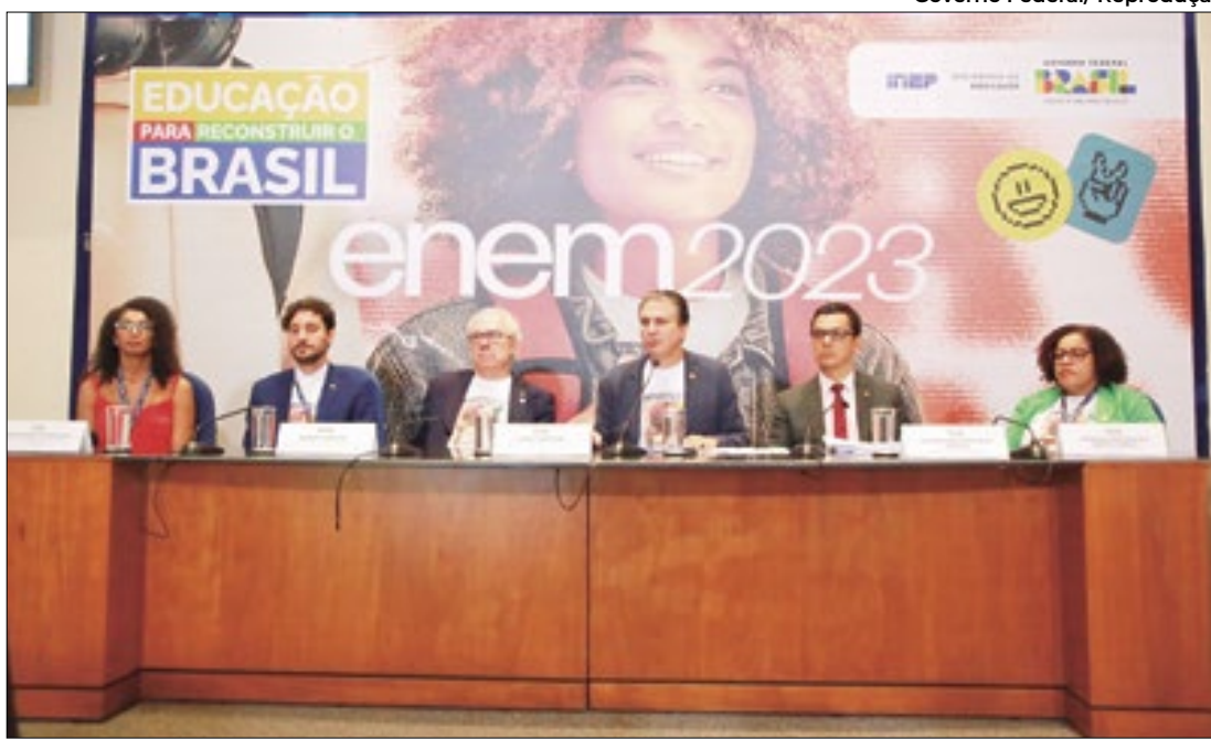
Edição desse ano contou com problemas logísticos