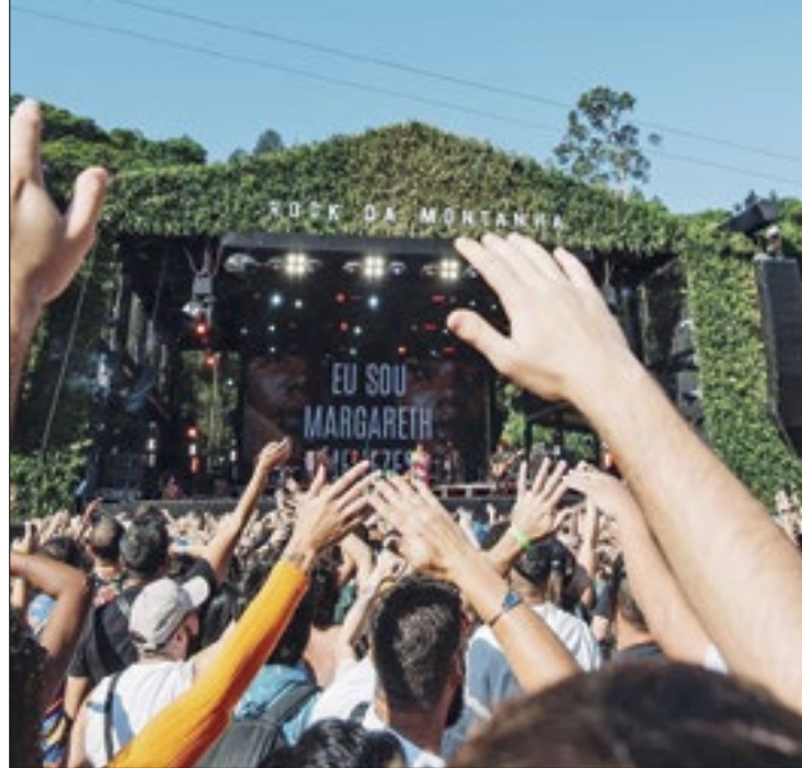
Festival teve recorde de público na edição 2023

O Rock the Mountain trouxe grandes nomes como Alcione, Maria Bethânia, Margareth Menezes, Majur, Iza, Paula Toller entre outras artistas da música brasileira. Segundo os organizadores do festival, um dos momentos mais esperados do domingo foi o show de Maria Bethânia que emocionou o público com um repertório de grandes sucessos da carreira, e homenageou Gal Costa, que morreu este ano. Bethânia também parabenizou o festival dizendo “Que beleza esse festival homenageando as vozes femininas do Brasil! Palmas para elas!”. Seguindo as homenagens, Paula Toller e Pitty também fizeram tributos a Rita Lee, que também morreu este ano.