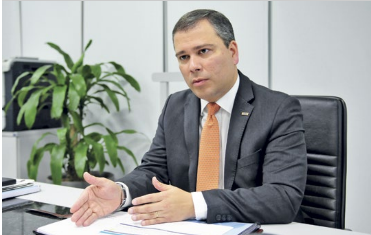
Presidente do BRB esteve com os deputados distritais, em reunião fechada na segunda-feira (13)