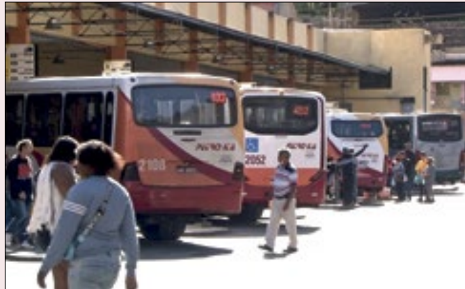
Denúncia de atraso no pagamento dos salários