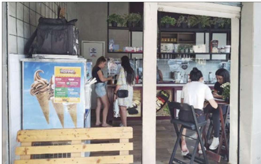
Venda de alimentos refrescantes cresceram com as altas temperaturas

Segundo a biomédica, o calor em excesso representa um grande risco para a saúde. Isso ocorre porque o organismo humano regula a temperatura interna dentro de uma faixa muito estreita, em torno de 35,8°C a 37°C e, quando a temperatura ambiente é demais, o corpo pode ter dificuldades em se resfriar. Entre os problemas de saúde que podem ser causados, estão a insolação, exaustão, de-