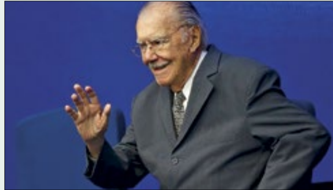
Ex-presidente faz lobby por candidato