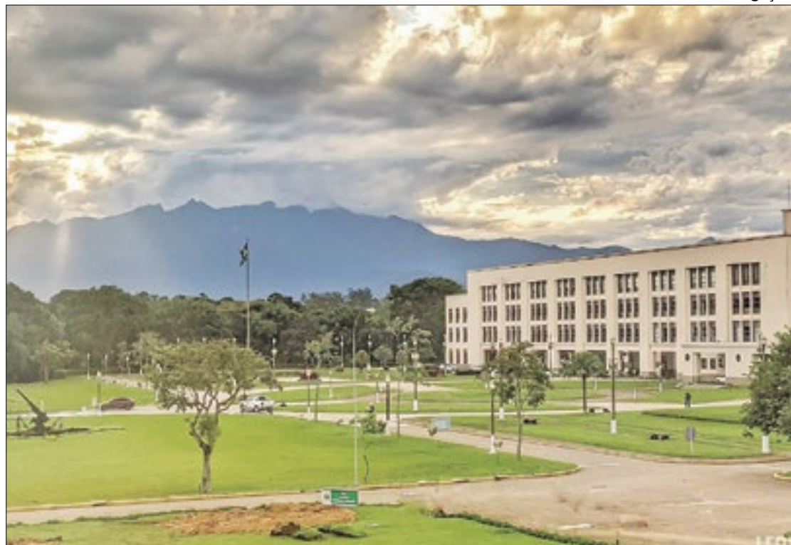
Fuzil é roubado de soldado que estava na área do Batalhão da Aman, em Resende

Agulhas Negras (AMAN) informa que, por volta das 2h50min do dia 12 de novembro de 2023, um Fuzil FAL 7.62mm foi roubado de um soldado que estava de serviço na área do Batalhão de Comando e Serviços (BCSv).