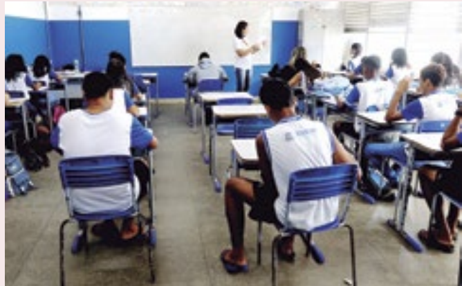
O Saeb examina a eficiência do ensino no município