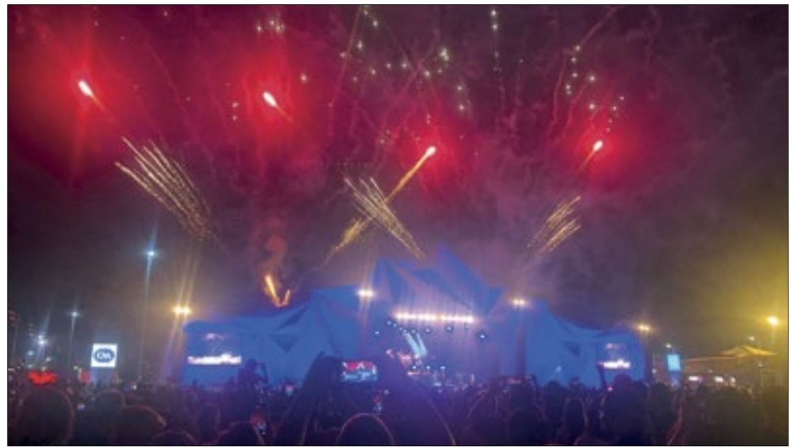
Plataforma servirá para que os fãs contem histórias marcantes relacionadas ao festival

O portal é um espaço para reunir histórias e reviver memórias das pessoas, marcas, colaboradores e todos que têm uma relação especial com o Rock in Rio. O festival convida os fãs a eternizar suas histórias de forma especial, ilustrada e que pode ser compartilhada