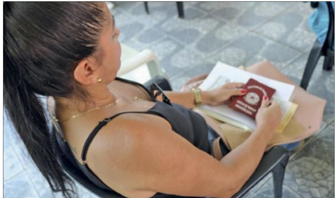
Oportunidades desta semana incluem o setor de construção civil

Os candidatos podem se inscrever de forma online,