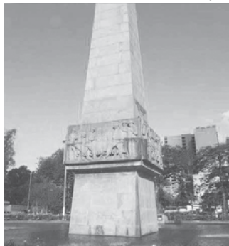
Obelisco de Volta Redonda