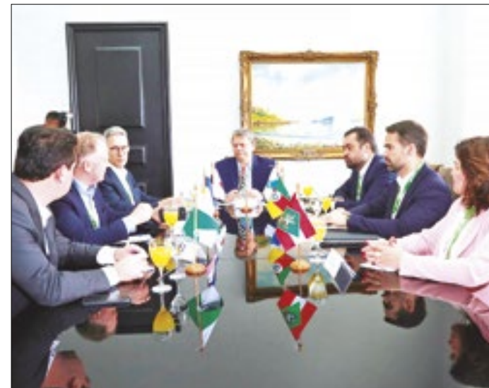
Governadores debatem as diretrizes do tratado