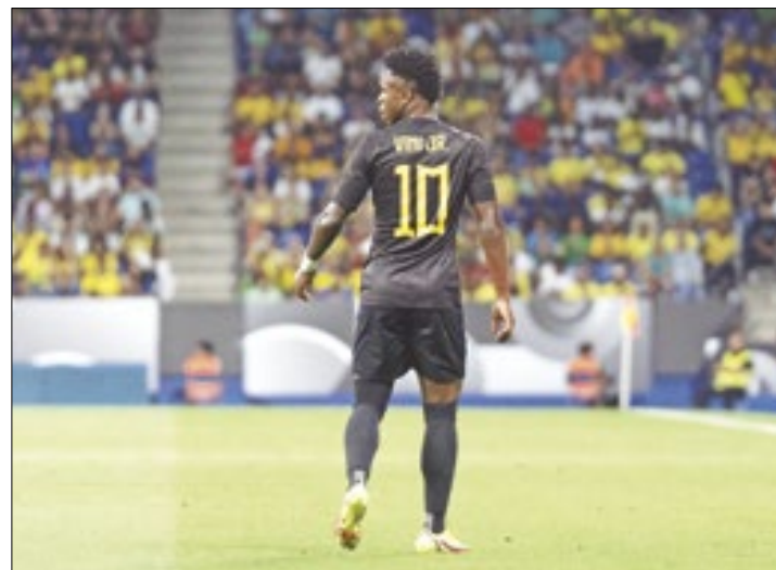
Atos foram quando Vinícius Júnior reclamava com jogadores

O Sevilla informou que identificou e expulsou do Estádio Ramón Sánchez Pizjuán um torcedor que cometeu agressões xenofóbicas e racistas, no sábado, durante o empate por 1 a 1 com o Real Madrid pelo Campeonato Espanhol.