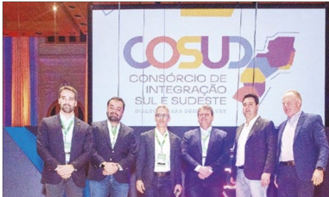
Da esquerda para a direita: Eduardo Leite (RS), Cláudio Castro (RJ), Romeu Zema (MG), Tarcísio de Freitas (SP), Ratinho Jr (PR) e Renato Casagrande (ES)