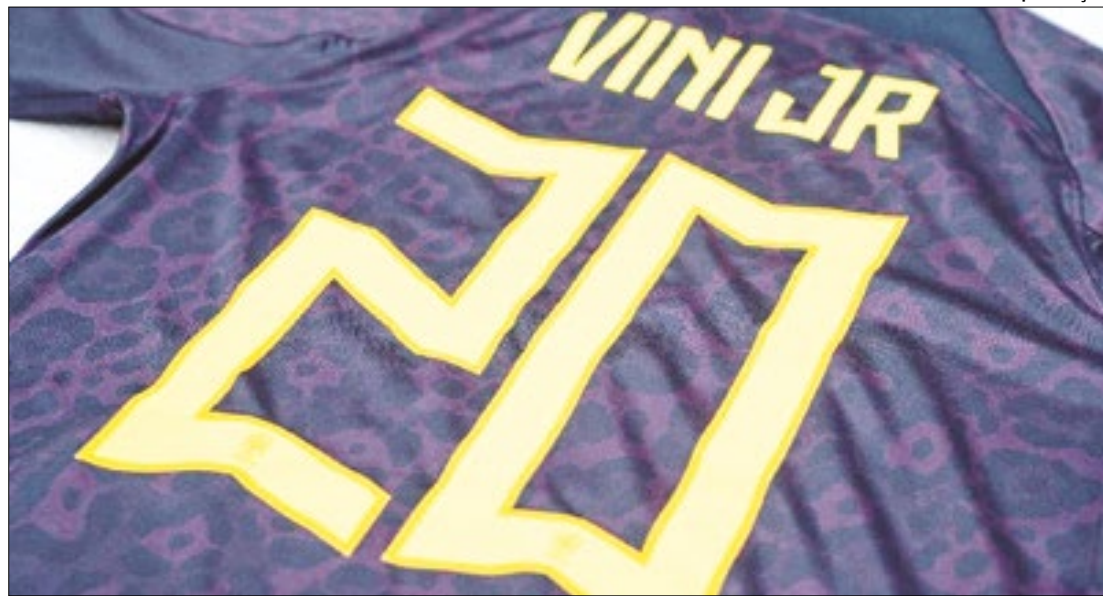
Jogador sofre rotina de ofensas no Campeonato Espanhol

O presidente da CBF, Ednaldo Rodrigues, também comentou o caso e o caracterizou