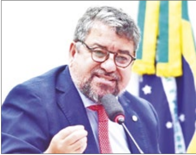
Quaquá quer que PT fique ao lado de Lira