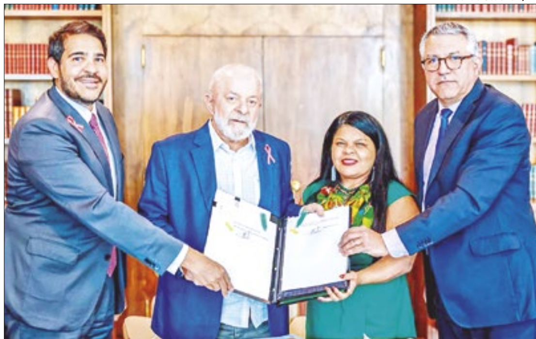
Lula com ministros após o veto parcial do Marco Temporal