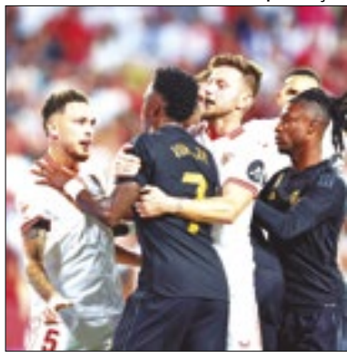
Torcedor foi identificado

O Sevilla informou que identificou e expulsou do Estádio Ramón Sánchez Pizjuán um torcedor que cometeu agressões xenófobas e racistas, na tarde deste sábado (21), durante o empate por 1 a 1 com o Real Madrid pela 10ª rodada do Campeonato Espanhol. Os atos foram realizados justamente no momento no qual o atacante brasileiro Vinícius Júnior estava reclamando com jogadores da equipe da casa.