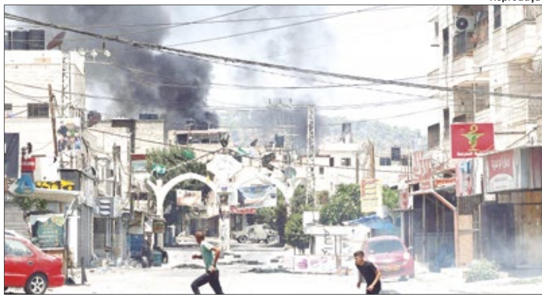
Jovens palestinos atiram pedras contra soldados israelenses

Do alto de um monte que serve de fronteira entre palestinos e israelenses na parte leste de Ramallah, militares armados com rifles de precisão e metralhadoras observam os adolescentes tentando acertá-los com pedras atiradas com fundas. Soldados descem o monte e se aproximam dos jovens palestinos numa tentativa de