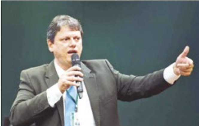
PT não quer Tarcísio candidato ao Planalto