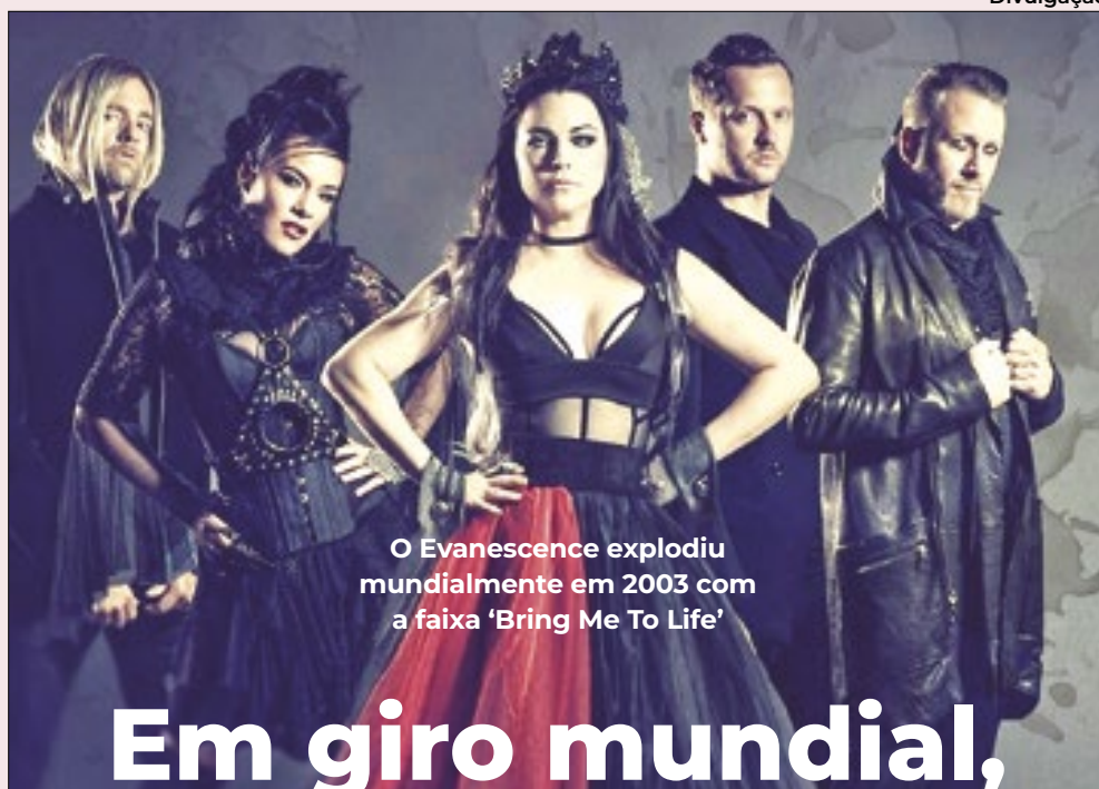
O Evanescence explodiu mundialmente em 2003 com a faixa 'Bring Me To Life'