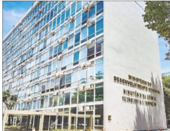
Provas devem ser realizadas apenas em 2024

O Concurso Nacional Unificado, coordenado pelo Ministério da Gestão e da Inovação em Serviços Públicos, terá, ao todo, 6.640 vagas. O número aumentou depois que o Inep resolveu aderir à iniciativa, com a abertura de concorrência para 50 vagas ao cargo de pesquisador-tecnologista em informações e avaliações educacionais.